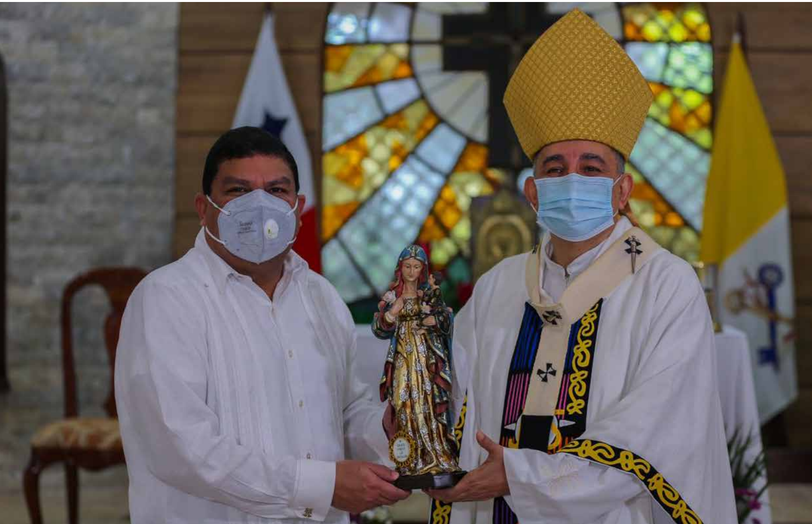
Carlos Aguilar, ministro de MiCultura y monseñor José Domingo Ulloa, arzobispo de Panamá.