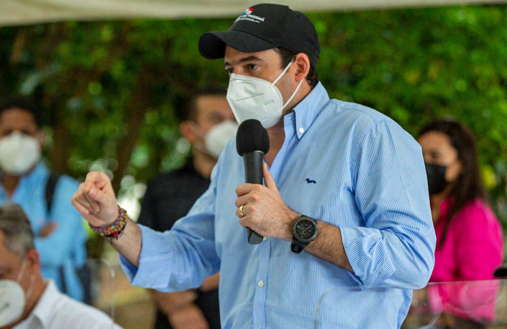
José Gabriel Carrizo Jaén, vicepresidente y ministro de la Presidencia de la República de Panamá.