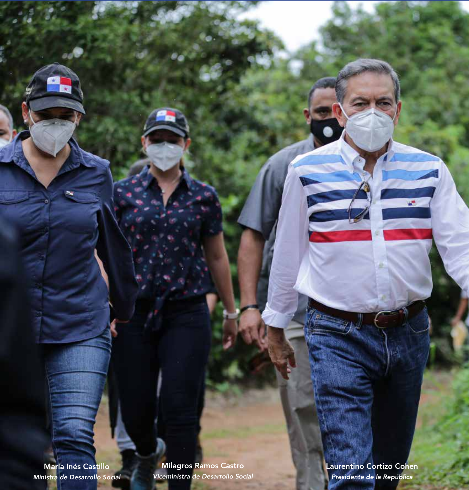
María Inés Castillo Ministra de Desarrollo Social

REVISTA SEMANAL • Del 17 al 22 de agosto del 2020 • #1 • República de Panamá