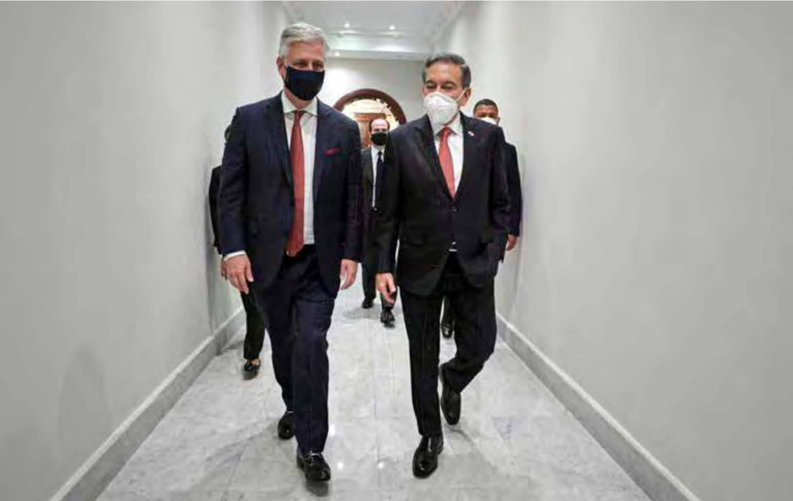
Robert O'Brien, consejero presidencial de Seguridad Nacional de Estados Unidos; y el presidente de la República de Panamá, Laurentino Cortizo Cohen.