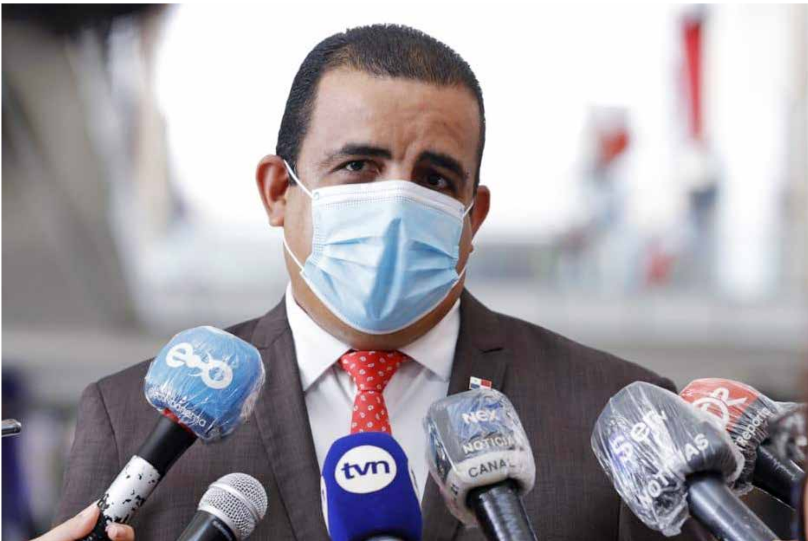
Omar Montilla, viceministro de Comercio Interior