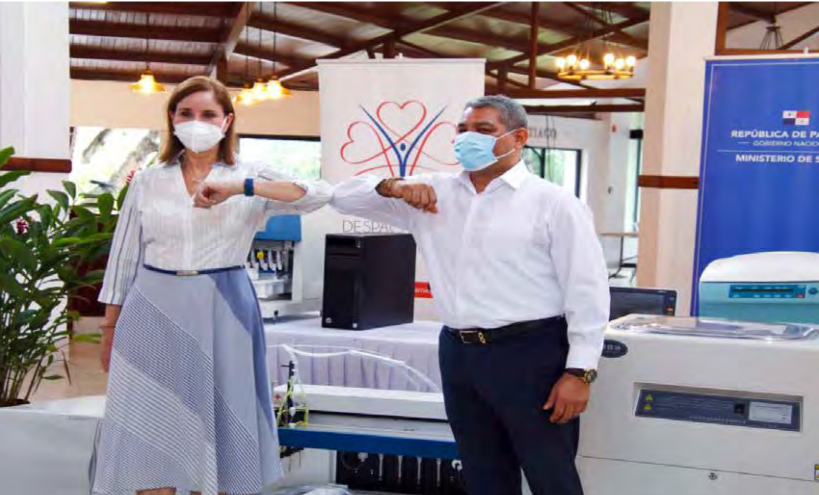
La Primera Dama de la República, Yasmín Colón de Cortizo y el ministro de Salud, Luis Francisco Sucre.