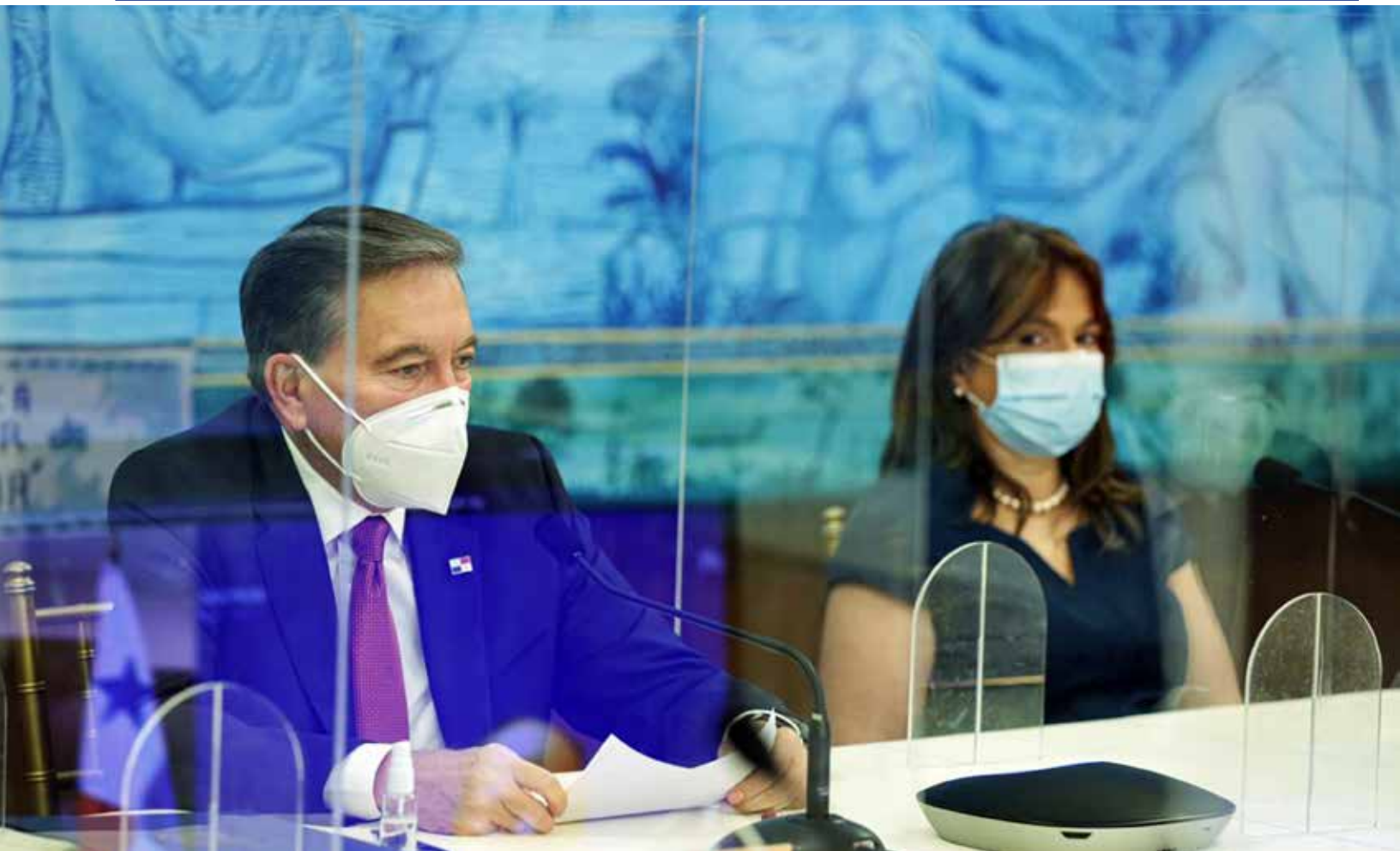
Presidente de la República, Laurentino Cortizo Cohen, y Maruja Gorday de Villabobos, ministra de Educación.