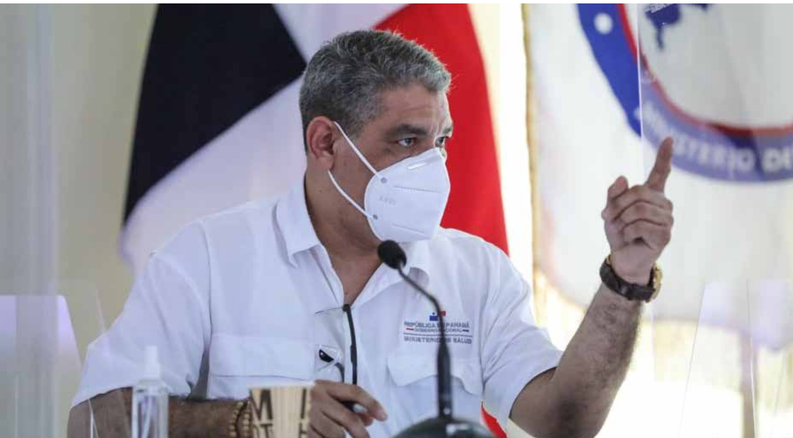
Luis Francisco Sucre, ministro de Salud.