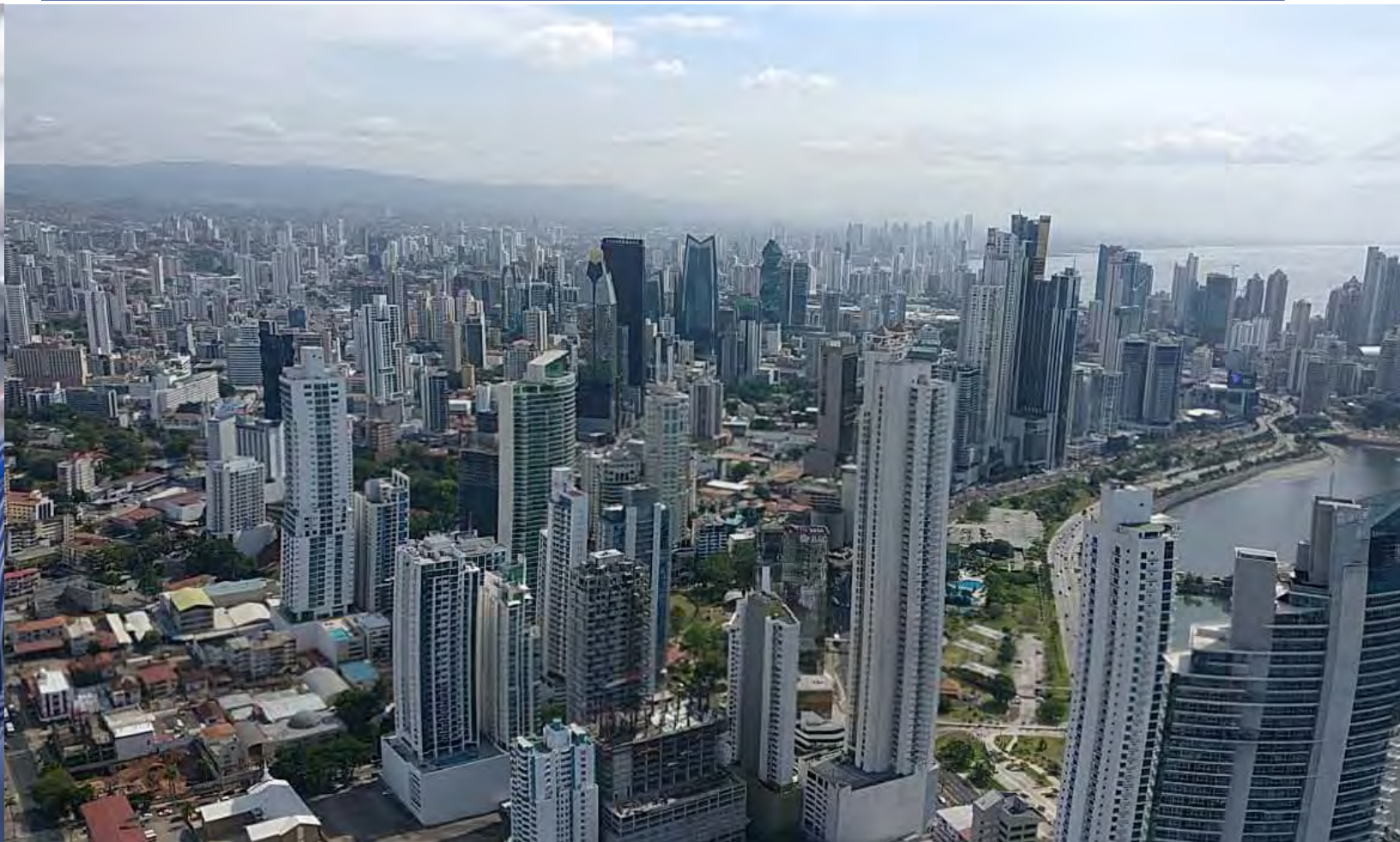
Centro Bancario de Panamá