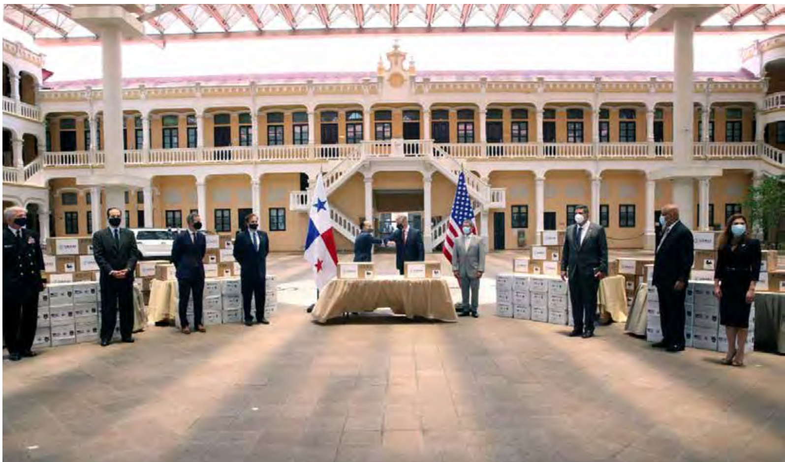
Autoridades de Estados Unidos y Panamá en el Ministerio de Relaciones Exteriores.