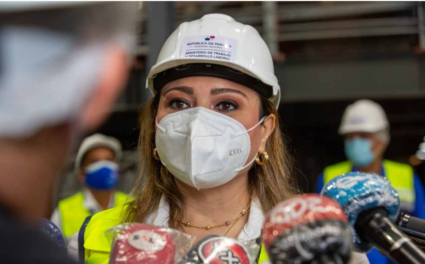
Doris Zapata, ministra de Trabajo y Desarrollo Laboral (Mitradel).