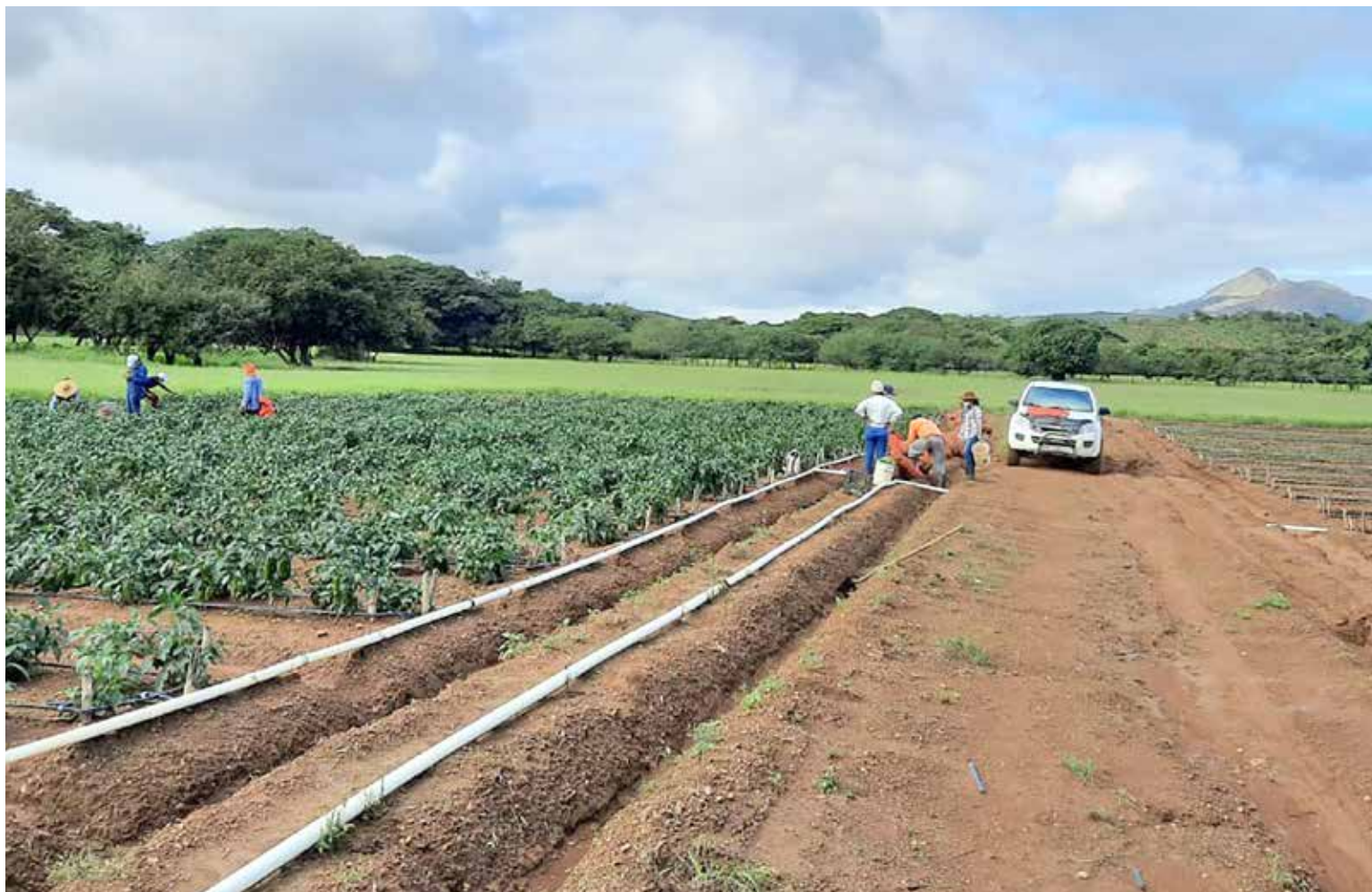
Plantaciones de ají en El Cortezo de Natá, provincia de Coclé.