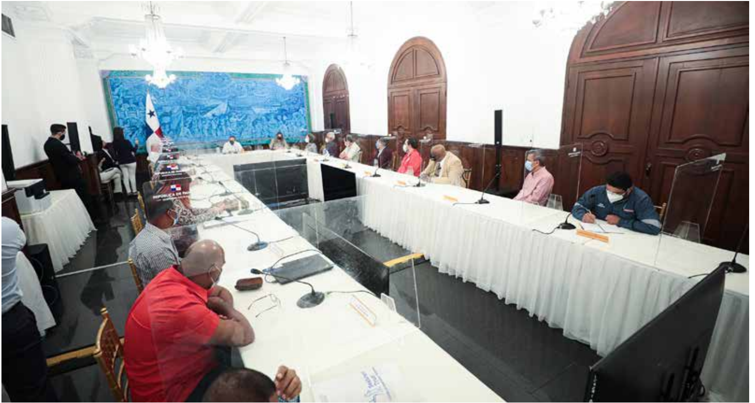
El presidente Laurentino Cortizo Cohen en reunión con la Confederación Nacional de Unidad Sindical Independiente.