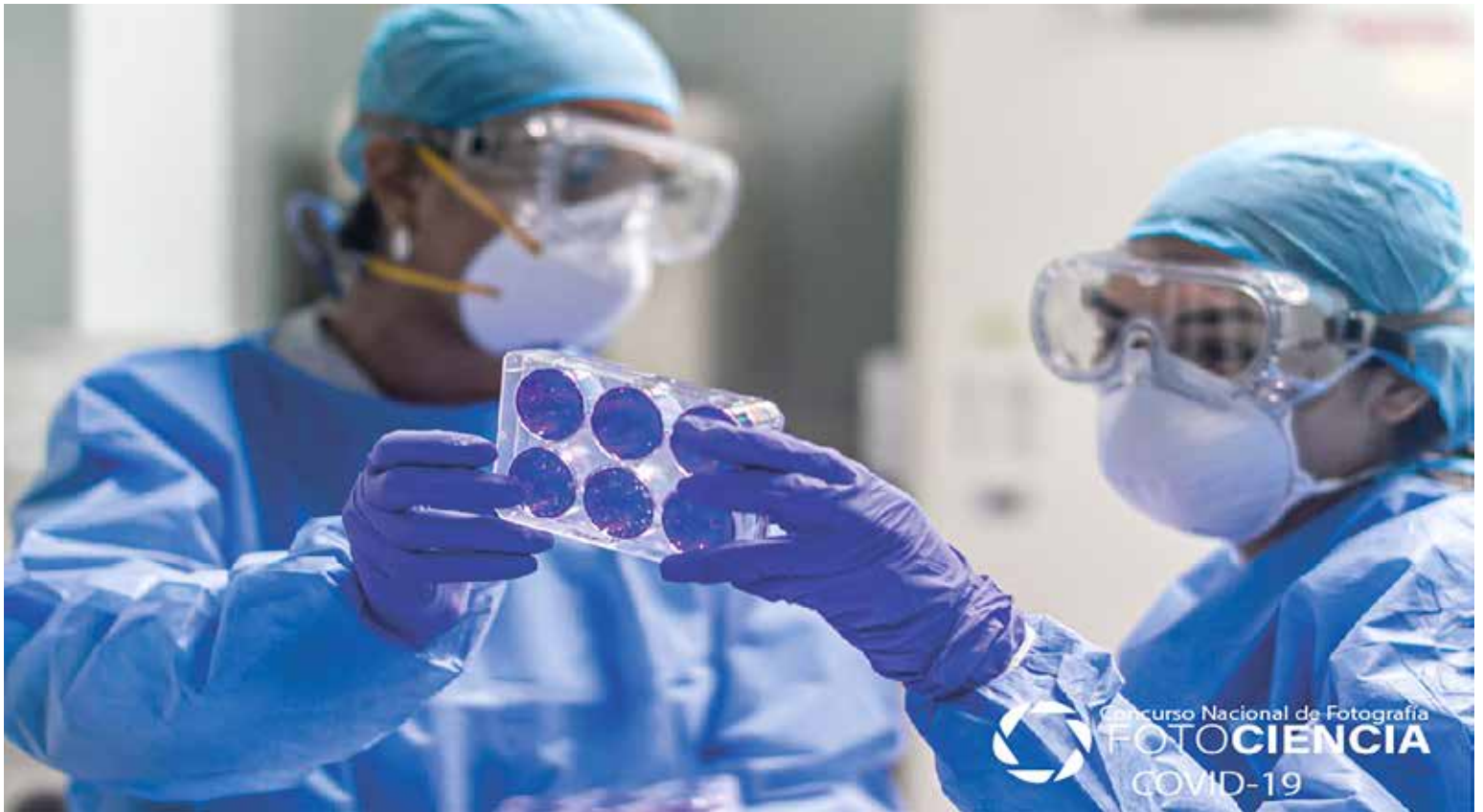
Manejo de muestras biológicas. Concurso "FotoCiencia COVID-19" de la SENACYT.