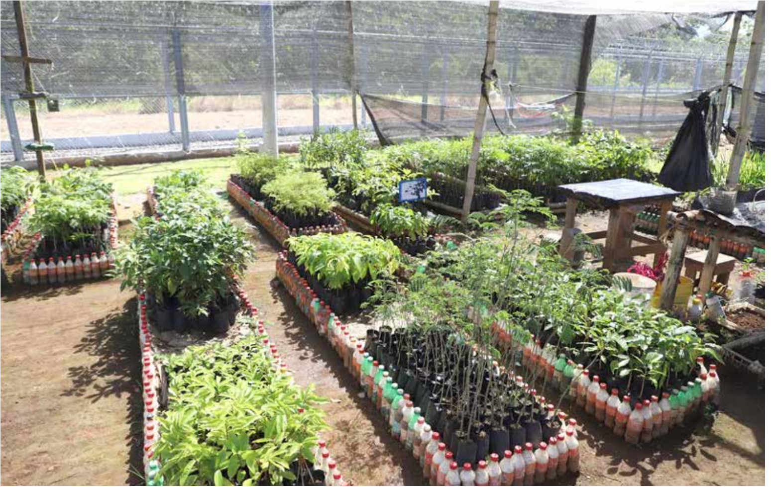
Huerto Sembrando Paz, en el centro penitenciario de Chiriquí.