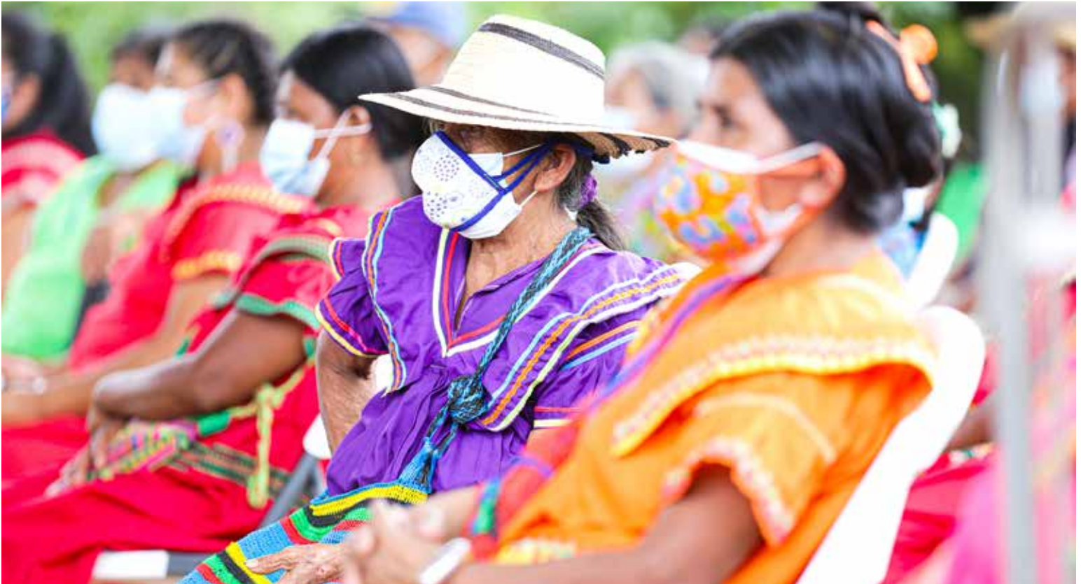
Mujeres de la comarca Ngäbe-Buglé en gira presidencial de trabajo comunitario.