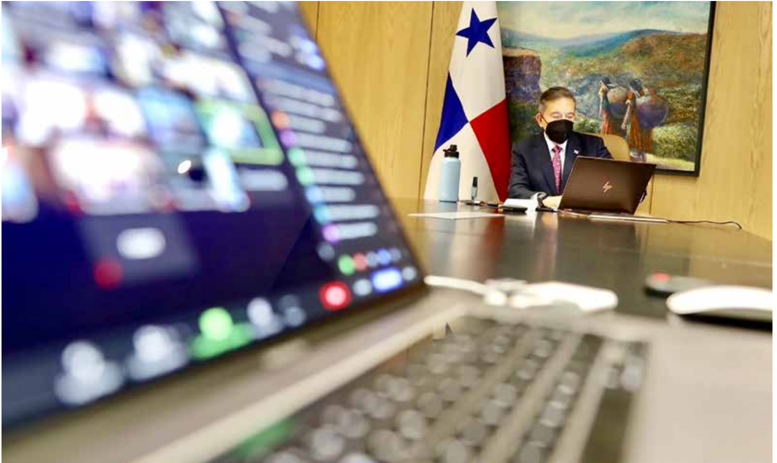
El presidente Laurentino Cortizo Cohen en Consejo de Gabinete virtual.