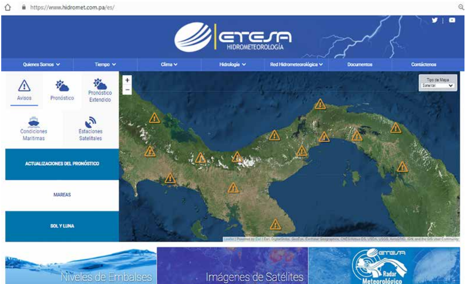
Página principal de nueva web de hidromet.com.pa