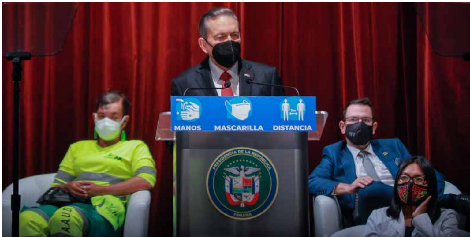
El presidente de la República, Laurentino Cortizo Cohen, en el acto inaugural del Pacto del Bicentenario: Cerrando Brechas.