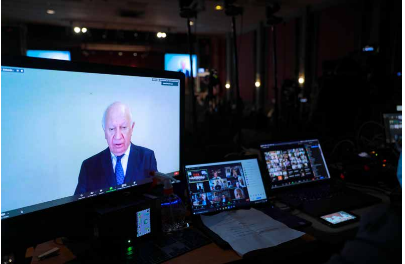
Ricardo Lagos, expresidente de Chile.