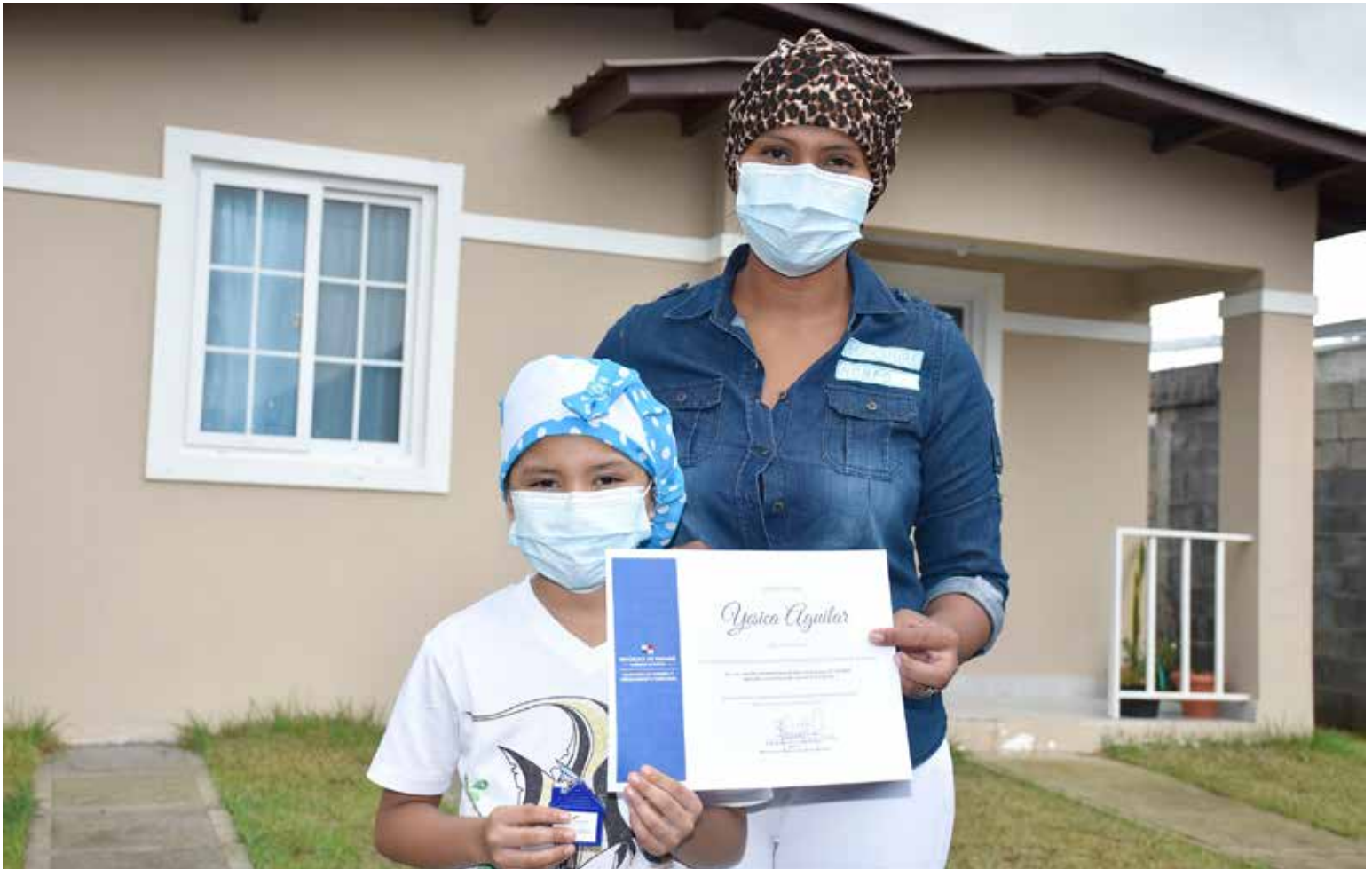
Programa Fondo Solidario de Vivienda.