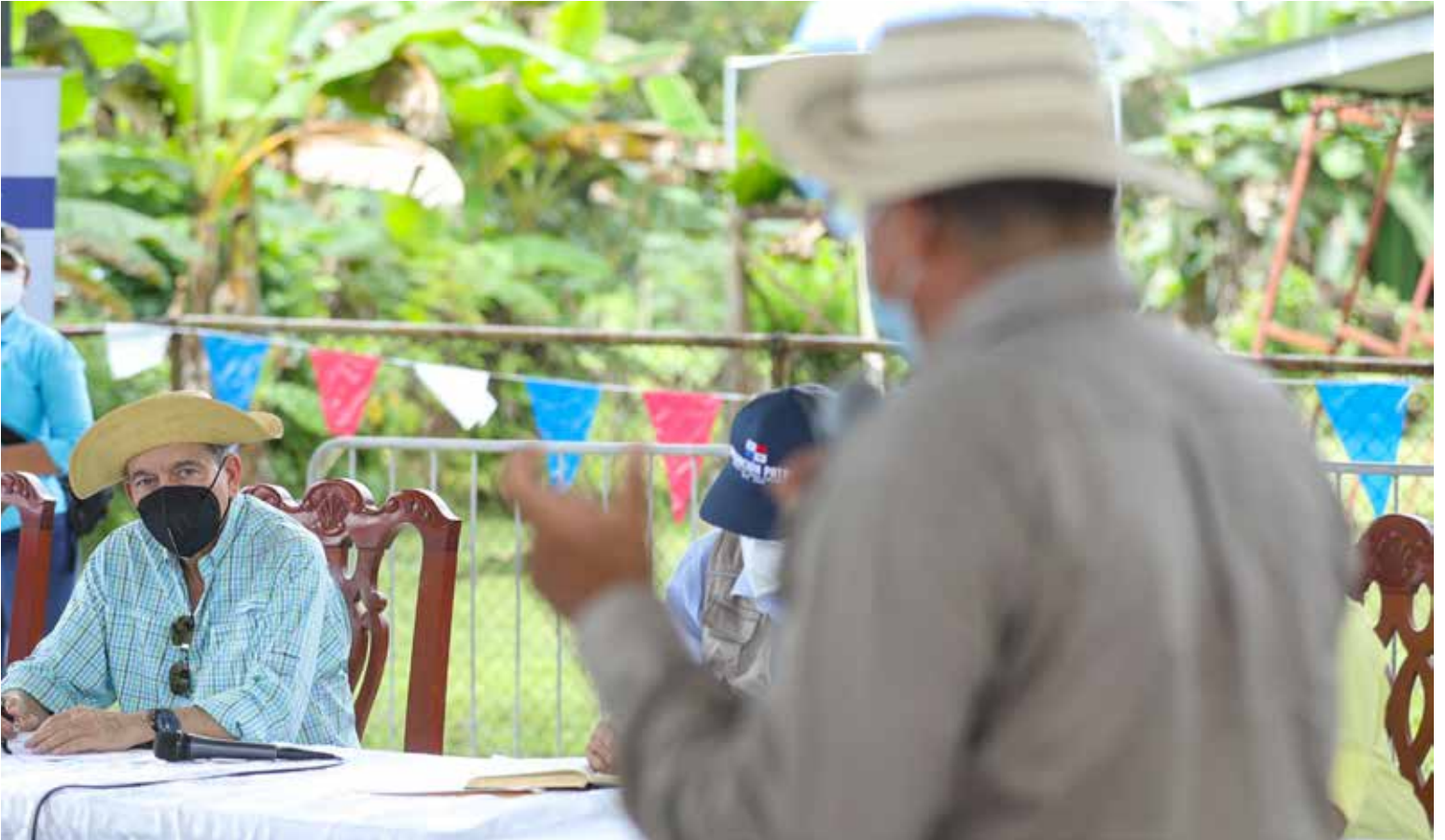
El presidente Laurentino Cortizo Cohen escucha a productores de Mariato.