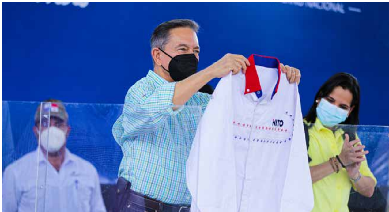
El presidente Laurentino Cortizo Cohen recibe una camisa con labores típicas trabajadas por manos de la etnia ngäbe.