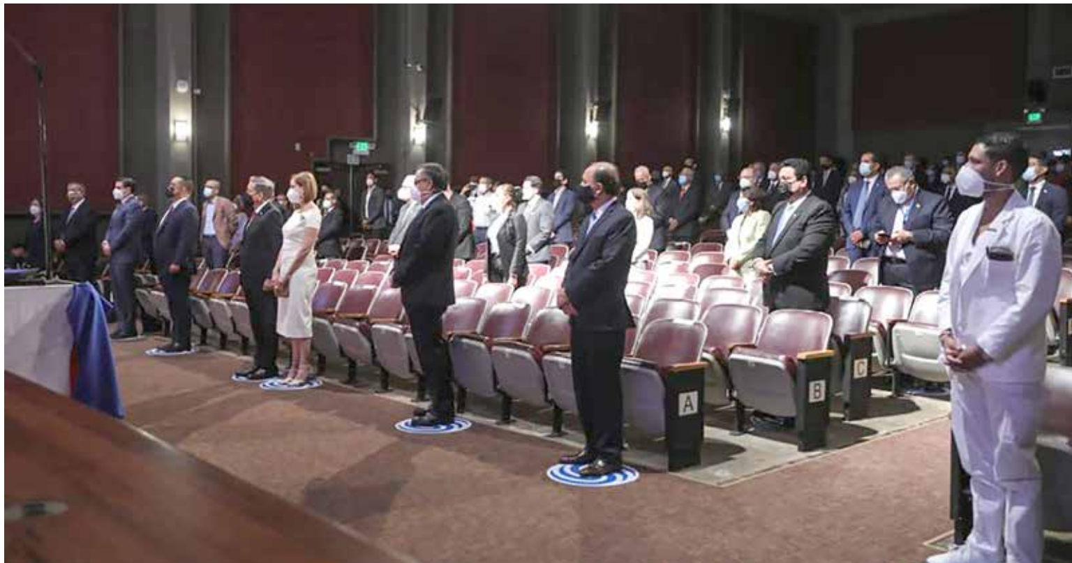
Autoridades, dirigentes de gremios e integrantes del Pacto del Bicentenario: Cerrando Brechas, en el acto inaugural.