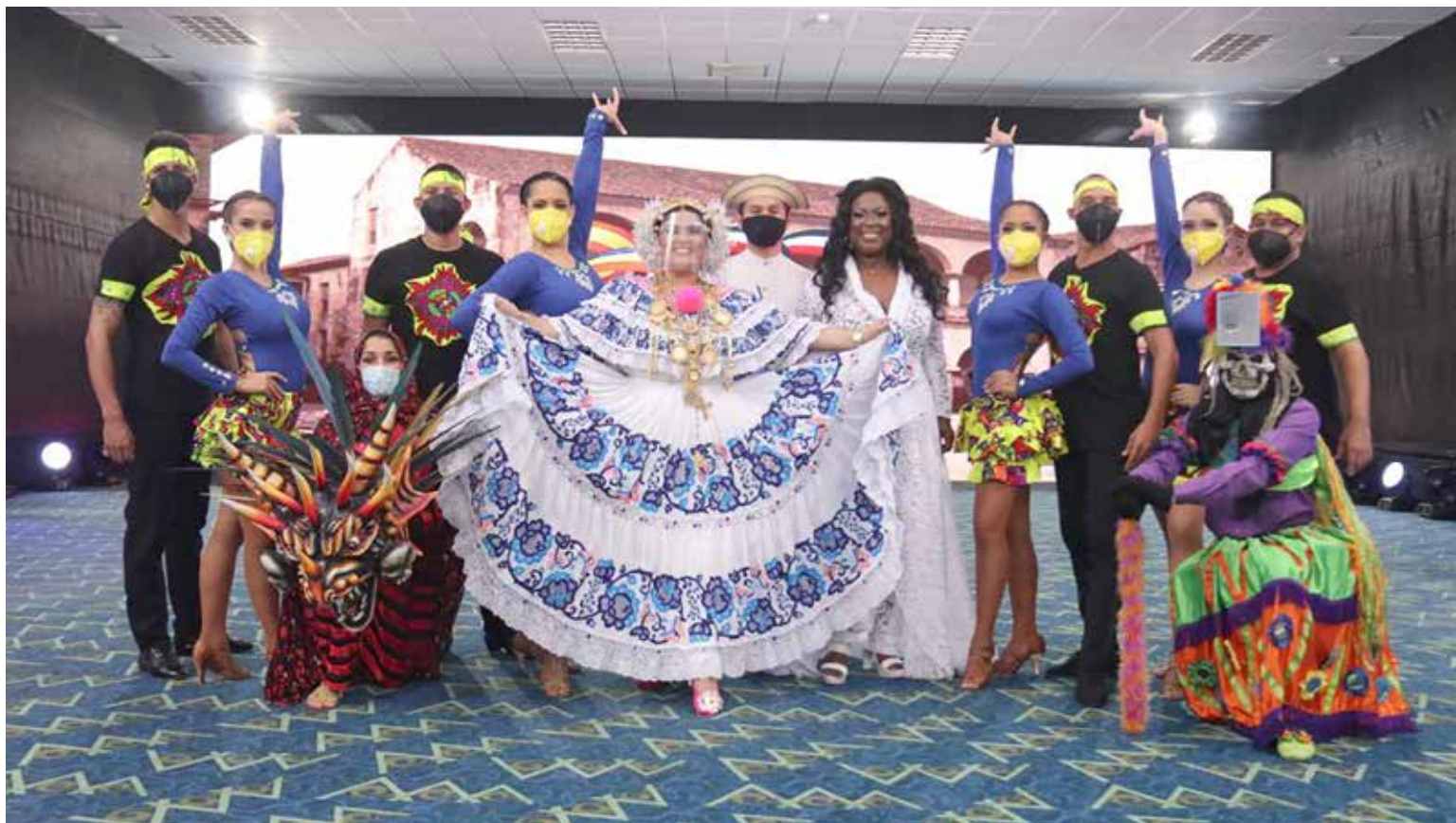
Panameños cantan el Himno Nacional para iniciar el conteo regresivo al Bicentenario de la Independencia de Panamá de España.