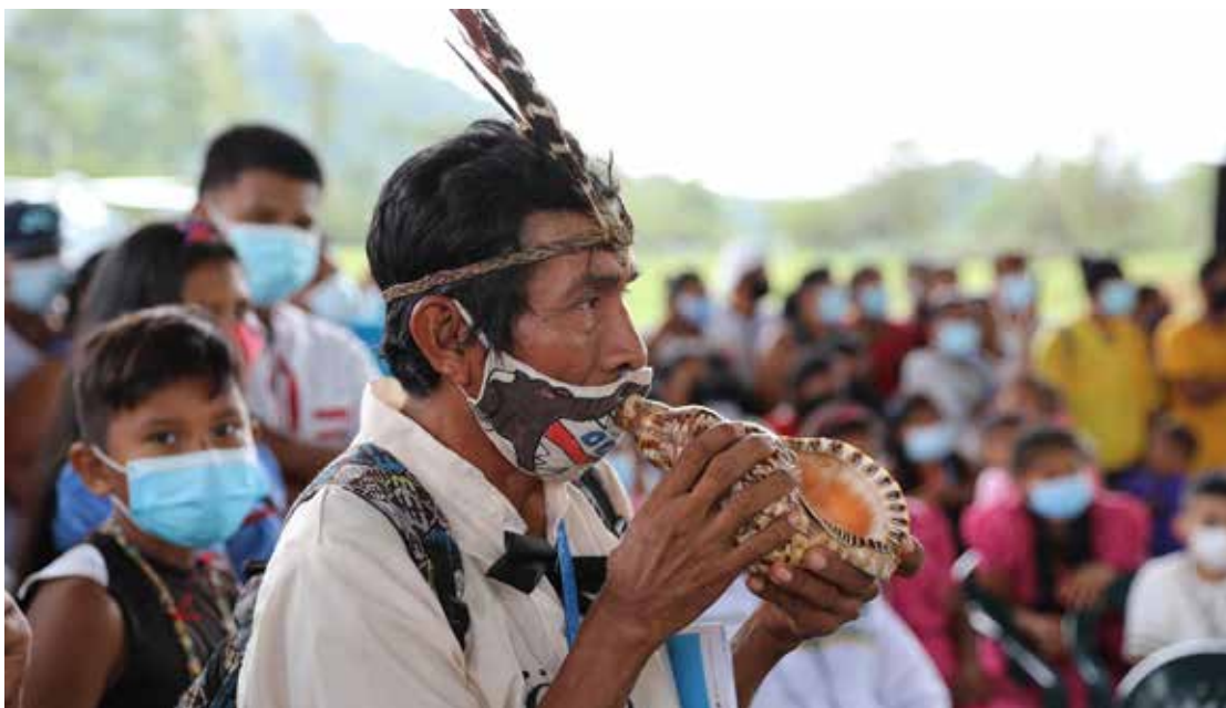
Los pobladores celebran con danzas y música la nueva comarca Naso Tjër-Di.