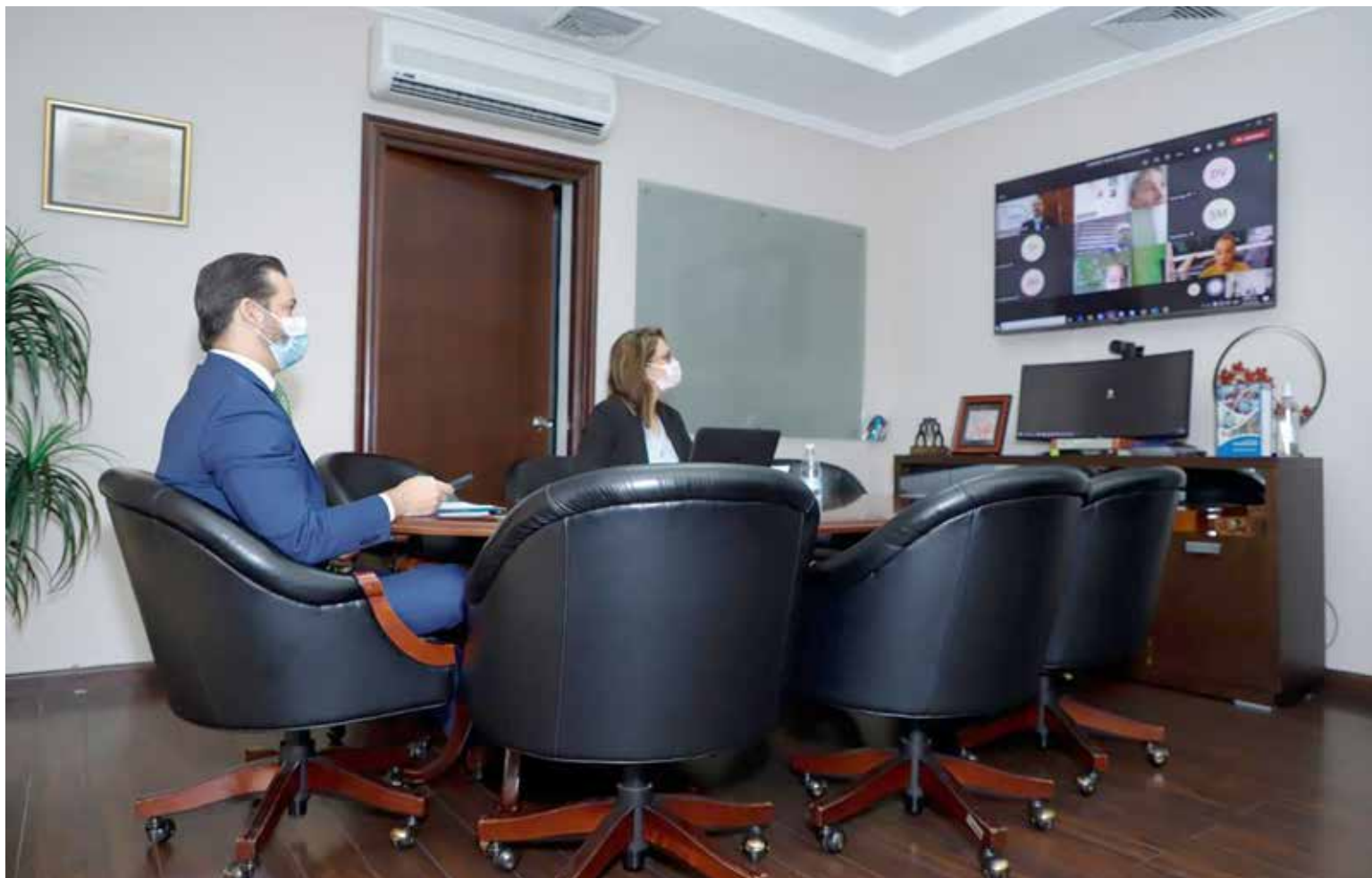
El equipo de Gobierno mantiene comunicación directa con el sector empresarial.