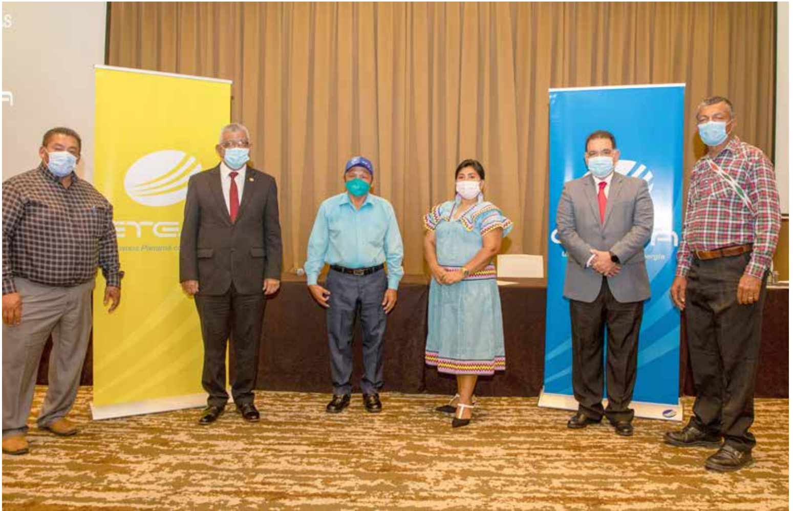
Equipo de trabajo para el proyecto de la cuarta línea, conformado por ETESA, la Comisión Especial del Congreso Regional Ño Kribo e instituciones del Gobierno Nacional.