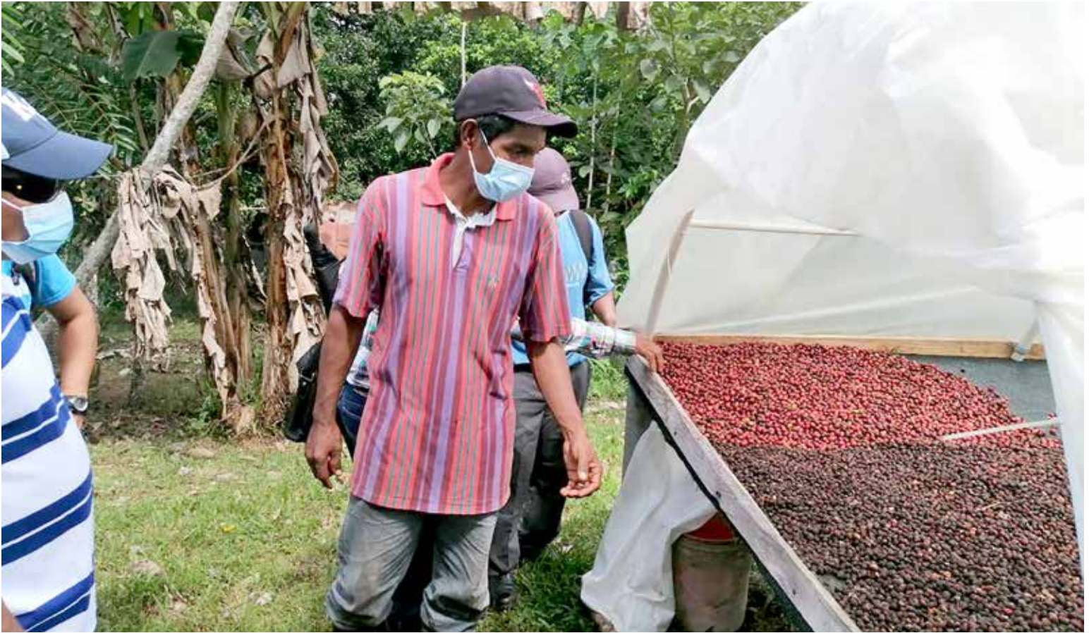
Con nueva variedad, cafetaleros de Colón buscan mejorar la producción.