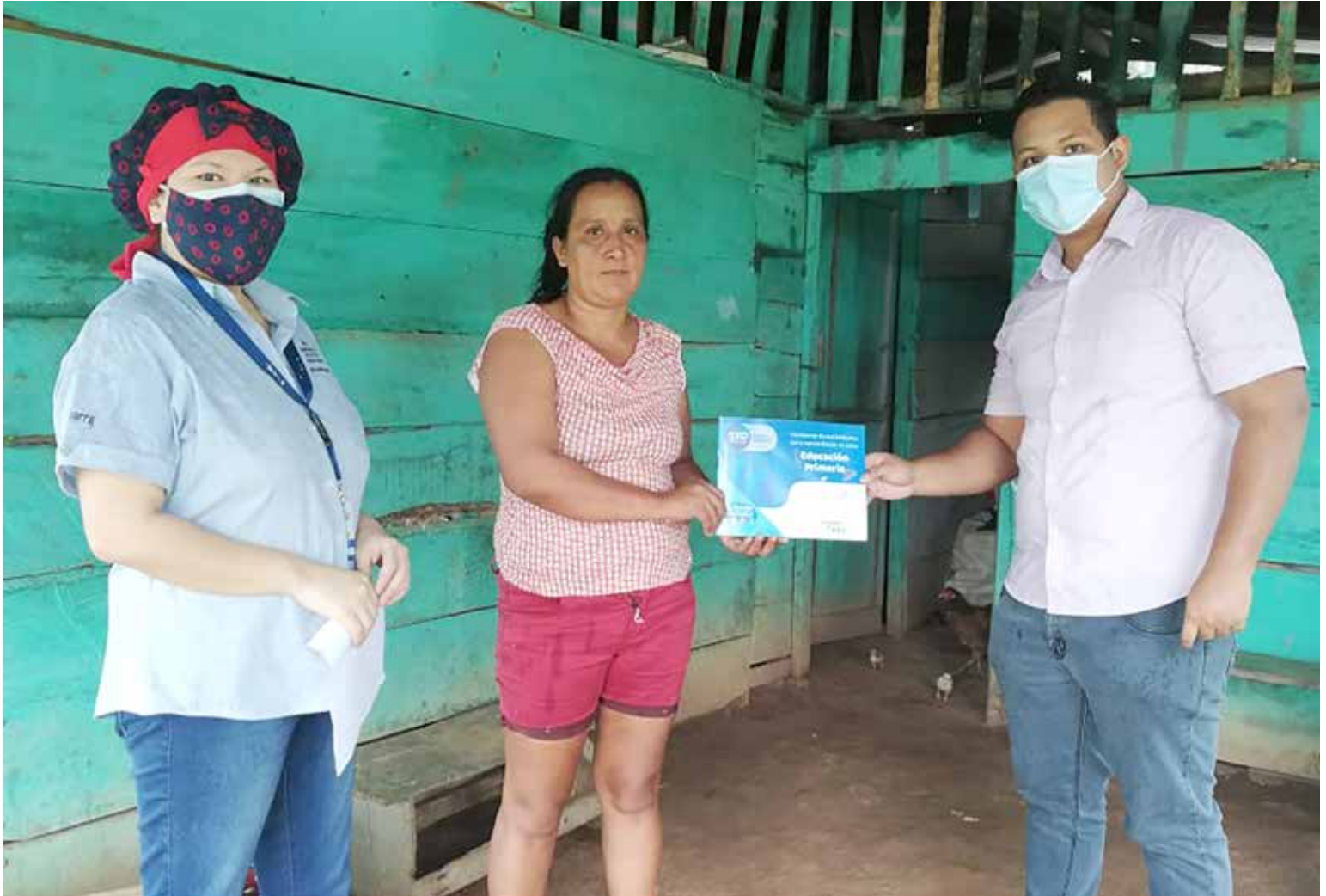
Profesionales de educación especial entregaron, de casa en casa, los cuadernos de trabajo a los padres de familia.