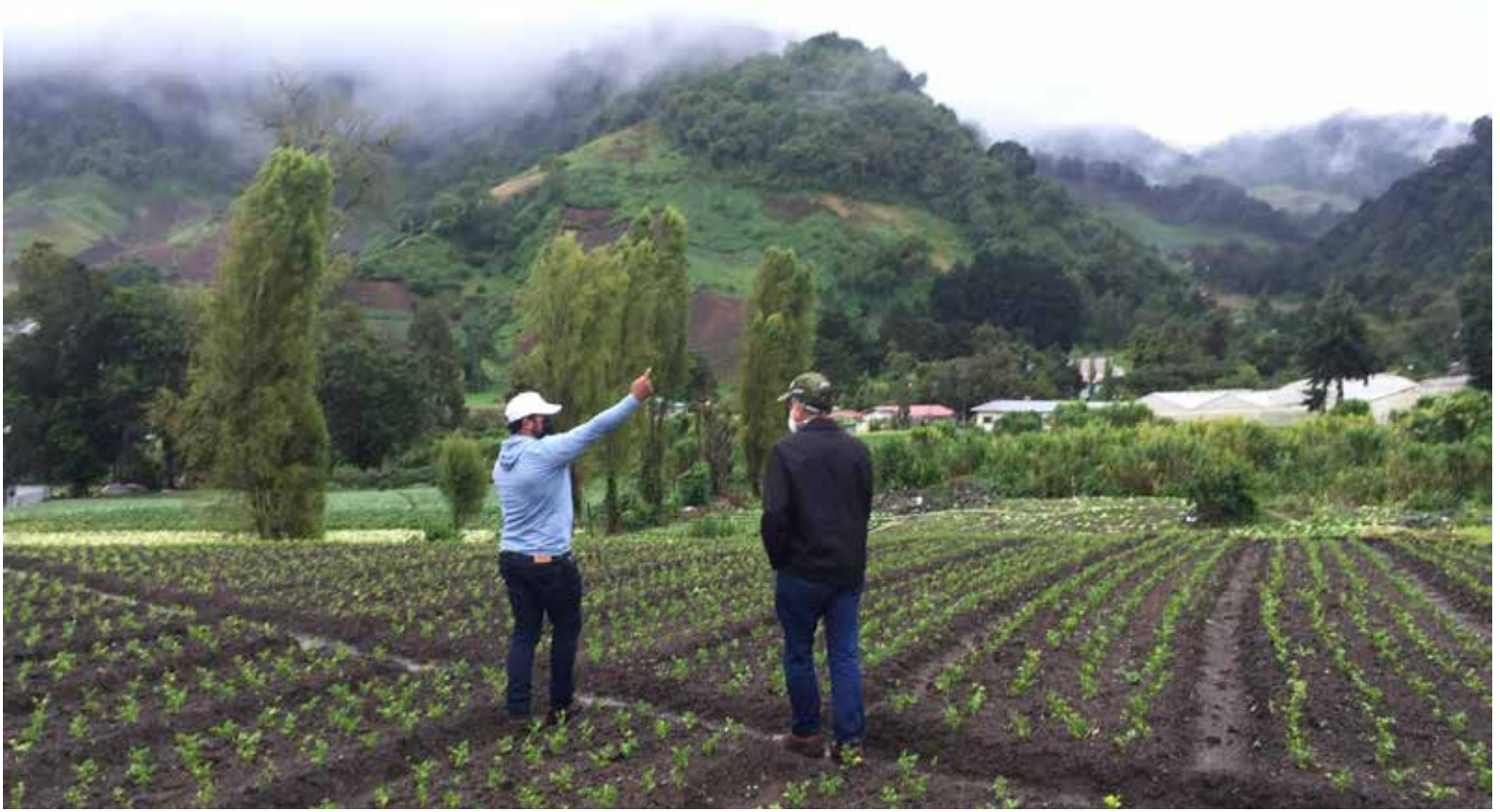
El ministro de Desarrollo Agropecuario, Augusto Valderrama, inspecciona cultivos en Tierras Altas, provincia de Chiriquí.