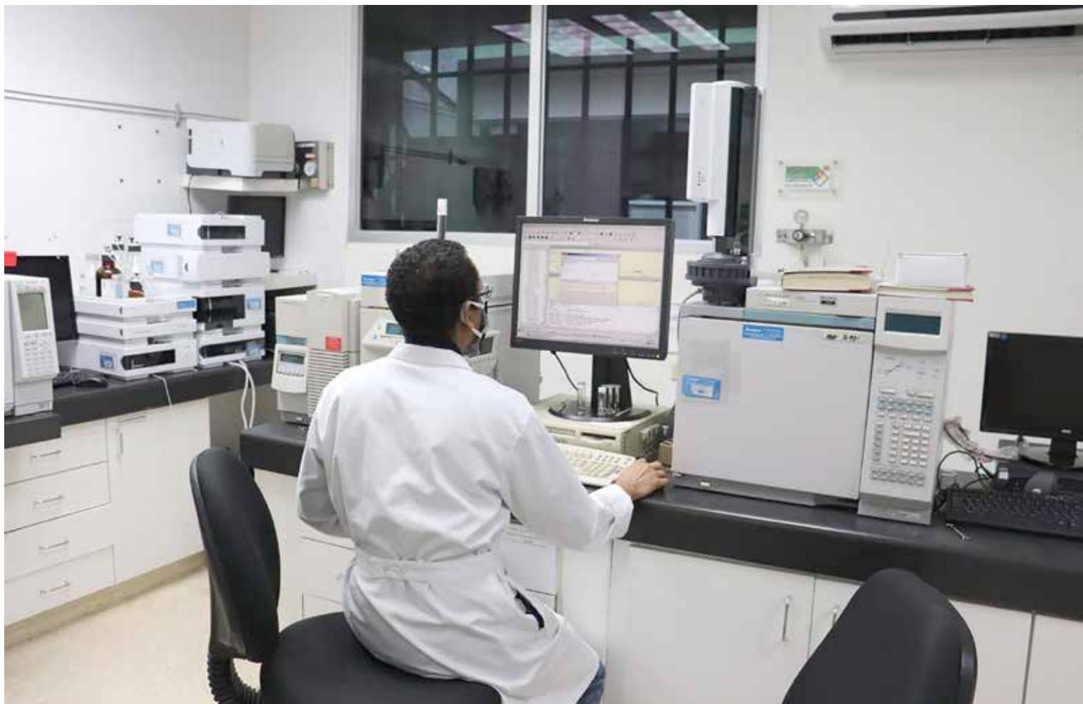
Laboratorio de Salud Animal se alista para cumplir con pruebas que solicita Estados Unidos.