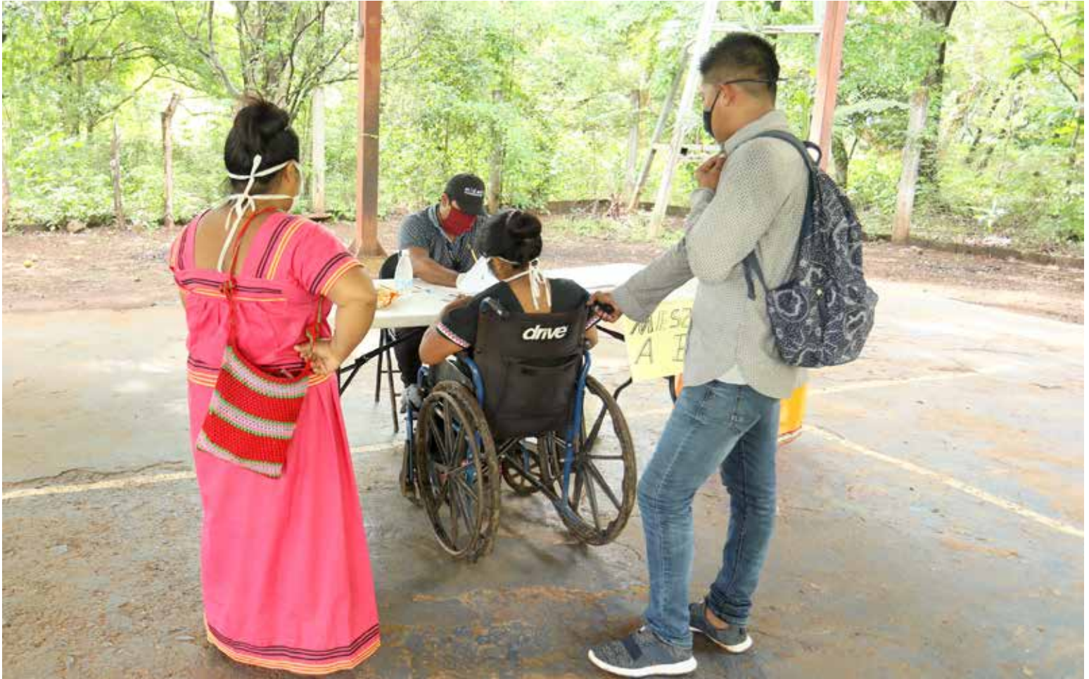
Las transferencias les permiten a los beneficiarios cubrir sus necesidades básicas de alimentación y servicios médicos.