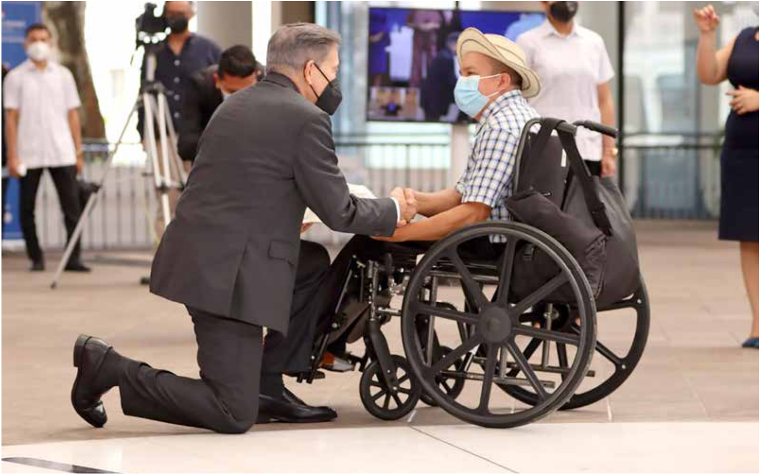
El presidente de la República, Laurentino Cortizo Cohen, saluda a Diógenes Zamora, durante el Consejo Nacional Consultivo de Discapacidad (Conadis).