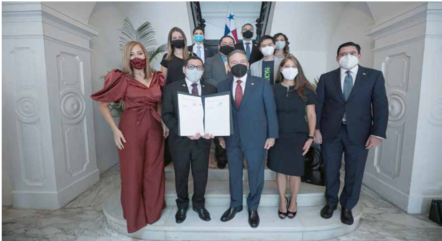
El presidente de la República, Laurentino Cortizo Cohen; y el vicepresidente, José Gabriel Carrizo Jaén, en la escalera del Palacio de las Garzas con invitados para la sanción de leyes que ayudan a la protección del medio ambiente.