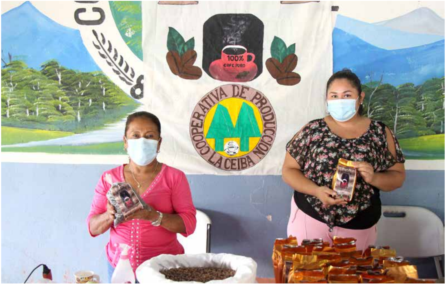
La Cooperativa de Producción La Ceiba se dedica a la producción y comercialización de café.