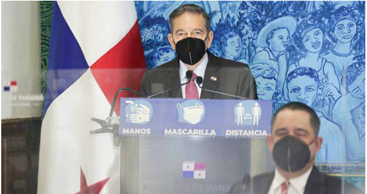
El presidente de la República, Laurentino Cortizo Cohen; y Marcos Castellero, presidente de la Asamblea Nacional de Panamá.