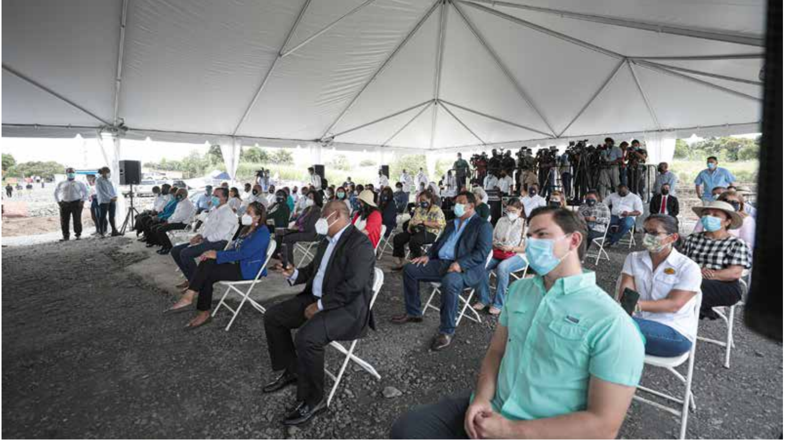
Autoridades y moradores en el acto de la primera palada de la futura sede del Centro Regional Universitario de San Miguelito.