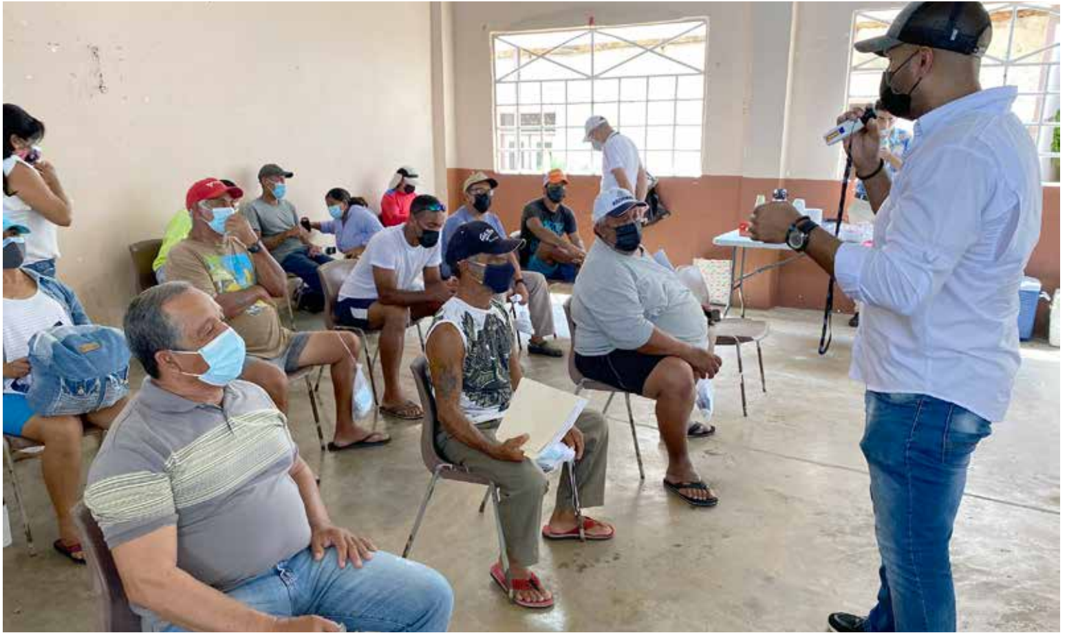
Pescadores de Taboga actualizan sus licencias, de cara al ordenamiento de la actividad en la isla.