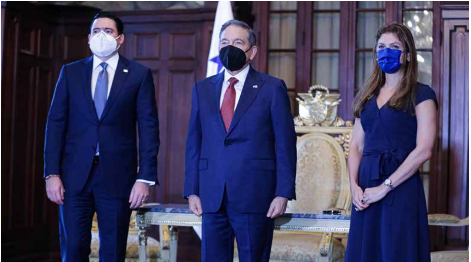
José Gabriel Carrizo Jaén, vicepresidente; Laurentino Cortizo Cohen, presidente de la República; Erika Mouynes, ministra de Relaciones Exteriores.