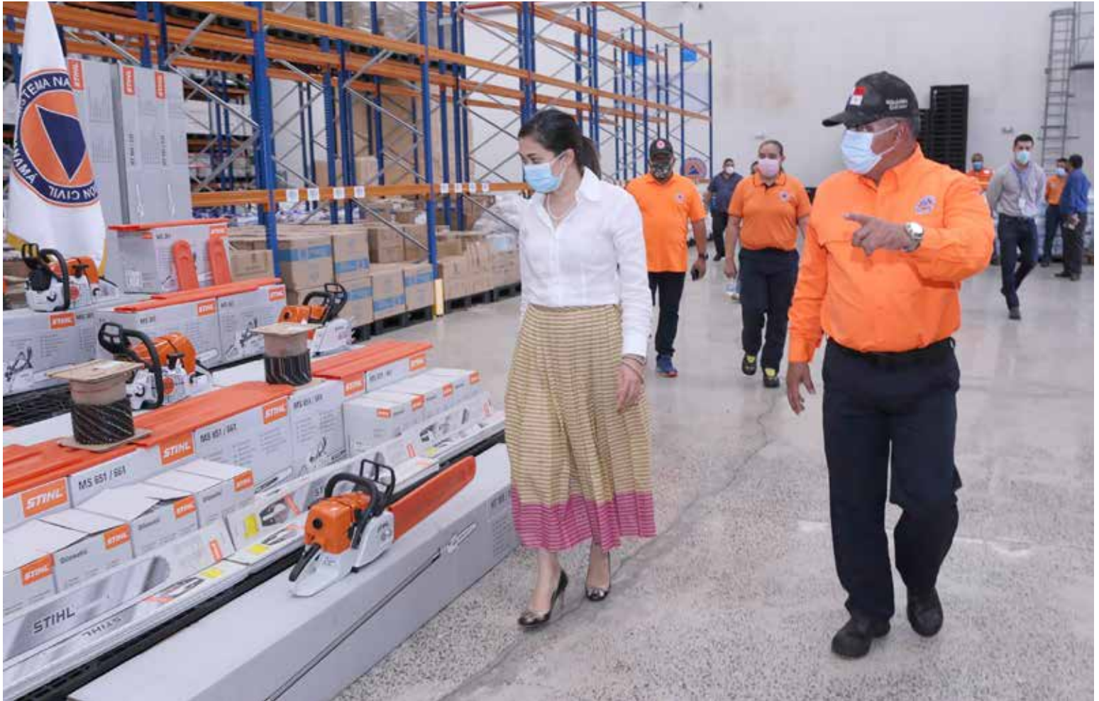
La ministra de Gobierno, Janaina Tewaney Mencomo, y el director general del Sinaproc, Carlos Rumbo, inspeccionan los equipos.