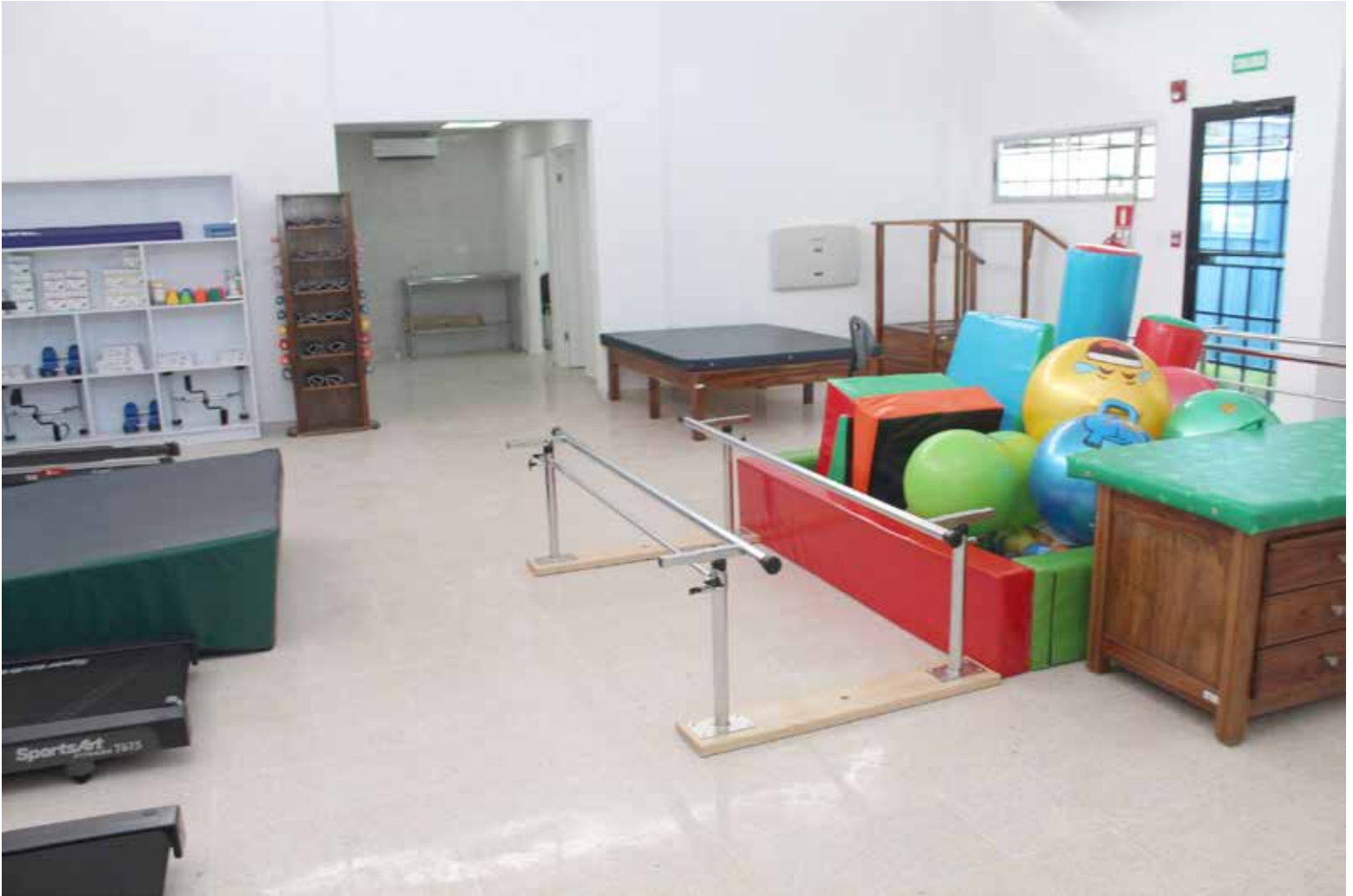
Centro de Rehabilitación Integral (Reintegra) en la provincia de Bocas del Toro.