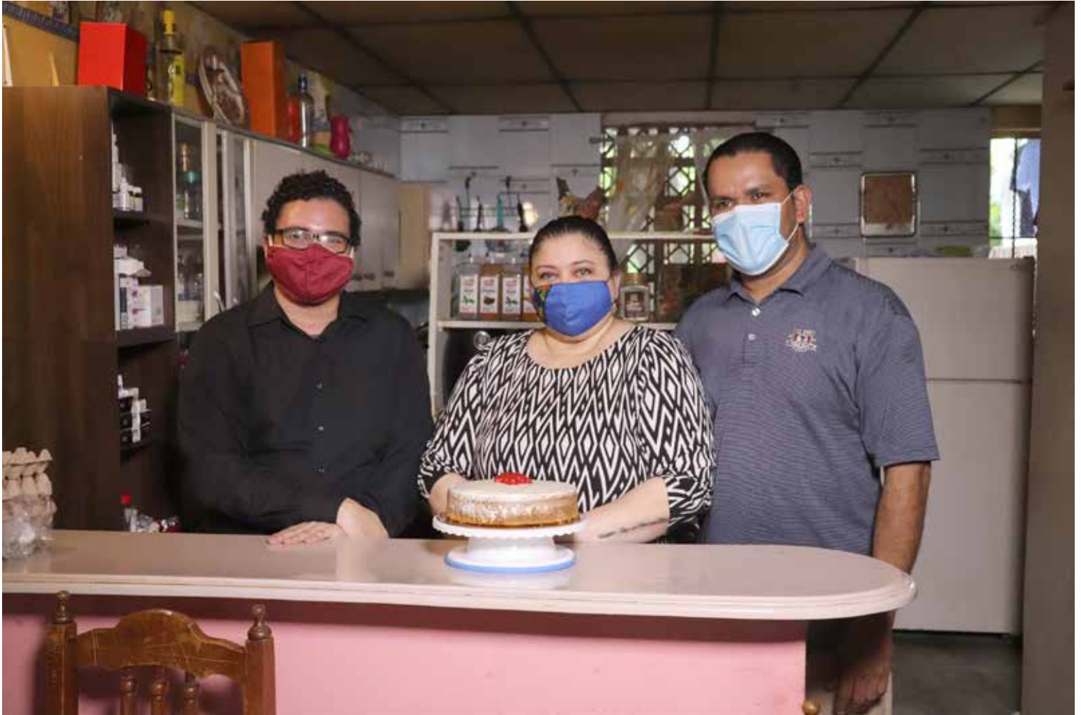
Una beneficiaria del programa de inclusión socioeconómica FamiEmpresas tiene un negocio familiar de repostería en Panamá Este.