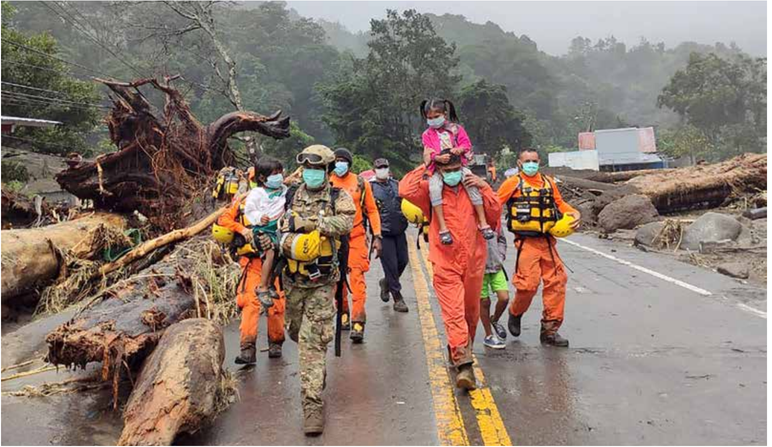
Equipo de salvamento ayuda a moradores de Tierras Altas