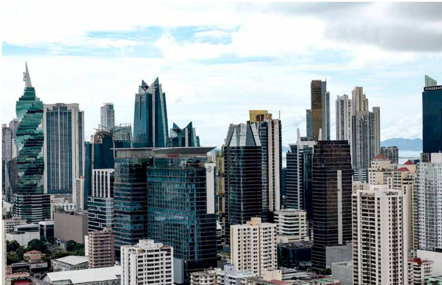
Centro Bancario de Panamá.