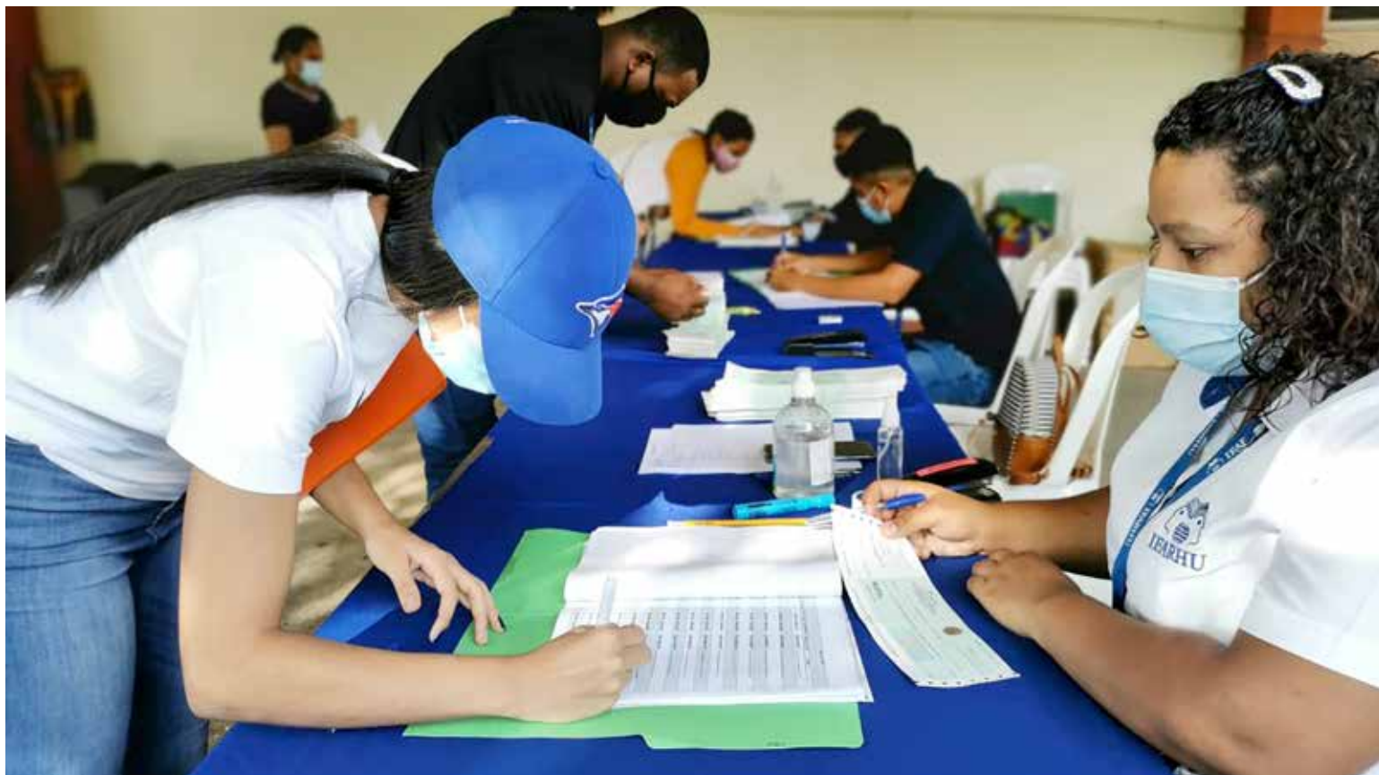
Estudiantes universitarios son beneficiados con becas para sus estudios.