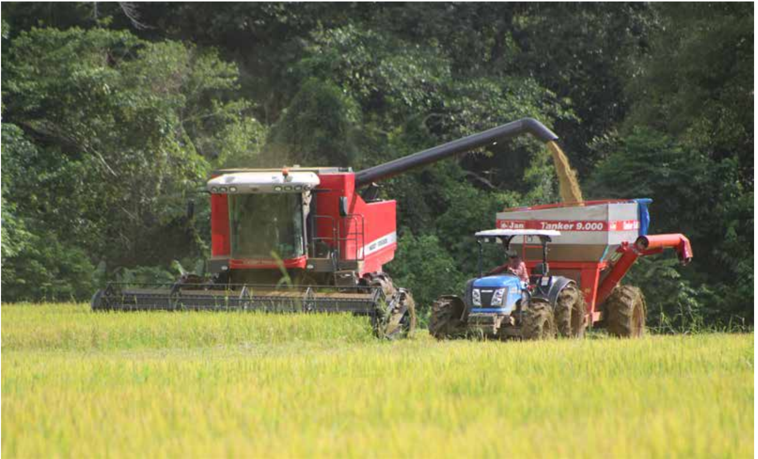
Recolección de arroz en una finca ubicada en el distrito de Soná, provincia de Veraguas.