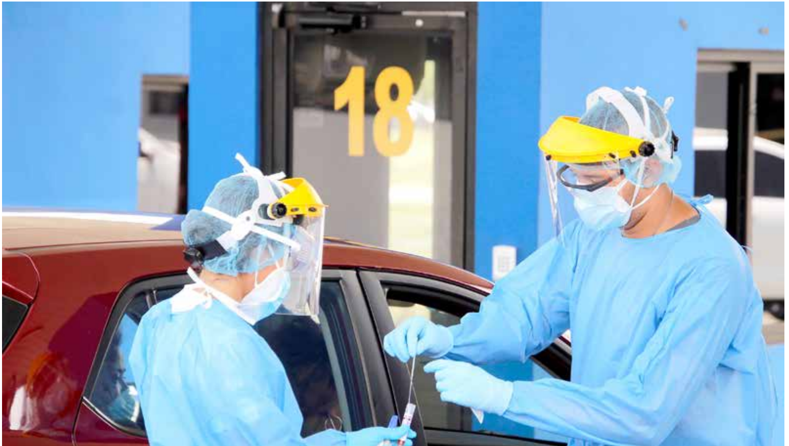
Equipo Unificado de Trazabilidad