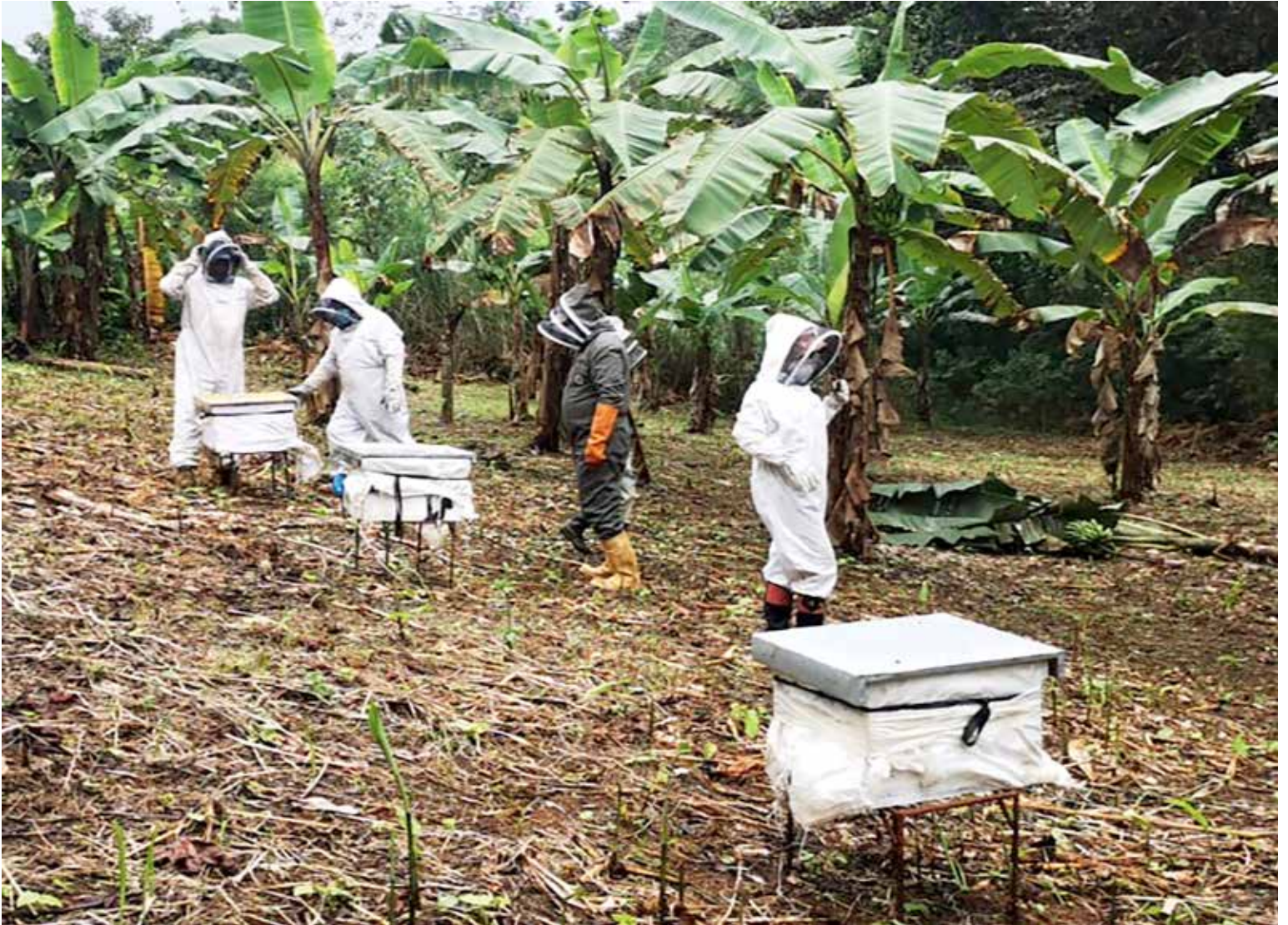
Nuevas técnicas de producción de abejas.