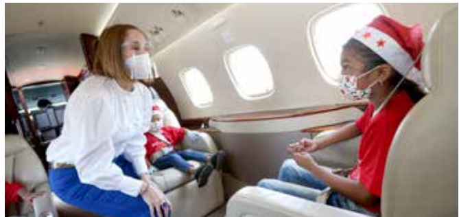
Yazmín Colón de Cortizo escucha atenta a una de las niñas en el avión presidencial.

Doce niños y niñas de la Fundación Aid For Aids vivieron y disfrutaron una experiencia mágica al sobrevolar la capital panameña en el avión presidencial. Los niños, que son pacientes de VIH, fueron recibidos por la primera dama de la República, Yazmín Colón de Cortizo, en las instalaciones del Aeropuerto Internacional Marcos A. Gelabert, en Albrook. En la terminal aérea, se subieron a las cabinas de helicópteros oficiales y saludaron al personal de la Autoridad de Aeronáutica Civil. Luego, al ritmo de villancicos entonados por la Banda de Música de la Policía Nacional, los agasajados abordaron la aeronave para disfrutar de su inolvidable aventura. Durante el recorrido, el avión se colmó de rostros de alegría, emoción y esperanza. De nuevo en tierra, recibieron más regalos y muestras de cariño. "¡Qué mejor manera de aprovechar las horas de vuelo requeridas por el avión presidencial, que regalándole una sonrisa a un niño con condiciones especiales!", manifestó la primera dama. La actividad, que cumplió con todos los protocolos de bioseguridad, se realizó en conmemoración del Día de la Aviación Civil Internacional.