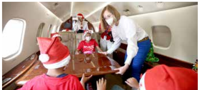
A su regreso, los niños fueron recibidos por Santa Claus y disfrutaron de más sorpresas especialmente preparadas para ellos.