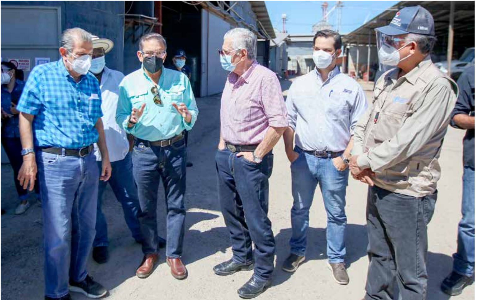
Empresarios del Molino Lago Sirino explican al presidente de la República, Laurentino Cortizo Cohen, y a su equipo de trabajo su producción arrocera.