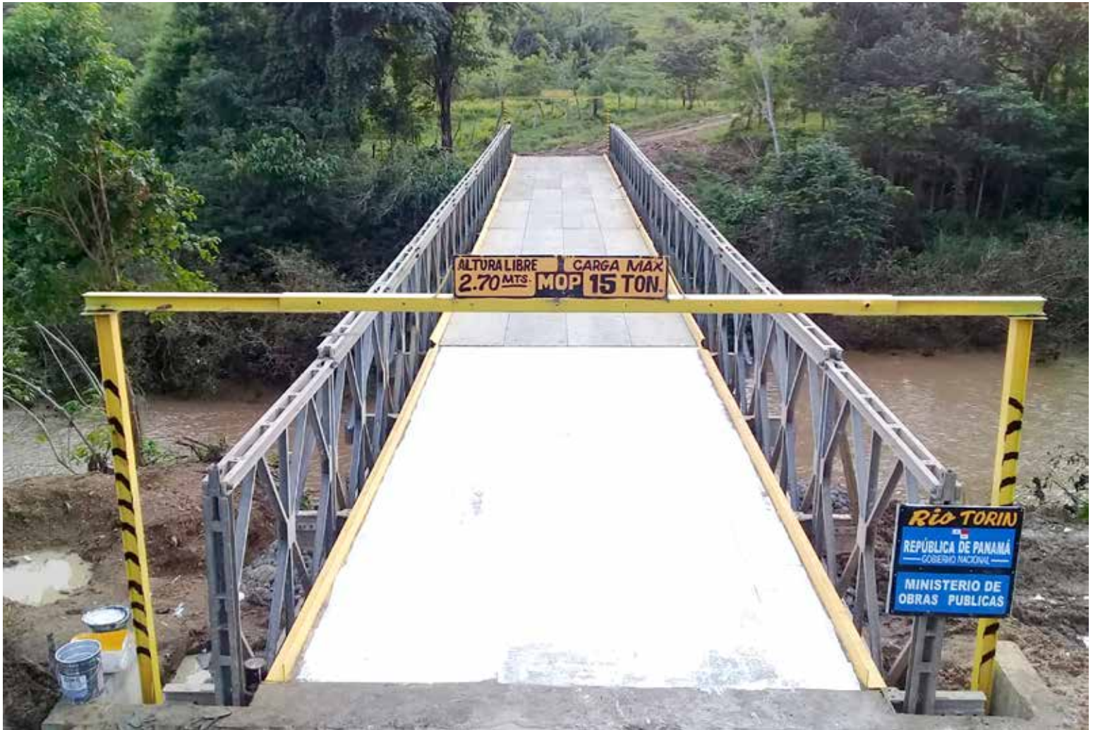
El MOP reconstruye el puente modular sobre el río Torín, en Chepo.