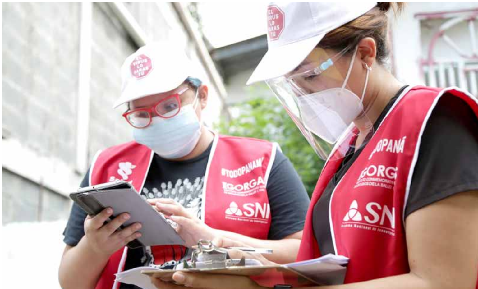
Gira de muestreo en Panamá Oeste