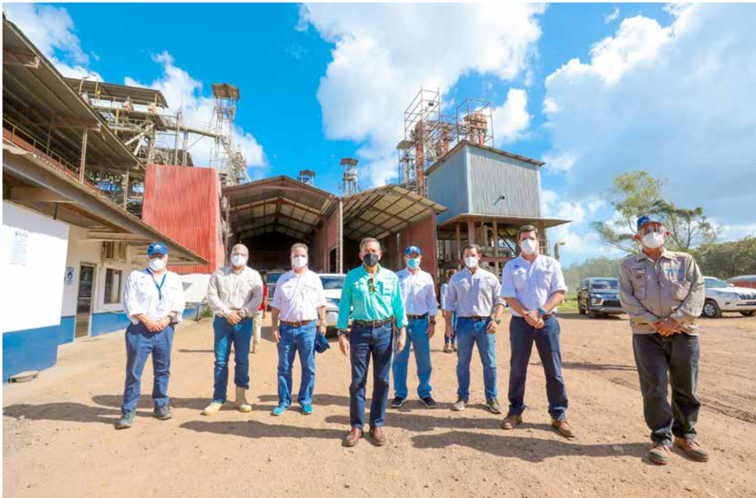
Grupo Calesa informa al presidente de la República, Laurentino Cortizo Cohen, sobre el proceso de fabricación de sus productos.