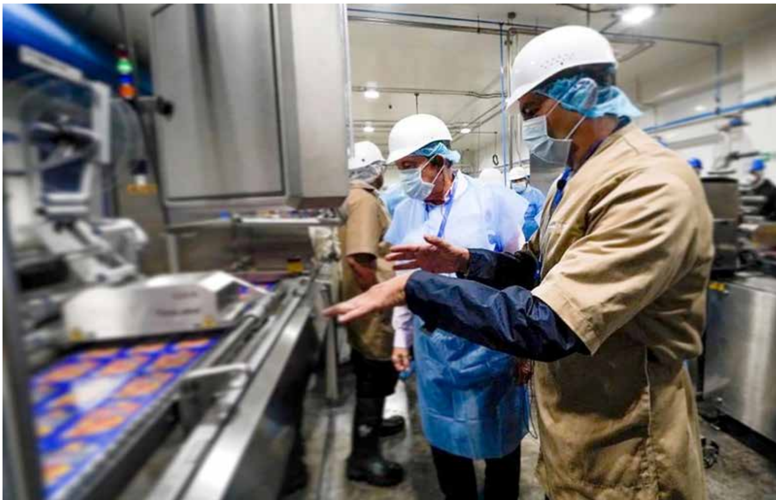
Productos panameños podrán ser exportados a Nicaragua.