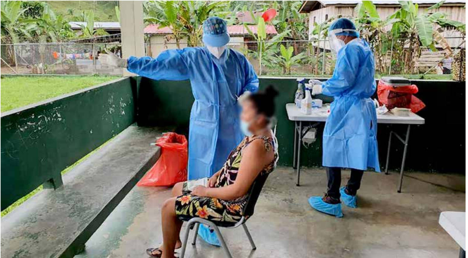
Equipo Unificado de Trazabilidad (EUT) realiza pruebas para combatir la pandemia.