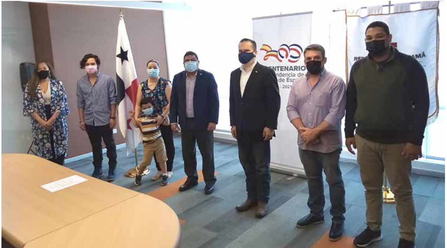
Ganadores del concurso "Mi Historia Cuenta"