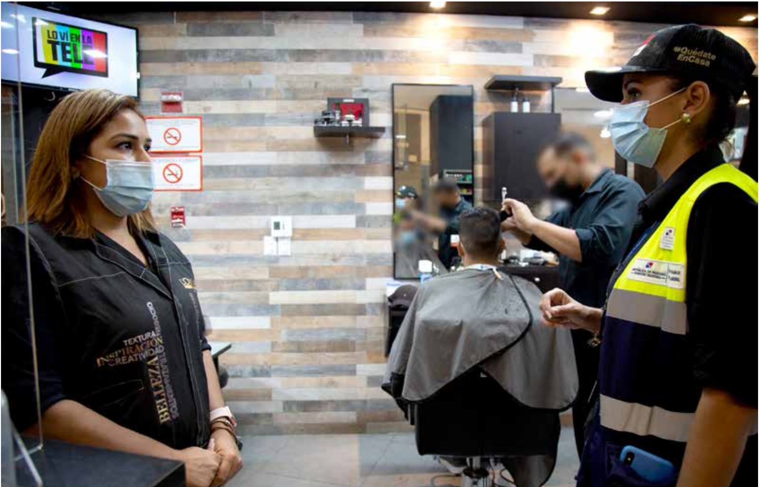
Yadizeth Ballesteros, subdirectora nacional de Inspección, conversa con la administradora de una barbería sobre las medidas de bioseguridad.