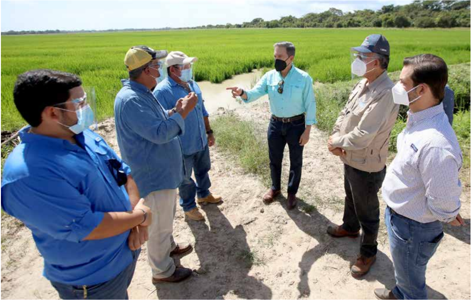
Empresarios de Molino Santa Isabel presentan al presidente de la República, Laurentino Cortizo Cohen, la siembra de arroz.