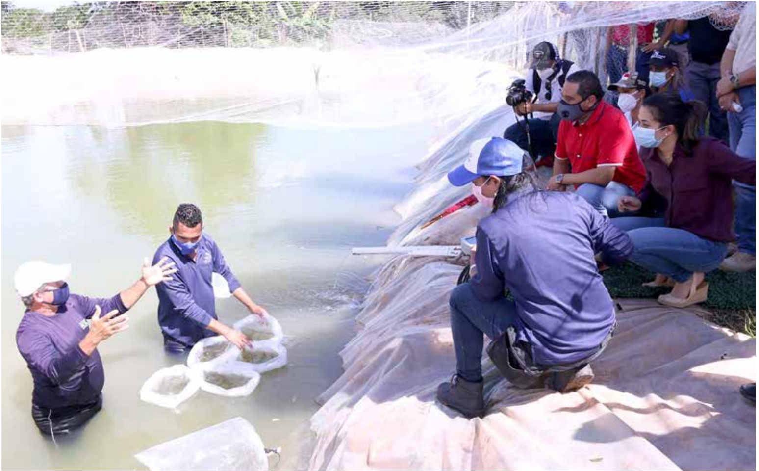
Siembra de alevines de tilapia en el centro penitenciario de Llano Marín, en Penonomé.