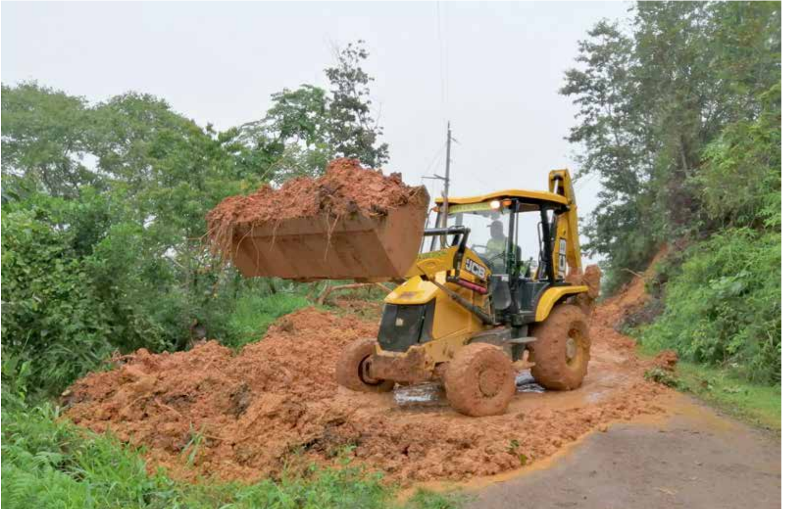
Despeje de escombros por deslizamiento en el sector de La Fragua, en Océ.