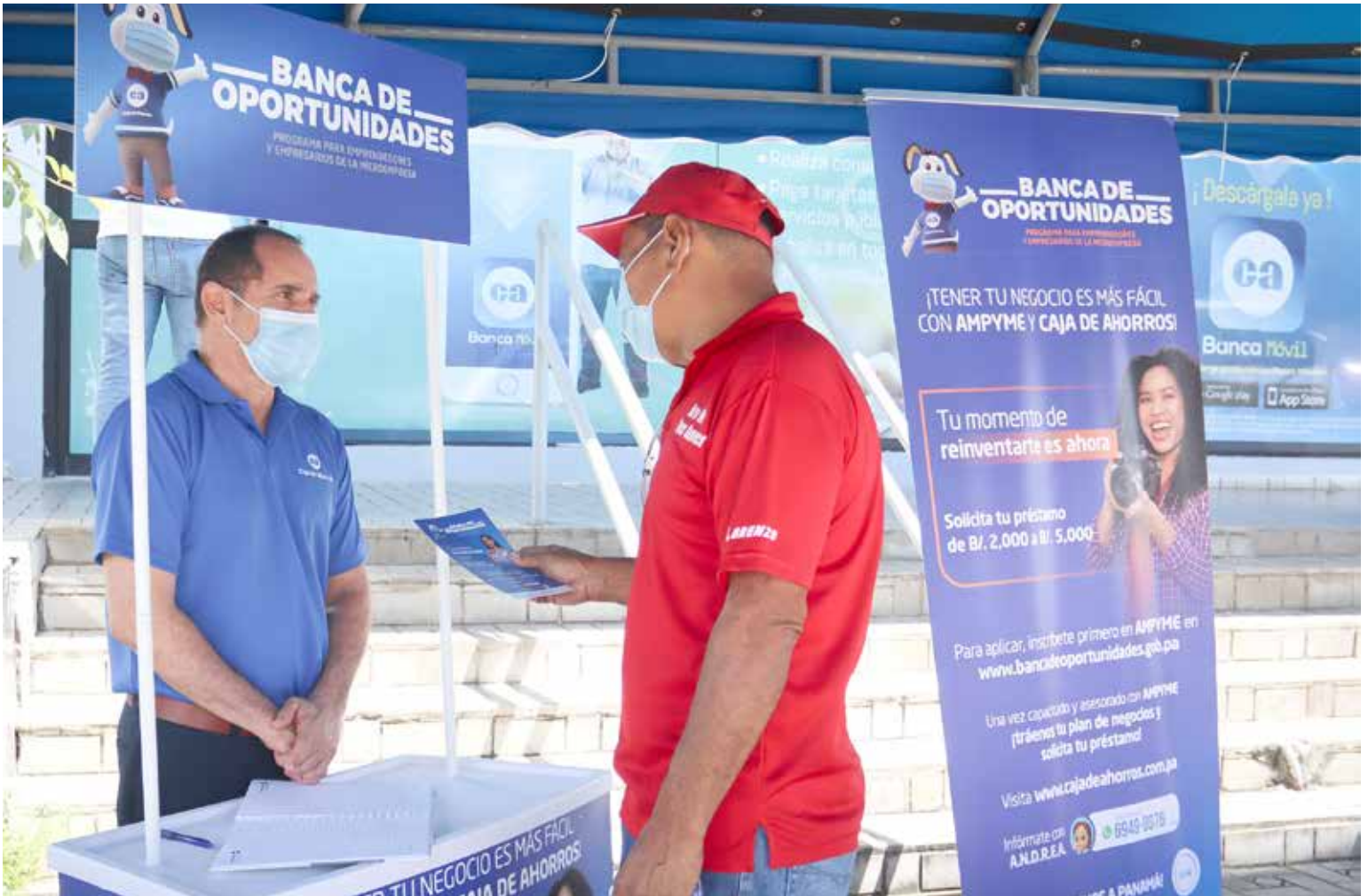
Un colaborador de Caja de Ahorros comparte con el público en general los beneficios del programa Banca de Oportunidades.