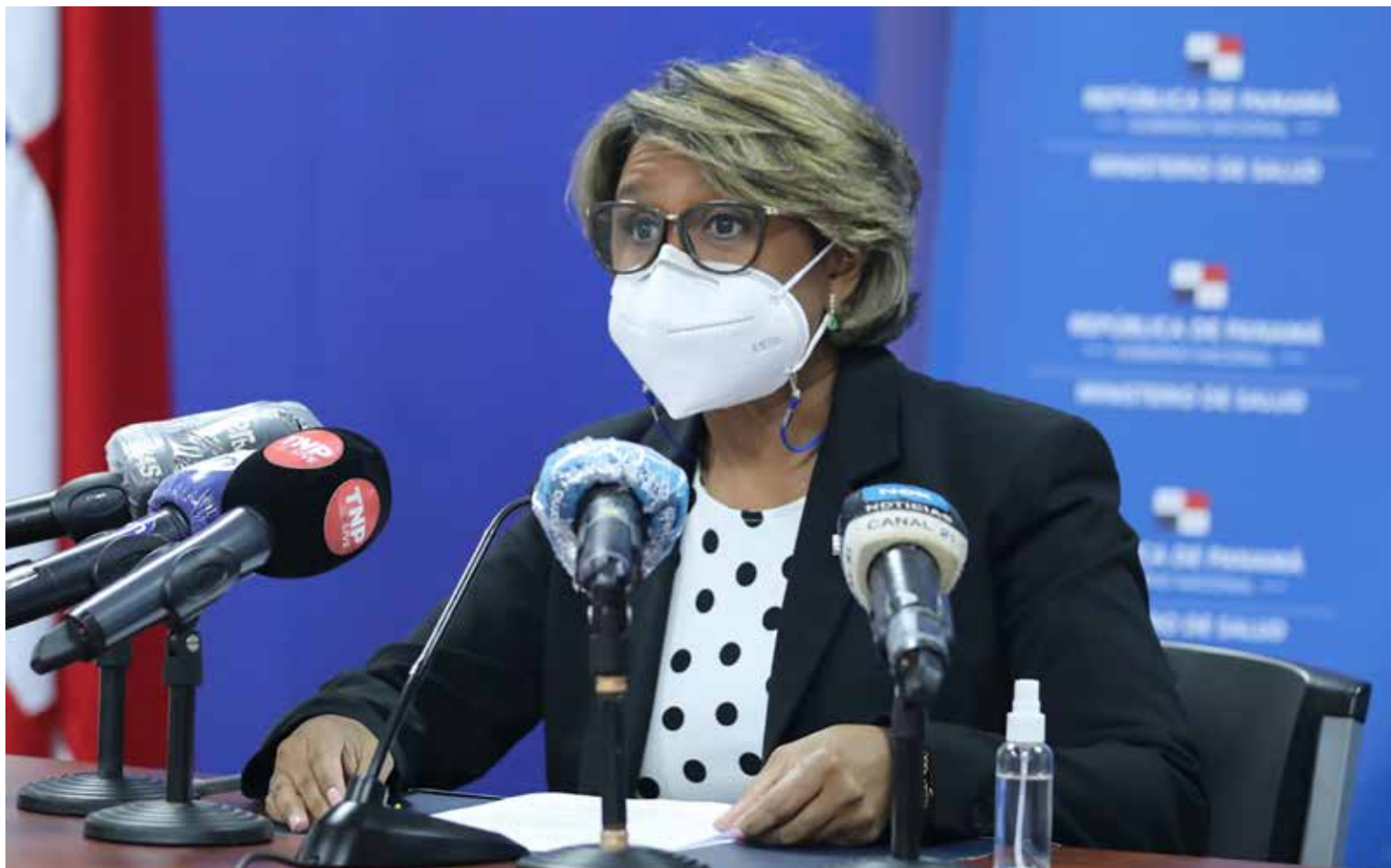
Ivette Berrío, viceministra de Salud.