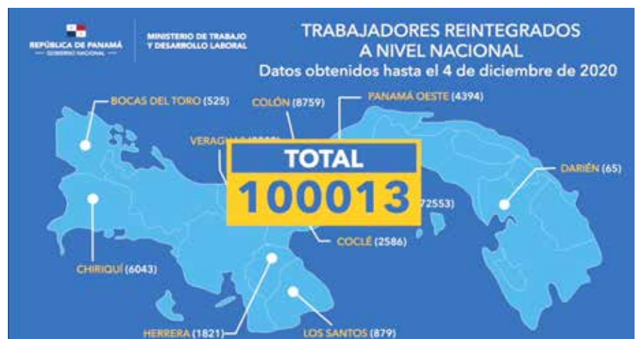
Mapa de contratos reactivados a nivel nacional.

Hasta el 4 de diciembre de 2020, el Ministerio de Trabajo y Desarrollo Laboral (Mitradel) registró un total de 100,013 trabajadores reactivados en las 8,001 empresas que han reiniciado operaciones. De los reactivados, el 62% son hombres y el 38%, mujeres. El Mitradel realiza operativos de inspección, verificación y orientación de las normas de bioseguridad en las empresas para garantizar el bienestar de clientes y trabajadores. Estas inspecciones se pueden solicitar al 311.