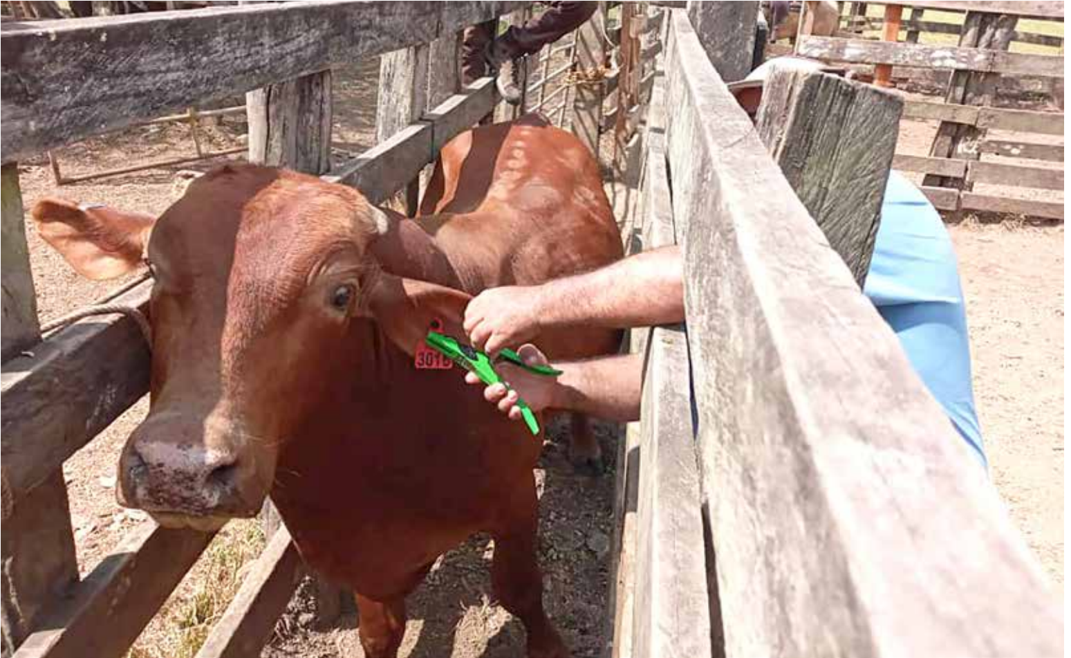
El dispositivo electrónico se coloca para medir la trayectoria del animal desde su nacimiento.