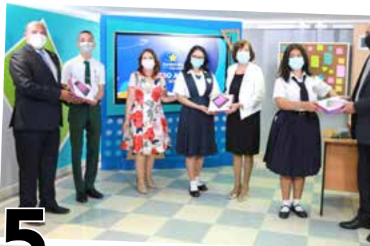
5 PLAN EDUCATIVO DE INTERNET