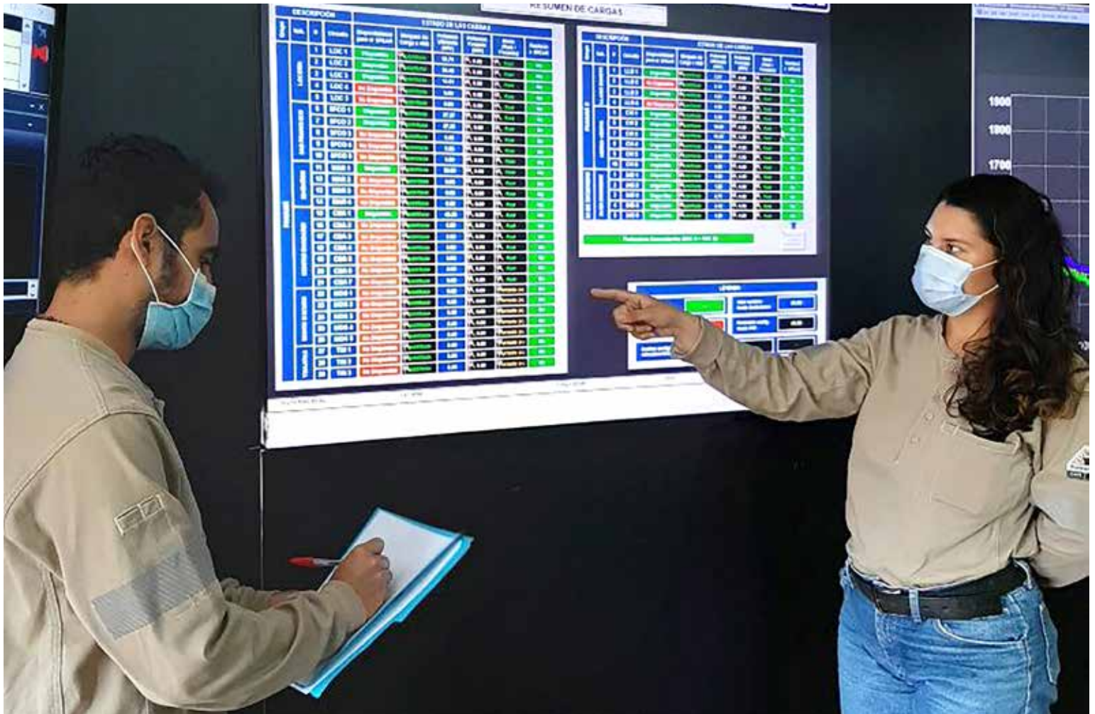
Ingenieros analizan datos del Sistema de Protección Especial con Acciones Remediales (SPEAR).