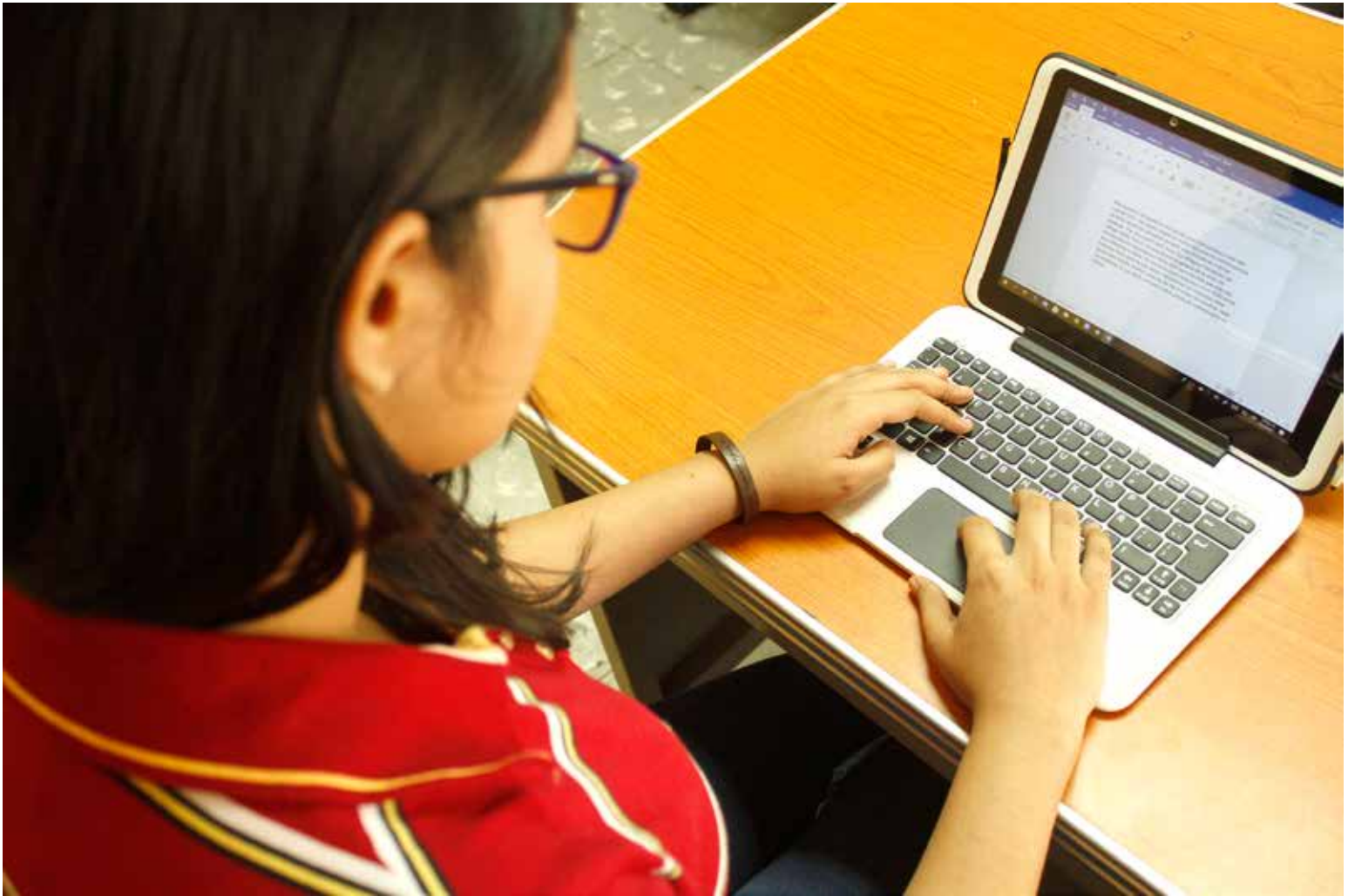
Estudiante de media preparándose para sus clases virtuales.