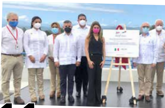
11 ESTRECHAN LAZOS BINACIONALES