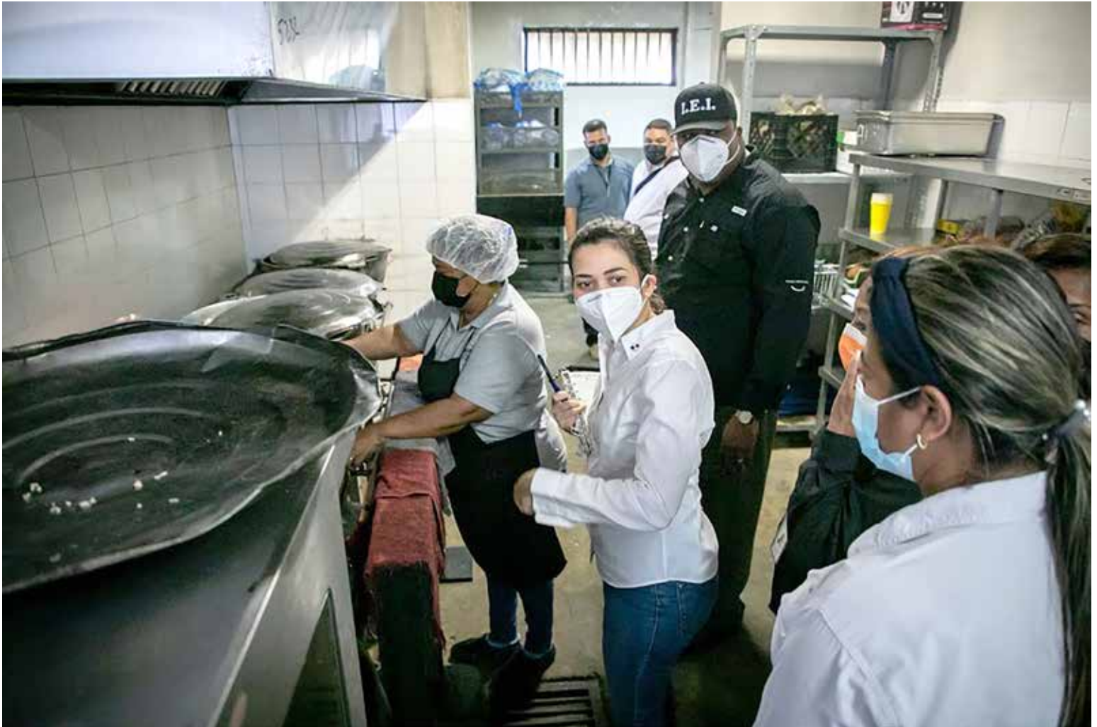
La ministra de Gobierno, Janaina Tewaney Mencomo, inspecciona el área de la cocina del Centro de Cumplimiento.