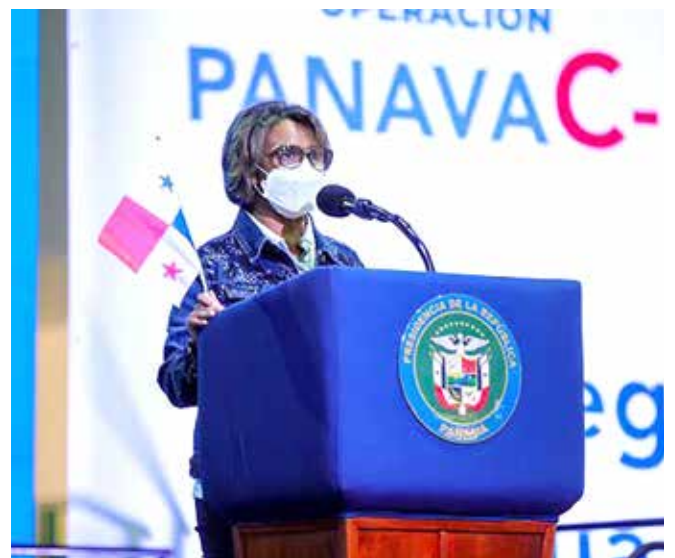
Ivette Berrío, viceministra de Salud.

En un emotivo acto, el presidente de la República, Laurentino Cortizo Cohen, dijo ante más de 700 enfermeras y enfermeros que inician la Fase 2 de la Estrategia Continua de Vacunación Panavac-19, en el circuito 8-6, que ellos son “una luz de esperanza y un mensaje de vida para todo el país”. Enfermeras del Ministerio de Salud (Minsa), de la Caja de Seguro Social (CSS) y estudiantes del último año de enfermería de distintas universidades del país comenzaron la vacunación de más de 55,784 adultos mayores de 60 años, en 95 salones habilitados en 19 centros escolares de los nueve corregimientos de San Miguelito, uno de los sectores más afectados por la pandemia del coronavirus. Un equipo de 1,464 profesionales de la salud ayudará en la Estrategia Continua de Vacunación en San Miguelito. Este acto también contó con la participación de la viceministra de Salud, Ivette Berrío, quien dedicó sus primeras palabras para agradecer el compromiso de todos los trabajadores de la salud del país.