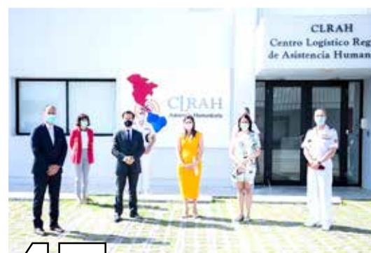
47 ALIANZAS PARA ASISTENCIA HUMANITARIA