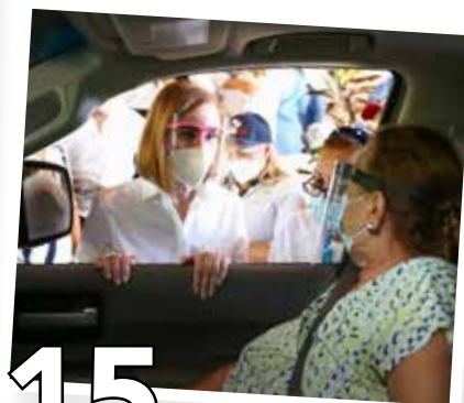
15 AUTORRÁPIDO PARA VACUNAR