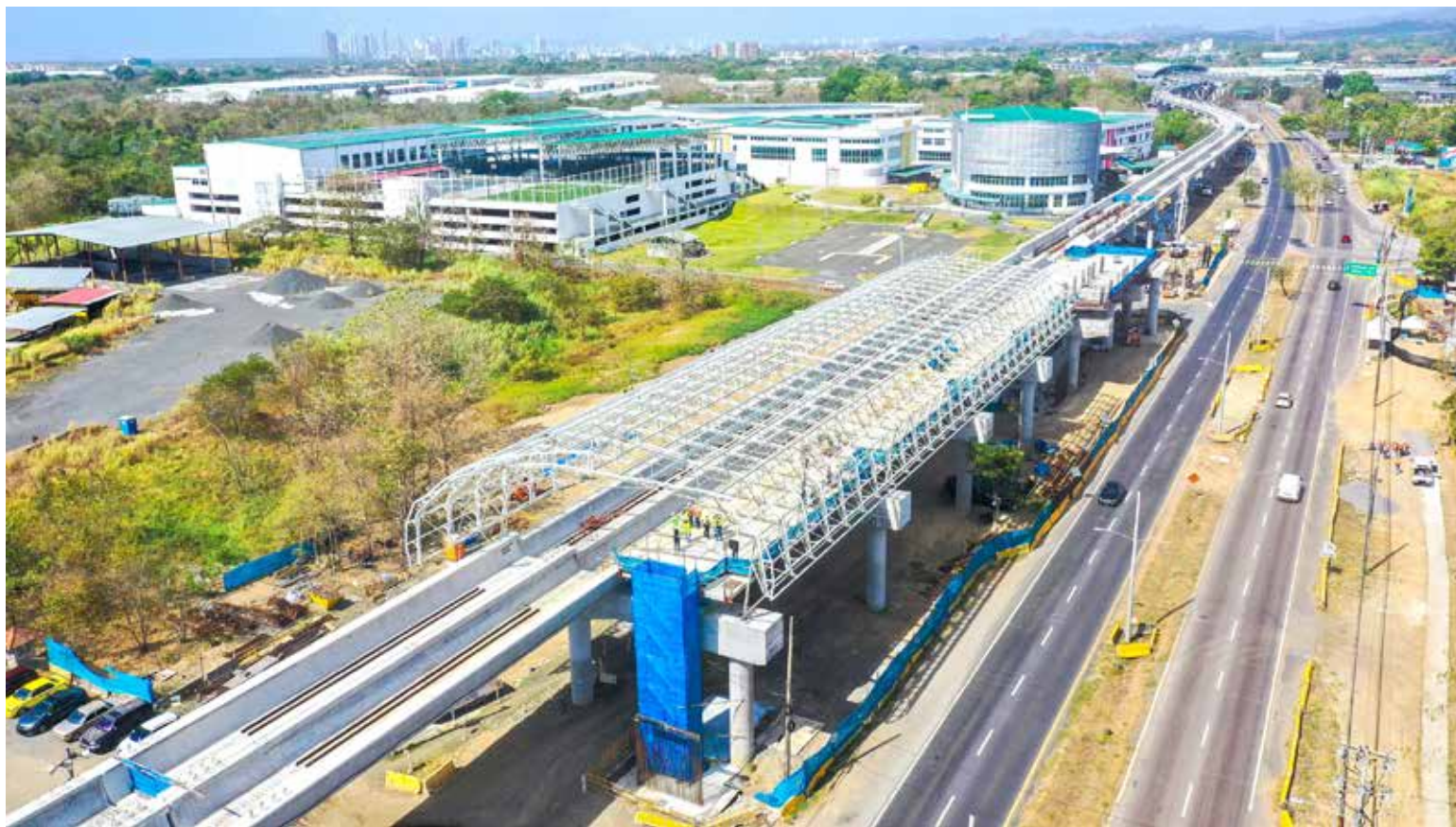
Instalación de los módulos de la cubierta de la Estación ITSE de la Línea 2 del Metro.