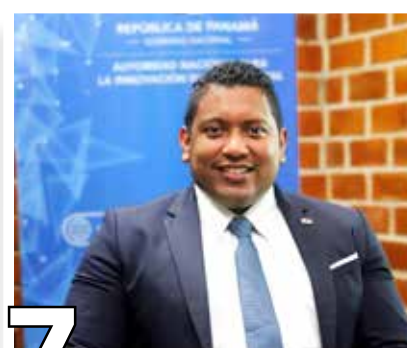
7 TRANSFORMACIÓN DIGITAL DEL ESTADO