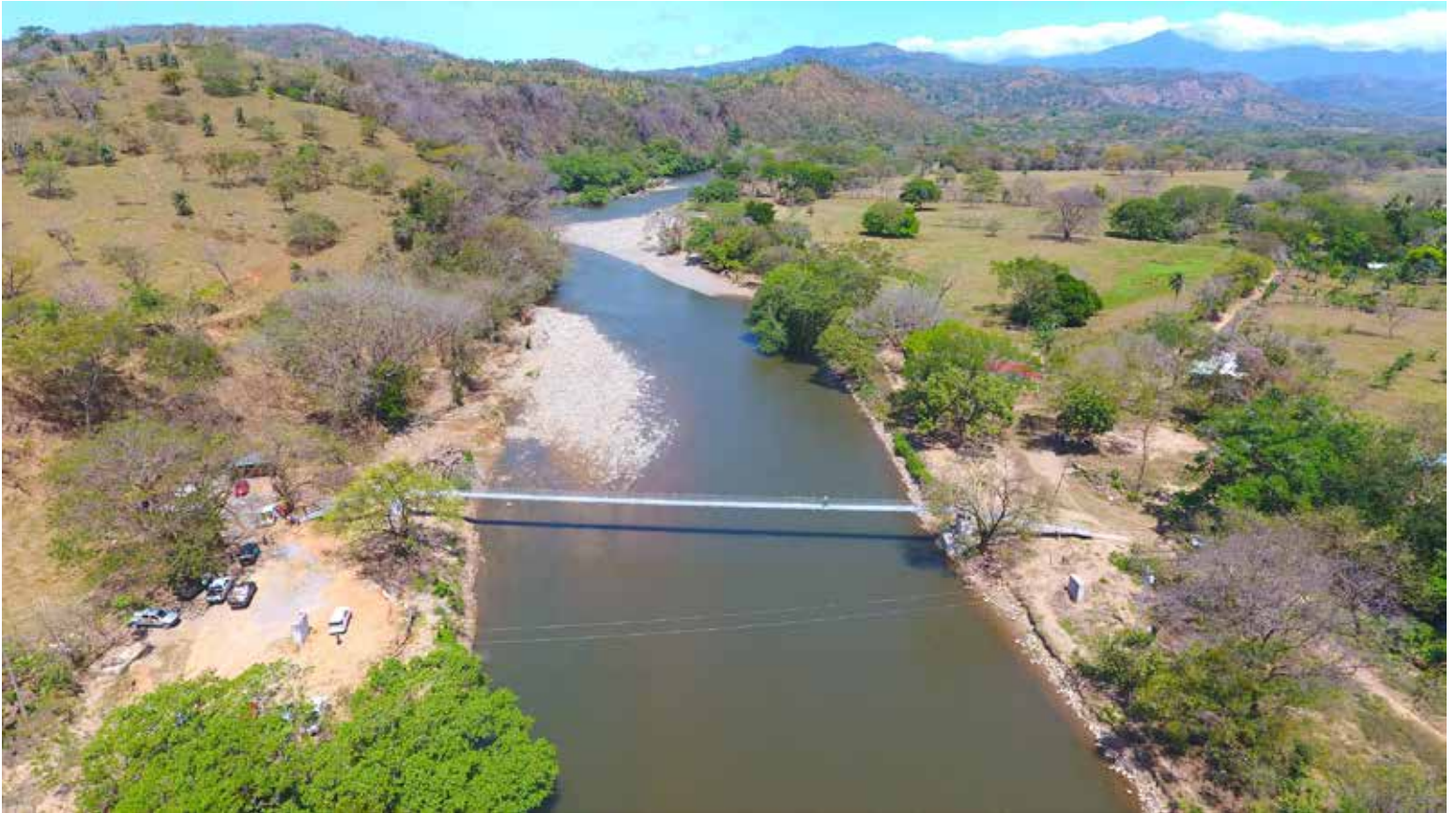
El nuevo puente zarzo peatonal está ubicado sobre el río Fonseca, en la comunidad de Paso Ganado.