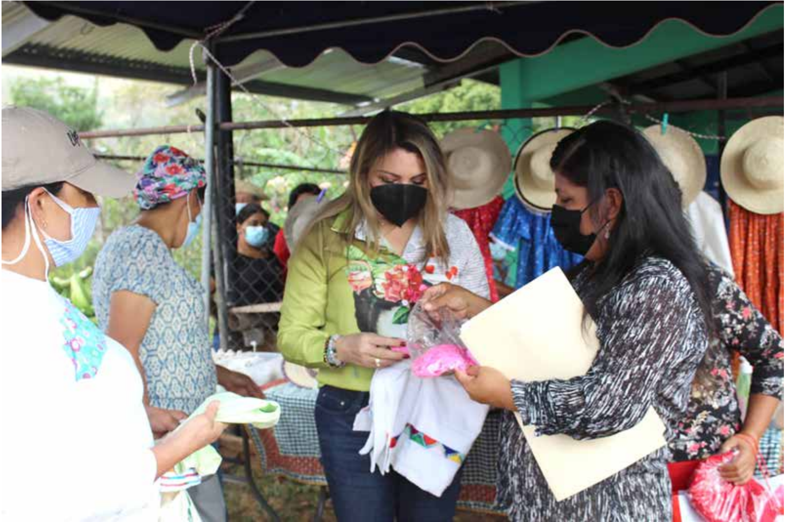
Las mujeres organizadas de Ventorrillo, en Coclé, muestran sus manualidades a la ministra Doris Zapata.