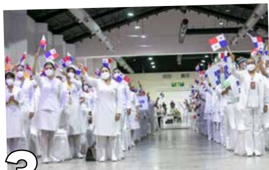
3 COMPROMISO CON LA VIDA