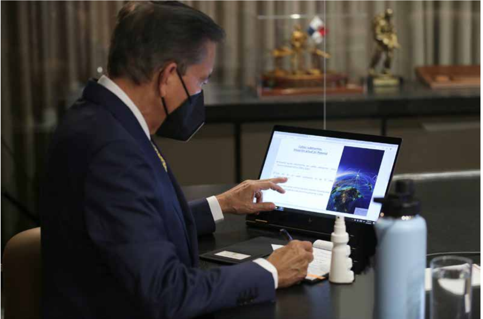
El presidente de la República, Laurentino Cortizo Cohen, durante el Consejo de Gabinete.