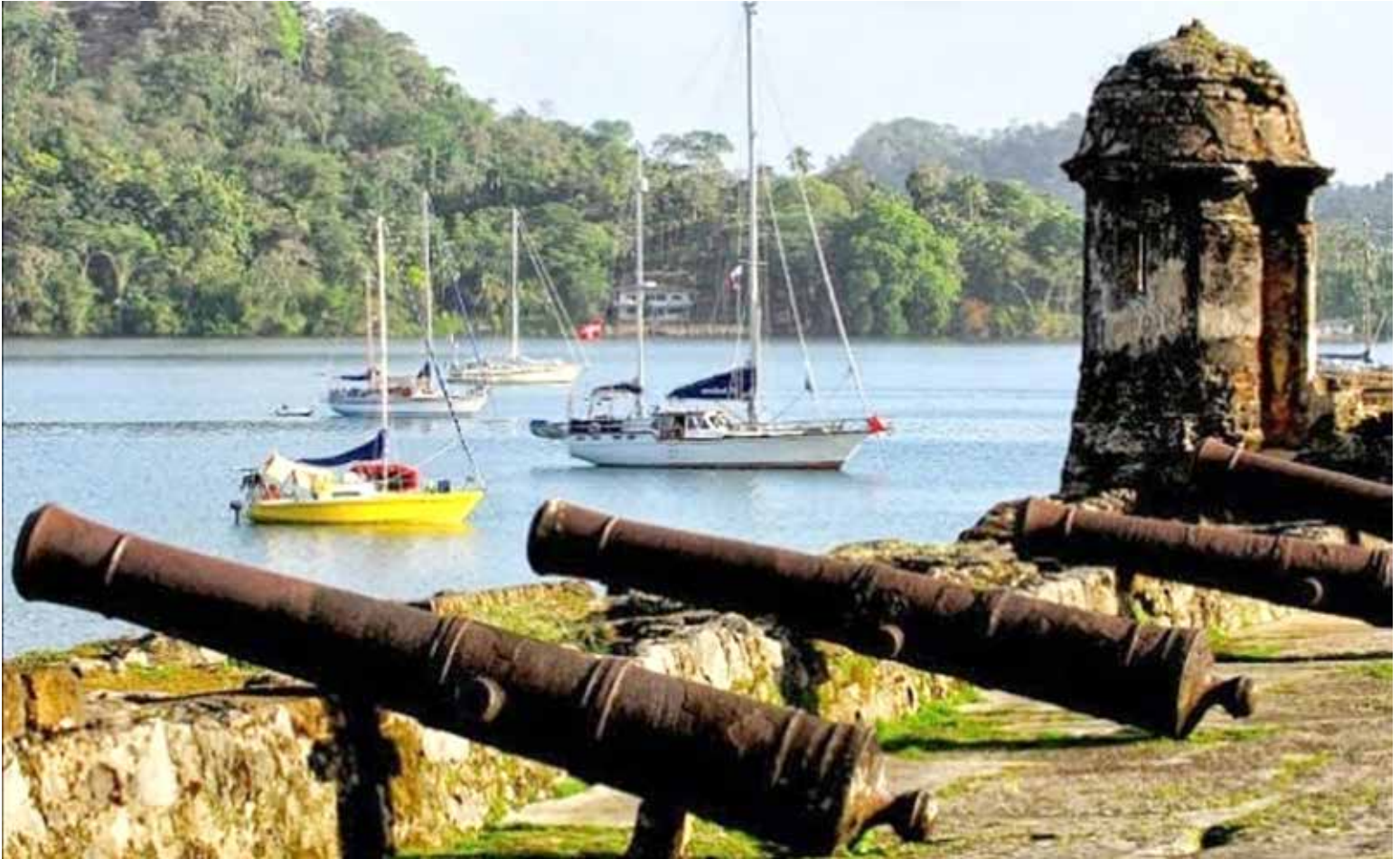
Con financiamiento del BID, se restaurará la Aduana de Portobelo.