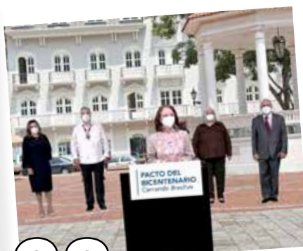
28 EXITOSA PRIMERA FASE