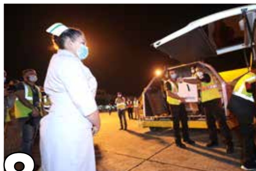
8 CUARTO LOTE DE VACUNAS