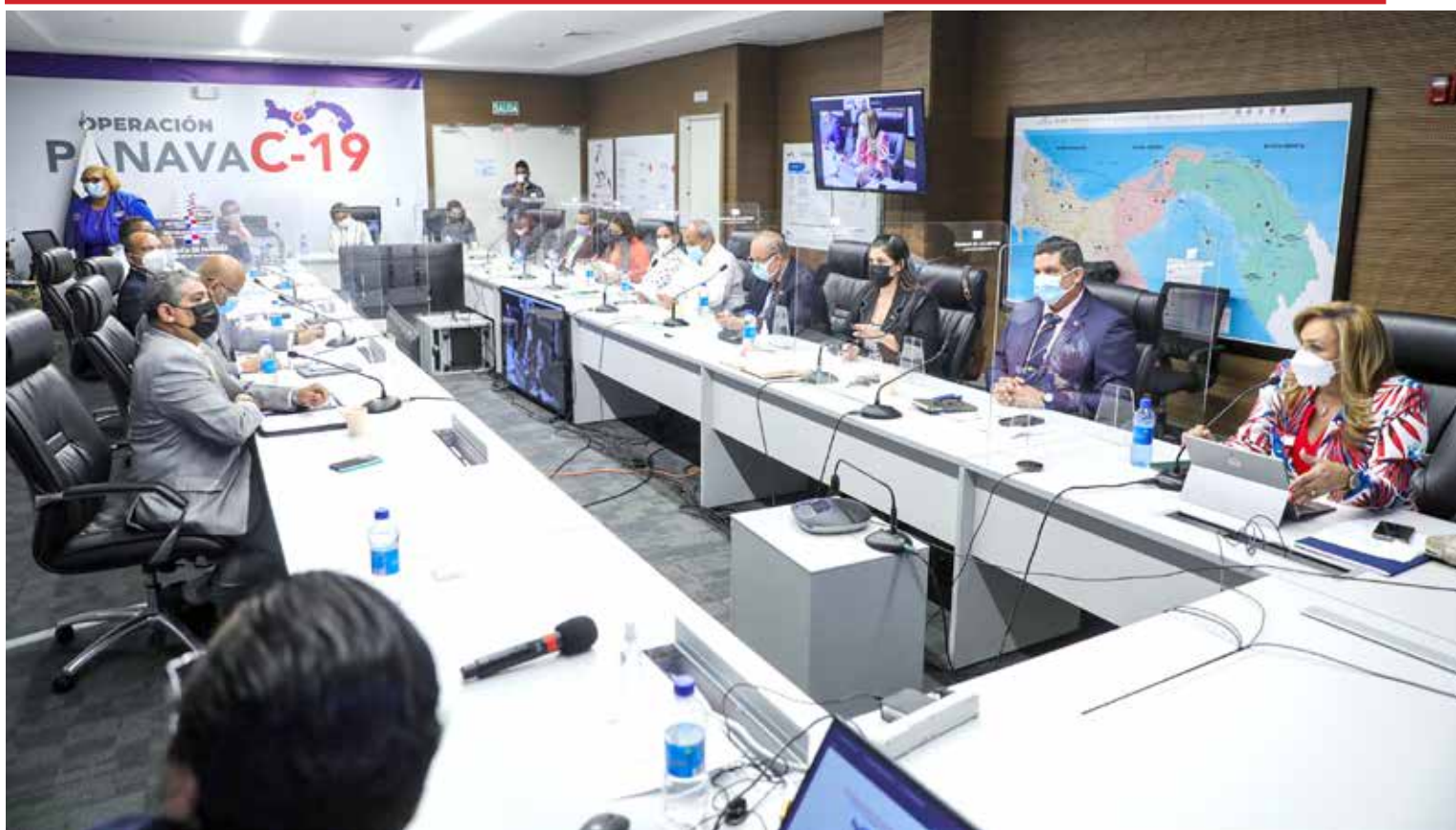
Equipo de Estrategia Continua de Vacunación PanavaC-19