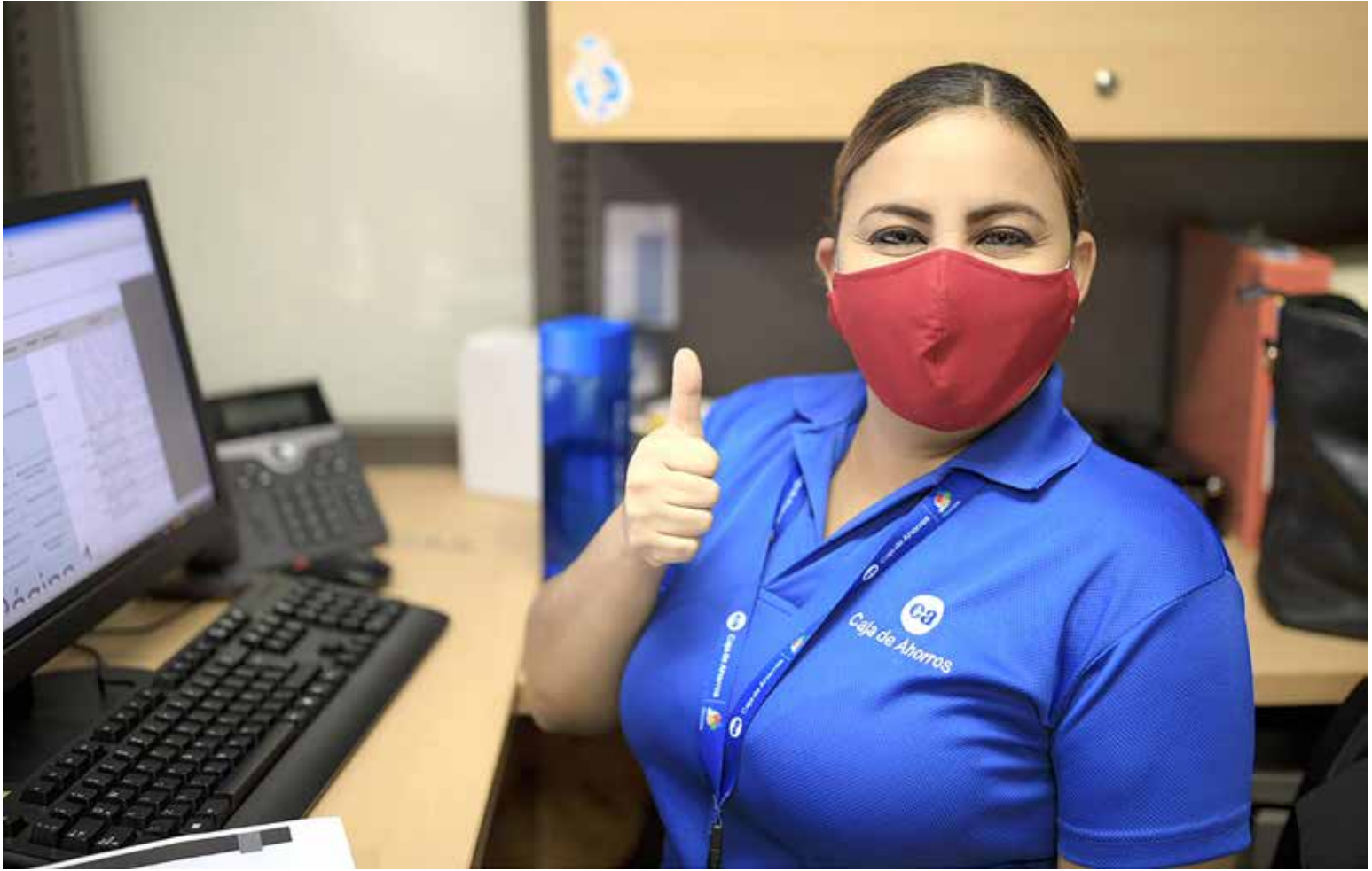
Colaboradora de Caja de Ahorros recibe capacitación de manera virtual.