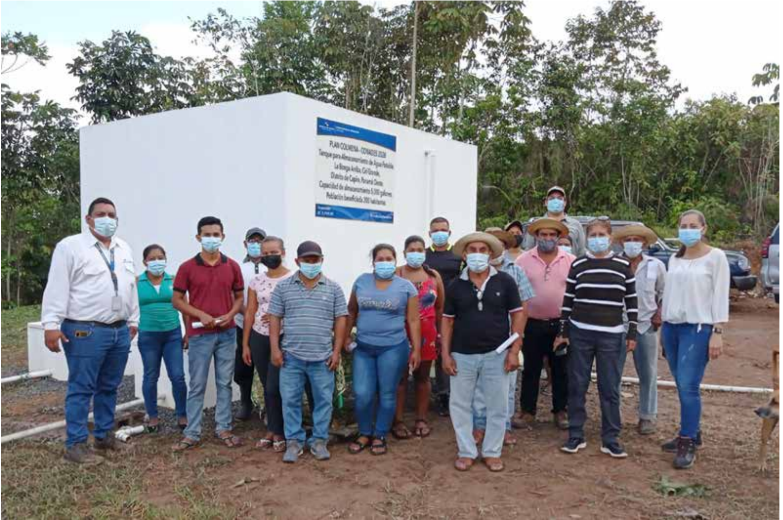
Residentes de La Bonga Arriba, con personal del Conades.