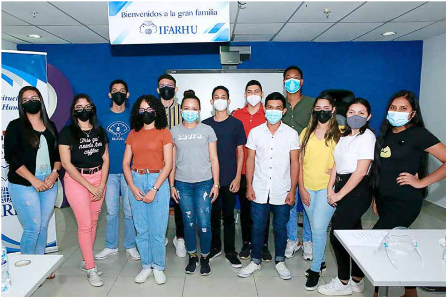
Estudiantes reciben capacitación previa a su viaje a Canadá.