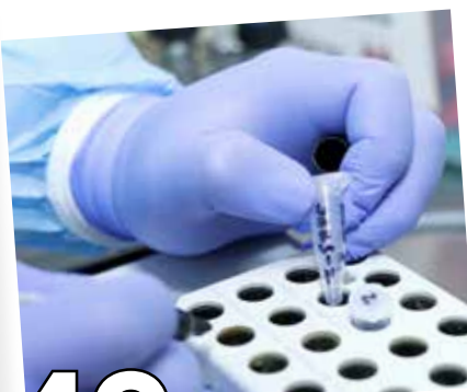
49 GORGAS SUPERA DESAFÍOS