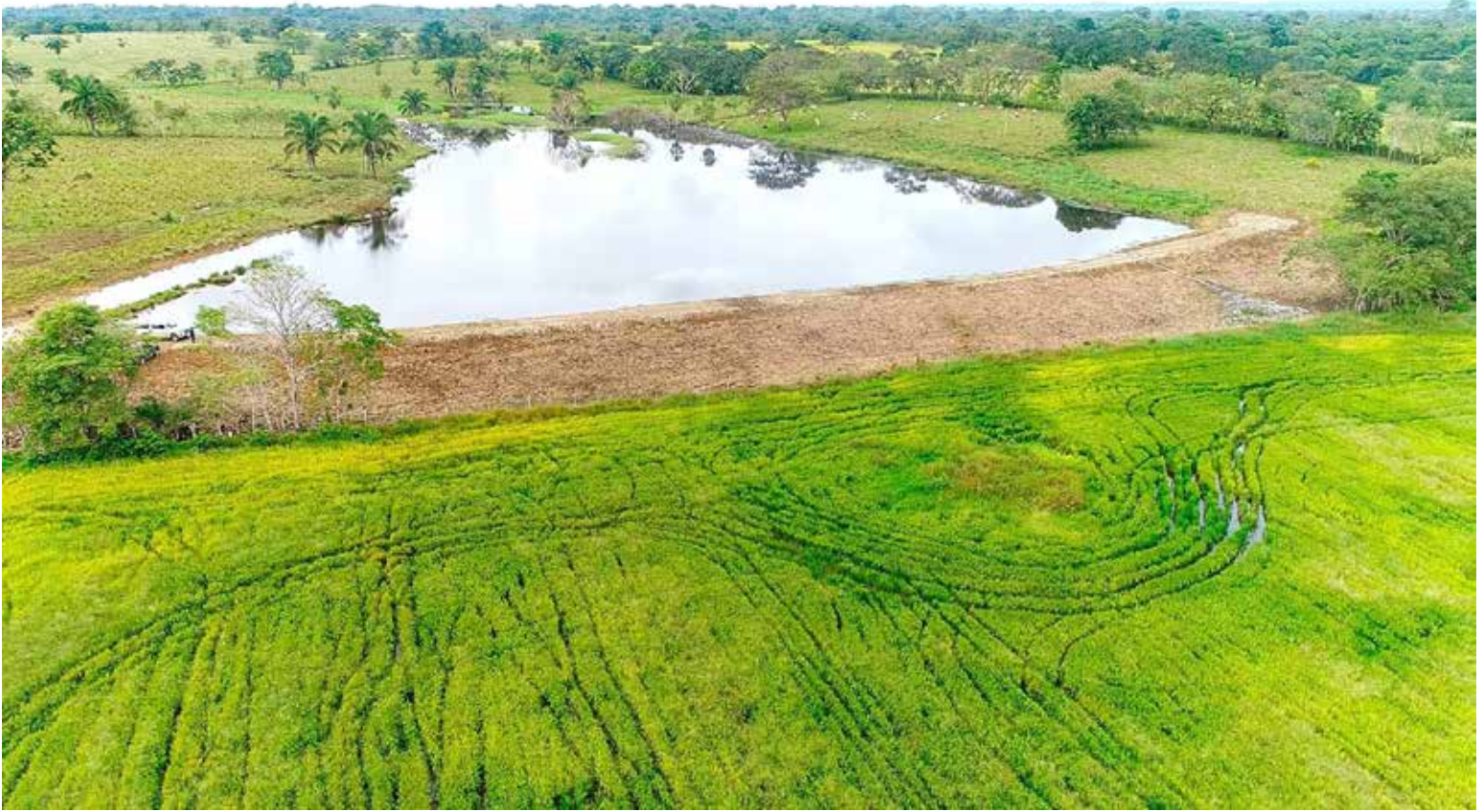
Producción de arroz con un sistema de riego amigable con el ambiente.