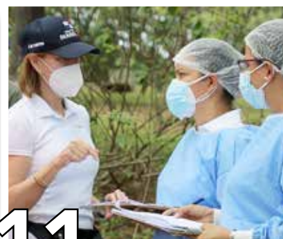
11 JORNADA EXITOSA