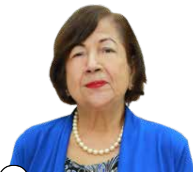
50 CONSAGRADA EDUCADORA