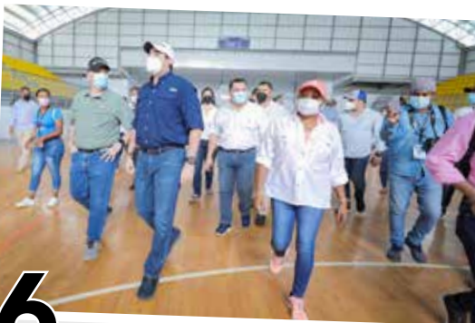
6 PANAMÁ SOLIDARIO