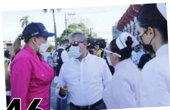
46 PANAMÁ ENTRE PIONEROS