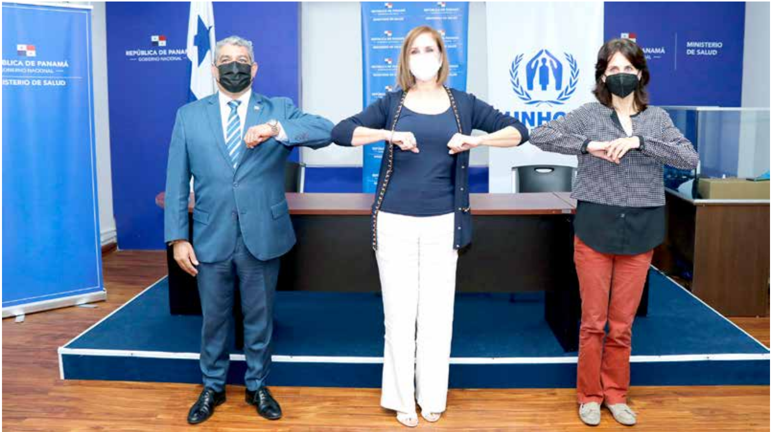
En el acto de entrega, estuvieron presentes Luis Francisco Sucre, ministro de Salud; la primera dama, Yasmín Colón de Cortizo; y Renee Cuijpers, representante regional adjunta de Acnur en Centroamérica y Cuba.