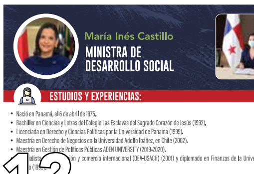
12 LOGROS MIDES