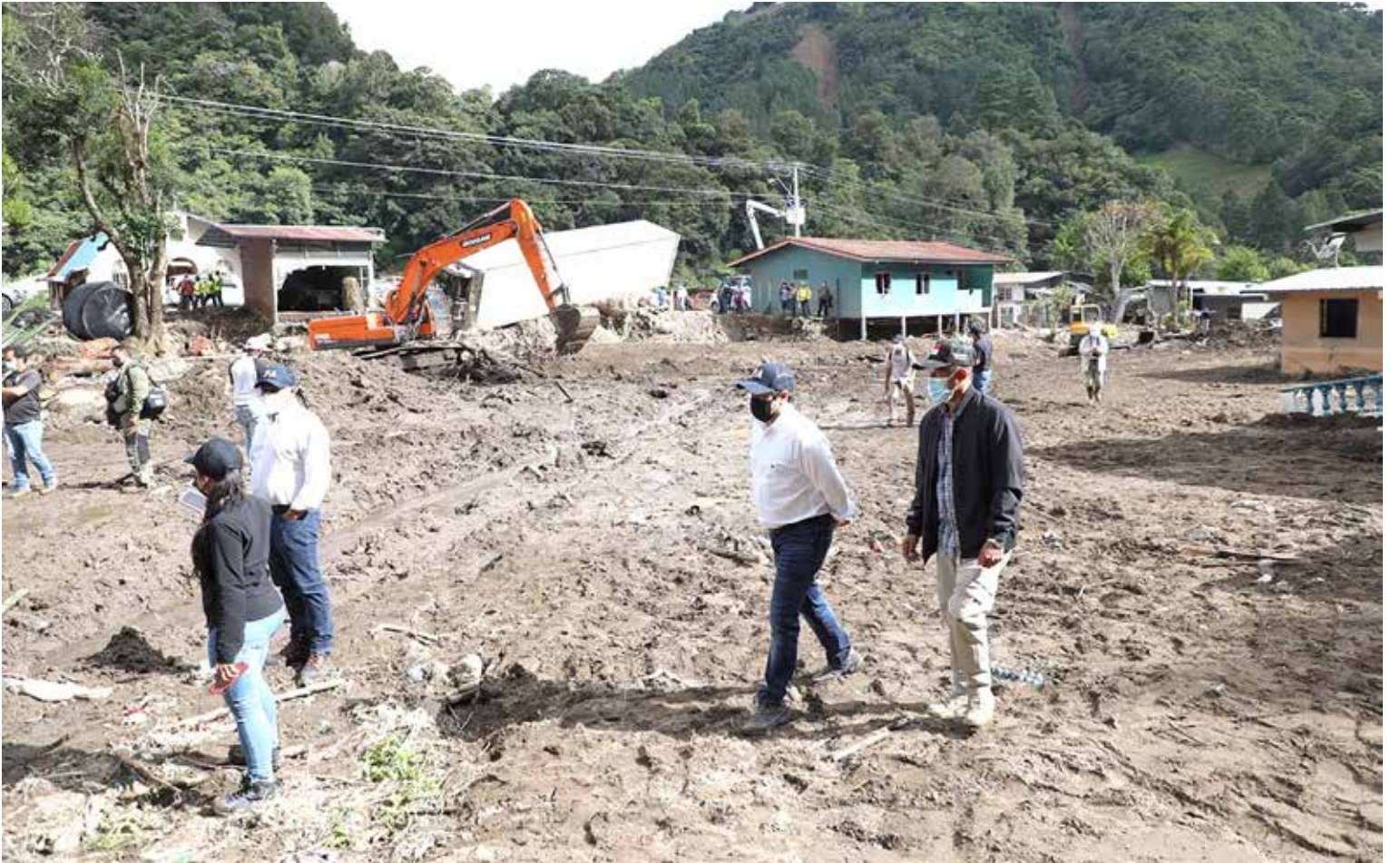
Autoridades del Gobierno Nacional recorren áreas afectadas por el ciclón tropical Eta en la provincia de Chiriquí.