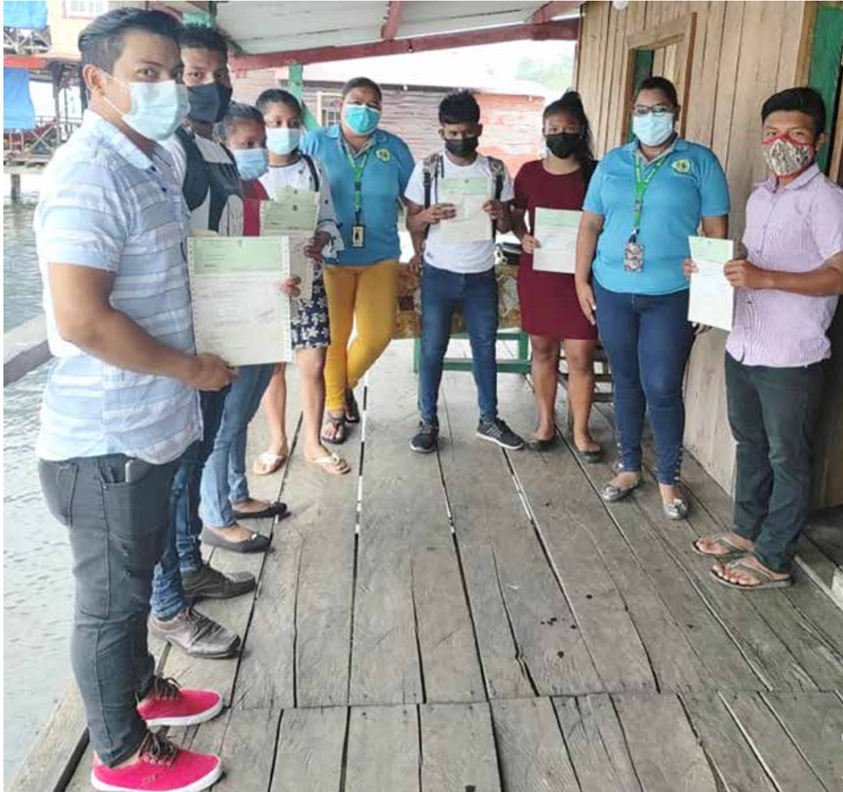
Estudiantes de Bocas del Toro reciben cheques del Programa de Asistencia Social Educativa Cooperativa.