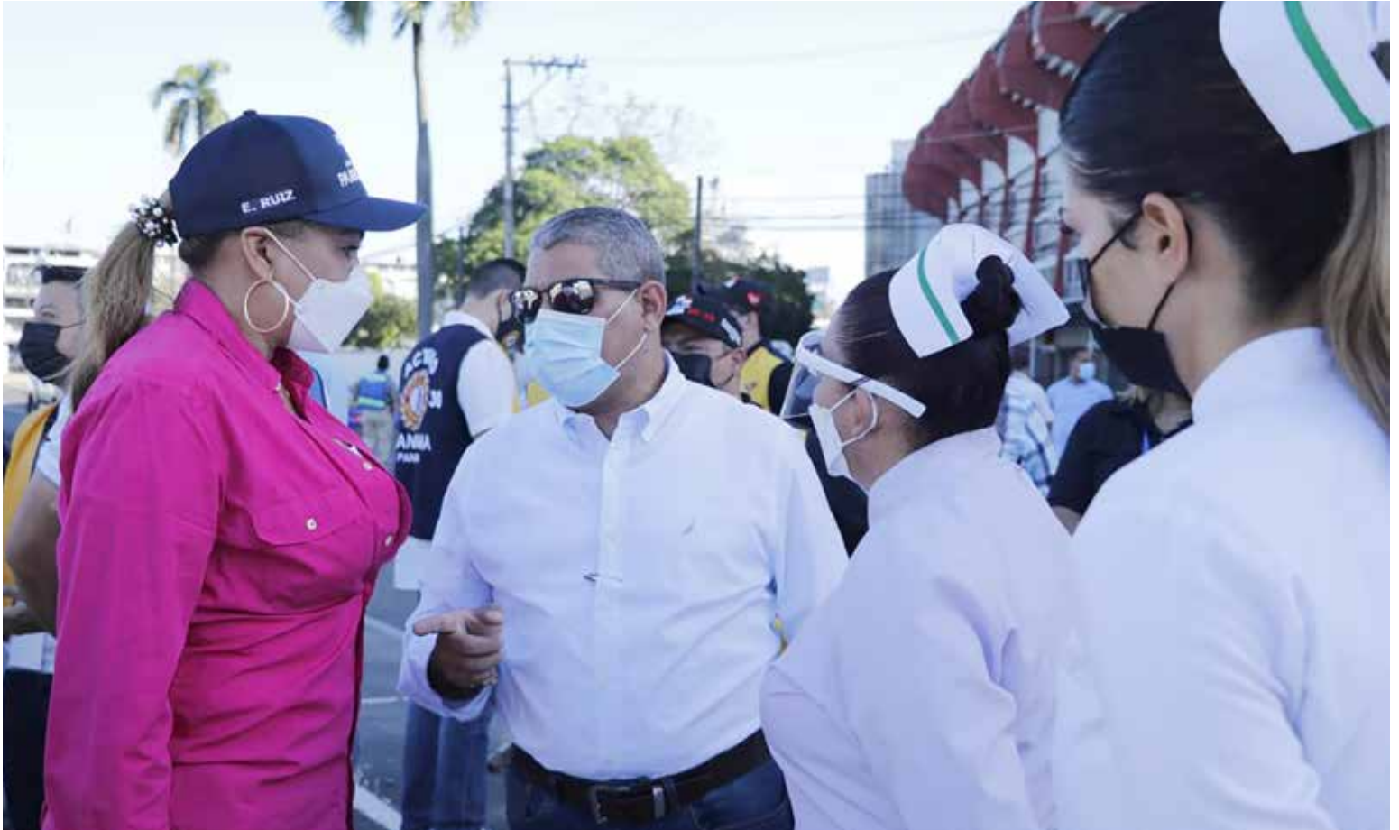
Los ministros Luis Francisco Sucre y Eyra Ruiz en el proceso de vacunación en el circuito 8-8.