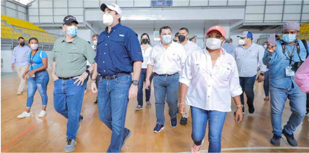
El vicepresidente de la República, José Gabriel Carrizo Jaén, realizó una gira de trabajo en Pacora con las autoridades líderes para seguir dando alivio y esperanza a la población.