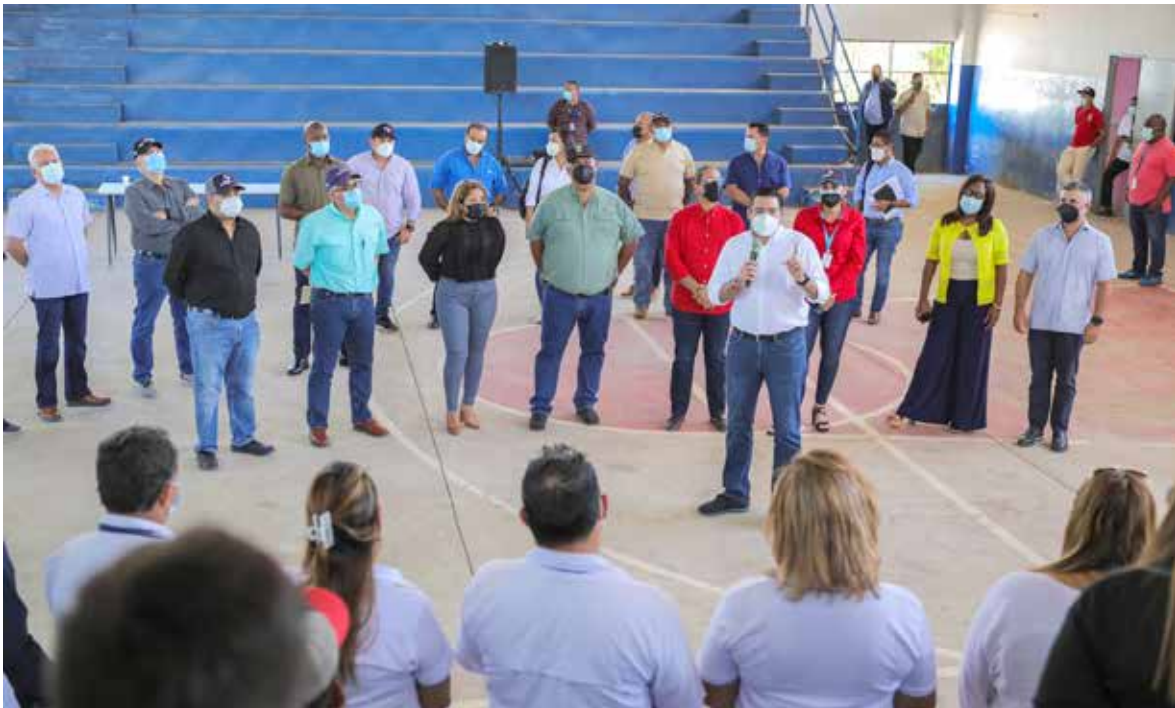
El vicepresidente de la República, José Gabriel Carrizo Jaén, se reunió el jueves con el equipo de Panamá Solidario en el distrito de Arraiján, provincia de Panamá Oeste, con el propósito de seguir fortaleciendo la ayuda que el Gobierno Nacional proporciona a personas afectadas por la pandemia.