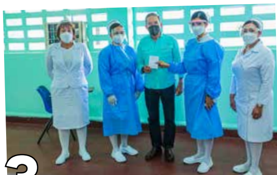
3 PAI CON EXCELENTE ORGANIZACIÓN