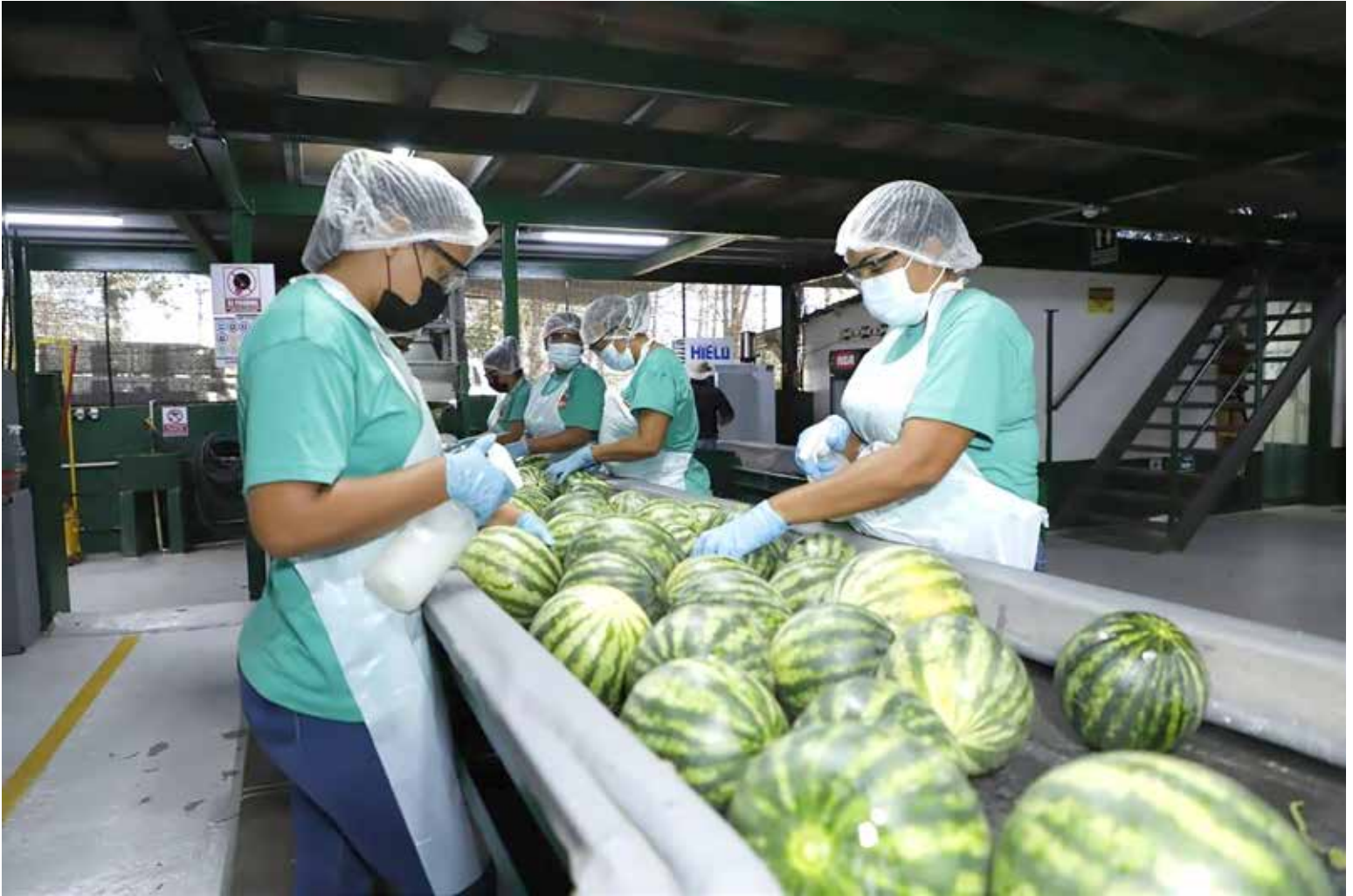
Planta de Potuga Fruit, en la provincia de Herrera.