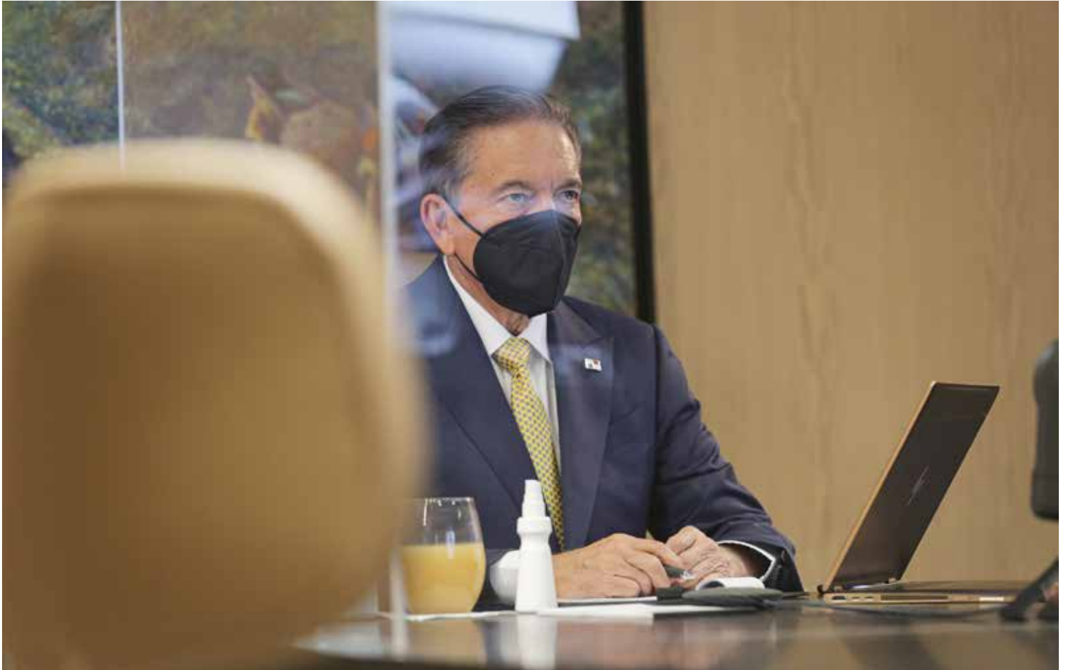
El presidente de la República, Laurentino Cortizo Cohen, durante Consejo de Gabinete.