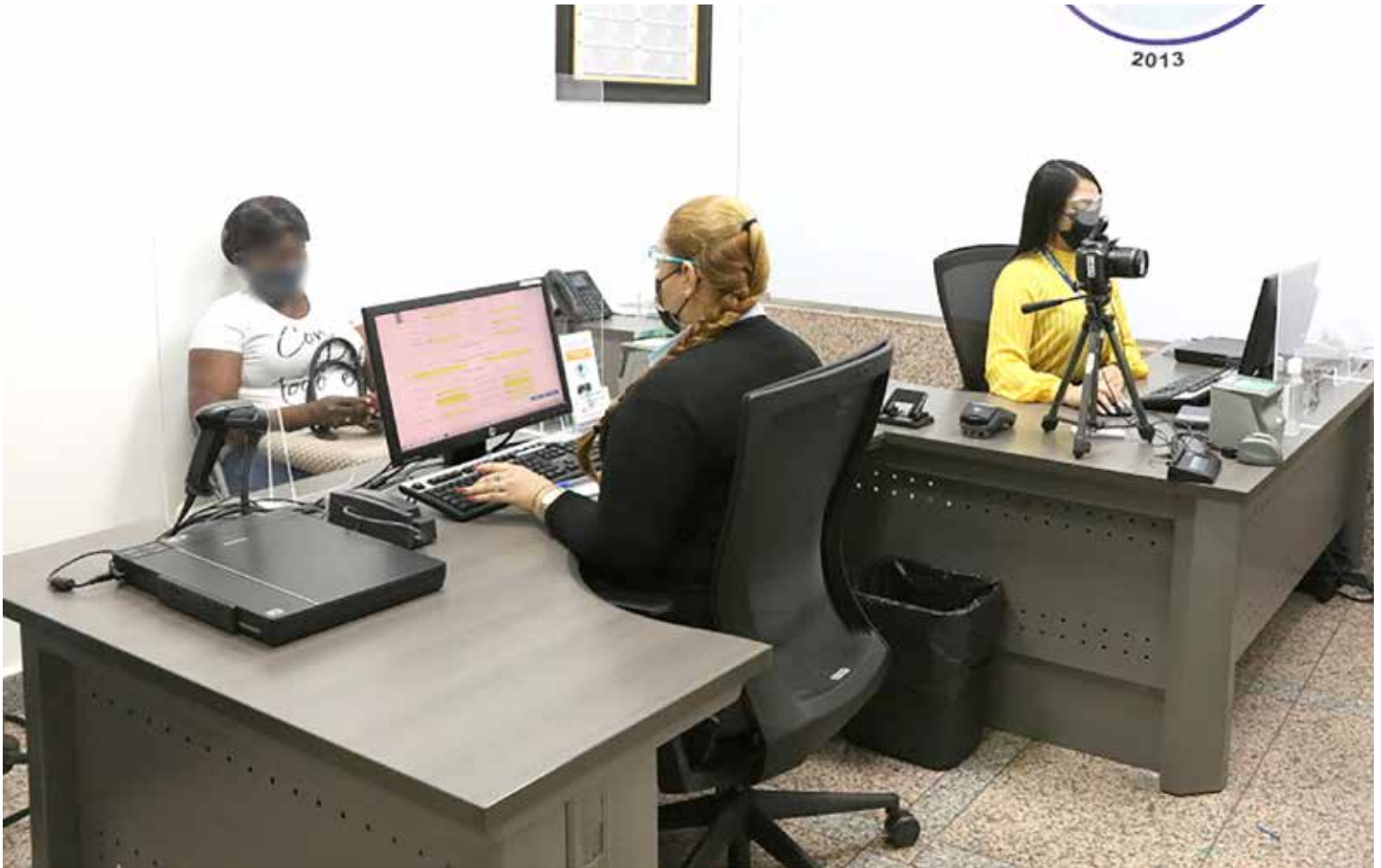
Funcionarios verifican los documentos de los usuarios para tramitar su pasaporte.