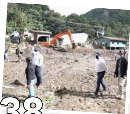
38 ESTADO COBRA INDEMNIZACIÓN