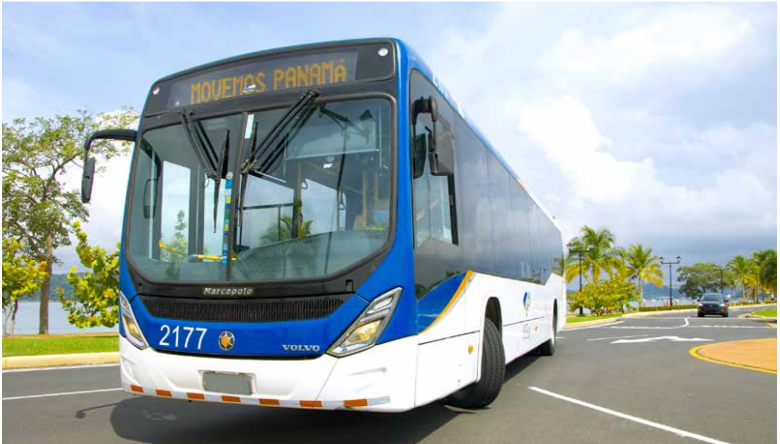
Unidad de MiBus, transporte masivo de Panamá, en su recorrido por la Calzada de Amador.