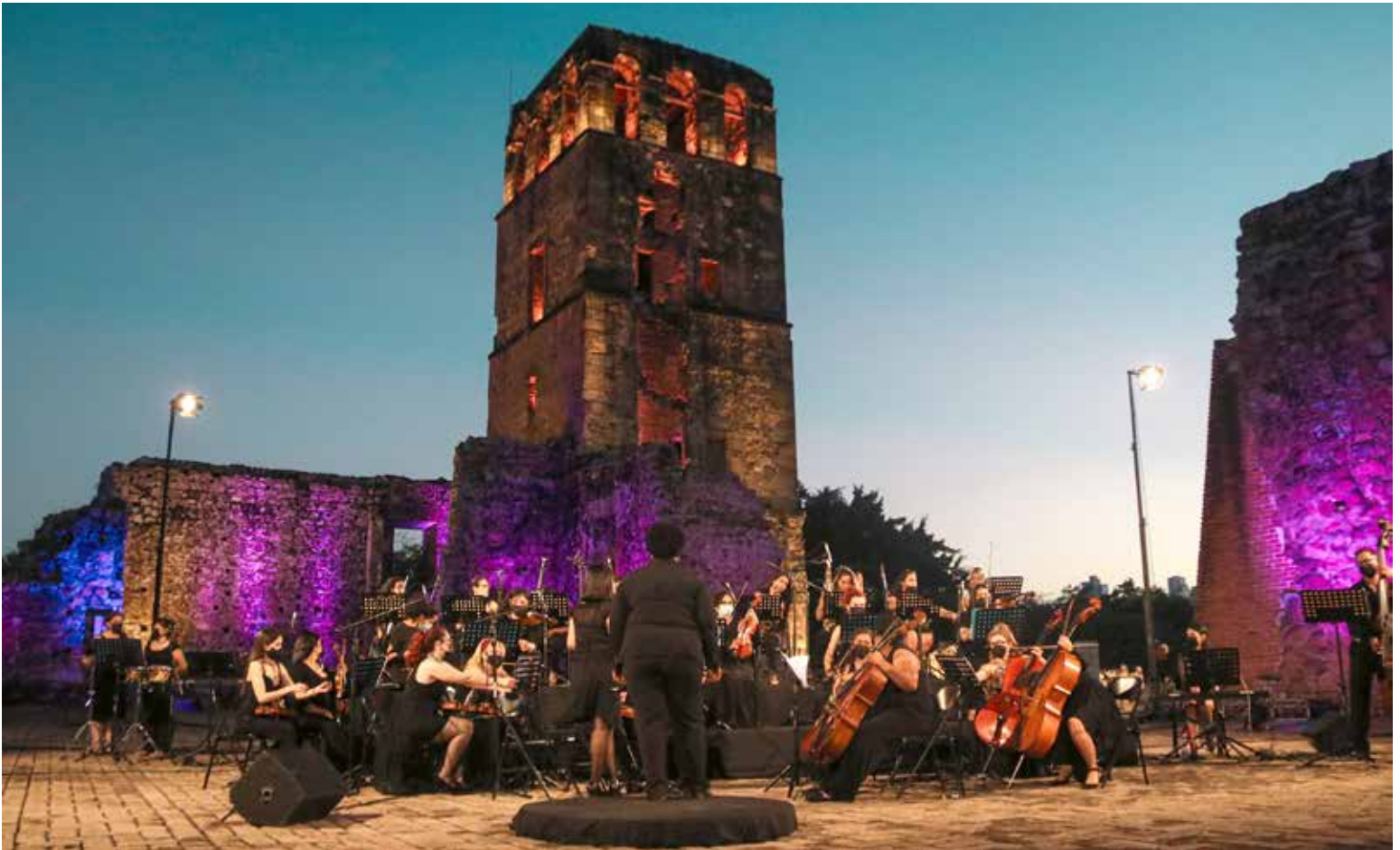
El repertorio de la Orquesta Sinfónica Carmen Cedeño se grabó en el emblemático Conjunto Monumental Histórico de Panamá Viejo.