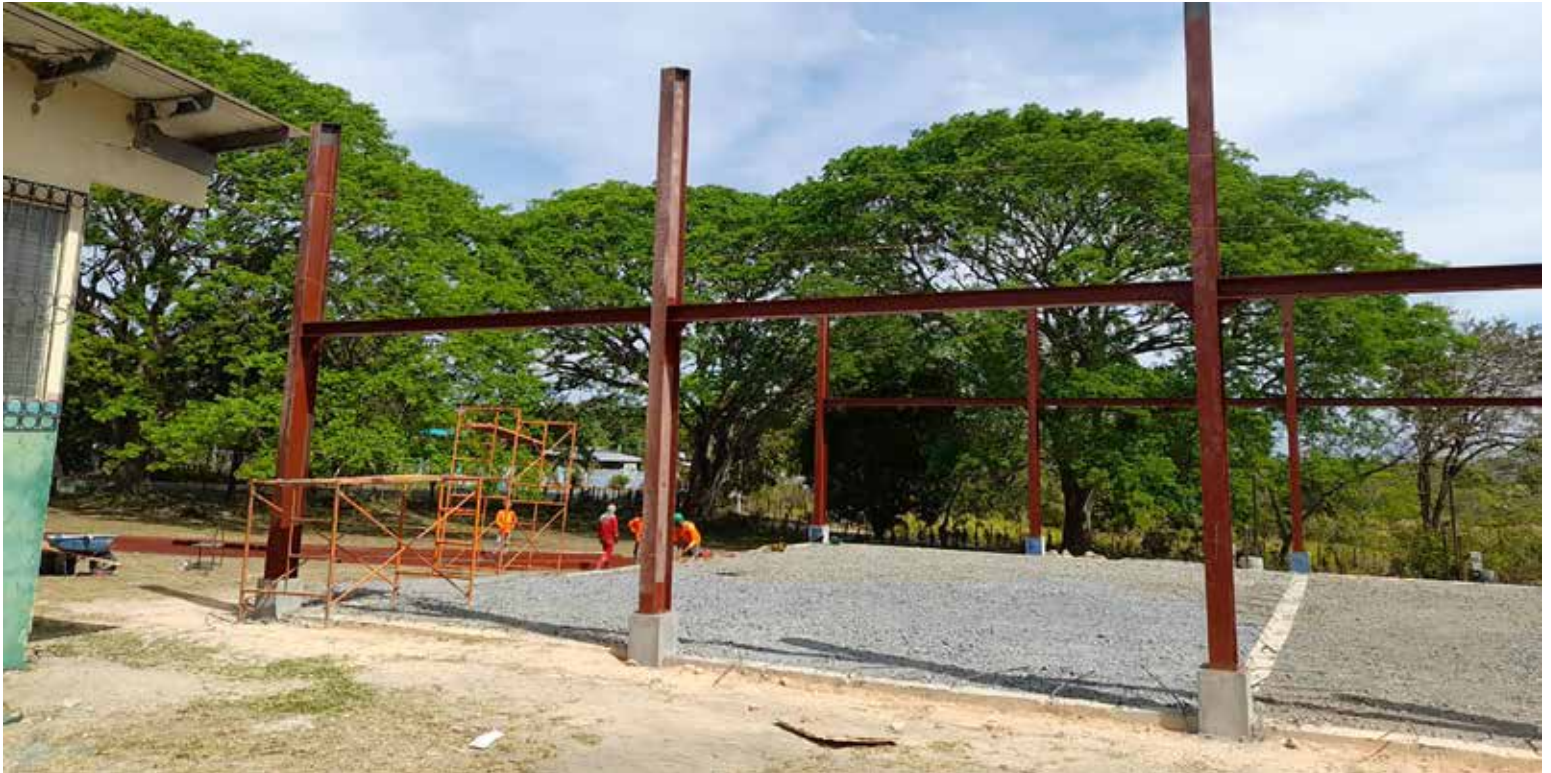
Muestra de los avances de la cancha techada, en el IPHE de Antón.