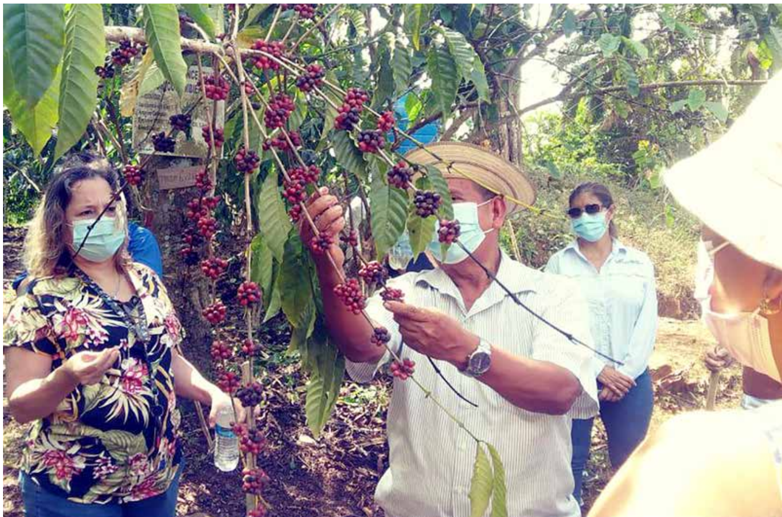
Los visitantes adquieren productos cultivados por lugareños.