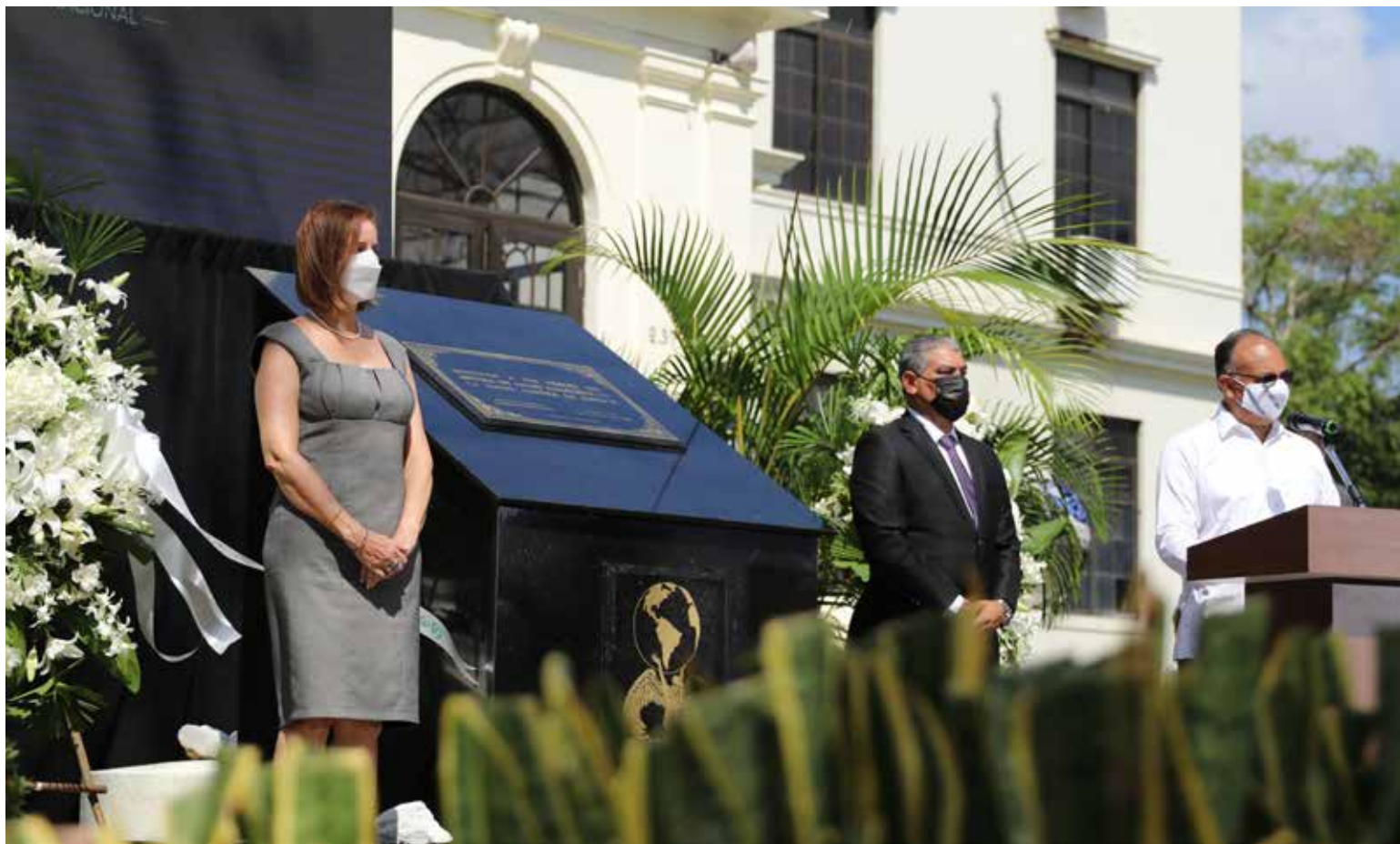
El ministro de Salud, Luis Francisco Sucre, y la primera dama, Yasmín Colón de Cortizo, develaron el monumento "en Honor a la memoria del personal de salud".