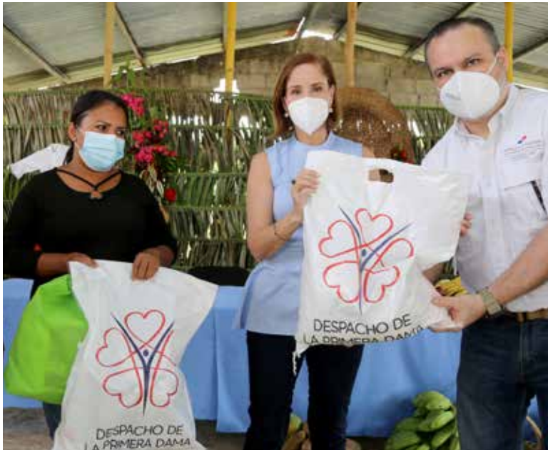
Como parte del compromiso social asumido por el Despacho de la Primera Dama, durante la visita a comunidades de Coclé se repartieron bolsas de alimentos, útiles escolares y artículos de aseo personal.