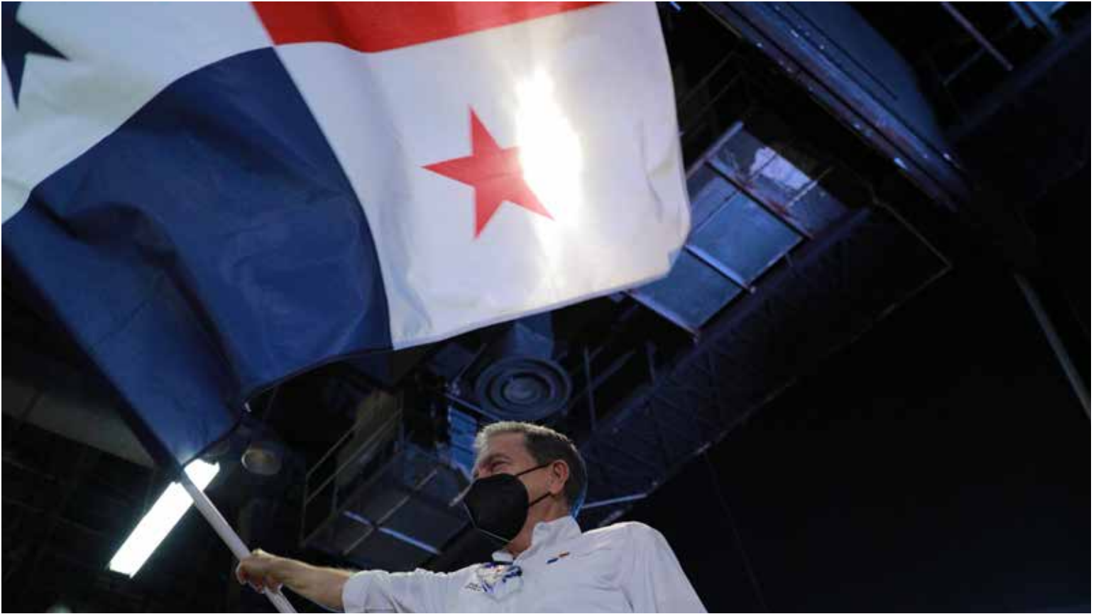
El presidente de la República, Laurentino Cortizo Cohen, saluda a los voluntarios de Plan Panamá Solidario.