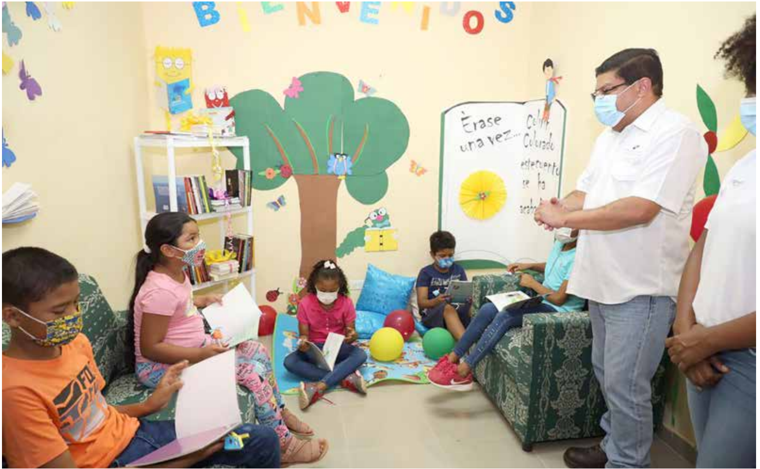
La inauguración del primer Espacio de Lectura en Ollas Arriba de Capira contó con la participación del ministro de Cultura, Carlos Aguilar Navarro.