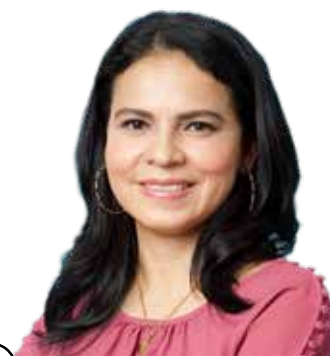
58 CIENTÍFICA A TIEMPO COMPLETO