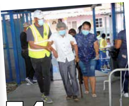
54 SEGUNDAS DOSIS EN EL 8-6