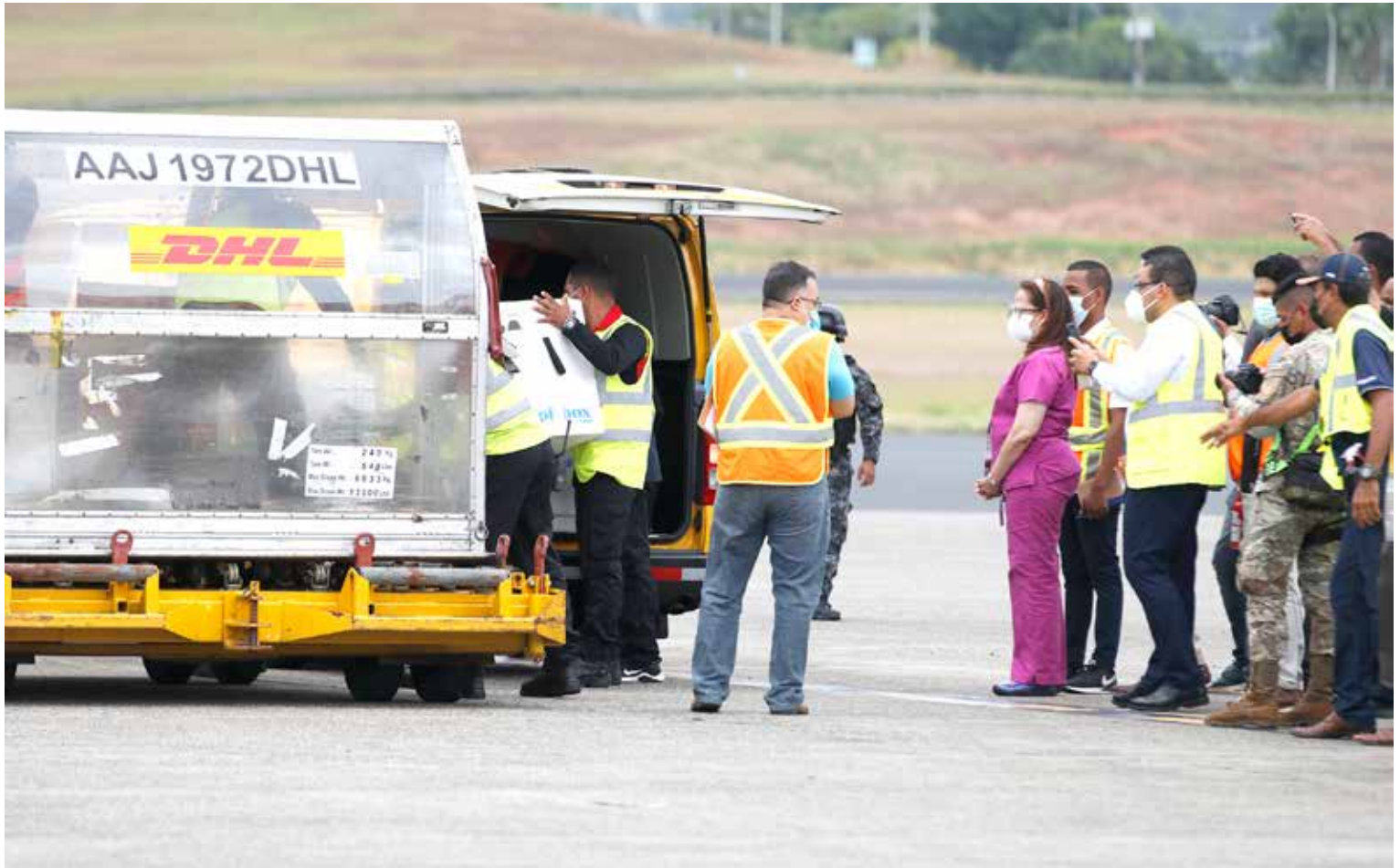
Trabajadores descargan el nuevo lote de vacunas, recibido por la directora general de Salud del Minsa, Nadja Porcell.