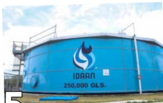
5 AGUA POTABLE PARA ANTÓN