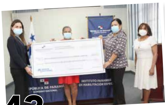
43 PAGAN VIGENCIA EXPIRADA