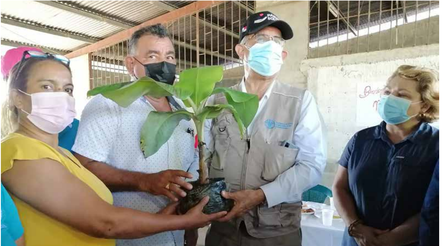
Se prevé entregar unos 60,000 plántones de plátanos a productores de Barú. En la foto, el ministro Valderrama y la secretaria técnica del Gabinete Agropecuario, Blanca Gómez, durante la entrega de las plantas