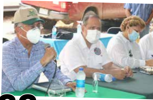
33 BUSCAN PROTEGER CÍTRICOS