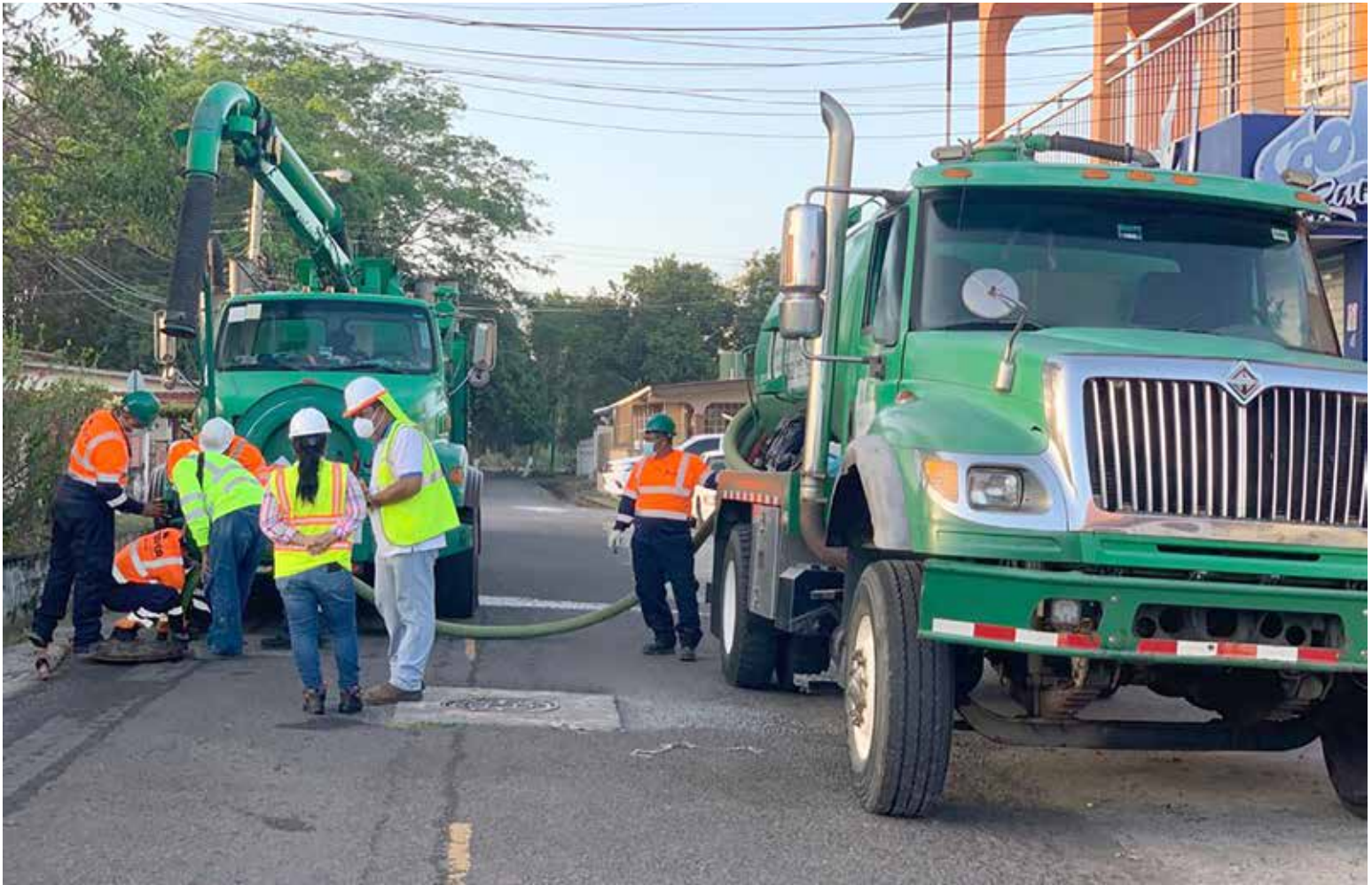
Equipo Técnico culmina los trabajos de limpieza de las redes de alcantarillado sanitario en Panamá Oeste planificados por el Programa Saneamiento de Panamá.