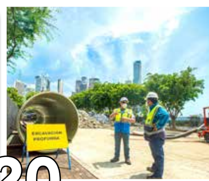
20 AGUA SANEADA, PANAMÁ SALUDABLE