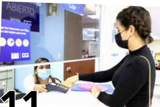
11 EXTIENDEN AMNISTÍA TRIBUTARIA