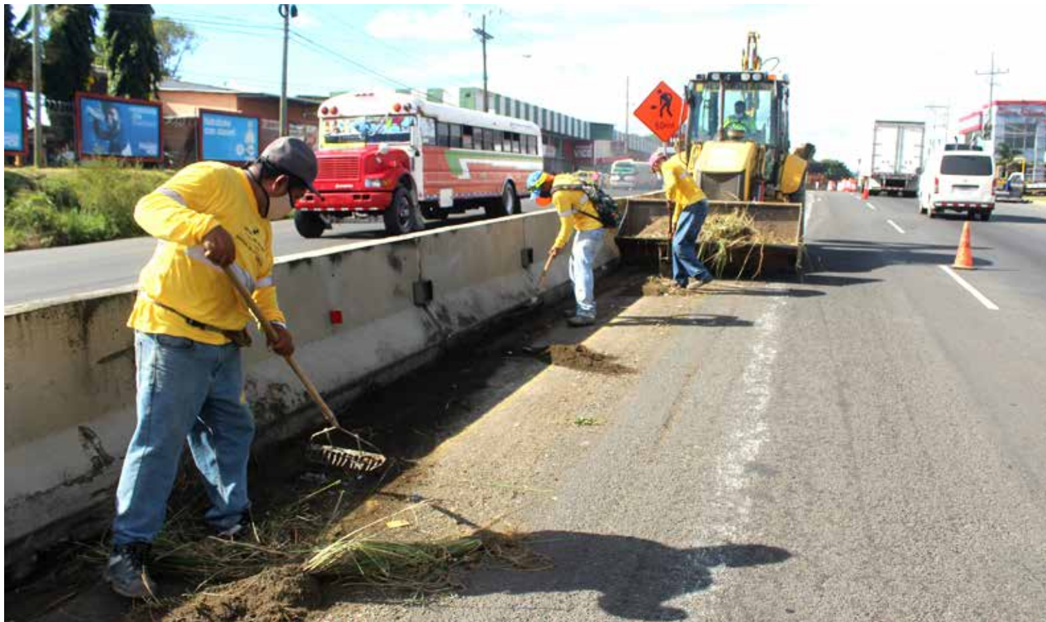
La reparación de la autopista Arraiján-La Chorrera es uno de los 32 proyectos que ha reactivado el MOP.