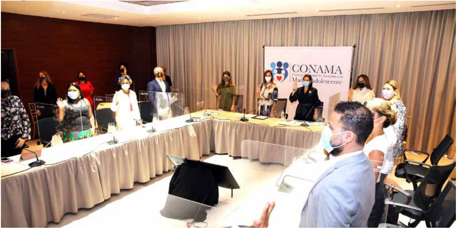
Erika Mouynes, ministra de Relaciones Exteriores; Yasmín Colón de Cortizo, primera dama de la República; y María Inés Castillo, ministra de Desarrollo Social y presidenta del Conama, al momento de la juramentación.