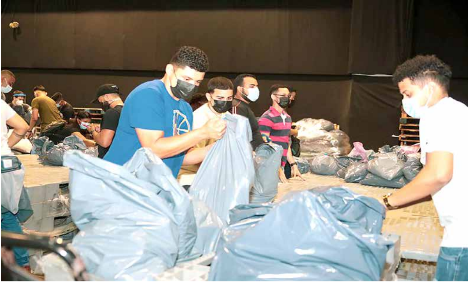
A través del Centro de Voluntariado, el Mides ha captado a estudiantes universitarios y jóvenes de diferentes comunidades.