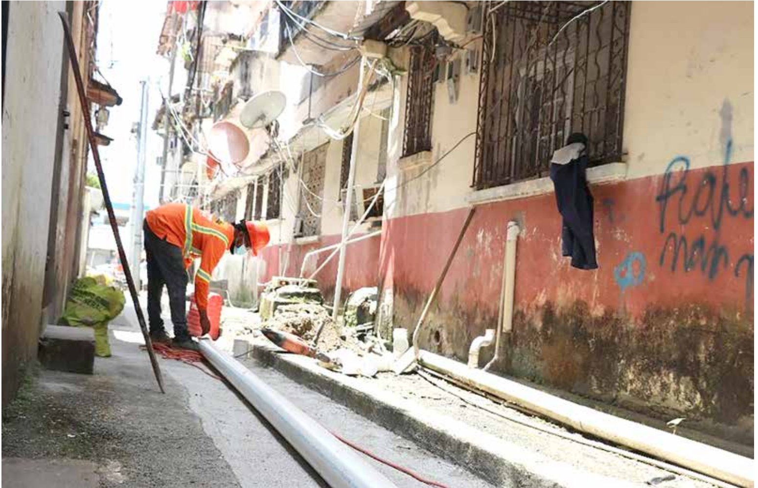
Las autoridades del Miviot realizaron recientemente trabajos de conexión sanitaria en apartamentos en calle 11 de la ciudad de Colón.