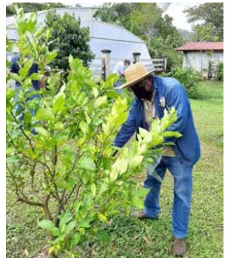
En la reunión se revisaron las acciones inmediatas que se ejecutan para hacerle frente a esta plaga.