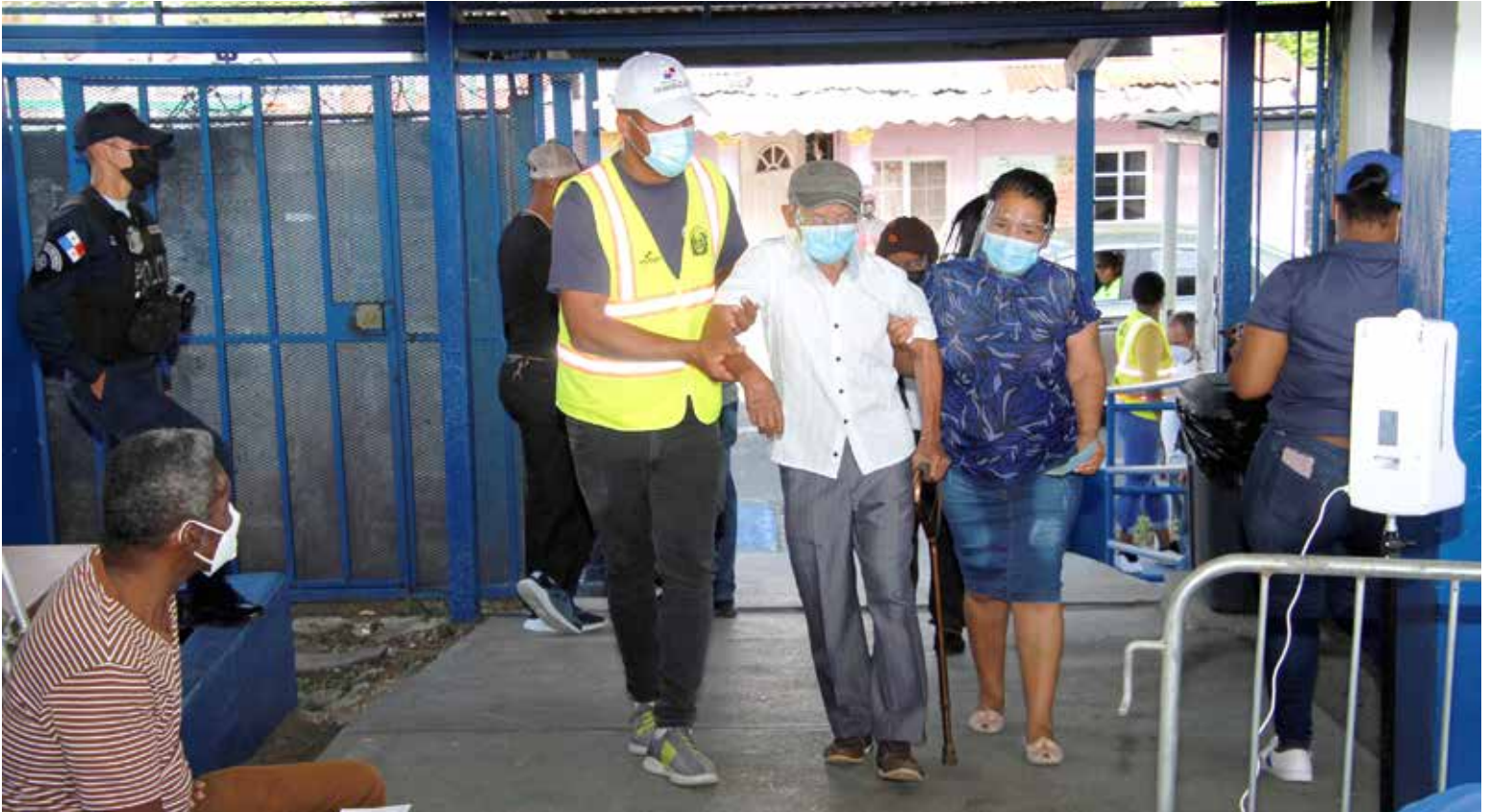
El día de su vacunación, los adultos mayores llegaron acompañados de un familiar.