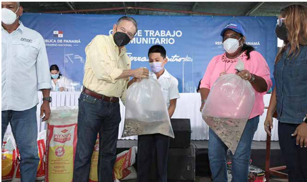
En la comunidad de Tambo, en Penonomé, provincia de Coclé, el presidente de la República, Laurentino Cortizo Cohen entregó ayuda a diversos sectores, entre ellos: el agropecuario, educativo y social.