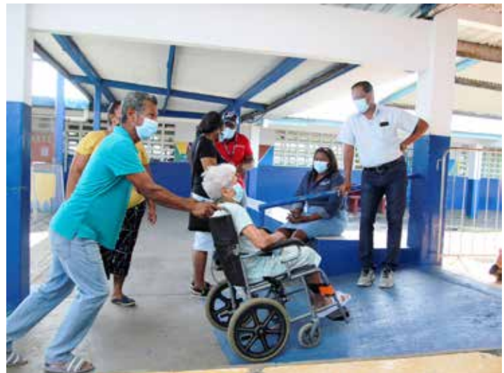
En el centro de vacunación, personal de las juntas comunales brindan orientación a los adultos mayores.

A partir del lunes 5 de abril, se inició la jornada de aplicación de las segundas dosis de vacunas anticovid de la farmacéutica Pfizer a los mayores de 60 años y la primera dosis a docentes que trabajan en el distrito de San Miguelito. Se espera que este proceso culmine en cuatro días y se estará suministrando a la población mayor de 60 años, que ya recibió la primera dosis de la vacuna. El Ministerio de Salud recuerda asistir con su cédula y la tarjeta de vacunación en mano; dependiendo de la hora de su cita, desayunar o almorzar, tomar sus medicamentos y asistir con ropa holgada. En total son 48,925 vacunas que se estarán aplicando, según datos suministrados por la Operación PanaVac-19; de ellos, 2,553 son maestros y profesores del distrito que recibirán la primera dosis.