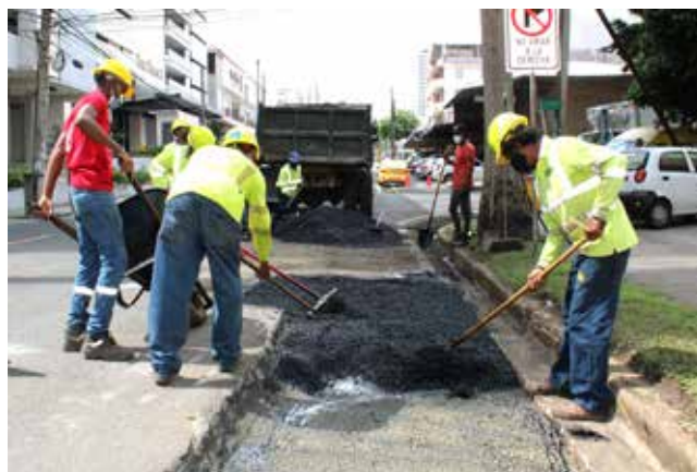
Se realizan también trabajos de rehabilitación en calle 45 Bella Vista, en la ciudad capital.

A fin de incrementar la economía con equidad social, el Gobierno Nacional, a través del Ministerio de Obras Públicas (MOP), impulsa la reactivación de 32 proyectos en las provincias de Panamá y Panamá Oeste, los cuales representan más de 700 kilómetros, por un monto superior a los B/.3,800 millones. La activación económica contribuirá a generar más de 3 mil empleos directos e indirectos a partir del impulso de proyectos tales como la ampliación a seis carriles del Corredor de Las Playas, la rehabilitación de la carretera en el tramo Puente de Las Américas-Arraiján, el Corredor Panamá Norte, la rehabilitación de calles de Alcalde Díaz, Caimitillo, Chilibre, Ernesto Córdoba y en el distrito de La Chorrera, entre otros. Próximamente, el titular del MOP, Rafael Sabonge, estará entregando órdenes de proceder de los proyectos de estudio, diseño, construcción y financiamiento para la rehabilitación y ampliación de la autopista puerto Vacamonte, así como el viaducto que une la Cinta Costera III con la Calzada de Amador.