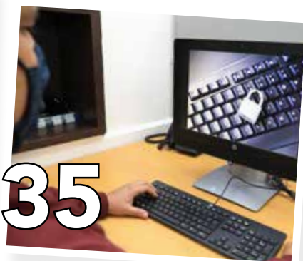
35 LEY DE DATOS PERSONALES