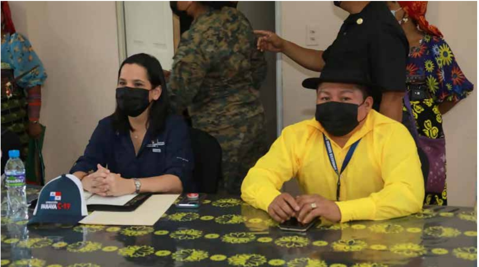
Se acordó una ruta de trabajo a favor de esta comunidad.