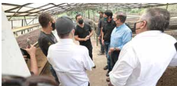
Dentro del Plan Maestro de Turismo 2020-2025, se encuentran las rutas de los Circuitos de Café, cuya finalidad es dar a conocer la experiencia de nuestros agricultores en la producción de este rubro.

extraordinario Patrimonio Verde de la región, sobre todo el Parque Nacional Volcán Barú y el Parque Internacional La Amistad, y 42 fincas que destacan los servicios y productos agroturísticos, así como las diferentes etapas de la siembra y cosecha del grano y la relación de las comunidades ngäbe buglé en torno al Circuito del Café.