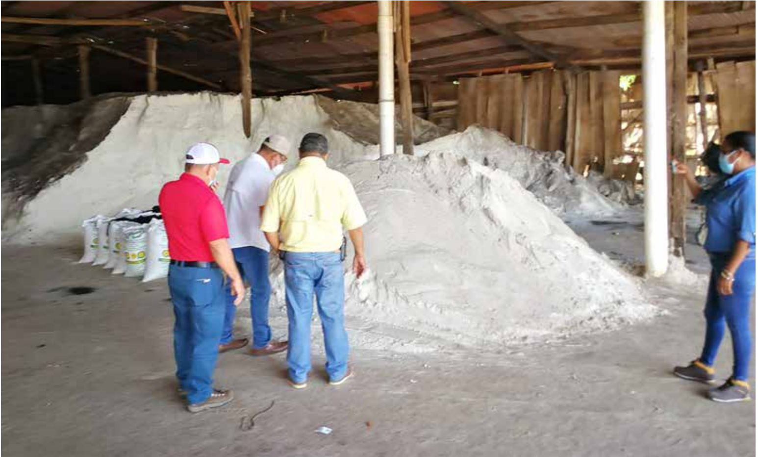
Inicio de la compra de sal cruda a la Cooperativa Salinera Marín Campo por parte del MIDA.