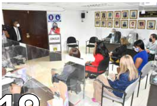
19 SERVICIOS BÁSICOS EN ÁREAS VULNERABLES