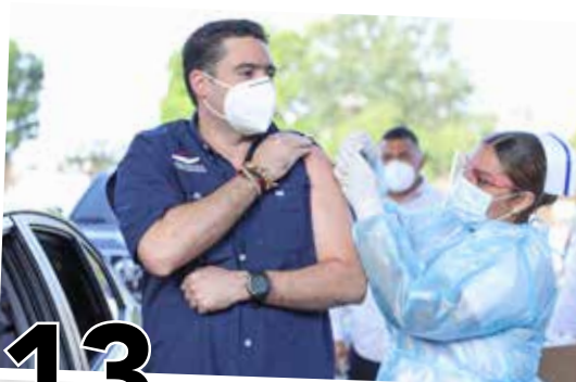
13 VACUNACIÓN CON AZTRAZENECA