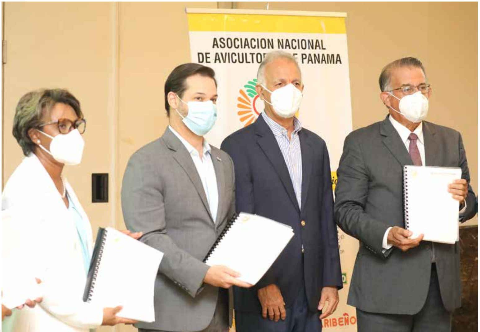
Autoridades de Gobierno sostienen reunión con Anavip.