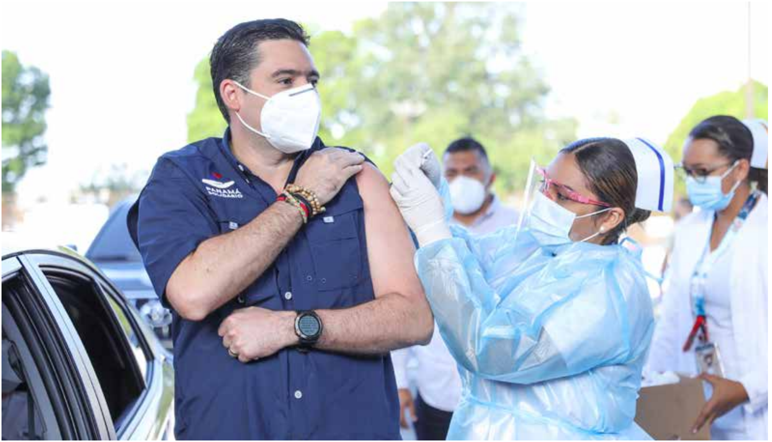
El vicepresidente de la República, José Gabriel Carrizo Jaén, el primer voluntario en recibir la vacuna de AstraZeneca en el país, exhortó a los panameños a colocársela, y reiteró que es efectiva y segura.