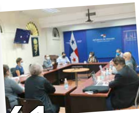
61 CERTIFICADO DE VACUNACIÓN COVID