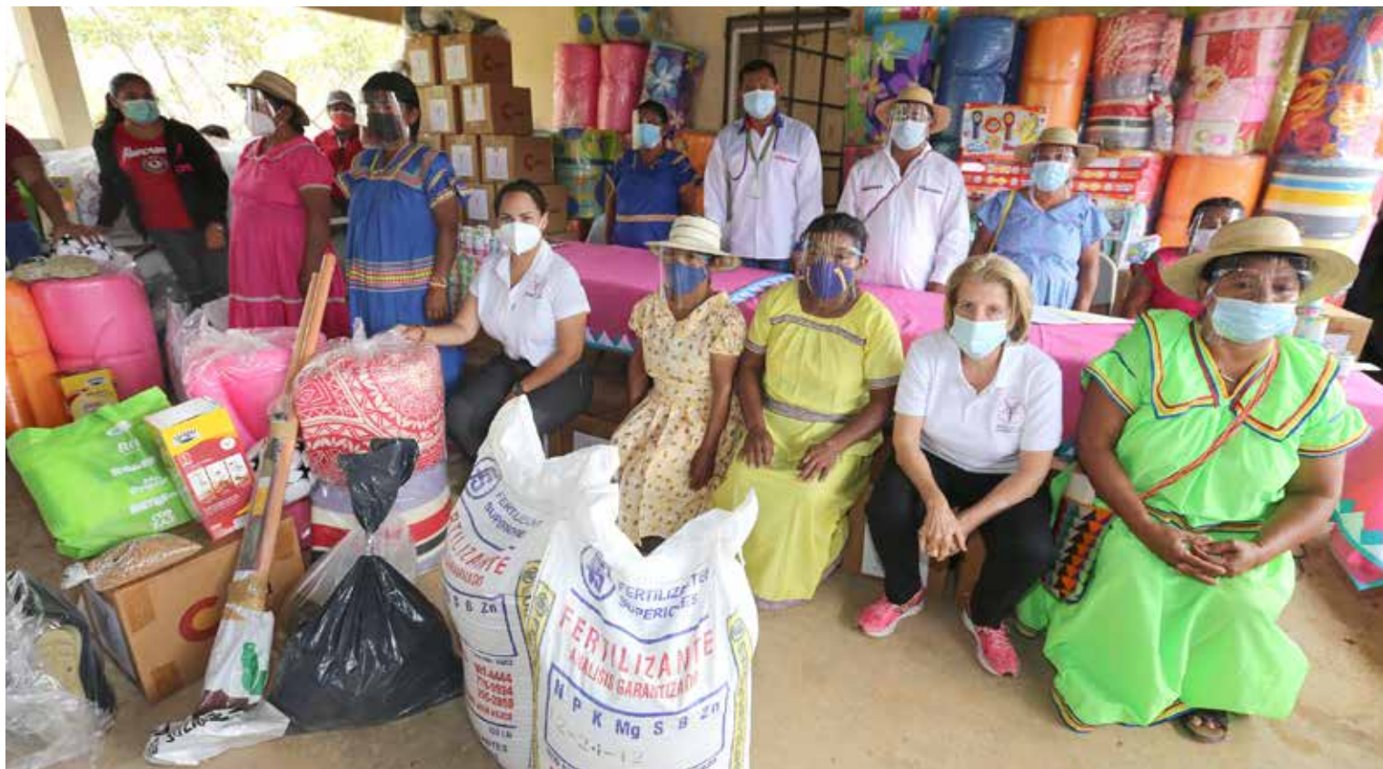
El equipo del Despacho de la Primera Dama entregó máquinas de moler granos, bolsas de alimentos, pañales desechables, leche fortificada, útiles escolares, colchonetas, cajas con utensilios de cocina, botas de hule, ropa para infantes, calzados, libros de cuentos, balones de fútbol y juguetes.