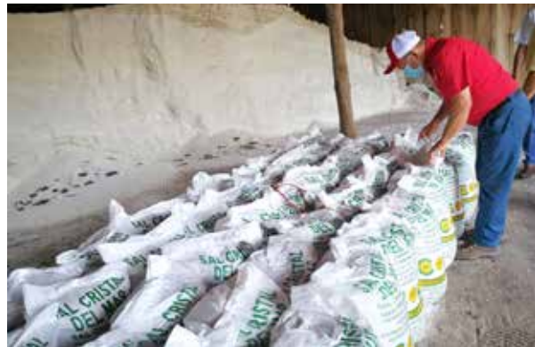
La sal cruda será para apoyar a pequeños ganaderos a través del Plan Sequía.

este año iniciaron la zafra tarde porque las bodegas están llenas a raíz de la pandemia, porque solo están vendiendo un 40 % de la producción.