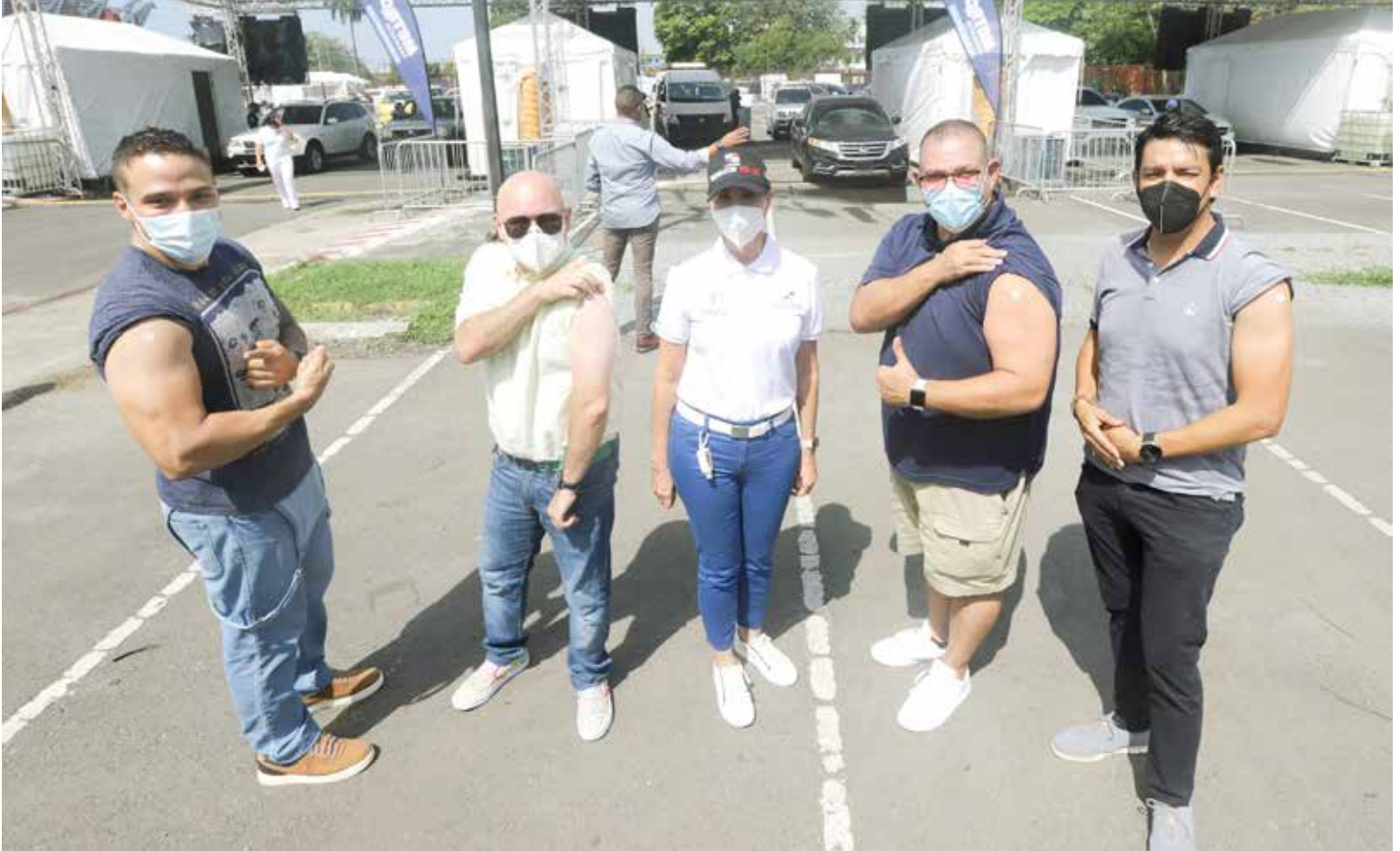
La primera Dama, Yasmín Colón de Cortizo, junto a presentadores de televisión que acudieron de forma voluntaria a recibir la primera dosis de la vacuna contra la Covid-19