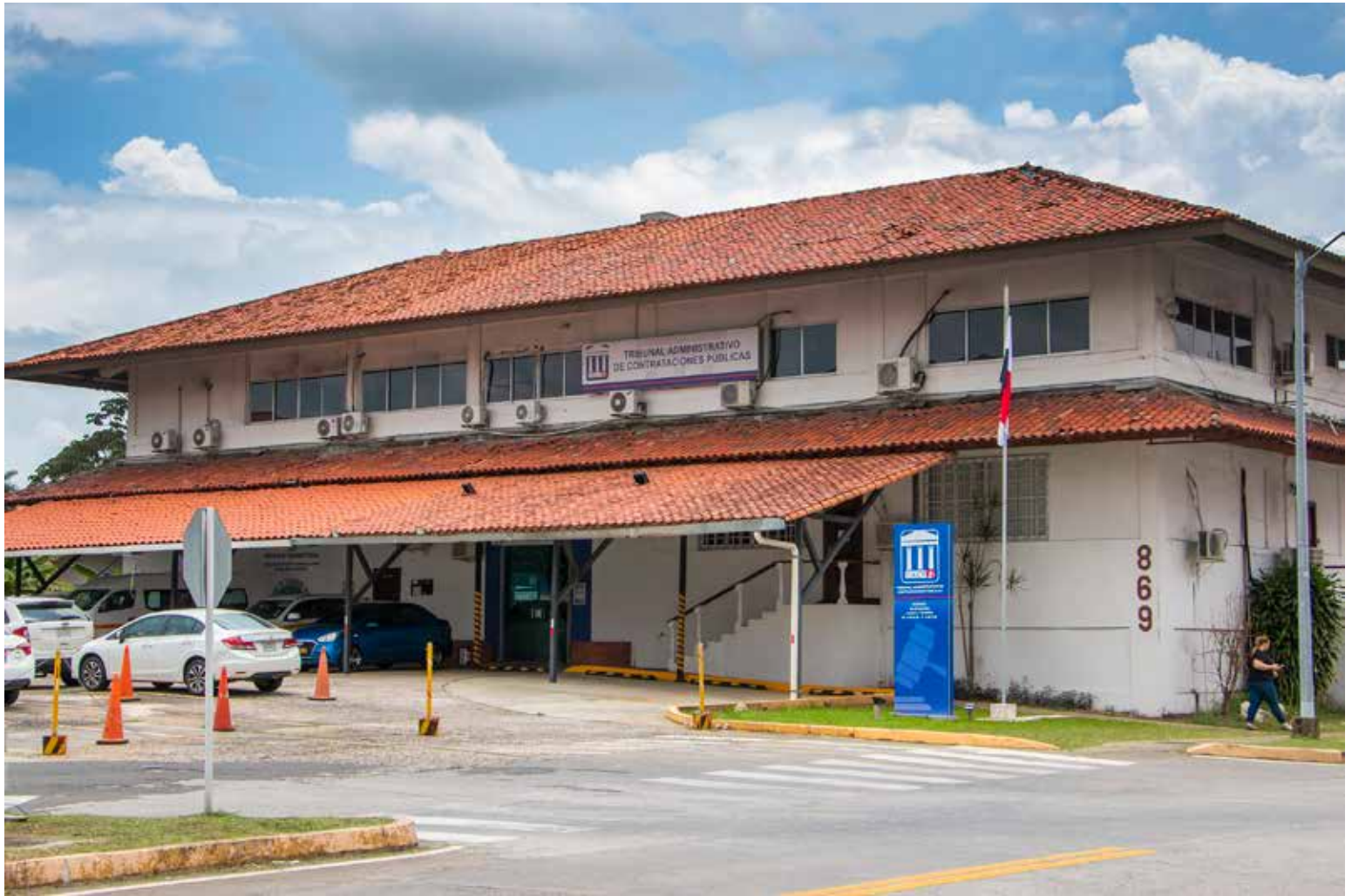
El presidente de la República, Laurentino Cortizo Cohen, designa magistrados principales del Tribunal Administrativo de Contrataciones Públicas.