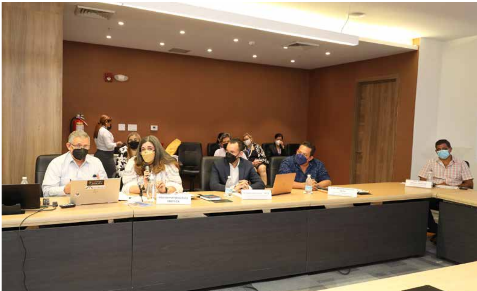
Autoridades de Cultura, Salud y Trabajo, junto a representantes de gremios artísticos.