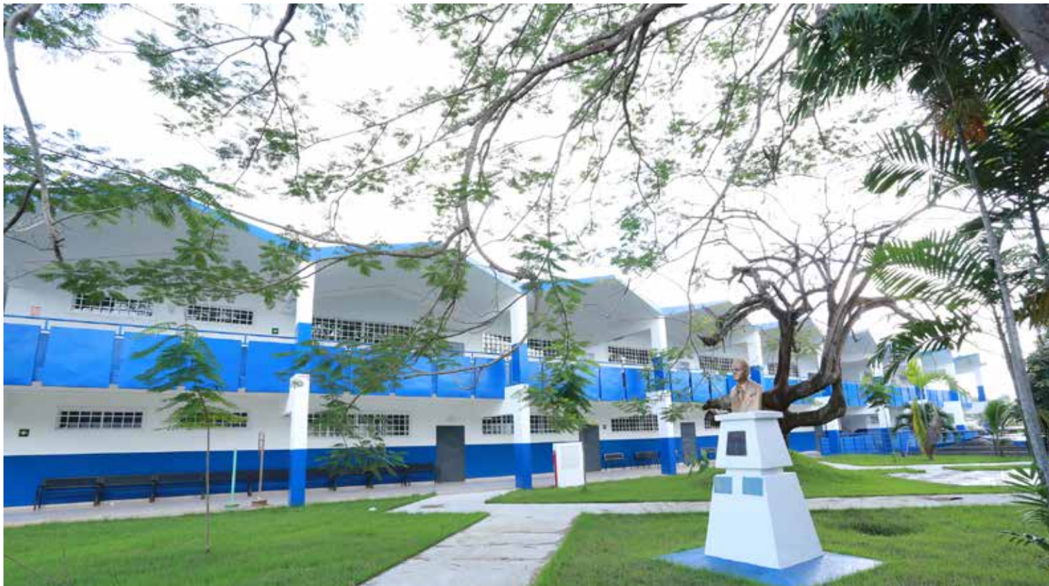
El Instituto Fermín Naudeau fue uno de los centros educativos rehabilitados en este programa del Meduca.