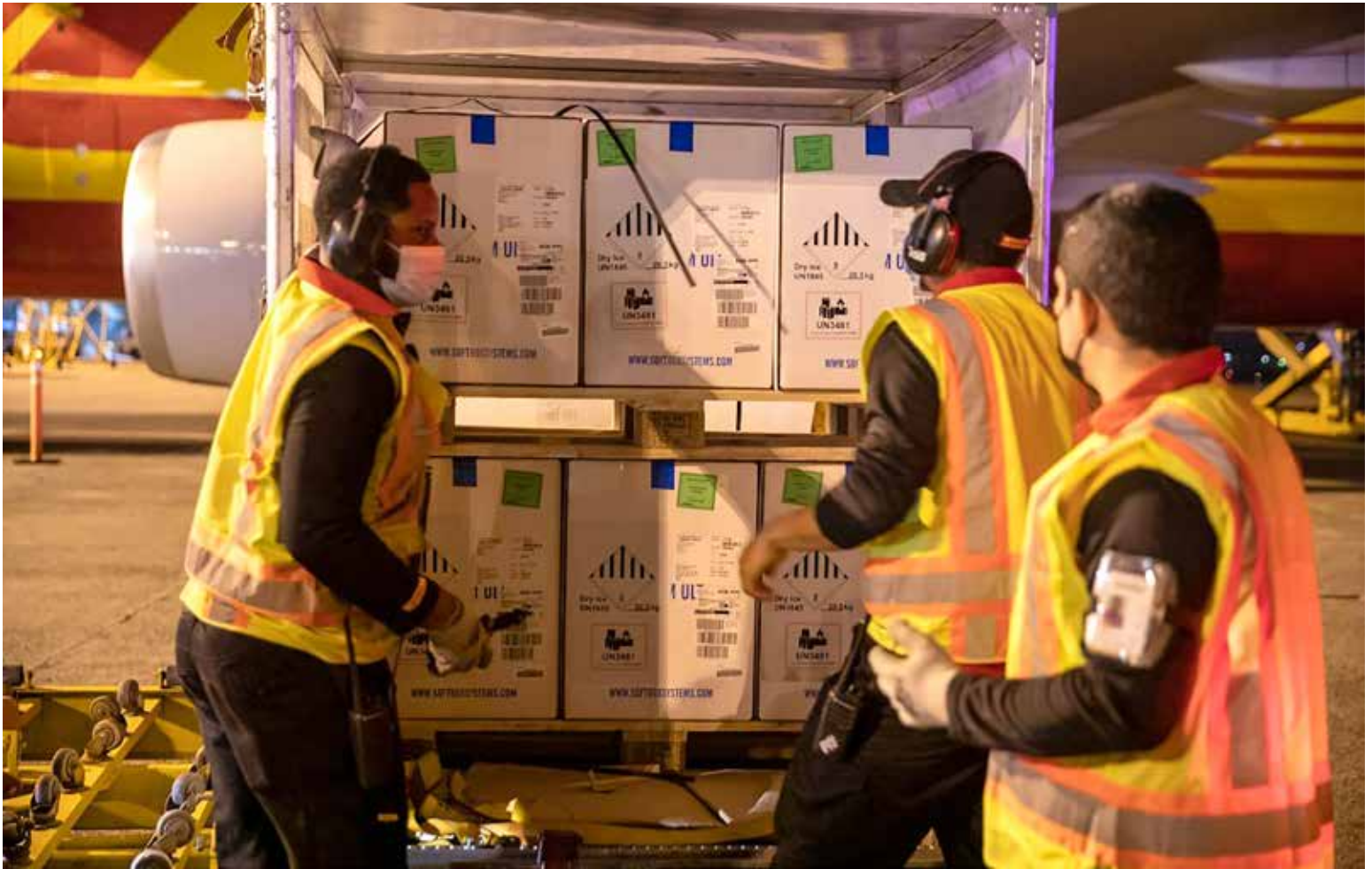
La madrugada de este miércoles llegó el undécimo lote de vacunas de la empresa farmacéutica Pfizer al Aeropuerto Internacional de Tocumen.