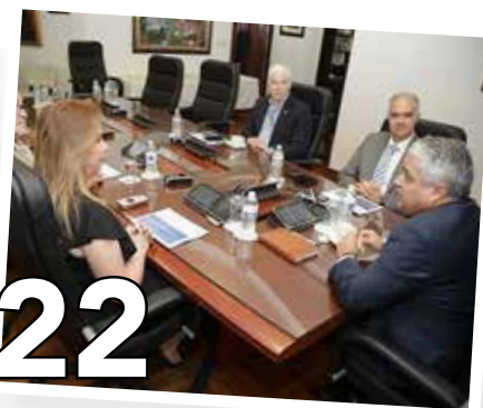
22 'UNIDOS, LOS PANAMEÑOS SALDREMOS ADELANTE'