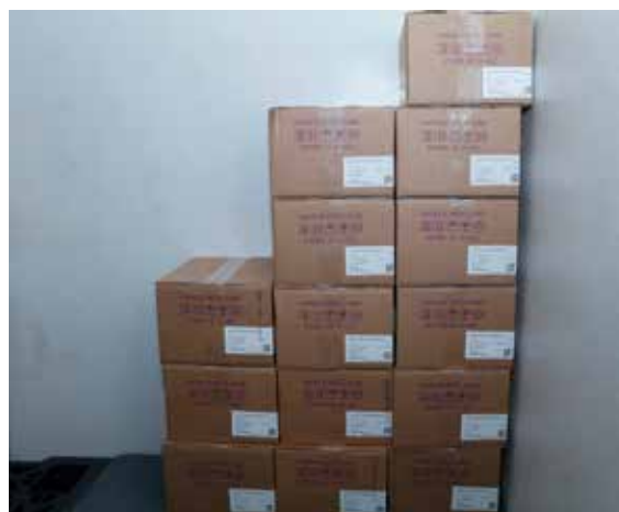
Panamá recibió 36 mil dosis de la vacuna AstraZeneca.

A partir del 20 de abril se habilitaron todas las plataformas para que los interesados se puedan inscribir y solicitar las dosis de la vacuna AstraZeneca, de manera voluntaria. En este sentido, todas las personas mayores de 30 años (varones) y mayores de 50 años (mujeres) podrán inscribirse en raisa.minsa.gob.pa , a través de la línea 177 y en vacunaspanamasolidario.gob.pa para aplicarse las dosis de la casa farmacéutica AstraZeneca. El ministro de Salud, Luis Francisco Sucre, detalló que la vacuna AstraZeneca es bien tolerada y protege contra la Covid-19, incluida la enfermedad grave y hospitalización; cuenta con el 76% de eficacia para prevenir Covid-19 sintomático y 85% de eficacia en personas de 65 años o más. Además, indicó que el Consejo de Monitoreo de Datos de Seguridad, ente encargado de la supervisión de las vacunas, no identificó problemas de seguridad relacionados con la vacuna. Panamá recibió el pasado viernes el primer lote de 36,000 dosis de la vacuna AstraZeneca y se evalúa llevarlo a nivel nacional para una mayor cobertura a través de la vacuna exprés.