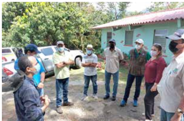
El comité técnico visitó las fincas positivas en Coclé.

Regional de Sanidad Agropecuaria (Oirsa) y del Organismo de las Naciones Unidas para la Agricultura y la Alimentación (FAO) y técnicos de las Direcciones de Agricultura y Sanidad Vegetal del Ministerio de Desarrollo Agropecuario (MIDA). El HLB es una devastadora enfermedad causada por una bacteria que provoca la muerte de los cítricos.