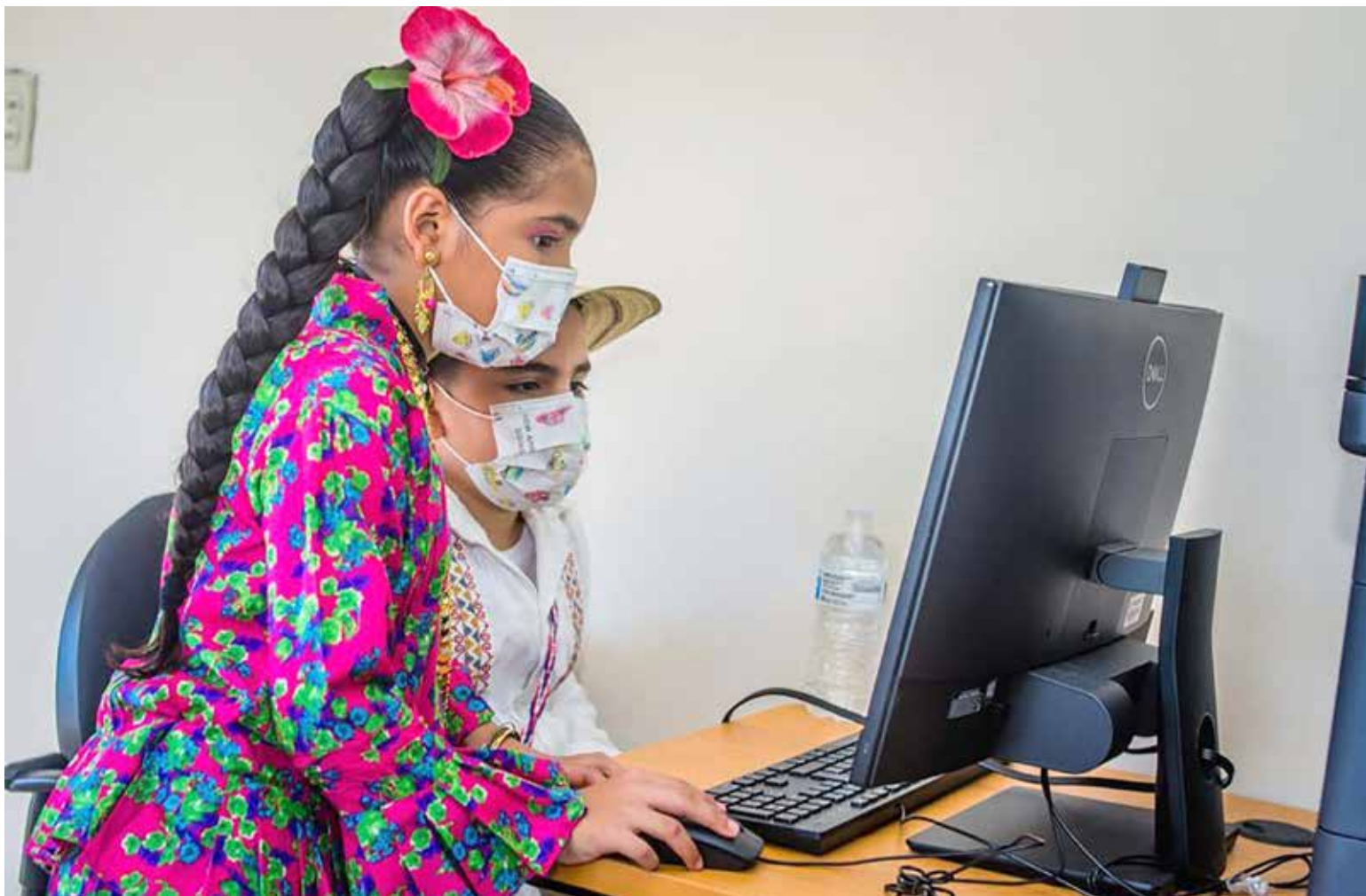
Las Infoplazas conectan las comunidades con la era digital.