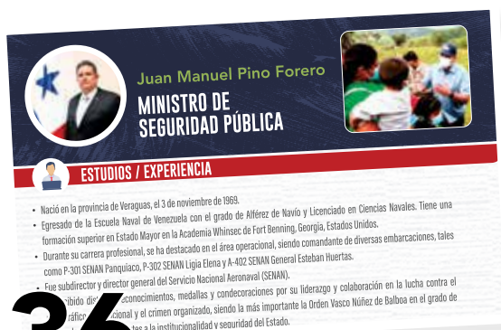
36 LOGROS MINISTERIO DE SEGURIDAD PÚBLICA