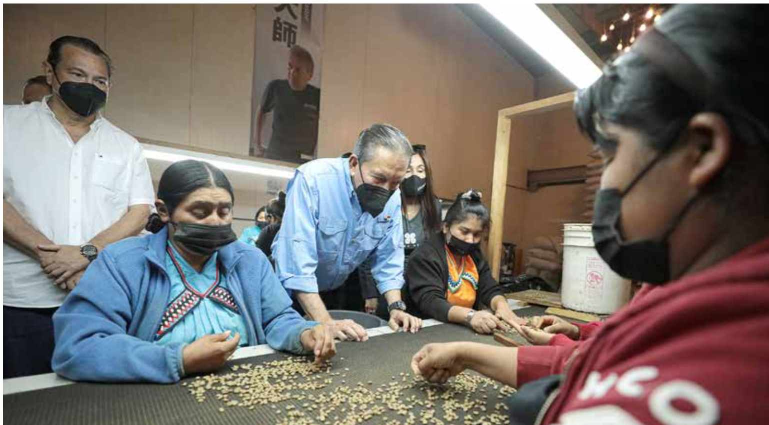
Un recorrido por la finca Elida Estate Coffee realizó el presidente, Laurentino Cortizo Cohen, durante su gira por la provincia de Chiriquí.