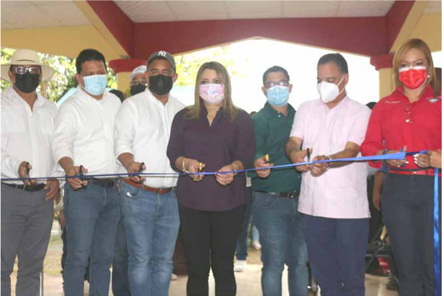
Pobladores de Herrera reforzarán sus habilidades técnicas en el Centro Comunitario Integral.