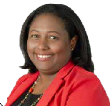
63 FORMADORA DEL TALENTO JUVENIL