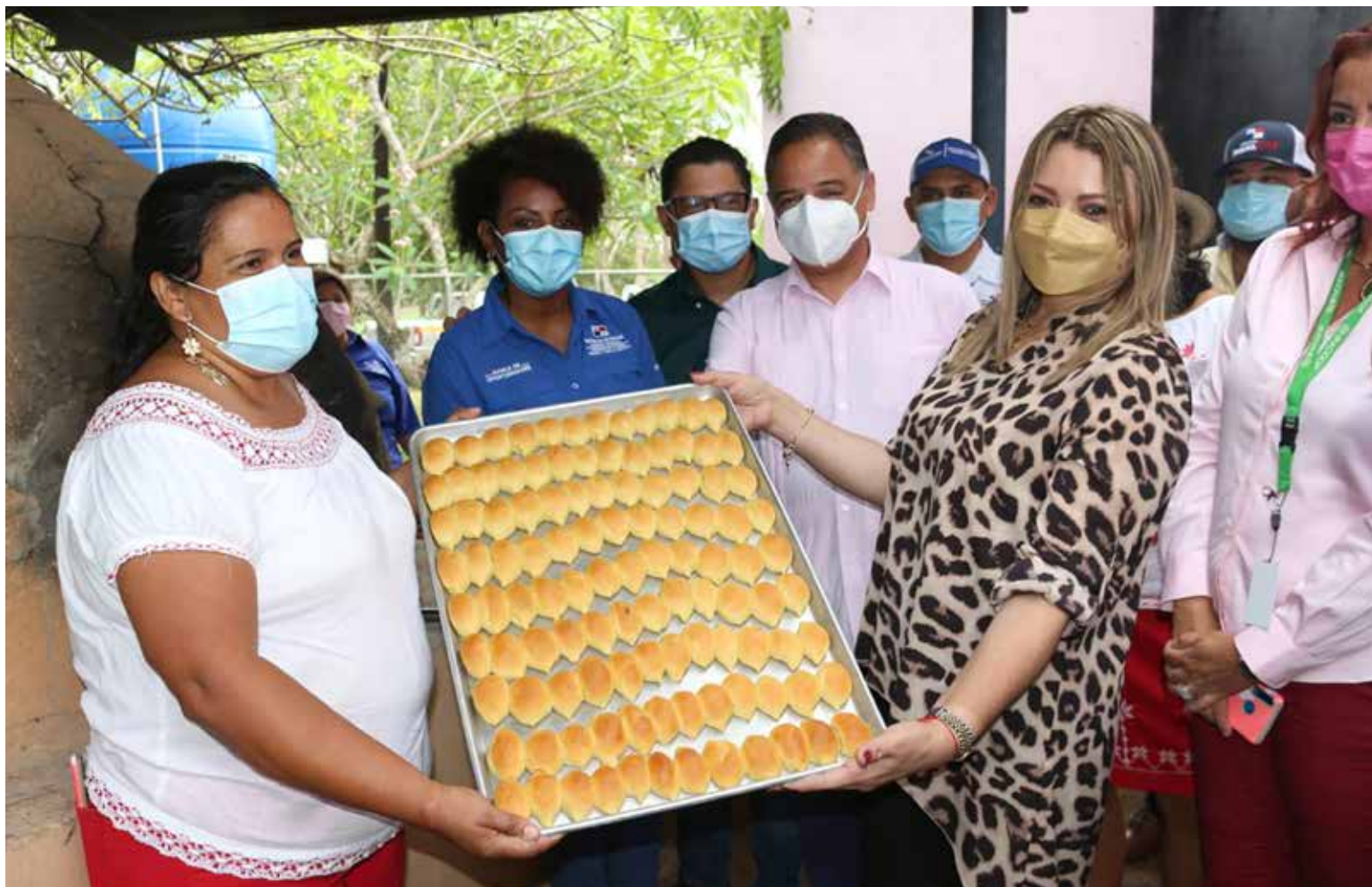
Moradores de Menchaca, en Océ, ingresan al Eje Cambiando Vidas.