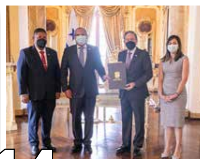
14 INSTITUTO DE METEOROLOGÍA