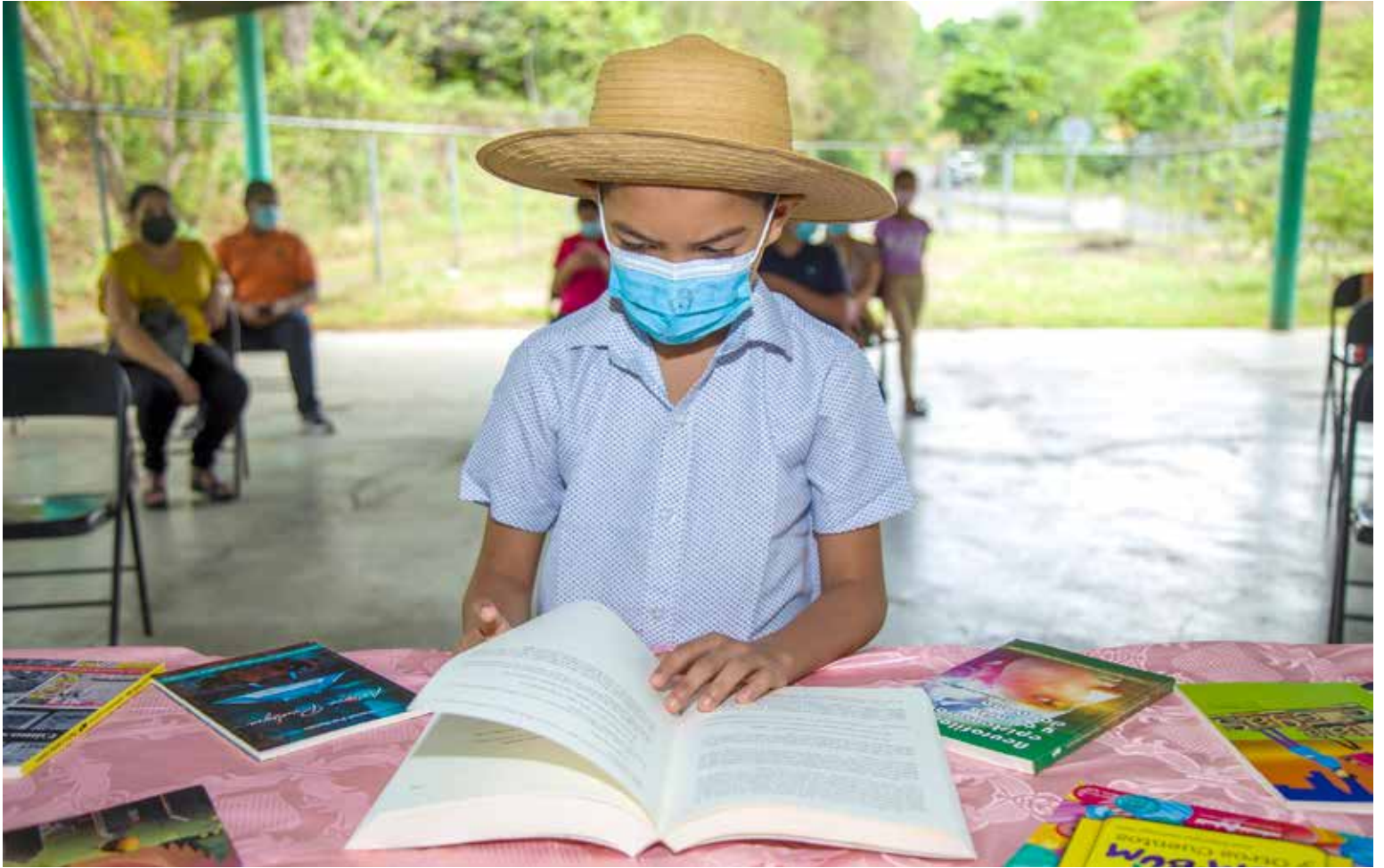
Los Espacios de Lectura se promueven a través de animadores culturales en cada junta comunal.