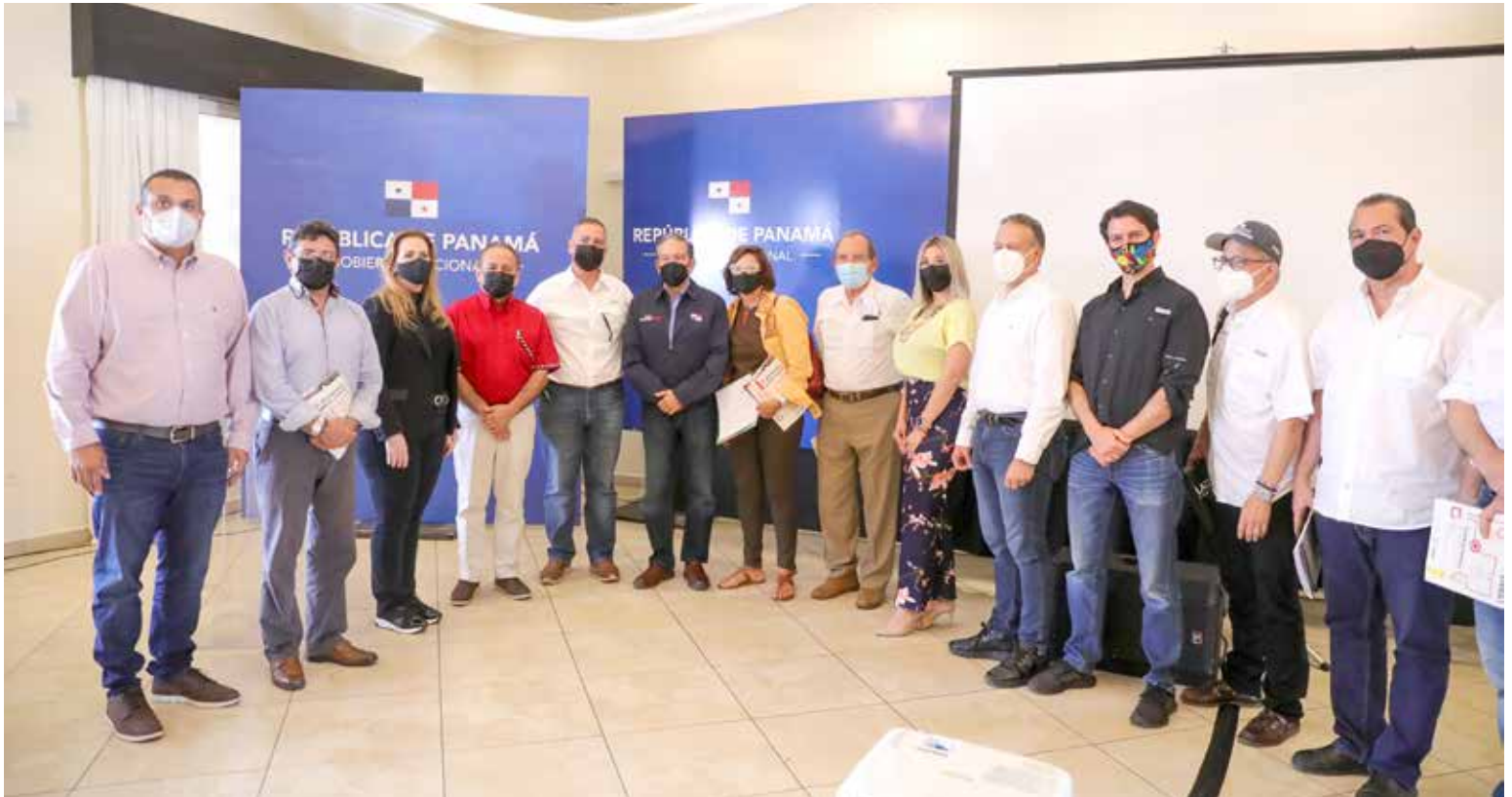
El presidente Laurentino Cortizo Cohen se reunió con miembros del Centro de Competitividad de la Región Occidental de Panamá (CECOMRO), para conocer la propuesta que elaboraron para la reactivación económica de la provincia de Chiriquí.