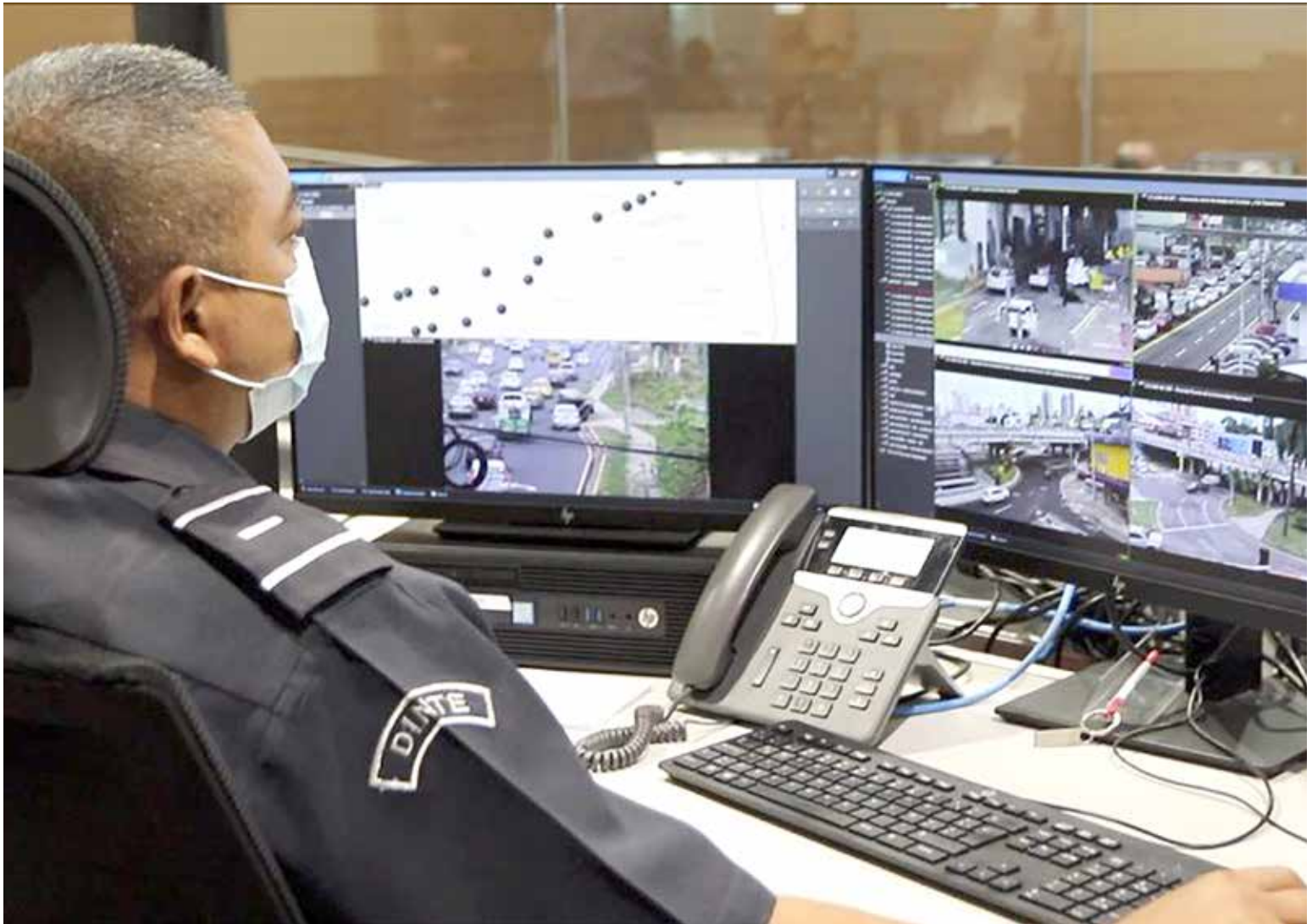
Monitoreo de las cámaras de videovigilancia y recepción de llamadas en el Centro de Operación Nacional del Ministerio de Seguridad Pública.