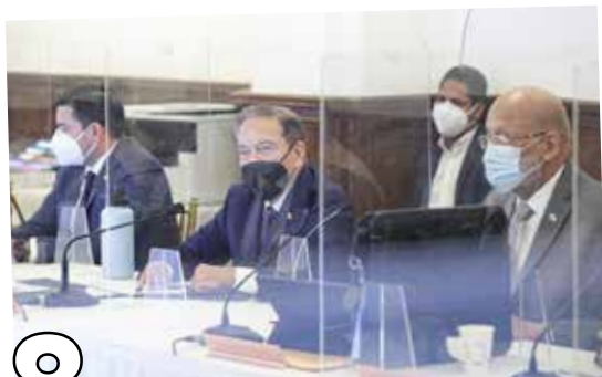
8 COMISIÓN DE ALTO NIVEL