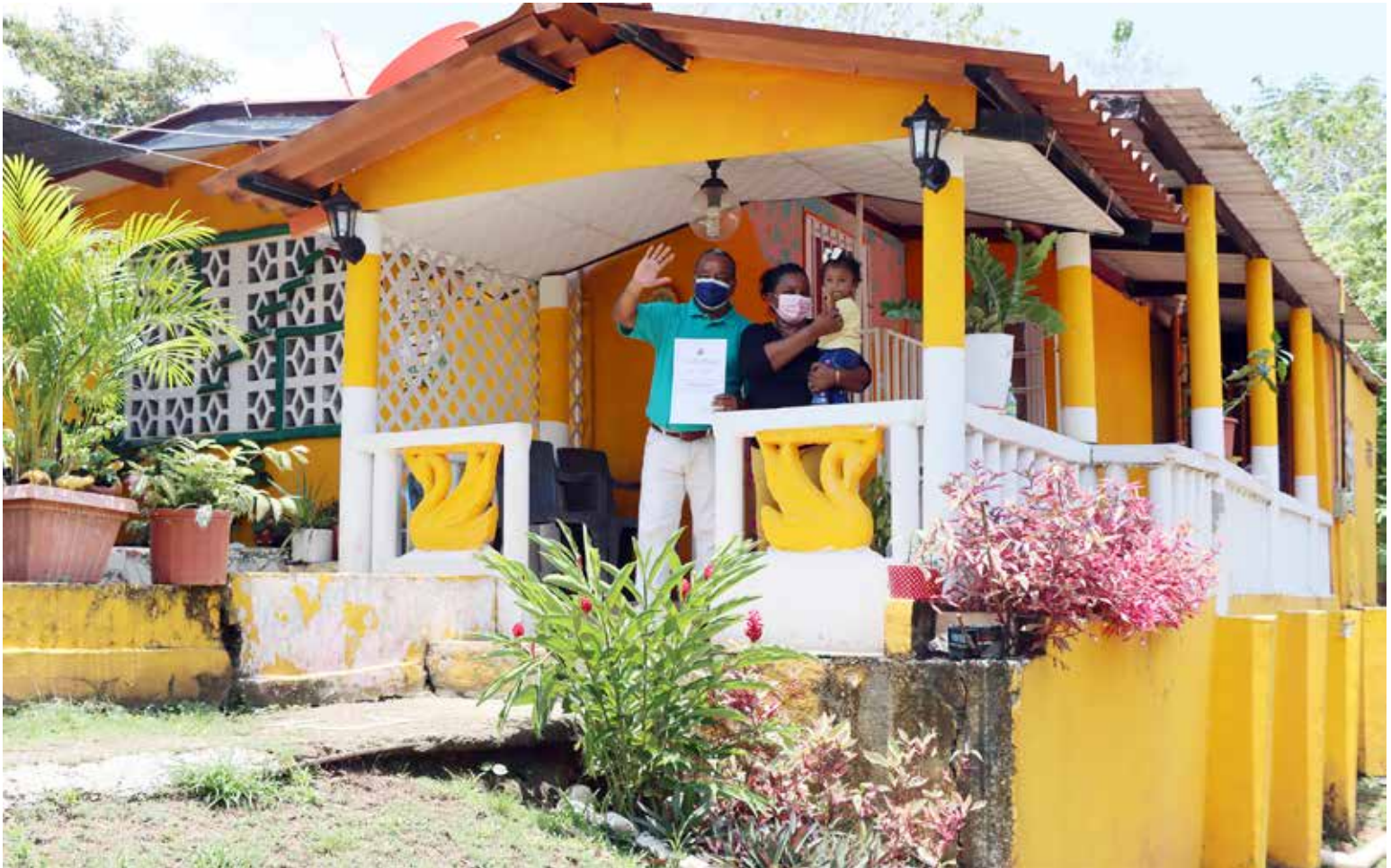
La familia Otton inicia una nueva etapa de vida luego de recibir las escrituras de su casa.