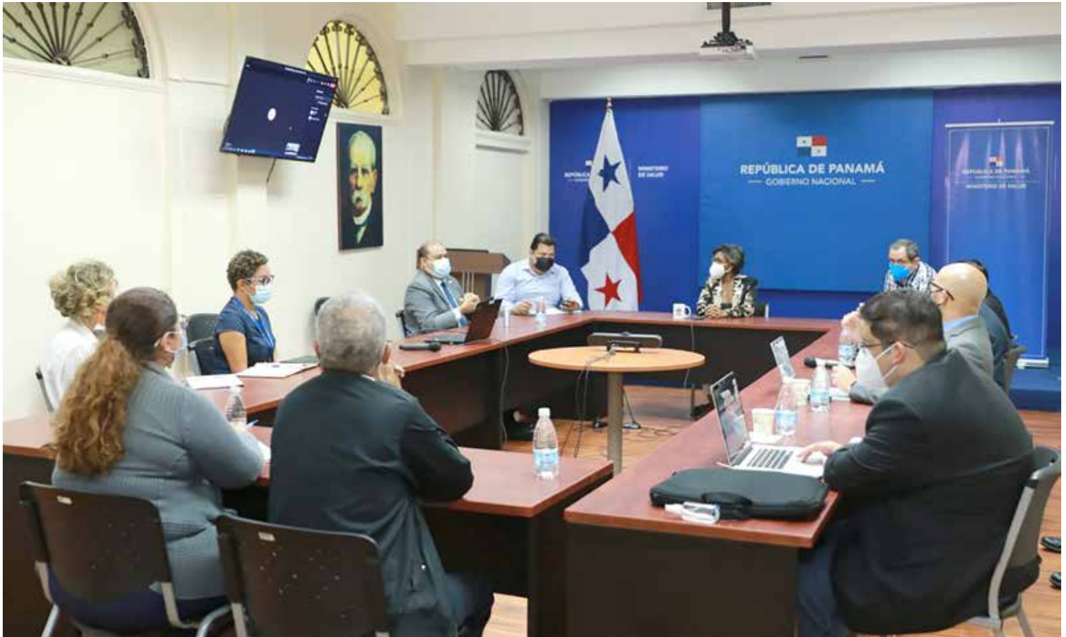
La mesa interinstitucional se reúne para avanzar con los lineamientos del certificado inmunitario.