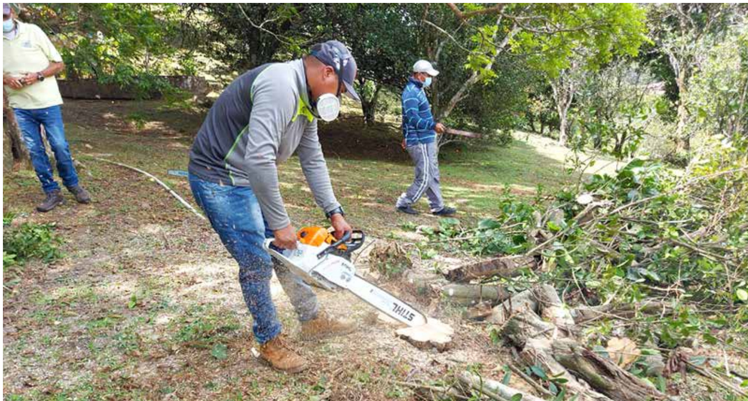
Una de las primeras acciones para erradicar el foco es la eliminación de las plantas sintomáticas.