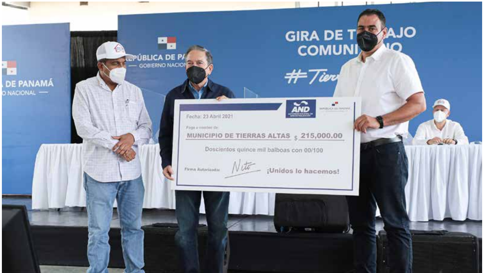
Durante el acto de CON Escuelas, el mandatario Laurentino Cortizo Cohen entregó un aporte al Municipio de Tierras Altas por B/.215 mil para la compra de equipo para atender daños causados por los huracanes Eta e Iota, el año pasado, en este el distrito.