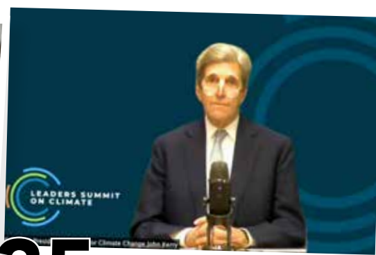
35 COMPROMISO AMBIENTAL