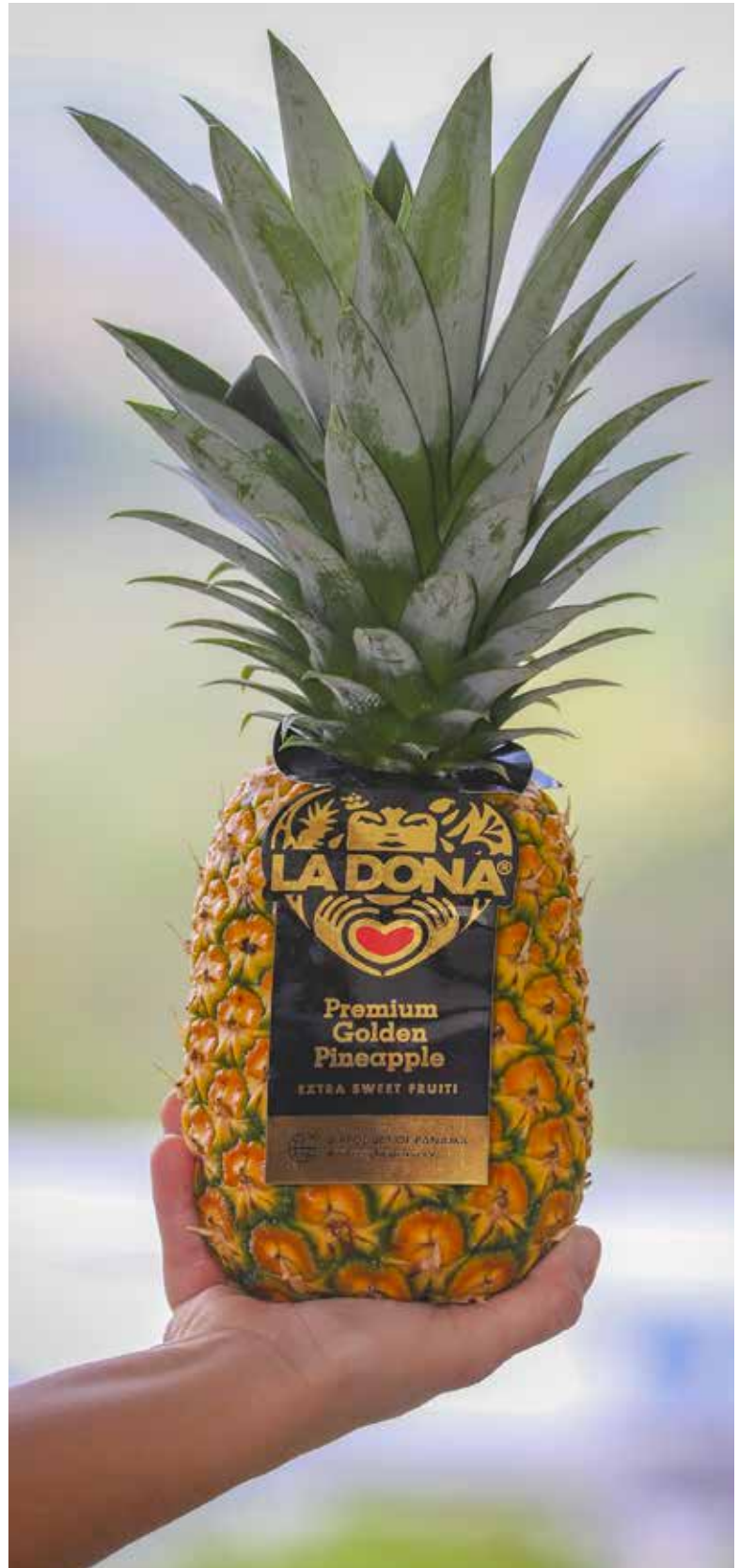
Las normas Codex son clave para el impulso de las exportaciones.

Más de cien participantes, entre representantes del sector empresarial, académicos y autoridades de la Dirección Nacional de Promoción de las Exportaciones y la Dirección General de Normas y Tecnología Industrial, del Ministerio de Comercio e Industrias (MICI), se dieron cita en la conferencia “Importancia del Codex Alimentarius en el proceso exportador”. El evento virtual, organizado por el MICI en alianza con la Asociación Panameña de Exportadores (APEX) y la Cámara de Comercio de Chiriquí (Camchi), destacó la aplicación de códigos, normas y directrices Codex, los cuales poseen una base científica sólida proporcionada por organismos internacionales independientes de evaluación de riesgos o consultas especiales organizadas por la Organización de las Naciones Unidas para la Alimentación y la Agricultura (FAO) y la Organización Mundial de la Salud (OMS). Panamá ha adoptado normas CODEX Alimentarius desde 1987.