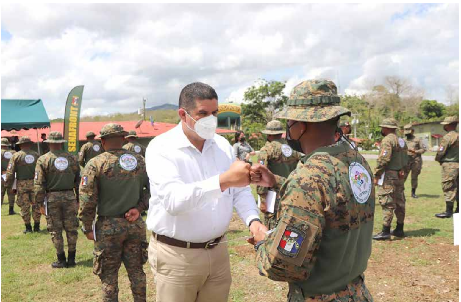
El ministro de Seguridad Pública, Juan Pino, participó en la graduación de las Unidades del Senafront que formarán parte de la Unidad de Seguridad Fronteriza Humanitaria (USFROH).