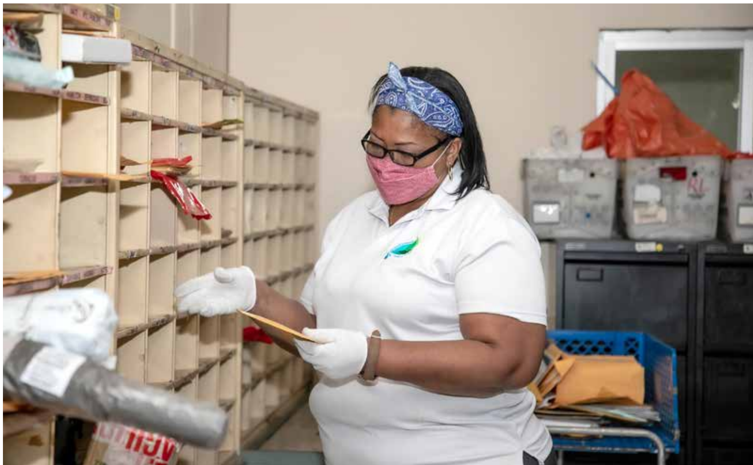
Uno de los servicios que tuvo mayor demanda en el primer trimestre de 2021 fue el envío de paquetería nacional e internacional.