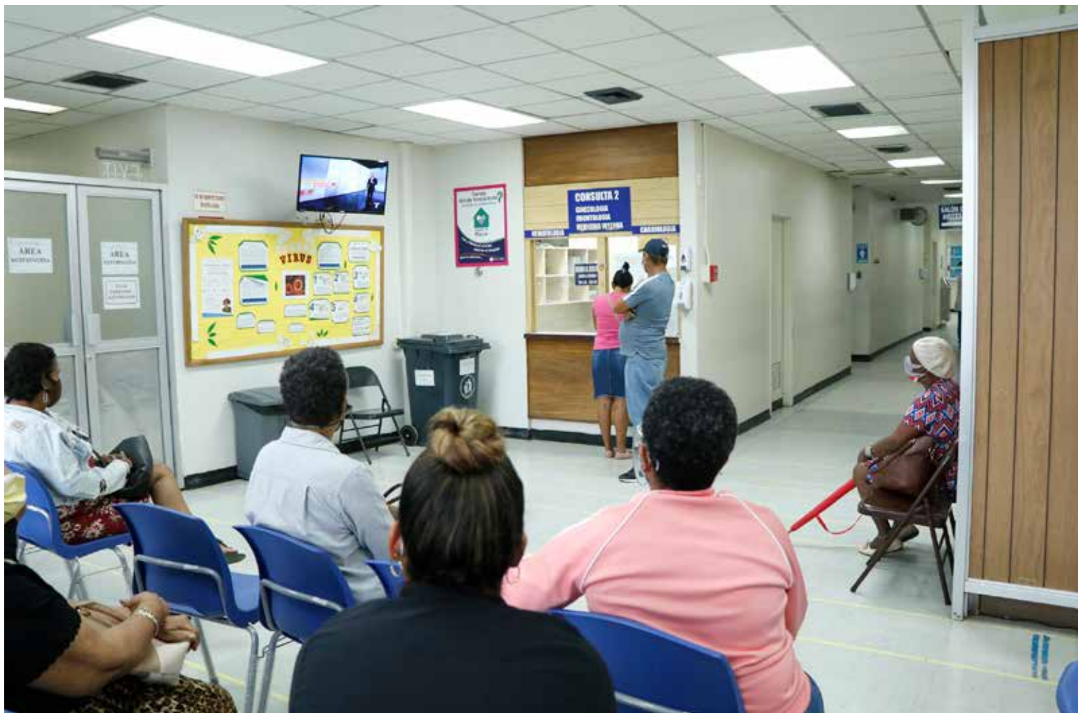
En el Instituto Oncológico Nacional se atiende tres tipos de cáncer de piel.