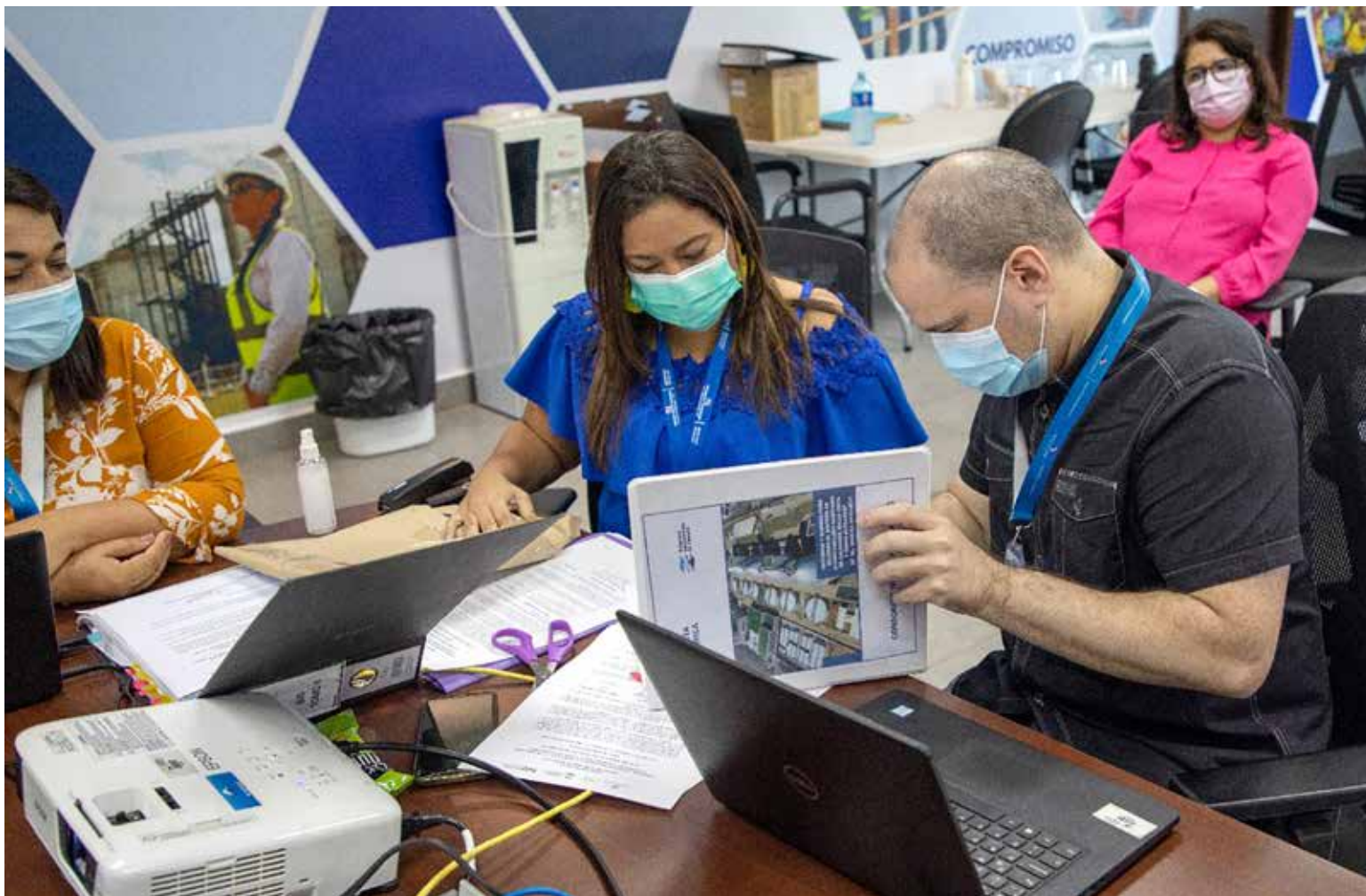
Los consorcios Nippon Koei Lac, Inc. y Txt-Saitec fueron los participantes en el acto público realizado por el Programa Saneamiento de Panamá por más de B/.2 millones.