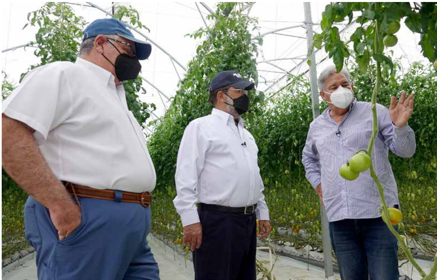
El día de campo virtual se desarrolló desde la Finca Paraíso, en la provincia de Chiriquí.