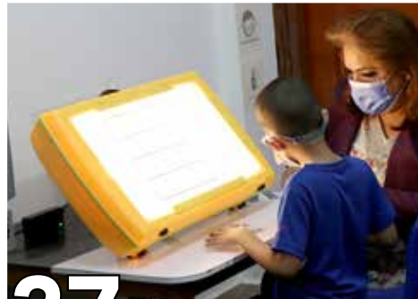
27 FUNCIONES VISUALES