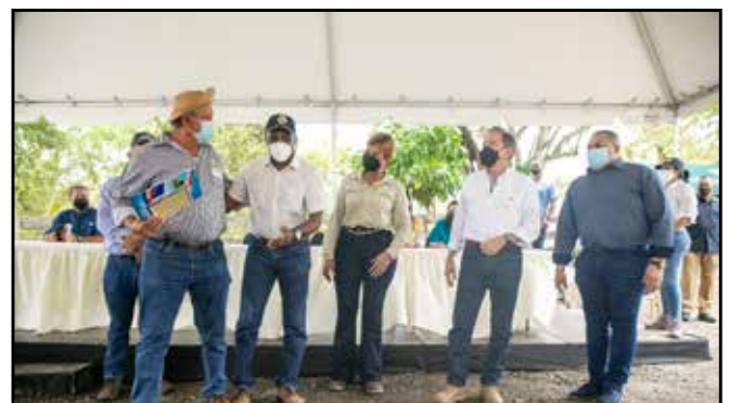
Del Programa Un Mejor Semental, se entregaron 5 toros lecheros a productores de la región.