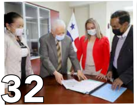
32 "RECURSOS PARA PANDEMIA: PAZ SOCIAL"