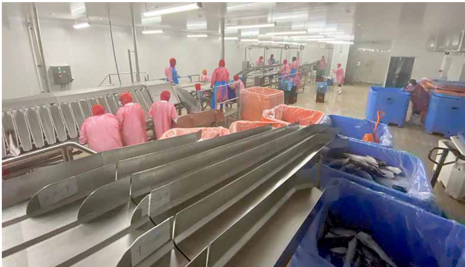
En la comunidad de Miramar, en la provincia de Colón, fue inaugurada la planta de procesamiento de la empresa acuícola Open Blue Sea Farms.