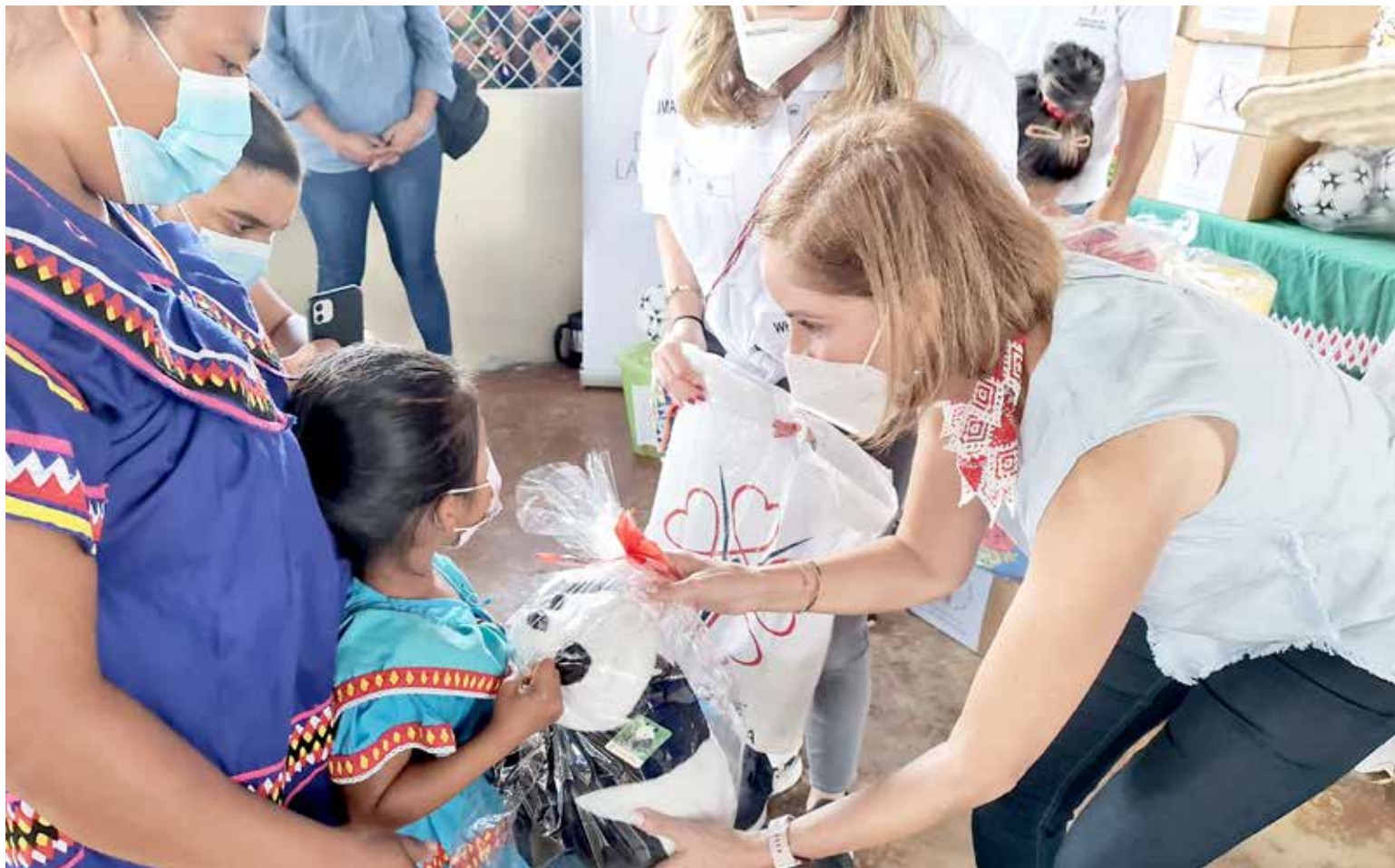
En Cerro Caña, la primera dama participó en la entrega de las donaciones.