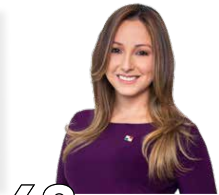
63 EL SER HUMANO PRIMERO