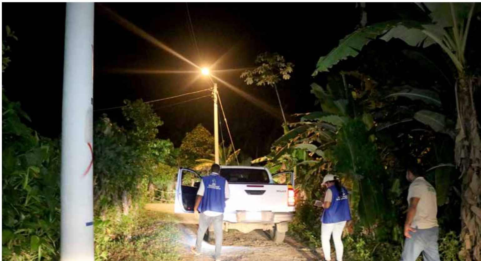
Con frecuencia, personal técnico de la ASEP verifica la calidad del alumbrado público.