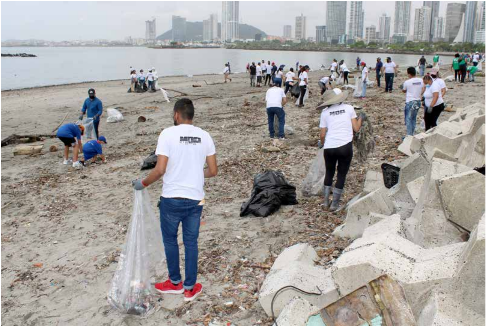
El Ministerio de Obras Públicas y otras entidades del Gobierno participaron, junto a la Embajada de Estados Unidos, en la limpieza de playa en la Cinta Costera.