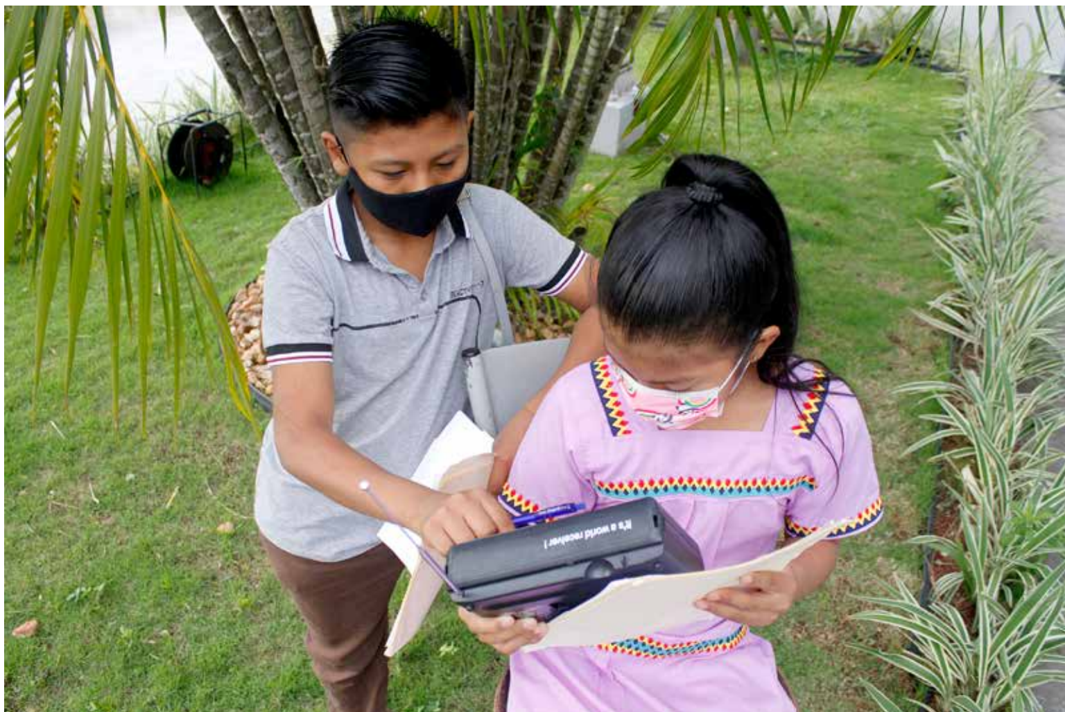
Estudiantes de la comarca Ngäbe Buglé escuchan en la radio las clases en lengua ngäbere.