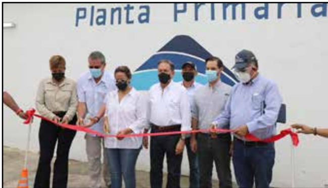
Inauguración de la Planta procesadora de Open Blue.

Comunidades visitadas: Miramar, Piña, Batería 35 y Escobal, en Costa Arriba y Costa Abajo de Colón.