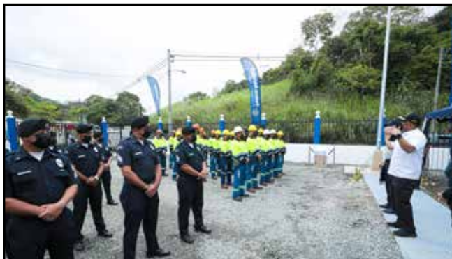
Inauguración de Subestación Policial Batería 35, que beneficiará en materia de seguridad a más de 40 mil personas.