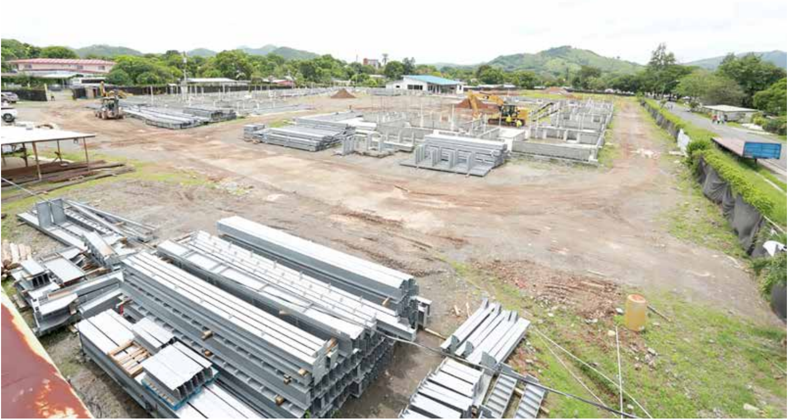
Se reanuda la construcción del CEBG Miguel Alba, en Soná, provincia de Veraguas.