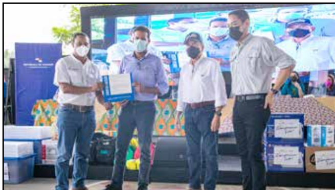
Entrega de orden de proceder para la rehabilitación del Campo Recreativo de Softball en Achote B/.379,903.00.

Comunidades visitadas: Miramar, Piña, Batería 35 y Escobal, en Costa Arriba y Costa Abajo de Colón.