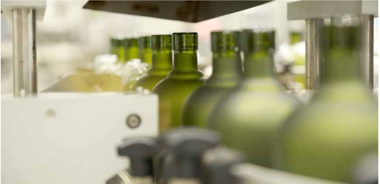
Cifras positivas en las exportaciones panameñas pese a la pandemia.