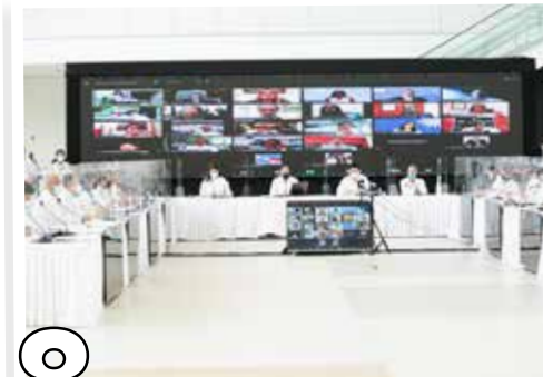
8 PLAN MAESTRO DE TURISMO