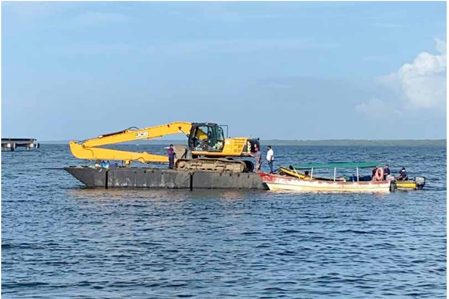
Una pala de brazo largo fue trasladada hacia Kusapín para ampliar de 2 a 5 metros de ancho los canales internos.