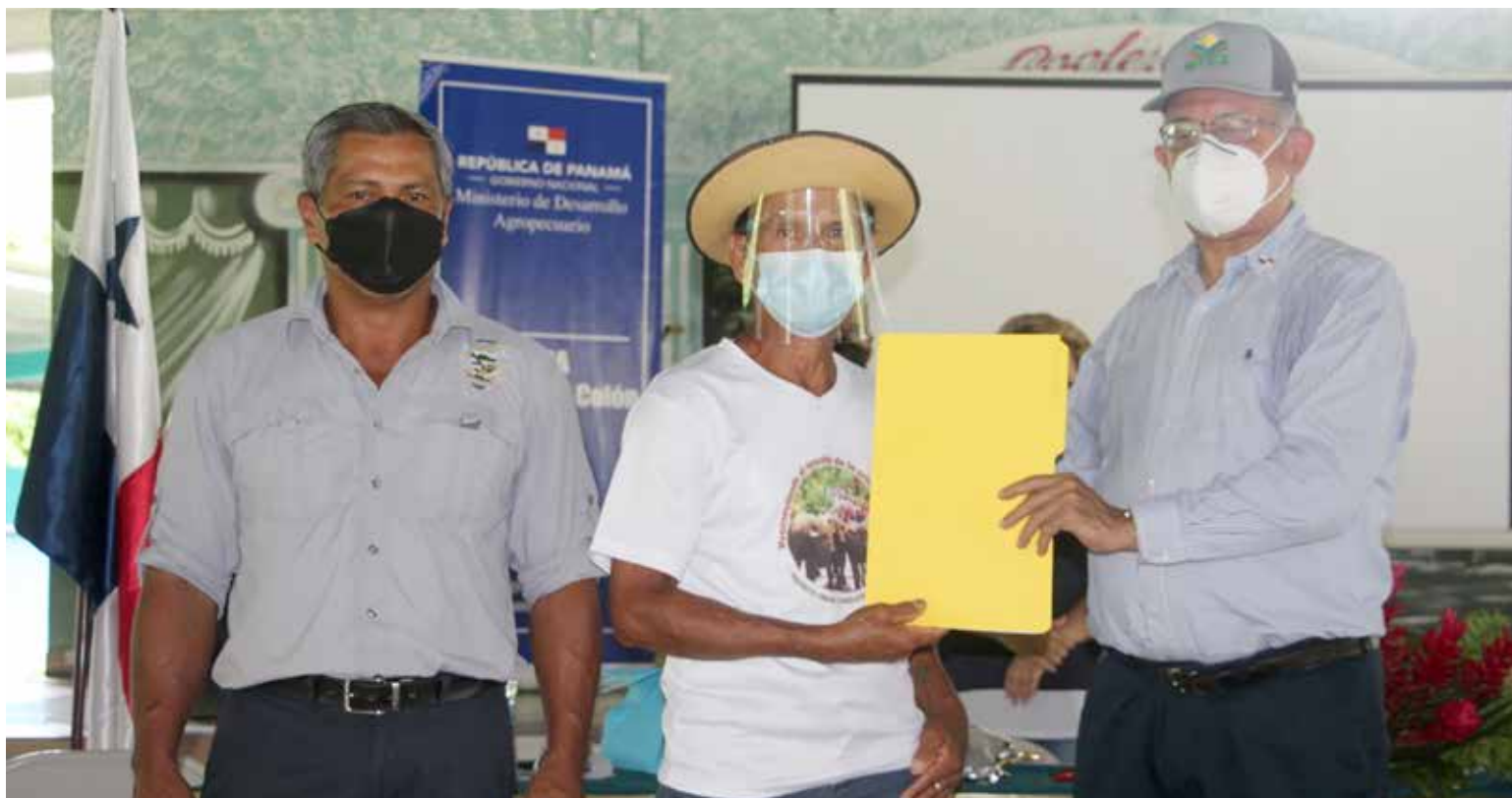
Productores beneficiados reciben de parte del ministro Augusto Valderrama documentación sobre los búfalos.