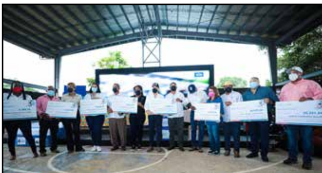
Cheques por B/.136,803.00 a nueve Juntas Comunales para la instalación de tanques de reserva de agua potable en 35 centros educativos.