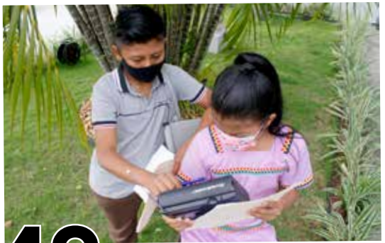
49 CLASES EN LENGUA NGÄBERE