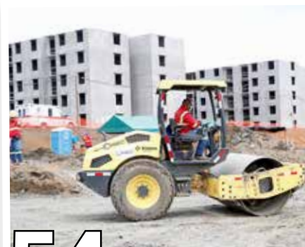
54 ALTOS DEL LAGO 2