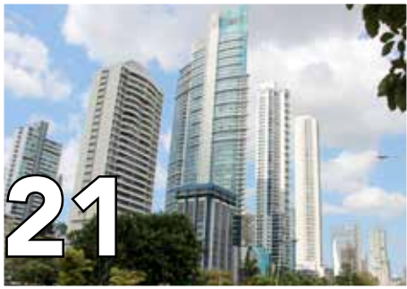
21 PRODUCTO INTERNO BRUTO