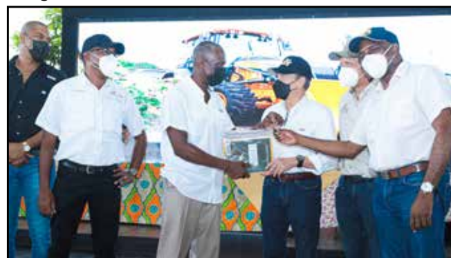
Las Juntas Comunales de Cacique y Nuevo Chagres recibieron 2 volquetes y 2 retroexcavadoras, por B/.221,100.00.