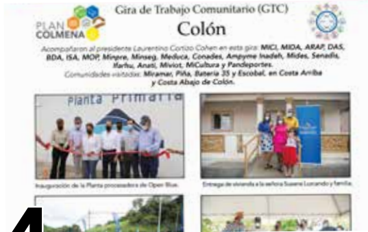
4 GIRAS DE TRABAJO COMUNITARIO - COLÓN