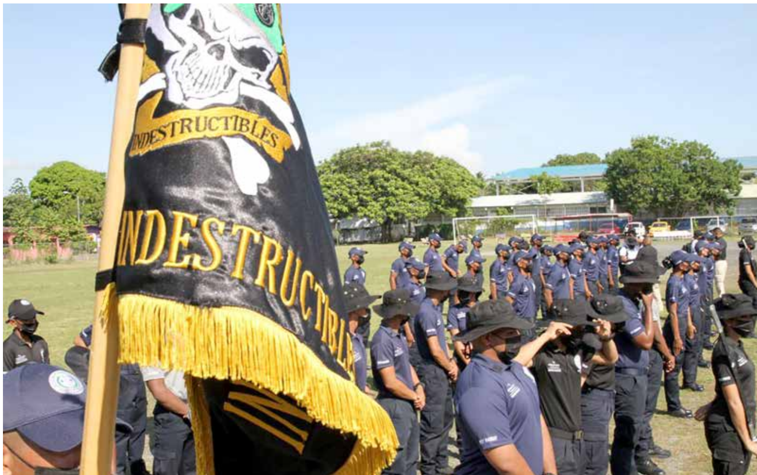
Jóvenes del programa "Encontrando el Camino Correcto" durante el acto de clausura del curso para intervenir en situaciones de riesgo.