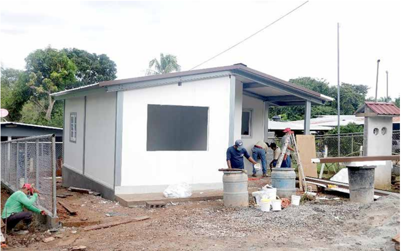
Los planes de vivienda impactarán a seis barrios de los corregimientos de Juan Díaz, Curundú y Ancón.