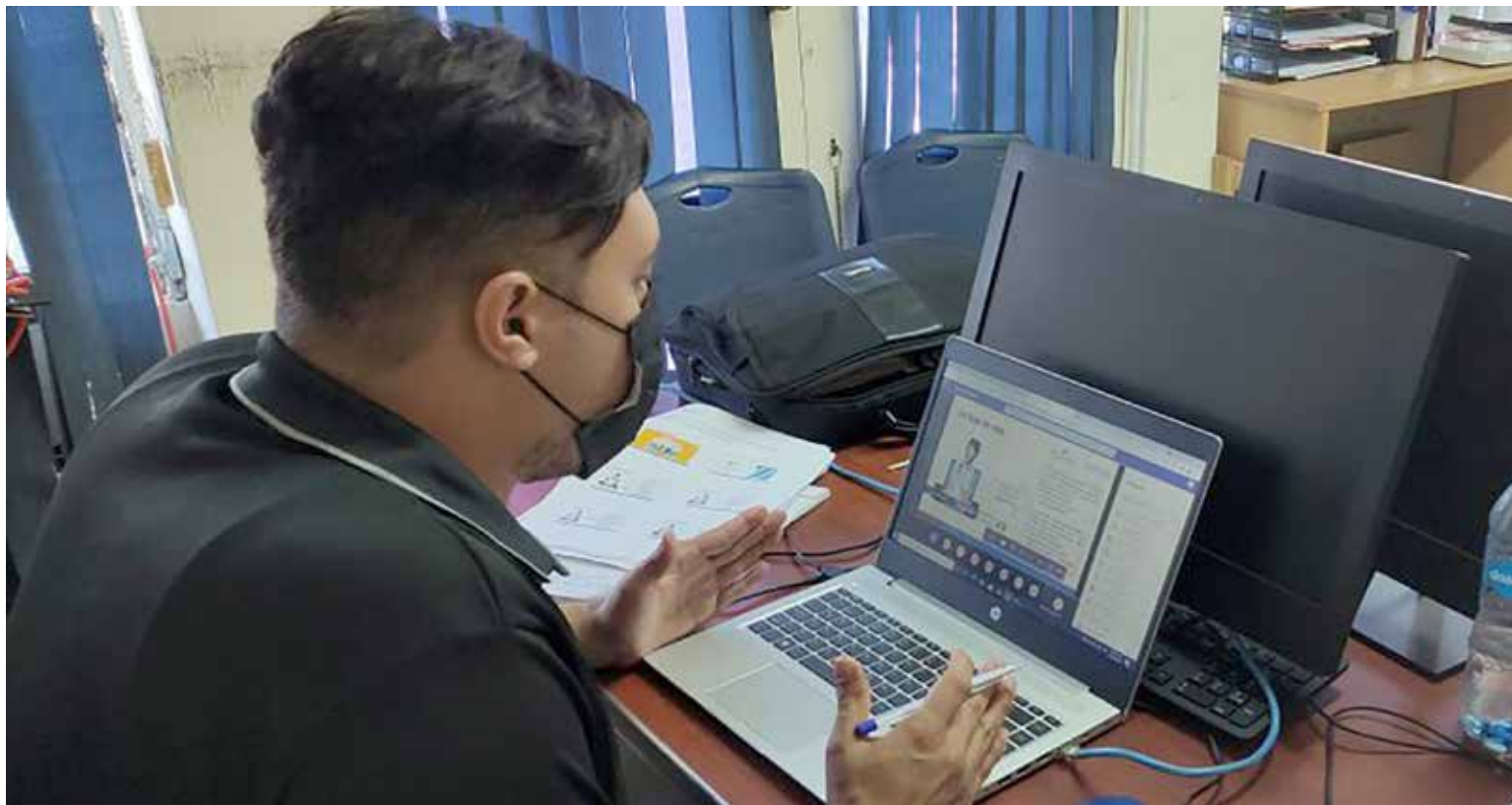
Un instructor de la Regional del Mitradel orienta a estudiantes en Chiriquí.