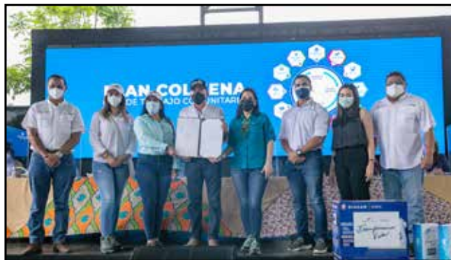
Firma de Convenio del Proyecto "Juventud Somos la Fuerza".