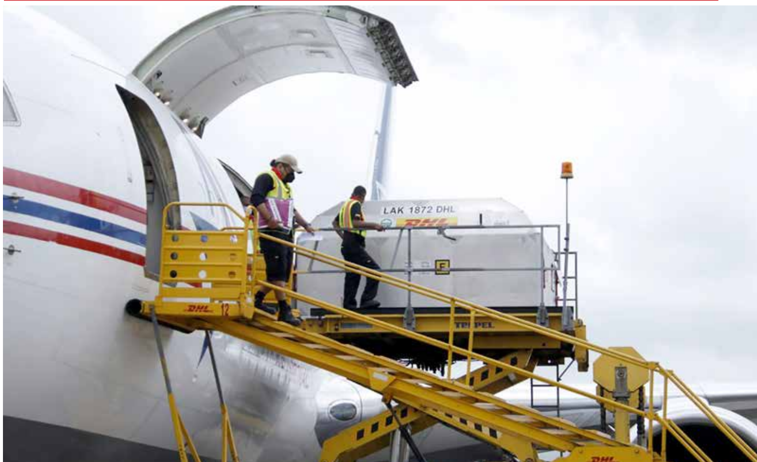
Panamá supera el millón de dosis recibidas desde el 20 de enero de 2021.