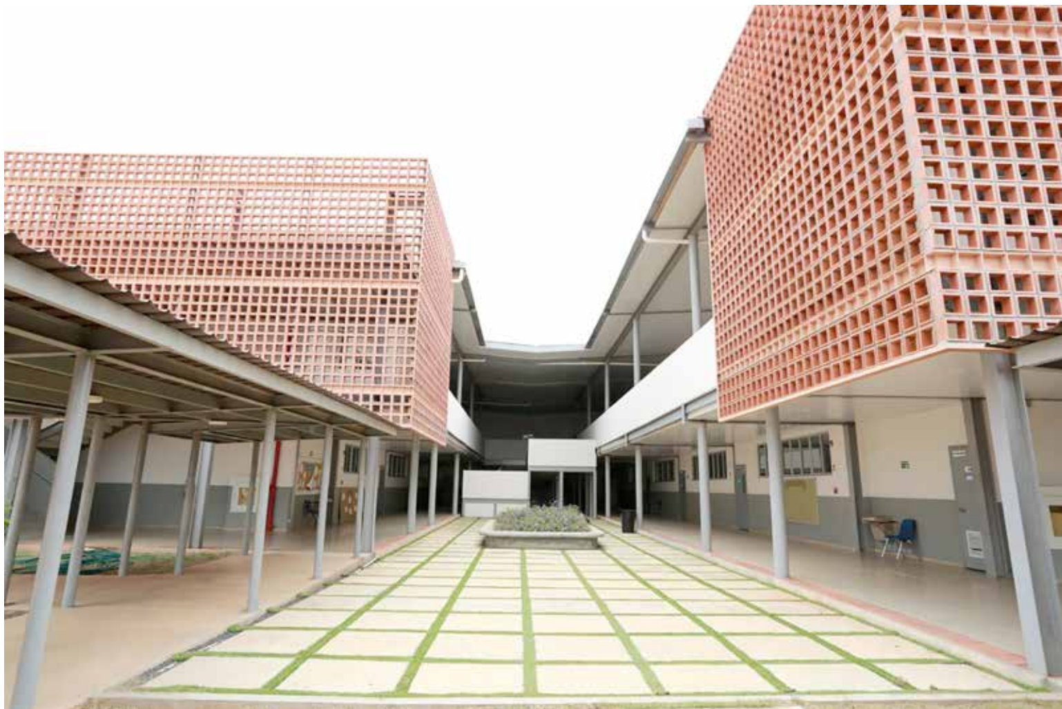
Instalaciones del centro educativo.