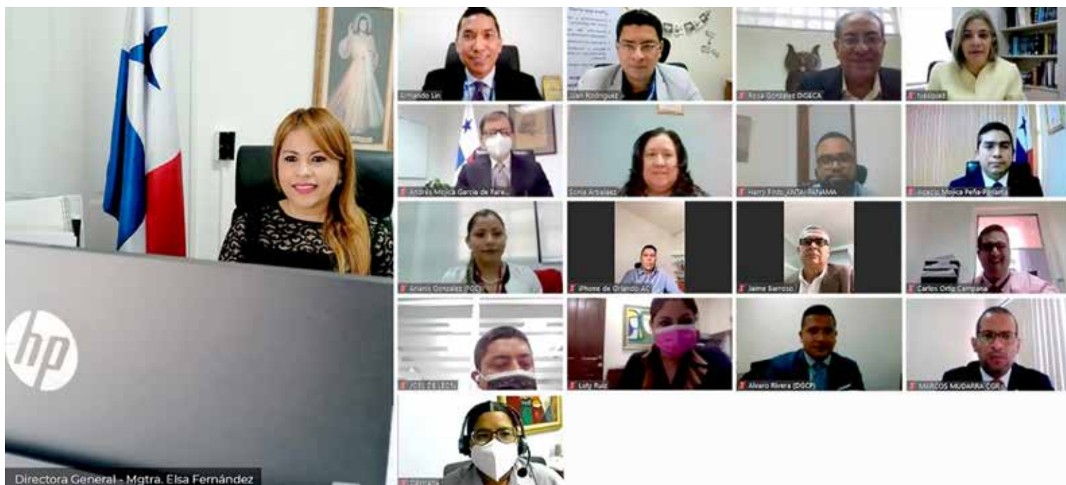
La mesa de trabajo está conformada por representantes de once instituciones del Estado.