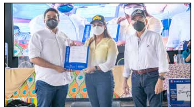
Entrega de orden de proceder para equipo pesado B/.641,828.00.