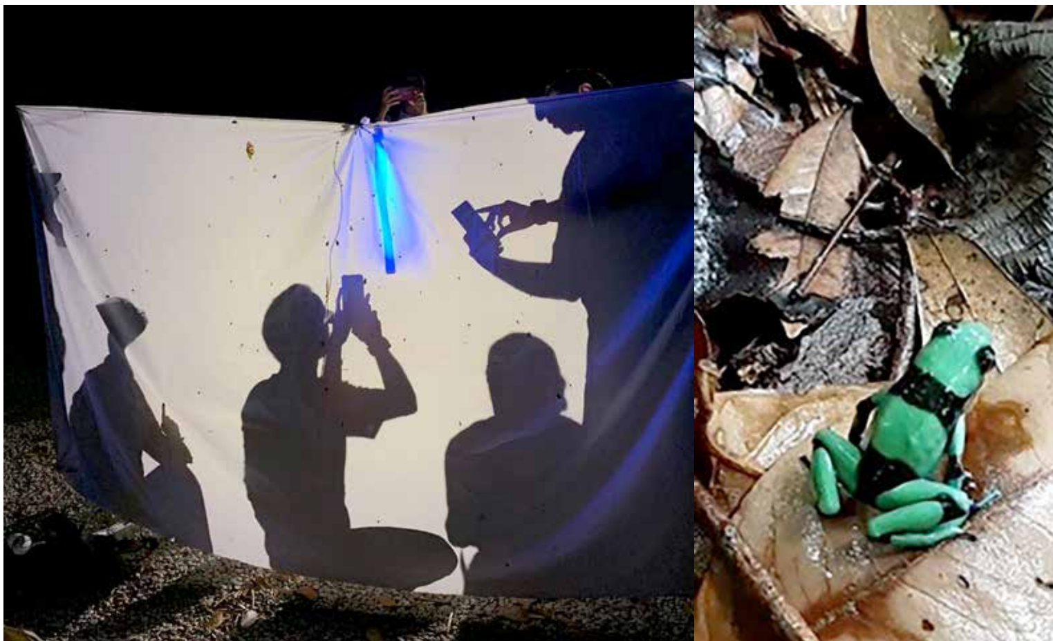
El Reto Naturalista Urbano es una iniciativa promovida por la Academia de Ciencias de California y el Museo de Historia Natural de la ciudad de Los Ángeles.