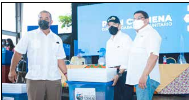
Se entregaron 5 Centros de Lectura Colmena de 120 libros de autores nacionales, librero y caja móvil, a los representantes de los corregimientos Achote, Palmas Bellas, Salud, Gobeá y San José del General.