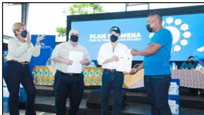
Fueron beneficiados 5 residentes con títulos de propiedad, de un total de 700 otorgados a la fecha en la región.