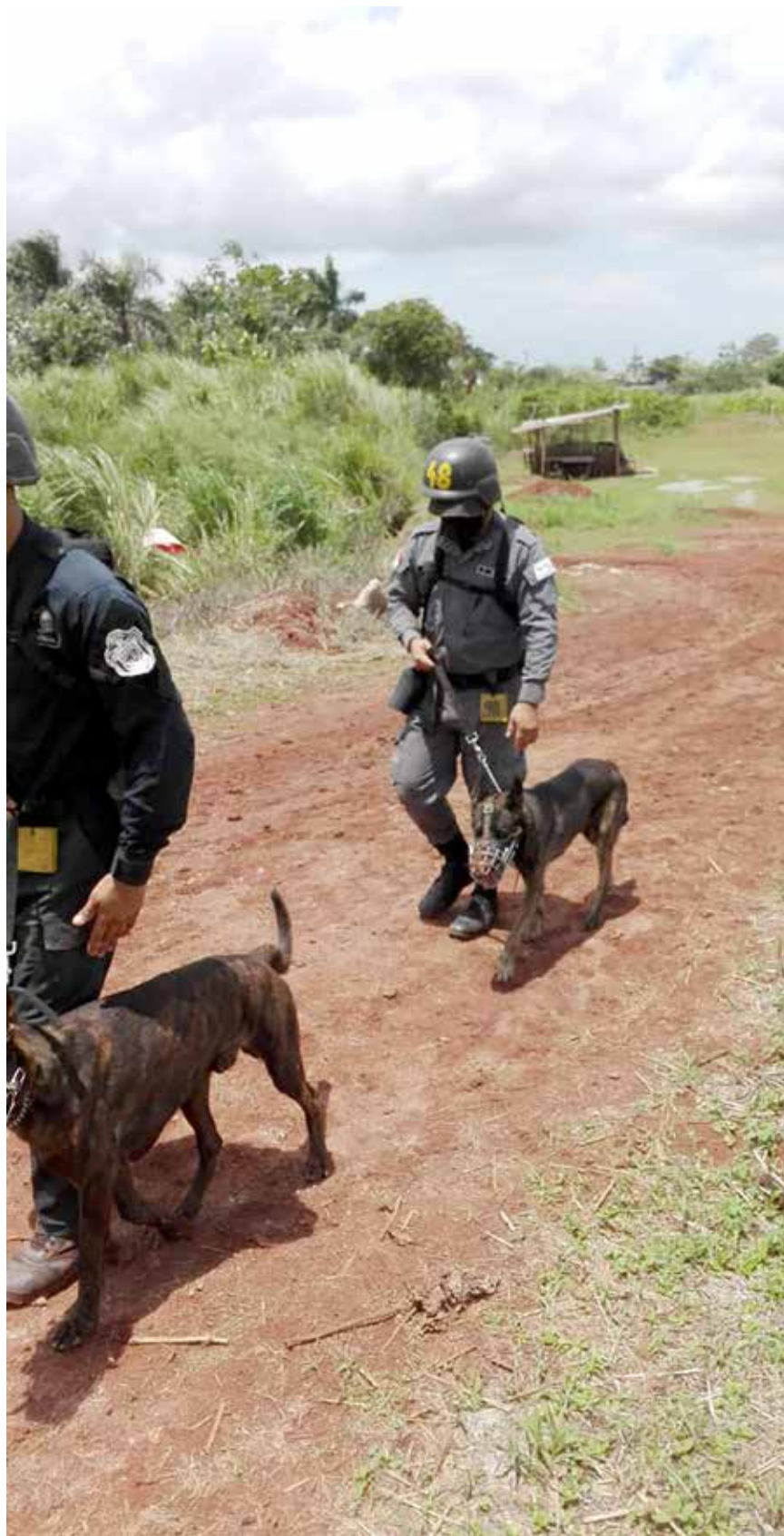
Un grupo de custodios se entrenan en manejo de canes.

Con el propósito de desarrollar habilidades y técnicas especiales para identificar y conocer el lenguaje corporal de los perros, un grupo de custodios de la Unidad Canina Penitenciaria de la Dirección General del Sistema Penitenciario se entrena como manejadores de canes bajo la conducción de la Dirección Nacional de Fuerzas Especiales de la Policía Nacional. El entrenamiento también incluye conceptos básicos de primeros auxilios y manejo de canes detectores de drogas y explosivos. Actualmente, la Unidad Canina cuenta con manejadores certificados y guías caninos que operan en los centros penitenciario La Nueva Joya y Chiriquí.