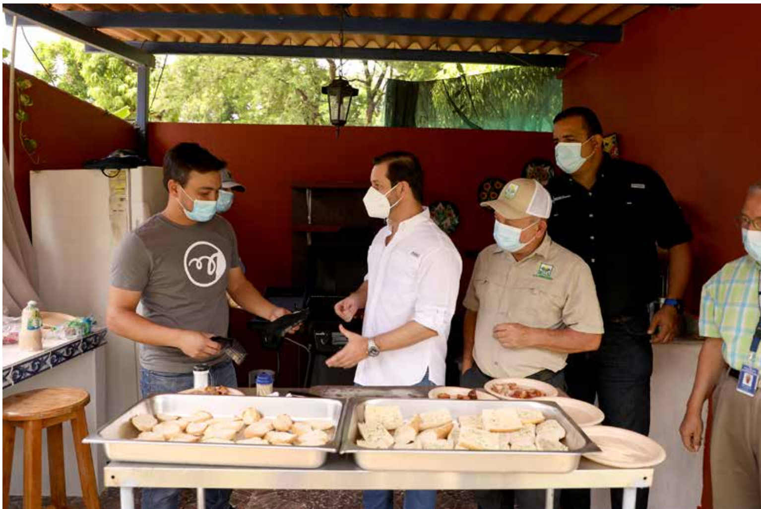
Autoridades del MICI realizan gira de reactivación económica en la provincia de Coclé.