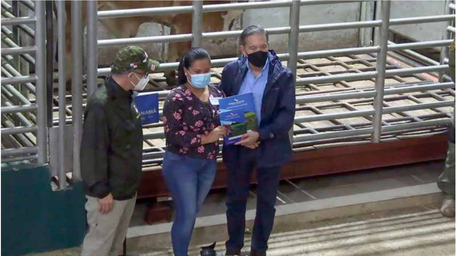
El presidente Laurentino Cortizo Cohen y el viceministro del MIDA, Carlo Rognoni, durante la entrega de toros del programa Un Mejor Semental en Darién.