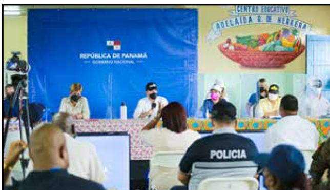
Se presentó en la Escuela Adelaida Herrera el informe del Centro de Operación Nacional Escuelas (CON Escuelas) 2021.