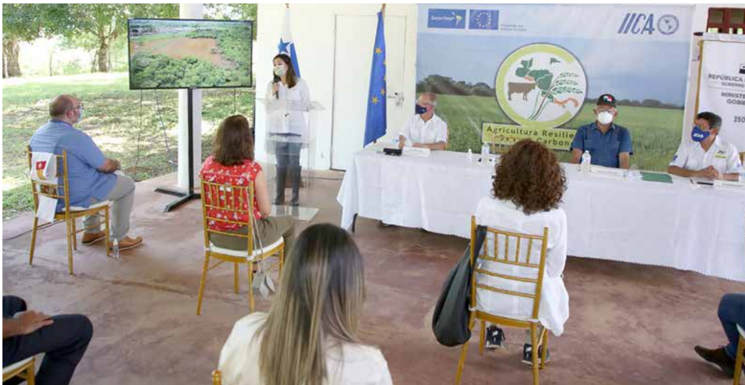
Inauguración de la Escuela de Campo Agropecuaria.