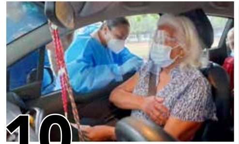
10 SUPERAMOS EL MILLÓN DE VACUNAS APLICADAS