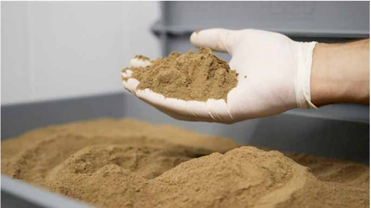
La planta panameña Procesadora Bayano, S.A. exporta a China harina de pescado.