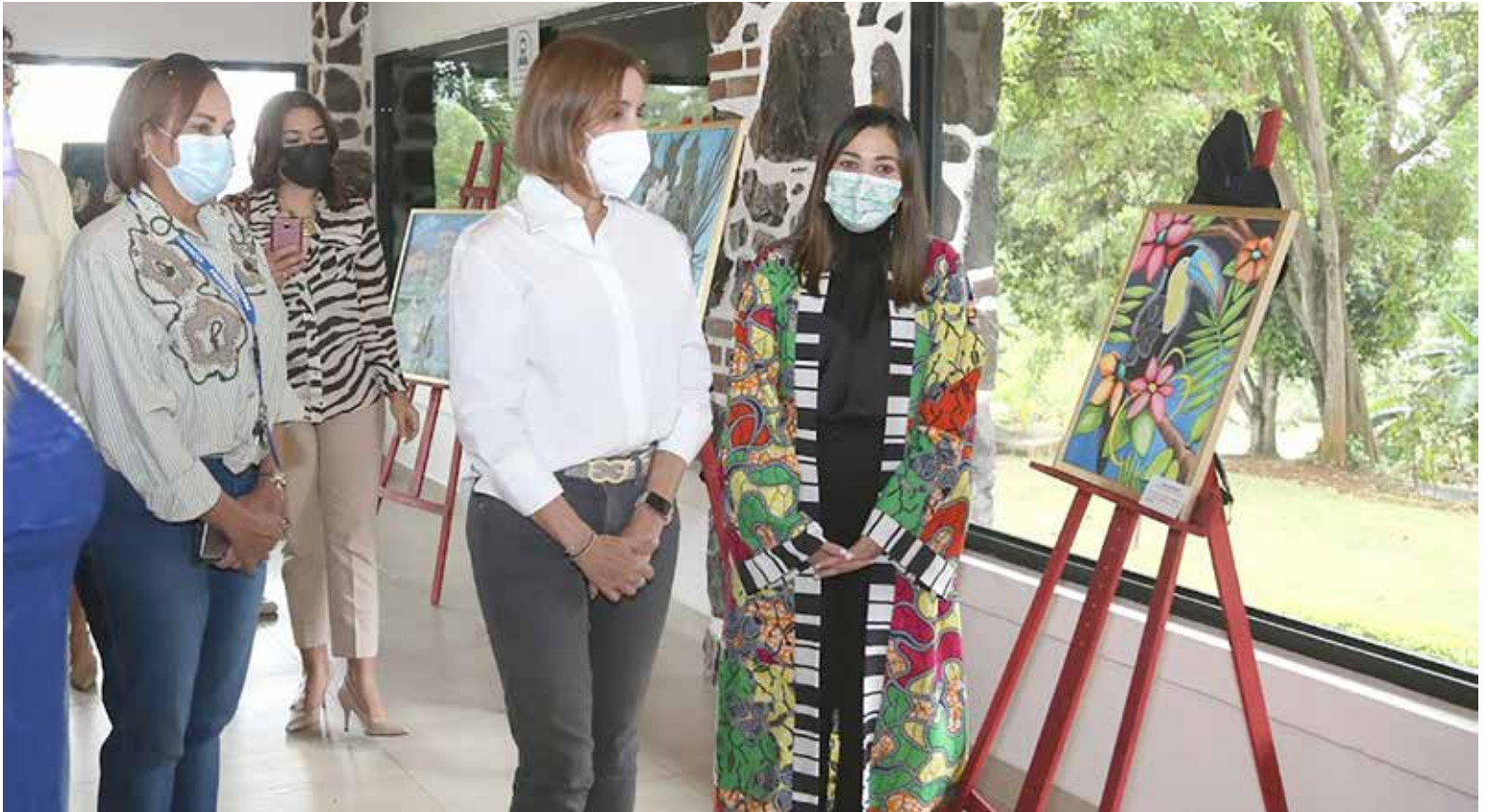
Exposición "Liberarte", con piezas de los privados de libertad.