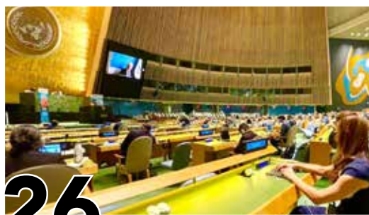
26 POLÍTICA EXTERIOR