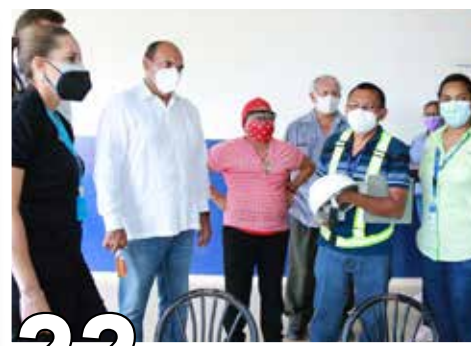
22 INFRAESTRUCTURA EDUCATIVA