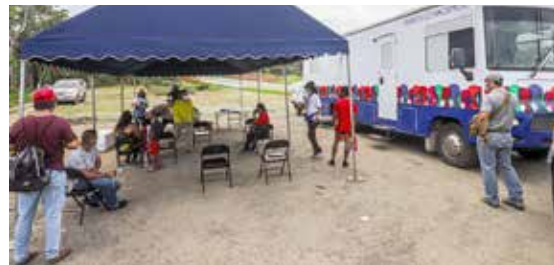
Pacientes esperan su turno para ser atendidos en la clínica móvil del programa Salud Sobre Ruedas.

Santa Ana y El Chorrillo. Los asistentes recibieron también charlas de las medidas de bioseguridad contra la Covid-19, consejería pre y posprueba de laboratorio e insumos de protección.