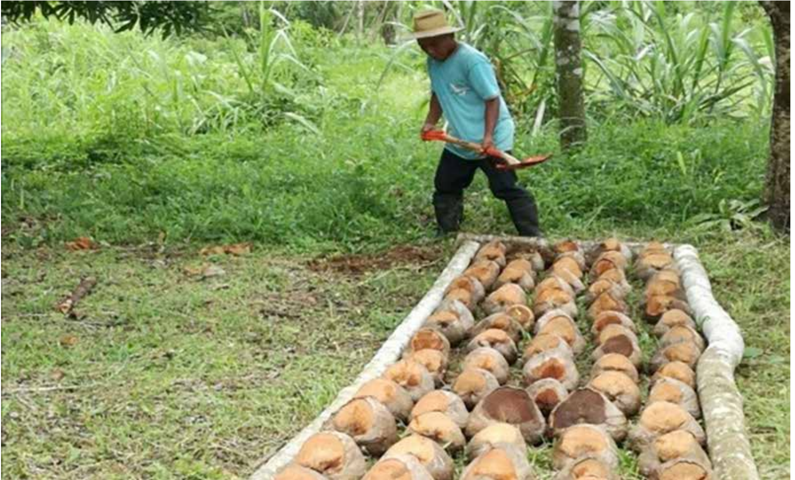
Primera cosecha de coco de la variedad tres filos del Proyecto de Mejoramiento del Cocotero en Colón.