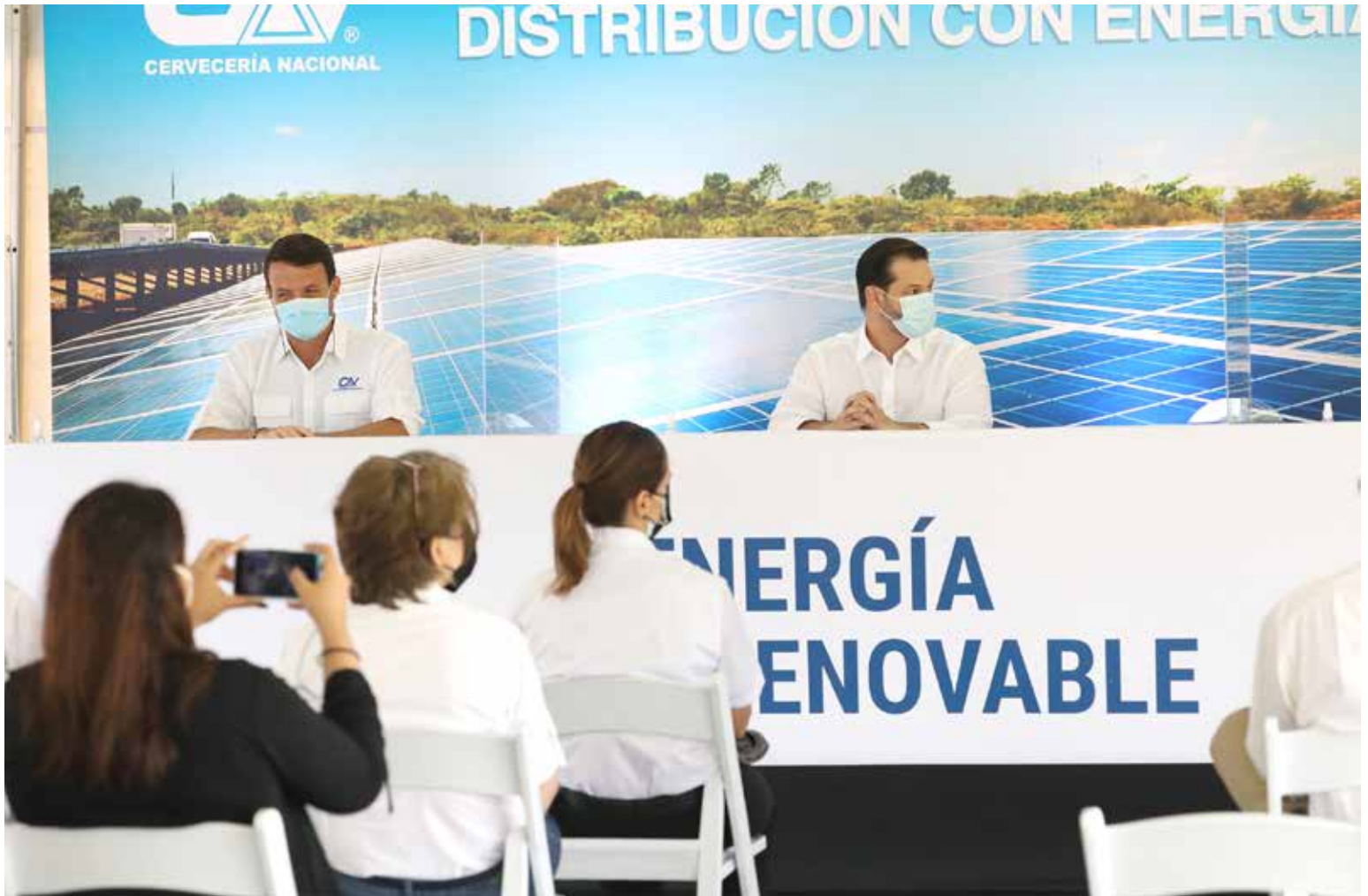
La inversión de B/.420 mil beneficia a la provincia de Colón.