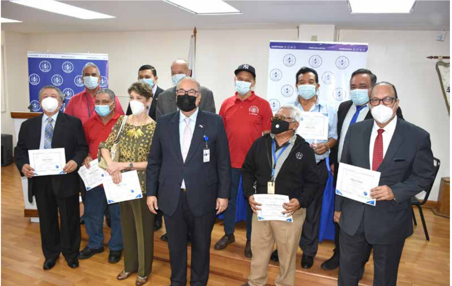
Se rindió un merecido homenaje al personal con más de 50 años de servicio.