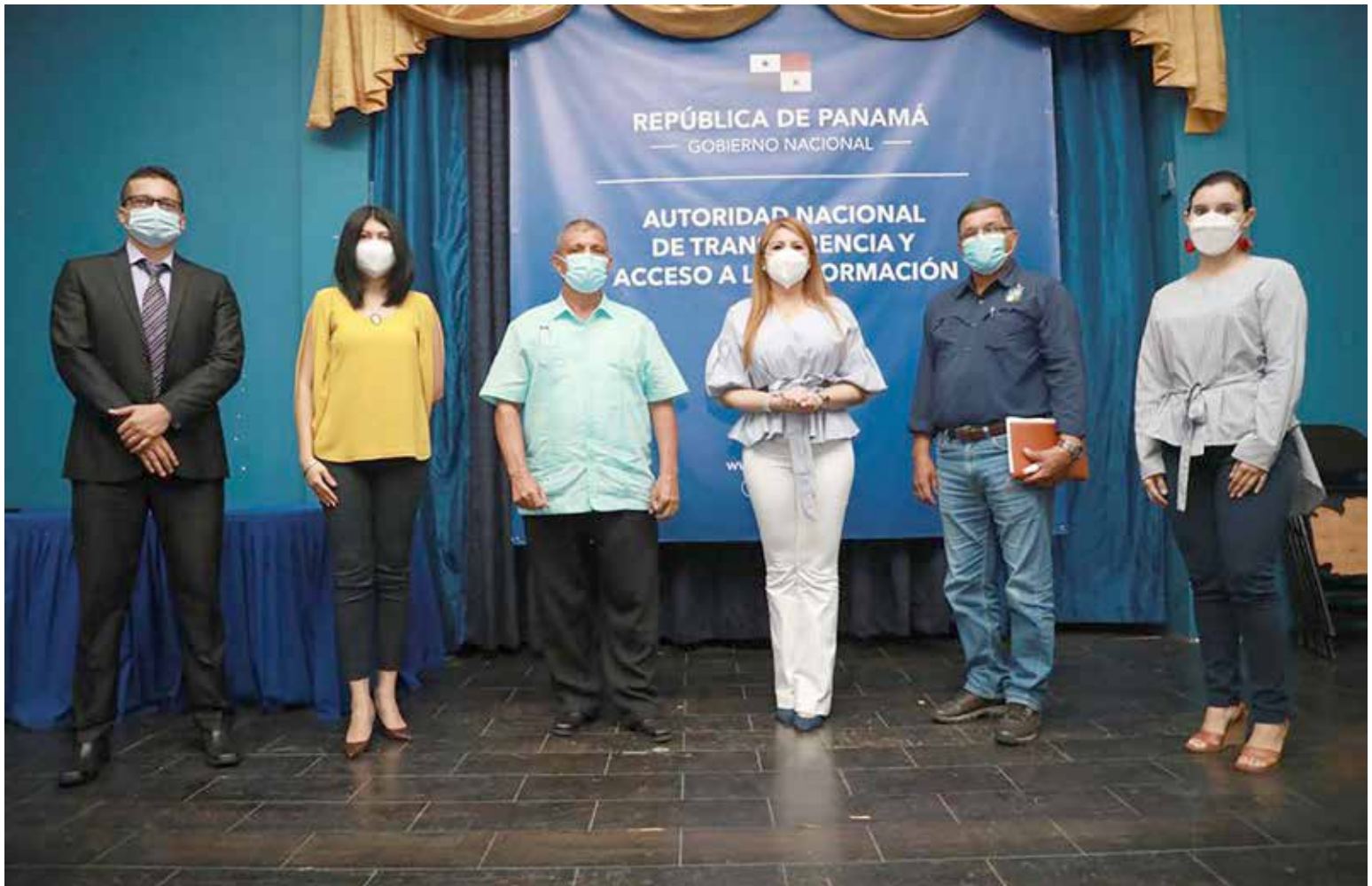
Lanzamiento del proyecto de Auditorías Sociales en la provincia de Coclé.