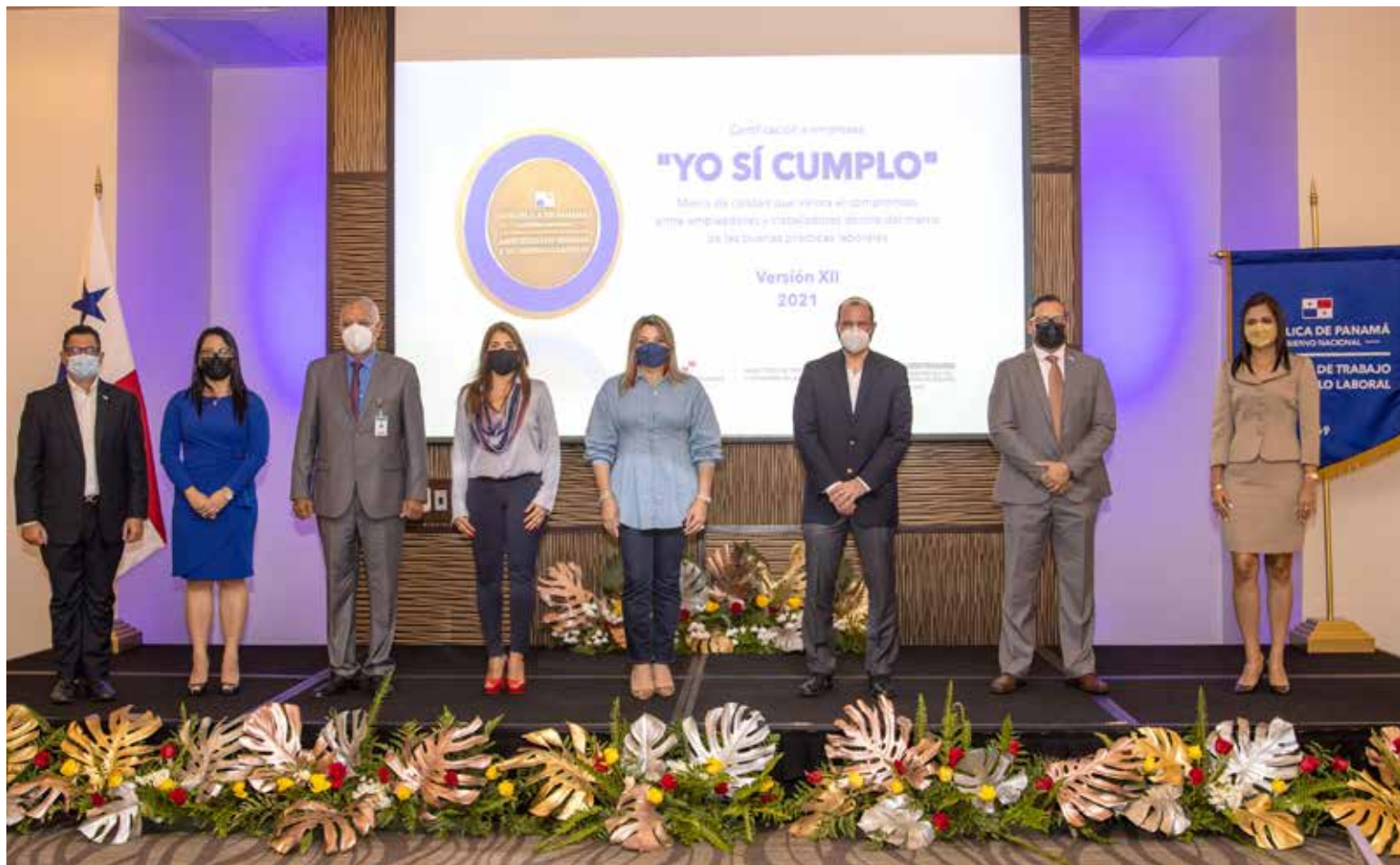
El Mitradel entregó certificaciones del programa "Yo sí cumpro" a 25 empresas que mantienen buenas prácticas laborales.