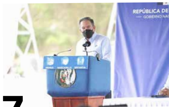
7 PLAN NACIONAL DE ENERGÍA