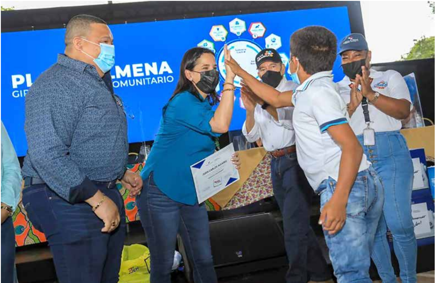
Los beneficios fueron entregados en una gira comunitaria encabezada por el presidente de la República, Laurentino Cortizo Cohen, y la ministra de Desarrollo Social, María Inés Castillo.