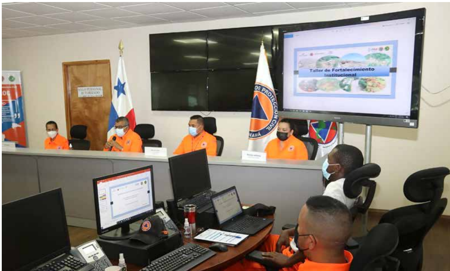
La gestión del riesgo requiere cooperación comunitaria.