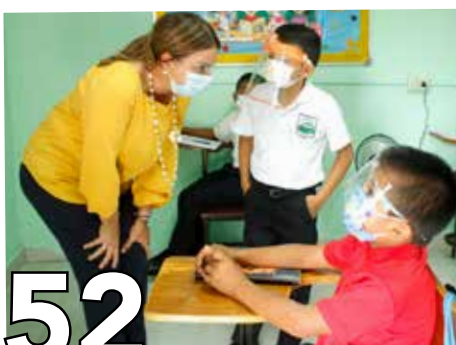
52 CLASES SEMIPRESENCIALES