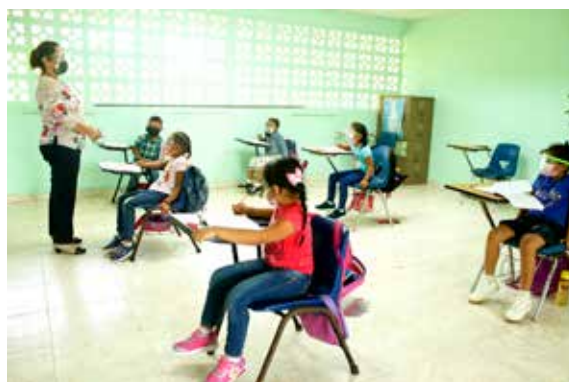
Este 31 de mayo se iniciaron las clases semipresenciales en 78 centros educativos del país de baja matrícula y multigrado.

Educación, Maruja Gorday de Villalobos. La matrícula para el período lectivo 2021 es de 914,101 estudiantes, 754,623 del sector oficial y 159,478 en el particular.