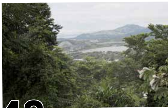
48 MERCADO DE CARBONO