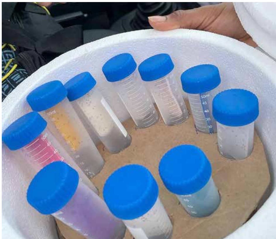
Pies de cría del insecto benéfico para apoyar la estrategia de control de la enfermedad que ataca a los cítricos.