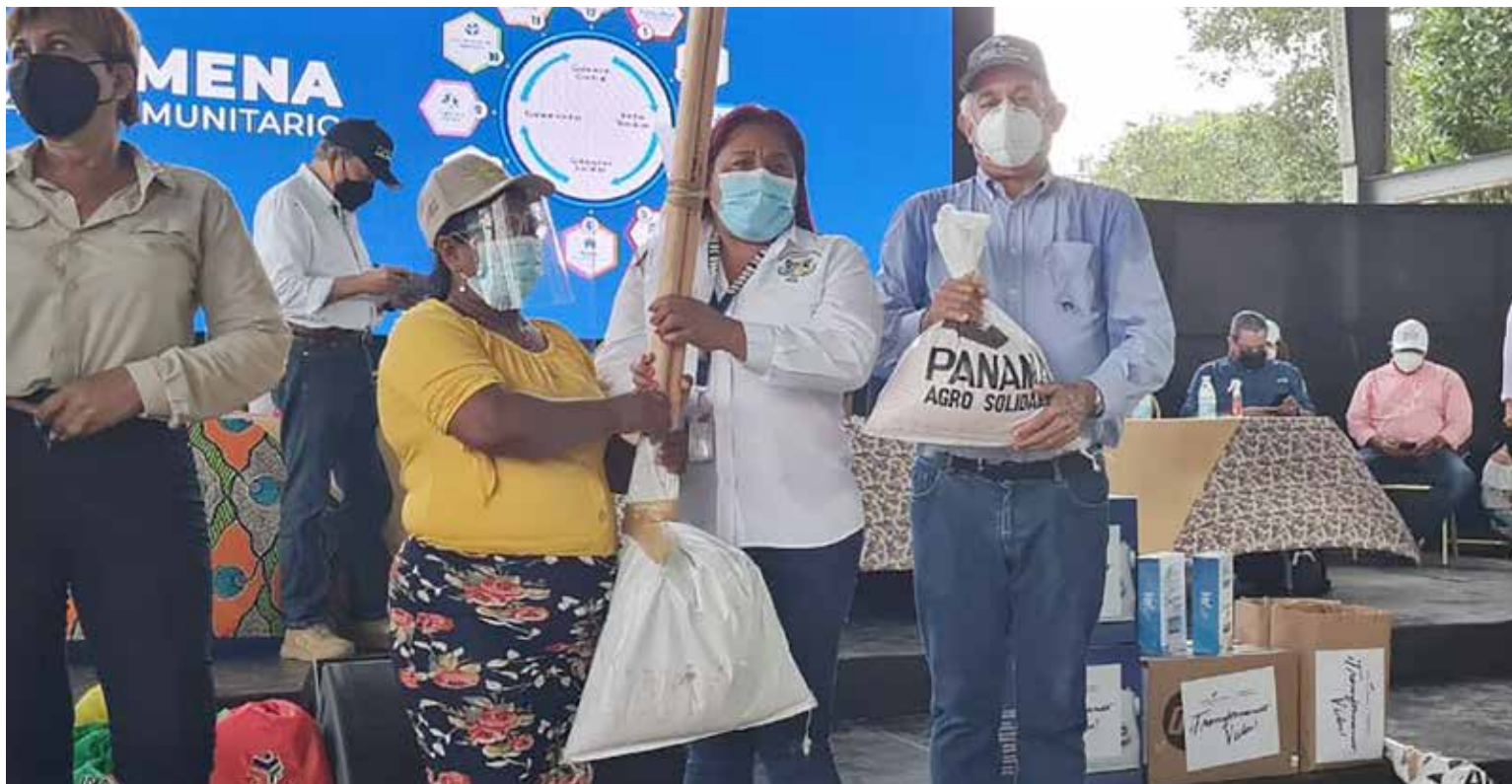
Entrega de herramientas del kit Agro Vida a productores de Colón.