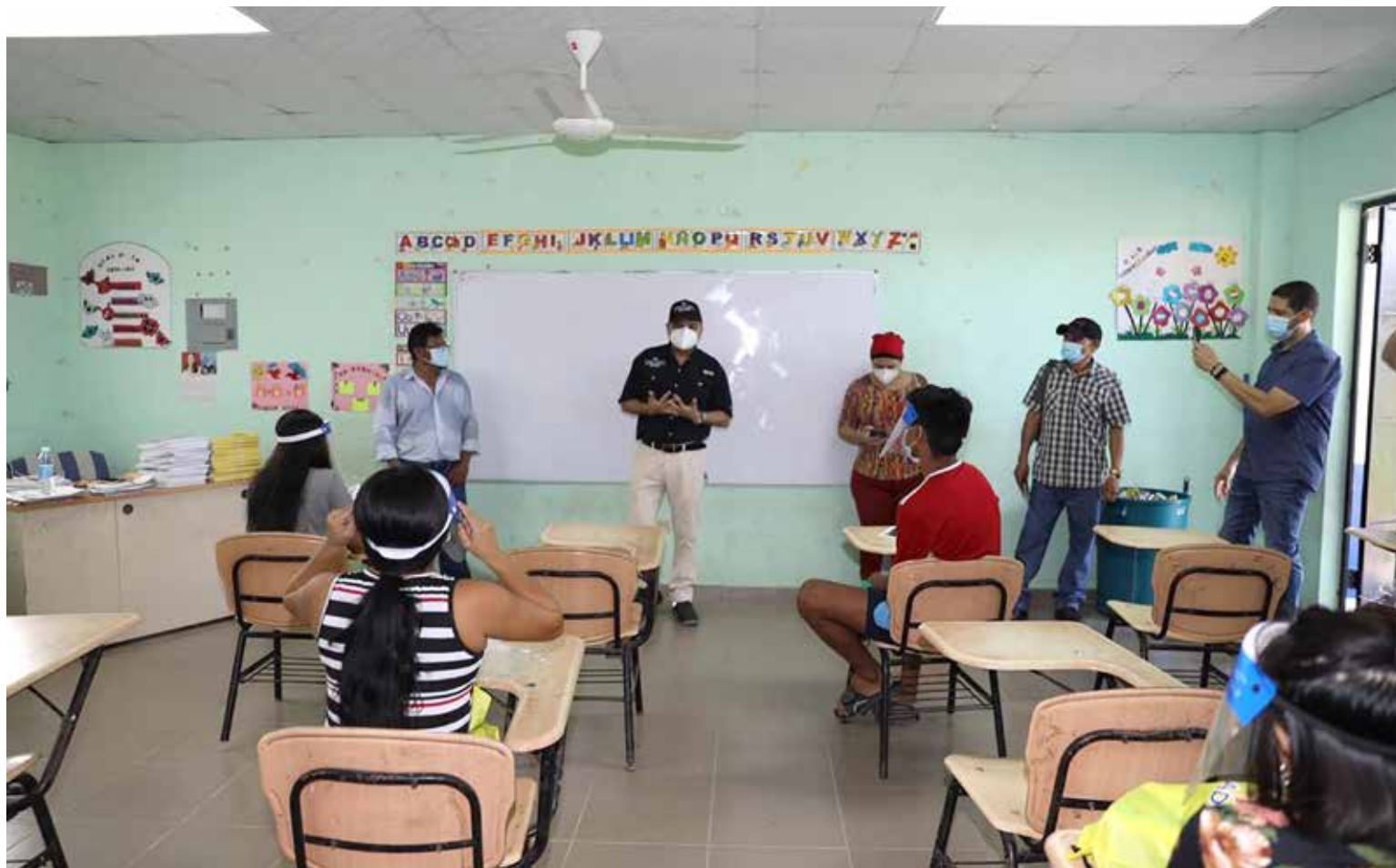
El Inadeh organizó cursos de capacitación en la comarca Guna de Madugandí.