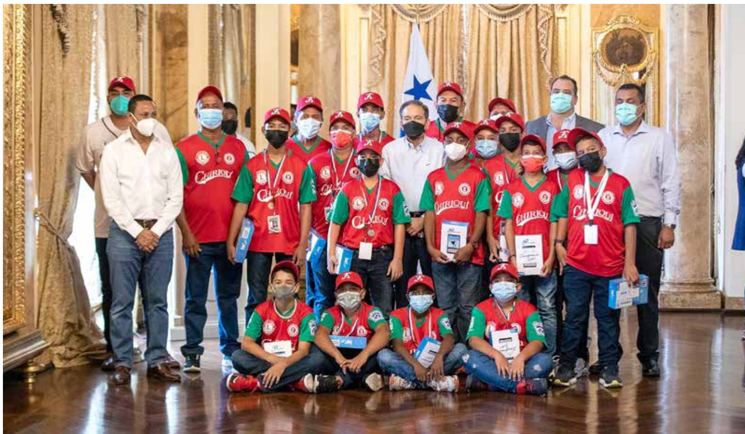
Los integrantes del equipo Campeón Nacional Infantil de Pequeñas Ligas fueron recibidos por el presidente Laurentino Cortizo Cohen en el Palacio de Las Garzas, en donde se les rindió homenaje tras ese importante logro.