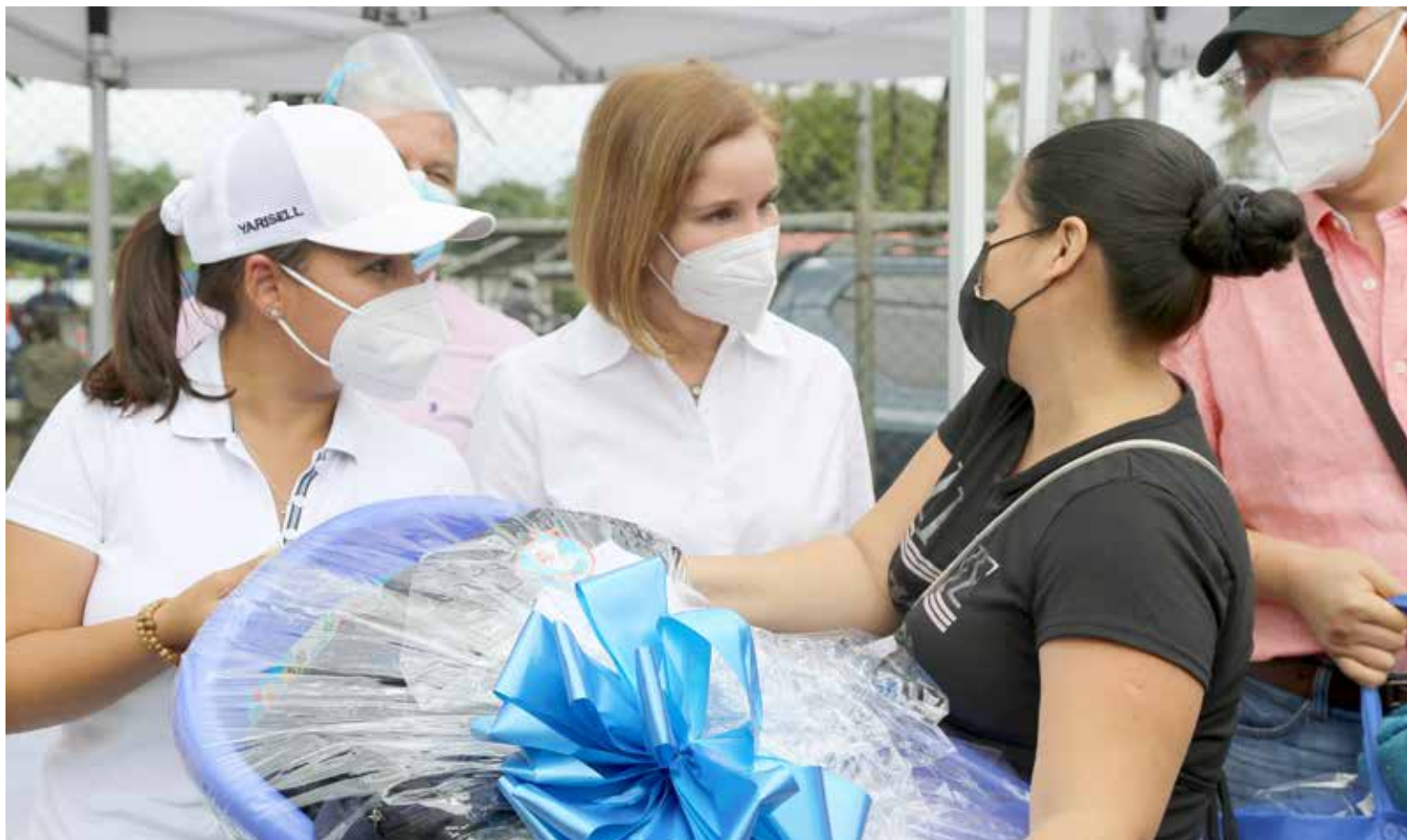
La primera dama de la República entrega una canastilla de bebé a una madre residente de la comunidad.