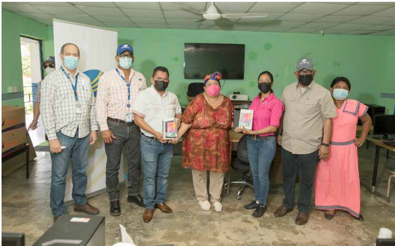
Donación de 15 computadoras y tabletas a la Escuela de Malí, distrito de Jirondai, en la comarca Ngäbe Buglé.