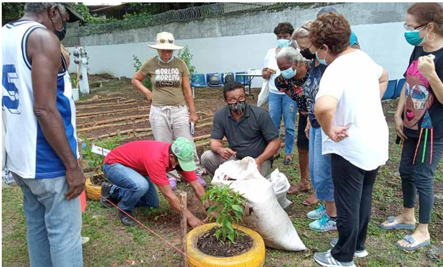
El centro brindará sus servicios en un horario de 7:30 a.m. a 3:30 p.m.