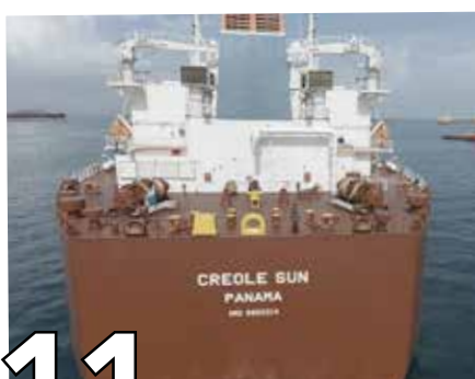
11 SUPERÁVIT EN RECAUDACIONES