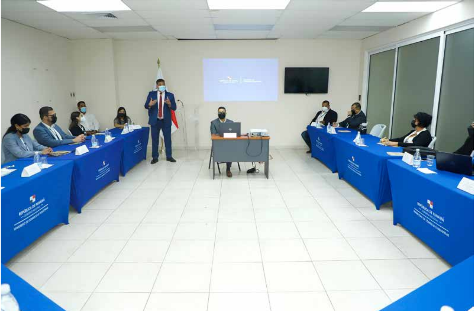
Directivos del MICI, MIDA y de la Autoridad ProPanamá participaron de una reunión de alineación interinstitucional.