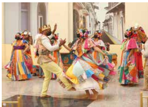
Grupo Proyecciones Escénicas Patria