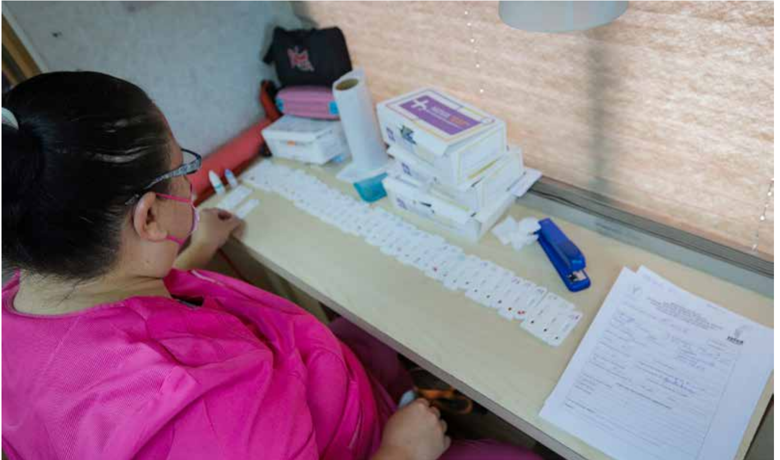
Una enfermera verifica los resultados en pruebas realizadas durante la jornada.