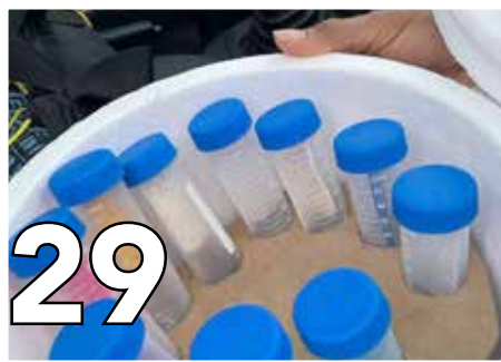
29 CONTROL DEL HLB