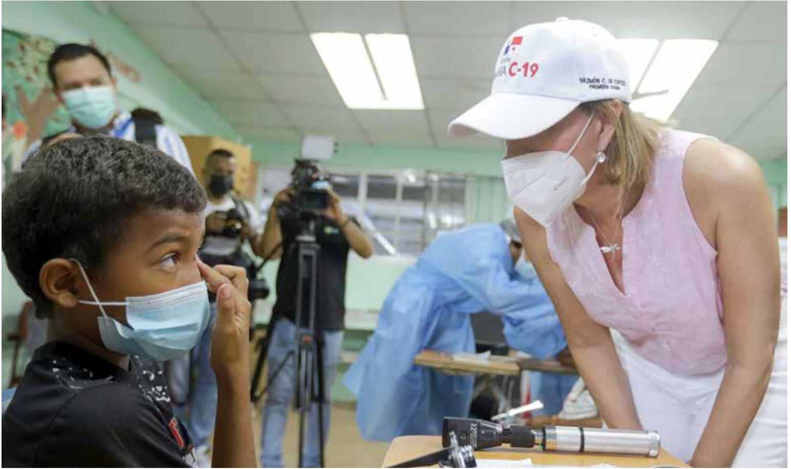
La primera dama de la República conversa con uno de los estudiantes beneficiados por este programa.