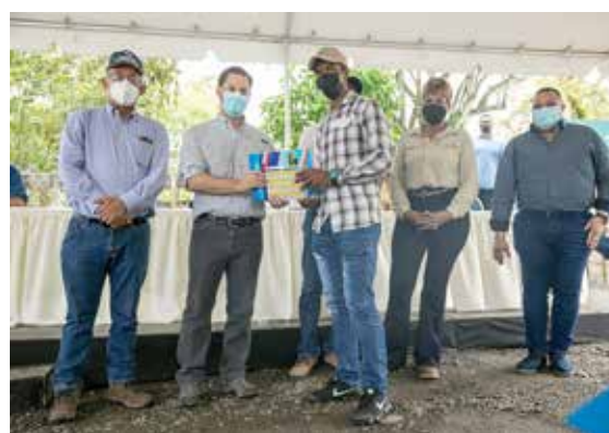
Productor colonense beneficiado con un semental de leche de alta genética recibe la documentación de parte de las autoridades.

a los pequeños agricultores, es Agro Vida. En esta oportunidad, se entregaron 10 kits de herramientas e insumos a las familias campesinas, para que inicien sus proyectos agropecuarios, que les garantice la seguridad alimentaria y sostenibilidad económica.