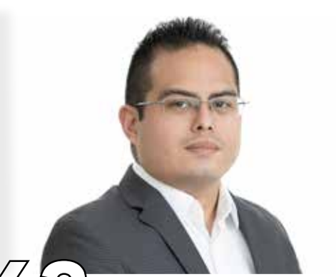
63 LA CIENCIA COMO PRIORIDAD