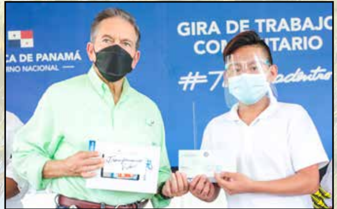
10 estudiantes recibieron laptops y becas, de un total de 11,426 que han sido beneficiados en la comarca.