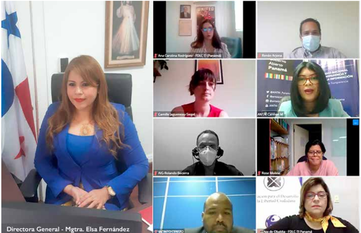
Representantes de gobierno y de la sociedad civil participan en las mesas temáticas del IV Plan de Acción Nacional de Gobierno Abierto.

Con el compromiso de implementar en Panamá la metodología de presupuesto abierto, se realizó la octava mesa temática del IV Plan de Acción Nacional de Gobierno Abierto, que se propone generar acciones puntuales en áreas prioritarias para el país. Esta mesa colaborativa busca que Panamá incorpore buenas prácticas en la elaboración del Presupuesto General del Estado, que cuente con aportes de la ciudadanía, que