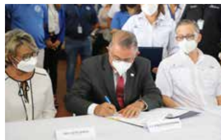
La firma del convenio interinstitucional beneficia a los consumidores panameños que pueden adquirir alimentos inocuos.

Merca Panamá, donde se encuentran los nuevos recintos de supervisión de estas instituciones. El objetivo principal será supervisar y vigilar el cumplimiento de los protocolos y controles de las actividades comerciales relacionadas con situaciones de alto riesgo público, en la introducción de alimentos importados o no en el recinto operado por la Cadena de Frío. El ministro Valderrama felicitó al grupo de