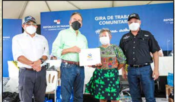
Moradores recibieron certificados de fin de cursos de modistería y confección de artesanías autóctonas.