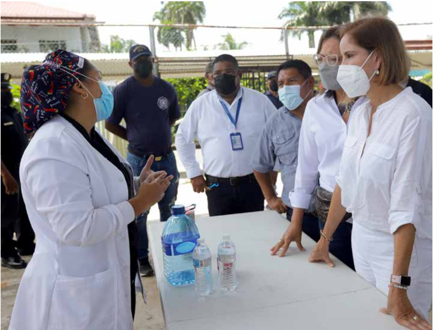
Una enfermera explica a la primera dama toda la información sobre la vacunación en el Colegio Rogelio Josué Ibarra.

Para este centro de vacunación se destinaron al menos 1,500 dosis de la vacuna AstraZeneca, que serán administradas de forma voluntaria a hombres y mujeres de 30 años en adelante.