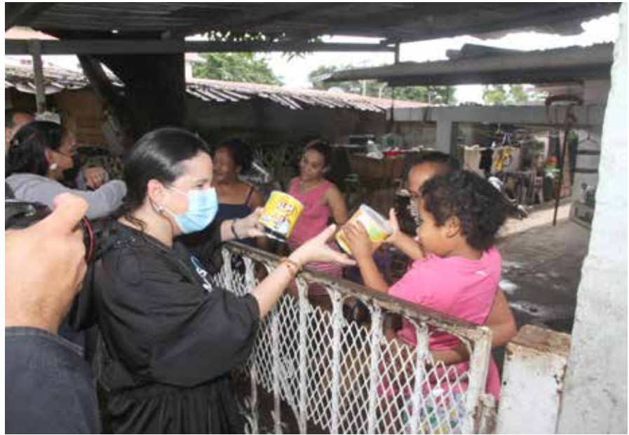
La ayuda se hizo efectiva para unas 60 familias en Panamá Viejo y 92 de Nueva Esperanza, en Juan Díaz.