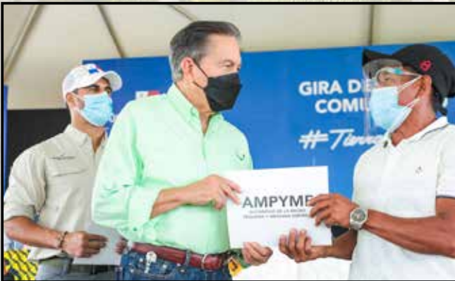
Emprendedores recibieron capital semilla no reembolsable por B/.12,000.00.