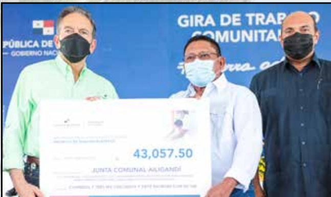
La Junta Comunal de Ailigandí recibió un cheque por B/43,057.50 para instalar tanques de reserva de agua en 10 escuelas.