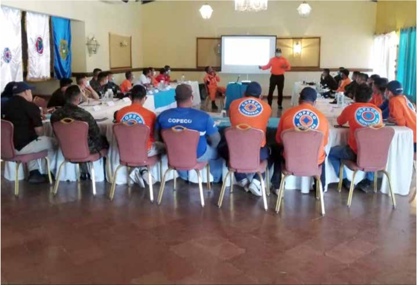
Sinaproc capacita a personal de rescate hondureño.