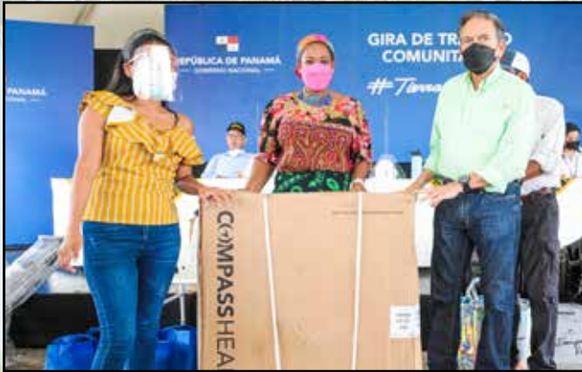
Residentes fueron beneficiados con la entrega de sillas de ruedas.

Acompañaron al presidente Laurentino Cortizo Cohen en esta gira: MIDA, Meduca, Ampyme, Inadeh, MIDES, Senadis, Ifarhu, Minpre, Senafront