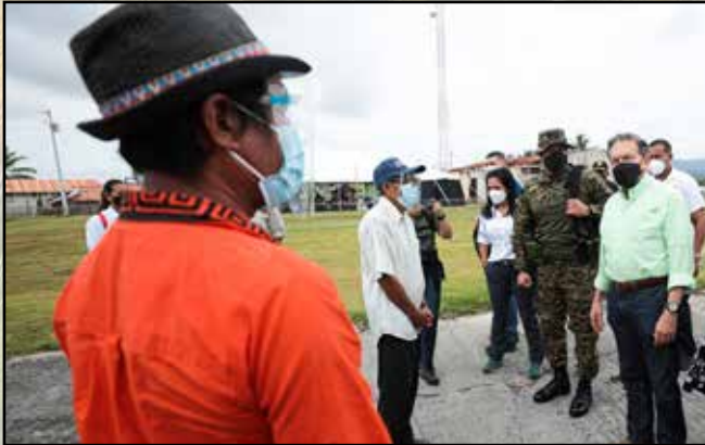
El informe de CON Escuelas, programa a través del que se reparan 11 escuelas de la región, se presentó en el Colegio Félix Esteban Oller.

Acompañaron al presidente Laurentino Cortizo Cohen en esta gira: MIDA, Meduca, Ampyme, Inadeh, MIDES, Senadis, Ifarhu, Minpre, Senafront