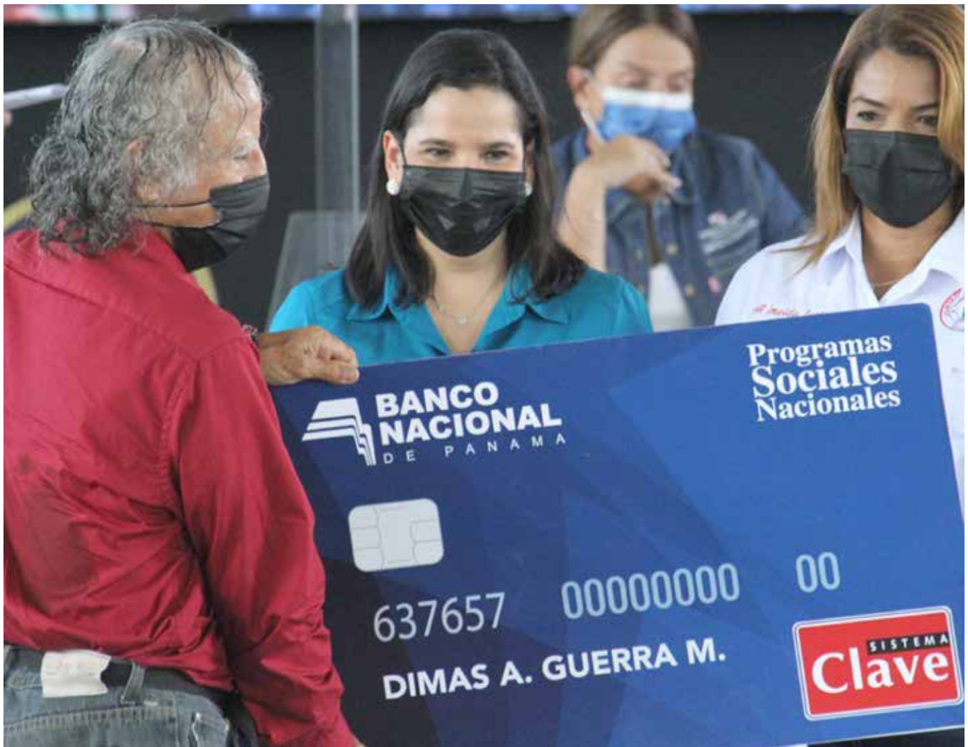
La ministra María Inés Castillo entregó tarjetas Clave Social del programa 120 a los 65, que beneficia a 2,270 adultos mayores del circuito 8-8 que no reciben jubilación.

Río Abajo y San Francisco, que forman parte del Plan Colmena, el cual busca combatir la pobreza en el país. También se entregaron insumos y equipos para el bienestar y cuidado del adulto mayor para tres casas hogar ubicadas en el área y que brindan protección a más de 100 panameños.