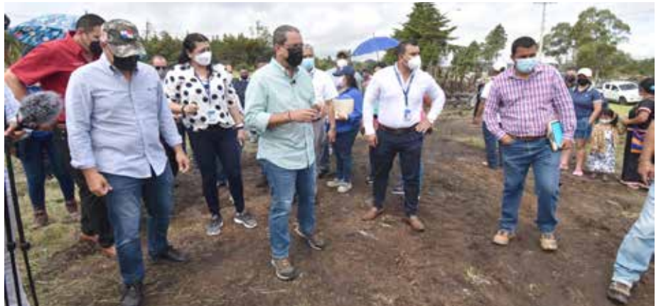
Las autoridades del Miviot, en una inspección de los terrenos del proyecto previa al acto público.