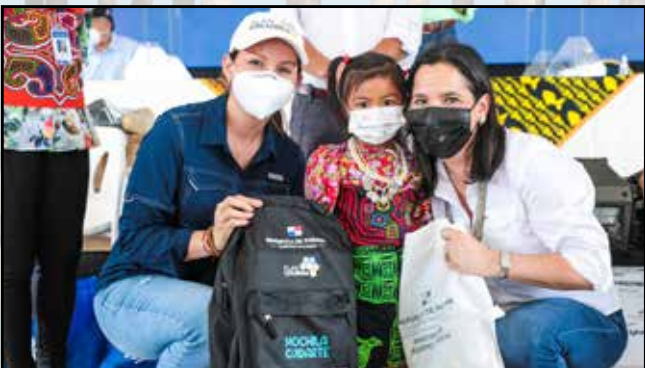
Madres de familia de la comunidad recibieron Mochilas Cuidarte y leche fortificada para sus hijos.