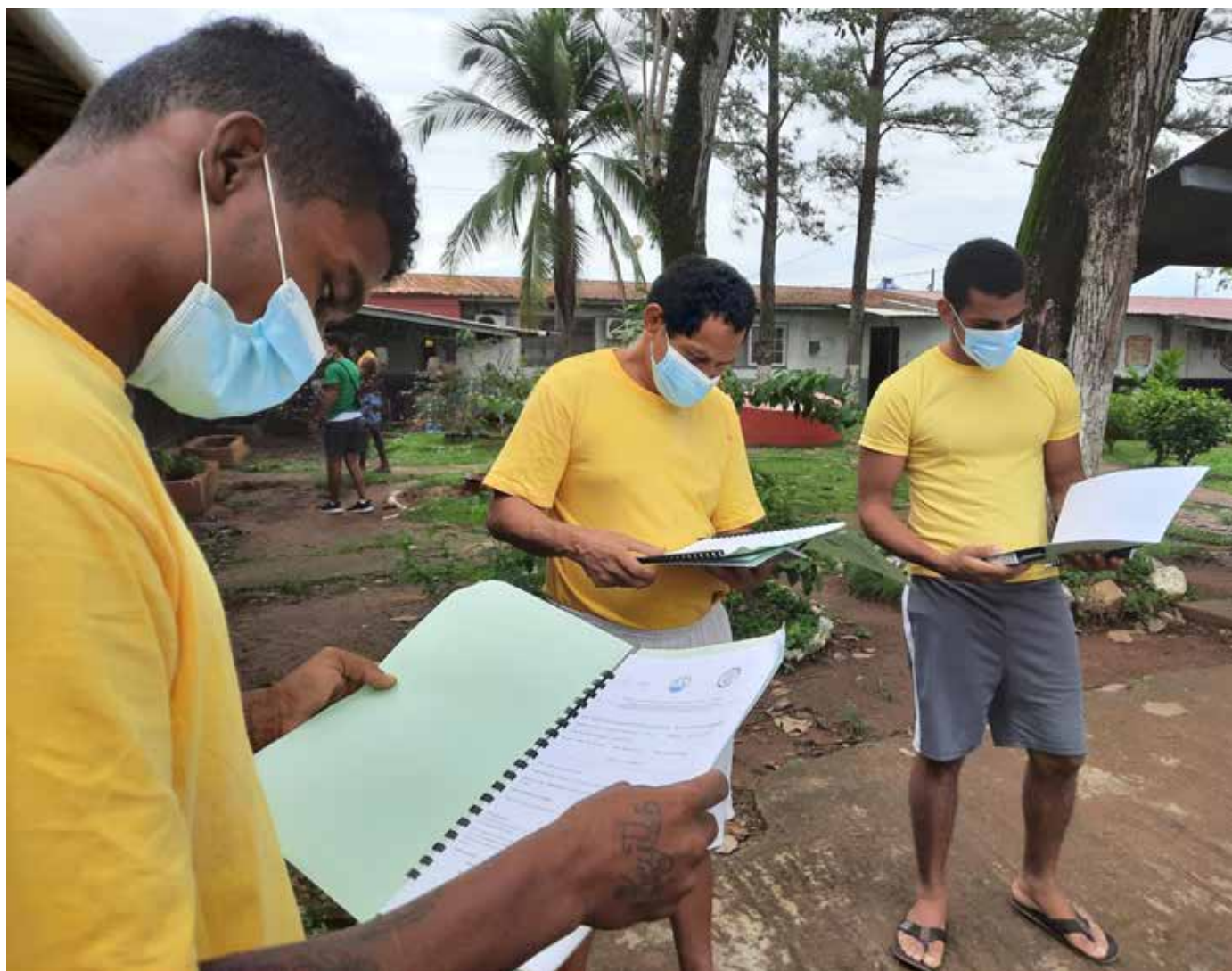
Privados de libertad reciben módulos escolares.

La matrícula aumentó de 2,726 a 3,264 privados de libertad en comparación con el año pasado.