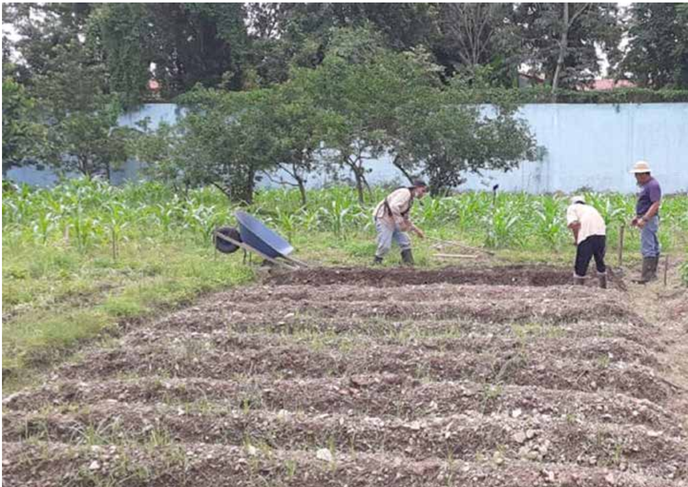
Adolescentes en conflicto con la ley trabajan en labores del huerto agroecológico.

Pimentón, tomate, repollo, espinaca, pepino, habichuela, saril, frijoles de guandú y papaya son algunos de los rubros que un grupo de jóvenes planta en el huerto agroecológico "La Bendición", en el Centro de Custodia de Arco Iris. El programa fomenta el entusiasmo por la agricultura respetando la conservación del medio ambiente y el consumo de alimentos frescos y saludables entre los adolescentes en conflicto con la ley penal. Al grupo se le ofrece capacitación en