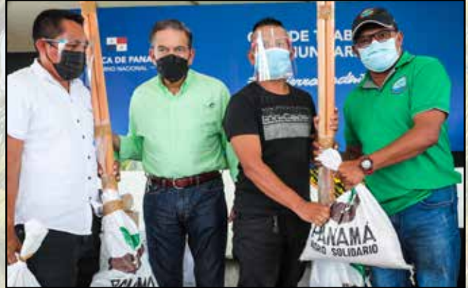
Se entregaron a residentes kits de Agro Vida para actividades agrícolas familiares.