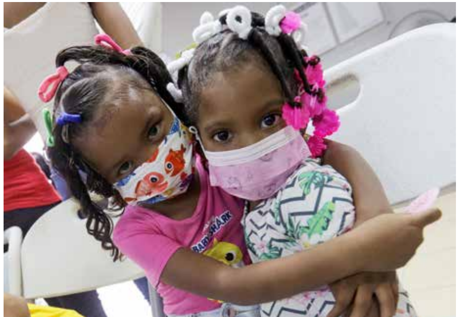
Dos niñas que visitan el Comedor Divino Niño, beneficiadas con el apoyo del Despacho de la Primera Dama.

Cumpliendo su compromiso con la niñez y la juventud panameña, la primera dama de la República, Yasmín Colón de Cortizo, realizó junto a su equipo de trabajo una visita al Comedor Divino Niño, el cual se encuentra ubicado en el corregimiento de El Chorrillo, en ciudad de Panamá. Actualmente, opera desde las instalaciones de la Unidad Preventiva Comunitaria de la Policía Nacional. Durante la visita, se hizo entrega de diversos insumos, como mochilas, kits escolares y de aseo, balones de fútbol y bolsas de comida, entre otros. Este espacio cuenta con el apoyo de la Fundación Localinpty Kids, que imparte clases de inglés a los niños que lo visitan. También, dispone de áreas de esparcimiento para fútbol y ping-pong o tenis de mesa dirigidas a los jóvenes, con el fin de evitar que permanezcan solos en las calles. Adicionalmente, la Dirección de Asistencia Social del Despacho de la Primera Dama entregó al comedor cuatro juegos Lego y dos abanicos, para que sean utilizados en las instalaciones.