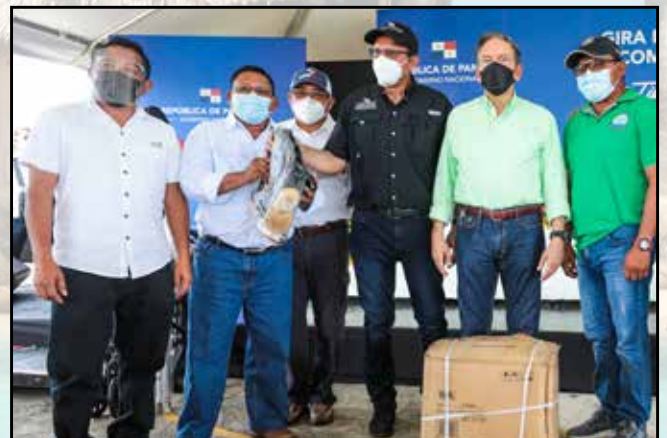
Entre niños y adultos de las diversas comunidades se entregaron 200 pares de botas de hule.