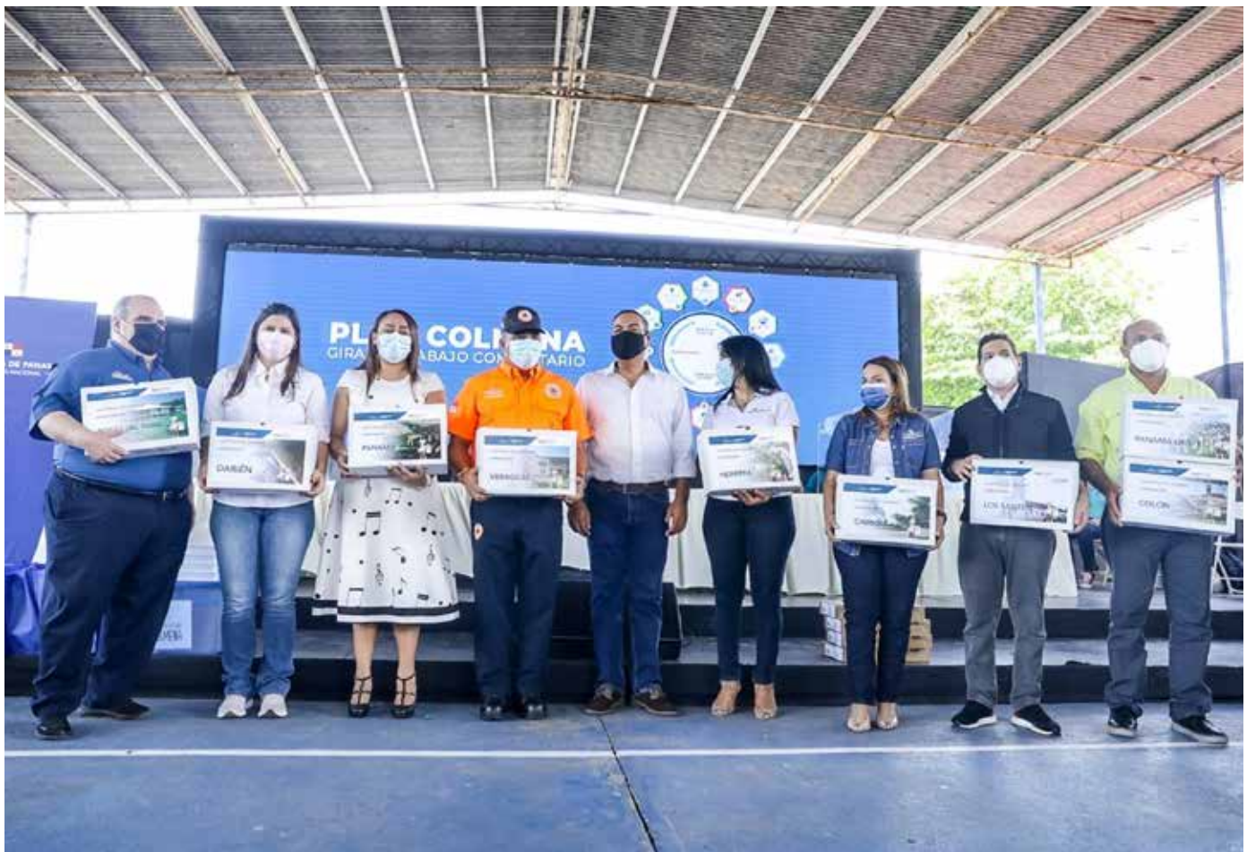
Un total de 129 centros educativos recibieron su título de propiedad.