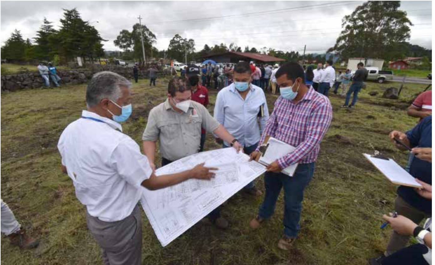
Las viviendas que se construirán estarán sobre un terreno de 450 metros cuadrados.