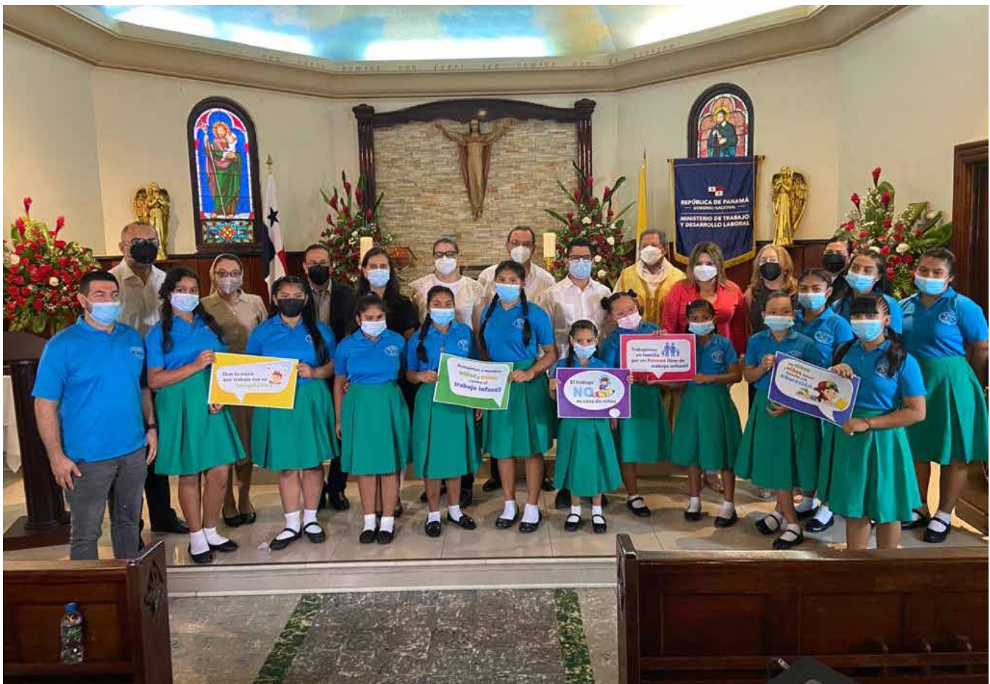
Autoridades participan de una misa y campaña de sensibilización contra el trabajo infantil.

En 2018, la OIT declaró a Panamá libre de mano de obra infantil en la producción de caña de azúcar.