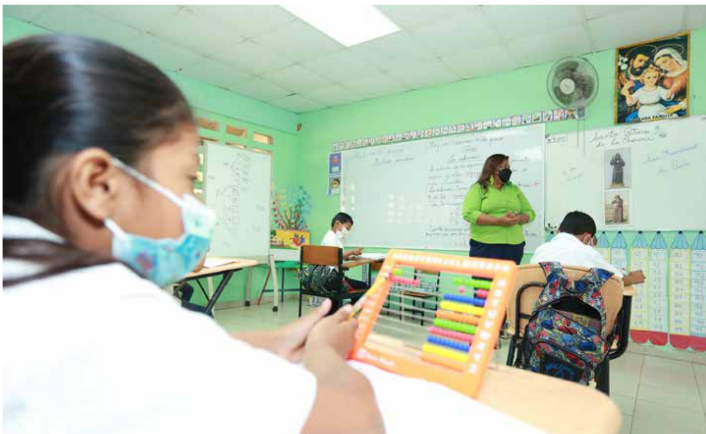
Estudiantes de la Escuela Santa Cruz, en La Chorrera, durante la reanudación de las clases semipresenciales.