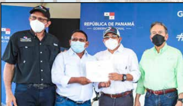
Para uso de las juntas comunales, se entregó un motor fuera de borda de 200 HP (B/. 11,556.00).