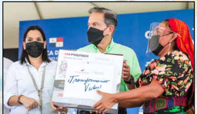
10 máquinas de coser, 10 kits de belleza, 5 cortagramas y 5 kits agropecuarios se entregaron en la comunidad de Yandub.