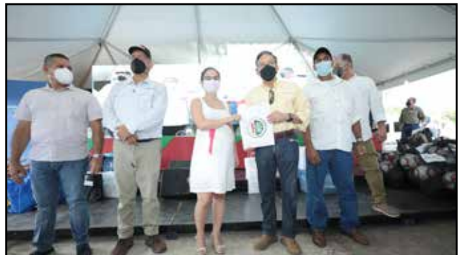
A través del Programa Panamá Agro Solidario, se otorgaron B/. 163,600.00 a productores de la región.