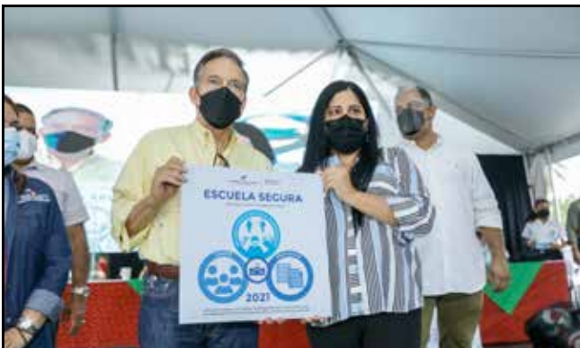
Nueve centros educativos fueron declarados "Escuela Segura", tras cumplir con las medidas de bioseguridad.