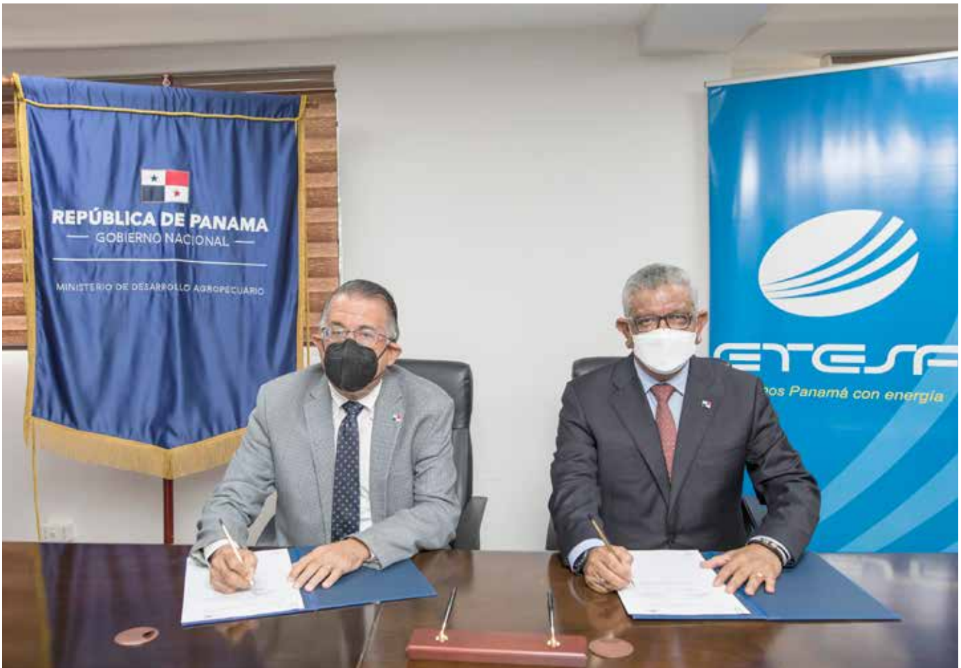
Las condiciones climáticas son fundamentales en la producción agrícola y pecuaria.