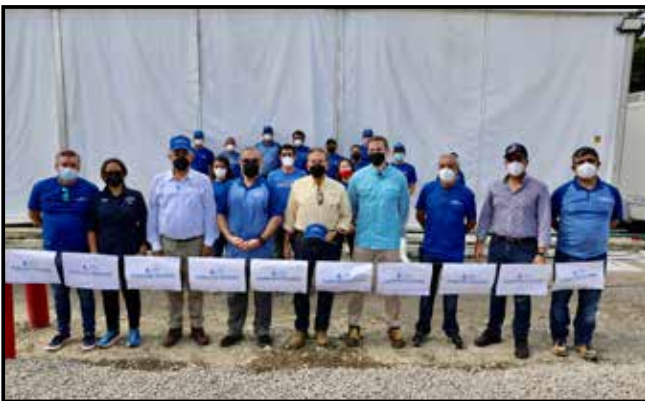
En Puerto Armuelles, se visitó las instalaciones de la empresa Forever Oceans Panamá, que invierte B/.50 millones y genera 400 empleos.