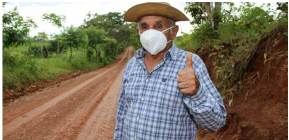
Adelantan labores de escarificación, corte y conformación de camino en el sector de Chivo-Chivo.

Más de 200 metros lineales de veredas con pasamanos y un puente peatonal fueron construidos por el Ministerio de Obras Públicas (MOP), a través de la Dirección de Asuntos Comunitarios en coordinación con la Junta Comunal del corregimiento Arnulfo Arias Madrid, para beneficiar a más de 200 familias del sector de Altos de La Torre. En el sector El Apache,