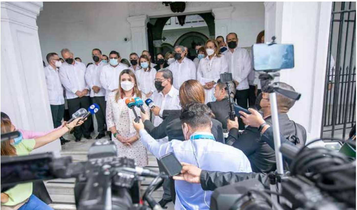
El Gabinete en pleno respaldó las acciones tomadas por el jefe del Ejecutivo durante el último año para hacerle frente a la pandemia generada por el Covid-19.

Los ministros destacaron que las principales calificadoras de riesgo, organismos internacionales y locales han establecido el crecimiento económico de Panamá, para 2022, entre 9% y 12%.