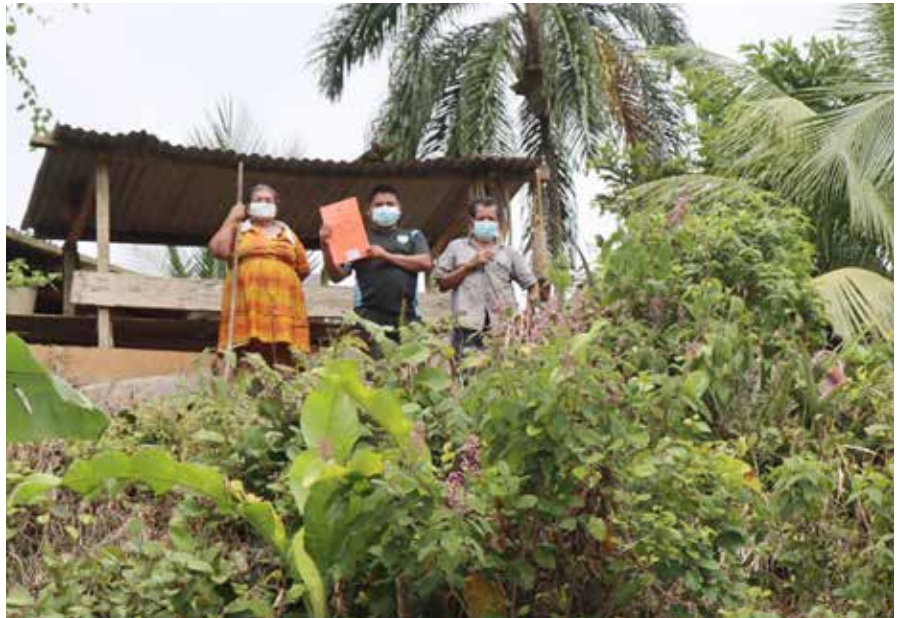
La familia Becker ha trabajado estas tierras por más de 30 años; lo que obtienen lo emplean en los estudios de Derecho de su hijo.

En esta provincia han sido beneficiadas 400 familias.