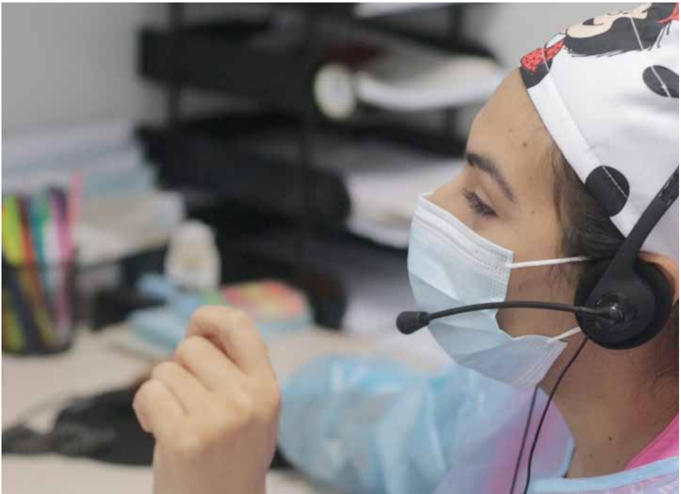
La CSS implementa la tecnología con la puesta en marcha del "Hospital Inteligente" y el "Consultorio Digital".

Con este prototipo insignia, se busca acercar los servicios a los asegurados y así evitar las aglomeraciones en los cuartos de urgencias.