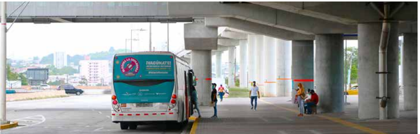
Las estaciones de Brisas del Golf, 24 de Diciembre y Nuevo Tocumen mantienen un avance de 91%.