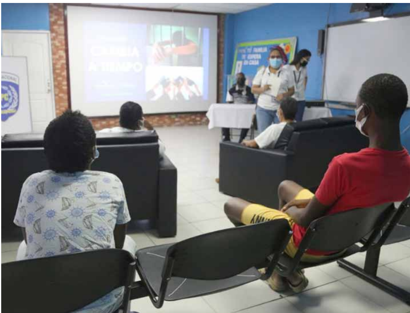
Jóvenes reciben orientación psicosocial.