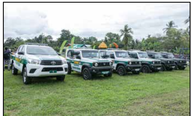
Una flota vehicular se entregó a la Brigada Occidental Vencedores de Coto, del Servicio Nacional de Fronteras.