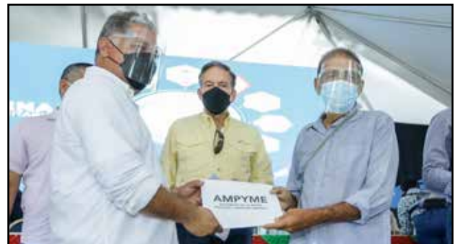
Del Programa Capital Semilla, se desembolsaron B/.20,000.00 a emprendedores para el desarrollo de su propia actividad.