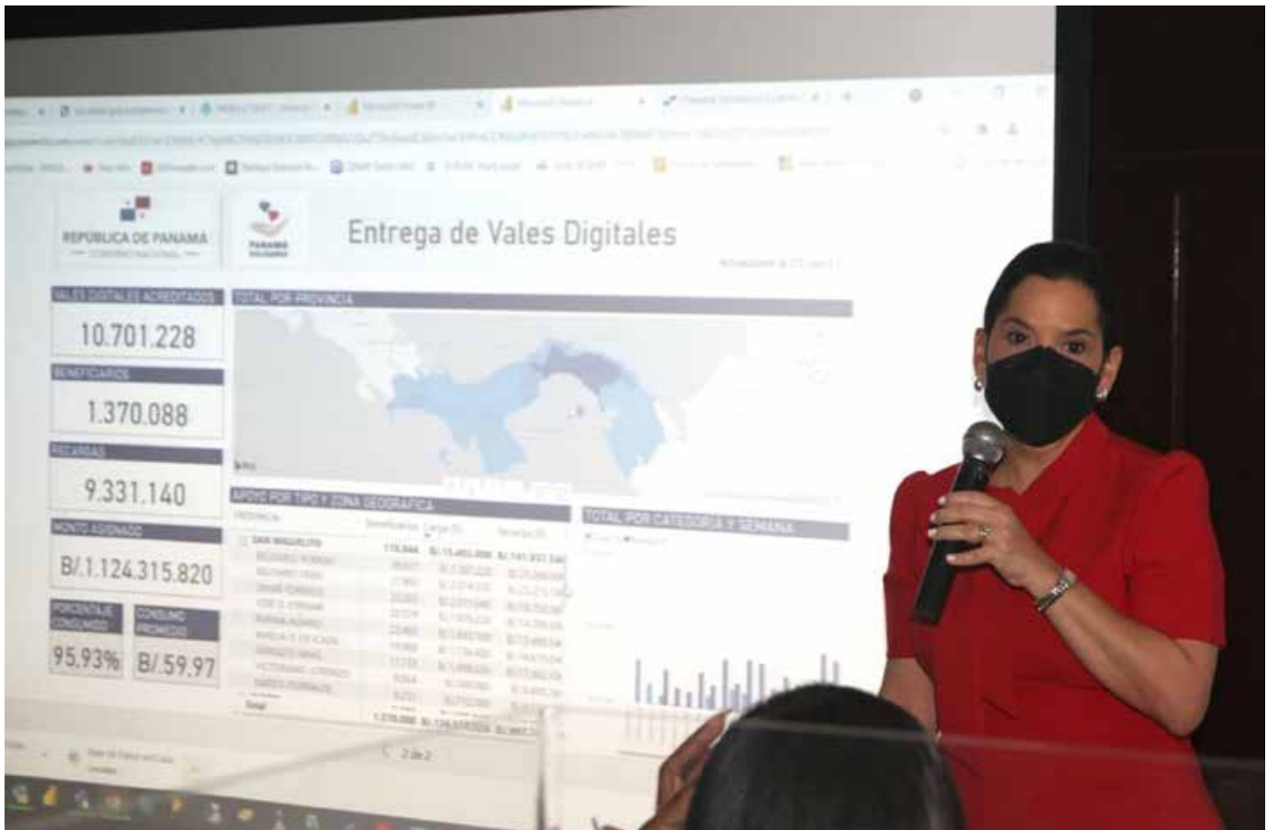
Al cierre de la reunión, se acordó realizar sesiones de trabajo, a fin de seguir preparando a los representantes en esta nueva etapa del Plan Panamá Solidario.