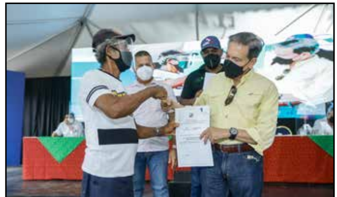
Después de esperar varios años por este beneficio, familias chiricanas ya cuentan con sus títulos de propiedad.