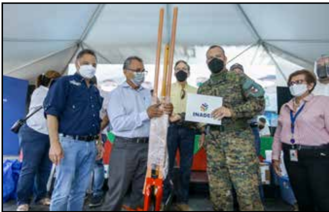
Un grupo de residentes recibió certificado de culminación de cursos y kits agropecuarios para agricultura de subsistencia.

Comunidades visitadas: Boquerón, Nuevo México, Puerto Armuelles, Baco.