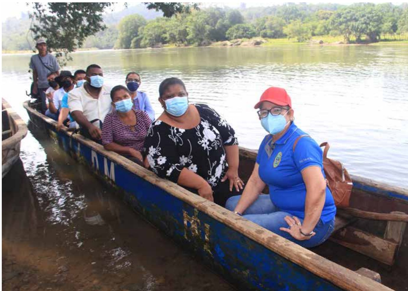
Personal del IPHE dirigiéndose hacia las áreas comarcales en una gira de inspección de centros educativos de la provincia de Bocas del Toro.

educativos que brinda el IPHE, para que el estudiante desarrolle habilidades y competencias. Se visitaron las escuelas inclusivas del distrito de Changuinola, además las escuelas Cochigró y Sursuba, de la comarca Ngäbe-Buglé; también la Escuela Bonyic, del corregimiento Teribe, en la comarca Naso Tjër Di; el Instituto Profesional y Técnico de El Silencio, así como las Escuelas Bilingües de Finca 4, 30 y 41, entre otros.