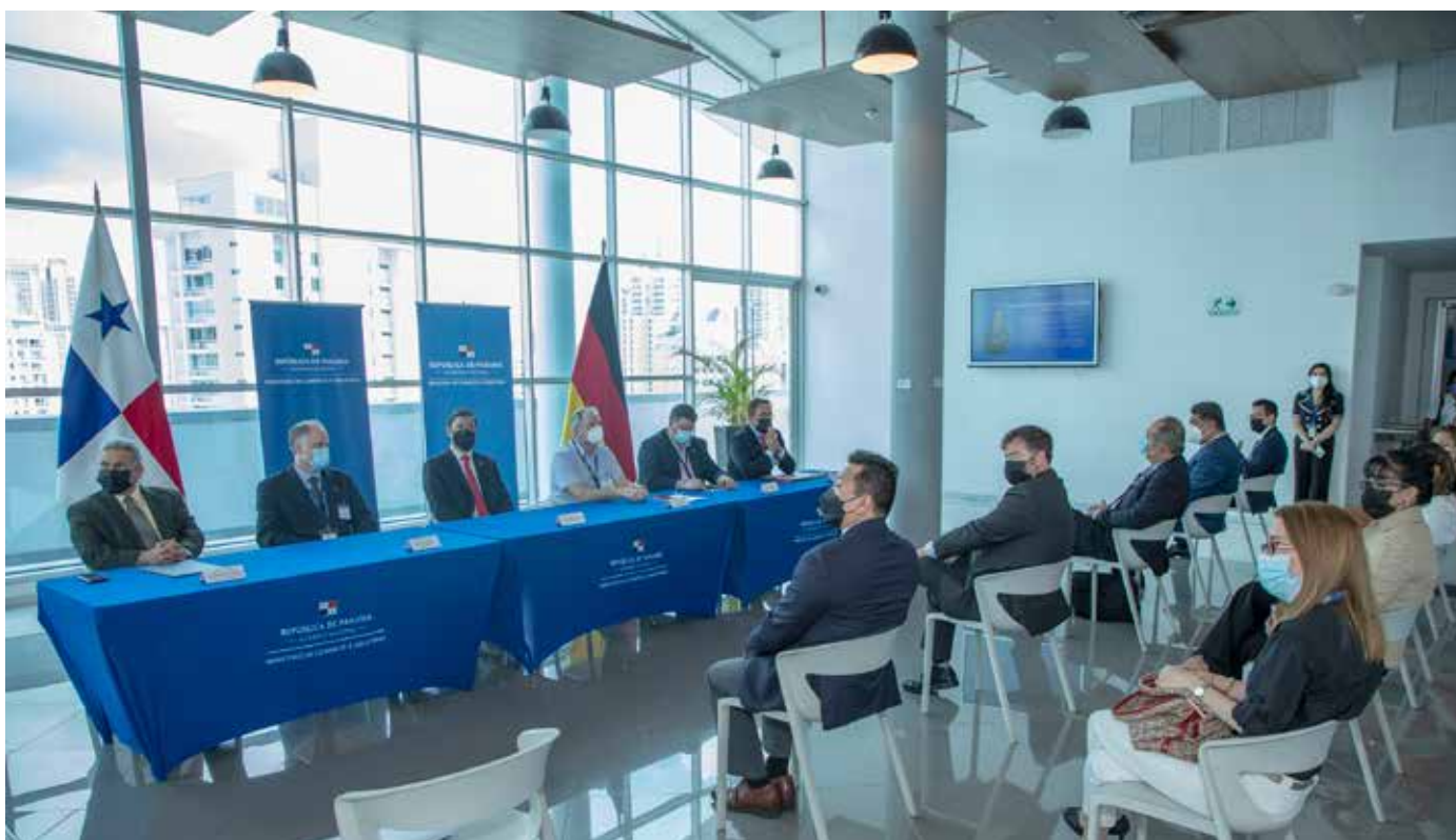
Esta actividad fue organizada por la Autoridad ProPanamá.

Empresarios germanos estuvieron una semana en el país para conocer las posibilidades de negocios.