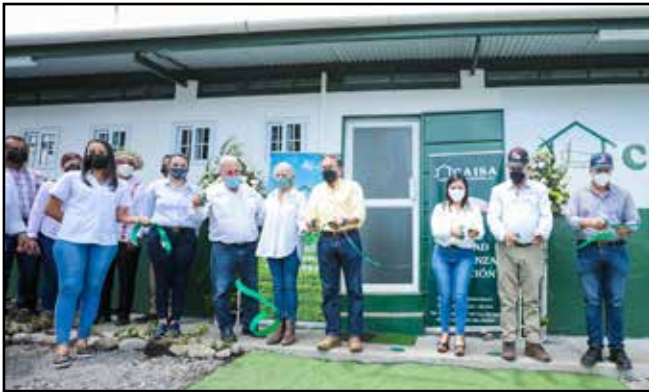
Con una inversión de B/.2.3 millones por parte de la empresa Caisa, se inauguró el nuevo matadero municipal de Boquerón.

Comunidades visitadas: Boquerón, Nuevo México, Puerto Armuelles, Baco.