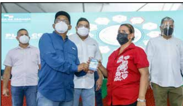
En materia de deporte y cultura, se emitieron certificados de acreditación a nuevos artesanos.