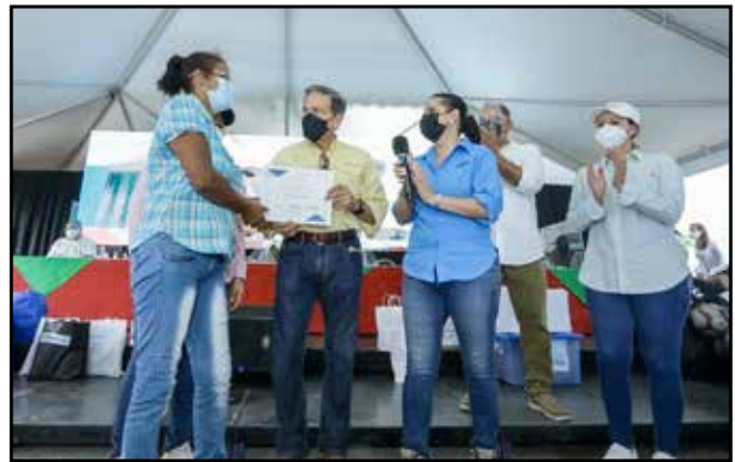
Adultos que completaron el programa de alfabetización del Mides recibieron sus certificados.