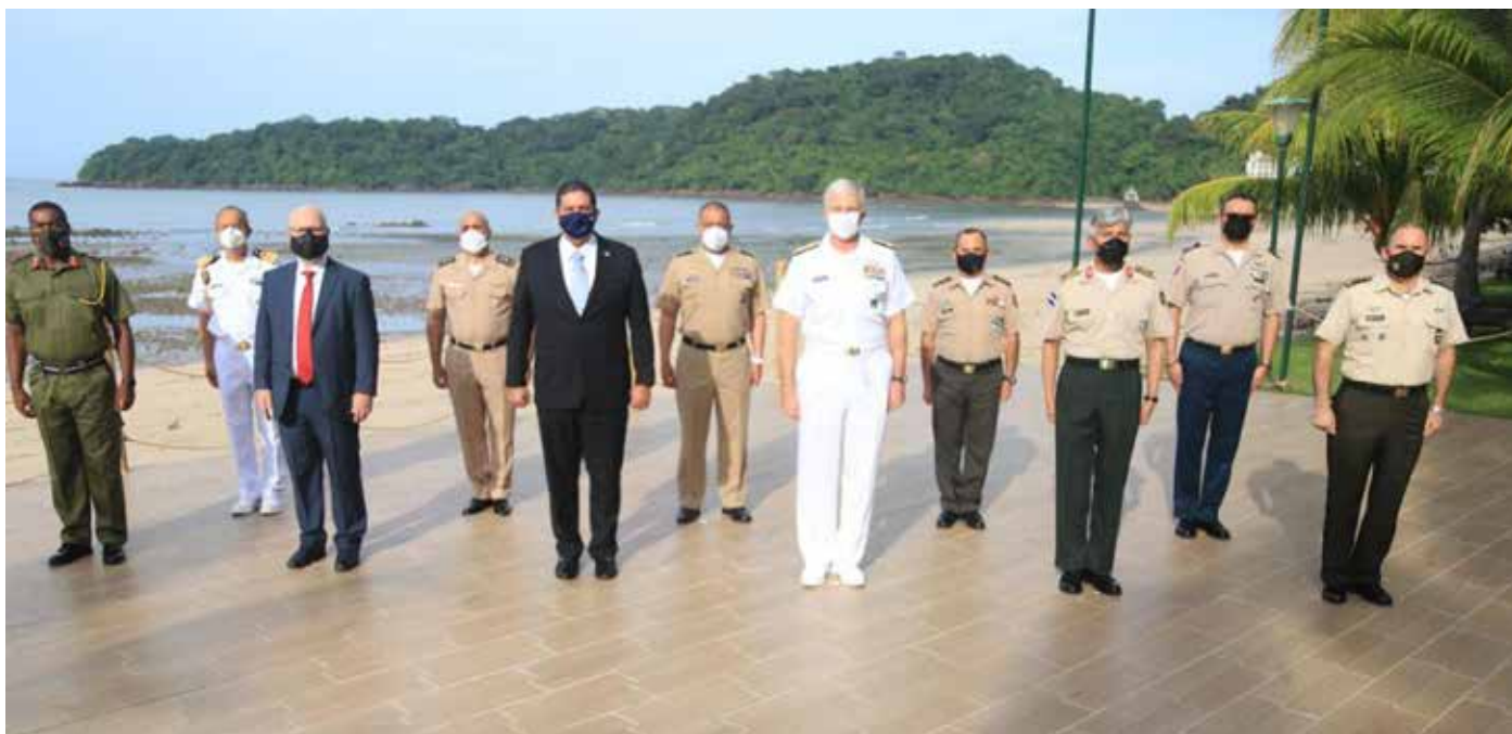
El ministro de Seguridad Pública, Juan Manuel Pino; y el jefe del Comando Sur de Estados Unidos, almirante Craig Faller, junto a las autoridades de los países participantes.

crimen organizado, así como las amenazas que impulsan la migración irregular y la respuesta regional frente a situaciones como las producidas por los huracanes Eta e Iota.