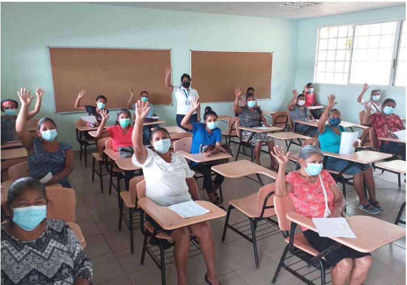
Pacientes reciben charla de salud preventiva impartida por el equipo de Proyección Social del Despacho de la Primera Dama.

La población femenina aprovechó la atención y se realizaron 71 exámenes de mamografía, 8 ultrasonidos obstétricos y 2 ultrasonidos ginecológicos.