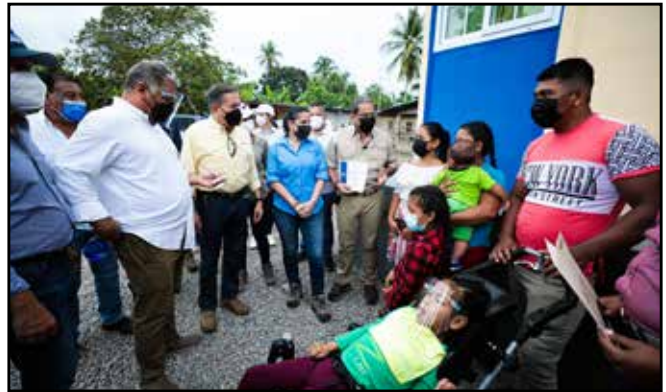
128 viviendas amuebladas recibieron las familias afectadas el año pasado por los huracanes Eta e Iota.