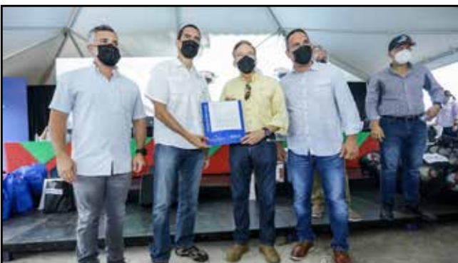
Por un monto de B/. 644,568.00, se dio la orden de proceder para el alquiler de equipo pesado.