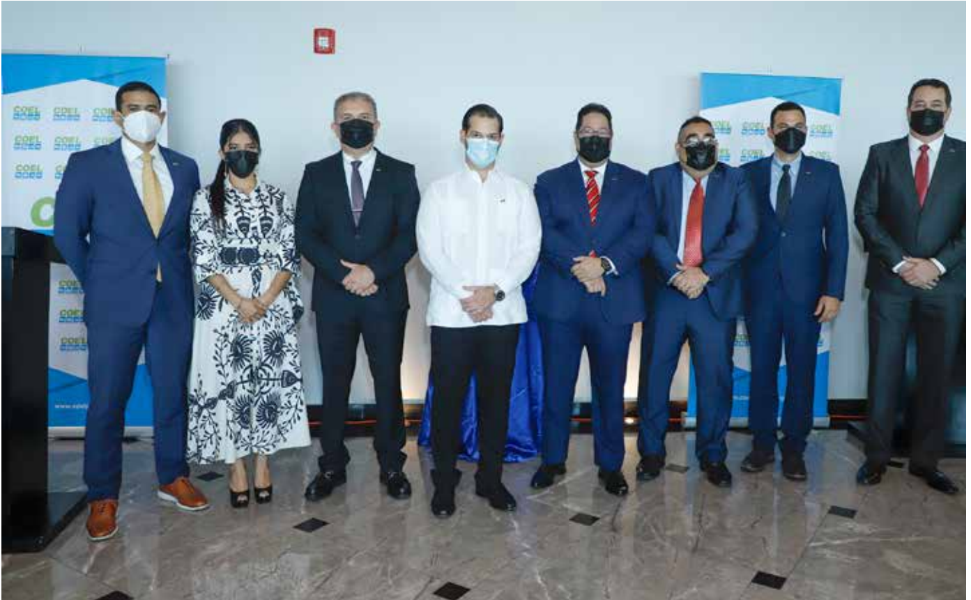
Acto de inauguración de trabajos en Agrosilos, S.A.