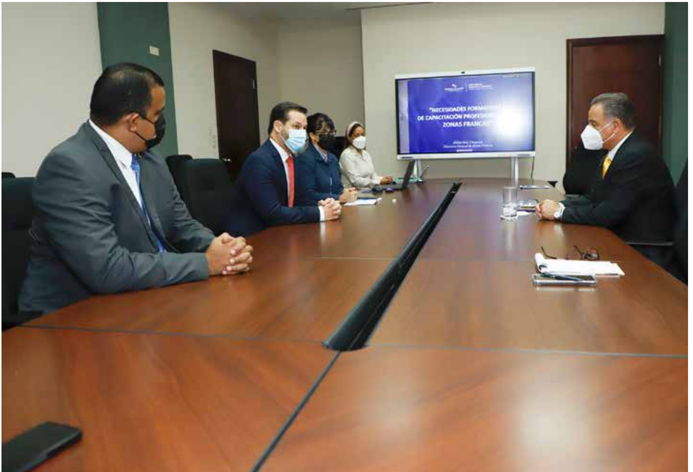
Encuentro entre autoridades del MICI y del Inadeh.