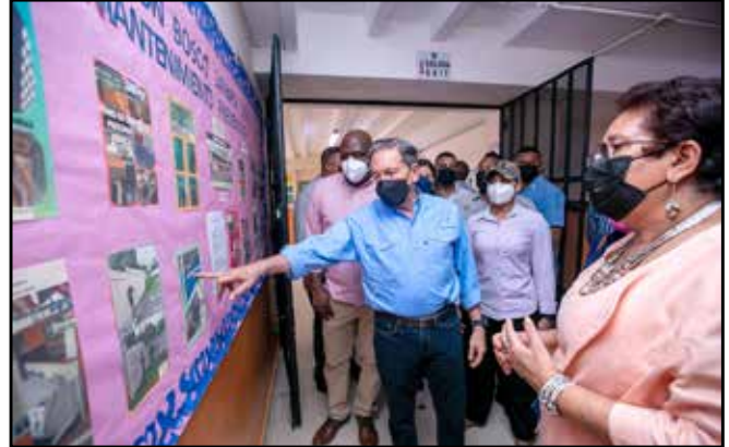
CON Escuelas realiza inversión por B/.199,800.00 en la reparación de 15 escuelas en este distrito.