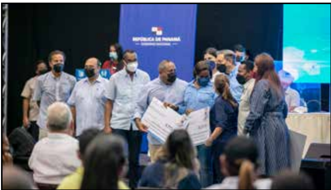
Para la instalación de tanques de reserva de agua en centros educativos, se otorgó B/.203,674.00.