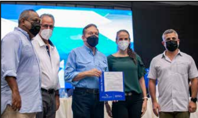
Por un monto de B/.612,024.00, se ejecutó orden de proceder para el alquiler de 9,010 horas máquina.