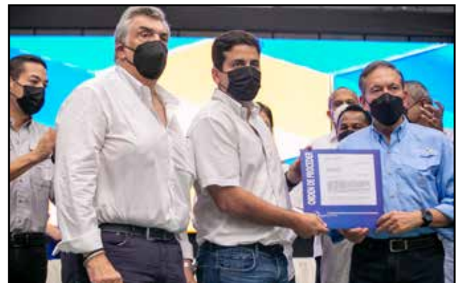
Para la construcción y rehabilitación del Gimnasio Orlando Winter, se emitió orden de proceder por B/.3,175,775.00.