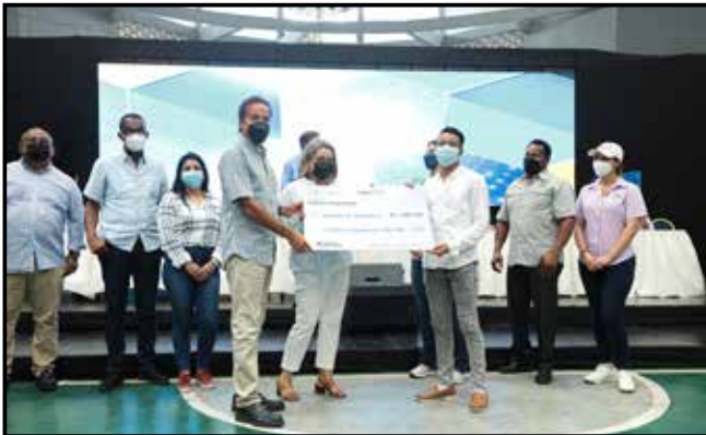
Se entregaron becas laborales a través del programa "Padrino Empresario".