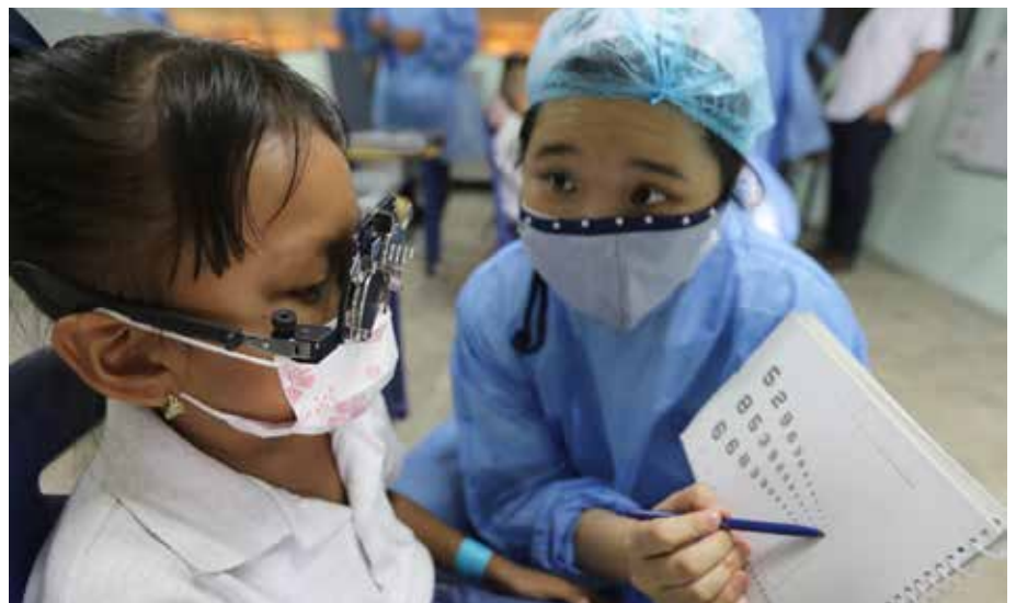
Durante 2021 se ha beneficiado a más de 700 estudiantes.