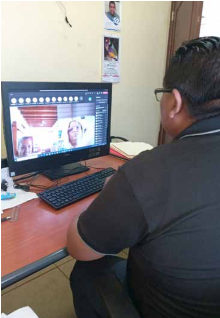
Un instructor del Mitradel comparte información sobre las tendencias laborales.