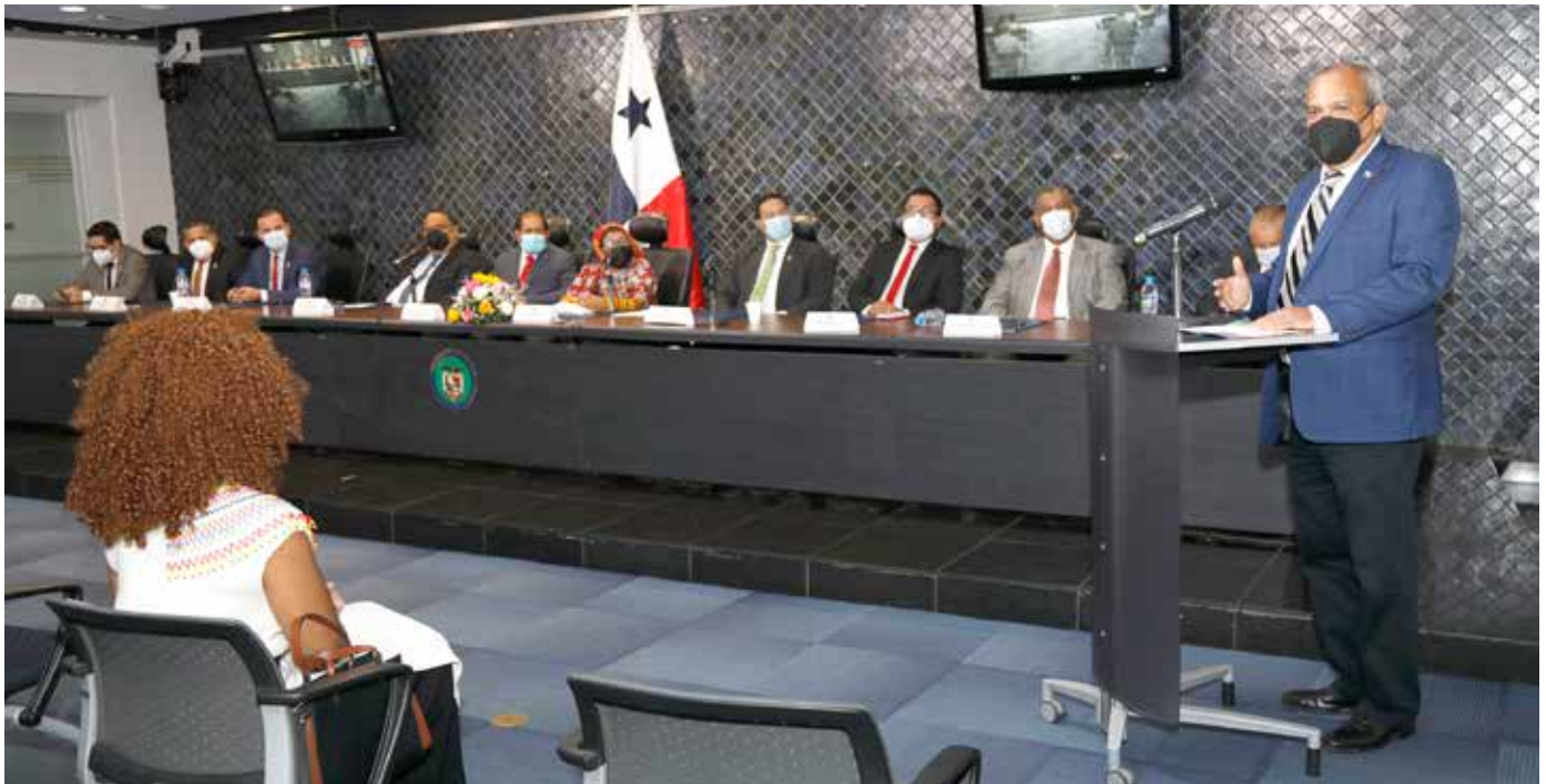
Es vital fortalecer la lucha contra el cambio climático.

hídrica. "Los efectos de los huracanes Eta e Iota han producido muchos males en el país. Jamás en la historia de Panamá se había dado un fenómeno así, ocasionado por el cambio climático. Hoy estamos sufriendo las consecuencias del mal uso de los recursos naturales", apuntó.