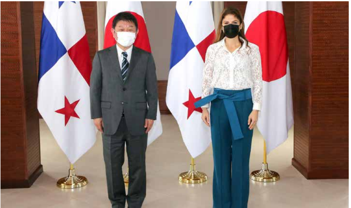
La canciller panameña, Erika Mouynes, se reunió con su homólogo japonés, Toshimitsu Motegi, en el marco de la visita oficial que realizó al país este 17 de julio.

económica y alineada a la estrategia para la reactivación pospandemia. En materia de cooperación internacional, otro eje importante de la Cancillería, se reconocieron los valiosos aportes del Gobierno de Japón para la lucha contra el Covid-19, entre ellos, la donación de $230,000 para la compra de insumos médicos contra el Covid-19 y el aporte al Programa de Desarrollo Económico y Social 2020, por $5.5 millones, para equipo médico, además del interés de Japón en apoyar a los países a obtener mayor número de vacunas. También se expusieron los beneficios sociales que traerá la Línea 3 del Metro, proyecto que se construirá con un financiamiento del Gobierno de Japón por $2,800 millones, a través de la Agencia Japonesa de Cooperación (JICA).