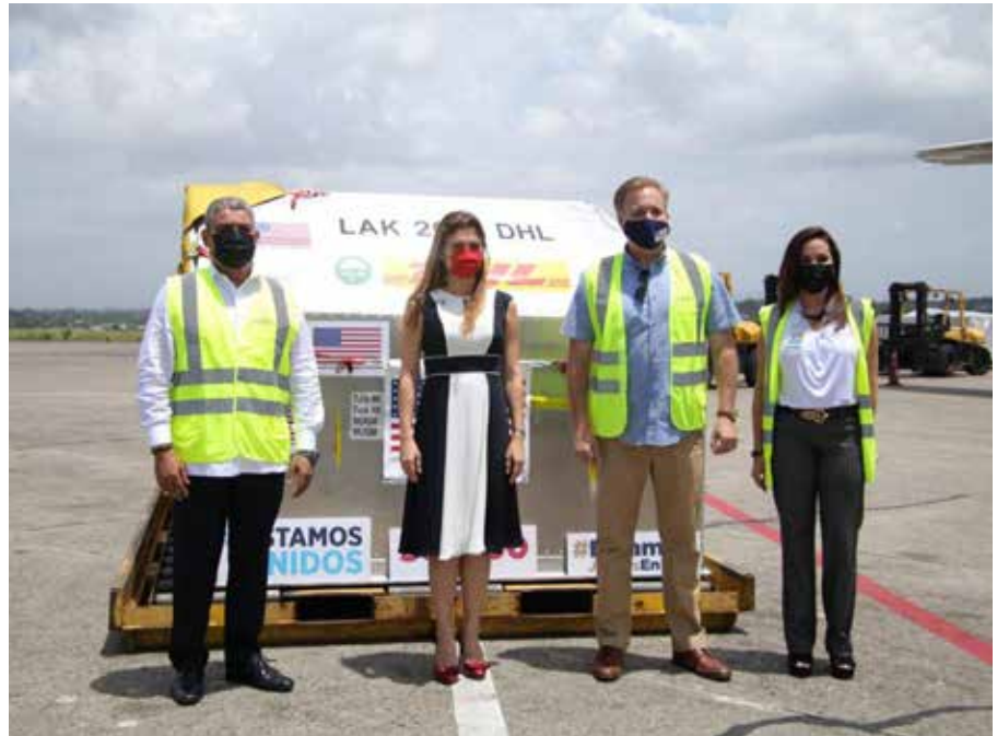
En representación del Gobierno Nacional, la ministra de Relaciones Exteriores, Erika Mouynes; y el ministro de Salud, Luis Francisco Sucre, recibieron de parte de Stewart Tuttle, jefe de misión interino de la Embajada de Estados Unidos en Panamá, esta donación de más de medio millón de dosis de vacunas que fortalece los lazos de cooperación, solidaridad y hermandad entre ambas naciones.