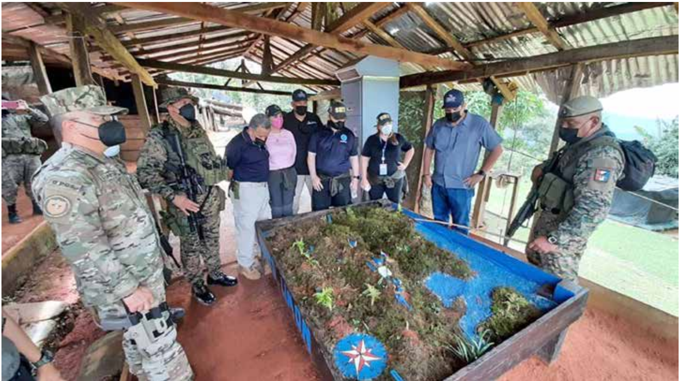
Unidades del Senafront explican a las autoridades los puntos de vigilancia en la frontera de Darién.