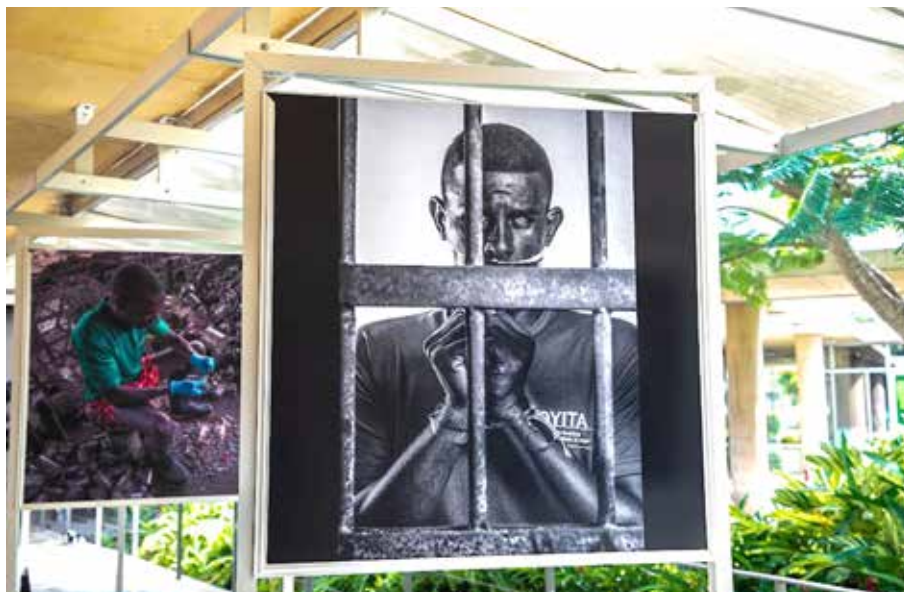
En La Plaza de Ciudad del Saber se exhibió una veintena de imágenes tomadas a participantes de los programas “Ecosólidos” y “Sembrando Paz”.