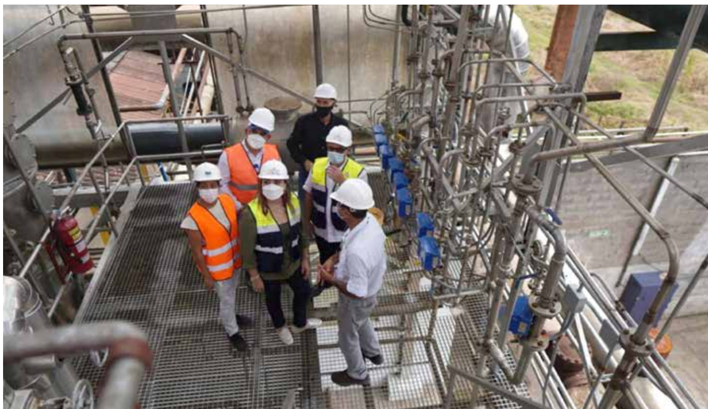
La ministra de Trabajo, Doris Zapata, visita una industria en Herrera.

Para resguardar la seguridad de los trabajadores, empleadores y clientes, el Ministerio de Trabajo y Desarrollo Laboral (Mitradel) hizo un recorrido para verificar el cumplimiento de los protocolos de salud y las medidas de seguridad en la empresa Alcoholes del Istmo, S.A., ubicada en la Zona Franca de Las Cabras en Pesé, provincia de Herrera. "Hemos avanzado en la reapertura de las actividades, esto es parte de la estrategia de reactivación económica que se ha planteado el Gobierno Nacional articuladamente con otras instituciones para garantizar no solo el impacto en la mano de obra, sino el empleo en el país en estos momentos de pandemia", señaló la titular del Mitradel, Doris Zapata Acevedo. A la fecha, el Mitradel