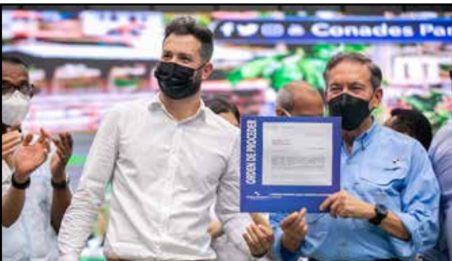
Por un monto de B/.2,097,135.00, se otorgó orden de proceder para la construcción y equipamiento del estadio de fútbol Bernardo "Candela" Gil.