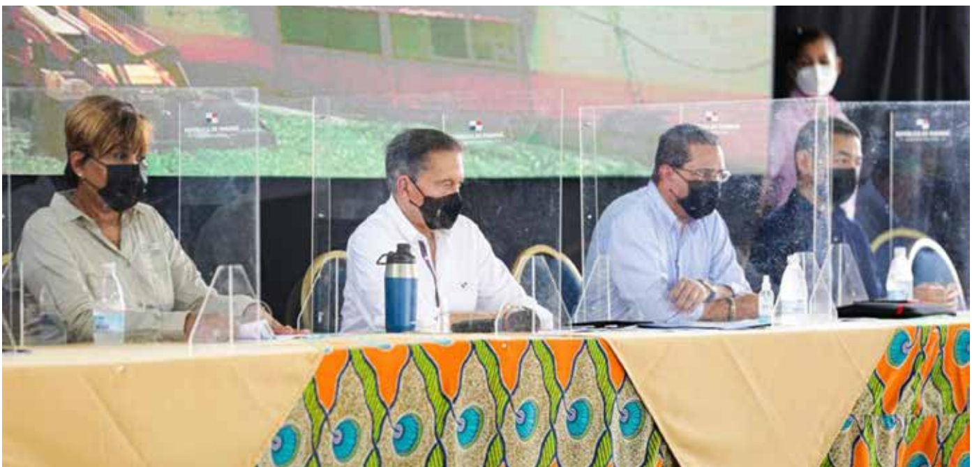
En Colón se invertirán B/.19.3 millones en la rehabilitación de 65 edificios de viviendas plurifamiliares.