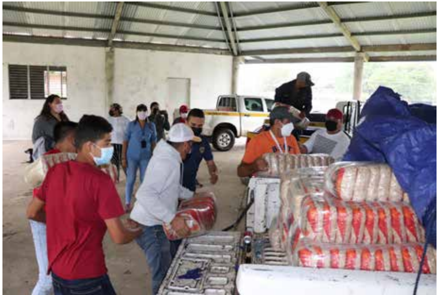
La ayuda es para las familias afectadas por la pandemia.

Desde inicios del mes de julio hasta la fecha se han entregado 24,500 paquetes de arroz en los 49 corregimientos, a través de las juntas comunales.