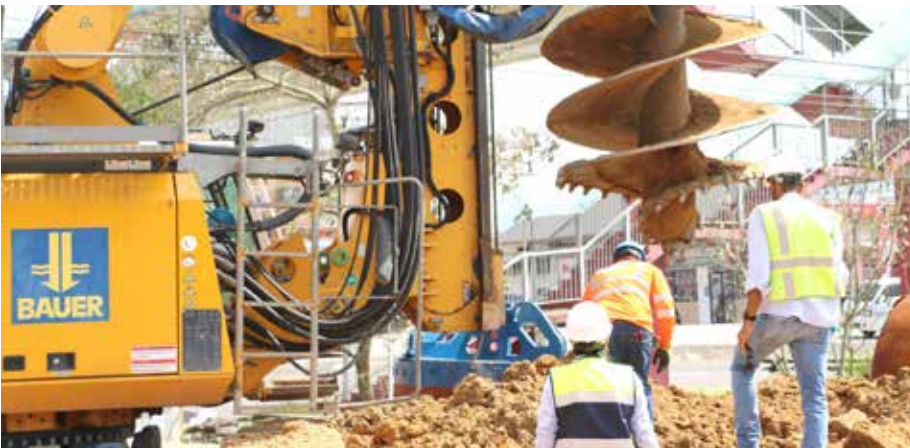
Estas pruebas definen la capacidad del terreno para soportar los pilotes o fundaciones del viaducto.

mano de obra de este megaproyecto estará a cargo de panameños, muchos de ellos con experiencia en la construcción de las Líneas 1 y 2 del Metro de Panamá. “Nos enorgullece que ingenieros jóvenes panameños que participaron en la construcción de las Líneas 1 y 2 del Metro, el primer Metro de Centroamérica, estén a cargo de esta importante megaobra. Nos comprometemos a continuar apoyando al desarrollo del país y brindar oportunidad laboral en este novedoso sistema de transporte”, manifestó Ortega.