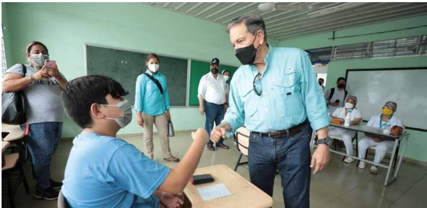
Este jueves, el presidente realizó un recorrido por varios centros de vacunación en las provincias de Veraguas, Coclé y Herrera.