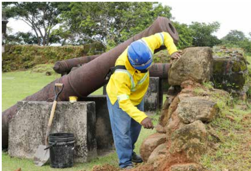
También se realizan obras generales de conservación en cinco sectores, entre ellos el adarve, hornabeque, patio de armas y el foso.