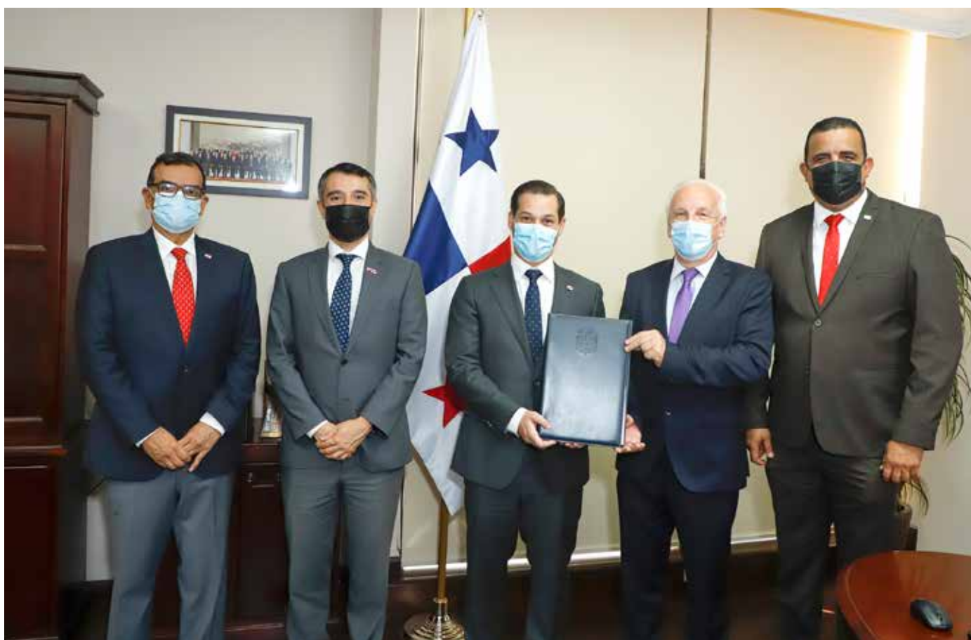
Equipo ministerial de Panamá y Chile, durante la firma del memorando de entendimiento.

El Gobierno Nacional promueve una industria minera sostenible y responsable.