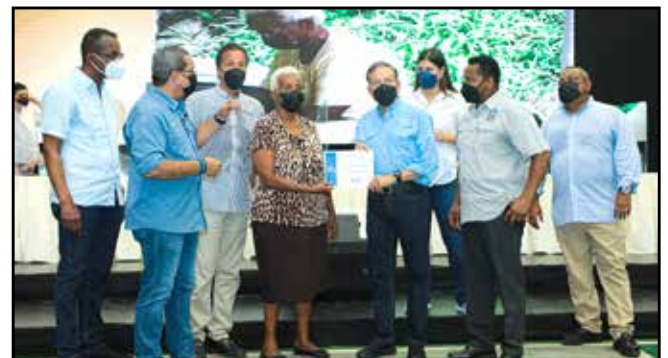
20 familias del área fueron beneficiadas con la entrega de viviendas.