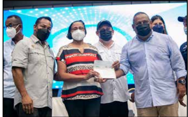
Empleados de la Caja de Seguro Social recibieron el pago de sus aportaciones.