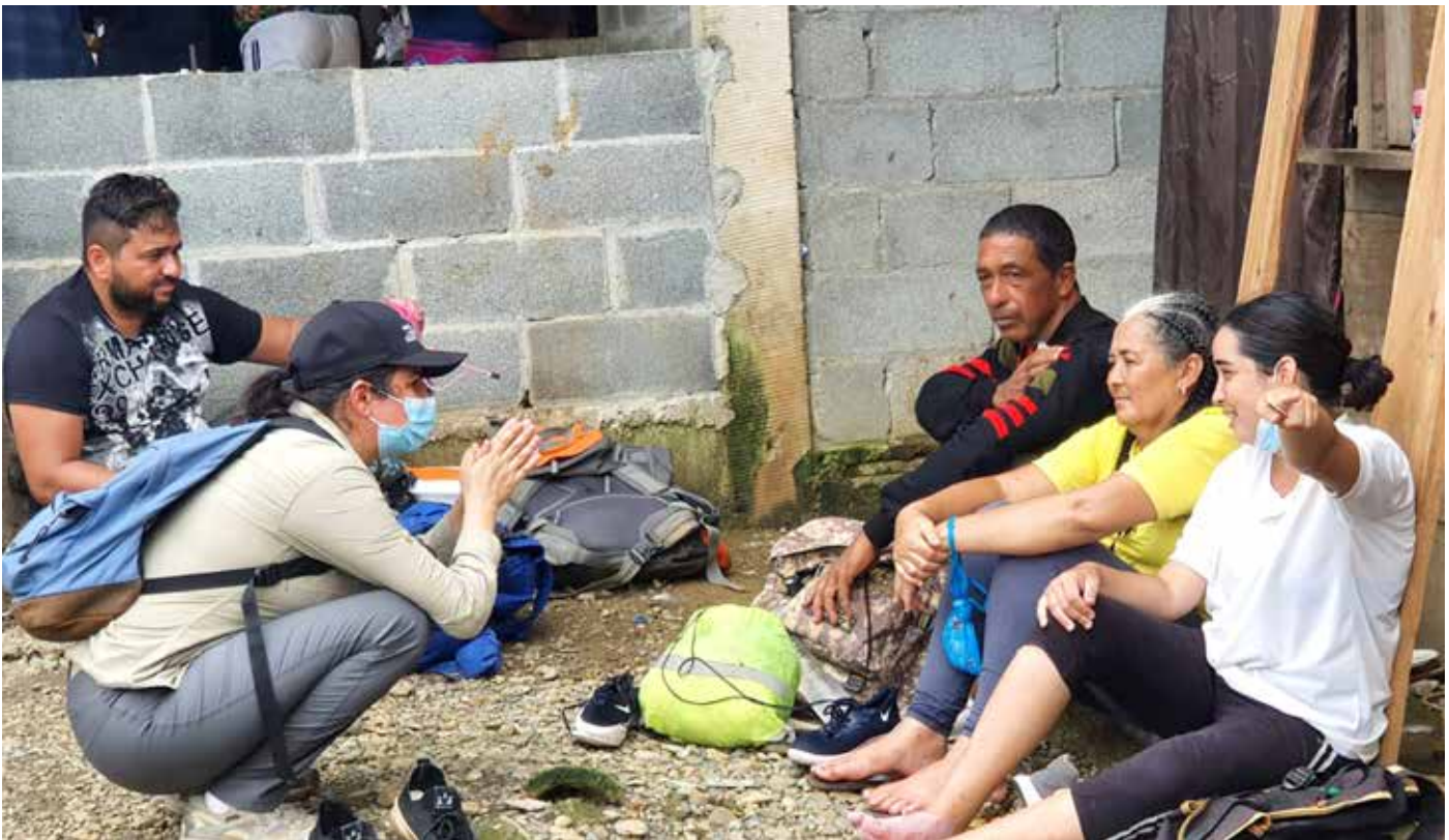
La vicecanciller conversa con migrantes en la provincia de Darién

oportuna, a fin de evitar que escale a una crisis humanitaria. Este enfoque cobra mayor relevancia en estos momentos, cuando por razón de la pandemia es particularmente sensible el control biosanitario. La cancillería panameña busca la colaboración de todas las naciones de la región involucradas, de manera que se pueda atender de una forma integral esta problemática regional. Entre tanto, el Estado cumple con la atención de los migrantes en materia de salud, alimentación y alojamiento temporal.