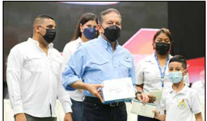
De los diferentes programas educativos, se dieron becas, tabletas y laptops a estudiantes.