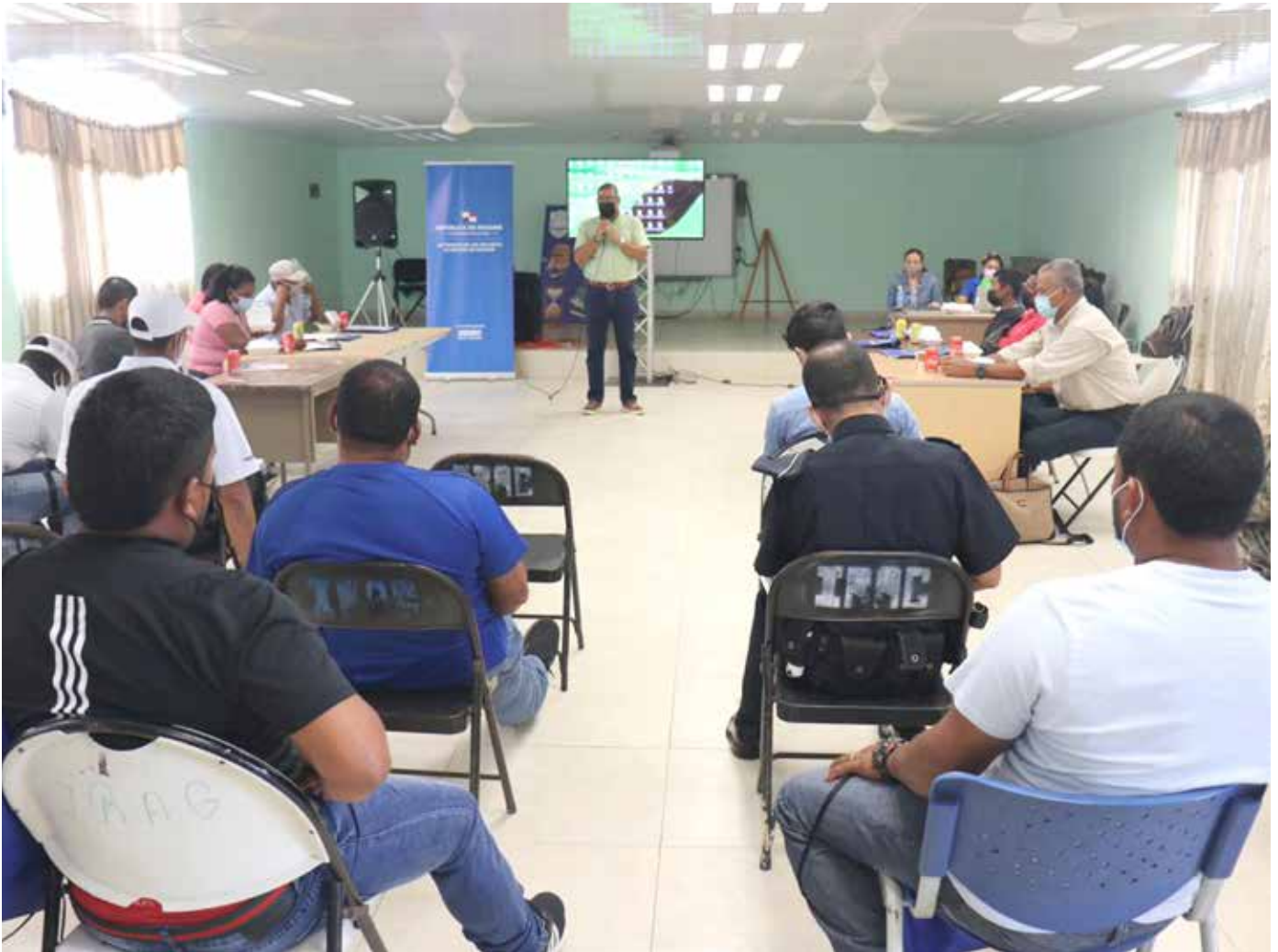
Pescadores colonenses aportan valiosas recomendaciones.