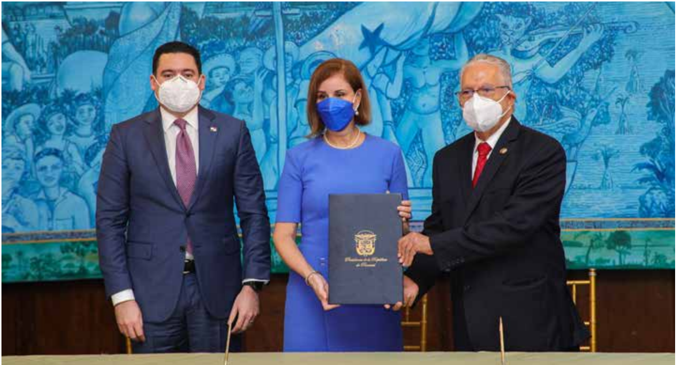
La primera dama fue testigo de honor del acuerdo de cooperación que garantiza la continuidad del programa.