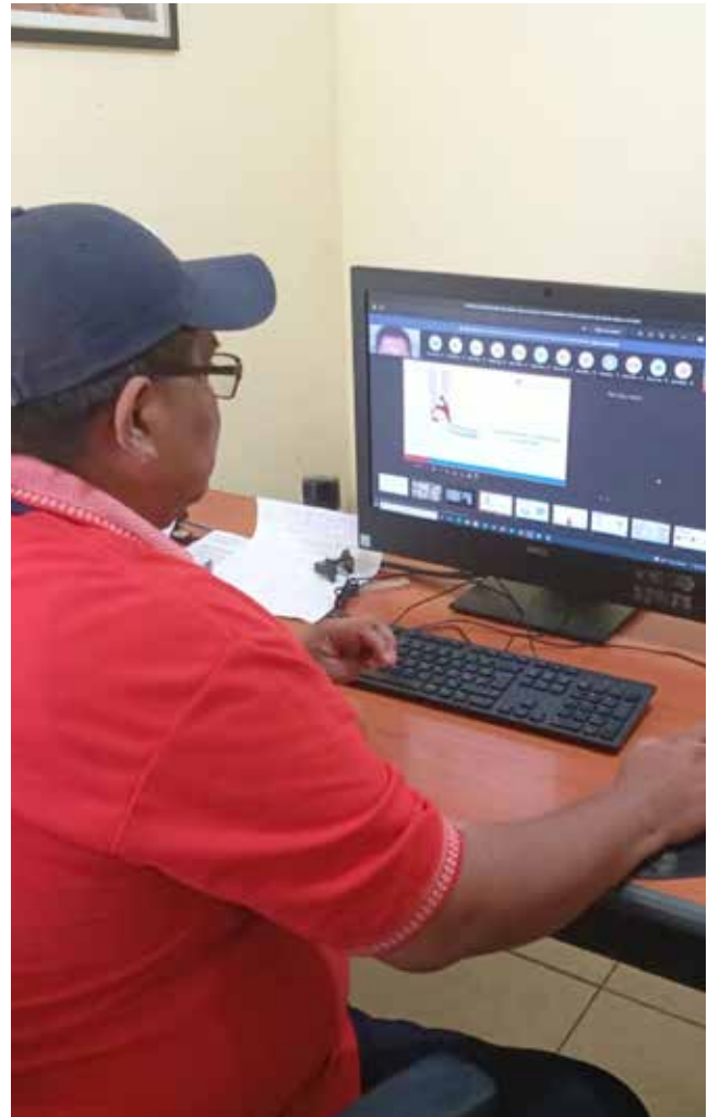
"Orienta Panamá" está dirigido a estudiantes de secundaria.

En Bocas del Toro, 224 estudiantes del IPT El Silencio y de la Escuela Rogelio Josué Ibarra recibieron orientación de manera virtual por parte de funcionarios de la Dirección Regional del Ministerio de Trabajo y Desarrollo Laboral (Mitradel) sobre las preferencias del mercado laboral en Panamá.