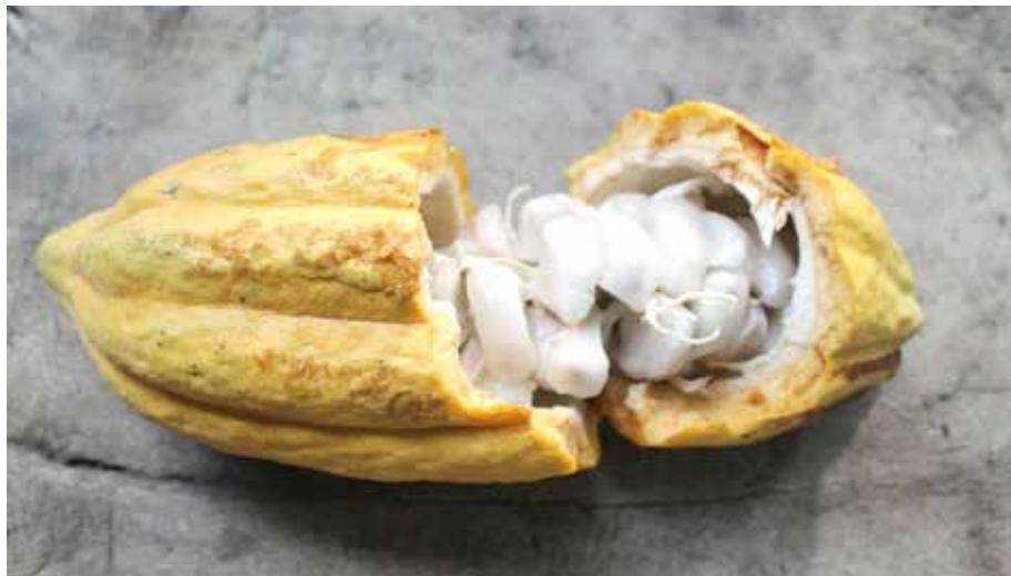
Bocas del Toro y la comarca Ngäbe Buglé son las principales regiones productoras de cacao en Panamá.