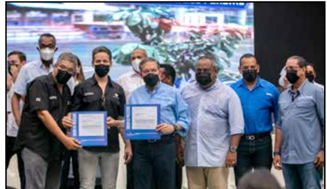
Se entregaron órdenes de proceder por B/.5,867,155 para la rehabilitación de edificios del programa "Recuperando Mi Barrio".