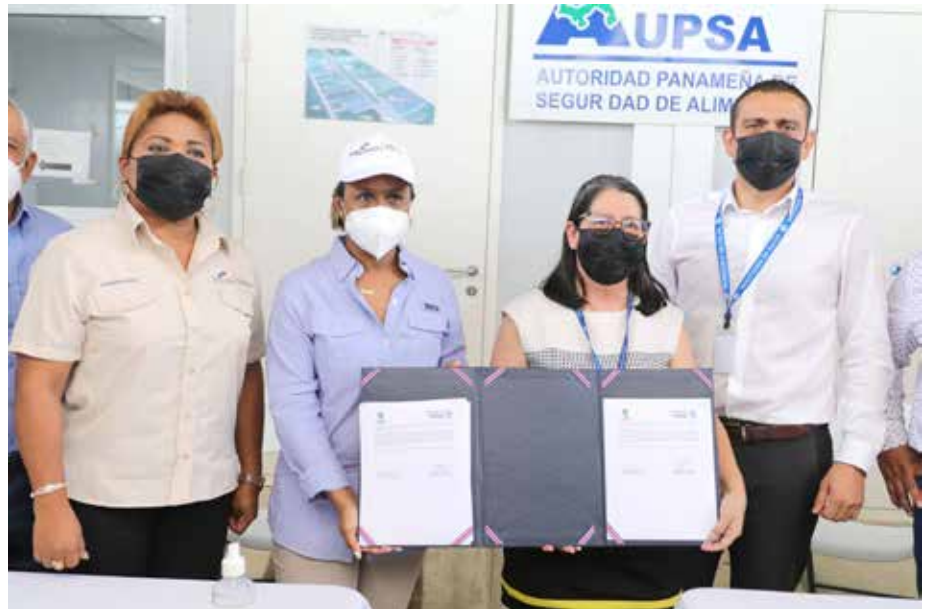
El convenio fortalece la hermandad entre ambas naciones.