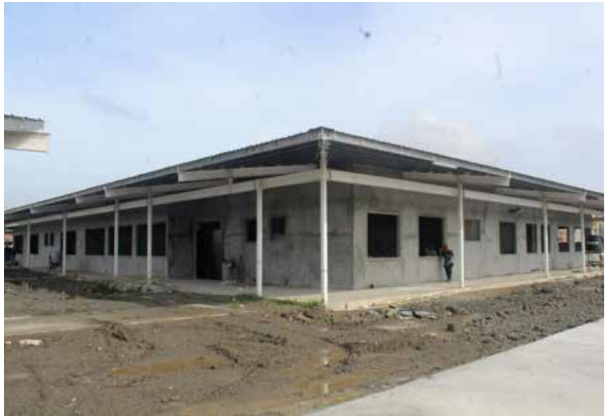
Entre los planteles que se construyen destacan: el Centro de Formación Integral Los Lagos y los centros de educación básica general El Jiral y Nuevo San Juan.

Para reactivar la economía, se utiliza mano de obra de más de 200 obreros del área.