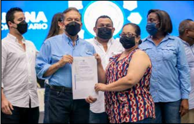
El programa "Tu Casa, Tu Oportunidad" otorgó a varios residentes las escrituras públicas de sus casas.

Los Andes N°2, Amelia Denis de Icaza, Belisario Porras y Mateo Iturralde.