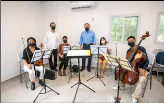
Se inauguró la Casa Cultural de San Miguelito, una obra anhelada por la comunidad.

Comunidades visitadas: Los Andes N°2, Amelia Denis de Icaza, Belisario Porras y Mateo Iturralde.