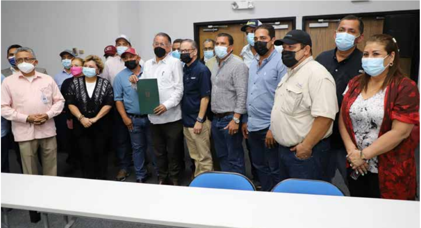
Se logró un acuerdo entre el sector arrocero y el Gobierno Nacional.