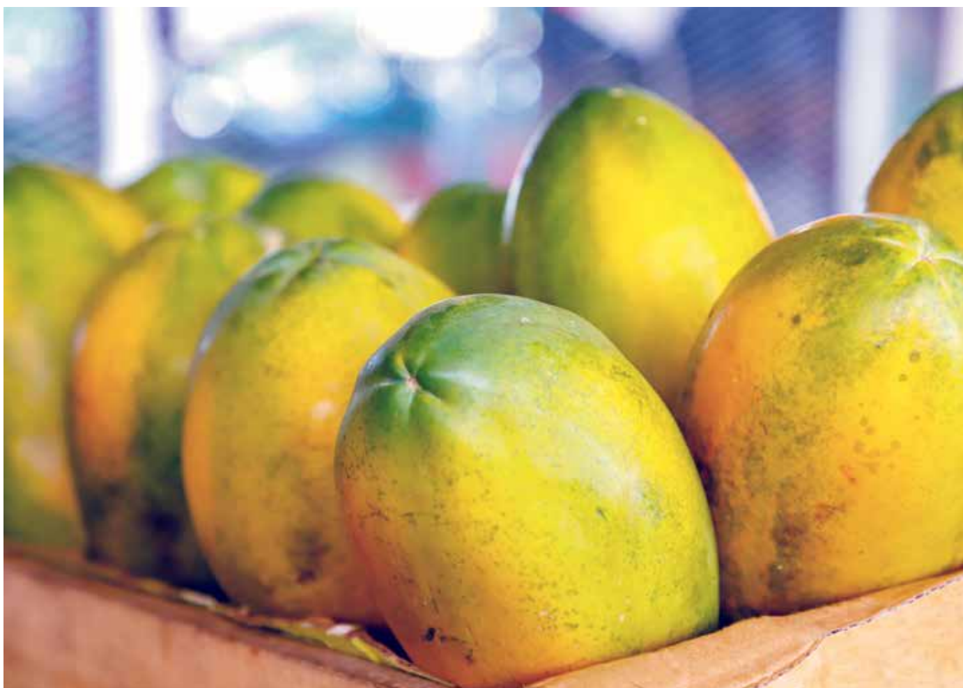
Papaya empacada para exportación.

Entre enero y junio las exportaciones de papaya crecieron un 41% frente al mismo periodo del año anterior, alcanzando B/.448,402. El 83% se envía a EE.UU., el 14% a Canadá y el resto a Europa.