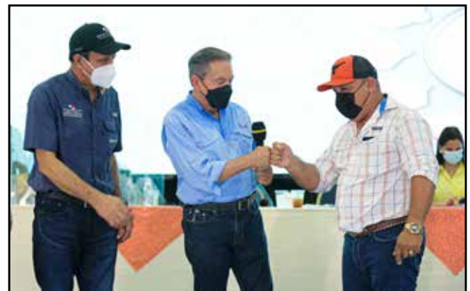
Del programa Transformando Vidas, se suministró un tractor para la Junta Comunal de Aromillo, por un valor de B/.176,550.00.