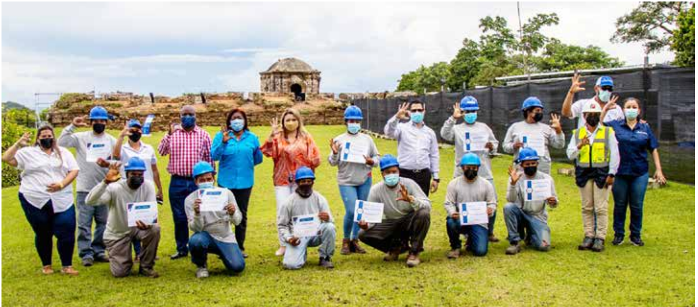
Los colonenses trabajan en rehabilitación de Castillo de San Lorenzo.