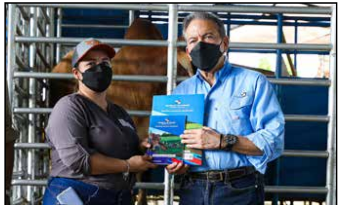
Toros de la raza Brahman, del Programa Un Mejor Semental, y bolsas de semillas de pasto mejorado, fueron entregados a productores de la provincia.