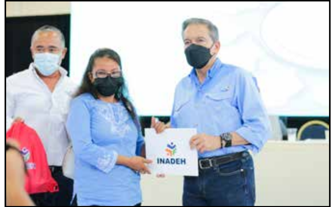
10 certificados de culminación de curso fueron otorgados, los cuales se suman a los 2,534 que se han expedido este año en la región.