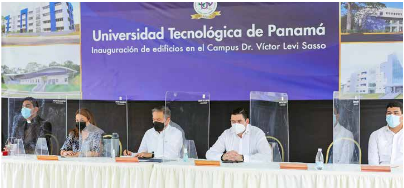
Este centro del conocimiento, que figura entre las mil mejores universidades del mundo, según QS World University Rankings, cumple 40 años de fundación.