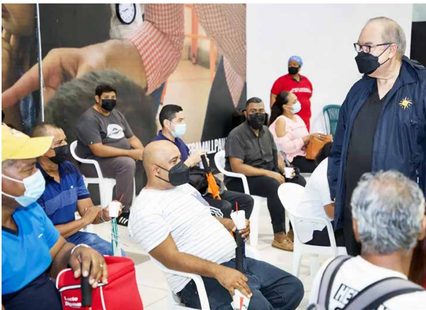
El director de la entidad visitó varios centros de vacunación, entre ellos Megamall, ubicado en el corregimiento 24 de Diciembre.

inmunizar a la población, al afirmar que están a disposición en nuestro país, tanto para nacionales como para extranjeros residentes en Panamá, dos vacunas aprobadas por organismos internacionales que denotan eficacia y seguridad.