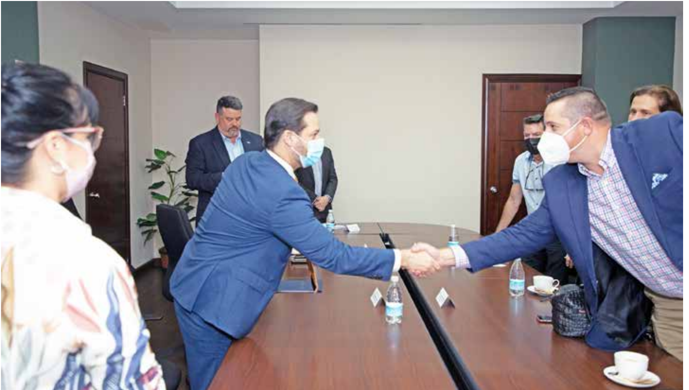
Autoridades del MICI con ejecutivos de MAPay.