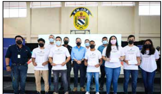
Atletas de diversas disciplinas de Veraguas recibieron estímulos deportivos.