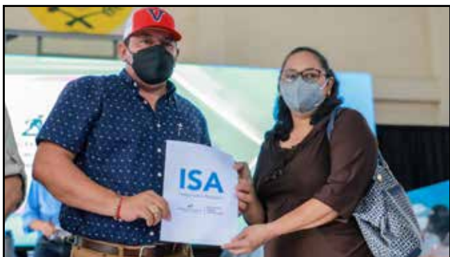
Se pagó indemnizaciones por B/.9,963.55 a productores de Veraguas, de un total de B/.157,563.00 canceladas en 2021.