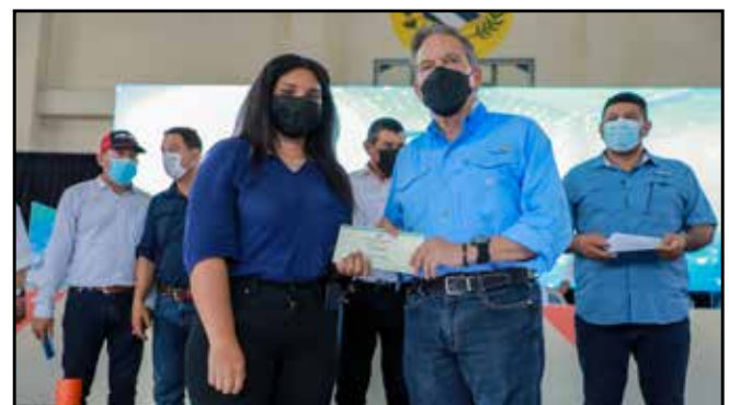
Estudiantes de todos los niveles fueron beneficiados con becas, tabletas y "laptops" del programa Transformando Vidas.