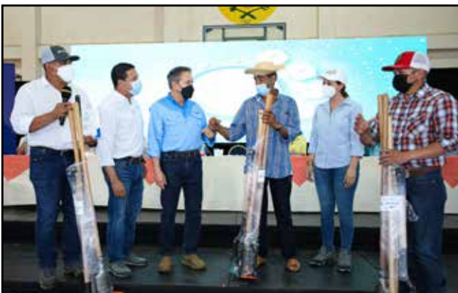
Al Asentamiento Campesino Victoriano Franco, del corregimiento de Santiago Sur, se le hizo entrega de un motocultor y herramientas agrícolas.