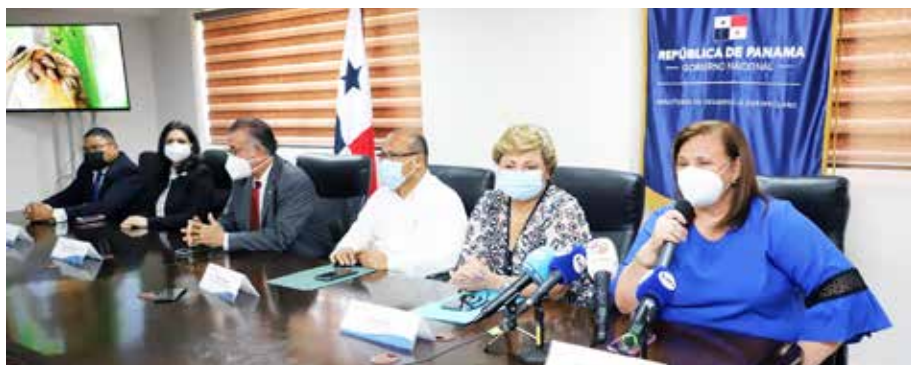
Autoridades del MIDA, Minsa y Aduanas anuncian la alerta por amenaza del molusco que puede afectar al sector agropecuario y la salud humana.

Dirección Ejecutiva de Cuarentena Agropecuaria; además de otras dependencias públicas vinculadas al movimiento de personas y mercaderías, adoptando todas las medidas fitosanitarias necesarias.