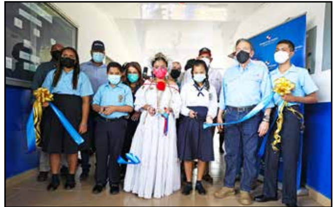
Con una inversión de B/. 1,999,999.19, se hizo entrega de las nuevas instalaciones del IPT Jaime Melamed Avilés, centro educativo de excelencia ubicado en el distrito de Montijo.