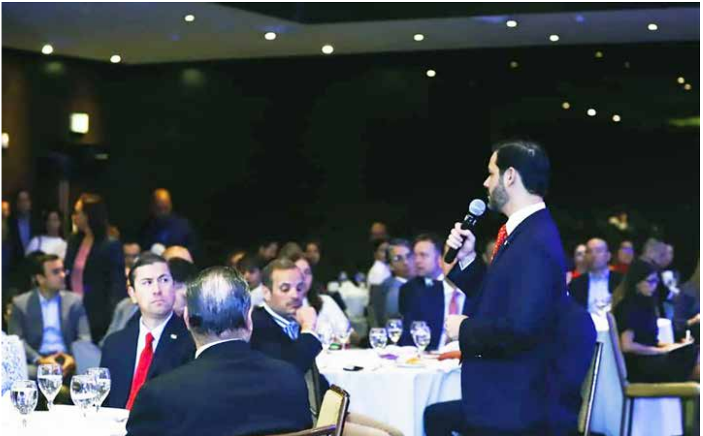
En la Dirección de SEM se tramitan las solicitudes de licencias.