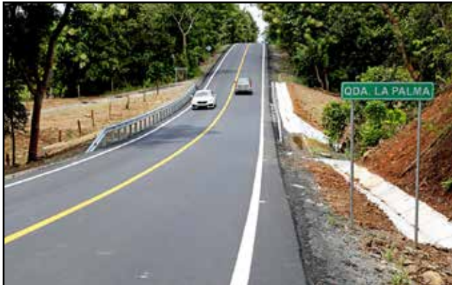
En el poblado de Llano Abajo de Calobre, se inaugura la carretera de 31 kilómetros El Jagüito-Calobre, con una inversión de B/.16,265,866.63, para el beneficio de 22 mil habitantes.

Comunidades visitadas: Calobre, Montijo, Los Algarrobos, Carlos Santana y Santiago.