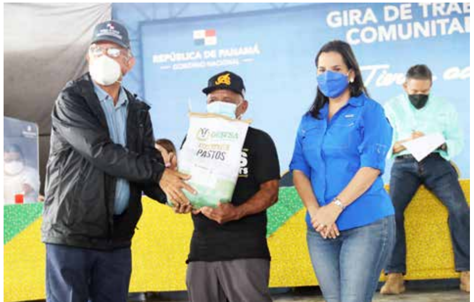
El presidente Cortizo y el ministro Valderrama durante la entrega de insumos a los productores.

El MIDA continuará brindando este apoyo en todas las provincias, como parte del impulso a la agricultura familiar para hacer frente a la pobreza y la desigualdad.