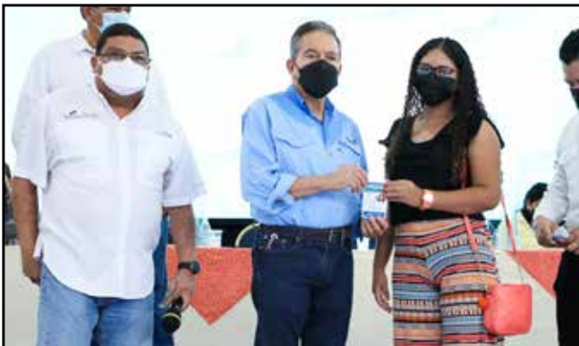
Emprendedores recibieron la certificación que los acredita como artesanos, luego de cumplir con los requisitos establecidos.