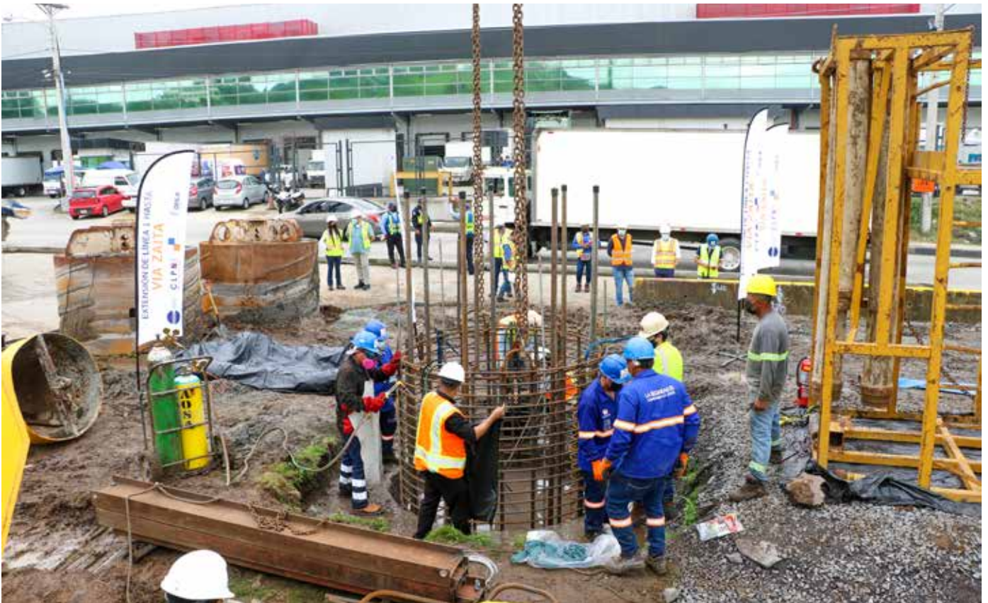
El proyecto contempla una ampliación a seis carriles de la vía Transístmica.