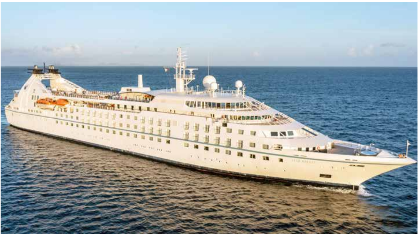
Esta línea opera cruceros pequeños de lujo en Europa, el Pacífico Sur, el Caribe y Centroamérica.

del pago del peaje correspondiente a un tránsito por la vía canalera para cada operación que realicen las empresas de cruceros que establezcan su puerto base en Panamá, busca incrementar la llegada de más cruceros al país.