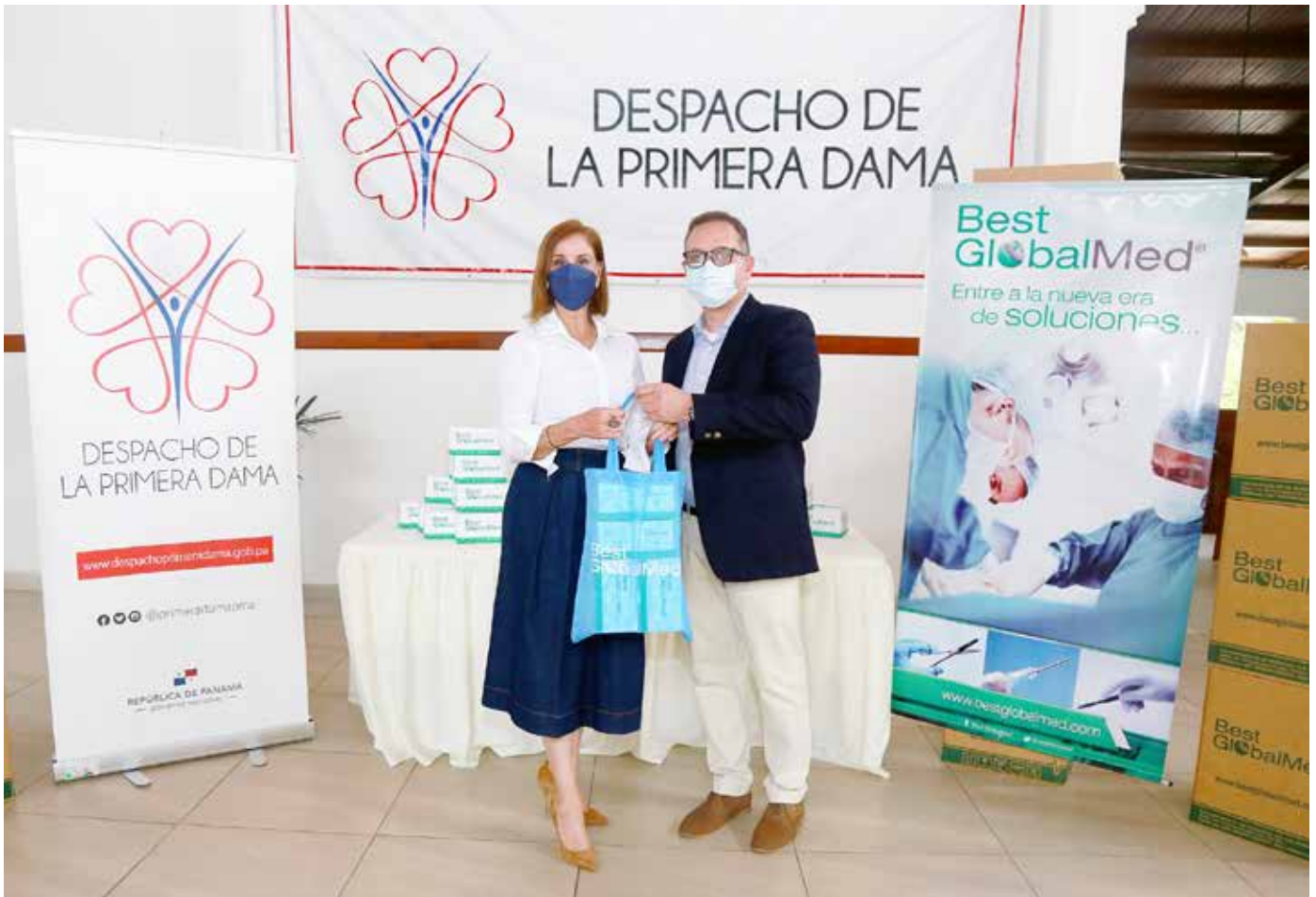
La primera dama recibe la donación de cubrebocas.