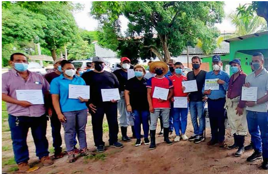
Participantes en el taller junto al ministro Valderrama durante el acto de clausura.

Unos 34 pequeños apicultores de Panamá Oeste recibieron una capacitación sobre manejo y biología de la abeja africanizada durante un taller realizado a través de la Dirección Nacional de Ganadería del Ministerio de Desarrollo Agropecuario (MIDA), en el sector de Sajalices, del 18 al 20 de agosto, la cual contó con la participación del titular del MIDA, Augusto Valderrama, durante el acto de clausura. Valderrama detalló que en el país existen unos 476 productores censados y con capacidad de duplicar esta cantidad porque esta es una actividad interesante que hay que promover, ya que es muy rentable, no necesita mucha inversión y las abejas son las más trabajadoras del mundo, por lo que se comprometió a coordinar el trabajo, ver los recursos e incentivar a mujeres emprendedoras para que incursionen en los proyectos apícolas. Agregó que es una actividad que hay que promover porque ofrece productos con buena demanda, calidad, que demora en el mercado y buenos precios. Reiteró el apoyo del MIDA en estos programas con los que se busca cerrar brechas, como dice el presidente de la República, Laurentino Cortizo Cohen, eliminando desigualdades y para que las personas del campo puedan aumentar sus ingresos y tener una mejor calidad de vida para sus familias. Valderrama, quien estuvo acompañado por la