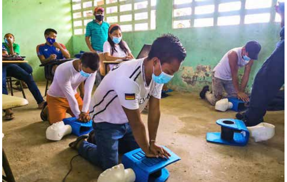
Líderes de la comunidad ponen en práctica técnicas de reanimación.

El objetivo de los Bomberos es llevar estos seminarios a las demás comarcas para que puedan responder ante una eventual emergencia.