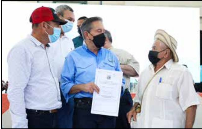
20 familias, de un total de 700 beneficiadas este año en esa provincia, recibieron los títulos de propiedad de las tierras que habitan.