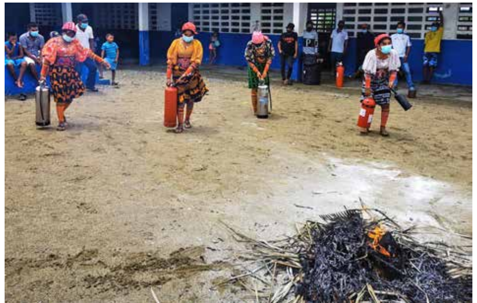
En representación de la mujer guna, 15 damas participaron en la jornada de capacitación “El Bombero en tu Comunidad”.