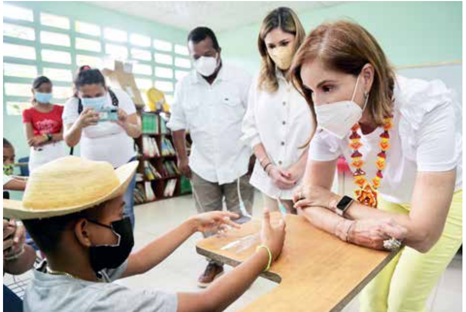
La primera dama, Yasmín Colón de Cortizo, participó en la jornada de evaluación que realiza personal de salud de Udelas.

El Despacho de la Primera Dama, a través de la Dirección de Proyección Social, llevó hasta el corregimiento de Zapallal, distrito de Santa Fe, provincia de Darién, el Programa Ver y Oír para Aprender, que consiste en jornadas médicas de optometría, fonoaudiología, odontología, vacunación y nutrición, dirigidas a estudiantes de centros educativos oficiales. En el Centro de Educación Básica General (C.E.B.G.) El Zapallal, fueron evaluados 301 estudiantes; 113 en C.E.B.G. Altos del Cristo; 23 en C.E.B.G. Nicanor; 61 en C.E.B.G. Arretí 10 y en el IPHE; es decir, más de 500 alumnos a los que se les podrá detectar a tiempo cualquier padecimiento visual o auditivo. Los resultados que arroje esta evaluación determinarán la cantidad de estudiantes que requieren anteojos o dispositivos auditivos. Estas jornadas las realiza personal médico de la Universidad Especializada de las Américas (Udelas). Hasta la fecha, más de 1,200 estudiantes han sido evaluados en Panamá Oeste, San Miguelito y Darién. Las próximas jornadas de evaluación del Programa Ver y Oír Para Aprender se trasladarán hasta la comarca Ngäbe Buglé y la provincia de Coclé, durante el mes de septiembre.