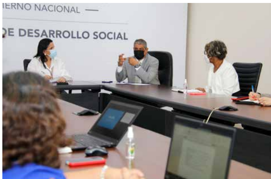
El ministro de Salud, Luis Francisco Sucre, participó en la reunión junto a representantes del Mides y de Unicef.

El Ministerio de Salud (Minsa) impulsa una estrategia nacional en conjunto con el Ministerio de Educación (Meduca), Ministerio de Desarrollo Social (Mides) y el Fondo de las Naciones Unidas para la Infancia (Unicef), para combatir la crisis de salud mental que padecen niños y adolescentes de áreas de difícil acceso y las comarcas, producto de la pandemia del Covid-19. Luis Francisco Sucre, ministro de Salud, participó de una reunión junto a la viceministra, Ivette Berrío, en la que se analizó la Tercera Encuesta de Hogares sobre Salud Mental, tras investigaciones llevadas a cabo por Unicef. Según la viceministra Berrío, la investigación revela que, en los últimos seis meses, estos menores han tenido dificultades para el acceso a la educación, para interactuar con otros niños y limitación de movilidad. “Realizaremos acciones y planes interministeriales para enfrentar los embates de la pandemia en la salud mental de los niños y adolescentes en nuestro país, en especial en áreas de difícil acceso”, dijo Berrío. Javier Córdova Ortega, coordinador del Programa de Unicef en Panamá, indicó que los resultados indican que la situación de la niñez y adolescentes en Panamá ha desmejorado a lo largo de la pandemia, pues existen más conflictos en los hogares.