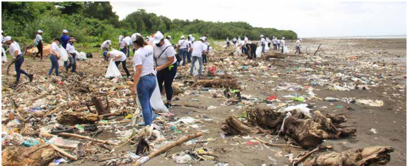
Se recogieron aproximadamente cinco toneladas de desechos.