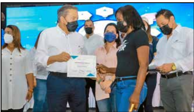
Beneficiarios del programa Muévete por Panamá, que brinda la posibilidad de aprender a leer y escribir, recibieron sus certificados de alfabetizados.