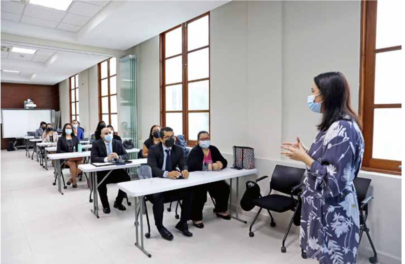
La vicedanciller Dayra Carrizo Castillero inauguró este programa de capacitación.