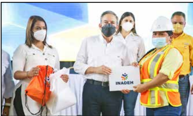
20 beneficiarios que concluyeron diversas capacitaciones que dicta el Inadeh recibieron sus certificados de fin de curso.