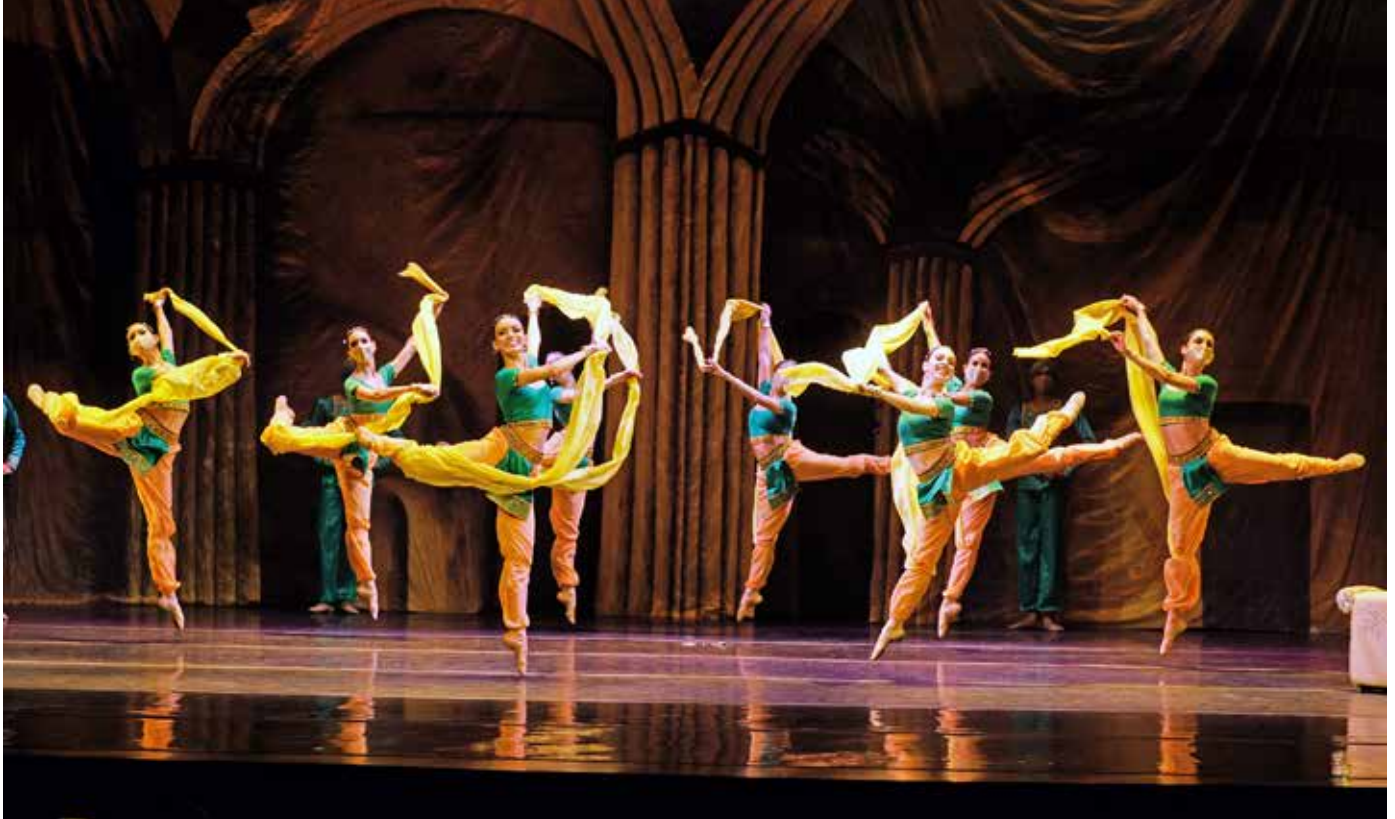
El Ballet Nacional interpretando "La Bayadère".