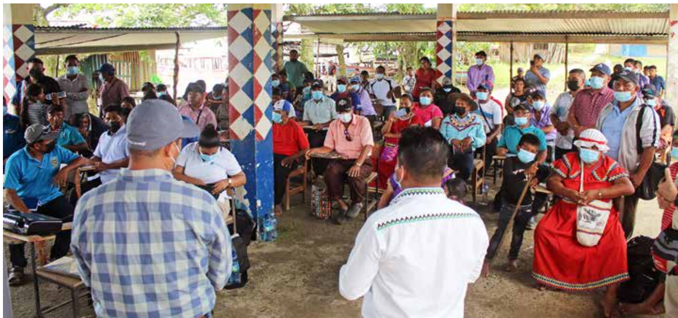
Etesa informó que no será afectada el área protegida de la región Ñö Kribo.

región. Se aclaró que no será afectada ninguna de las áreas protegidas dentro de la región y se explicó cómo serán estructurados los estudios ambientales y sociales dentro de la comarca Ngäbe Buglé. Se entregó información de primera mano a los participantes, para indicar en qué etapa se encuentra el proyecto, responder sus inquietudes, escuchar sus sugerencias y observaciones.