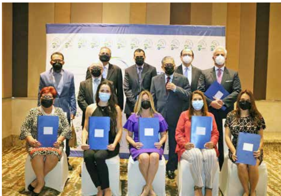
Un total de 18 representantes de estas empresas radiales recibieron la resolución legal de sus renovaciones.

De acuerdo con la Ley 24 de 1999, las estaciones de radio o televisión tendrán una vigencia de 25 años.