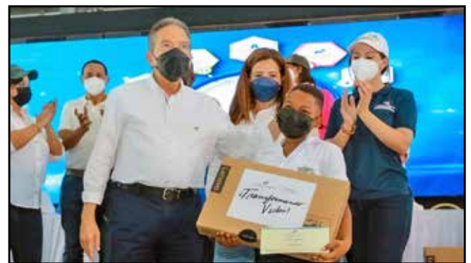
Estudiantes del circuito fueron beneficiados con becas, tabletas y "laptops".