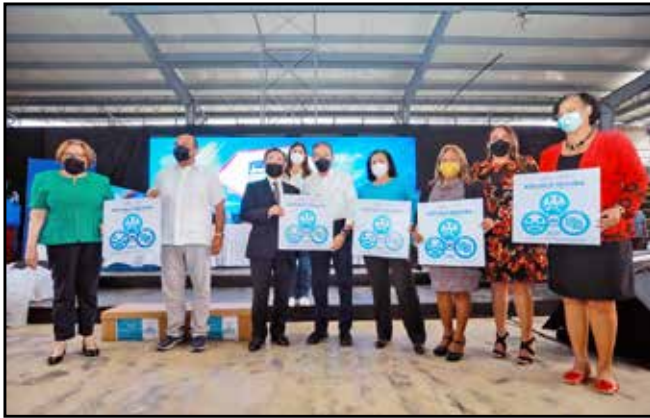
Cinco planteles recibieron la certificación de Escuela Segura, tras su adecuación a través del programa CON Escuelas, que incluye 8 centros educativos de este circuito.