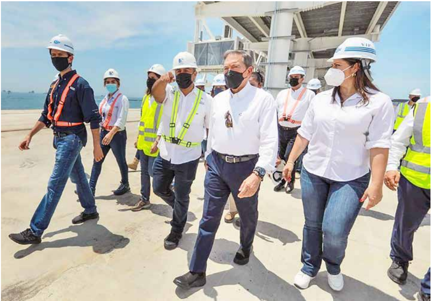
La construcción del proyecto registra un 80% de avance.