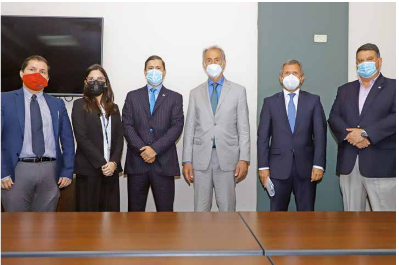
Autoridades del MICI y Jorge Neme, secretario de Relaciones Económicas Internacionales de Argentina.

En el encuentro también se abordó el interés de promover a nuestro país como base ideal para la internacionalización de empresas de esa nación sudamericana.