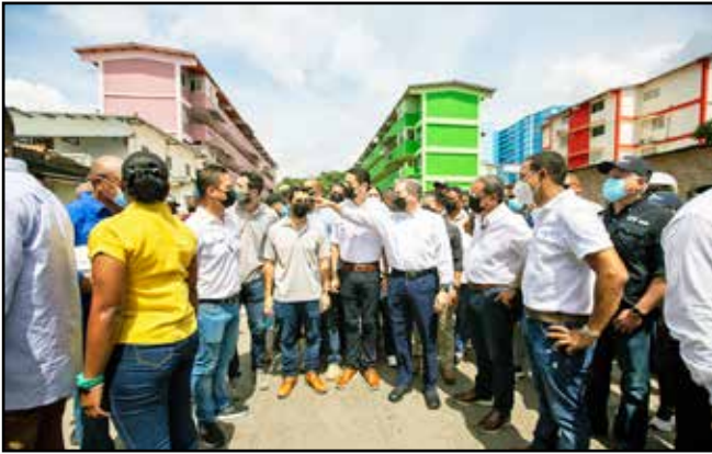
El mandatario recorrió el proyecto Recuperando Mi Barrio en El Chorrillo, que incluye la revitalización de 92 edificios y una inversión de B/.18,103,971.

El presidente Laurentino Cortizo Cohen estuvo en compañía de autoridades de CONADES, MIVIOT, AMP, MEDUCA, MIDES, IFARHU, AMPYME, INADEH, PANDEPORTES, MINPRE y DAS. Comunidades visitadas: El Chorrillo, isla Perico, Ciudad del Saber, Betania.