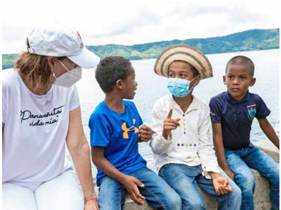
Primera Dama encabeza entrega de aportes a residentes del lugar.