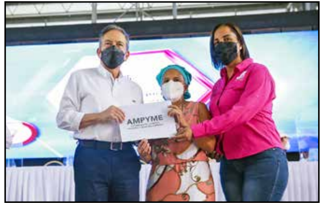
En inversión del programa Capital Semilla no reembolsable, se otorgó B/.32,000 a nuevos emprendedores.