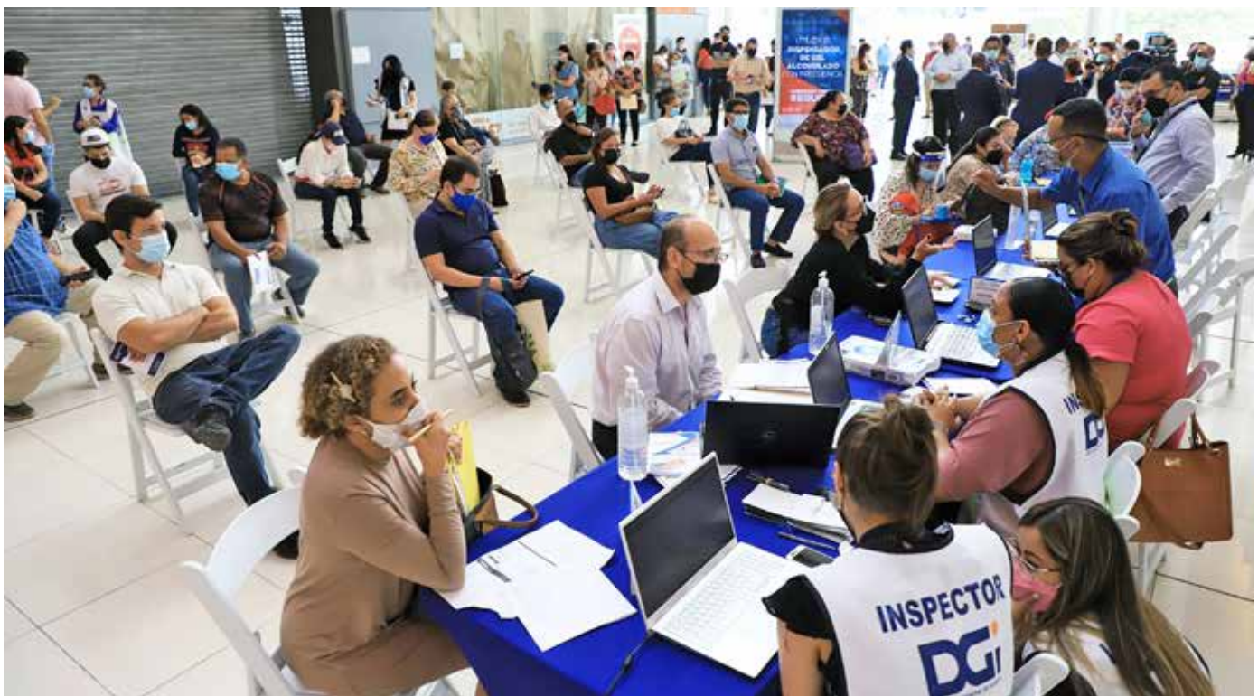
Un gran número de contribuyentes asistió a la DGI para cumplir con sus obligaciones tributarias.

garanticen, por lo menos, arreglos de pagos un poco más extendidos, sobre todo a los contribuyentes que se vieron seriamente afectados por la pandemia del Covid-19. Recalcó que a todas las personas naturales y jurídicas que al final de esta amnistía pactaron con la institución sus arreglos de pago, se les garantiza que tienen hasta el 31 de diciembre de 2021 para cumplir con sus obligaciones tributarias sin ningún perjuicio, con la finalidad de contribuir con la reactivación de la economía. A la fecha, los ingresos corrientes del Estado alcanzan los B/.3,500 millones recaudados, lo que significa un 26% por encima del presupuesto y un 17% más respecto al año 2020.