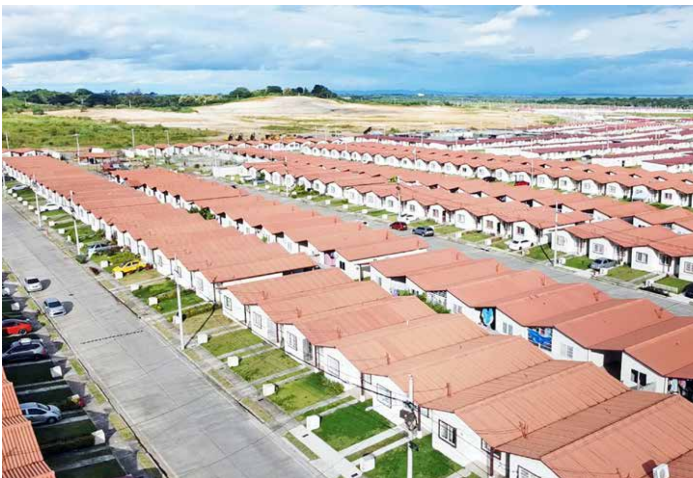
Los proyectos residenciales con el uso de suelo tipo RBS forman parte del programa Fondo Solidario de Vivienda.