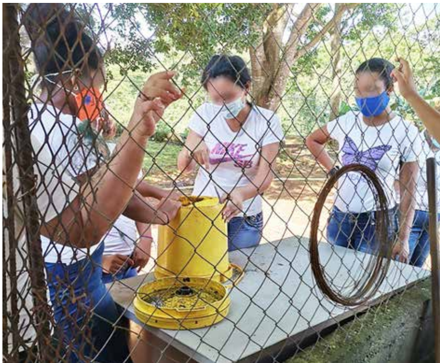
Grupo de detenidas participa en capacitación de 110 horas.

En el curso de ceba y manejo de pollos de engorde en infraestructuras rústicas, las privadas de libertad aprenden a criar aves de corral utilizando materiales reciclados.