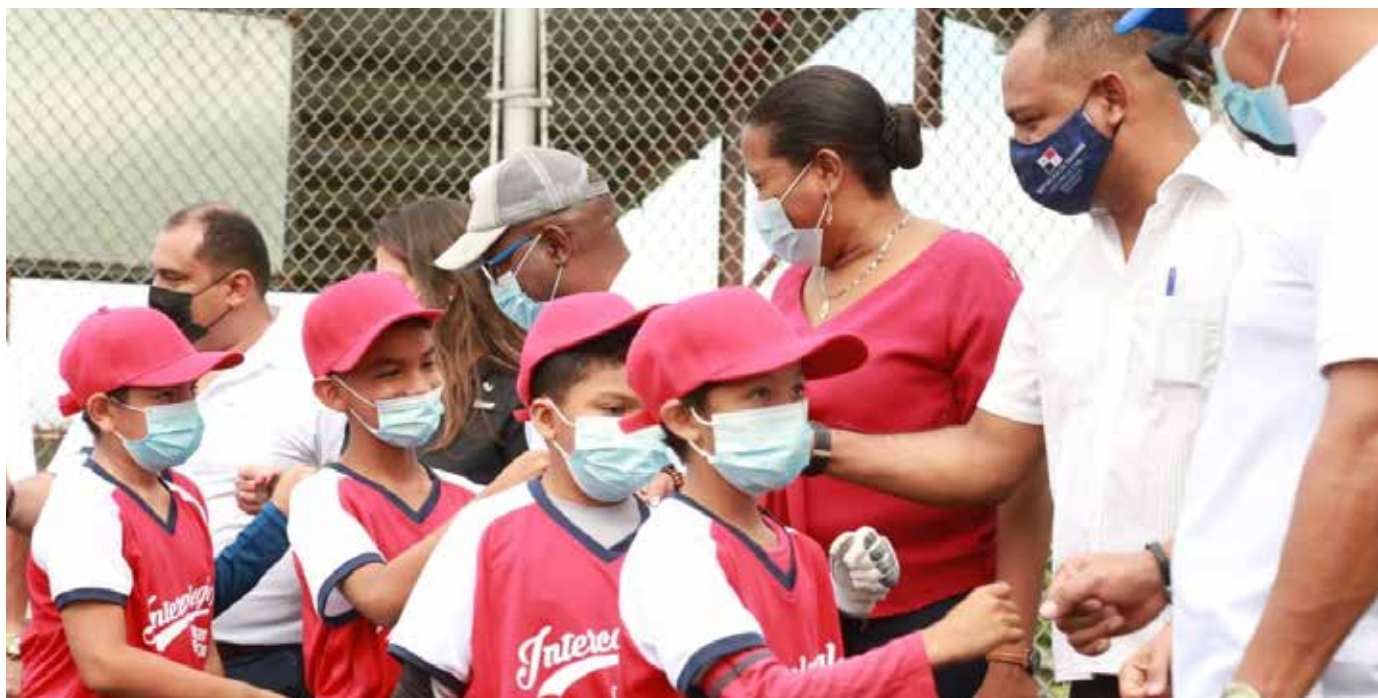
El primer partido lo escenificaron el Centro Educativo Bilingüe Tomás Arias y el Centro de Educación Básica General María Henríquez, ambos de Panamá Norte. La victoria la obtuvo la novena del María Henríquez.