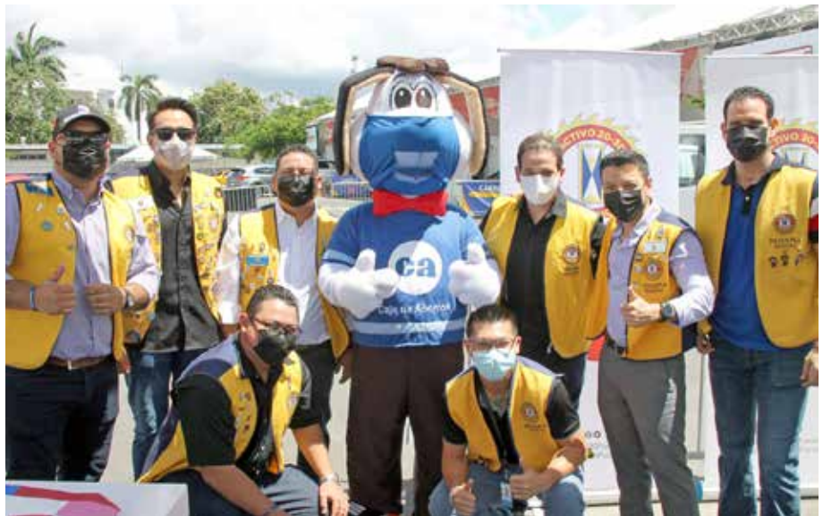
Directivos y socios del Club Activo 20-30.

Este novedoso método de inmunización se puso en marcha el pasado 13 de marzo y en estos centros de vacunación exprés se han colocado dosis de las farmacéuticas Pfizer y AstraZeneca.