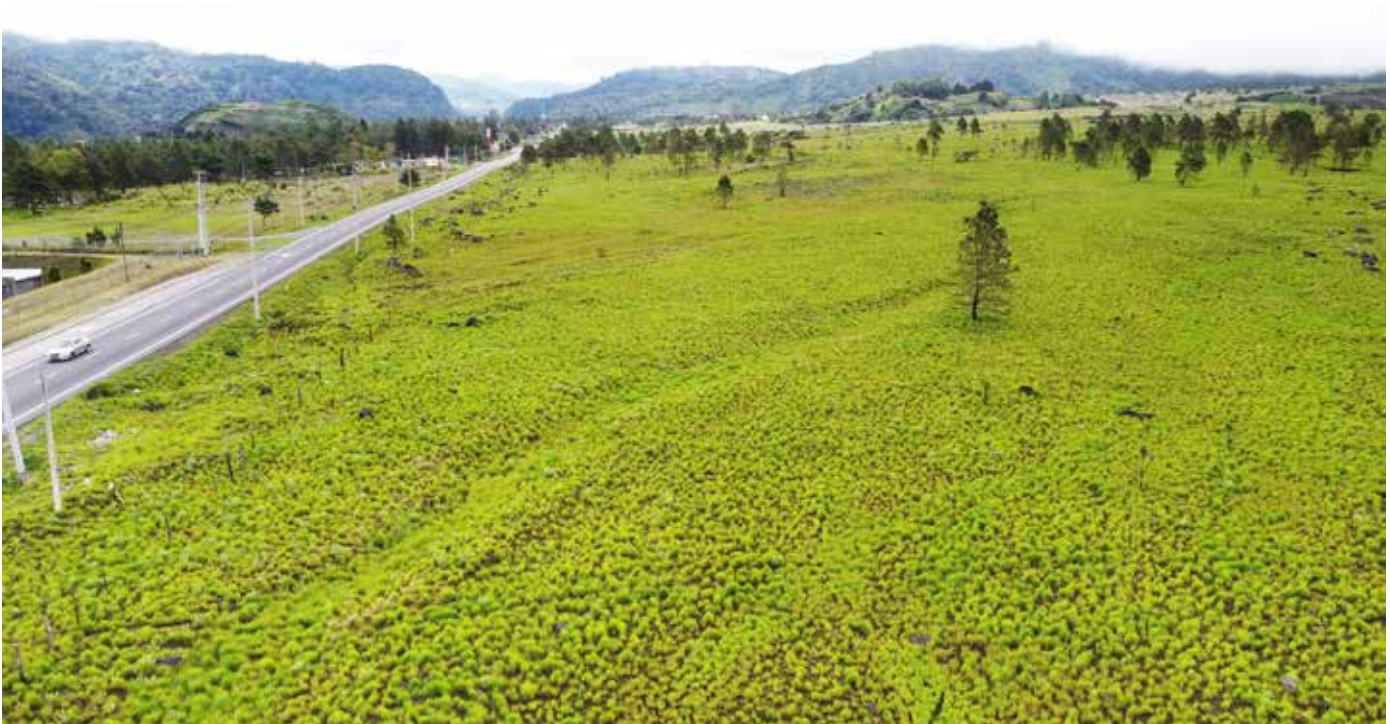
Las viviendas se edificarán sobre un terreno de 450 metros cuadrados.