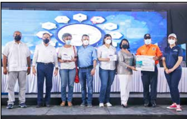
Se dotó con máquinas de coser y tabletas a la Asociación Edad 3 de Betania y a la Asociación Pro-Mejoras de Miraflores.