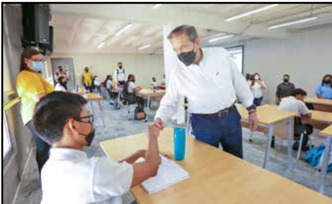
Tras sancionar la ley que implementa el Diploma de Bachillerato Internacional, Cortizo Cohen hizo un recorrido por la Academia Panamá para el Futuro. (B/. 3,400,000).