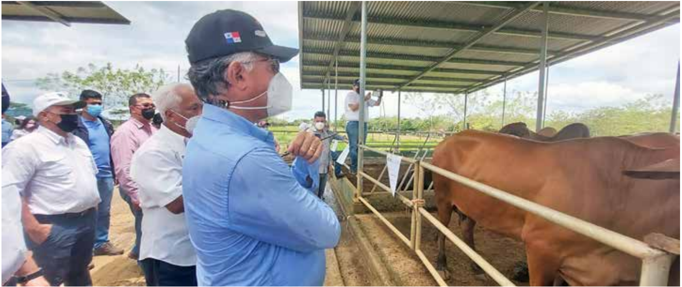
El ministro Valderrama observa la calidad genética de los bovinos en la finca experimental del IDIAP en Gualaca, Chiriquí.