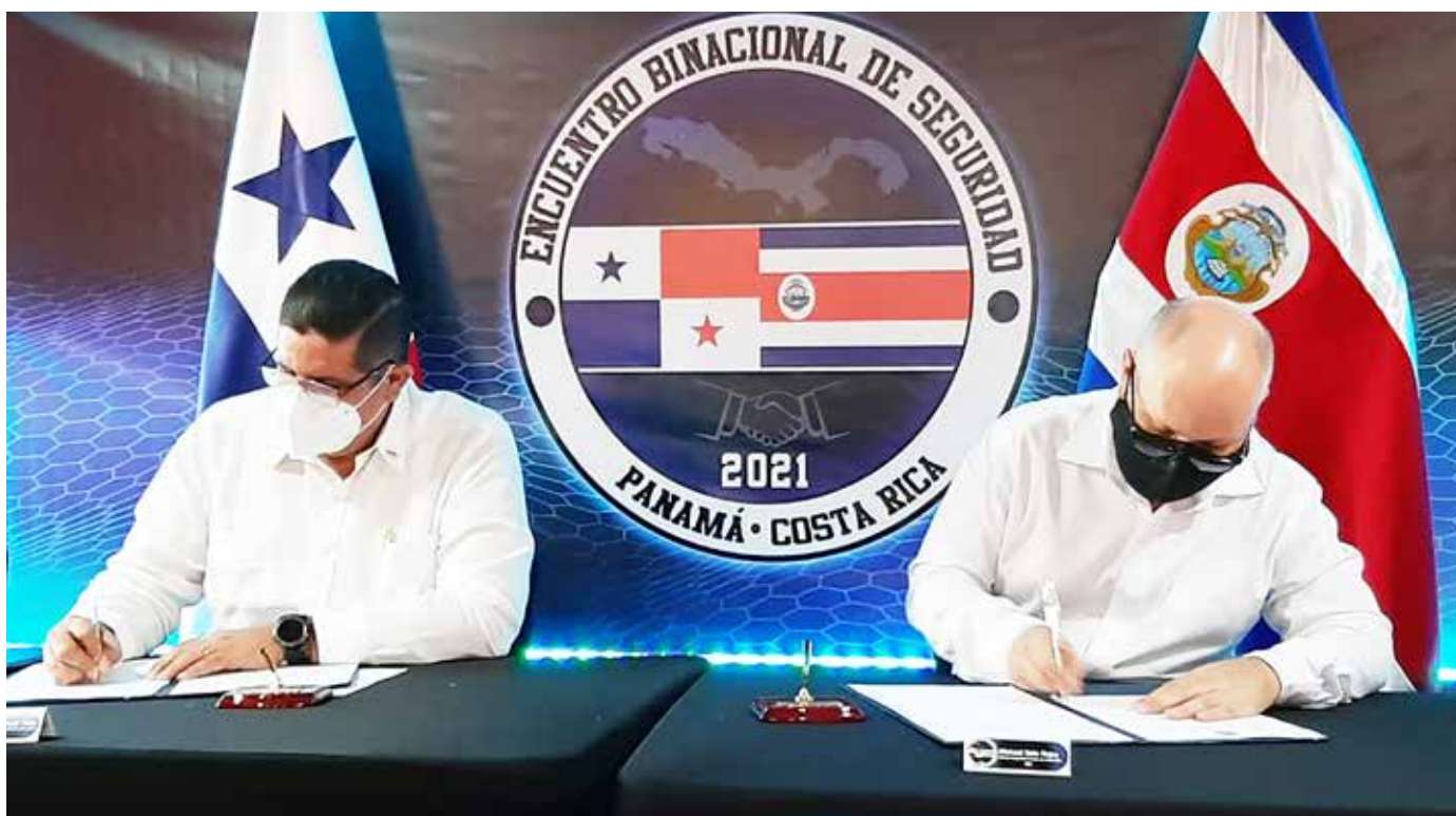
El ministro panameño de Seguridad Pública, Juan Manuel Pino, y su homólogo de Costa Rica, Michael Soto Rojas, durante la firma de la declaración conjunta en materia de seguridad.

estratégicas de trabajo en materia de seguridad terrestre, marítima y aérea, acordando dar un impulso a la formalización de protocolos operacionales para mejorar los planes y estrategias que involucren a la Fuerza Pública de Costa Rica y Panamá. En la reunión, se reafirmó la importancia de la reactivación de la Comisión Binacional de Seguridad Fronteriza Costa Rica-Panamá (Combifron), para lo cual instruyeron a sus equipos técnicos a desarrollar una propuesta de reglamento para la organización y funcionamiento del mecanismo de cooperación bilateral.