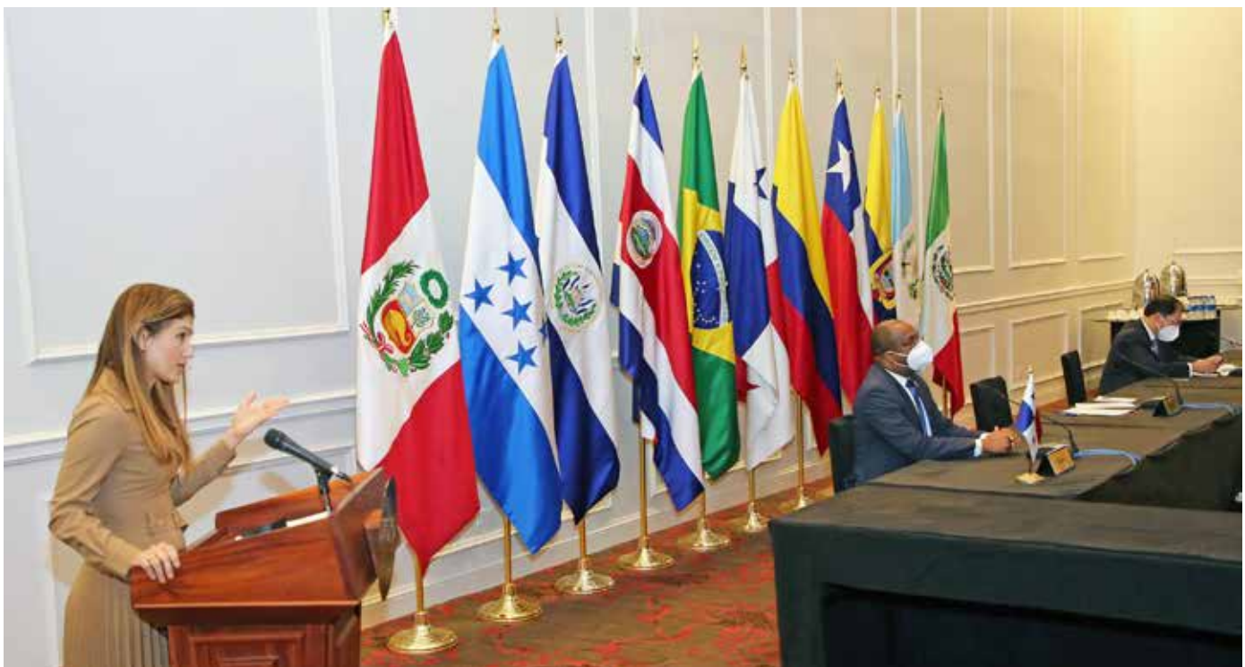
La ministra de Relaciones Exteriores, Erika Mouynes, en la inauguración del I Encuentro de Procuradores Generales.

regional, requiere de actuaciones coordinadas desde todos los países que experimentan este fenómeno. “Panamá está asegurando la participación regional para generar la corresponsabilidad en la ejecución de una hoja de ruta trazada. Hoy se reunieron los procuradores y fiscales para establecer una cooperación judicial en esta materia”, añadió la canciller y reiteró que el intercambio de información homologada y coordinada entre los países que integran la ruta de los migrantes es fundamental. “De este encuentro surge una articulación clave entre los ministerios públicos para combatir el crimen organizado que sabemos está detrás de estos movimientos migratorios irregulares”, agregó.