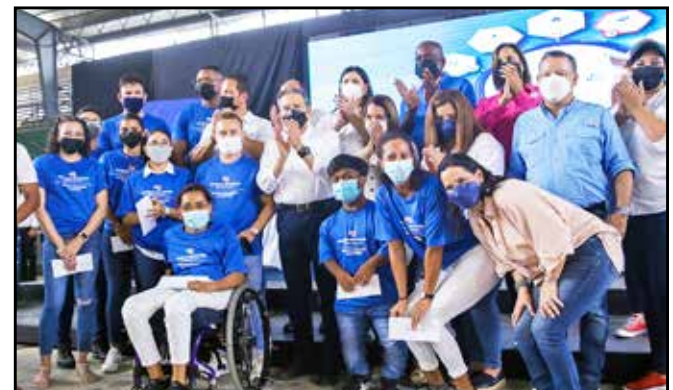
A través del programa Transformando Vidas, se entregaron a las juntas comunales, bolsas con implementos deportivos para atletas de las comunidades.