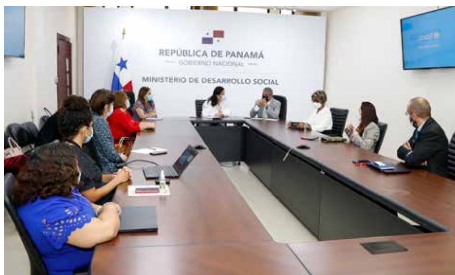
Los más afectados son los niños y adolescentes de áreas de difícil acceso y las comarcas, al igual que los que tienen limitantes en la movilidad.