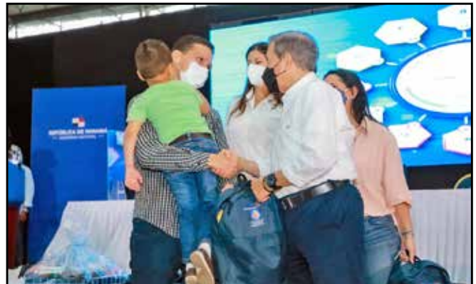
Como parte de los programas sociales, se distribuyeron mochilas Cuidarte con material didáctico para la atención integral de infantes.