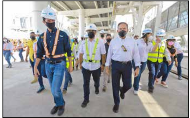
La comitiva gubernamental también inspeccionó la construcción del Puerto de Cruceros de Amador, en la isla Perico, que registra un avance de un 80%.