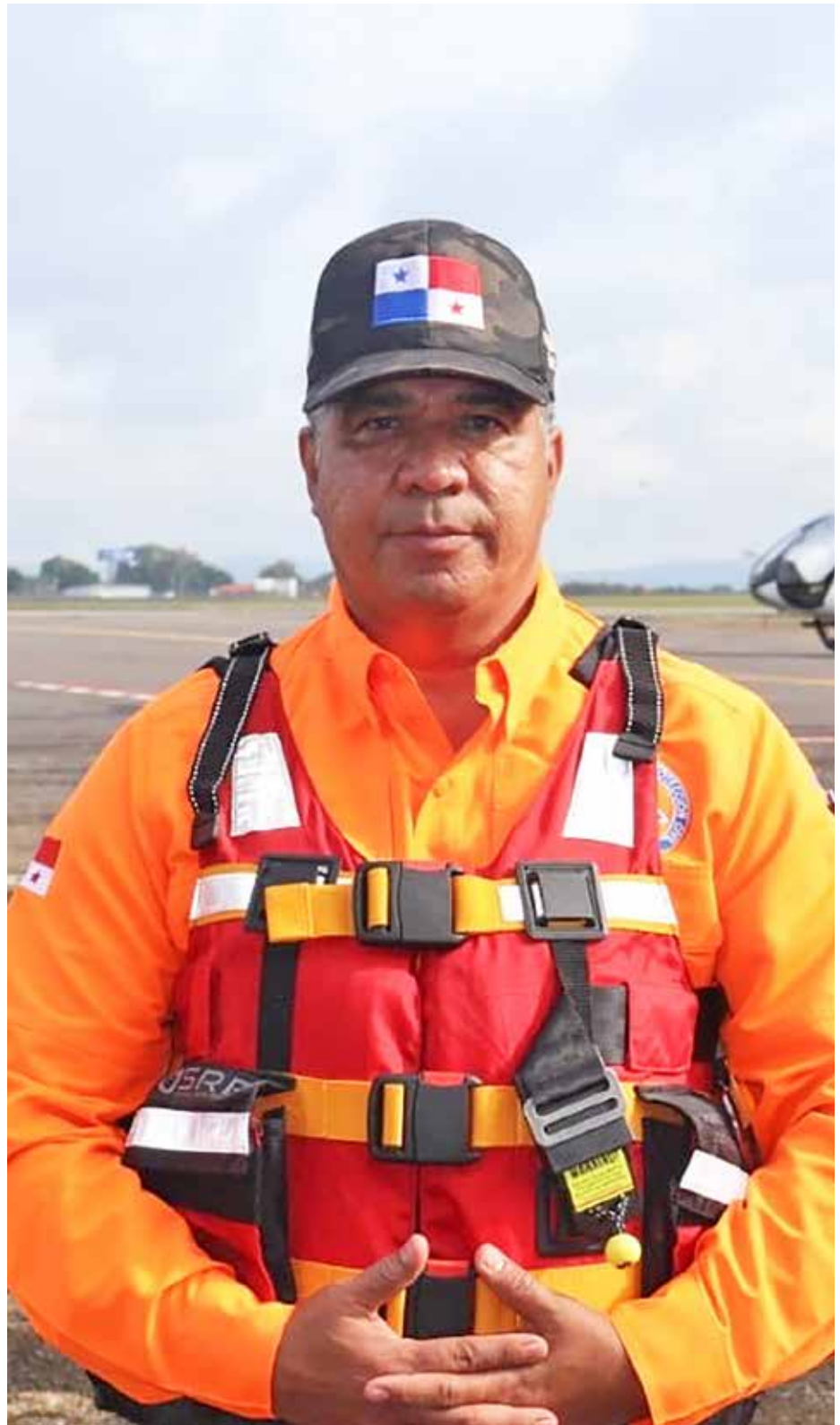
Carlos Alberto Rumbo Pérez Director del Sistema Nacional de Protección Civil (Sinaproc)

A través del Gobierno Nacional y el Ministerio de Gobierno, seguiremos fortaleciendo los componentes para la planificación, organización y control dirigido al análisis, a la reducción de riesgo, así como al manejo de eventos adversos. Para ello, se ha dotado de equipos de protección personal, de herramientas de trabajo y de plataformas tecnológicas para la respuesta ante las emergencias. Con la creación del reciente Gabinete de Gestión Integral de Riesgo de Desastres (GIRD), el Sinaproc como entidad encargada de ejecutar las disposiciones para prevenir y mitigar los efectos que la acción de la naturaleza o la antropogénica puedan generar, estaremos mejorando nuestra capacidad para afrontar el impacto de los desastres y cuyo propósito es proteger la vida de nacionales y extranjeros en nuestro país.