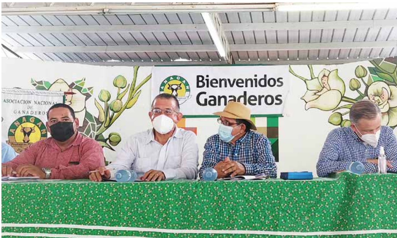
El ministro Valderrama, durante su intervención en la Asamblea de Anagan.

República, Laurentino Cortizo Cohen. Resaltó que una medida que se ha implementado para ayudar a los ganaderos del país ha sido el revisar las importaciones desmedidas y sin control que se habían dado en años anteriores. También el desarrollo de programas como Un Mejor Semental, que contribuyen en el mejoramiento de la genética del pie de cría de los productores. También se refirió a que Panamá cuenta con un laboratorio con todas las especificaciones para realizar las 22 pruebas que exige Estados Unidos para poder exportar carne a ese país, un sueño de 38 años que está próximo a cumplirse.