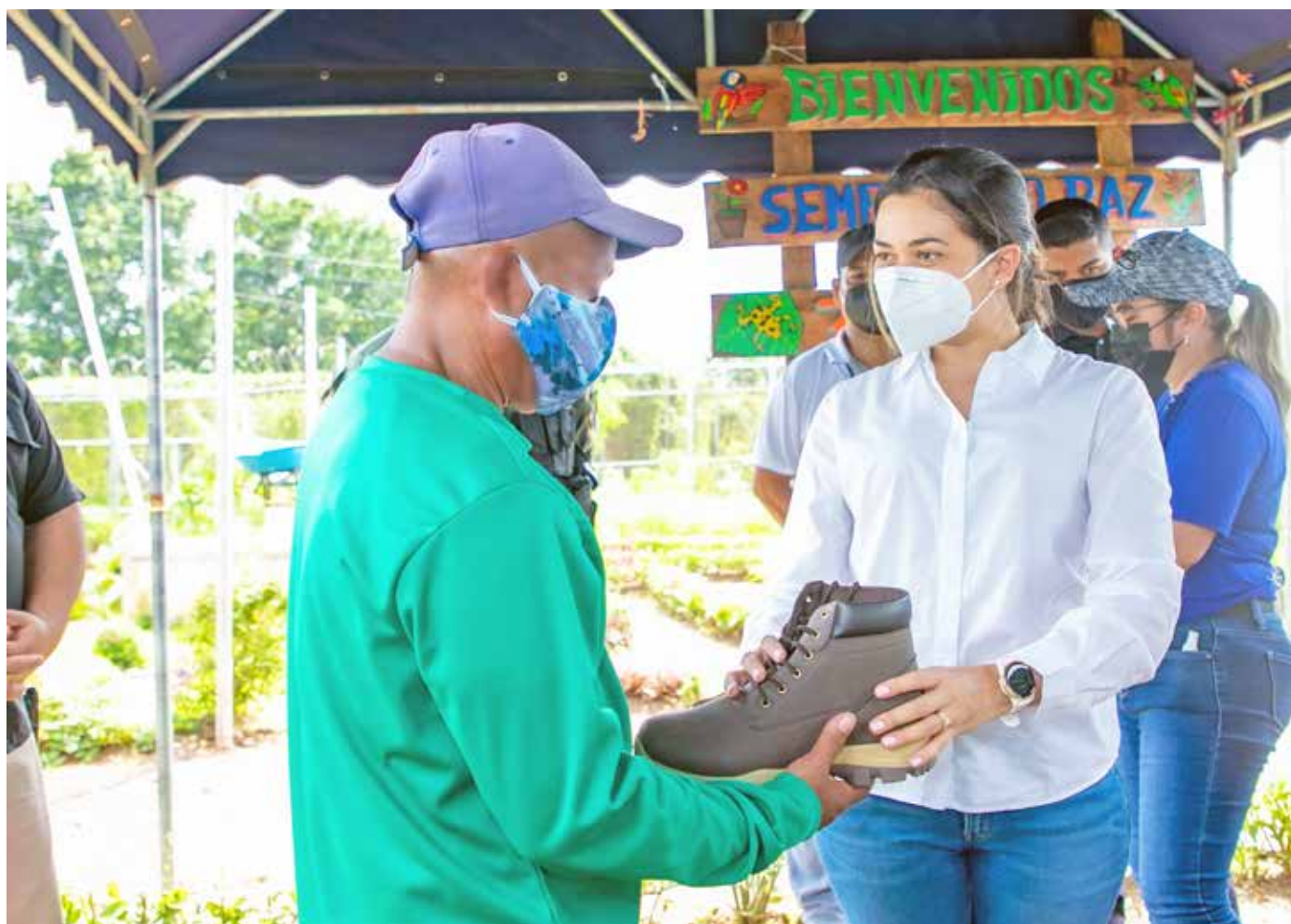
La ministra de Gobierno visita a privados de libertad que participan en el programa Sembrando Paz.

agradeció la visita y los implementos que están siendo facilitados de manera permanente por el Despacho Superior del Ministerio de Gobierno. La ministra recorrió la instalación de Sembrando Paz y supervisó los avances del programa que aporta a la sociedad plántones originarios de Panamá que luego son utilizados para la reforestación en diferentes zonas del país.