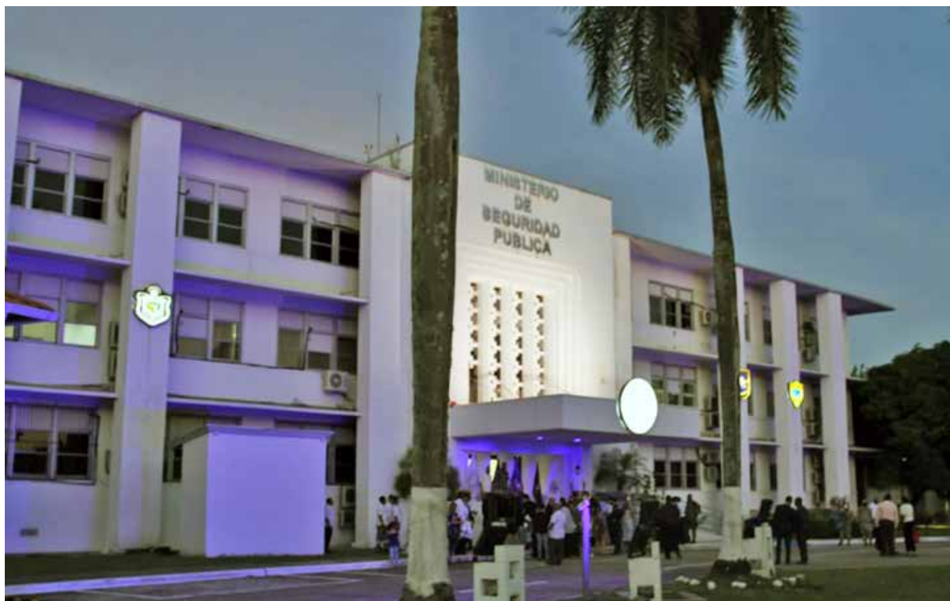
La sede del Ministerio de Seguridad Pública se ilumina en celebración del mes de la sensibilización contra la trata de personas.