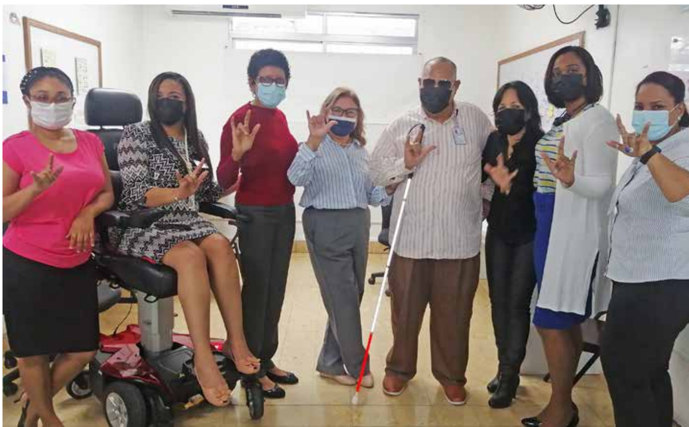
Mediante el lenguaje de señas, personal de la OEO envía el mensaje a la ciudadanía: "Con amor".

La aprobación cumplirá con lo establecido en la Convención sobre los Derechos de las Personas con Discapacidad y el Protocolo Facultativo de la Convención sobre los Derechos de esa población, adoptados por la Asamblea General de las Naciones Unidas.