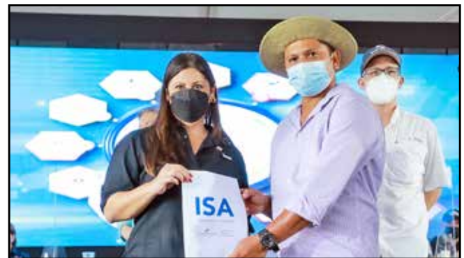
Productores recibieron el pago de indemnizaciones por B/.254,860.00.