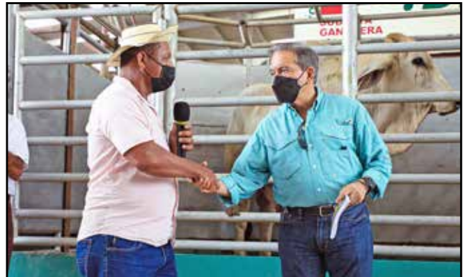
Del programa Un Mejor Semental, se distribuyeron 15 toros de la raza Brahman y 15 kilos de pasto mejorado a pequeños productores del área.