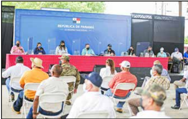
A través del plan CON Escuelas, en el sector este ya se concluyeron trabajos de reparaciones menores y mantenimiento en 37 planteles y otros 31 están siendo intervenidos.

COMUNIDADES VISITADAS: Las Margaritas, Cañita y Tortí.