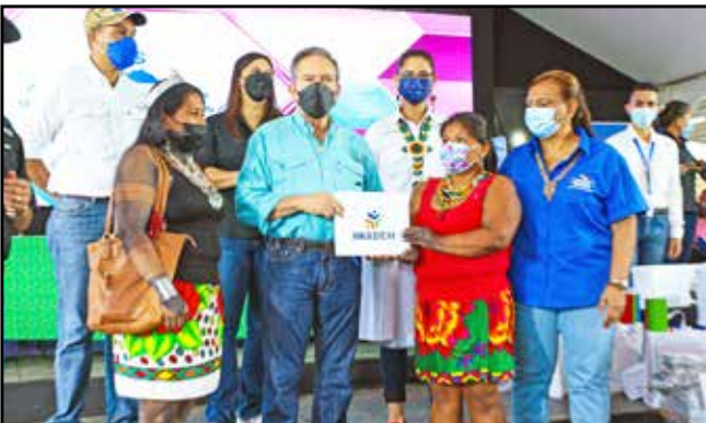
12 personas recibieron certificados de culminación de diversos cursos dictados en el Inadeh.