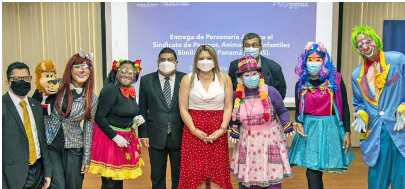
Mitradel y MiCultura, junto a directivos del Sipais.