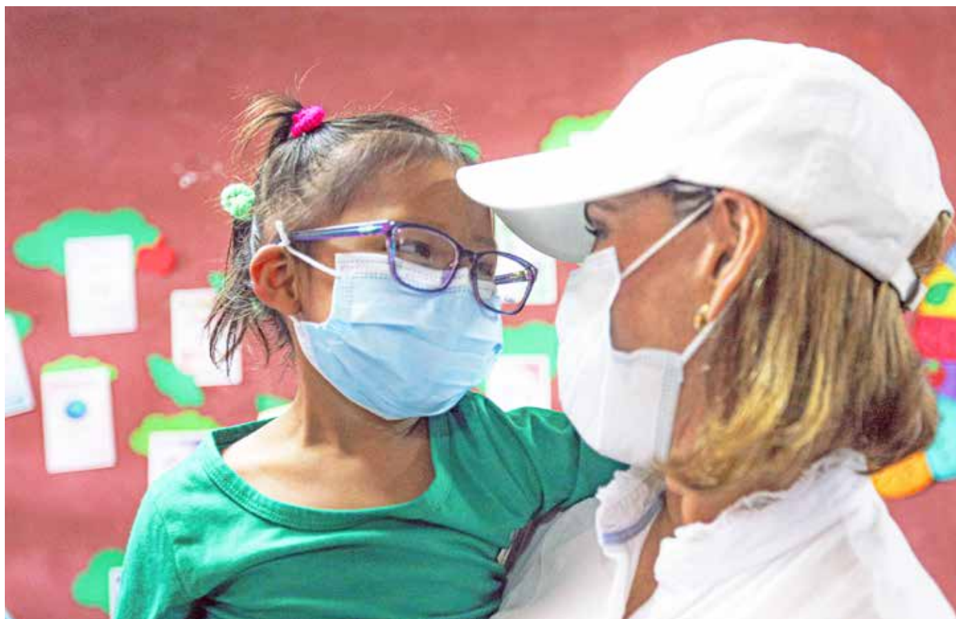
La primera dama, con una de las estudiantes a las que se les aplicó los exámenes.

y primaria. En las próximas jornadas, se superará los 3,000 niños en edad escolar evaluados por profesionales de la salud. Muchos de ellos han sido y serán beneficiados con este programa que capta a estudiantes con problemas visuales y auditivos a nivel nacional, y que además forman parte de las comunidades incluidas en el Plan Colmena. En la gira, el Ministerio de Salud (Minsa) realizó una jornada de vacunación, odontología y evaluación de peso y talla para los estudiantes. También se brindó atención de salud para los padres de familia y aplicaron vacunas contra el Covid-19.