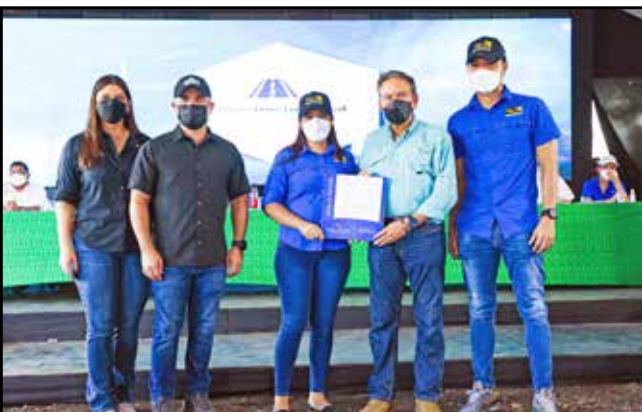
Para reparar las calles del sector, se emitió orden de proceder para alquiler de equipo pesado por 15,700 horas máquina, por un monto de B/.1,020,352.00.