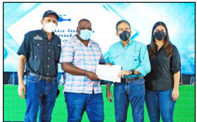
Se dio orden de proceder por un monto de B/.13,488.00 para el suministro y servicio de perforación de dos pozos para el acueducto de Saboga.