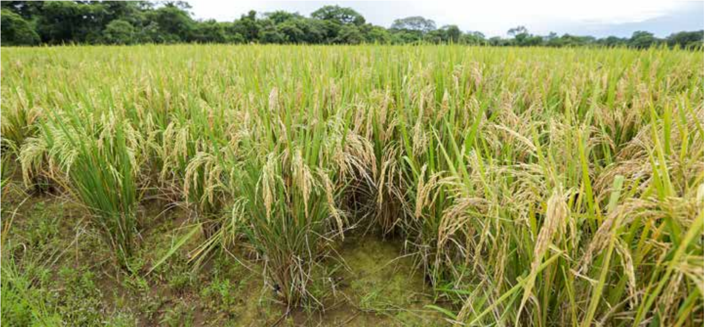
Parcelas de semillas certificadas de arroz de la Facultad de Ciencias Agropecuarias en Chiriquí.