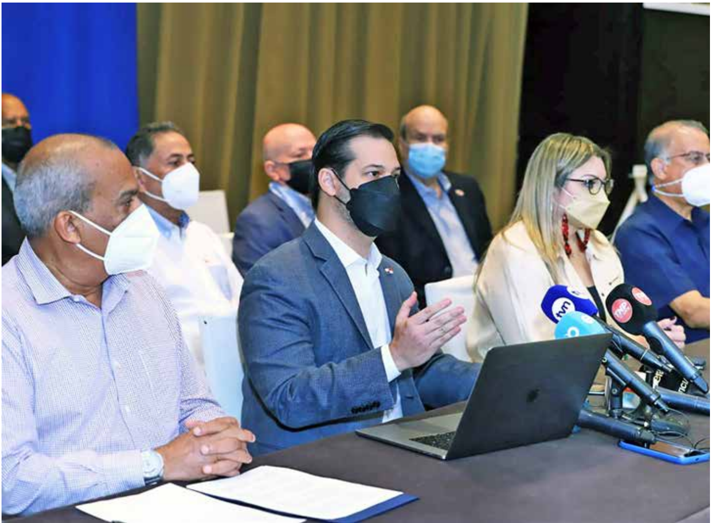
Se presentó ante los medios de comunicación los avances de la negociación.

El equipo designado por el presidente Laurentino Cortizo Cohen actúa guiado por los intereses nacionales y enfocado en lograr los mayores beneficios posibles para el país.