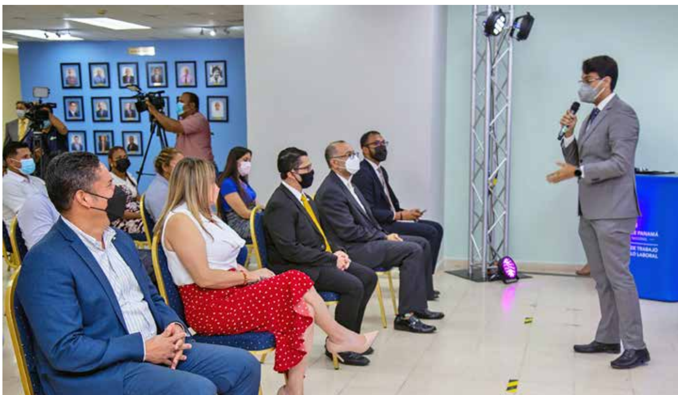
El grupo de expertos comparte su análisis sobre el mercado laboral pospandemia.

El objetivo del foro fue brindar a los jóvenes una jornada de docencia sobre el papel fundamental que desempeña la juventud en la recuperación económica y una perspectiva sobre el futuro del trabajo en la región.