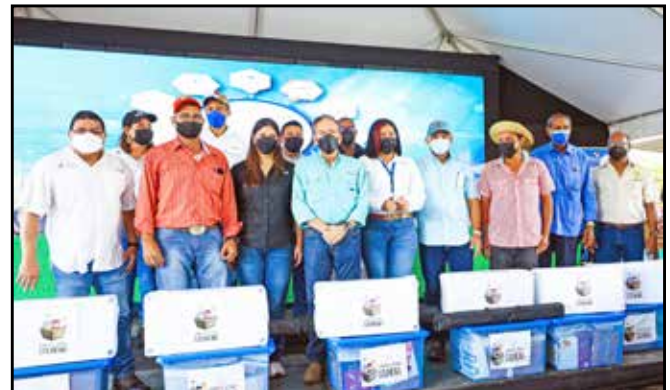
Las diversas juntas comunales del distrito de Chepo recibieron centros de lectura Colmena, que incluyen libros de autores nacionales, librero y caja móvil.