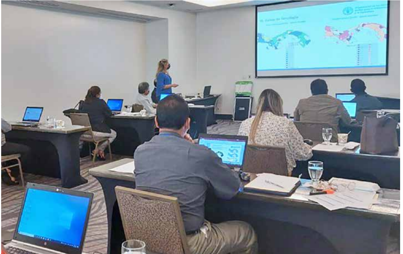
Funcionarios de las diversas direcciones del MIDA recibieron la capacitación.