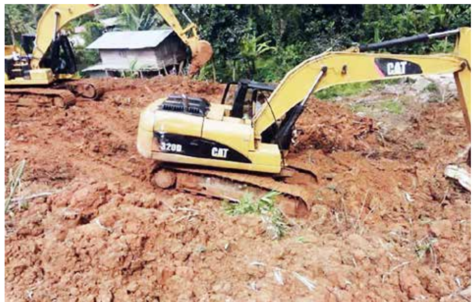
En El Empalme, Changuinola, comenzó el movimiento de tierra para construir las viviendas seguras.