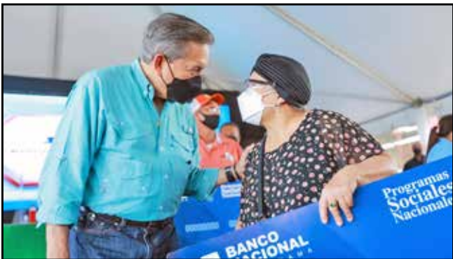
Se entregaron tarjetas Clave Social a beneficiarios del programa 120 a los 65, que les permite contar con recursos para hacerle frente a gastos básicos.