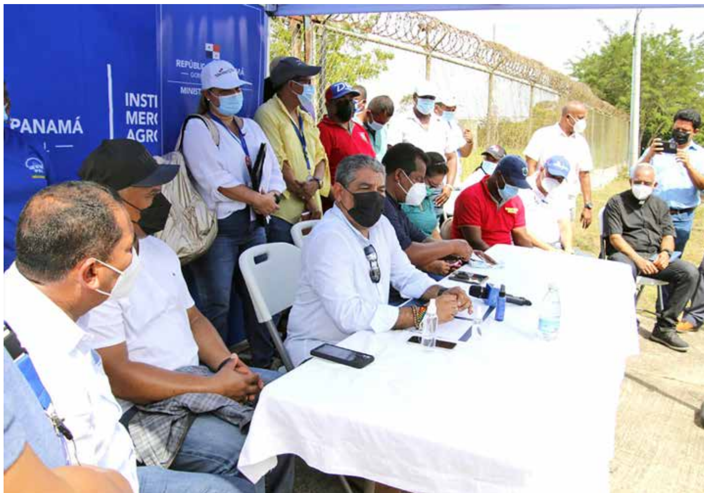
El ministro de Salud, Luis Francisco Sucre, hizo el anuncio durante una gira de trabajo en esa comunidad.