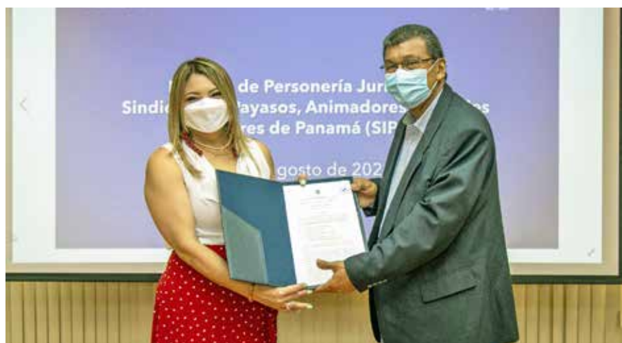
La ministra de Trabajo entrega la personería jurídica al gremio.