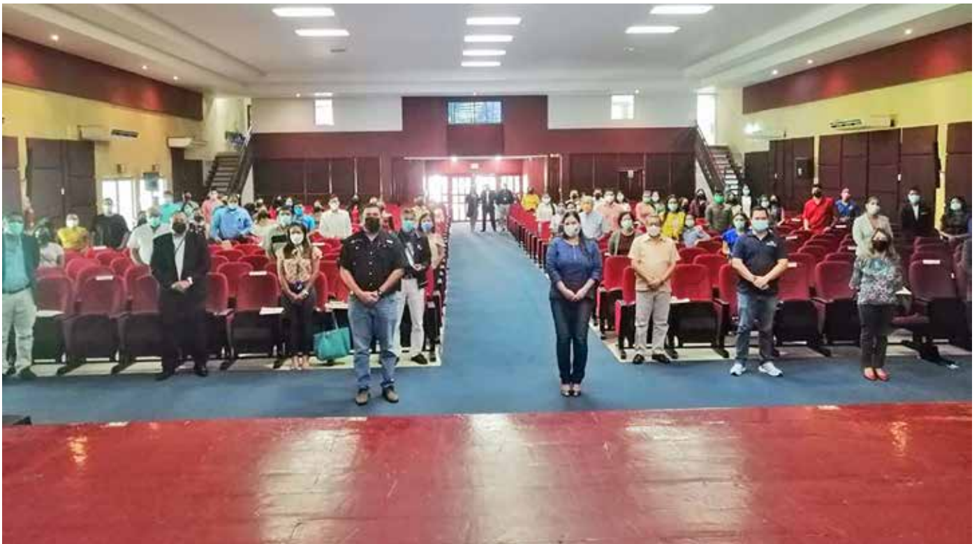
El Centro Regional Universitario de Azuero fue el escenario de esta importante sesión informativa.