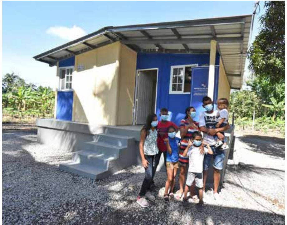
Familias de Barú afectadas por los huracanes ya recibieron sus nuevas viviendas.

Familias de bajos recursos económicos en ocho provincias y la comarca Ngäbe Buglé, afectadas por los huracanes Eta e Iota ocurridos a finales de 2020, están siendo apoyadas por el Gobierno Nacional. Al final serán 655 familias las que serán ayudadas con soluciones habitacionales, de acuerdo con el Informe del Estado de Emergencia Ambiental del Ministerio de Vivienda y Ordenamiento Territorial, de las cuales 455 familias serán favorecidas con casas completamente nuevas. En cuanto a las mejoras, hay 200 familias distribuidas así: Bocas del Toro (9), Coclé (3), Colón (2), Chiriquí (100), Herrera (6), Panamá (35), Veraguas (4), Panamá Oeste (2) y comarca Ngäbe Buglé (39). Para agilizar este plan de ayuda habitacional, en Chiriquí ya se entregaron 128 viviendas para Barú y Alanje; se construyen otras 12 en Barú y 4 casas más en Gualaca. Igualmente, se espera la adjudicación para la construcción del proyecto Urbanización Paso Ancho (116 casas), para familias afectadas en Tierras Altas. En Changuinola y Renacimiento, iniciaron el acondicionamiento del terreno y traslado de materiales para empezar la construcción.