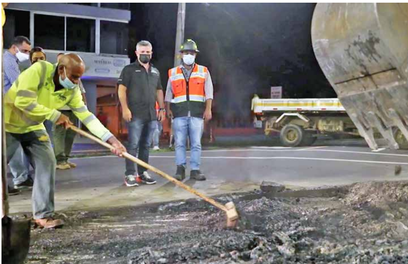
El ministro de Obras Públicas, Rafael Sabonge, hizo un recorrido nocturno por varias vías de la ciudad, entre ellas la calle 50.

irresponsable decir que se puede atender todas las necesidades viales, por lo que solicitó a la población enfocarse en aquellos trabajos de rehabilitación y reconstrucción de calles y no solo en las vías que están dañadas y aún no han sido reparadas. El titular del MOP informó que, actualmente, hay 10 licitaciones para obras en el portal PanamáCompra y que, para el viernes 10 de septiembre, se subirán otros 5 proyectos. Para fin de año, se prevé haber licitado un total de 26 proyectos.