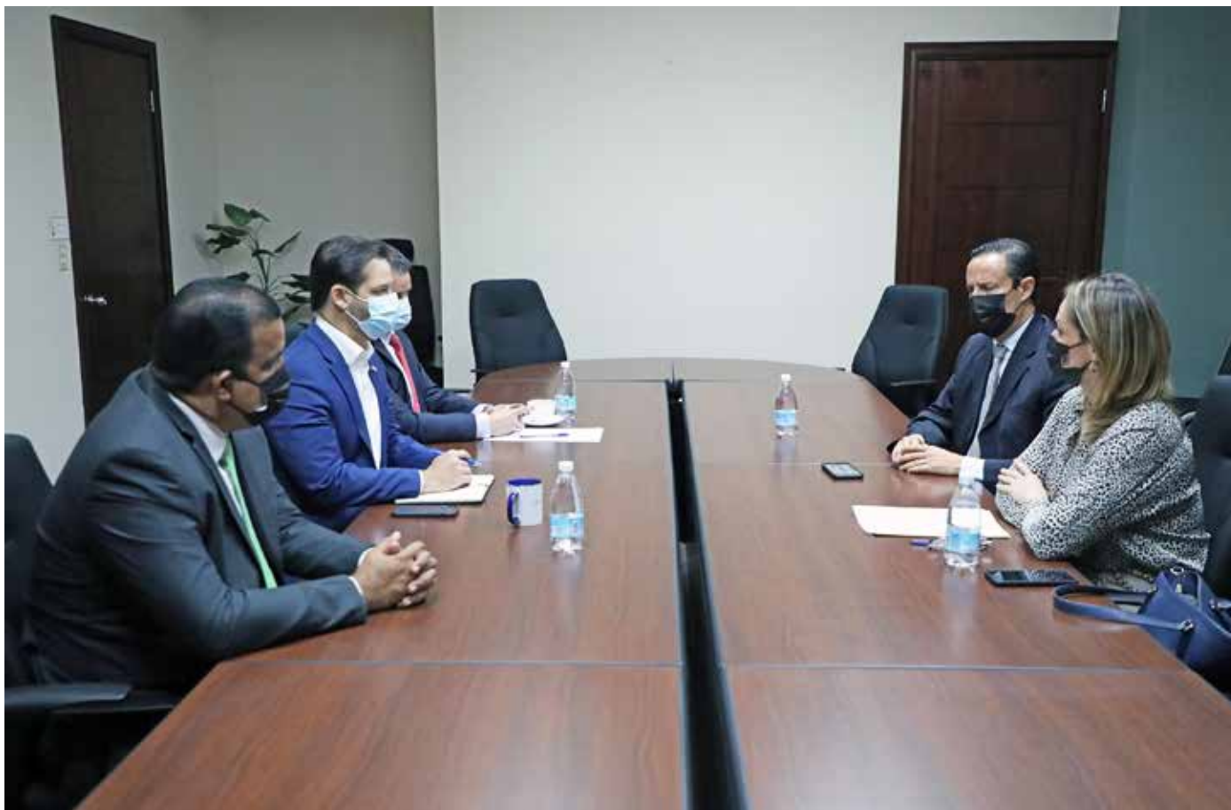
En el encuentro, se dio seguimiento a las propuestas de reactivación económica.

Recientemente, el presidente Laurentino Cortizo Cohen anunció que el Gobierno prepara una estrategia nacional para el sector industrial con visión al año 2050 que contribuirá a la evolución, diversificación y expansión hacia nuevos mercados internacionales.