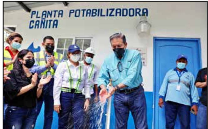
Por un monto de B/.2,830,892.00, se entregó el proyecto de mejoras a la potabilizadora en Cañita, para beneficio de 4 mil habitantes del distrito de Chepo.