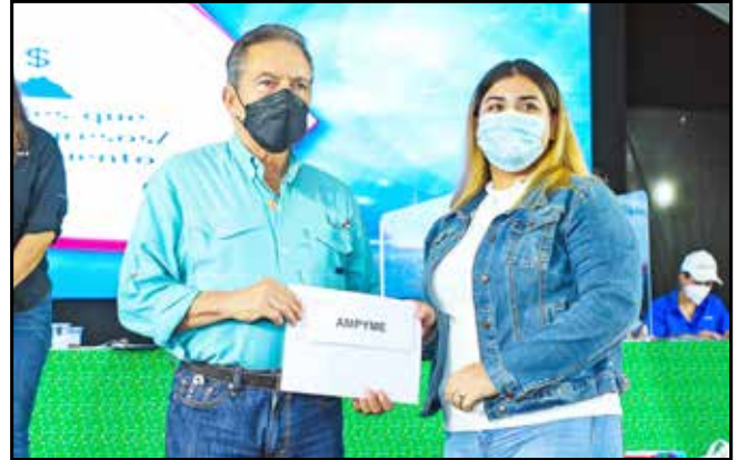
Entre beneficiarios del Programa Capital Semilla no reembolsable, se distribuyeron cheques por B/.60,000.00.