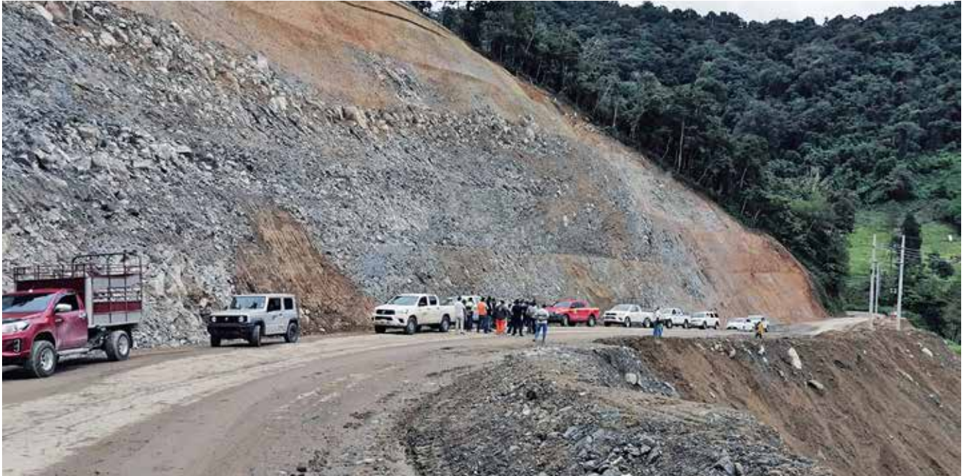
El Ministerio de Obras Públicas, a través de la empresa Ininco, S.A., realiza los trabajos de estabilización de los deslaves y daños causados por los huracanes Eta e Iota, en noviembre de 2020.