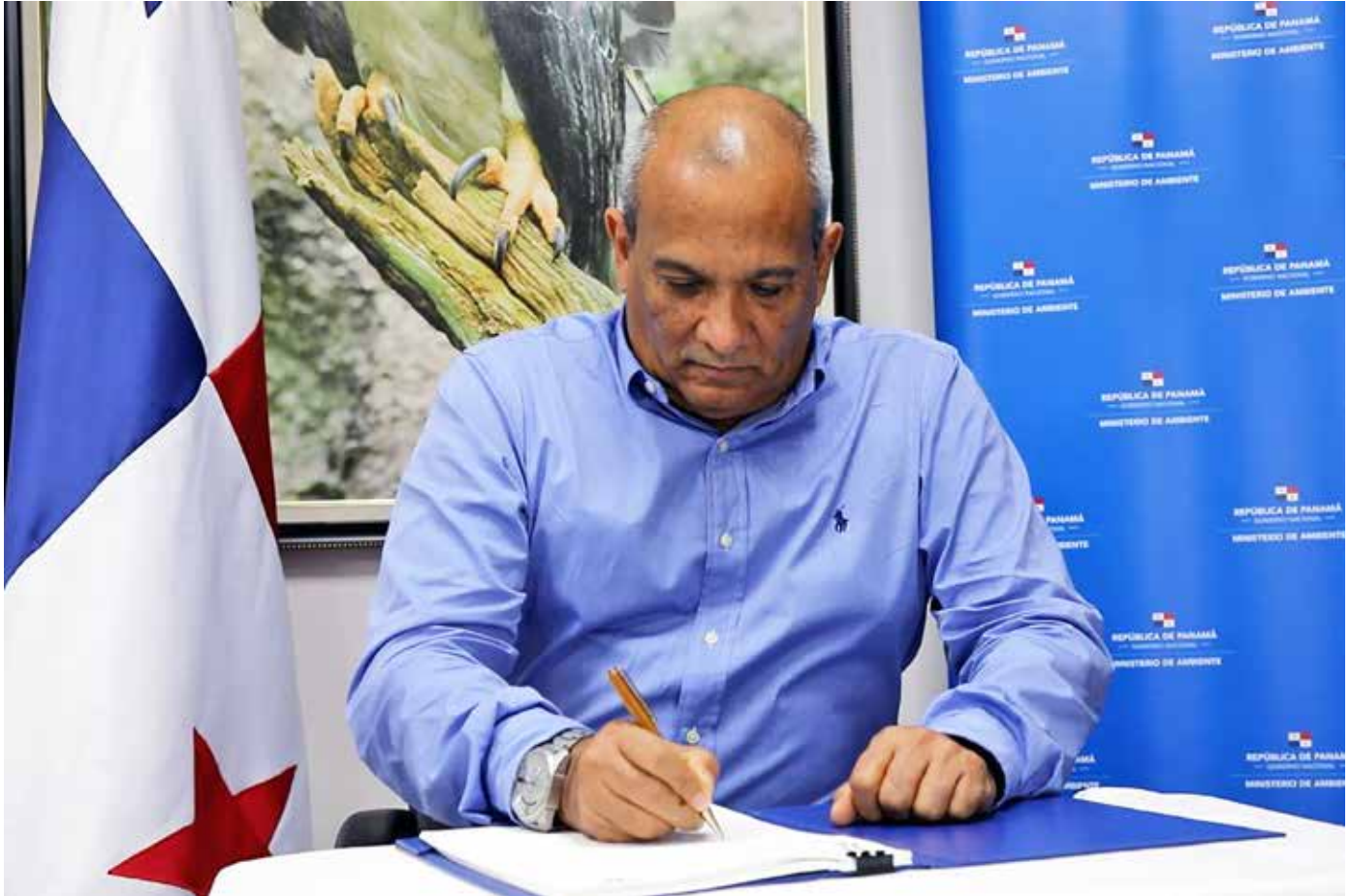
Milciades Concepción, ministro de Ambiente de Panamá firmó el Acuerdo de País Anfitrión.