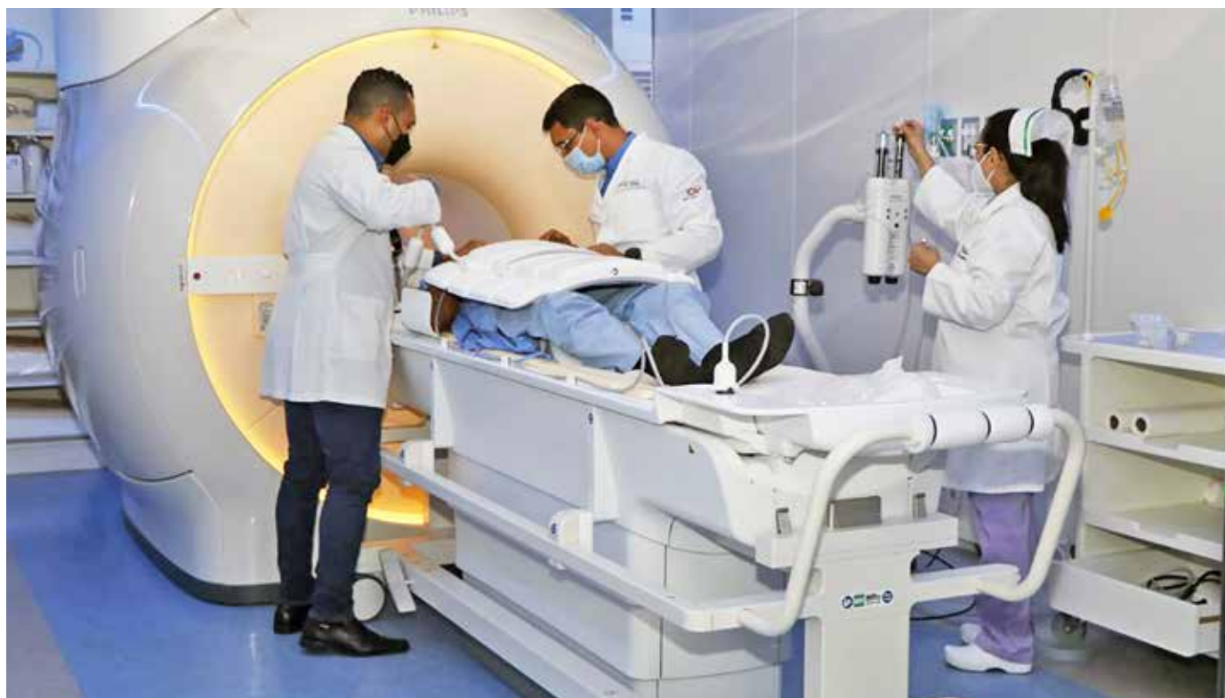
El ministro de Salud, Luis Francisco Sucre, inauguró el nuevo servicio de resonancia magnética en el Instituto Oncológico Nacional, que representa un gran avance en el diagnóstico de enfermedades.

cuello uterino, situaciones específicas de cáncer de mama y definir qué tan comprometido se encuentra el hígado”. Alcedo manifestó también que se reservan cupos para casos de urgencias o algún paciente hospitalizado que lo requiera.