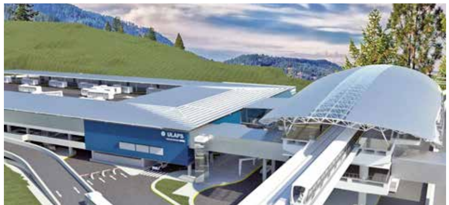
La extensión de la Línea 1 hasta Villa Zaíta tendrá una vía de acceso exclusiva para la Ulaps.

Los trabajos de acondicionamiento para la mudanza temporal de la Unidad Local de Atención Primaria de Salud (Ulaps) Edilberto Culiolis, en Las Cumbres, debido a la extensión de la Línea 1 del Metro hasta Villa Zaíta, mantienen un 90% de avance en el diseño y un 25% de la obra en sitio. Es importante resaltar que la sede temporal tendrá un espacio físico de 1,200 metros cuadrados, 400 más que la actual, lo cual ofrecerá una mayor comodidad a los asegurados, personal de salud y el público en general. La sede temporal de la Ulaps estará ubicada frente a la actual, en la plaza comercial Villa Zaíta, y permite el fácil acceso de los usuarios a los servicios de Medicina General, Gineco-Obstetricia, Pediatría, Odontología, Radiología, Farmacia, Laboratorio, entre otros. Una vez culminen las