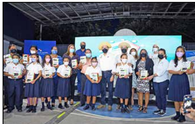
En materia educativa, se distribuyeron 170 tabletas a estudiantes de diversos centros educativos de la región.