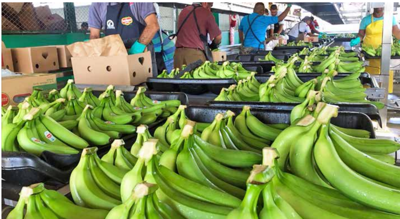
Banapiña de Panamá, S.A. es una de las empresas capacitadas en el uso de la plataforma digital.

Banapiña de Panamá, S.A., exportadora de banano que mostró un particular interés en beneficiarse de esta iniciativa tecnológica. Posteriormente se irán incorporando más exportadores y técnicos del MIDA de otras provincias al uso de esta herramienta al servicio del sector agropecuario.