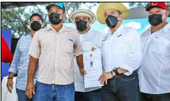
21 moradores recibieron los títulos de propiedad de las tierras que habitan. En lo que va del año, se han entregado 700 en esta provincia.