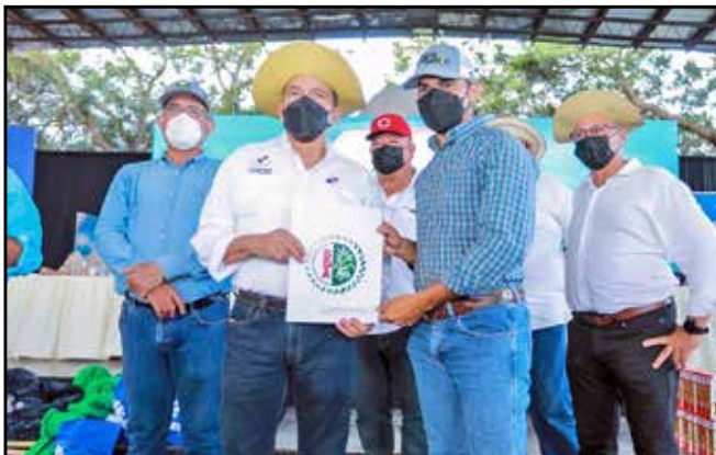
A través del Plan Panamá Agro Solidario, se canceló cheques a pequeños productores por un total de B/.329,450.