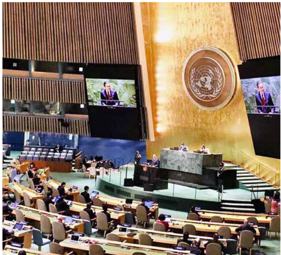
El gobernante panameño destacó el Plan Panamá Solidario y el proceso de vacunación como pasos exitosos para combatir la pandemia a causa de la Covid-19.

el presidente hizo hincapié en que Panamá se ofrece, una vez más, como puente para aproximar a las naciones, buscar soluciones comunes a los problemas y enfrentar los desafíos regionales y globales. “Podemos hacerlo con una hoja de ruta marcada por la solidaridad y el respeto por los derechos humanos. Podemos hacerlo a través del diálogo amplio y honesto, enfocando el esfuerzo internacional en mantener la paz social, en dotar de las vacunas necesarias a todos los países, para salvar vidas, preservar la salud y encaminarnos, todos, lo más pronto posible, a la recuperación económica global”, subrayó el presidente Cortizo Cohen.