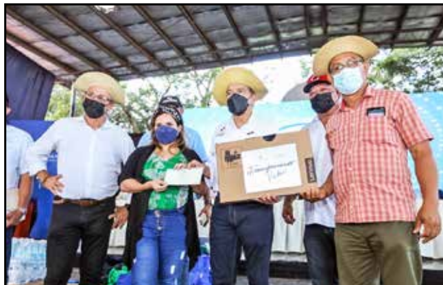
Estudiantes recibieron becas del Ifarhu y "laptops" del Programa Transformando Vidas.