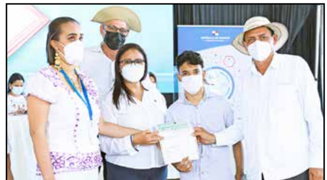
Se dieron aportes del subsidio de capital semilla a través del proyecto Fami -Empresas, dirigido a las personas con discapacidad y sus familias.