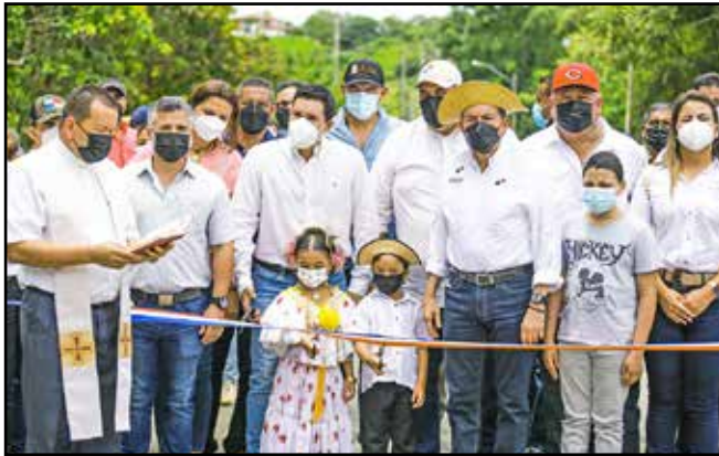
En El Ciruelo, se inauguró la carretera Pedasí - Los Asientos - Cañas, valorada en B/.18,054,244.00, que favorece a más de 14 mil habitantes.

Comunidades visitadas: Oria Arriba, Tonosí, El Cacao, Vallerriquito, La Tiza y Las Tablas.