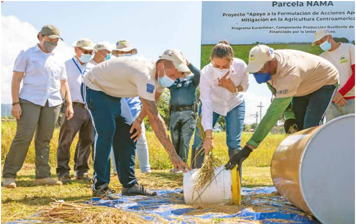
Los privados de libertad recibieron certificados de capacitación de la Escuela de Campo para Agricultores.