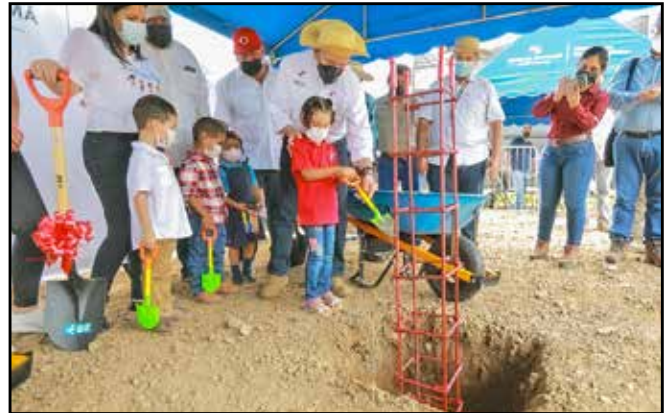
En el distrito de Tonosí, se hizo entrega del Centro de Atención Integral a la Primera Infancia (Caipi), por un valor de B/.362,900.00.