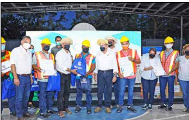
15 participantes de los diversos cursos dictados por el Inadeh recibieron sus certificados de culminación de cursos.