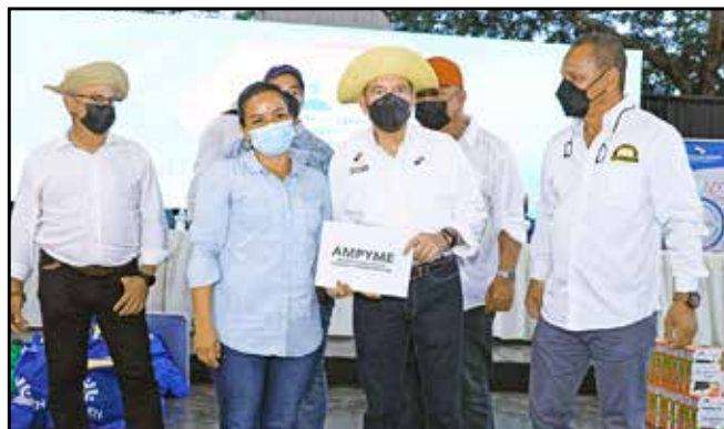
Del Programa Capital Semilla no reembolsable, se distribuyeron B/.40,000.