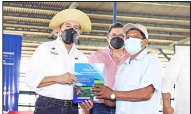
Productores del corregimiento de Vallerriquito recibieron 15 bovinos del Programa Un Mejor Semental y 150 kilos de pasto mejorado.