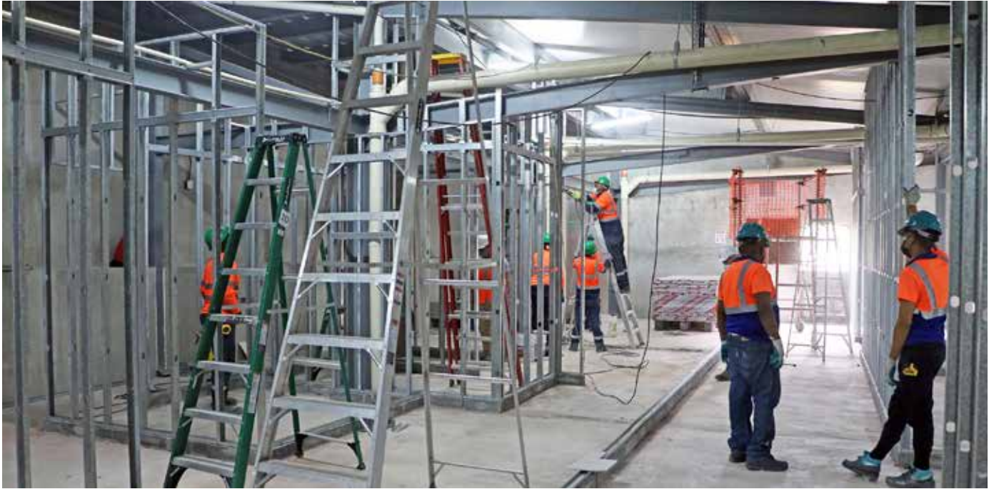
Adecuaciones que se realizan en la infraestructura temporal de este importante puesto de salud de la CSS.