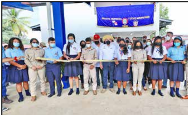
Se inauguró las instalaciones del Instituto Profesional y Técnico Agropecuario de Tonosí, con una inversión de B/.7,402,867.33 y que alberga a 430 estudiantes.