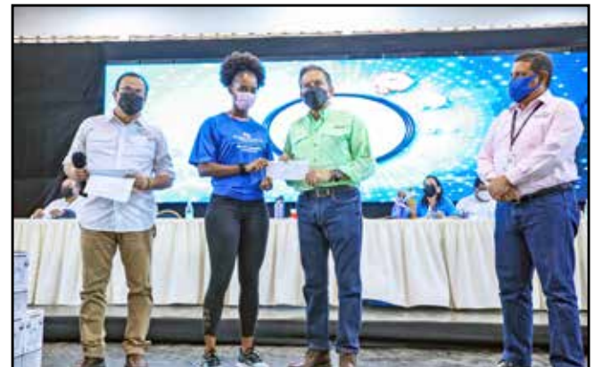
Se entregaron estímulos deportivos a cinco atletas y bolsas con implementos deportivos a las ocho juntas comunales del distrito de Arraján.