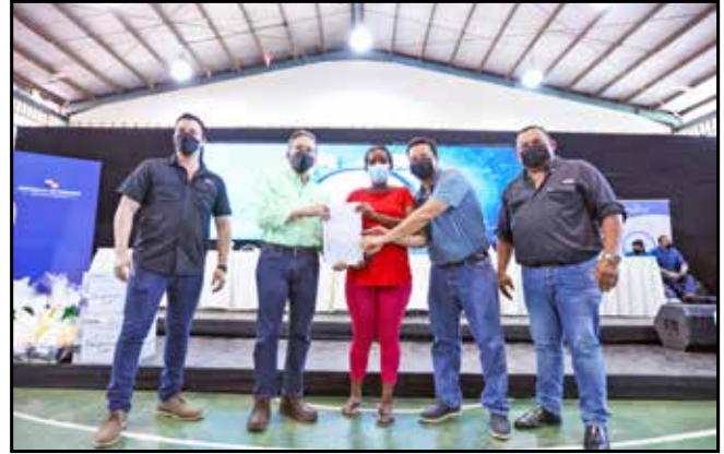
Del Programa Tu Casa, Tu Oportunidad, se otorgó a 10 residentes del lugar la escritura pública del terreno donde habitan.