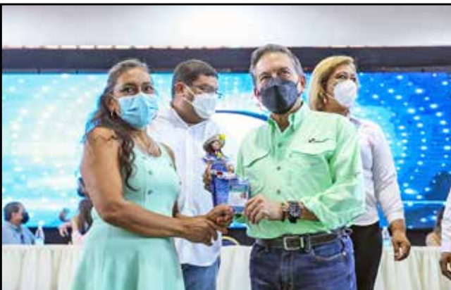
22 artesanos recibieron sus acreditaciones dentro del programa que busca llevar un registro nacional, reconocer al artesano, la producción, el origen de las artesanías e incentivar su desarrollo.