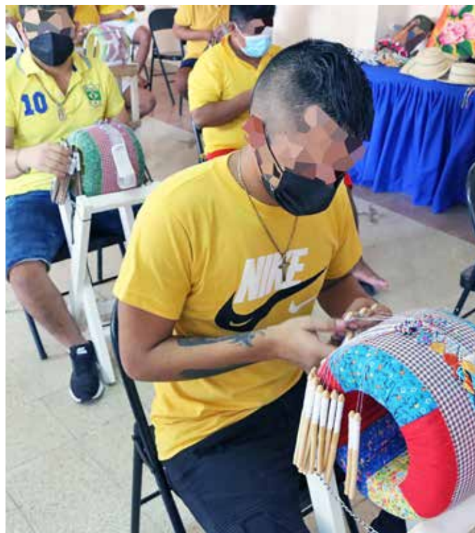
Privados de libertad trabajan en la reconstrucción de sillas para estudiantes, programas agrícolas y talleres artesanales, entre otros.