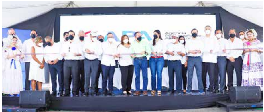
El jefe del Ejecutivo firmó el Decreto Ejecutivo N°125 del 29 de septiembre de 2021 que reglamenta la Ley 206 de 2021, que crea la Agencia Panameña de Alimentos.