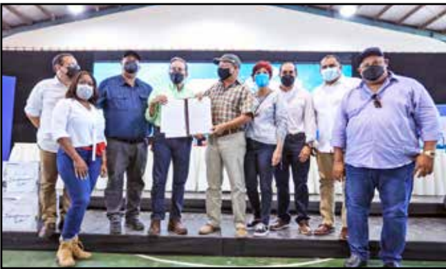
Con una inversión de B/.9,186,000, se procedió con el Acta de Entrega Anticipada de Bienes a la Federación de Fútbol de Panamá de un terreno en el corregimiento de Burunga, para el desarrollo de un centro deportivo de alto rendimiento.