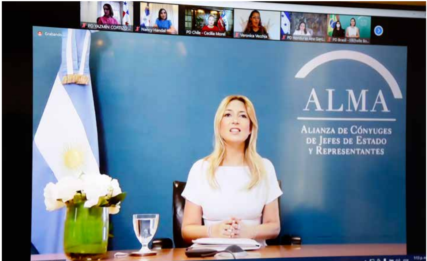
Fabiola Yáñez, primera dama de Argentina y presidenta saliente, agradeció la confianza que depositaron en su gestión.