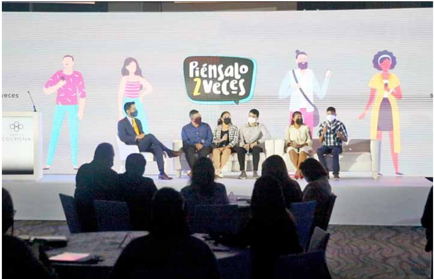
Jóvenes de Panamá Oeste participaron en el lanzamiento de la campaña.