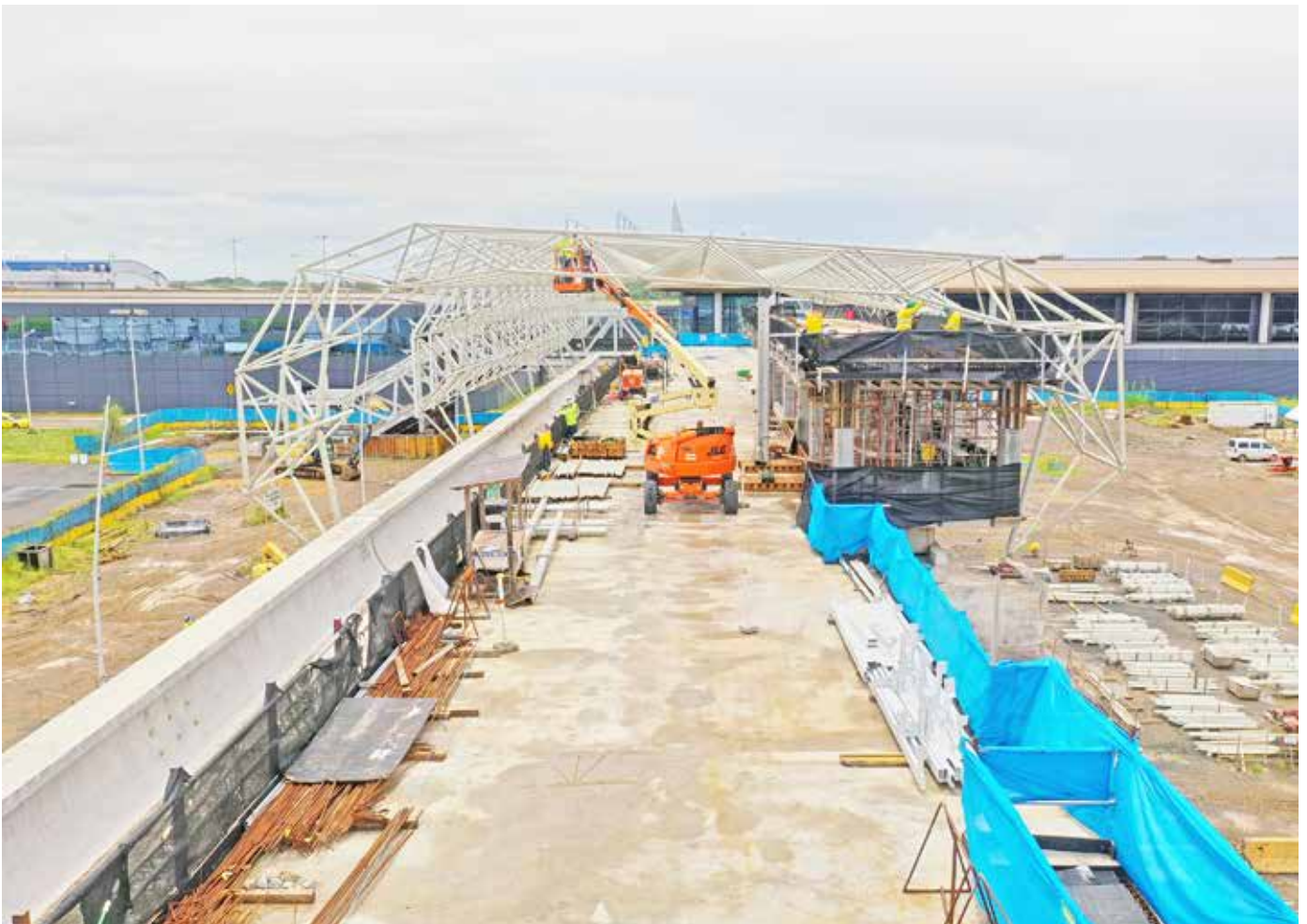
Las cuadrillas del MOP trabajan día y noche en las principales avenidas de la ciudad capital.

los 20 a 42 metros, y montaje de la cubierta de la Estación ITSE. La Estación Aeropuerto registra un 78% de avance, y se estima que a finales de 2021 se complete el montaje de su cubierta y pasarela. Por su parte, la Estación ITSE tiene un 84% de avance, su conectividad beneficiará a más de 5 mil estudiantes del Instituto Técnico Superior Especializado (ITSE), estudiantes del Inadeh, escuelas y comunidades aledañas.