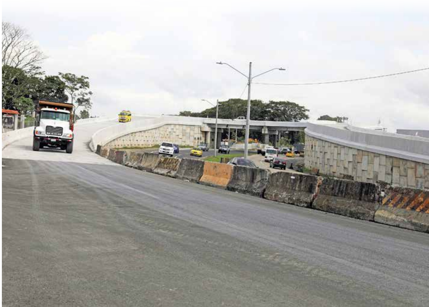
El MOP trabaja en la habilitación del retorno tipo herradura sur, localizado cerca del Colegio Francisco Beckman.

uno es el intercambiador de La Cabima y sus retornos en Ciudad Bolívar, así como la ampliación de la vía de Villa Grecia hasta Chilibre y el puente Don Bosco.