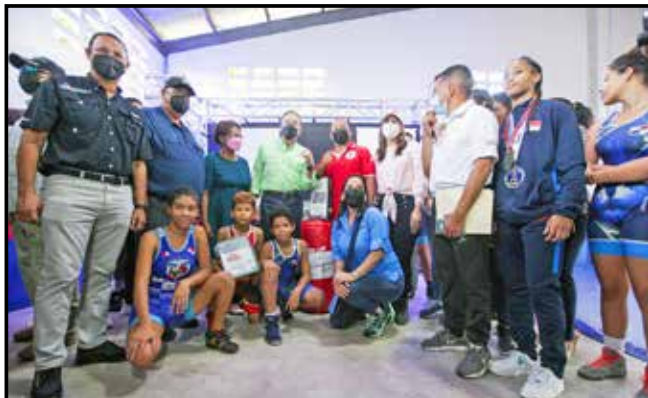
Se inauguró el Gimnasio Municipal de Lucha y Boxeo de Arraiján y se entregó implementos a deportistas, a través del Programa Transformando Vidas.