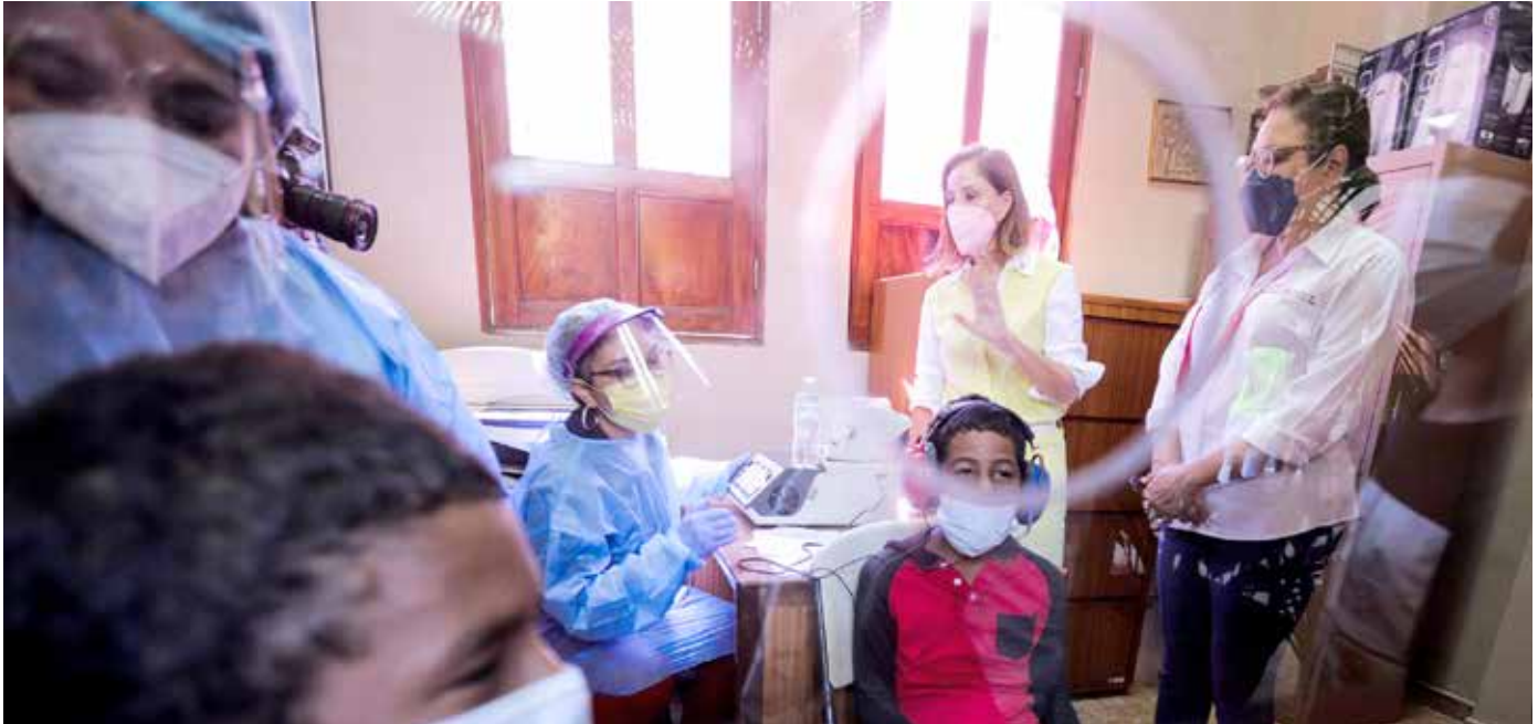
Más de 100 niños y adolescentes de San Felipe y Santa Ana tuvieron evaluaciones visuales y auditivas.