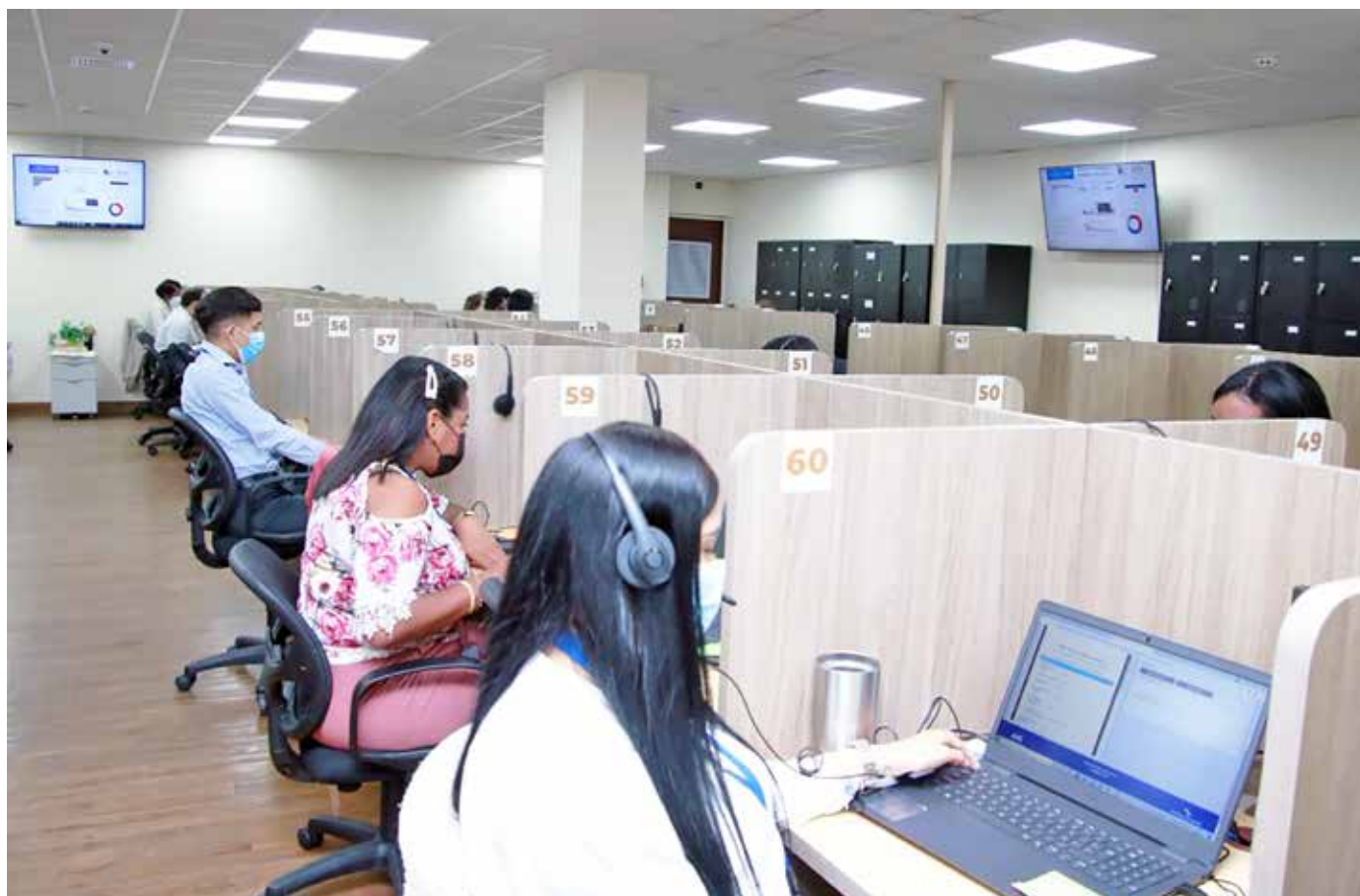
La Teleconsulta y el Expediente Electrónico son avances tecnológicos de gran impacto en Panamá.

y expedición de citas desde casa. En la Telemedicina, se brindan citas al paciente, el médico lo atiende desde una instalación de salud y se le hacen igual las recetas. Un total de 19 médicos se encargan de atender a los pacientes por medio de este servicio. El titular de Salud detalló que este servicio ha evolucionado más rápido de lo planificado y que Darién, las comarcas Guna Yala, Ngäbe Buglé y Emberá, son las únicas regiones que no cuentan con Teleconsulta debido a la conectividad, aunque ya se trabaja en las adecuaciones.