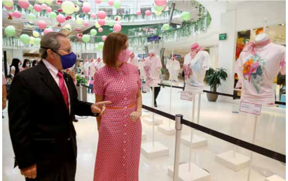
La primera dama de la República, Yasmín Colón de Cortizo, participó en el lanzamiento de la campaña “2 minutos para la vida”, de FundAyuda.

Con la llegada de octubre, se inician las actividades en conmemoración del Mes de Sensibilización sobre el Cáncer de Mama. El pasado miércoles 29 de septiembre, la primera dama de la República, Yasmín Colón de Cortizo, acompañó a FundAyuda al lanzamiento de la campaña “2 minutos para la vida”, en la que se destaca que el autoexamen es fundamental y solo dura dos minutos que pueden salvar miles de vidas. Colón de Cortizo recordó que son 20 años en los cuales esta fundación ha trabajado por la salud de las mujeres en Panamá, cuando en 2001 fueron pioneros lanzando la campaña de la Cinta Rosada junto a Esteé Lauder. Por otro lado, desde este viernes 1 de octubre se hizo el tradicional encendido de luces en el Palacio Presidencial, como parte de la campaña de la Cinta Rosada a la cual se unen instituciones y la empresa privada para crear conciencia sobre el cáncer de mama y su detección temprana. El Despacho de la Primera Dama, junto a la Asociación Pro Obras de Beneficencia, se prepara para la segunda edición de Subasta por la Vida, a beneficio del Instituto Oncológico Nacional, en el que más