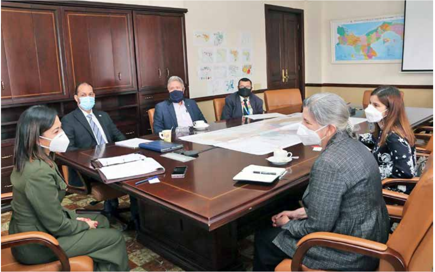
El Depósito de Respuesta Humanitaria de las Naciones Unidas (UNHRD) del Programa Mundial de Alimentos (PMA) y la Federación Internacional de la Cruz Roja y la Media Luna Roja (IFRC) son usuarios del Hub Humanitario.