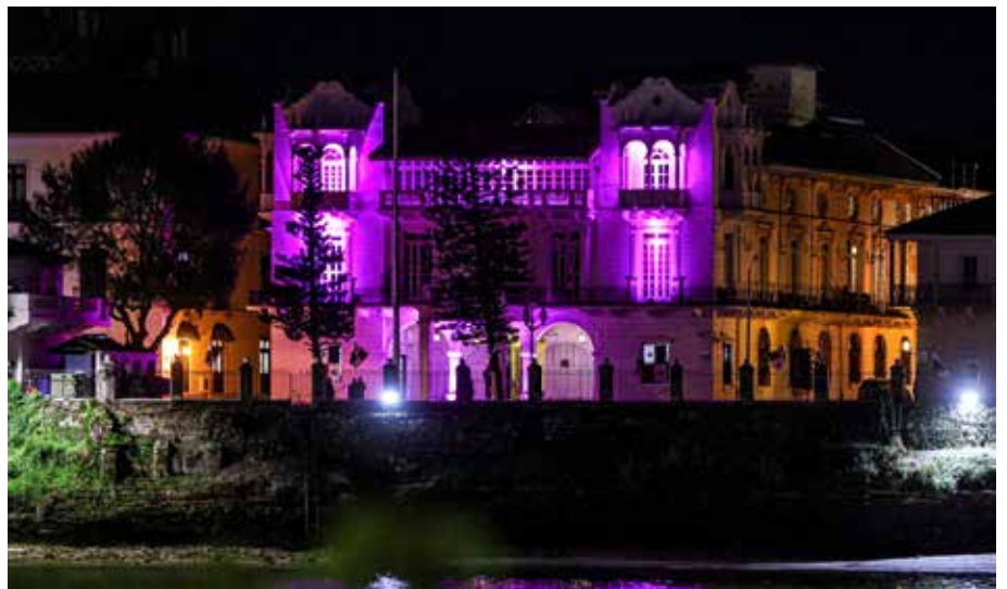
Este viernes 1 de octubre se hizo el tradicional encendido de luces en el Palacio Presidencial, como parte de la campaña de la Cinta Rosada.

Del 5 al 20 de octubre, en la Casa Club del Parque Recreativo y Cultural Omar, se llevará a cabo la segunda versión de la Subasta por la Vida, en beneficio del hospital Oncológico.