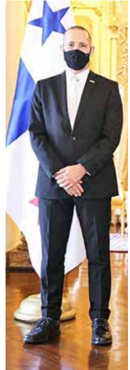
Seis nuevos embajadores se acreditan ante el Gobierno de Panamá