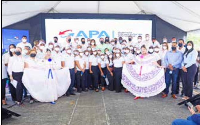
El presidente participó en la puesta en operación de la nueva Agencia Panameña de Alimentos (APA), que tramitará los registros de productos nacionales y sus procesos de exportación, y que reemplazó a la Aupsa.

Comunidades visitadas: Arraiján Cabecera