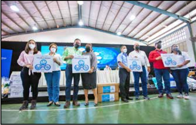
Las escuelas La Herradura, La Playita de Bique, Fuente de Amor y El Espavé recibieron el certificado de Escuela Segura, que les permite reanudar clases de forma semipresencial.