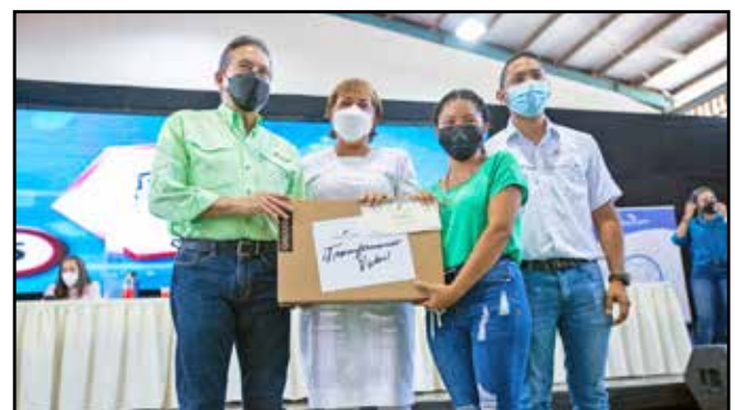
A través del Programa Transformando Vidas, se otorgaron becas y "laptops" a estudiantes de centros educativos del área.