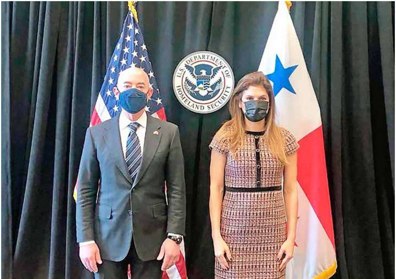
La canciller Erika Mouynes y Alejandro Mayorkas, secretario del Departamento de Seguridad Nacional de Estados Unidos.

Mark Green, del Subcomité del Hemisferio Occidental y del Comité de Relaciones Exteriores de la Cámara de Representantes; el senador Robert Menéndez, presidente del Comité de Relaciones Exteriores del Senado; el congresista Gregory Meeks, presidente del Comité de Relaciones Internacionales de la Cámara de Representantes; y también con el presidente del Banco Interamericano de Desarrollo (BID), Mauricio Claver-Carone.