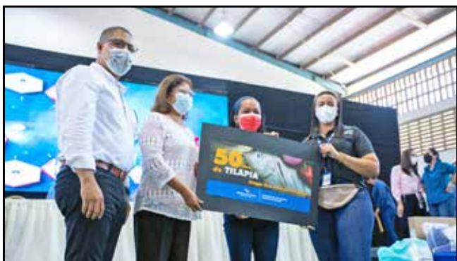
El Hogar San José de Malambo y la Fundación Luz en Mi Camino recibieron, cada uno, 50 libras de tilapias para su siembra y posterior cosecha.