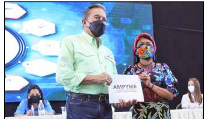
Del Capital Semilla no reembolsable, Ampyme entregó B/.40,000, distribuidos entre 20 emprendedores, para el inicio de sus negocios.