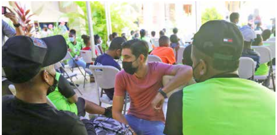
El exarquero de la Selección Nacional de Fútbol Jaime Penedo apoyó la iniciativa e hizo entrega de balones y libros autografiados.

El Despacho de la Primera Dama de la República, a través de la Dirección de Proyección Social, realizó el pasado viernes una jornada de evaluación en el corregimiento de San Felipe, como parte del programa “Ver y Oír para Aprender”. En la misma se beneficiaron unos 130 niños que pertenecen a la Fundación San Felipe (15), a la Fundación Jaime Penedo (96) y del Barrio de San Felipe y Santa Ana (19), quienes recibieron evaluaciones en Optometría, Fonoaudiología y Odontología; además de servicios de vacunación. Durante la jornada, también se hizo entrega de bolsas con balones de fútbol, kits escolares, mascarillas, leche y alimentos a todos los niños y niñas presentes. La primera dama, Yasmín Colón de Cortizo, compartió una amena mañana con los asistentes, llevando a cabo dinámicas y juegos junto a Jaime Penedo y su equipo. Se obsequiaron premios por