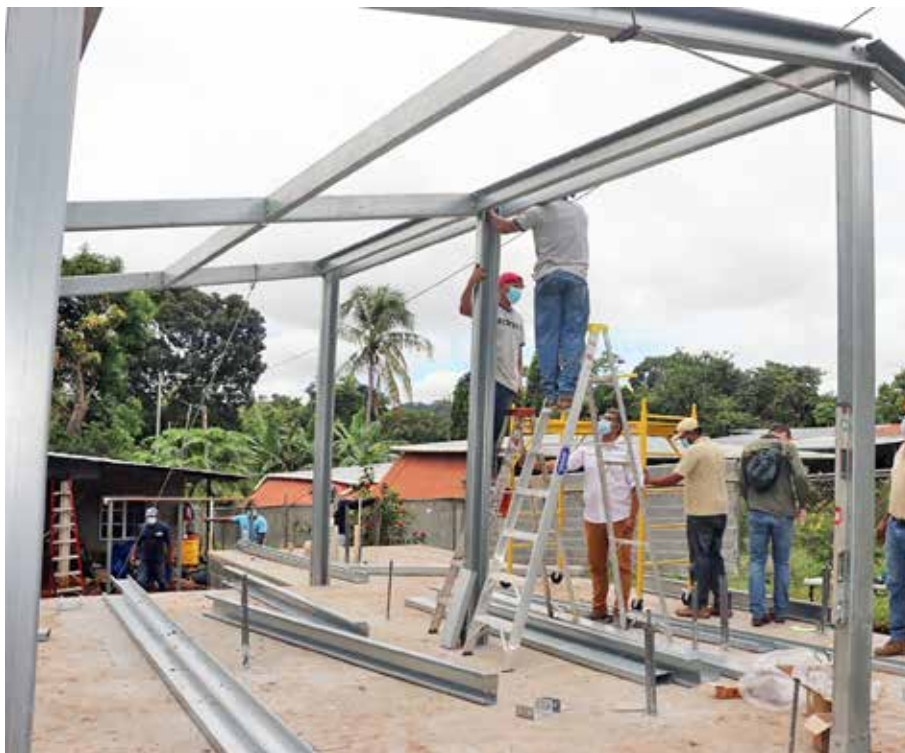
Cuadrillas del Miviot continúan con la construcción de viviendas del Plan Progreso a nivel nacional.

Este es un modelo más económico para atender la necesidad habitacional de esta población.