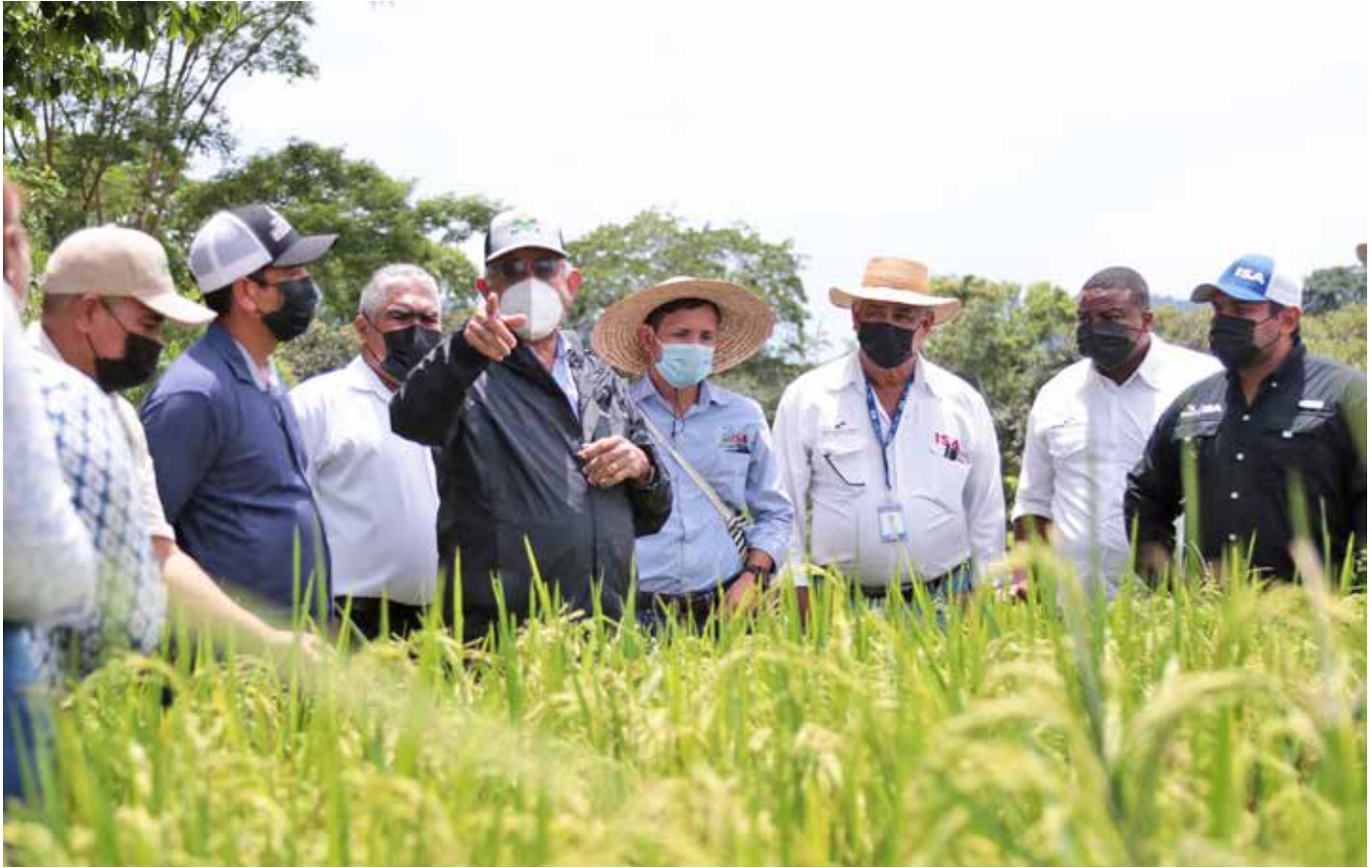
El ministro Augusto Valderrama participó en el acto de graduación.