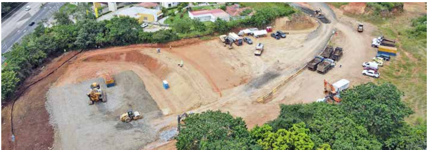
Ciudad del Futuro, donde se ubica una estación, es otro de los frentes donde han empezado estos trabajos.