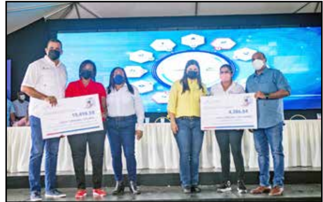
Para la instalación en seis escuelas del servicio básico de agua con tanques de reserva plásticos y metálicos, se entregó B/.23,885 para distribuir entre las juntas comunales de Chilibre y Las Cumbres.