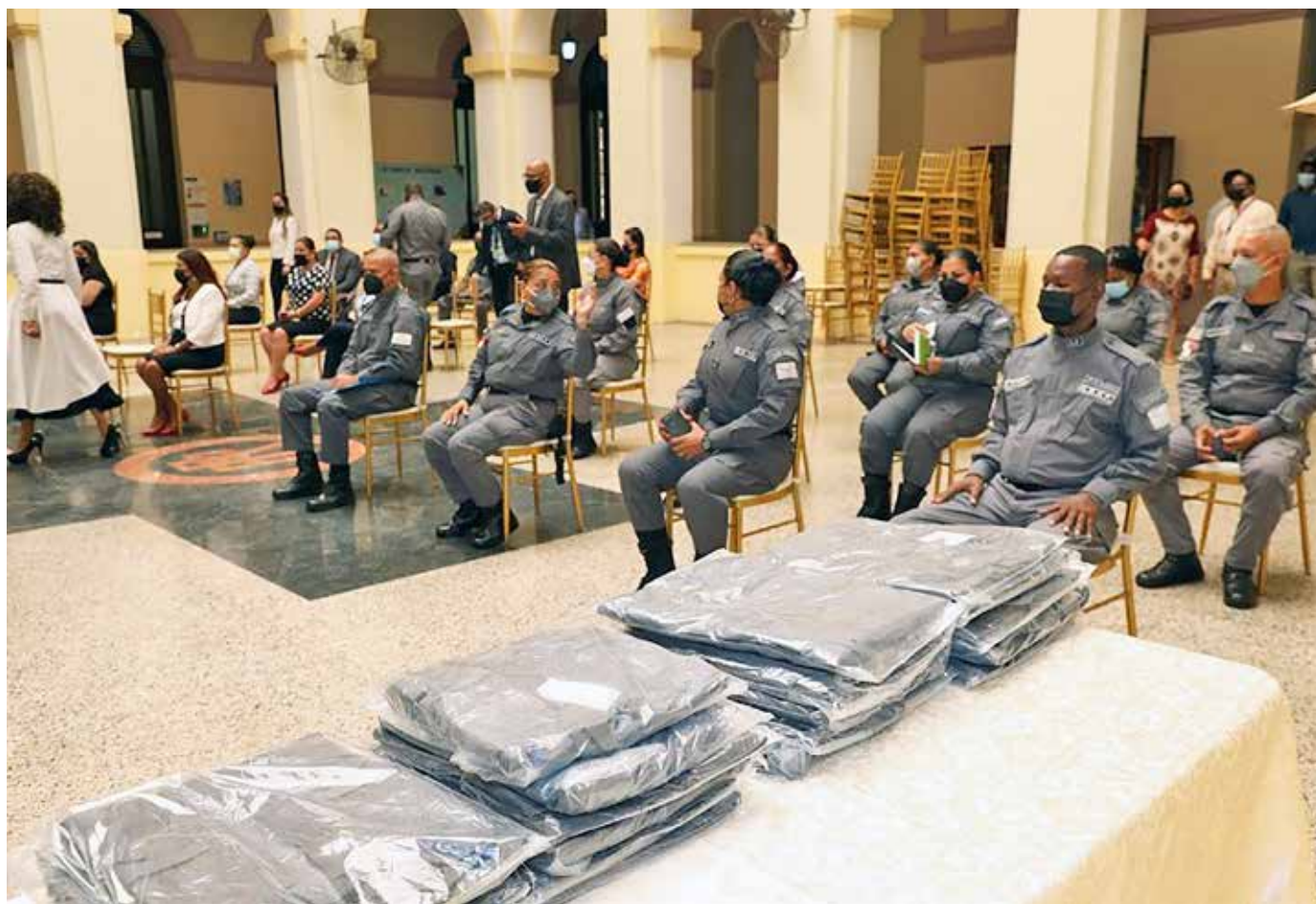
Los empleados recibieron uniformes y certificados tras culminar un curso de formación básica para oficiales.