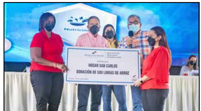
Los hogares San Carlos, Dalexa, Bella Vista y Las Cumbres, donde se encuentran reclusos adultos mayores en condición especial, encamados, discapacitados y con demencia senil, recibieron la donación de arroz (1,100 libras en total).