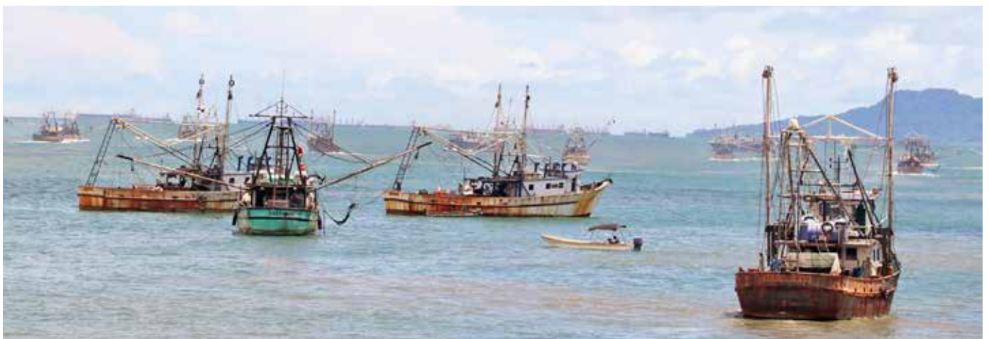
Las embarcaciones camaroneras salieron al mar desde las 12.01 p.m.

un bajón del 20% el año pasado y se espera, en esta ocasión, una abundante pesca de camarón para subir esas cifras a un porcentaje importante.