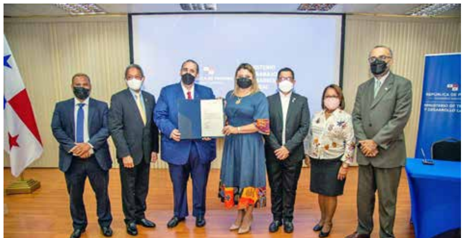
Innovación gubernamental en el Mitradel.