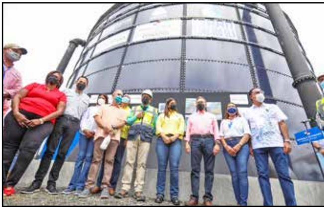
Con una inversión de B/.6,312,530.29, se hizo entrega del tanque de acero vitrificado de 1.07 millones de galones de agua que mejorará el servicio de agua potable de más de 50 mil residentes de Alcalde Díaz.

Comunidades visitadas: Alcalde Díaz, Las Cumbres, Chilibre.