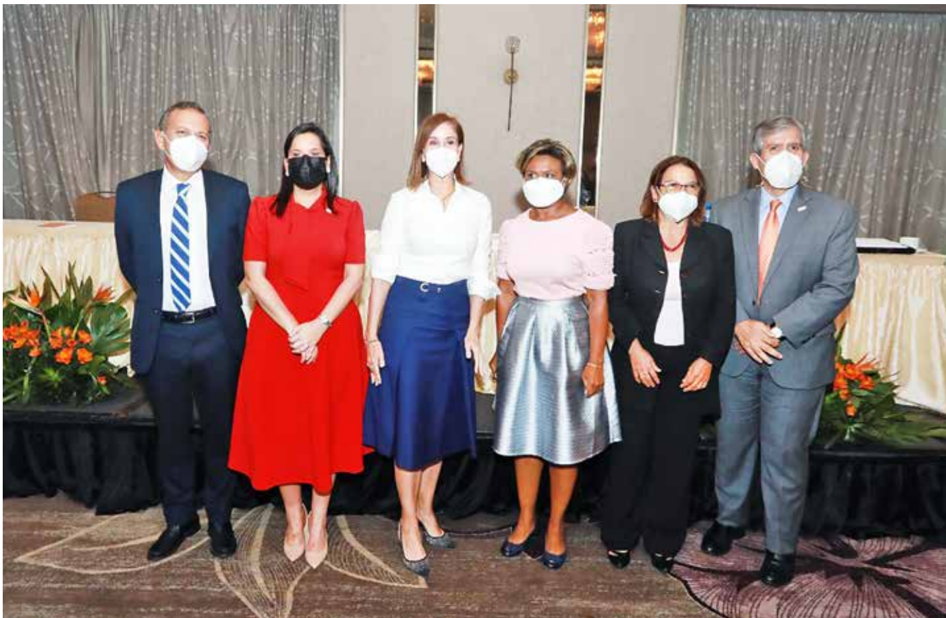
La viceministra de Salud, Ivette Berrio, y la primera dama, Yasmín Colón de Cortizo, destacaron la importancia de aplicar políticas de prevención para disminuir los embarazos en adolescentes.