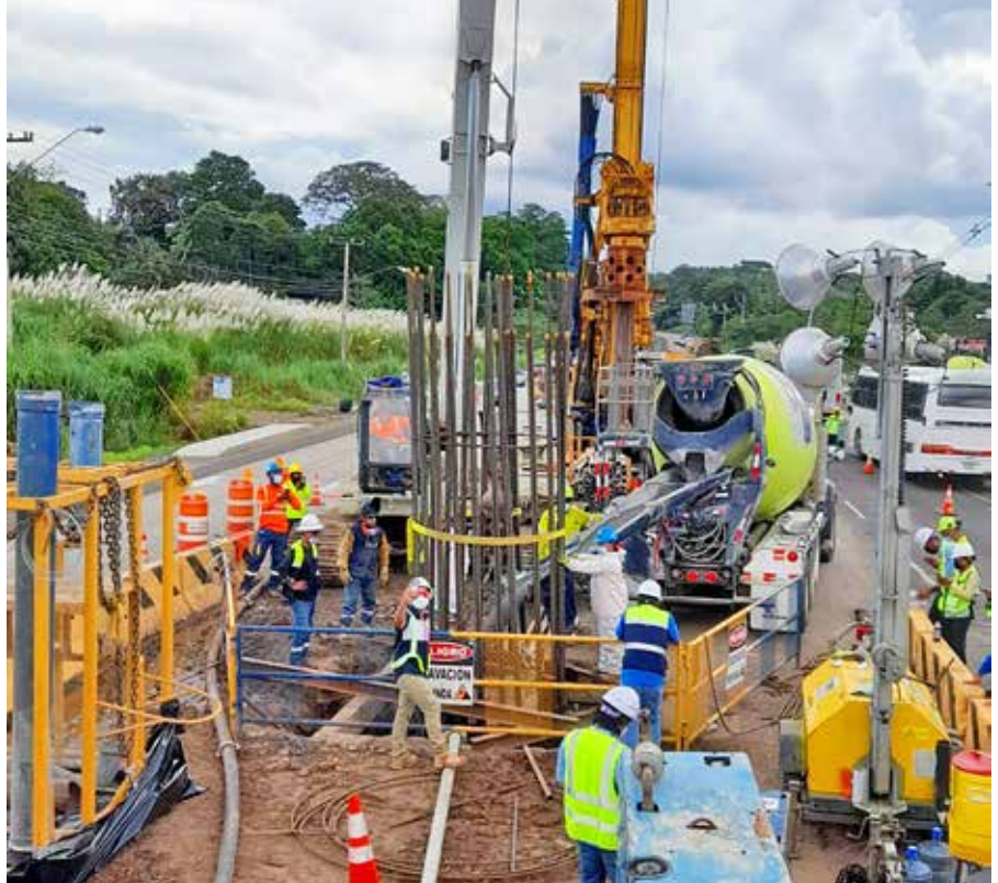
Vaciado de concreto del primer pilote que dará paso a una de las columnas de la Línea 3.

Los pilotes de este proyecto tendrán mayor diámetro que los de las líneas anteriores, por las condiciones del diseño.