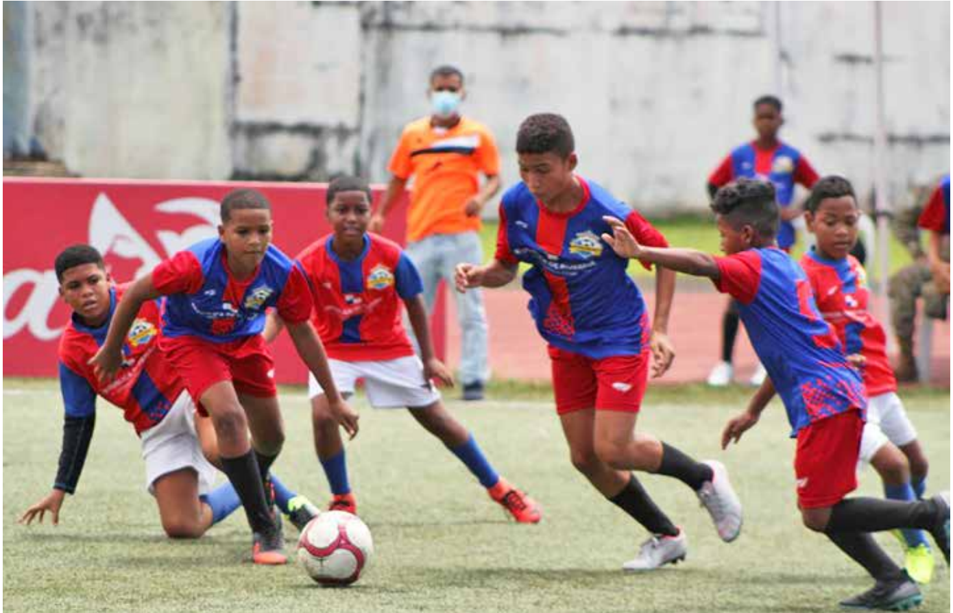
Los ganadores de las tres categorías participantes representarán a Panamá en un campeonato en Costa Rica.