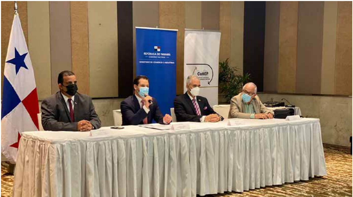
Directivos del CONEP y del Mici durante el anuncio de resultados de la Comisión.