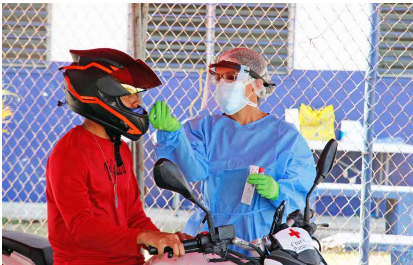
La operación PanavaC-19 ha llegado a todas las provincias y comarcas del país.

(porcentaje de muertes entre quienes se confirmaron con la Covid-19), siendo el país de las Américas con más baja letalidad y a su vez está debajo del promedio para la Región, que es del 2.5%.