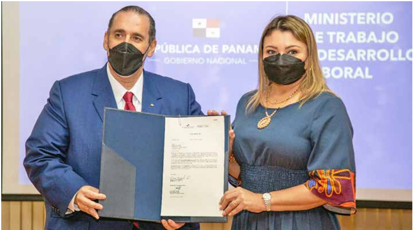
Digitalización masiva de documentos.