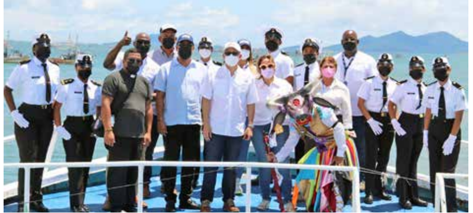
El viceministro Carlo Rognoni, en compañía de la administradora general de la ARAP, Flor Torrijos, y el equipo de la ARAP.

La pesca de camarones se reactivó con el zarpe de 102 embarcaciones camaroneras, con 510 tripulantes, desde el puerto de Vacamonte, en la provincia de Panamá Oeste, tras la culminación de la segunda veda del camarón, que se inició el 1 de septiembre y terminó el 11 de octubre de este año. El viceministro de Desarrollo Agropecuario, Carlo Rognoni, y la administradora general de la Autoridad de Recursos Acuáticos de Panamá (ARAP), Flor Torrijos, fueron los encargados de realizar el tradicional disparo de luces de bengala que anuncia la salida al mar de los barcos. Rognoni indicó que con esta restricción se comprueba la necesidad que tiene el ser humano de compaginar y coexistir con el medio ambiente, ya que esta pausa le permite a la madre naturaleza regenerarse y repoblarse, por lo que es necesario realizarla dos veces al año con el concurso de los pescadores, de los que trabajan en las embarcaciones y de los empresarios, debido a que sin ella se agotarían los recursos de forma indiscriminada y todos quedarían sin sustento. Por su parte, Torrijos expresó que en esta ocasión tomaron