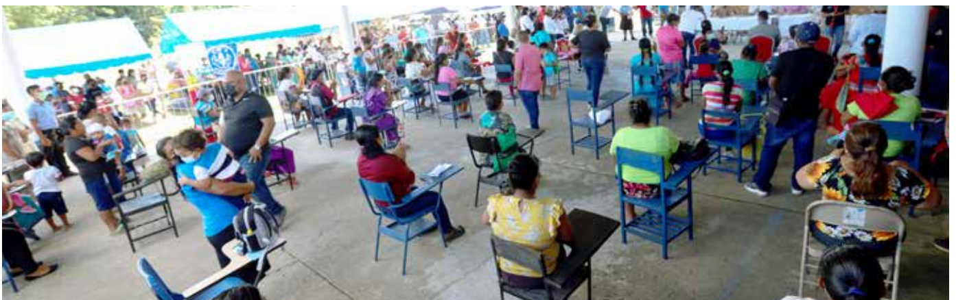
3,000 habitantes de la comunidad de Río Luis recibieron las ayudas.