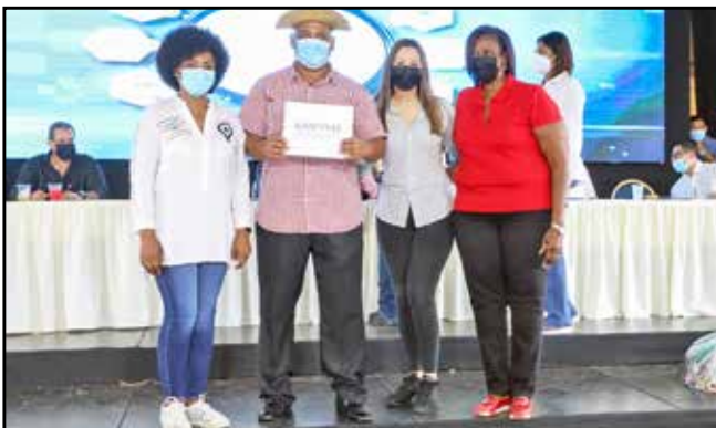
Cinco emprendedores recibieron su certificado de registro empresarial, de un total de 1,909 que se han entregado en lo que va de 2021.