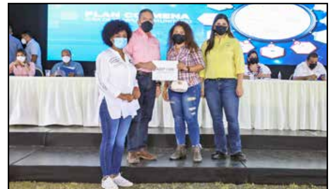
Un total de B/.30,000 fueron entregados en concepto de capital semilla no reembolsable a microempresarios.