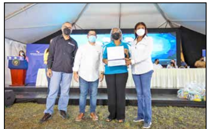
El Ministerio de Trabajo y Desarrollo Laboral entregó certificados de capacitación laboral que totalizan 4,170 los emitidos desde enero a la fecha.