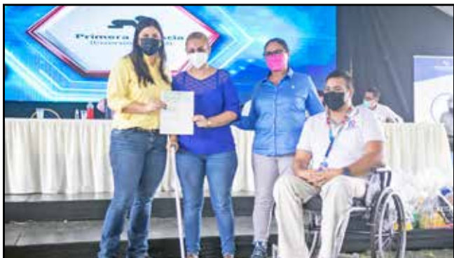
Seis familias beneficiarias del Programa Fami Empresas recibieron aportes para iniciar sus emprendimientos, con el fin de lograr su inserción en el sistema productivo.