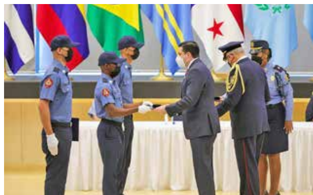
El vicepresidente de la República entregó los certificados a los tres primeros puestos de la promoción ‘Titanes de Fuego’.