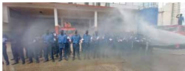
Los nuevos bomberos fueron recibidos con el tradicional bautizo con chorro de agua.