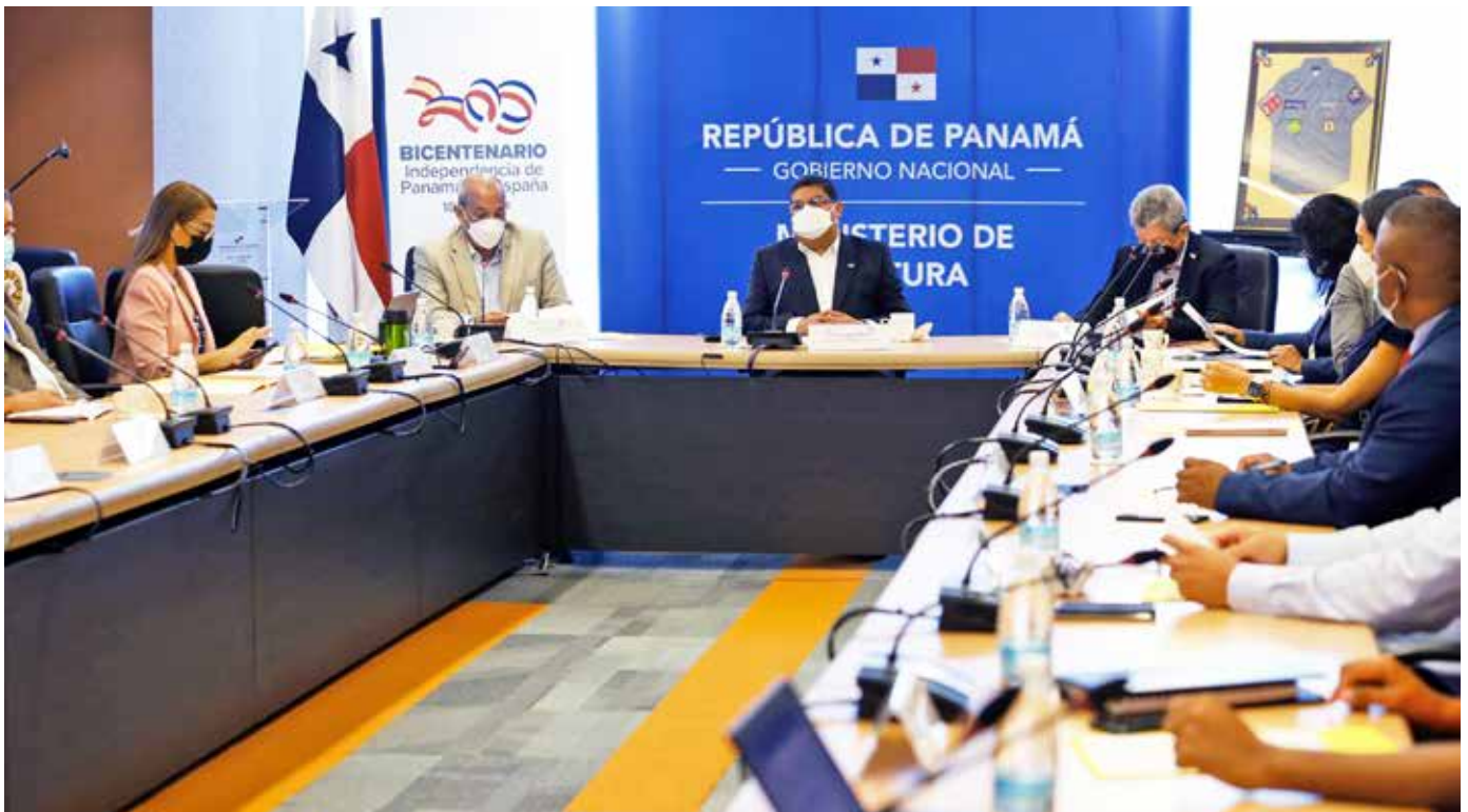
Todas las entidades que integran la comisión interinstitucional presentaron sus informes.

Cambio Climático como medio para la toma de decisiones en la realización de todas las obras que implica esta ejecución, medida que, de acuerdo con esta institución, es cada vez más necesaria, recordando que el cambio climático es una realidad.