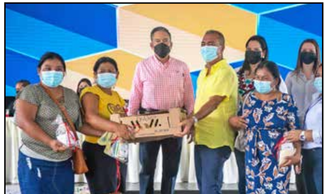
Del Programa Red de Familias, se aportaron insumos agrícolas y avícolas para garantizar la seguridad alimentaria. A la fecha, han sido beneficiadas 40 familias del área.