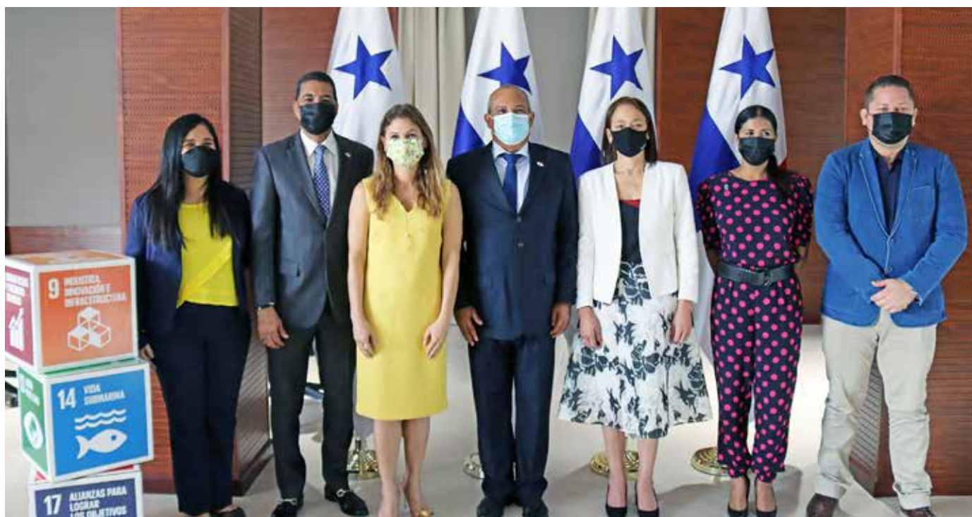
Acto de lanzamiento de la campaña "El Otro Virus".

adecuadamente en la basura, para que no terminen en nuestros ríos, mares y océanos, contaminándolos y afectando nuestra salud.