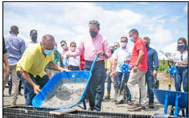
A un costo de B/.6,051,048.63, se inició la construcción de la vía Mocambo - Villa Grecia, que facilitará la conectividad en el sector de Panamá Norte.