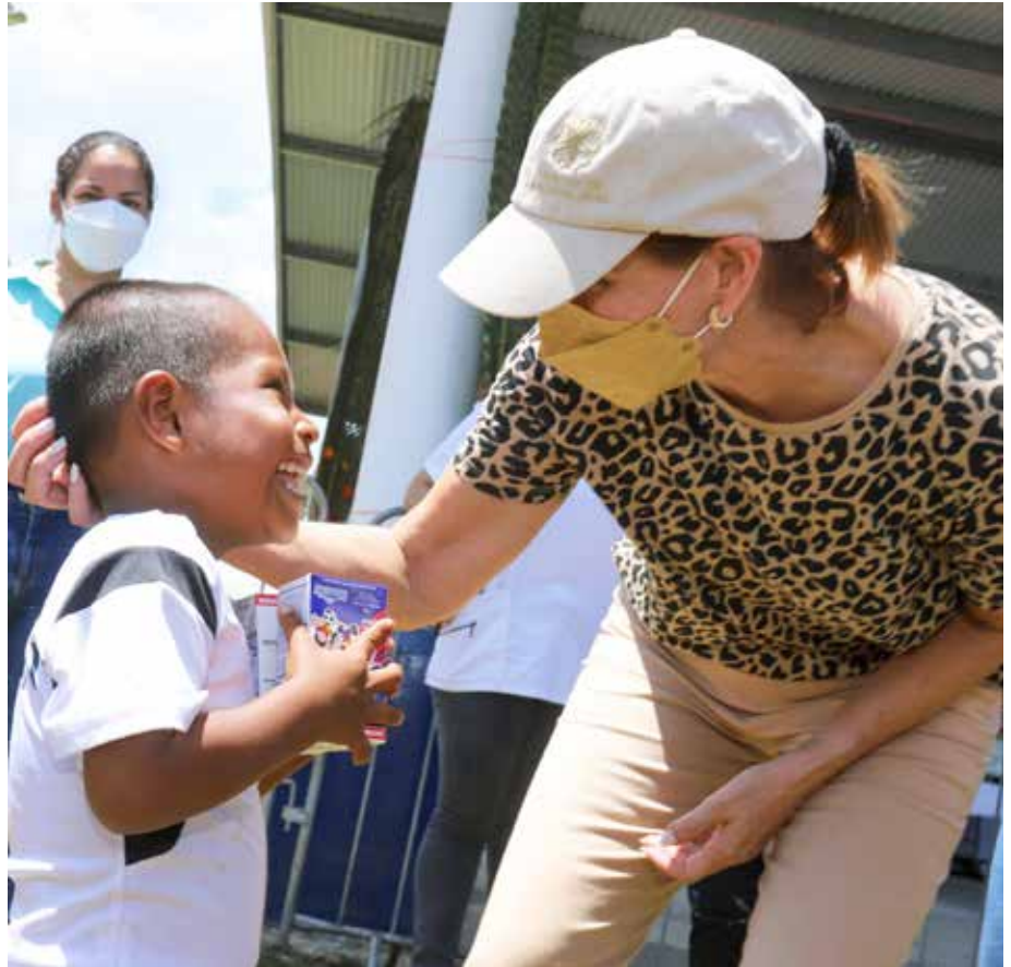
La primera dama, en conjunto con otras instituciones del Estado, entrega beneficios a los residentes de estas comunidades.

A través de la Dirección de Asistencia Social, el Despacho de la Primera Dama, dirigido por Yasmín Colón de Cortizo, realizó una gira para llevar ayudas a la comunidad de Río Luis, corregimiento del mismo nombre, en el distrito de Santa Fe, provincia de Veraguas, de unos 3,000 moradores, la mayoría indígenas de la comarca Ngäbe Buglé. Los habitantes de esta comunidad recibieron donaciones como bolsas de comida, aceite, telas para enaguas, zapatos escolares, kits de aseo, kits de cocina, entre otros insumos. Adicional, a unas 116 madres se les entregó leche y pañales para sus infantes. La primera dama visitó el aula de alfabetización de adultos y uno de los huertos del lugar. Al respecto, manifestó su satisfacción por llevar donaciones a esta comunidad para mejorar la calidad de vida de sus habitantes. Todo esto es posible gracias al trabajo en equipo y al importante apoyo de diversas instituciones del Estado. Las comunidades beneficiadas se dedican a la agricultura de subsistencia; cultivan arroz, maíz, café, guineo, otoi, yuca, ñame y ñampí, y también a la cría de animales domésticos.