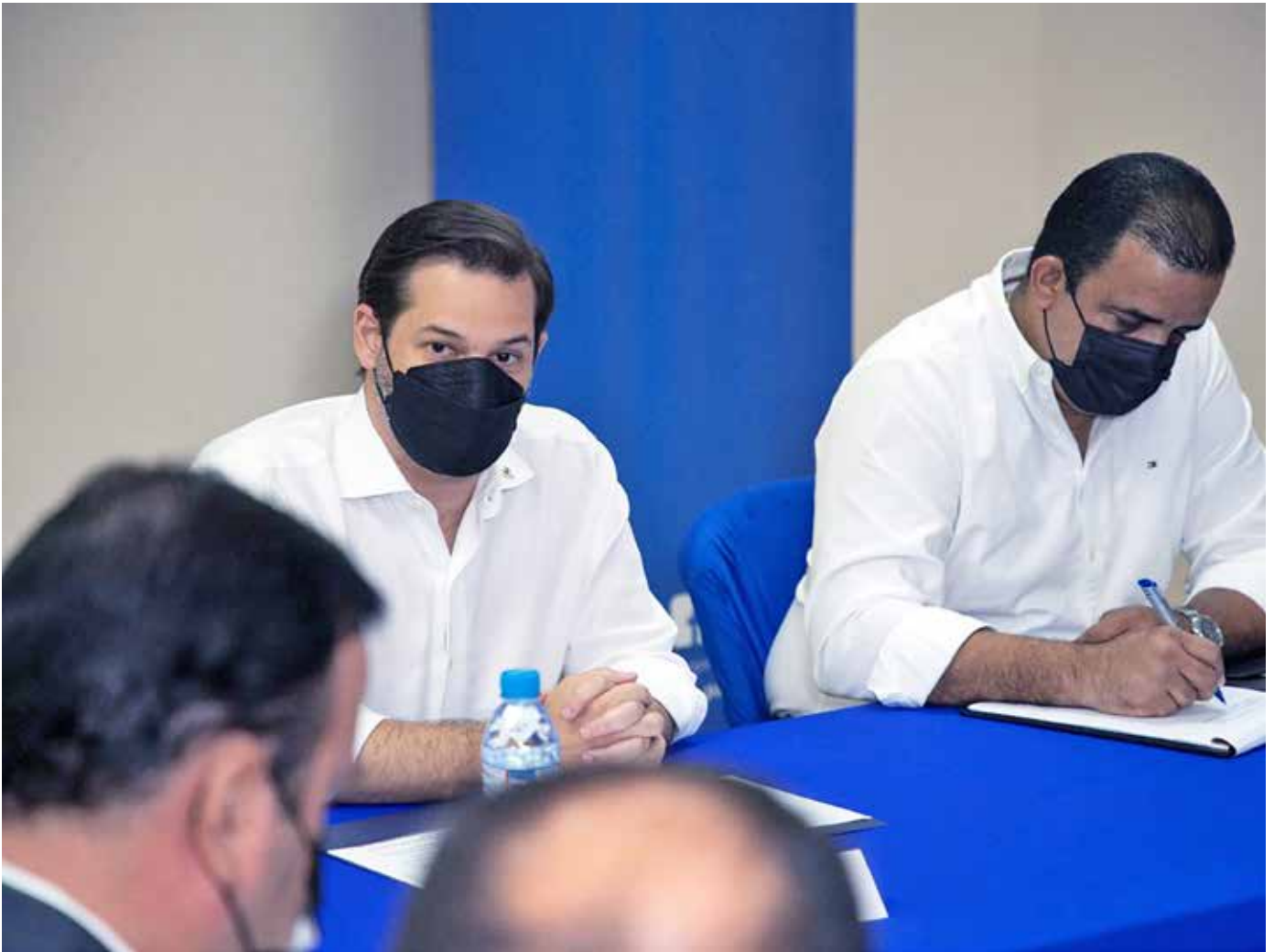
Autoridades del MICI, durante la instalación de los grupos de trabajo.

Los representantes de las partes se reunirán en las mesas técnicas cada quince días, ya que el objetivo del Gobierno Nacional está encaminado a recuperar la economía.