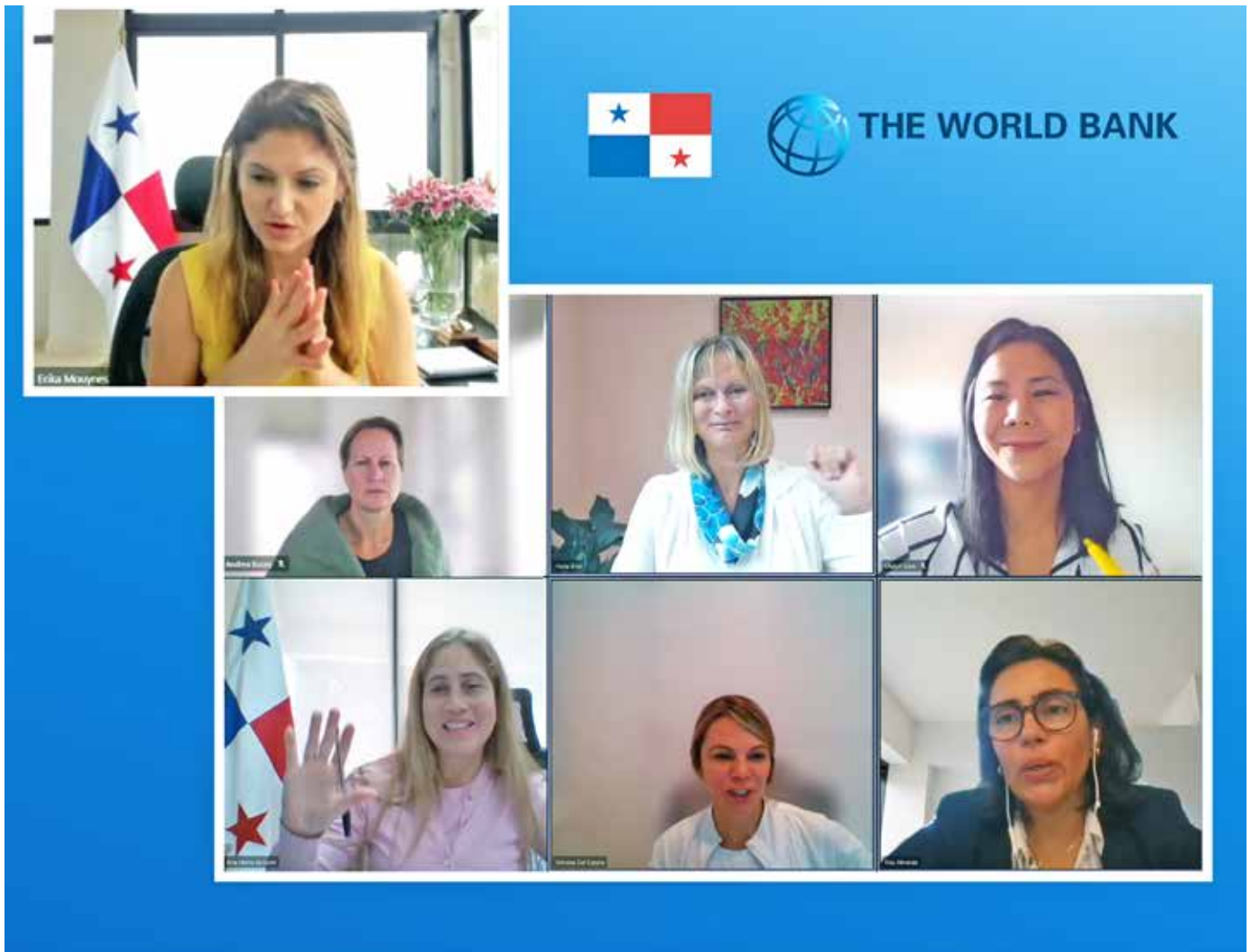
Reunión virtual entre la canciller, Erika Mouynes, con Hana Brix, directora global de Género del Banco Mundial.

contexto, el Gobierno Nacional, bajo el liderazgo del presidente de la República, Laurentino Cortizo Cohen, adelanta acciones para reducir el impacto de la pandemia en niñas y mujeres mediante políticas públicas con perspectiva de género, apoyo al autoempleo, promoción de planes de entrenamiento e inserción laboral.