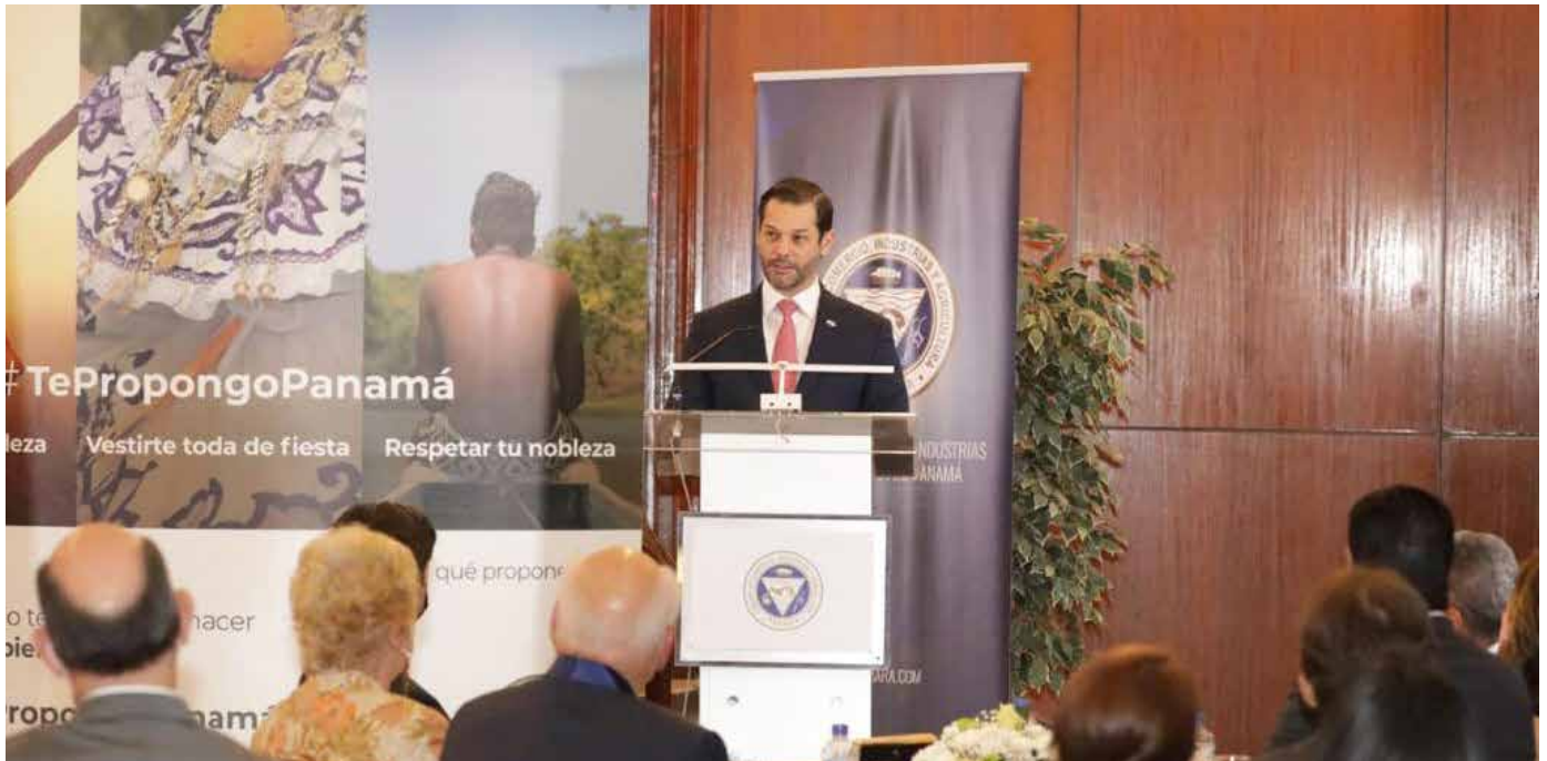
El ministro Ramón Martínez, durante su exposición ante la CCIAP.