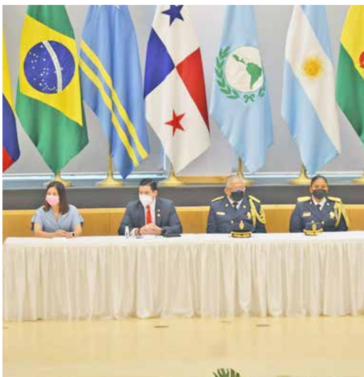
La ceremonia de graduación se realizó en la sede del Parlatino, ubicada en Amador, y fue presidida por el vicepresidente de la República y ministro de la Presidencia, José Gabriel Carrizo.

en beneficio de otras personas; a eso nos comprometemos cuando decidimos ser bomberos”, apuntó. Los nuevos bomberos, que provienen de las 11 zonas regionales, fueron capacitados en rescate vehicular, rescate con cuerdas, rescate en espacio confinado, extinción de incendios, atención prehospitalaria, Sistema Penal Acusatorio, inglés básico y primer respondiente.