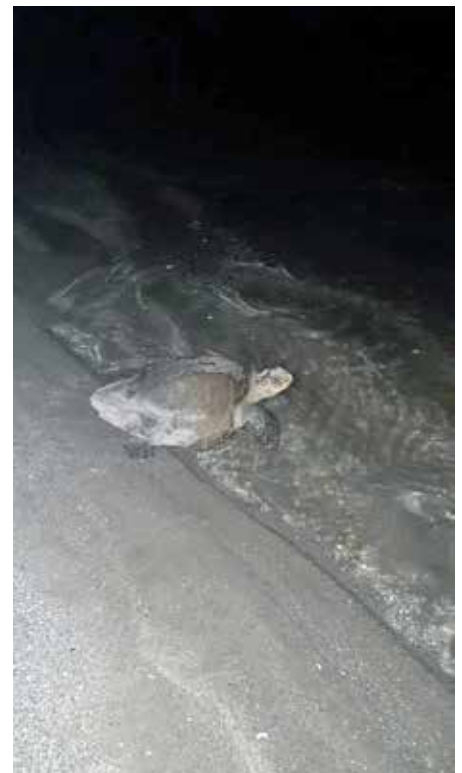
Los nidos de tortuga son trasladados al vivero para proteger los huevos hasta que se desarrollen y posteriormente liberarlos en el mar.