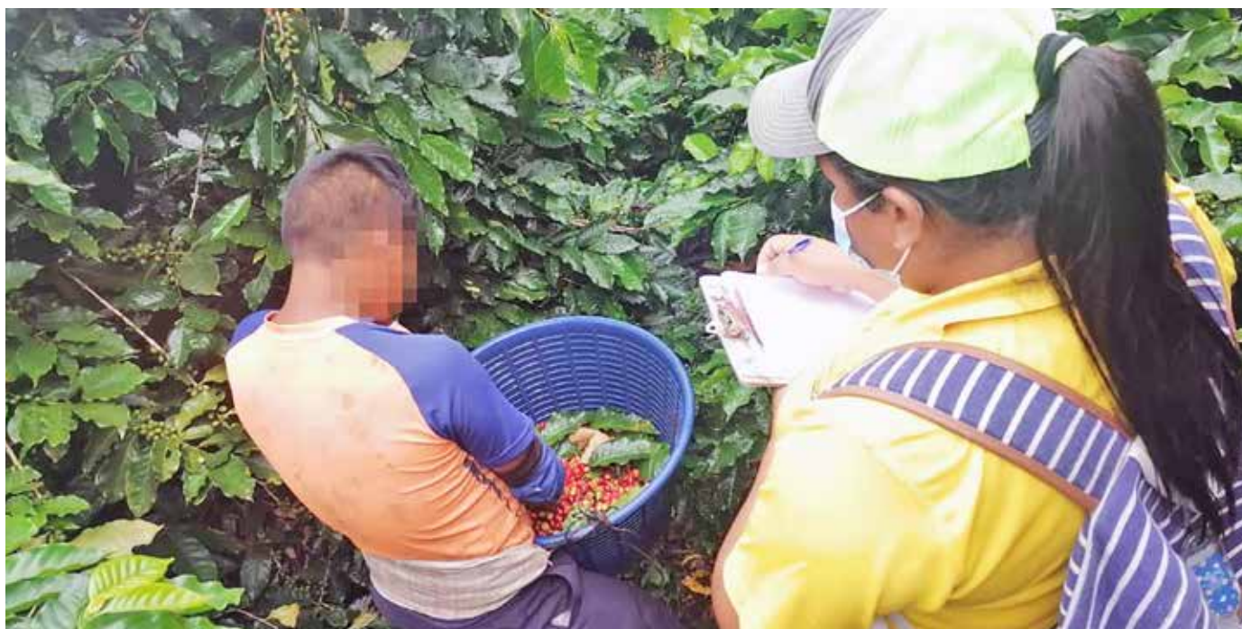
Se detectó que algunos padres tenían a sus hijos trabajando en cafetales.

país libre de trabajo infantil, por lo que instó al sector cafetalero a trabajar en conjunto con Mitradel y demás organismos para avanzar en esta meta.