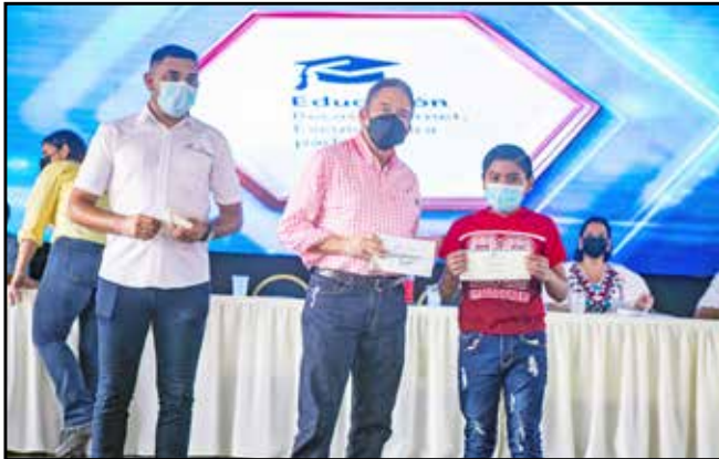
Estudiantes de este circuito fueron beneficiados con diferentes apoyos educativos, entre ellos: 20 becas, 9 "laptops" y 11 tabletas, con lo que se facilitará su proceso de aprendizaje.