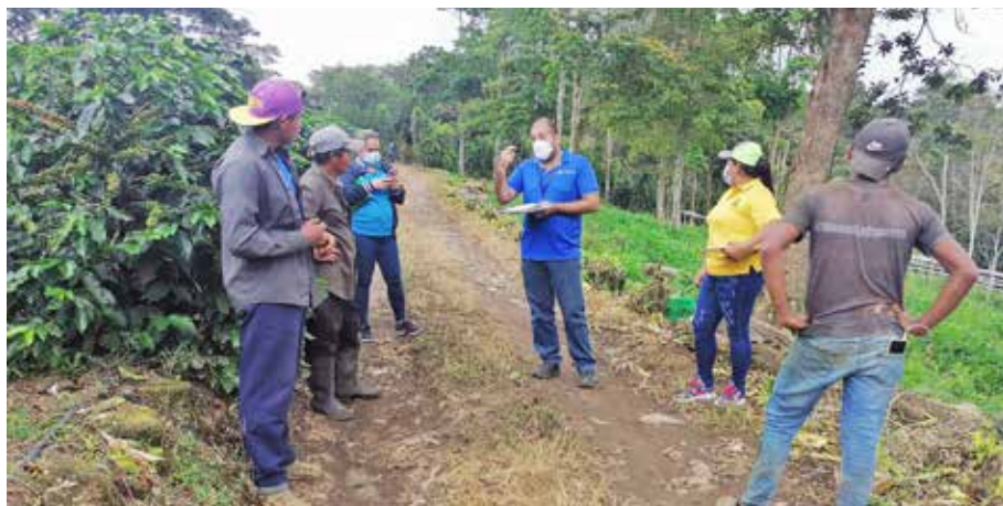
Las autoridades orientan sobre el peligro del trabajo de menores.

El Ministerio de Trabajo y Desarrollo Laboral (Mitradel), junto con la Secretaría Nacional de Niñez, Adolescencia y Familia (Senniaf), el Servicio Nacional de Fronteras (Senafrent) y Casa Esperanza, realizó un recorrido de prevención y atención del trabajo infantil en tres fincas cafetaleras del sector de Miraflores, en el distrito de Renacimiento, provincia de Chiriquí. Durante la acción, se detectó a seis menores, con edades entre los 8 y 16 años. Inmediatamente, bajo la orientación de la Dirección para la Erradicación del Trabajo Infantil y Protección del Adolescente Trabajador (Diretipat), se solicitó a los padres retirarlos del área, al tiempo que se instruyó a los encargados de las fincas sobre el riesgo que representa tener a niños, niñas y