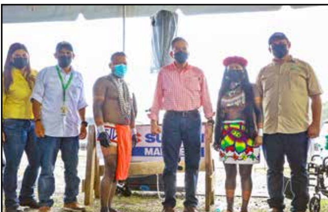
Por un valor conjunto de B/.5,000.00, se dotó de dos motores fuera de borda, uno para la cooperativa Warra Crincha, R.L. y otro para Tranchichi Emberá Drúa, R.L.