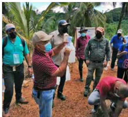
En el taller se explicó el proceso de extracción del aceite de coco.

El Ministerio de Desarrollo Agropecuario (MIDA) de la Región 6 – Colón, con el apoyo del Organismo Internacional Regional de Sanidad Agropecuaria (OIRSA), realizó una gira con la finalidad de capacitar sobre el mejoramiento tecnológico del cocotero en la Costa Abajo de la provincia de Colón. La gira tuvo como sede la comunidad de Platanal, en el corregimiento Miguel De La Borda, del distrito de Donoso, y se utilizó como fuente de información los resultados preliminares de la investigación que realiza el Instituto de Innovación Agropecuaria de Panamá (IDIAP) sobre el rubro en el área, para capacitar a productores de cocotero de las comunidades de Belén, Coclé del Norte, San Lucas, Aguacate, Limón y Platanal, sobre la fertilización del cocotero y el control del insecto conocido como picudo, que afecta las plantaciones de coco. En la gira se entregó fertilizante