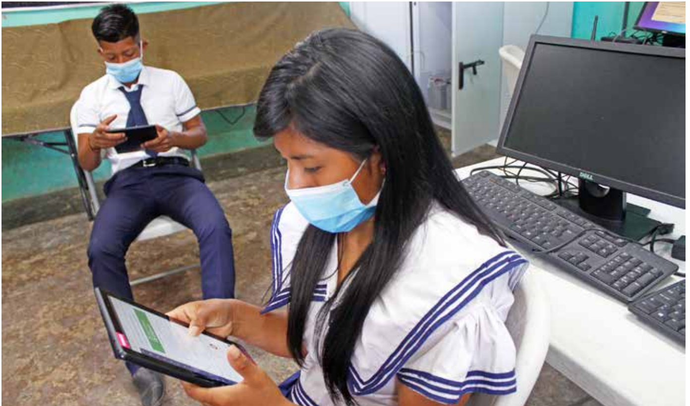
Estudiantes de las comarcas se conectan a internet.

El Ministerio de Educación (Meduca) mantiene un 55% de los centros educativos conectados al internet, lo cual beneficia a más de 657 mil estudiantes de todo el país. Se han gestionado varios proyectos para ampliar y mejorar la conectividad en 321 escuelas, se realizaron cambios de tecnología del servicio de internet satelital y microondas de 2 MB y 4 MB, a servicio de fibra óptica de 10 MB y, en 20 planteles escolares de difícil acceso, se inició el piloto de instalación del servicio LTE. Actualmente, se ejecuta el proyecto de cableado estructurado en 41