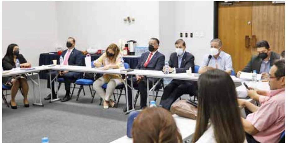
Dirigentes de diversos gremios de productores participaron en este encuentro.

y café; sin embargo, el principal reto lo constituye la eliminación progresiva de aranceles de protección para productos como arroz, carne de cerdo, carne de pollo, leche, derivados lácteos, maíz y tomate procesado, que amenaza con desplazar la producción nacional agrícola.