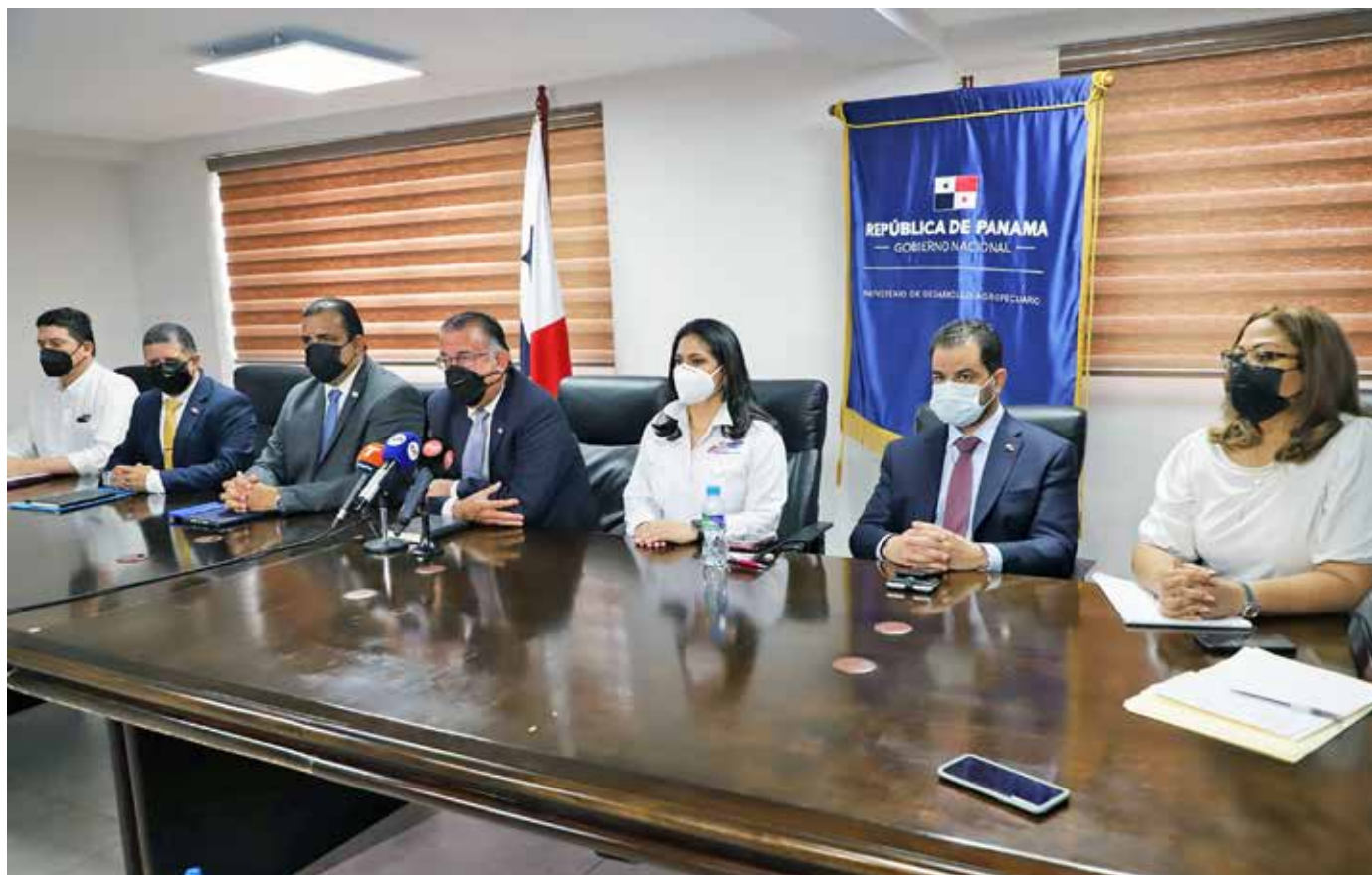
La reunión se llevó a cabo en la sede del Mida.

medidas que tengamos a mano para paliar y apoyar esta dura crisis que se está dando a nivel mundial y que afecta a Panamá”, agregó.