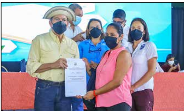
Diez familias de los corregimientos de El Marañón, Soná y Las Palmas, que ocupan los terrenos desde hace más de 30 años, recibieron sus títulos de propiedad.