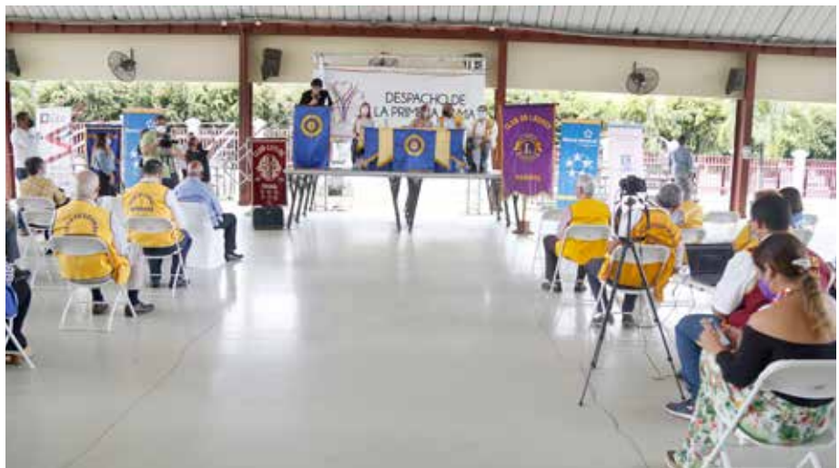
Se busca generar cambios a nivel colectivo y afianzar el proceso de construcción de una sociedad civil fuerte y organizada.

Un grupo de panameños interesados en rescatar e inculcar la práctica de valores en todos los estratos y poderes de nuestra sociedad creó, en la década de 1980, una comisión que vela por estos aspectos.