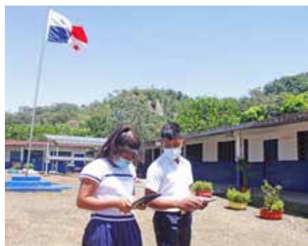
Cerrando la brecha digital en el sector educativo.

El Ministerio de Educación (Meduca) mantiene un 55% de los centros educativos conectados al internet, lo cual beneficia a más de 657 mil estudiantes de todo el país. Se han gestionado varios proyectos para ampliar y mejorar la conectividad en 321 escuelas, se realizaron cambios de tecnología del servicio de internet satelital y microondas de 2 MB y 4 MB, a servicio de fibra óptica de 10 MB y, en 20 planteles escolares de difícil acceso, se inició el piloto de instalación del servicio LTE. Actualmente, se ejecuta el proyecto de cableado estructurado en 41