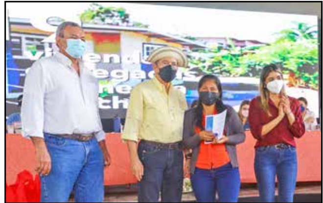
Con una inversión de B/.105,000.00, se entregaron seis viviendas a familias que vivían en condiciones de pobreza y pobreza extrema, en los distritos de San Francisco, Atalaya, Santiago y Montijo.