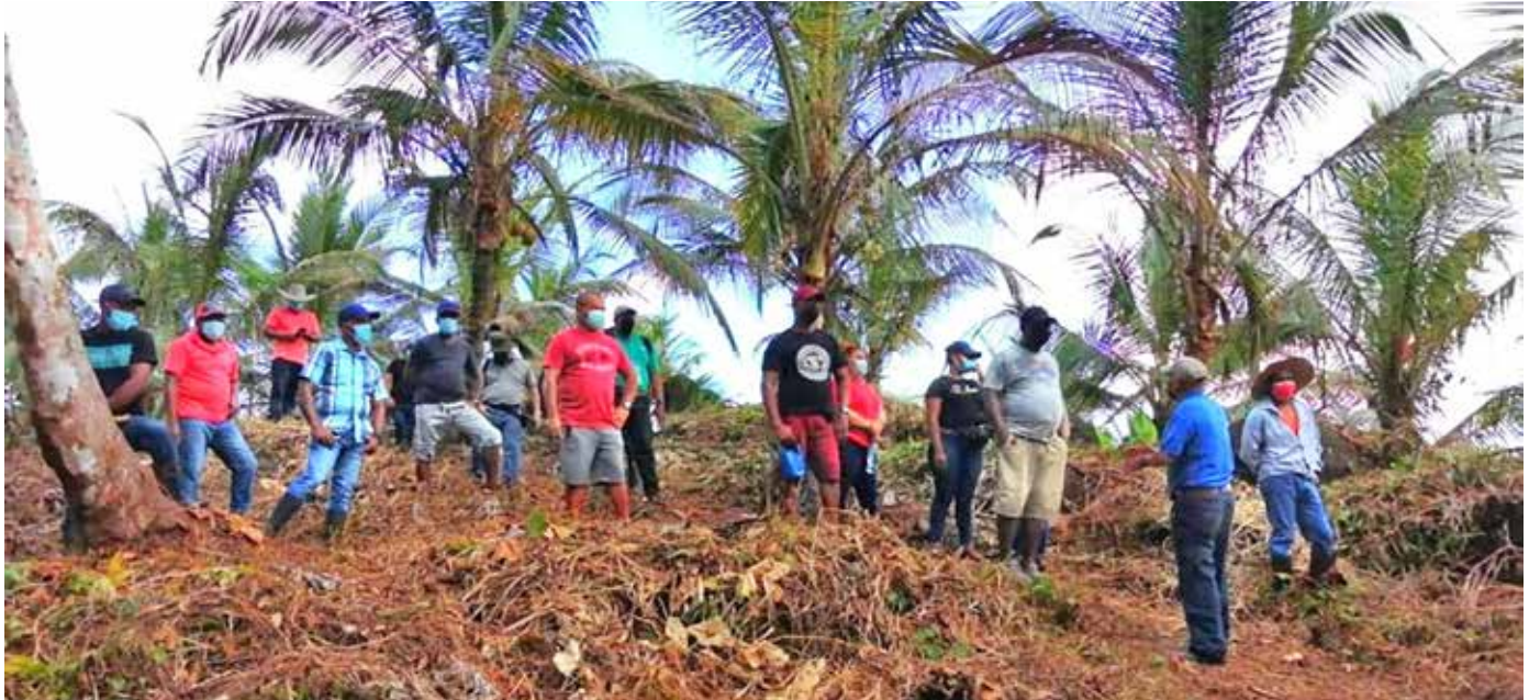
El entrenamiento tuvo lugar en la comunidad de Platanal, corregimiento Miguel De La Borda, del distrito de Donoso.