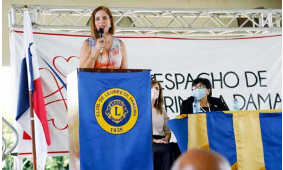
La primera dama tomó parte en el lanzamiento de la actividad.

La Comisión Nacional Pro Valores Cívicos y Morales, con el liderazgo del Club de Leones de Panamá, y con el apoyo de la Cámara de Comercio, Industrias y Agricultura de Panamá (CCIAP), anunció, en el marco de la celebración del Día Nacional de los Valores, el próximo 18 de noviembre, las actividades de sensibilización con respecto a este importante tema. La primera dama de la República, Yazmín Colón de Cortizo, quien fue invitada a este lanzamiento, destacó que a los niños se les debe educar en valores a través del ejemplo en casa, y reiteró que hoy más que nunca se deben reforzar esos valores que poco a poco se han perdido en la sociedad. Principalmente, deben reforzarse en los jóvenes, que serán los próximos gobernantes, educadores, doctores, futuros profesionales que serán líderes, pero que sin esa semilla de buenos valores no marcarán la diferencia. Colón de Cortizo finalizó invitando a la población a denunciar los actos de corrupción, porque la valentía es un valor. Esta conmemoración aboga por el fortalecimiento de los valores y enfatiza en el respeto y la honestidad, como principios catalizadores que generan cambios a nivel colectivo y