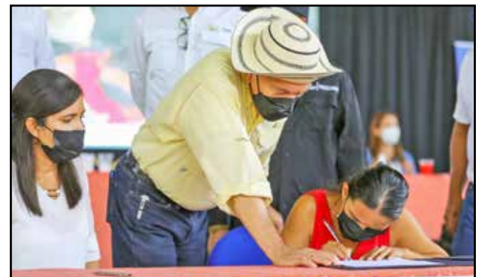
Nueve jóvenes fueron beneficiados con la firma de contratos de trabajo como parte del Programa de Apoyo a la Inserción Laboral (PAIL), que impulsa esta Administración.