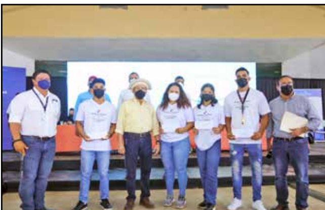
Se entregaron cinco estímulos deportivos y doce bolsas con implementos deportivos a representantes de las juntas comunales del circuito 9-2.