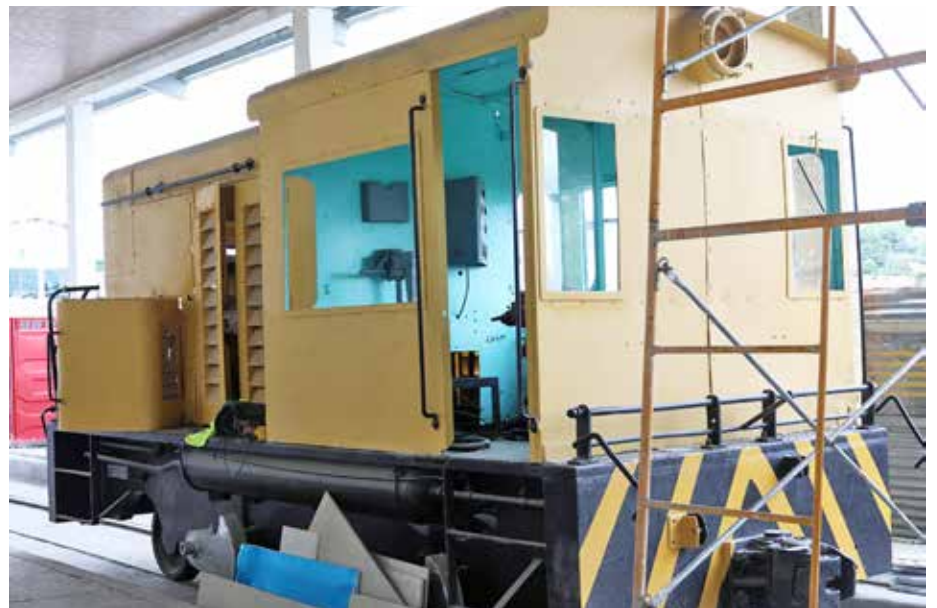
Pieza del Museo.

La restauración del Museo del Ferrocarril tiene un avance del 75% y debe concluir en noviembre del año en curso, de acuerdo con las autoridades del Municipio de Bugaba, en la provincia de Chiriquí. El ministro de Cultura, Carlos Aguilar Navarro, manifestó su complacencia por esta iniciativa de la Alcaldía y el Consejo Municipal, que creyeron en el potencial de la cultura e impulsaron el proyecto que realza el patrimonio histórico. “Estamos viendo ya casi terminada la obra, la empresa ha hecho un gran trabajo; aspiramos a que, para noviembre, en el Bicentenario, podamos inaugurarlo”, destacó Aguilar Navarro. Por su parte, el alcalde, Rafael Quintero, dijo que esta estructura tenía más de 40 años en total abandono y las distintas generaciones pedían su restauración, por lo que “la Alcaldía y los representantes de corregimiento plantearon a la población la iniciativa,