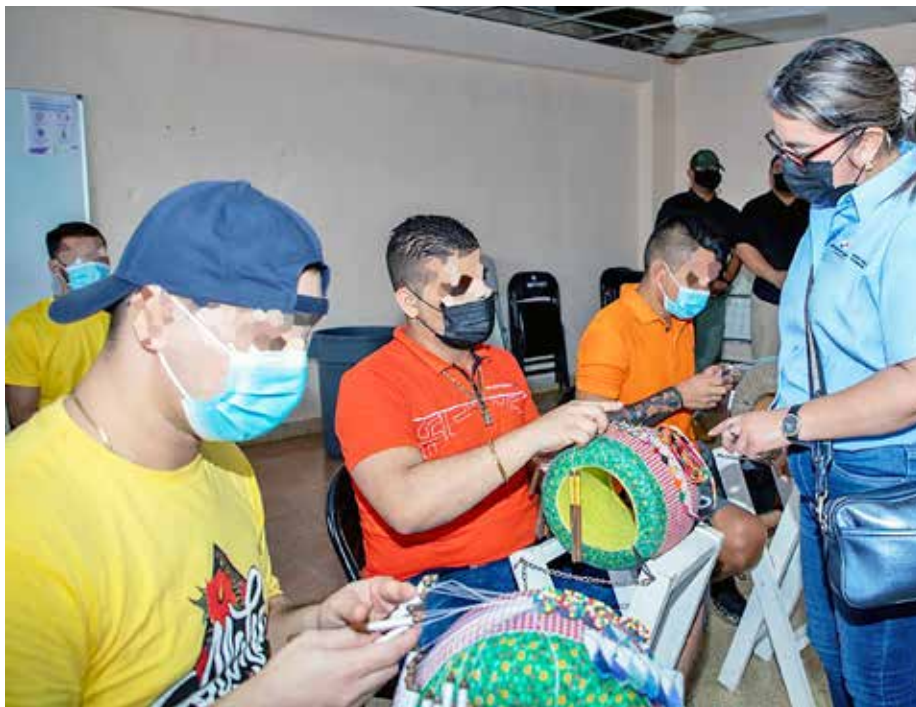
Detenidos en Océ, Las Tablas, La Villa y Chitré, entre otros, participan en este proyecto.