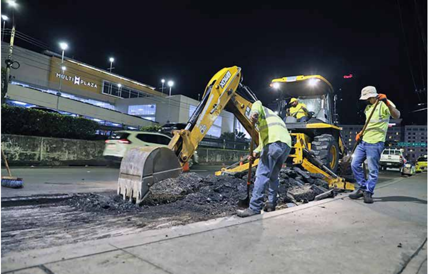
El Mop adelanta trabajos en las principales calles del país.