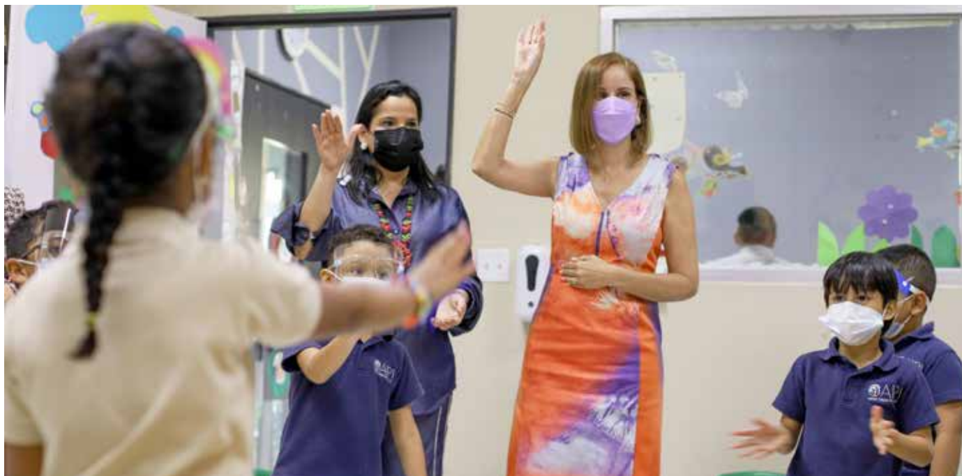
En el CAIPI Santa Teresa de Calcuta, ubicado en el Casco Antiguo, comenzó el recorrido de la primera dama.