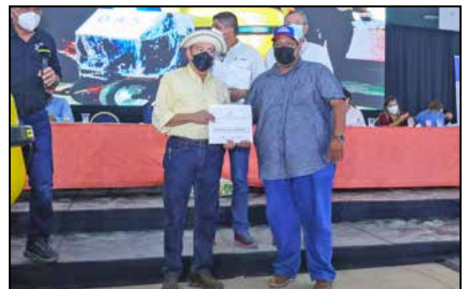
Por un total de B/.28,990.00, se entregó orden de compra para el suministro de un camión volquete al Municipio de La Mesa.