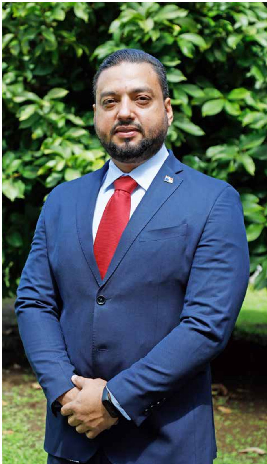
VÍCTOR CADAVID, director nacional de Forestal del Ministerio de Ambiente

La aplicación es compatible para ser instalada en teléfonos móviles, tabletas y PC de última generación, ya sea en sistema Android, iOS o Windows, y es capaz de operar o captar datos incluso cuando se encuentre fuera del área de cobertura de los operadores de telefonía móvil. Estos datos alimentarán el Sistema Nacional de Monitoreo de Bosque Multipropósito y todos los datos generados por el mismo serán vinculados con el Sistema Nacional de Información Ambiental, el portal digital más amplio y robusto de datos sobre el ambiente en el país que aloja el sitio web del Ministerio de Ambiente.