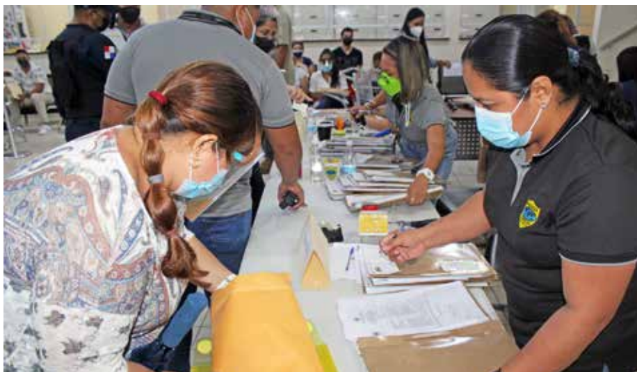
Este es el segundo Proceso Extraordinario de Regularización de Notificación Migratoria.

El Servicio Nacional de Migración (SNM) logró regularizar a más 3 mil extranjeros que se encontraban en trámite de notificación para la renovación de su carné de estatus migratorio en el país, durante el segundo Proceso Extraordinario de Regularización de Notificación Migratoria. Junto a su equipo de directores y colaboradores, la directora general, Samira Gozaine, dirigió de forma organizada la jornada extraordinaria, con el fin de cumplir con los usuarios del SNM. Durante este proceso, se cumplió con todas las medidas de bioseguridad y para el ingreso a la institución, se exigió el uso obligatorio de mascarilla y careta.