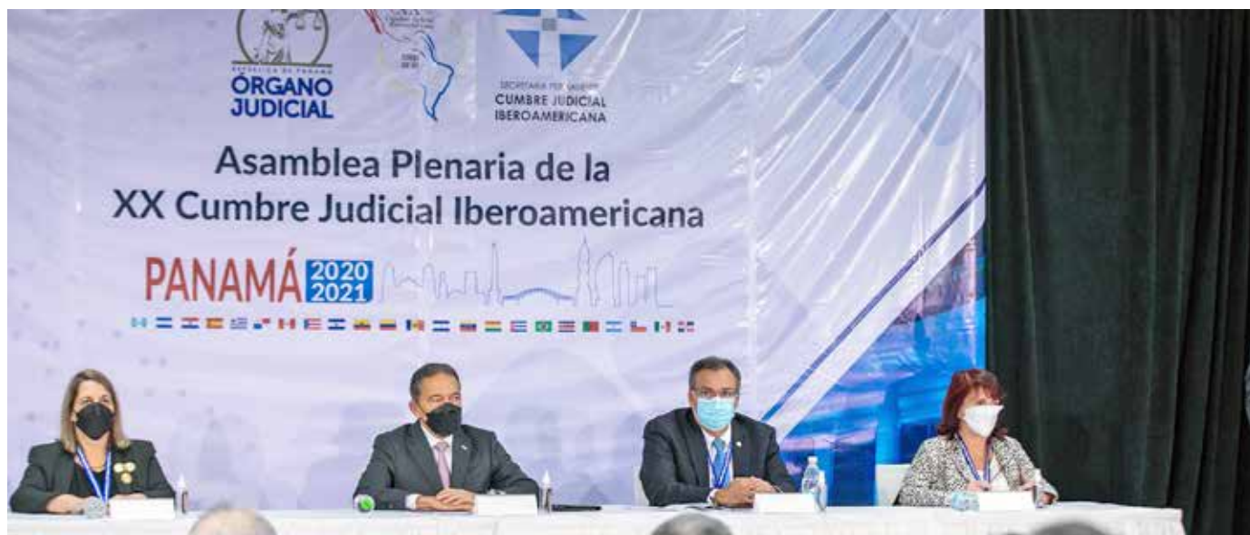
El mandatario participó en la inauguración de la XX Cumbre Judicial Iberoamericana, celebrada en Panamá.