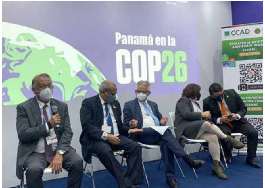
El ministro Augusto Valderrama, durante su participación en la reunión.

La COP26 reunió a gobiernos, empresas, autoridades locales y sociedad civil para debatir acerca de la acción mundial por el clima.