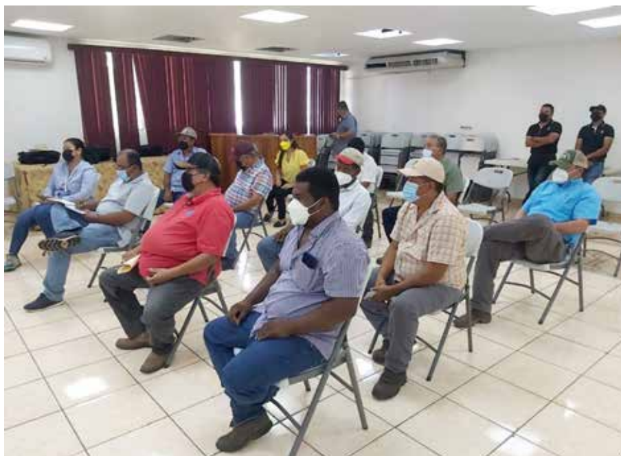
Dirigentes de gremios arroceros participaron en las conversaciones.