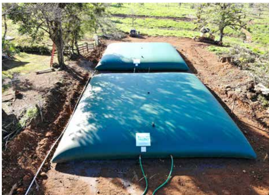
Durante esta gestión de gobierno, se han instalado seis Scall en varios puntos del territorio nacional.