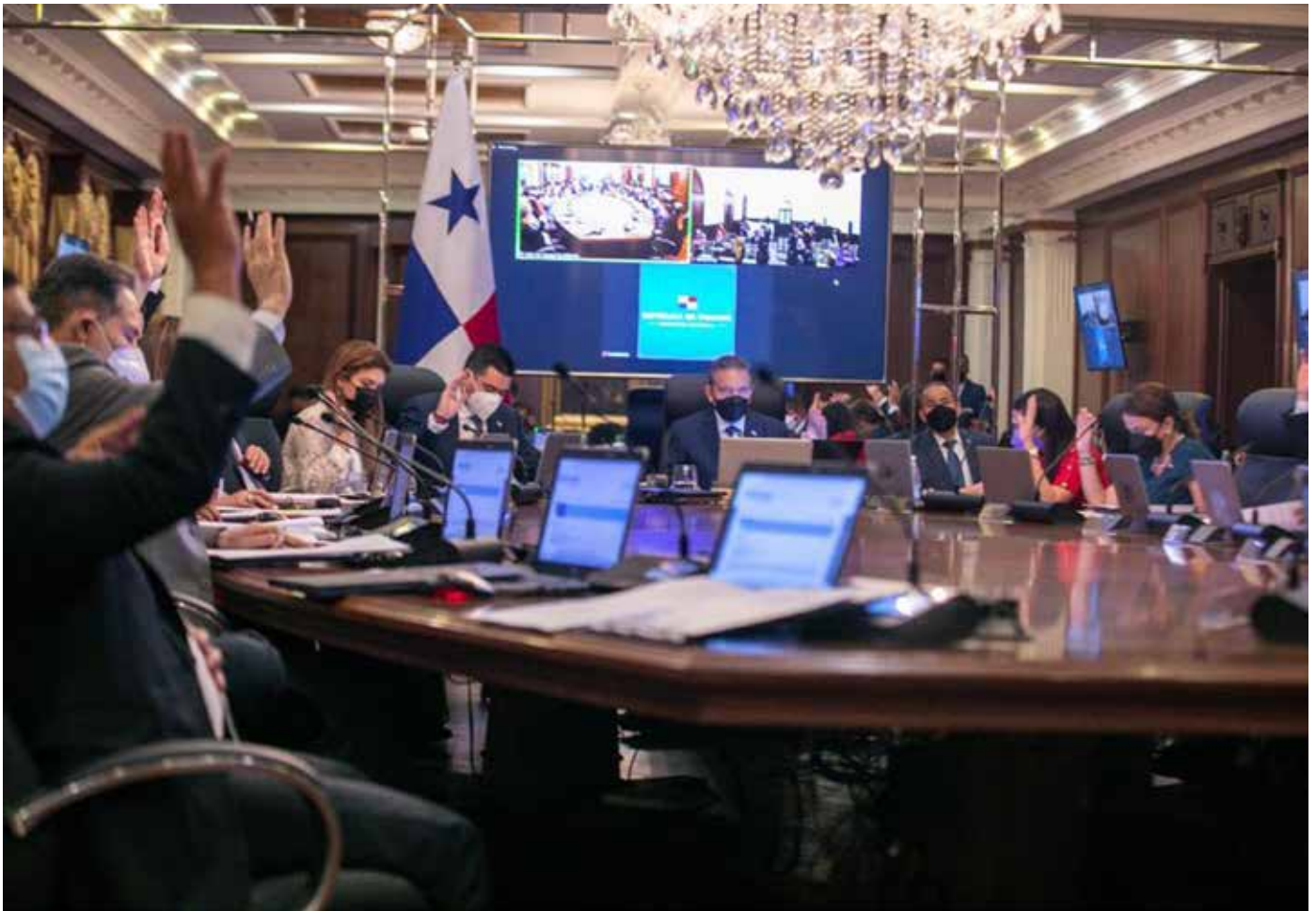
El consejo de ministros también aprobó la suscripción de convenios para ayuda técnica no reembolsable por el Covid-19.

de Panamá, representada por el Ministerio de Economía y Finanzas (MEF) por un monto estimado de B/.330,000.00 para la adquisición de 816,480 mascarillas KF-94 de origen coreano y para cubrir los gastos de transporte y logística. También fue aprobado el Proyecto de Decreto de Gabinete No.27-21, que autoriza a suscribir el Convenio de Cooperación Financiera No Reembolsable entre la República de Panamá, representada por el MEF, y el Banco Centroamericano de Integración Económica, hasta por la suma de $500,000.