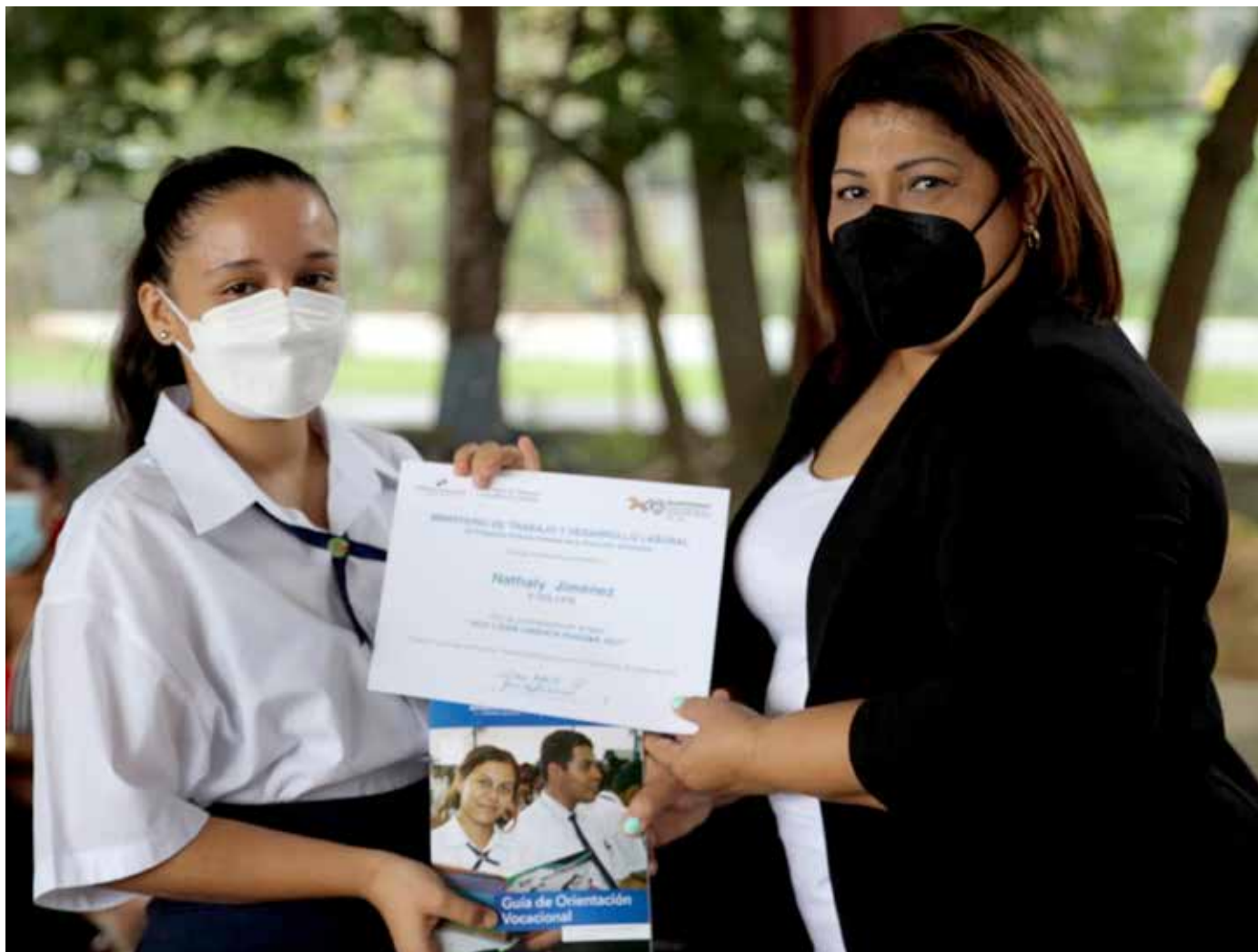
Una alumna recibe la “Guía de Orientación Vocacional”.

80 estudiantes de la provincia de Coclé recibieron, de parte del Ministerio de Trabajo y Desarrollo Laboral (Mitradel), la “Guía de Orientación Vocacional” y el certificado de culminación del taller “Soy Líder Orienta Panamá 2021”. Los jóvenes estudian en el Centro de Educación Básica General Pablo Alzamora, en el corregimiento de