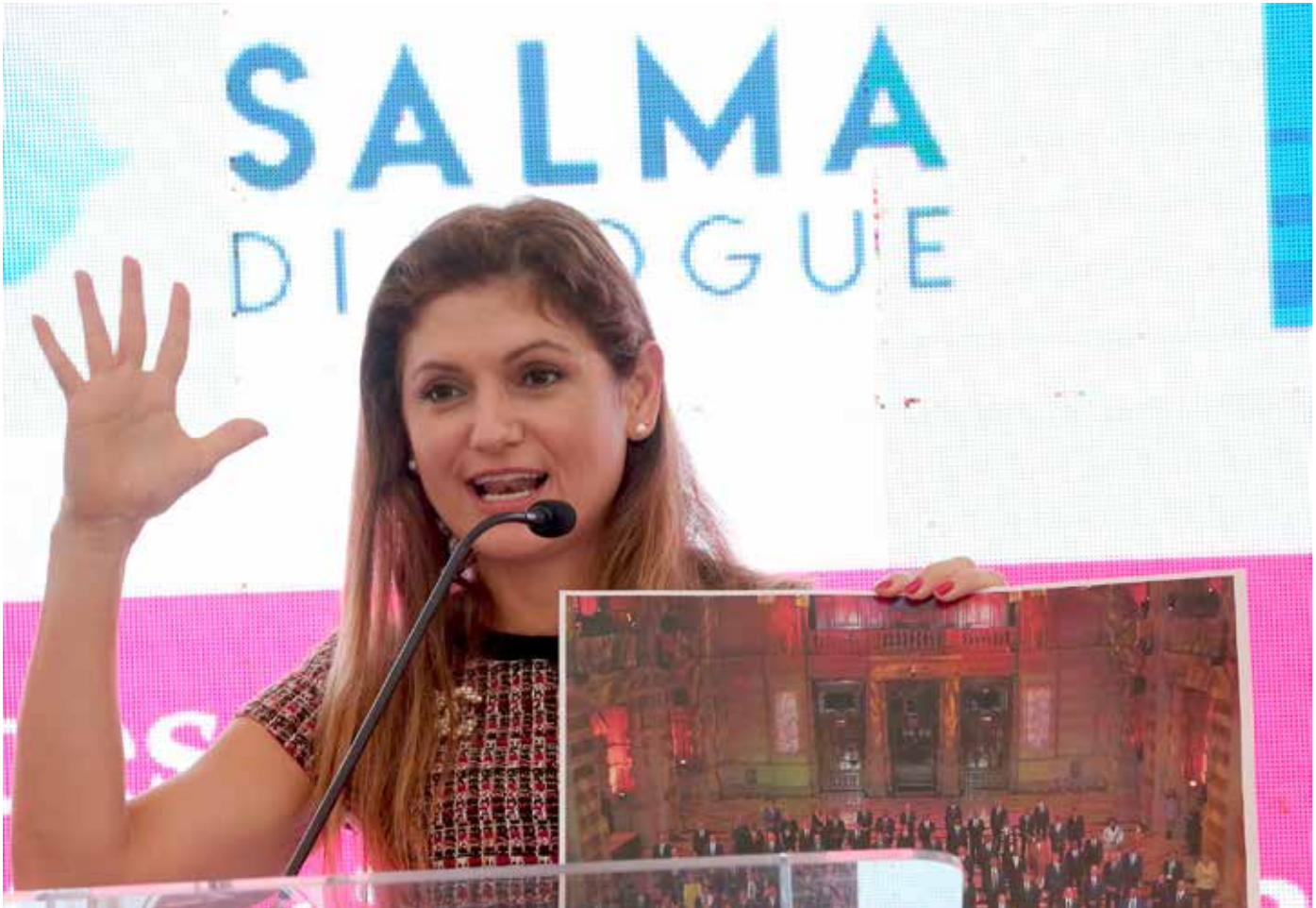
La canciller Erika Mouynes participó en este importante foro.

Ante líderes de Europa, África y América, reunidos en la Conferencia de Diálogo de Mujeres Salma 2021, la ministra de Relaciones Exteriores, Erika Mouynes, se refirió al papel de Panamá y la nueva relación entre Latinoamérica y África. En ese contexto, destacó que “nunca ha habido en la historia un momento más estratégico para actuar en bloque. Es el momento de unirse y que se sienta nuestra voz, de abogar por un multilateralismo justo y equitativo. Latinoamérica y África se tienen que hacer escuchar.