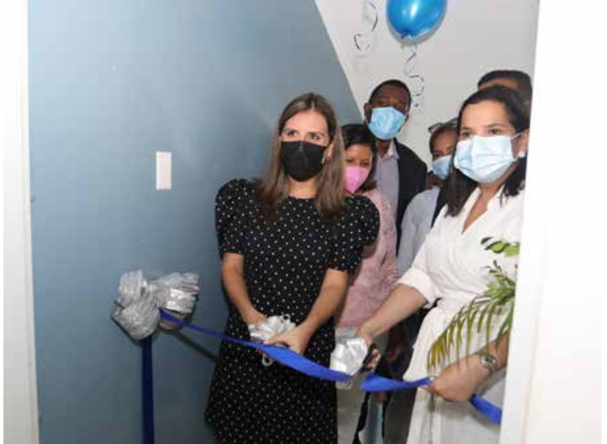
Los casos de violencia en el entorno familiar que se reporten en el distrito de San Miguelito se atenderán en esta nueva sede.

La nueva sede contará con personal capacitado en áreas de psicología general y clínica, trabajo social, asesoría legal, derechos y protección de niños, niñas y adolescentes.