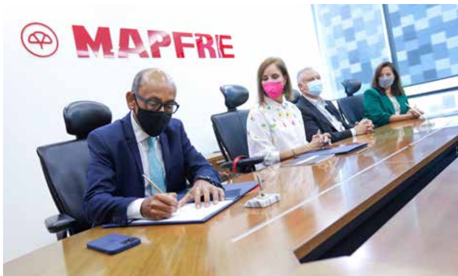
La primera dama participa como testigo de honor en la firma del convenio con Fundación Mapfre.

Invitada como testigo de honor, la primera dama de la República, Yasmín Colón de Cortizo, participó en la firma del convenio de cooperación para la ejecución del proyecto “Parque Infantil de Tránsito en el Parque Recreativo y Cultural Omar” y de un Programa Educativo de Seguridad Vial, para enseñar educación vial de forma gratuita a niños de 8 a 12 años de colegios públicos y privados del país. Las actividades, que se realizarán en sesiones que duran 1 hora y 15 minutos, se dividen en dos partes: la primera con información teórica dentro de un salón, en donde aprenderán sobre los principios básicos de vialidad para peatones, ciclistas, pasajeros y conductores; y la segunda, que es práctica, se desarrolla en una pista donde los niños podrán aplicar los conocimientos adquiridos, desempeñándose como peatones, ciclistas, conductores y observadores. Este parque, construido en el año 2012 como una iniciativa de la Fundación Mapfre, es administrado por el Despacho de la Primera Dama.