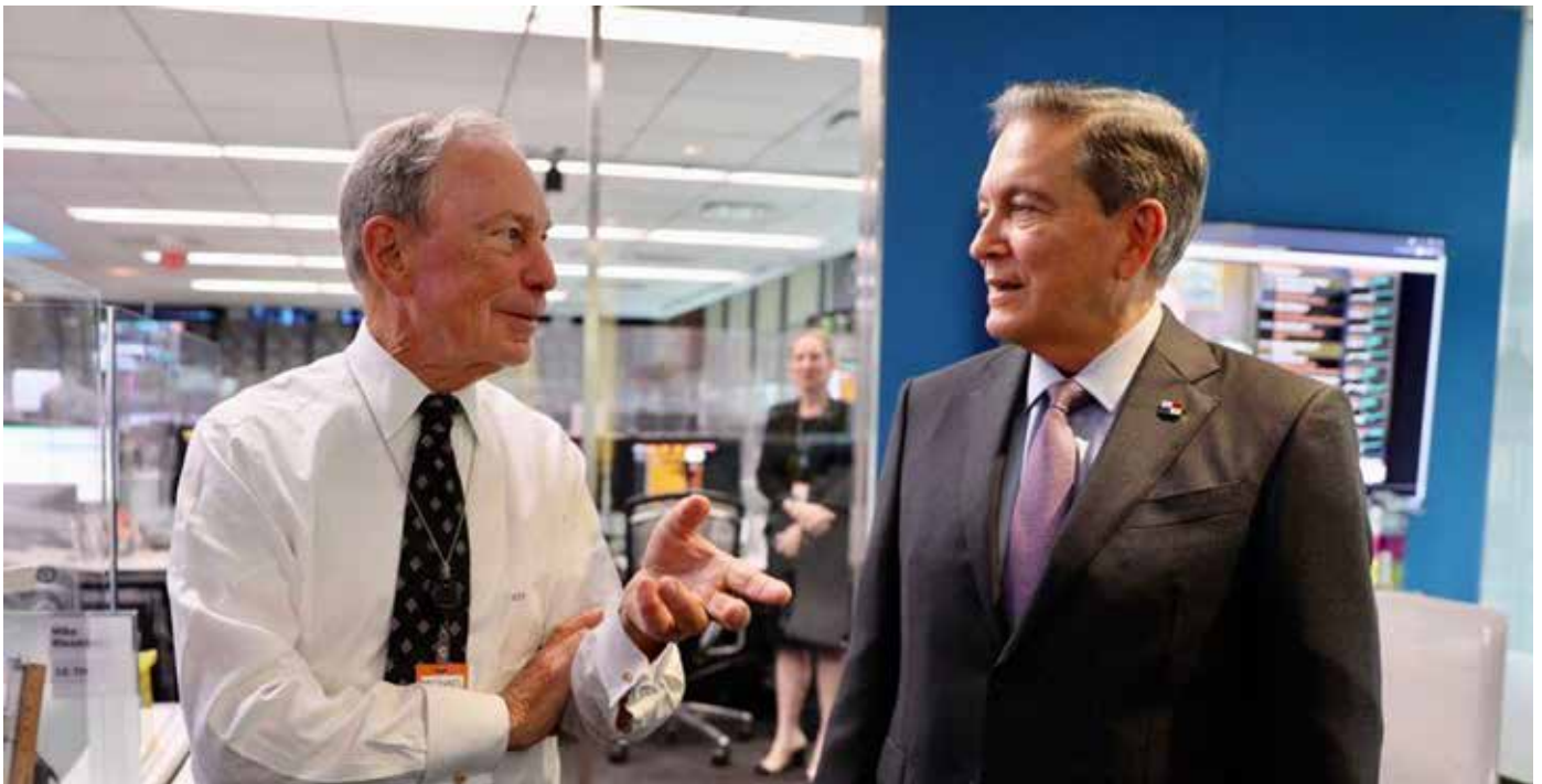
En la clausura del Bloomberg New Economy Forum en Singapur, “Mike” Bloomberg compartió detalles sobre el primer evento de la comunidad de la New Economy fuera de Asia.

global más moderna”, dijo. En colaboración con el Gobierno panameño, el evento inaugural de Bloomberg New Economy Gateway en América Latina reunirá a los líderes regionales y globales para actuar sobre las inversiones sostenibles y el futuro del comercio. Su conversación y acción continuará centrándose en los cinco pilares editoriales establecidos por Bloomberg New Economy: ciudades, finanzas, comercio, salud pública y clima. “Panamá tiene el honor de ser el anfitrión de Bloomberg New Economy Gateway LatAm en 2022”, dijo Laurentino Cortizo Cohen, presidente de la República de Panamá. “Esta es una excelente oportunidad para ayudar a influir y acelerar la colaboración entre las empresas y el Gobierno durante un momento crítico para el mundo”, añadió.