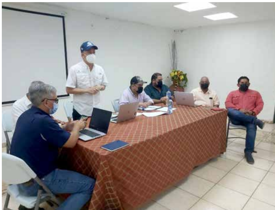
El ministro encargado Carlo Rognoni presidió el inicio de las conversaciones con los productores de este importante rubro.

Se anunció la aprobación, en la Comisión de Presupuesto de la Asamblea Nacional, del crédito extraordinario de B/.25 millones para el pago de incentivos a la producción.