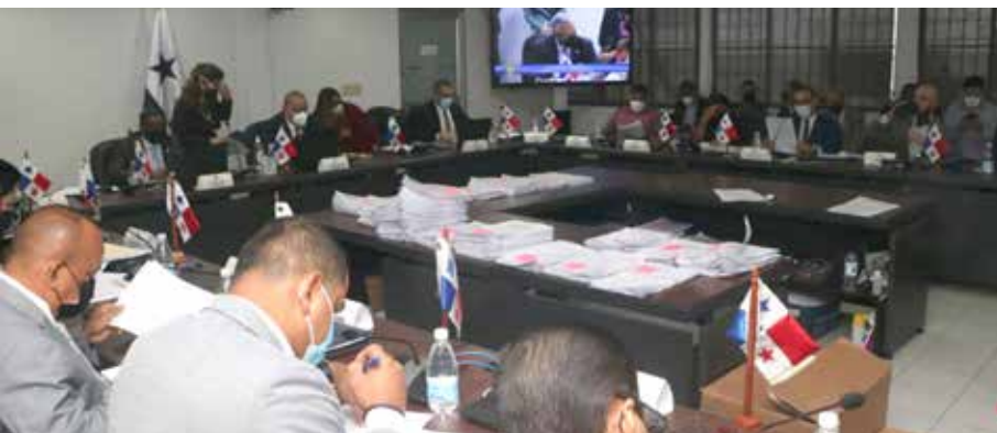
Los miembros de la Comisión de Presupuesto dieron su aval para apoyar al sector agropecuario.

y a los productores de leche Grado C, les corresponden B/.4.4 millones. También se contempla para la Ley 107 de incentivos a Granos una solicitud de B/.3.7 millones. Agregó que con esto se refuerza la producción nacional, la cual se ha visto incrementada en esta administración del presidente Laurentino Cortizo Cohen en todos los rubros, particularmente en arroz, que ha crecido un 15%, pasando de 78 mil hectáreas en el ciclo pasado a 90 mil hectáreas, que es lo proyectado para este año.