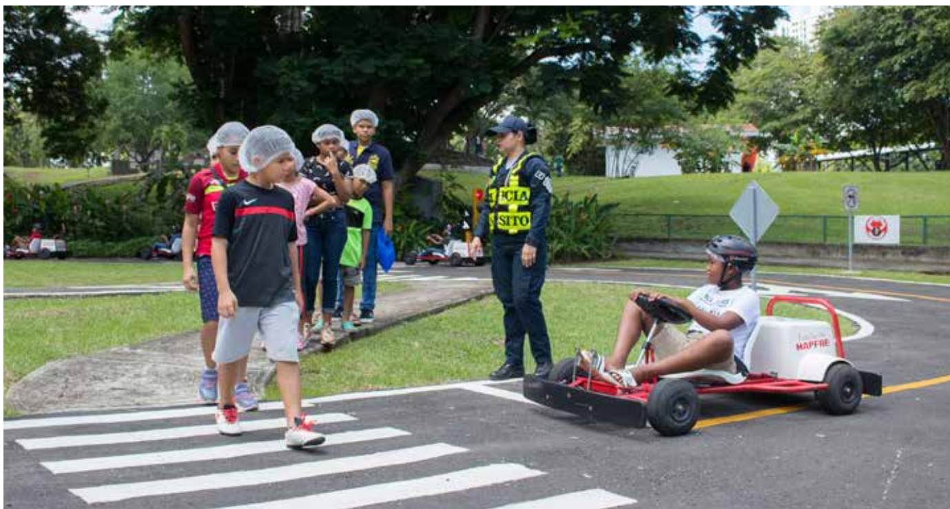
La actividad se dirige a niños de 8 a 12 años de colegios públicos y privados.