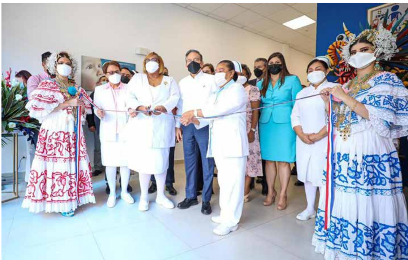
El presidente Laurentino Cortizo Cohen encabezó el acto de inauguración de las nuevas instalaciones.