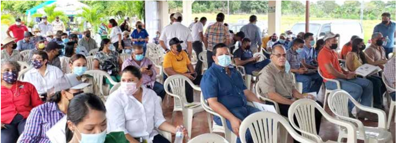
Productores y técnicos beneficiados con las Escuelas de Campo.

Más de 350 personas, entre productores y técnicos panameños, se beneficiaron con las 15 Escuelas de Campo que se crearon en diferentes áreas productoras de arroz del país, a través del proyecto “Apoyo a la Formulación de Acciones Apropriadas de Mitigación en la Agricultura Centroamericana”, impulsado por el Ministerio de Desarrollo Agropecuario (MIDA), y el Instituto Interamericano para la Agricultura (IICA), que gestionó