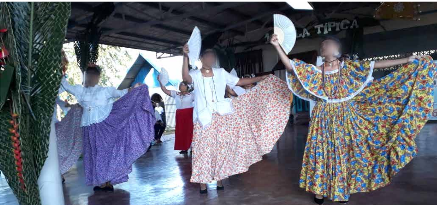
Privadas de libertad de Los Algarrobos, Chiriquí, le rinden tributo a la patria en su Bicentenario.