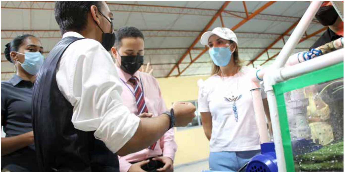
La primera dama de la República observó los trabajos presentados en la Expotecnia 2021.

“La virtualidad, líder de la innovación” fue el lema de Expotecnia 2021, una exhibición de proyectos técnico-científicos realizados por estudiantes desde kínder hasta duodécimo grado del Instituto Técnico Don Bosco, y que recibió la visita de la primera dama de la República, Yasmín Colón de Cortizo, como embajadora de la educación STEAM. Todos los trabajos participan en un concurso y son evaluados por un jurado calificado en las diferentes áreas. Este plantel educativo está en proceso de modernización de sus laboratorios y