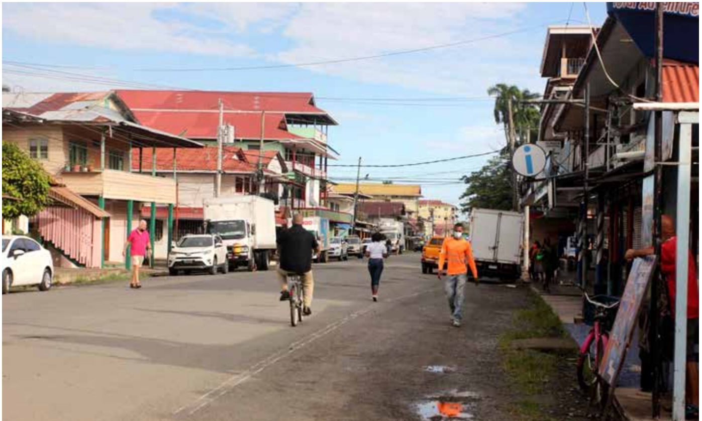
El MOP suma 25 contratos llave en mano.

Este tipo de contratos permite que la empresa aporte los fondos para ejecutar la obra.