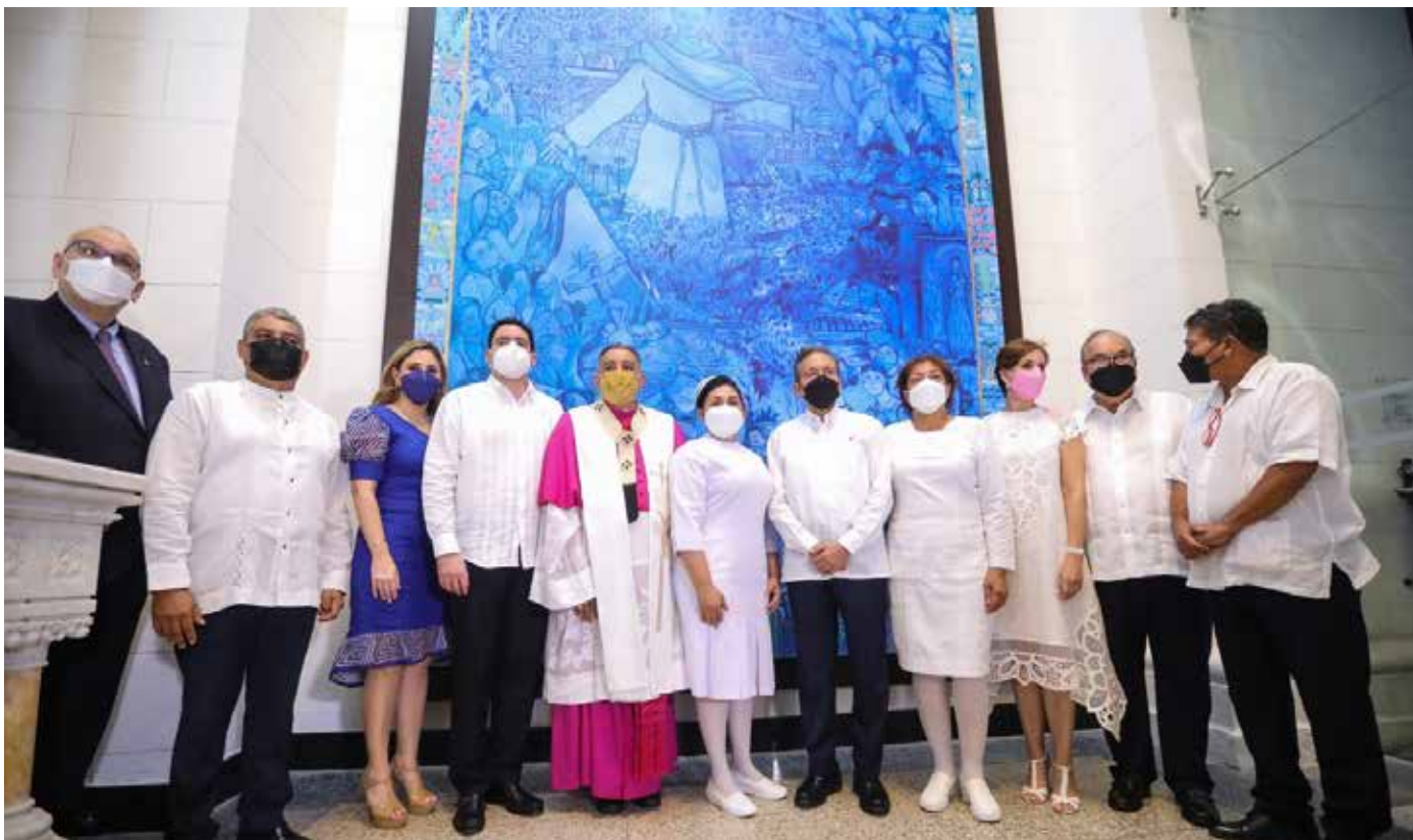
Como un homenaje a los fallecidos por el Covid-19, en la Iglesia San Francisco de Asís se develó un retablo sobre lienzo del artista panameño Aristides Ureña.