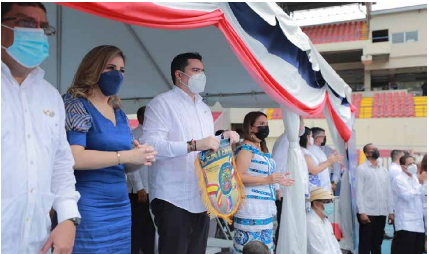
El vicepresidente de la República, José Gabriel Carrizo Jaén, presidió el acto en el Estadio Rommel Fernández.