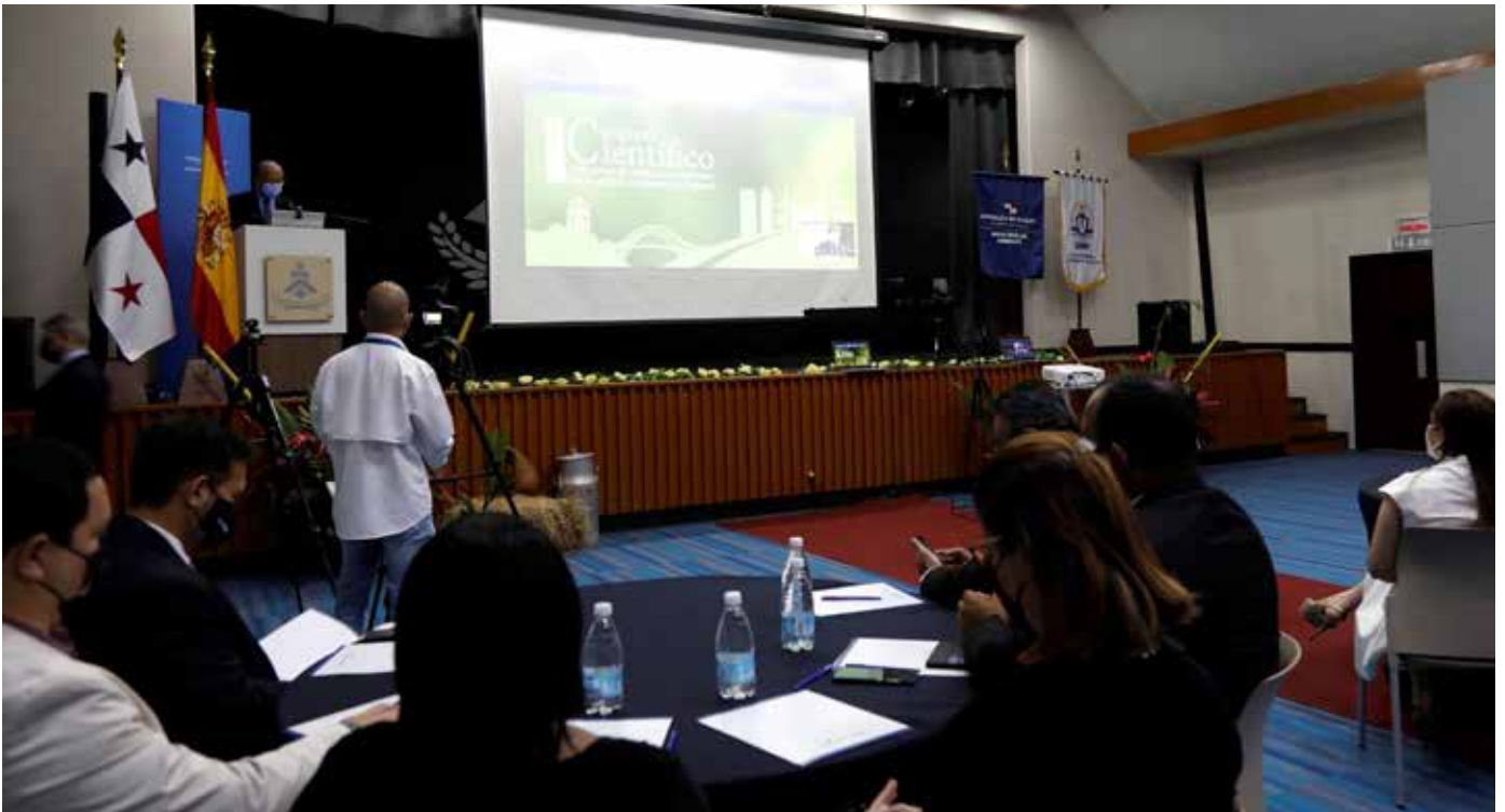
Las jornadas contaron con la participación de reconocidos expositores nacionales e internacionales.