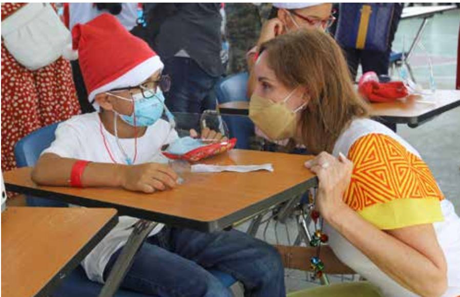
Ver y Oír para Aprender ha evaluado este año a cerca de 4,000 estudiantes a nivel nacional.

A través de la Dirección de Proyección Social, el Despacho de la Primera Dama hizo entrega de anteojos a 41 estudiantes del Centro de Educación Básica General (C.E.B.G.) El Zapallal, C.E.B.G. Arretí, C.E.B.G. Nicanor y C.E.B.G. Altos del Cristo, del corregimiento de Zapallal, distrito de Santa Fe, provincia de Darién, como parte del Programa Ver y Oír para Aprender. Los estudiantes fueron evaluados en septiembre pasado por personal de salud de la Universidad Especializada de las Américas. Este programa consiste en realizar jornadas médicas de optometría, fonoaudiología, odontología, vacunación y nutrición, dirigidas a estudiantes de centros educativos oficiales. Ver y Oír para Aprender ha evaluado a cerca de 4,000 estudiantes a nivel nacional en este 2021 y se continuará impulsando este programa que mejora el desempeño escolar de niños, niñas y adolescentes del país. En esta jornada, también una de las clínicas del programa Salud Sobre Ruedas, del Despacho de la Primera Dama, se trasladó al lugar para atender, los días 30 de noviembre y 1 y 2 de diciembre, a cerca de 100 mujeres con mamografías. También se hizo entrega de donaciones a la Región de Salud de Darién, consistente en dos mesas metálicas para realizar exámenes físicos, alimentos secos para pacientes afectados por Covid-19, enfermedades transmisibles y personas en pobreza multidimensional.