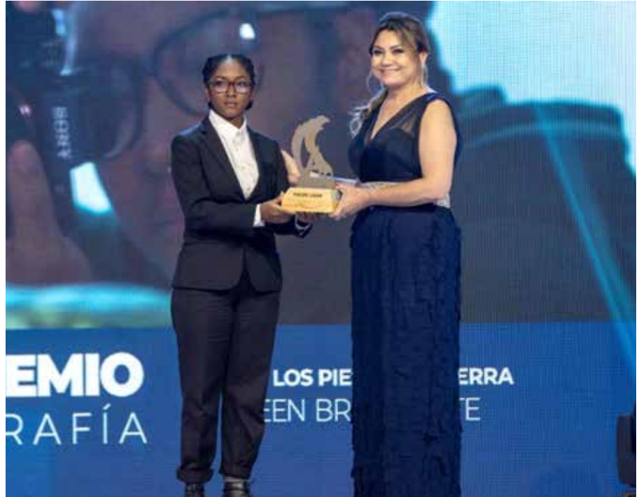
El galardón que resalta la cultura laboral.

El Concurso Nacional a la Cultura Laboral – Premios IPEL 2021 del Ministerio de Trabajo y Desarrollo Laboral (Mitradel), en su versión número 41, realizó el acto de entrega de premios a los 21 ganadores de las 7 categorías: artesanía, escultura, pintura, poesía, cuento, décima y fotografía con el tema “El Bicentenario de la República, un recorrido de 200 años en la construcción de nuestra nación”. La ministra de la cartera laboral, Doris Zapata Acevedo, explicó que el lema de este año se enmarcó en el Bicentenario de la Independencia de España, que constituye un evento trascendental para la sociedad logrado como nación desde el esfuerzo colectivo de la clase trabajadora con su historial de luchas reivindicativas, destacado a través de las expresiones artísticas de los participantes de este concurso. Esta iniciativa, que organiza el Instituto Panameño de Estudios Laborales (IPEL) del Mitradel, motiva e incrementa la