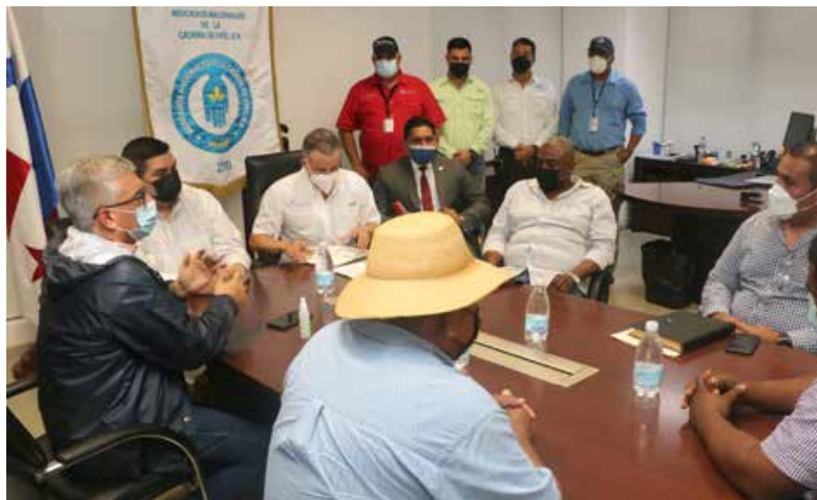
Miembros de la Asociación de Agricultores Unidos de Panamá participaron en la reunión en Merca Panamá.