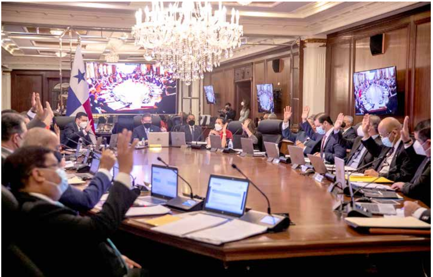
La administración recibió 1,003 obras incompletas que representan B/.116 mil millones.

representan B/.116 mil millones. El Consejo de Ministros también aprobó el proyecto de Resolución de Gabinete 125-21, que autoriza al Ministerio de Gobierno a suscribir, en nombre del Estado, un acuerdo transaccional con el Consorcio CEFERE Panamá para reactivar el contrato de obra N° 11-DAJTL-2017, de estudio, diseño, construcción y equipamiento del nuevo Centro Femenino de Rehabilitación. También aprobó el proyecto de Resolución 126-21, que autoriza un crédito adicional al Presupuesto General del Estado para la vigencia fiscal 2021, con asignación a favor de la Autoridad Nacional de Aduanas hasta por la suma de B/.4,377,303.00.