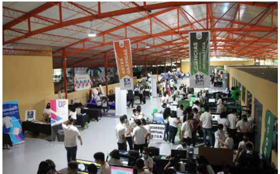
Alumnos del Instituto Técnico Don Bosco explican a la primera dama sus proyectos.

“La virtualidad, líder de la innovación” fue el lema de Expotecnia 2021, una exhibición de proyectos técnico-científicos realizados por estudiantes desde kínder hasta duodécimo grado del Instituto Técnico Don Bosco, y que recibió la visita de la primera dama de la República, Yasmín Colón de Cortizo, como embajadora de la educación STEAM. Todos los trabajos participan en un concurso y son evaluados por un jurado calificado en las diferentes áreas. Este plantel educativo está en proceso de modernización de sus laboratorios y