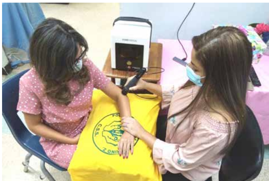
El tratamiento aplica ondas sonoras o acústicas de alta velocidad en los puntos dolorosos.

En esta instalación de la CSS se atienden, a nivel general, aproximadamente 464 mil asegurados.