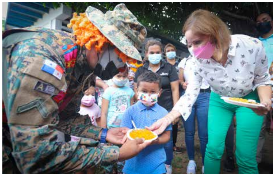
Los asistentes podrán disfrutar de juegos, "shows", bandas musicales, golosinas, comidas y juguetes.