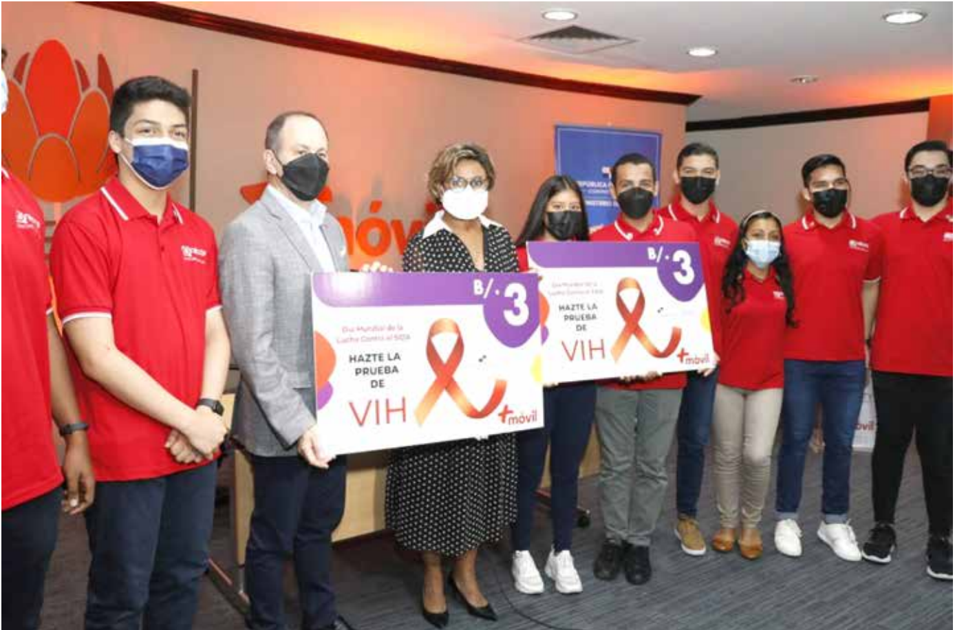
Los estudiantes finalistas del Concurso Nacional de Oratoria 2021 estuvieron presentes en el acto.