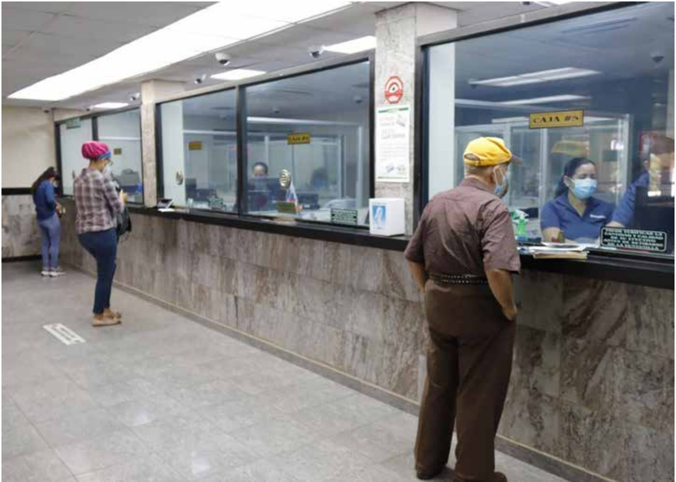
Los asociados muestran confianza en el cooperativismo.