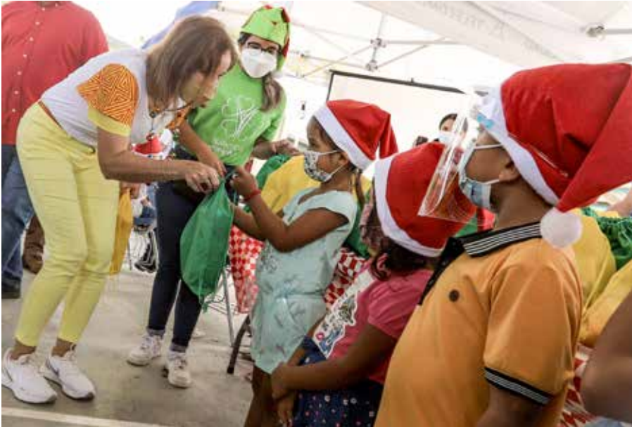
El Despacho de la Primera Dama entrega lentes del Programa Ver y Oír para Aprender en la provincia de Darién.