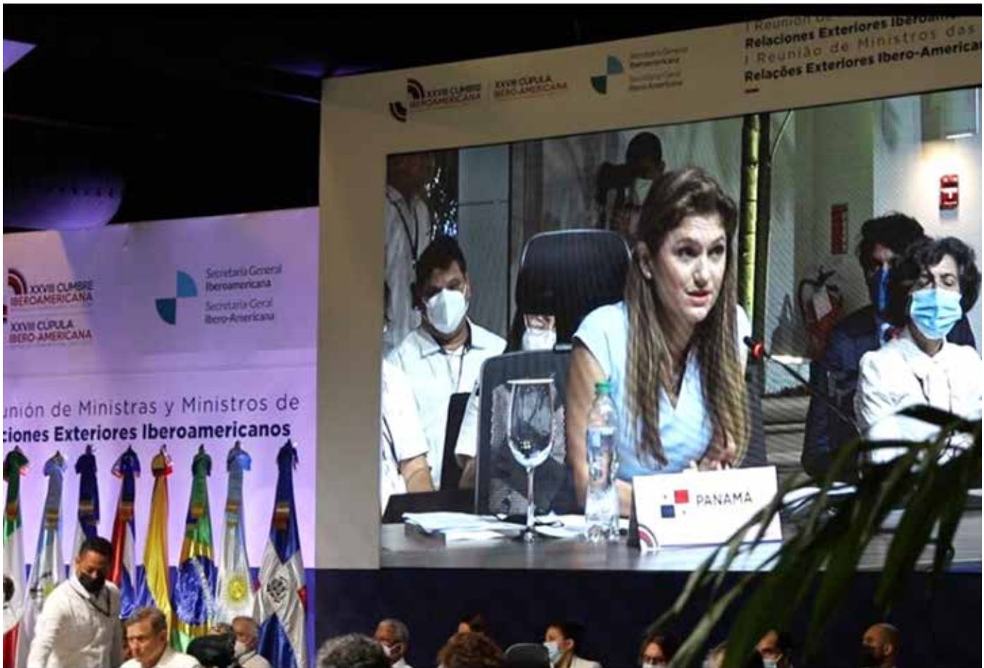
La canciller Erika Mouynes participó en esta reunión.