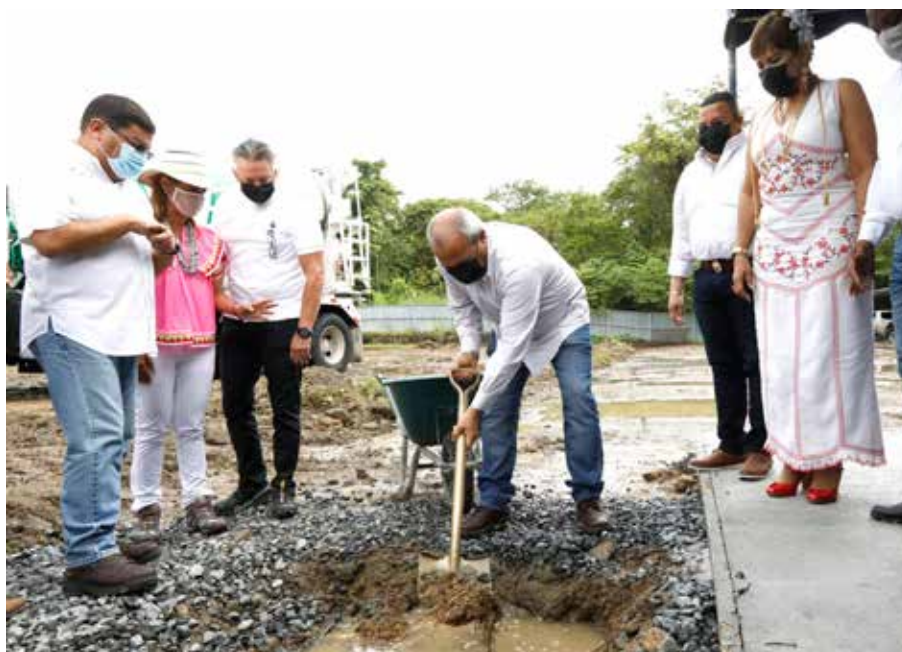
La obra, que tiene un costo de B/.6,858,309.45, es financiada por el BID.