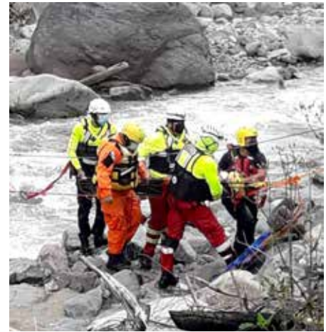
Trabajos de rescate durante los huracanes Eta e Iota.

también han sido la punta de lanza para elevar el nivel técnico operativo de la institución, razón por la cual más de 40 colaboradores han viajado al exterior para tomar cursos especializados en países como México, Guatemala, Nicaragua, Honduras, Japón, República Dominicana, Colombia, bajo el auspicio del Centro de Coordinación para la Prevención de Desastres (CEPRENAC) y el programa regional USAID/OFDA/LAC. En ese sentido, a través de la Academia Nacional de