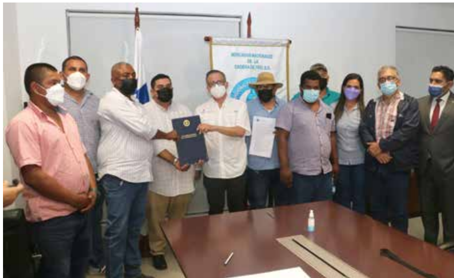
El ministro encargado Carlo Rognoni, durante la firma del acta de compromiso con productores.