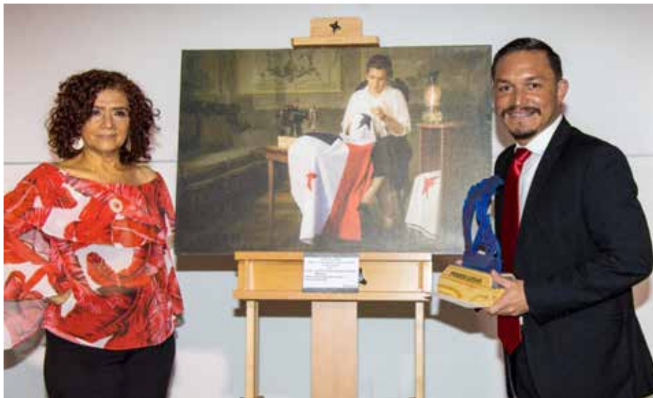
Ganadores reciben sus premios.

participación de los trabajadores panameños, mediante la creación de obras artísticas a nivel nacional.