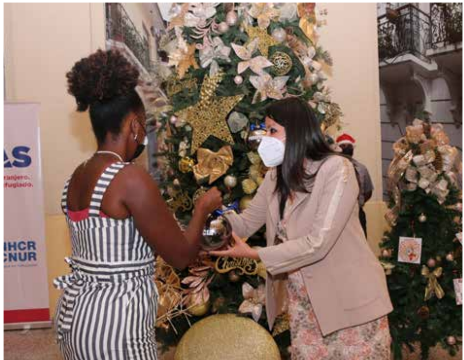
Cada refugiado colocó un adorno destacando los valores de la época decembrina.