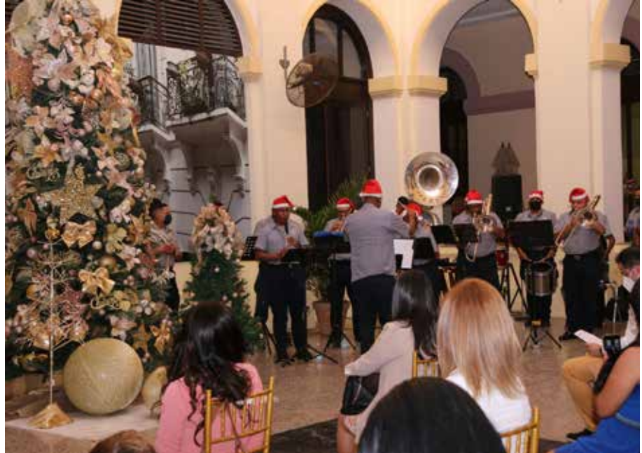
Refugiados en Panamá participaron en el encendido del árbol de Navidad en el Ministerio de Gobierno.

En el Día Internacional de los Derechos Humanos, refugiados se reúnen para encender el árbol de Navidad.