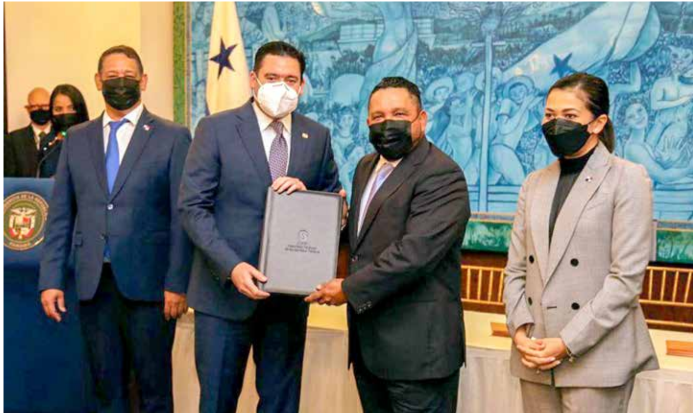
El vicepresidente de la República y ministro de la Presidencia, José Gabriel Carrizo Jaén, indicó que el gobierno reconoce y agradece el apoyo irrestricto de la radiodifusión en la lucha contra la pandemia de la Covid-19.

paz y salvo con el pago de la tasa de regulación anual, que esté operando en la zona de cobertura autorizada de forma continua e ininterrumpida, sin ocasionar interferencias perjudiciales, entre otros.