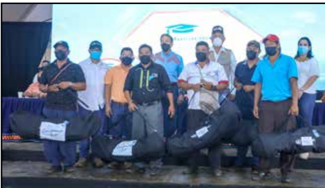
Atletas de la región fueron beneficiados con la entrega de implementos deportivos.