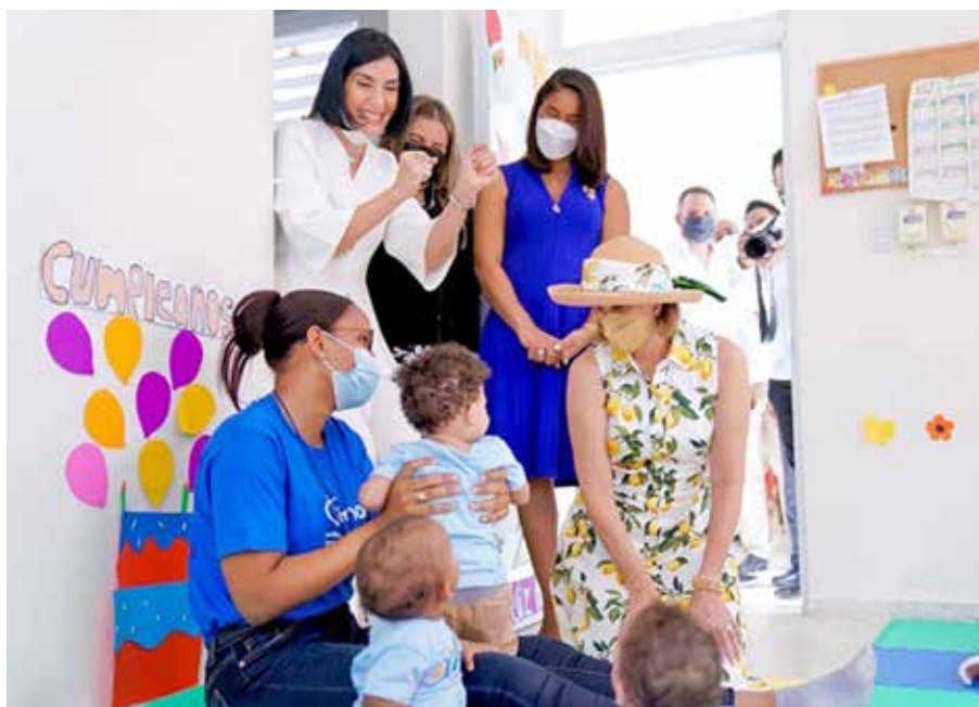
Colón de Cortizo visitó el Caipi San Marcos, en Puerto Plata, República Dominicana.