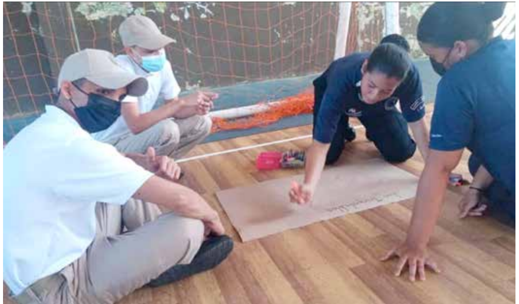
Los participantes fueron jóvenes del Programa Encontrando el Camino Correcto del corregimiento Pedregal, en el distrito de David, incluido en el Plan Colmena.

Dieciocho jóvenes integrantes del Programa Encontrando el Camino Correcto (PECC) recibieron orientación sobre prevención del VIH-SIDA. La información fue facilitada por la Alianza Integral y Continua en VIH de Chiriquí y el Ministerio de Desarrollo Social (Mides) a estos jóvenes en edades entre 15 y 18 años. Temas como la prevención de enfermedades de transmisión sexual (ETS), la prevención del VIH-SIDA y el uso del preservativo fueron tratados en esta actividad, que busca concientizar a los jóvenes sobre esta enfermedad que ha afectado a más de 17 mil personas en Panamá. Participaron los jóvenes del PECC del corregimiento de Pedregal, en el distrito de David, incluido en el Plan Colmena. El PECC es una iniciativa de la Policía Nacional para orientar y alejar a jóvenes en riesgo social del pandillerismo y la delincuencia, así como también de los peligros a los que se enfrentan en su entorno.