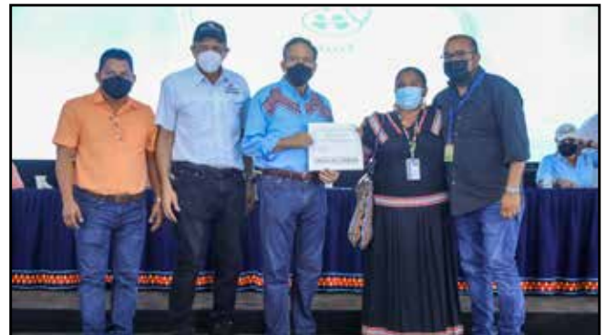
Con una inversión de B/.112,872.00, la Dirección de Asistencia Social (DAS) entregó una ambulancia para el Centro de Salud de Soloy.