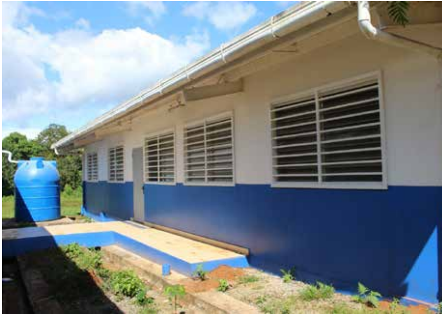
La Escuela Cerro Muleto recibió una partida de B/.4,455 para colocar un depósito acuífero que servirá a 256 alumnos.