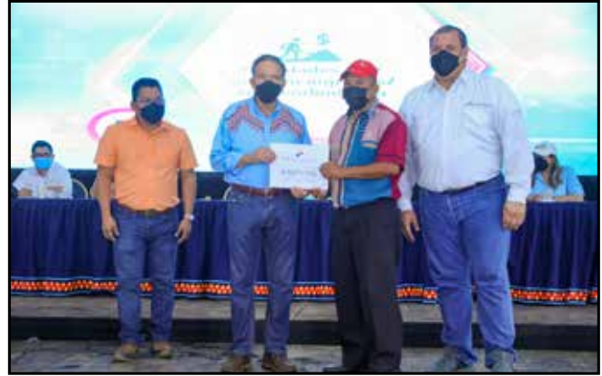
Del Programa Capital Semilla, se entregaron fondos por B/.20,000.00 a 10 emprendedores para que inicien sus negocios.