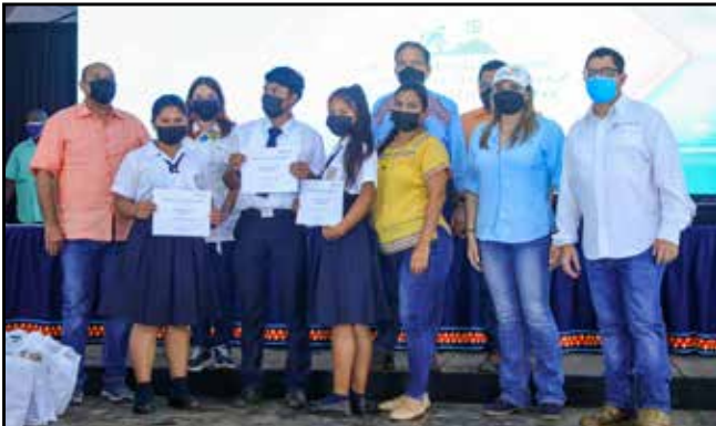
Se otorgaron 22 certificaciones a estudiantes del Programa Orienta Panamá y otras 27 a beneficiarios del Programa Género e Igualdad de Oportunidades.