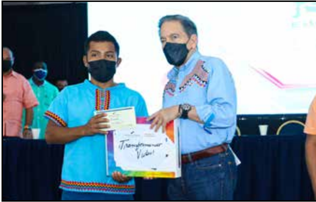
20 estudiantes recibieron becas y "laptops" del Programa Transformando Vidas, del Ministerio de la Presidencia.