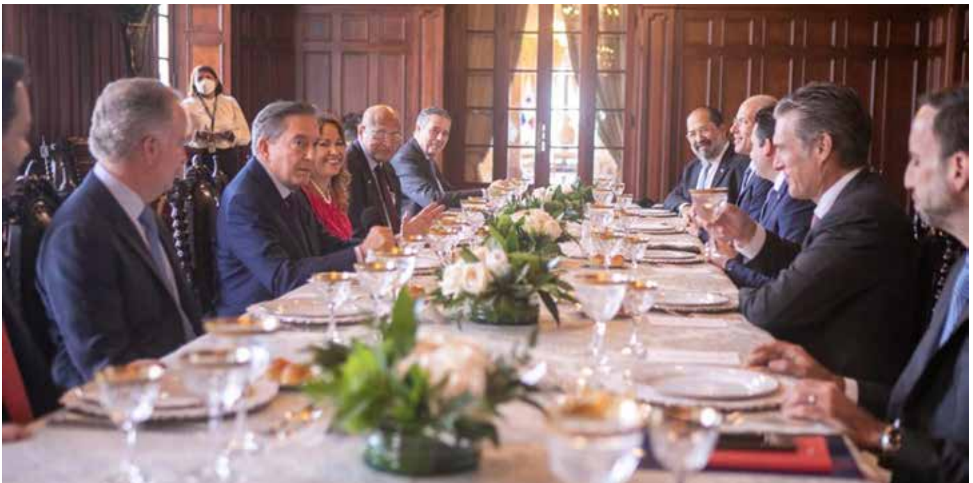
Este encuentro se enmarca en la política de puertas abiertas del Jefe del Ejecutivo con diferentes sectores.