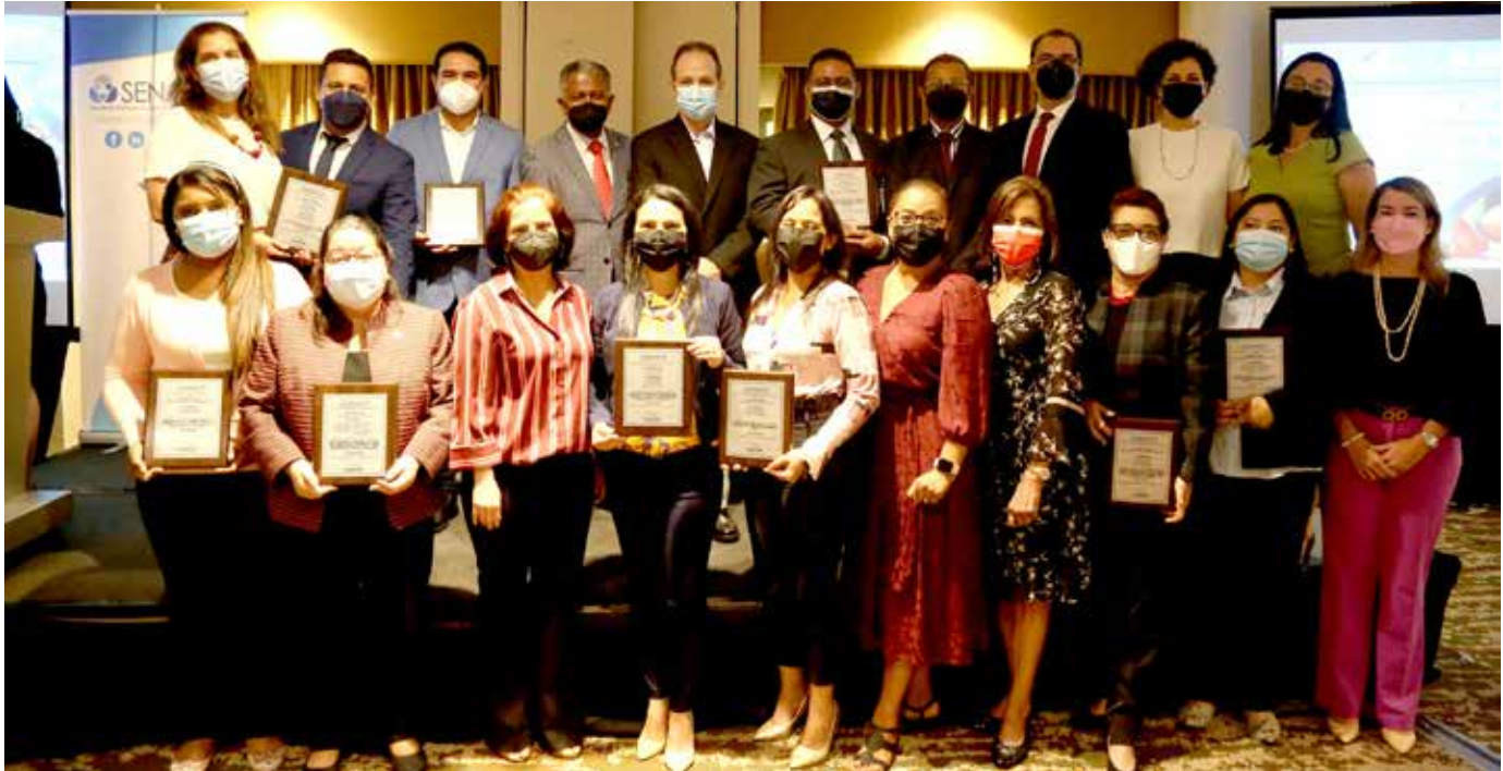
En el evento se hizo entrega de una placa de reconocimiento a los investigadores.

La Secretaría Nacional de Ciencia, Tecnología e Innovación (Senacyt) presentó los resultados de 82 proyectos de investigación científica finalizados exitosamente. Las investigaciones fueron ejecutadas entre los años 2006 y 2017 con una inversión total de B/.5,906,848.81. Estos trabajos comprenden las áreas de: Ciencias médicas, farmacológicas y de la salud; Ciencias Naturales, Ciencias de la ingeniería, tecnologías, físicas y matemáticas; Ciencias sociales, humanísticas y administrativas; arqueología, paleontología y arquitectura patrimonial, Ciencias de la Tierra y Ciencias agrícolas. Fueron desarrollados por 19 instituciones, 69 investigadores y 368 colaboradores, entre coinvestigadores, tesistas y asistentes de investigación y de campo. La Dirección de Investigación Científica y Tecnológica de la Senacyt lanzó un compendio de los hallazgos