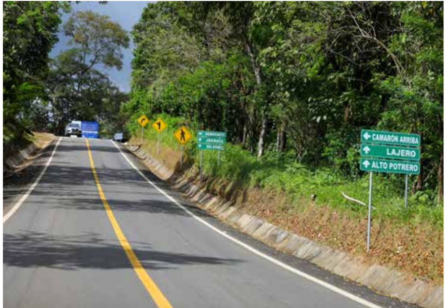
La vía mejorará la calidad de vida de más de 30 mil personas en el distrito de Besikó.

El presidente de la República, Laurentino Cortizo, entregó la carretera La Cieneguita – Quebrada Hacha – Lajero – Alto Potrero y ramal hacia Camarón Arriba, en el distrito de Besikó, comarca Ngäbe Buglé, y puso en funcionamiento el Centro de Operaciones Municipal de David, provincia de Chiriquí, donde operará un moderno sistema de cámaras de videovigilancia. El jefe del Ejecutivo manifestó que la carretera en la comarca Ngäbe tiene una extensión de 23.14 kilómetros, se construyó a un costo de B/.20,557,910.00 a través de un financiamiento del Banco Interamericano de Desarrollo (BID), y beneficia a más de 30 mil habitantes de esa región del país. “Esta carretera tiene un efecto importante y multiplicador en todos nosotros, porque los beneficios están ligados a mejor salud, vivienda, producción, infraestructura vial, educación, seguridad, deporte, cultura y electrificación rural”. En esta gira, el jefe del Ejecutivo presidió el acto mediante el cual entró en operaciones el moderno sistema de videovigilancia en la ciudad de David, que en su primera fase tendrá en operación 120 cámaras, distribuidas estratégicamente en las entradas y salidas de la