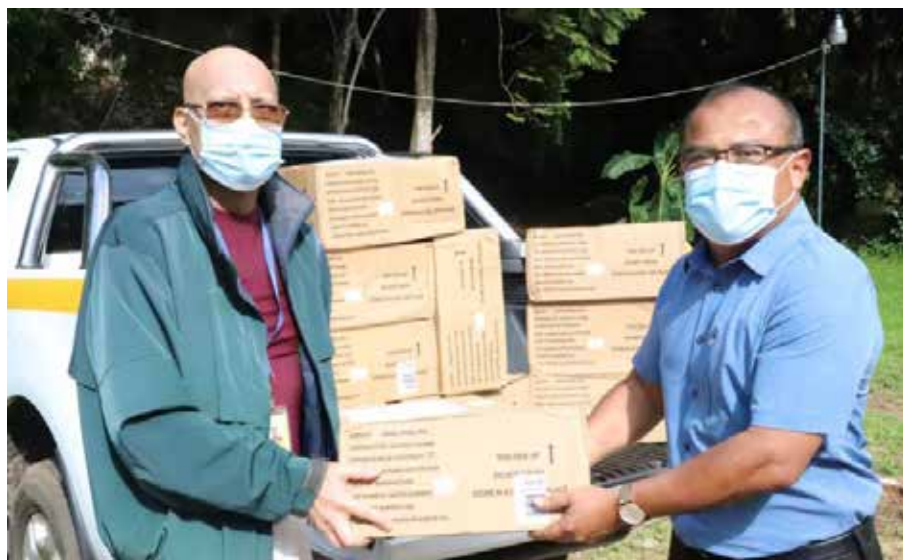
La Embajada de Estados Unidos donó 5,500 insertos para trampas Jackson y mil trampas Jackson para reforzar los programas de vigilancia fitosanitaria.

Los insumos serán utilizados por el personal técnico del MIDA que labora en todas las provincias, especialmente en aquellos lugares donde se llevan protocolos de exportación de papaya, cucurbitáceas y pimentones.