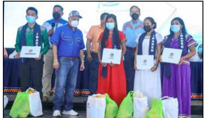
15 personas incluidas en el Programa Transformando Vidas, del Ministerio de la Presidencia, recibieron certificados de culminación de cursos del Inadeh.