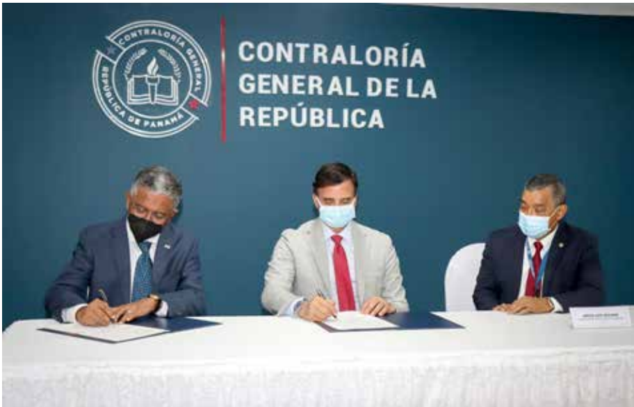
La Senacyt y la Contraloría General de la República suscribieron este acuerdo.