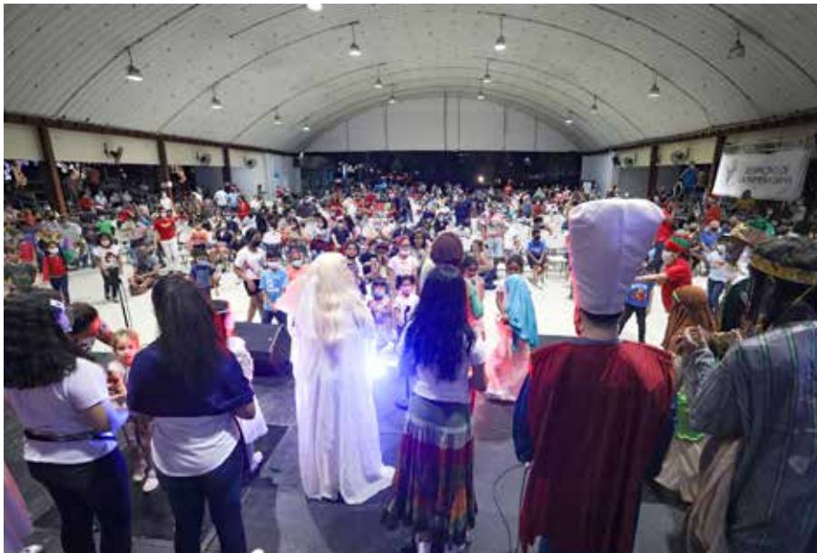
Cientos de personas llegaron al Domo del Parque Omar para participar de las actividades navideñas.