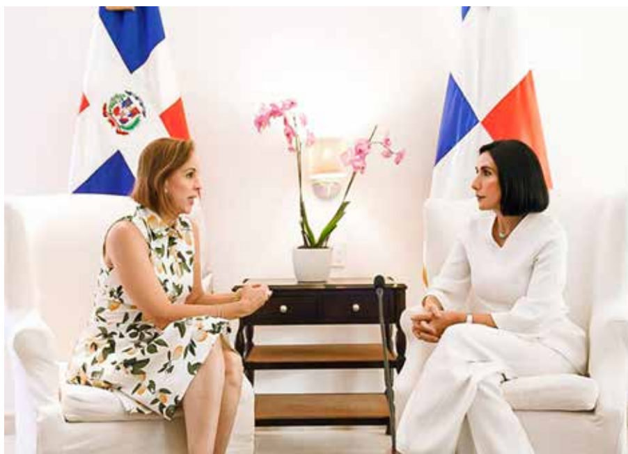
La primera dama participa en reunión bilateral con su homóloga dominicana, Raquel Arbaje.

Este enfoque refuerza las áreas de la ciencia, tecnología, ingeniería, arte y matemáticas en niños y jóvenes, utilizando la robótica y programación como herramientas para la resolución de problemas.