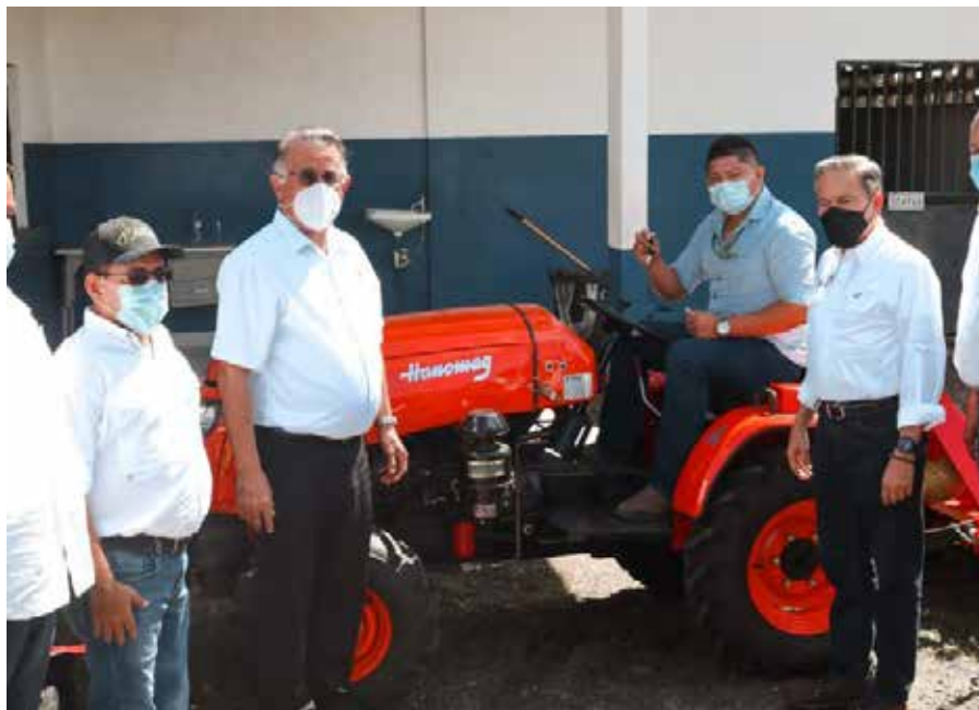
Entre los implementos suministrados hay cinco motocultores tipo azadas, un minitractor 4X4 y una piladora de granos.

Con esta entrega, se inicia el trabajo de pequeños productores, que para el próximo año prevé entregar más de B/.600 mil en estos equipos que ayudan y aumentan su rendimiento.