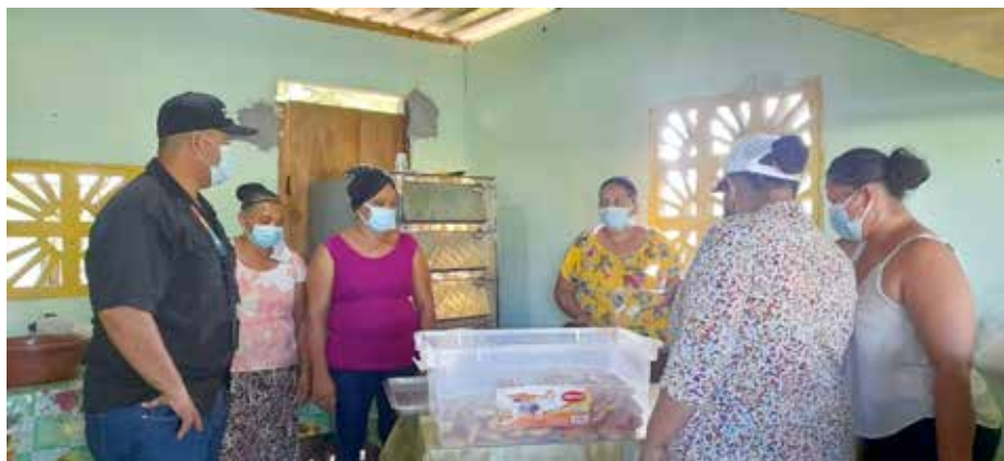
Las microempresarias exhortan a otras mujeres a iniciar su propio negocio.