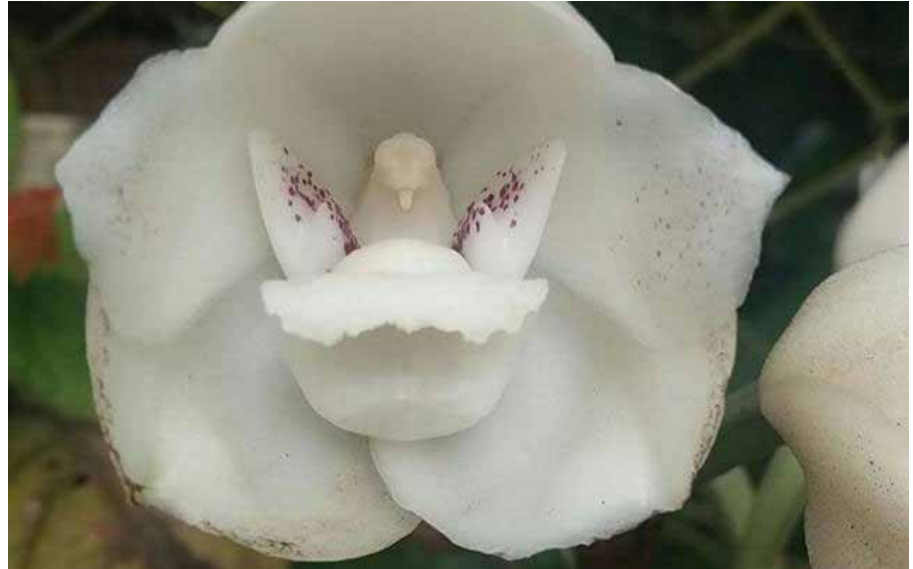
Esta especie de la flora panameña, de las que 150 son endémicas, pueden adquirirse en viveros registrados por el Ministerio de Ambiente.