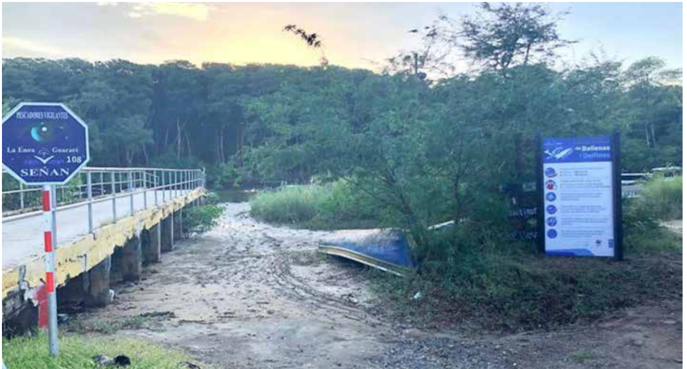
El turismo de avistamiento es una de las actividades de mayor crecimiento en el mundo.