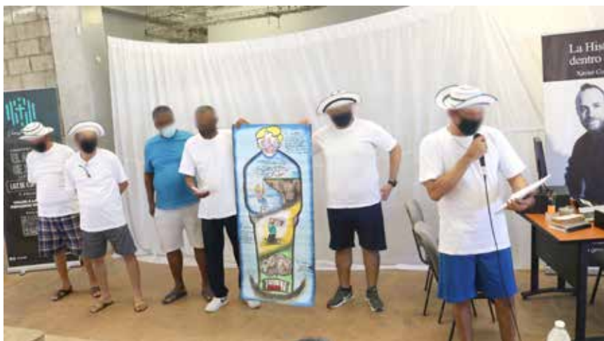
Los detenidos escenificaron dramas, pintaron dibujos y cantaron décimas del libro "La historia dentro de ti".