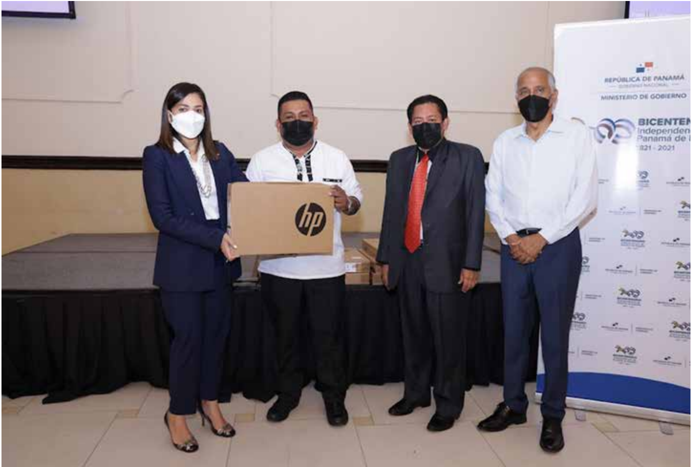
Clausura de la Tercera Reunión Ordinaria 2021 del Consejo Nacional de Desarrollo Integral de los Pueblos Indígenas.