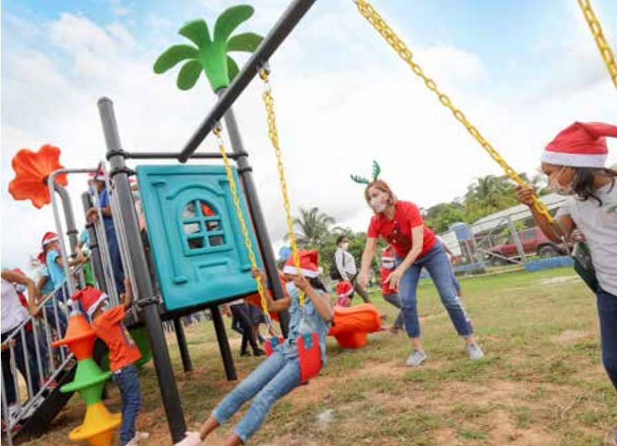
Se entregó un parque recreativo en el corregimiento de Las Huacas, distrito de Natá, provincia de Coclé.