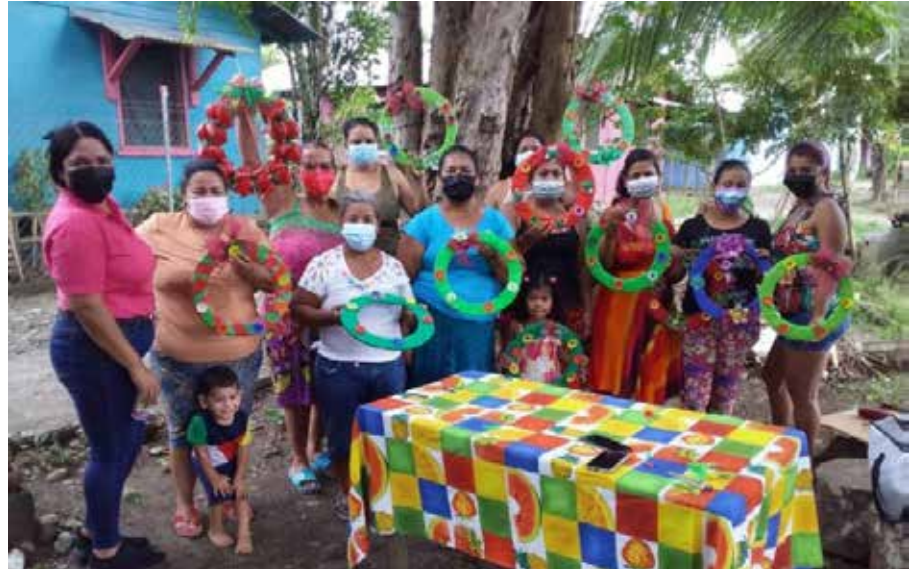
Para las flores, utilizan botellas plásticas y de latas.