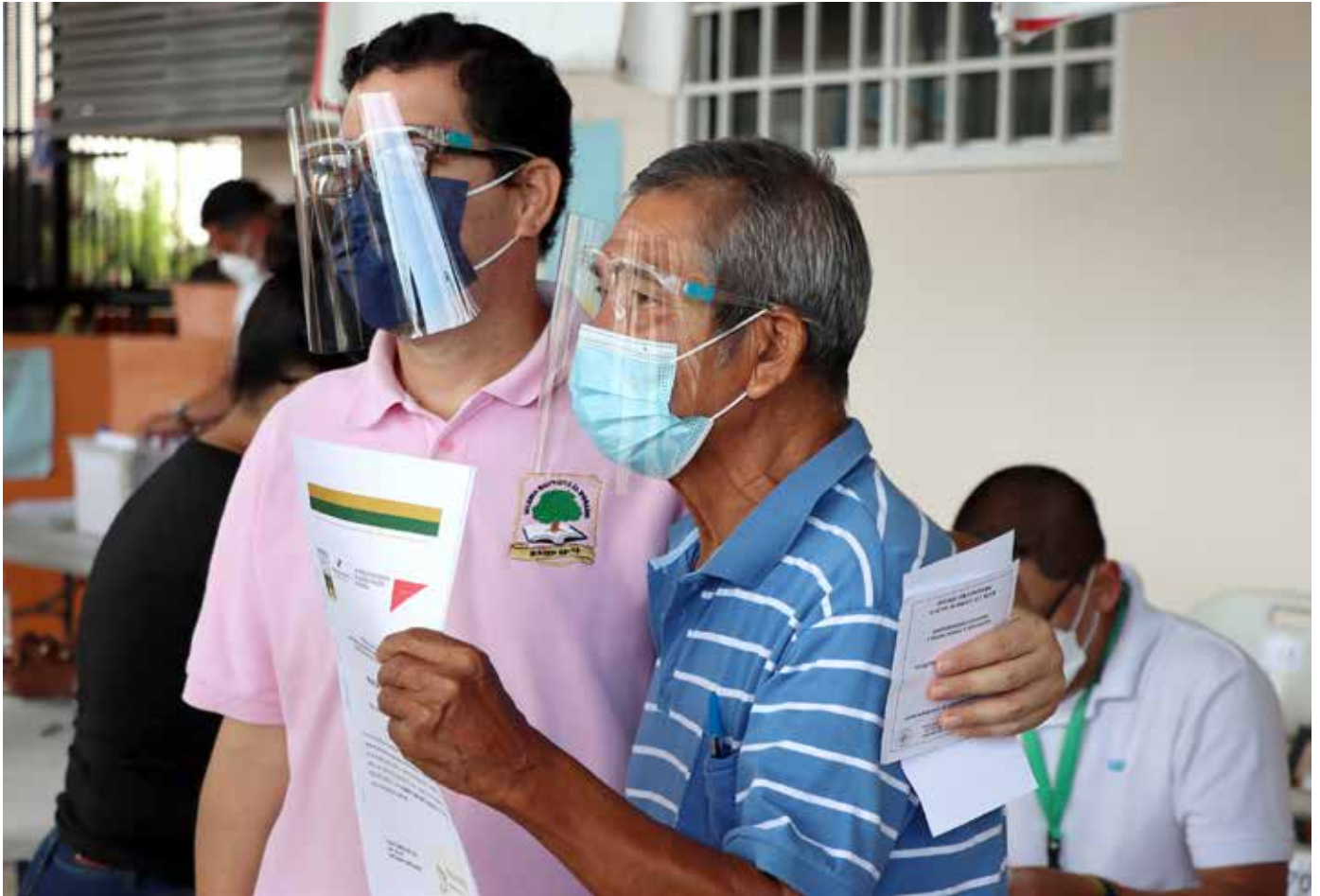
Padre e hijo, que esperaron por 40 años este documento, acudieron al llamado para recibir el título de propiedad.

Panamá sale adelante y, junto a esta reactivación, la Autoridad Nacional de Administración de Tierras (Anati) llevó a 6,603 familias de todo el país los títulos de propiedad de sus tierras, incorporándolas a la economía nacional y otorgándoles seguridad jurídica sobre sus predios. El martes 28 de diciembre culminó la jornada de entregas anuales beneficiando a 350 familias de San Miguelito en un acto donde se implementó el nuevo mecanismo que será utilizado