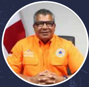
Carlos Rumbo Director general del Sistema Nacional de Protección Civil (Sinaproc)