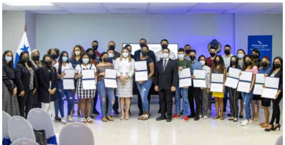
Participantes de las capacitaciones en habilidades socioemocionales para la vida y el trabajo.