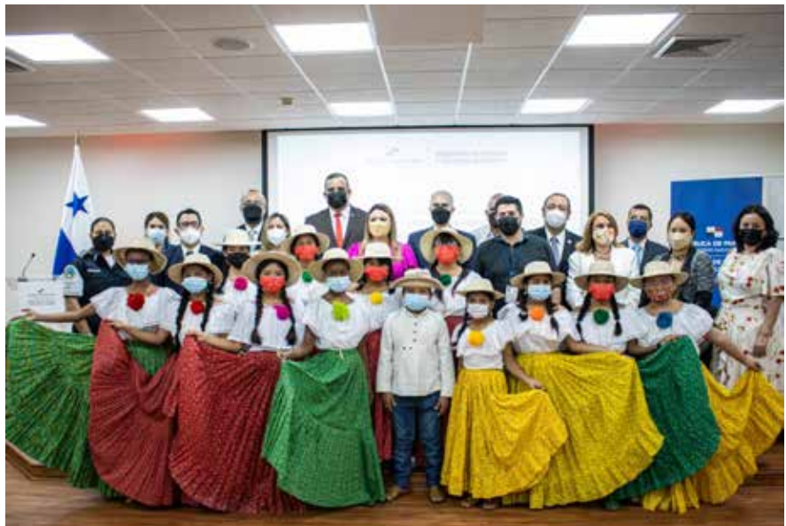
Representantes de la alianza público-privada de la red de empresas para la prevención y erradicación del trabajo infantil.