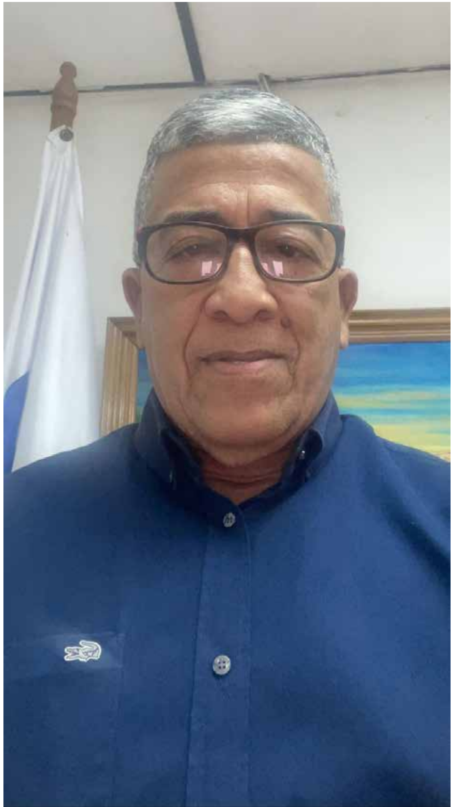
Avelino Ureña, director Nacional de Ganadería del Ministerio de Desarrollo Agropecuario (MIDA)

Con este programa buscamos solventar la necesidad de los pequeños ganaderos que, debido a problemas económicos y a la falta de orientación en el cruzamiento dirigido, no obtienen sementales de alto valor genético ni adoptan tecnologías de punta. También buscamos aprovechar la disponibilidad de material genético nacional de alta calidad, poco aprovechado, por la demanda de sementales, como resultado de la falta de recursos económicos de los pequeños productores con bajos recursos. Entre las razas de ganado de carne que hemos entregado están las cebuinas (Brahman, Nelore, Guzerat, sardo negro); las razas europeas de carne (angus rojo, brangus, beefmaster), y para el ganado de leche (Holstein, pardo suizo, gyr lechero, gilorando 5/8, 3/4 y jersey). Adicional a los sementales, hemos apoyado a los ganaderos con la distribución de 22,907 kilos de semilla gámica, por un valor de B/.197,161.50, para ayudarlos con la buena nutrición de los animales, a fin de que obtengan mejores rendimientos.