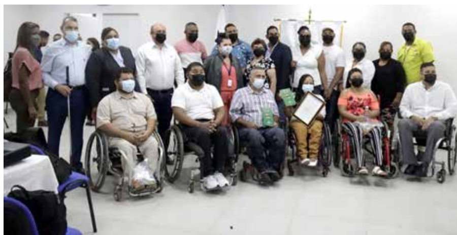
La entidad rectora del cooperativismo abrirá en enero una oficina de enlace en La Chorrera, que atenderá a las cooperativas de Panamá Oeste.