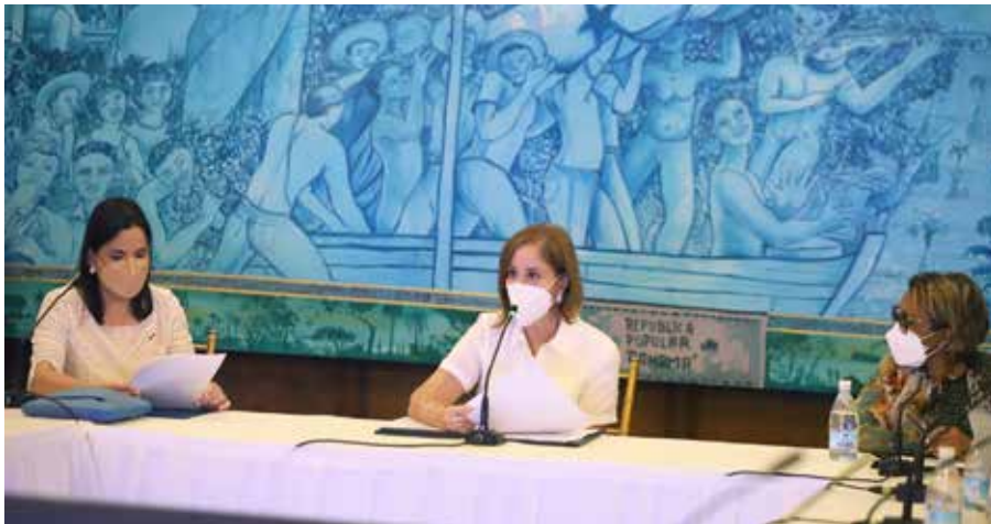
La primera dama, Yazmín Colón de Cortizo, participó en la reunión de alto nivel del Programa de Anticonceptivos Subcutáneos.