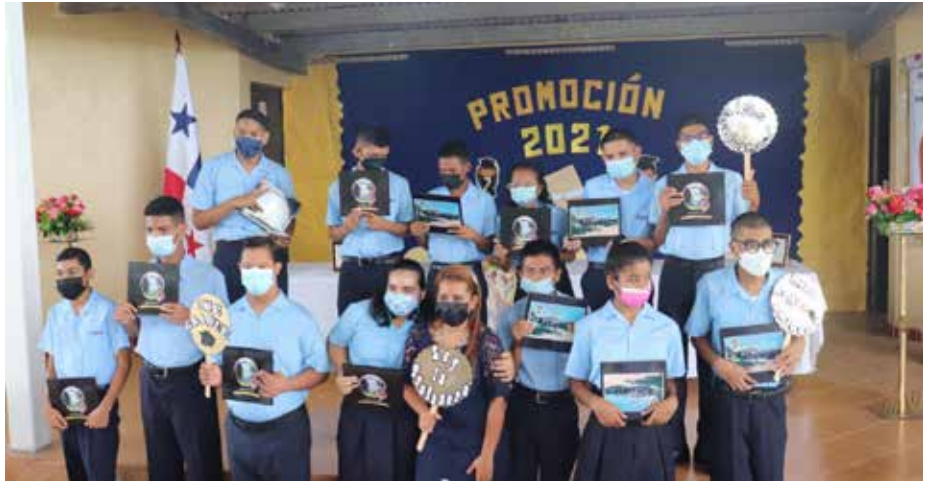
Los estudiantes tienen garantizado su derecho a una educación de calidad y en igualdad de oportunidades, de acuerdo con la Ley 25 de 10 de julio de 2007.

El objetivo de la educación especial es potenciar al máximo el desarrollo social, educativo y laboral para los niños, jóvenes y adolescentes que tienen necesidades educativas especiales.