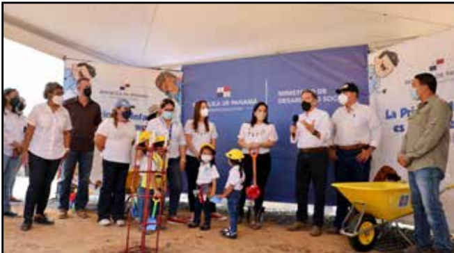
El mandatario presidió el acto protocolar de colocación de la primera palada para la construcción del CAIPI La Primavera, con una inversión de B/.335,311.88.