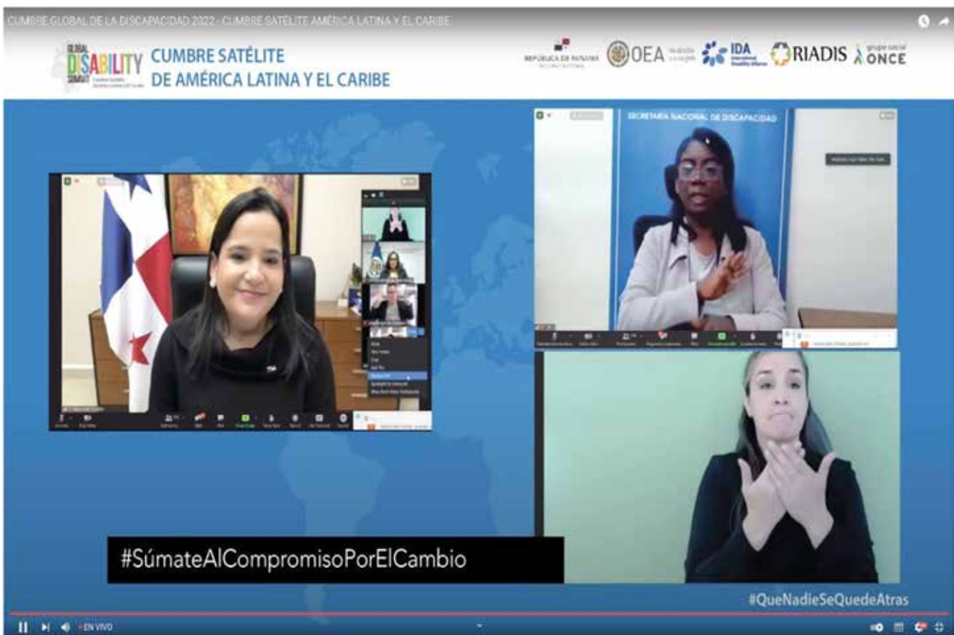
La cumbre virtual permitió reforzar los compromisos de los países de América Latina y el Caribe en temas de protección en favor de esta población.

organizaciones de la sociedad civil existentes con sostenibilidad y capacidad técnica. Además, hizo énfasis en que, desde antes de la pandemia, este grupo poblacional de la sociedad presentaba grandes desafíos que se han maximizado con la Covid-19, pero al mismo tiempo otras oportunidades se abren en estos tiempos y esta convocatoria ha permitido a los equipos técnicos vislumbrar un panorama real en el futuro.