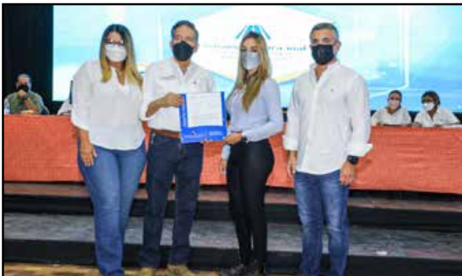
Se entregó orden de proceder para la rehabilitación de los caminos agropecuarios en esta provincia, con una inversión de B/.8,100,079.72.