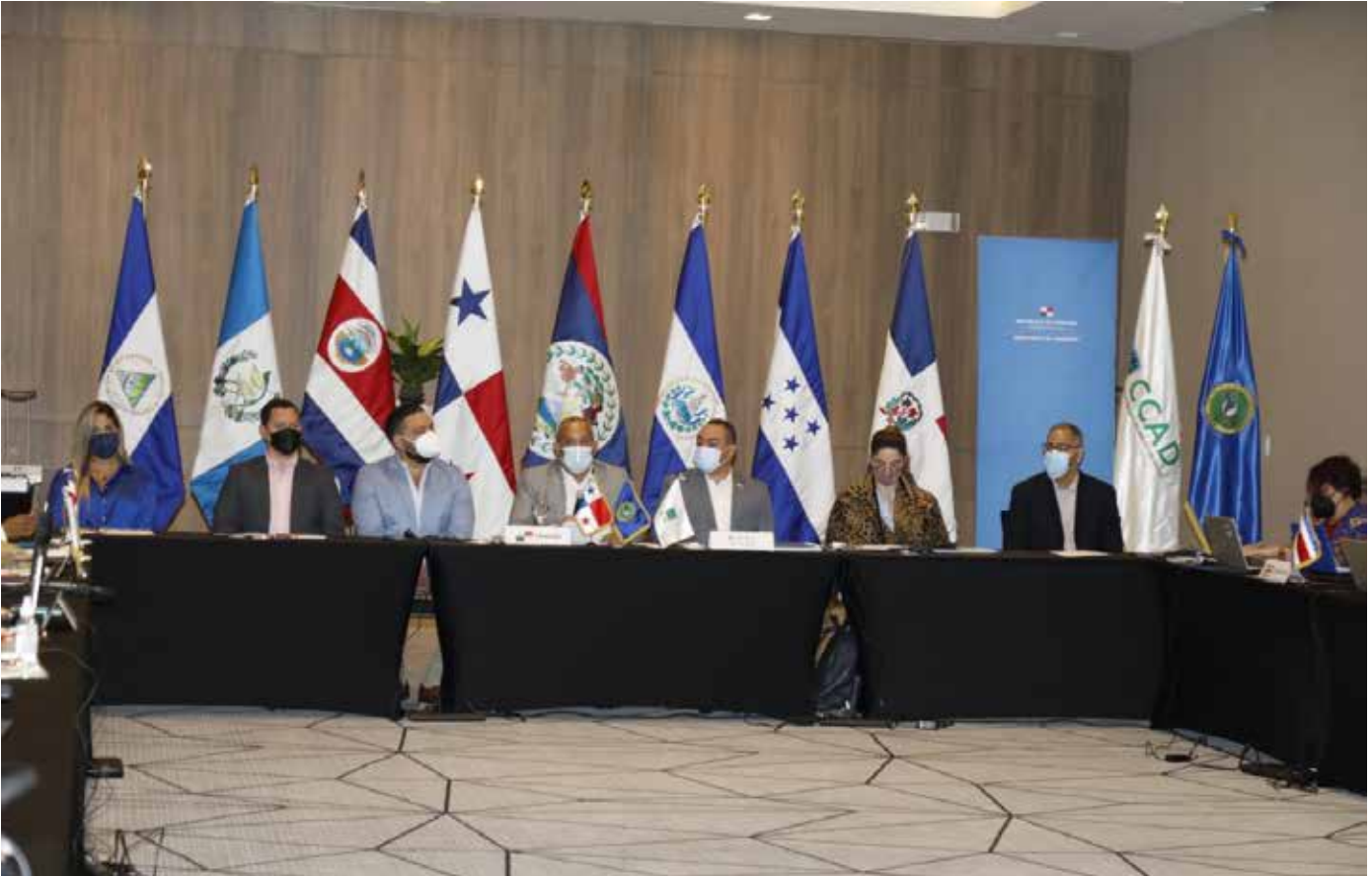
La reunión se celebra de manera presencial por primera vez desde el inicio de la pandemia

Ministros de Ambiente de Centroamérica se reunieron en Panamá para coordinar acciones que reduzcan la vulnerabilidad regional ante el cambio climático y la pérdida de biodiversidad. Este encuentro se da como parte de la LXVII Reunión Ordinaria del Consejo de Ministros de la Comisión de Ambiente y Desarrollo