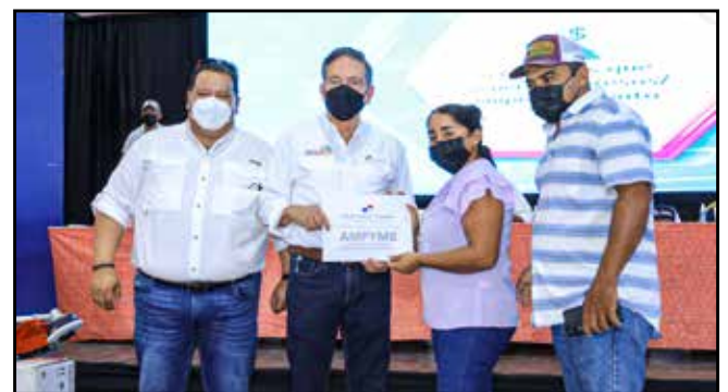
15 emprendedores de Mariato, Atalaya y San Antonio recibieron capital semilla por un monto de B/.30,000.00, para la puesta en marcha de sus negocios.