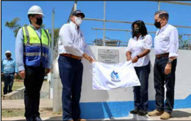
Por un monto de B/.13,092,688.55, se inauguró la planta de tratamiento de agua potable en la provincia de Veraguas, que beneficiará a 120 mil habitantes.

Comunidades visitadas: Santiago, San Martín, Atalaya.