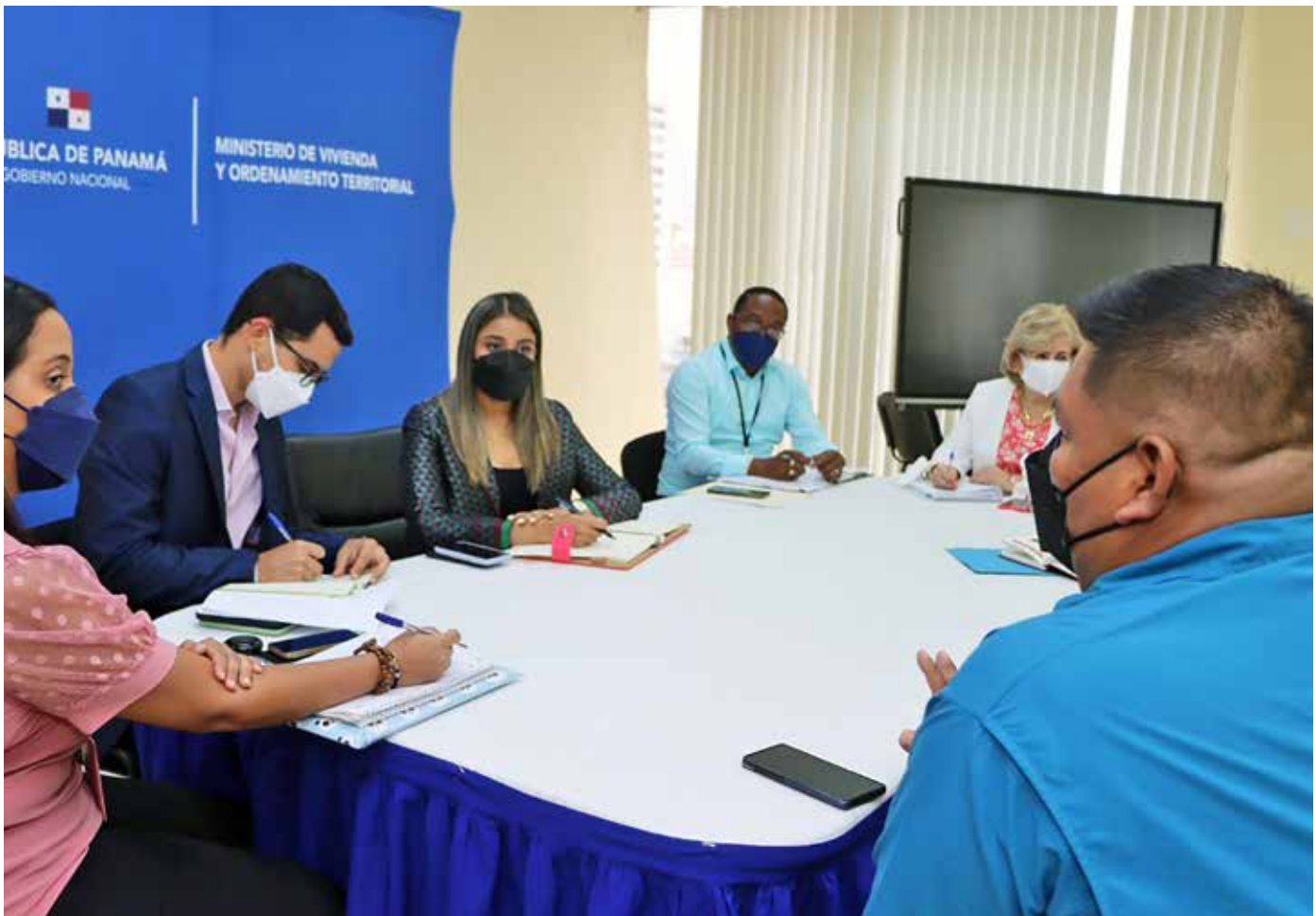
Las viviendas se construirán a través de los programas de Mejoramiento Habitacional, Plan Progreso, Vida y V-36, del Miviot.

municipales y locales de la comarca realizar una gira comunitaria de trabajo para observar en el campo la realidad y la necesidad de las familias de esa región.