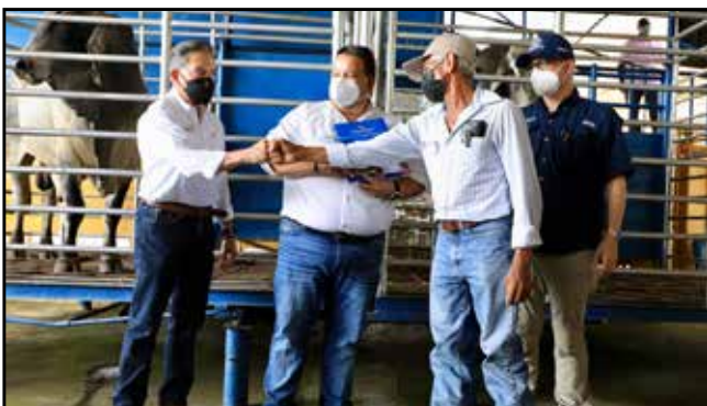
Pequeños productores de Montijo, Río de Jesús, Atalaya, La Mesa y Mariato recibieron 50 sementales de razas cebuinas, por un costo aproximado de B/.125,000.00.