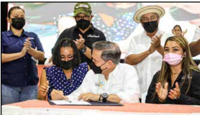
Se gestionó tres contratos de inserción laboral y, del programa de integración socioeconómica de las personas con discapacidad, se logró un nuevo contrato de trabajo.