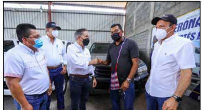
En la comarca Ngäbe Buglé, se entregaron vehículos a las juntas comunales de Bahía Azul, Bisira, Agua de Salud, Buenos Aires y Lajero.