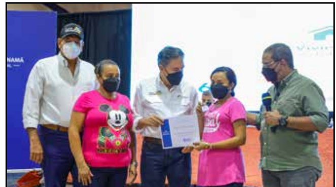
Por un total de B/.157,500.00, se entregó en los distritos Atalaya, Santa Fe, Cañazas y Santiago, 10 soluciones habitacionales, ocho viviendas y dos mejoras.