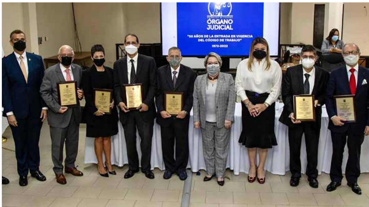
Se entregó reconocimientos a codificadores que elaboraron el Código de Trabajo.