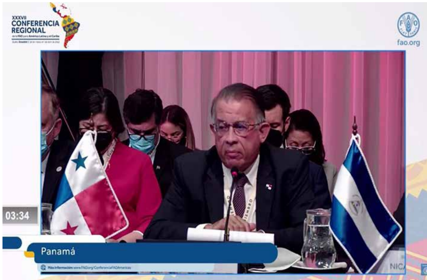
El titular del MIDA, Augusto Valderrama, durante la XXXVII Conferencia Regional de la Organización de las Naciones Unidas para la Alimentación y la Agricultura (FAO).

En su participación en la XXXVII Conferencia Regional de la Organización de las Naciones Unidas para la Alimentación y la Agricultura (FAO), que se desarrolló del 28 de marzo al 1 de abril en Quito, Ecuador, el ministro de Desarrollo Agropecuario, Augusto Valderrama, destacó la importancia del sector agropecuario para garantizar el abastecimiento de alimentos en la región. También instó a trabajar en conjunto para lograr la transformación y eficiencia de los