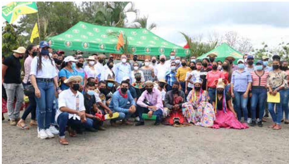
La mujer rural será uno de los temas en agenda de la reunión.

El encuentro promueve y opera de manera coordinada acciones en favor de la inclusión de las juventudes regionales agropecuarias.