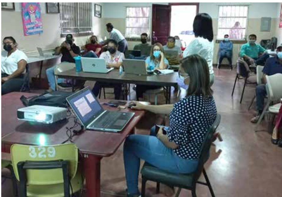
Exportadores reciben capacitación en línea para tramitar los certificados fitosanitarios.

Como resultado de acciones conjuntas entre la Oficina de Política Comercial, las coordinaciones regionales de Sanidad Vegetal de Chiriquí, Bocas del Toro, Colón y la Dirección Nacional de Sanidad Vegetal (DNSV), se logró el acceso a códigos para exportar a la República Popular China para 110 productores de café y 2 de cacao, lo que se traduce en una oportunidad para comercializar el grano panameño en el gigante asiático. Panamá fue uno de los cinco países exportadores de café del continente americano que logró cumplir con los procedimientos para la admisibilidad establecidos por la Administración General de la Aduana China, que empezaron a regir el 1 de enero de 2022 y el segundo con mayor número de exportadores registrados. Con el registro y los códigos otorgados por la Administración General de la Aduana China, los exportadores panameños, además de contar con autorización para enviar sus productos a ese país, podrán utilizar la plataforma Single Window de la institución asiática.