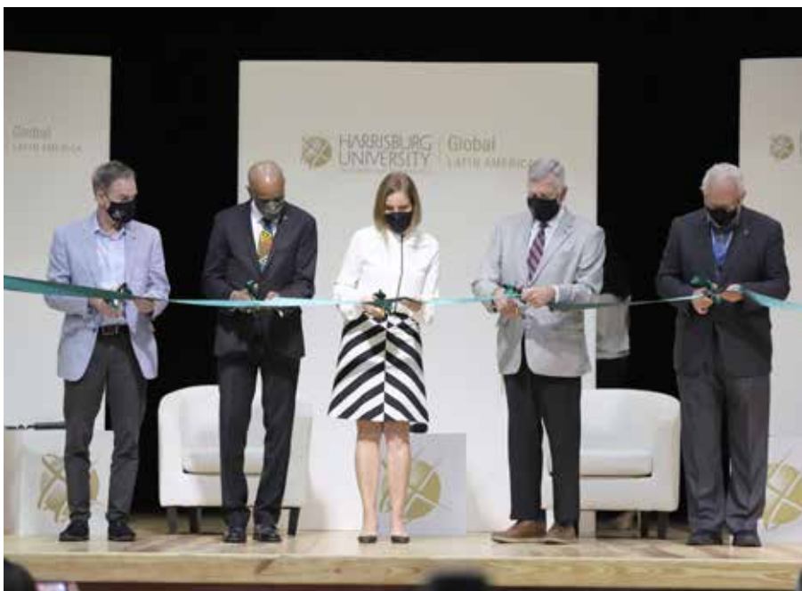
Harrisburg University ofrecerá sus maestrías en Analítica de Datos, Ciberseguridad y Gestión de Proyectos.

Con la participación de la primera dama de la República, Yazmín Colón de Cortizo, y un panel de expertas que conversaron sobre las “Ideas clave para el desarrollo del talento humano latinoamericano en competencias STEM”, se llevó a cabo el acto inaugural de la sede de Harrisburg University para América Latina. Esta institución educativa de origen norteamericano es considerada una de las mejores universidades con enfoque “STEM” (Ciencia, Tecnología, Ingeniería y Matemáticas) en los Estados Unidos, según Corporate LiveWire. La primera dama resaltó la visión “STEAM”, bajo la cual su Despacho viene trabajando como abanderado de este tema en el país. Desde ahora, Harrisburg University of Science and Technology (HU) ofrecerá sus maestrías en Analítica de Datos, Ciberseguridad y Gestión de Proyectos para brindar las herramientas y oportunidades que los estudiantes necesitan en el desarrollo pleno de sus habilidades y para contribuir a alcanzar la confianza y competencia necesarias para ingresar en sus campos profesionales y lograr así una diferencia positiva en su entorno. Obtener una beca en HULATAM es fácil. Todos los estudiantes aceptados en esta sede serán considerados automáticamente al solicitar este beneficio en línea a través de https://www.harrisburgu.edu/apply-at-hu/ . Las becas están disponibles para los estudiantes latinoamericanos que se inscriban en la sede de Panamá.