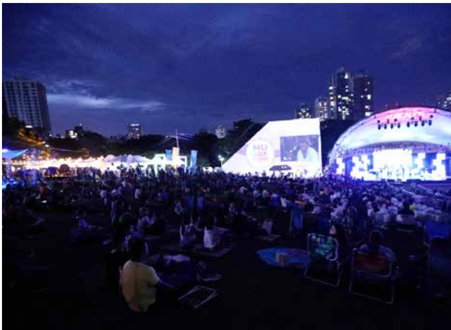
Cientos de personas se dieron cita los tres días de espectáculo a cargo de 250 artistas nacionales.

Del viernes 8 al domingo 10 de abril, se llevó a cabo el Musicalion 2022, en el anfiteatro del Parque Omar, gracias al apoyo y trabajo colaborativo del Despacho de la Primera Dama de la República y la administración del Parque Recreativo y Cultural Omar. Se trata de la novena edición del festival, una iniciativa de la Fundación ARIA, que busca robustecer las artes escénicas y las industrias culturales a través de la divulgación, la puesta en escena y la promoción del talento. La primera dama, Yasmín Colón de Cortizo, participó de la gala de inauguración y expresó su satisfacción en que regrese este festival artístico y musical al Parque Omar. Cientos de personas se dieron cita los tres días de espectáculo a cargo de 250 artistas nacionales entre bailarines, cantantes y músicos. El viernes 8 se desarrolló el concierto de salsa "Con Son Latino". El sábado 9 fue una tarde para la familia con la obra teatral "El Principito", seguido de las bandas sonoras de películas animadas incluyendo "Encanto". El domingo 10 fue el turno para Voces por la Paz, un concierto de esperanza. A lo largo de los nueve años de Musicalion, más de 2,000 artistas panameños se han presentado en este escenario que les permite exponer su talento ante los asistentes que se dan cita en cada festival.