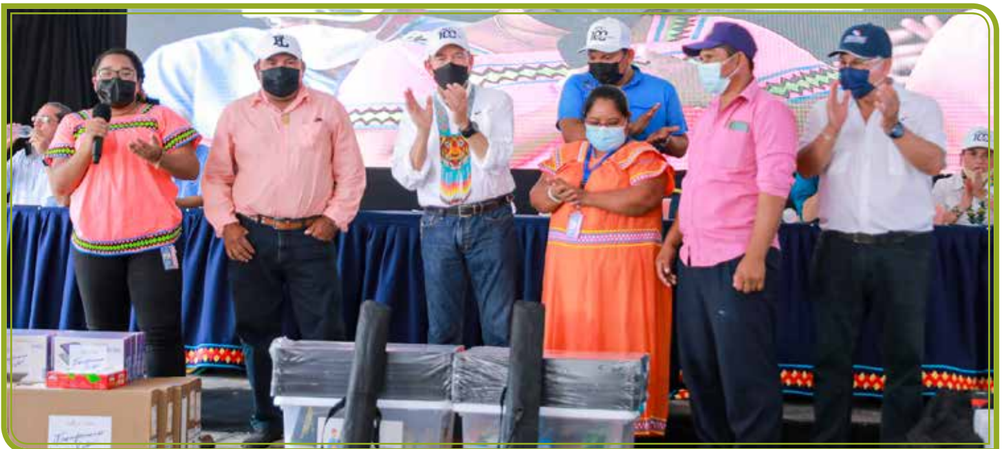
CENTROS DE LECTURA COLMENA

INSTITUCIONES PARTICIPANTES: MOP, MINPRE, IMA, MIDA, AMPYME, MICULTURA, MIDES, MEDUCA, IFARHU, INADEH, MINSA, MIVIOT Y ATP.