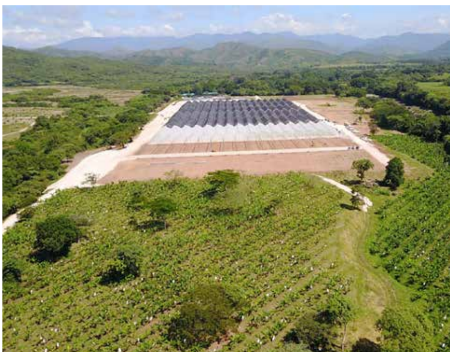
Esta iniciativa está enfocada en la producción agroalimentaria, agroindustrial y la promoción de cadenas productivas de valor, a partir de materia prima de producción nacional agrícola, pecuaria, acuícola, pesquera, forestal y productos del mar.

Con la finalidad de seguir fortaleciendo la ley del régimen especial para el establecimiento de empresas operadoras y desarrolladoras de agroparques en Panamá, el viceministro de Desarrollo Agropecuario, Carlo Rognoni, inauguró las nuevas oficinas de Agroparques, ubicadas en la sede central del Ministerio de Desarrollo Agropecuario (MIDA), en Altos de Curundú. Rognoni manifestó que con el inicio de operaciones de esta oficina se cumple con el compromiso de fortalecer la promoción y la atracción de inversión nacional y extranjera en el sector agropecuario, tal como lo establece el Plan de Gobierno del presidente Laurentino Cortizo Cohen. “Esta ley es el fruto de un trabajo en equipo entre la Presidencia de la República, el MIDA y la oficina del ministro Consejero de Asuntos Agropecuarios, Carlos Salcedo. Hay mucha expectativa de parte del sector privado nacional e internacional para la utilización de agroparques, añadiendo valor al producto nacional y agrupando a nuestros productores con miras a impulsar las exportaciones”, acotó Rognoni. La ley de agroparques fue sancionada el 8 de febrero de 2021, por el presidente Cortizo Cohen y, además, se nombró una comisión técnica para su debida reglamentación.