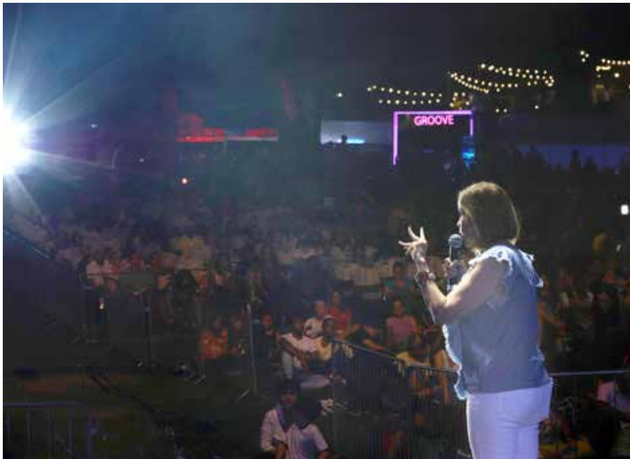
La primera dama participa en la apertura del Festival Musicalion en el Parque Omar.