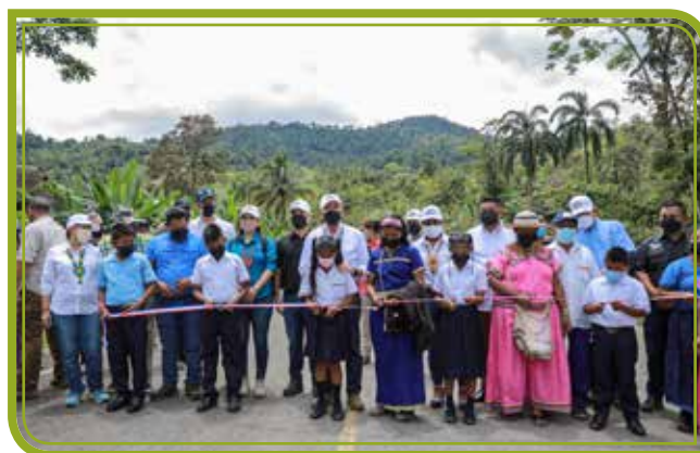
ENTREGA DEL TRAMO 1 DE LA CARRETERA CAÑAZAS - KANKINTÚ