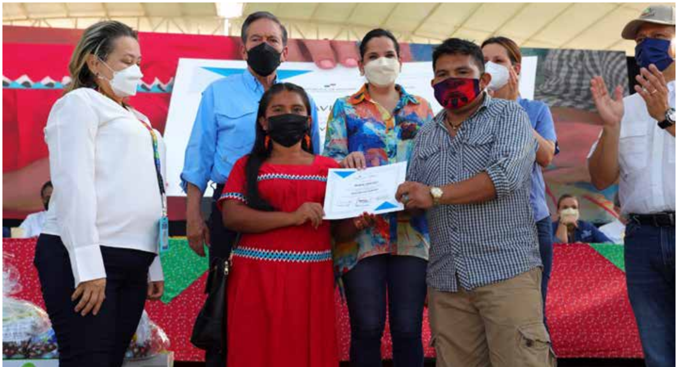
Durante la GTC se entregó asistencia social a tres hogares de adultos mayores.