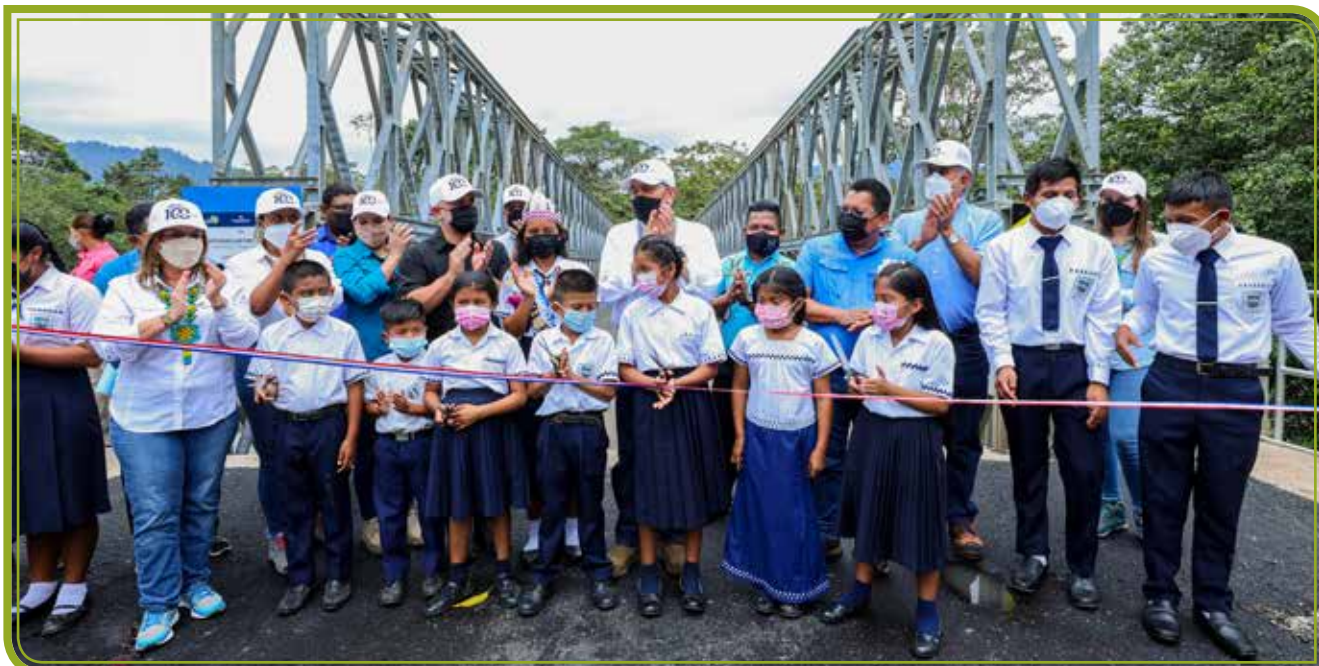
INAUGURACIÓN DEL PUENTE SOBRE EL RÍO GUABO