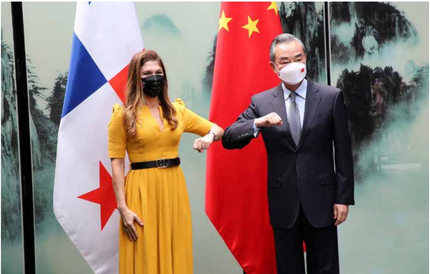
La ministra Erika Mouynes presentó al canciller y consejero de Estado de la República Popular China, Wang Yi, la agenda panameña de cooperación, comercio e inversión y diálogo político.

los resultados del encuentro, así como la relevancia de que China, como miembro permanente del Consejo de Seguridad pendiente por suscribir el Protocolo de Neutralidad del Canal de Panamá, se adhiera a este instrumento jurídico internacional.