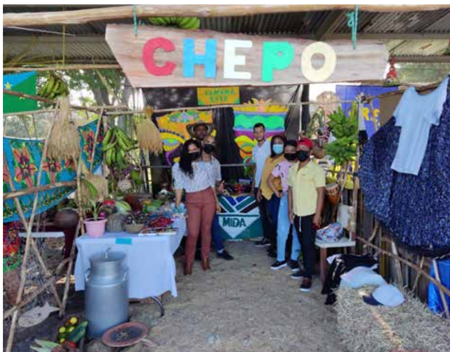
Jóvenes exponen sus productos en el encuentro.