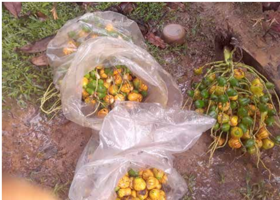
Las bolsas plásticas utilizadas se constituyen en una barrera que impide que el insecto logre infestar los frutos.

El picudo del pixbae es un pequeño escarabajo o gorgojo cuya hembra coloca sus huevecillos en las flores de la palma, donde posteriormente nacen larvas que infestan y se alimentan internamente en los frutos, pudiendo causar hasta el 100% de pérdida de los frutos en cada racimo.