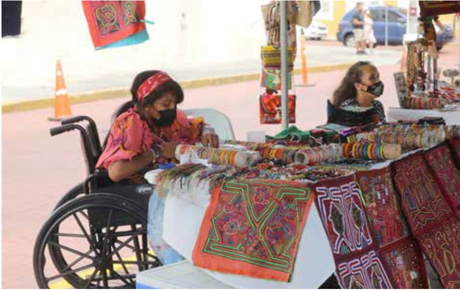
El Mercadito Artesanal de la Catedral cumple 19 años de estar ofreciendo a turistas y nacionales las creaciones de emprendedores panameños.