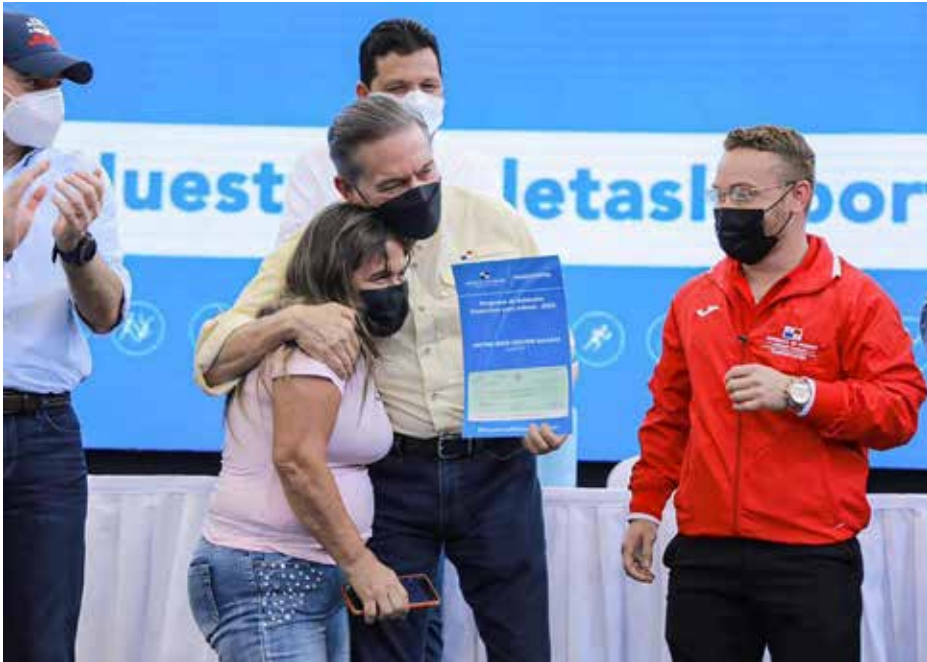
El acto de entrega de incentivos económicos se llevó a cabo en el Gimnasio Municipal de Chitré, también conocido como "La Cajetita de Fósforo".