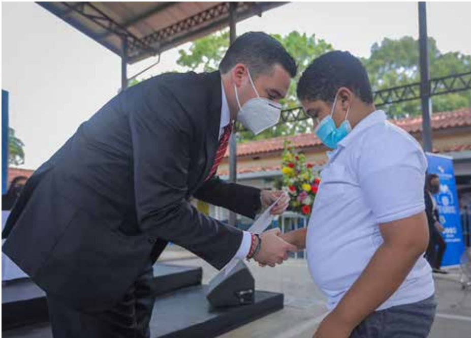
El vicepresidente de la República, José Gabriel Carrizo Jaén, acompañó al presidente Cortizo Cohen en la entrega de becas.

Este jueves 7 de abril, el presidente de la República, Laurentino Cortizo Cohen, anunció la inclusión de 4 mil estudiantes panameños que acuden a distintas escuelas y universidades, al Programa de Asistencia Económica para Estudiantes con Discapacidad. Estos 4 mil estudiantes participaron de la Convocatoria de Becas para Estudiantes con Discapacidad que en febrero de 2022 lanzó el Instituto para la Formación y Aprovechamiento de Recursos Humanos (Ifarhu). El anuncio lo efectuó el presidente durante el acto de entrega protocolar de becas a 20 de los estudiantes que participaron en la convocatoria para estudios de primaria, premedia, media y universitaria. Cortizo Cohen señaló que la educación, “la estrella”, no es un tema exclusivo de una sola administración, sino de muchas más, pero una educación de calidad para la vida y el trabajo.