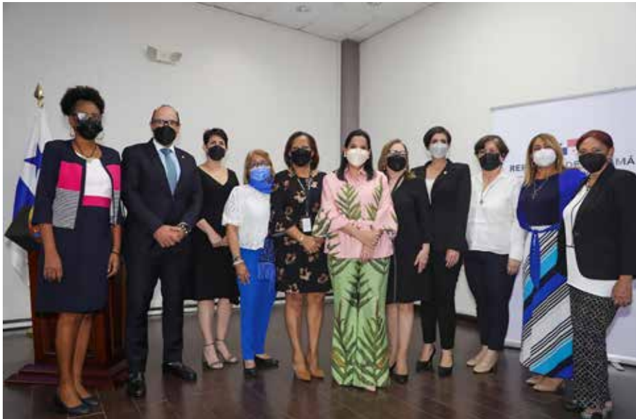
Con el apoyo del UNFPA, Cladem y CEFA, el Mides realiza una investigación sobre la vulnerabilidad de los derechos de la población adulta mayor.

La ministra de Desarrollo Social, María Inés Castillo, presidió la presentación de los resultados del Estudio Sobre la Violencia Contra las Mujeres Mayores, que arrojó importantes datos para el desarrollo de una política pública dirigida a proteger la integridad y los derechos de esta población. La titular de la cartera social indicó que estos datos permitirán trazar una hoja de ruta del trabajo articulado que deben llevar adelante las instituciones involucradas en el tema, para garantizar de forma integral los derechos humanos de esta población, sin que nadie se quede atrás. De acuerdo con el estudio, realizado por investigadoras, abogadas, sociólogas, trabajadoras sociales y psicólogas, un 87.8% de las encuestadas indicó que las mujeres mayores pueden sufrir de violencia, mientras que un 63.6% declaró conocer a mujeres afectadas por la violencia. El estudio, que contó con el respaldo del Fondo de Población de las Naciones Unidas (UNFPA), el Comité de Latinoamérica y el Caribe para la Defensa de los Derechos de la Mujer (Cladem) y el Centro de Estudio y Capacitación Familiar (CEFA), hizo la encuesta a 140 mujeres en las provincias de Veraguas, Colón, Chiriquí y Panamá Centro, entre los meses de marzo y noviembre de 2021.