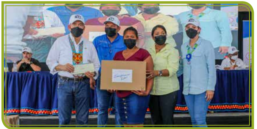
BECAS, "LAPTOPS" Y "TABLETS"