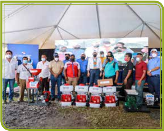
MOTOBOMBAS A PRODUCTORES DE CAFÉ Y PLÁTANO