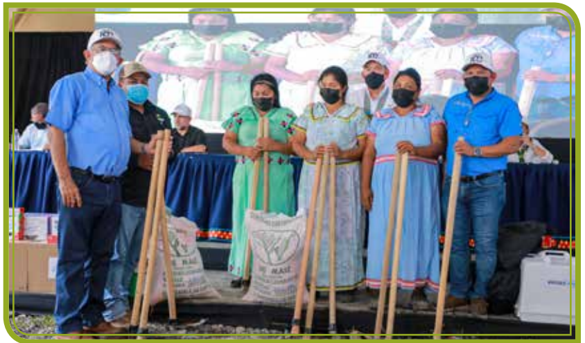
INSUMOS A LOS PRODUCTORES DE AGRICULTURA FAMILIAR