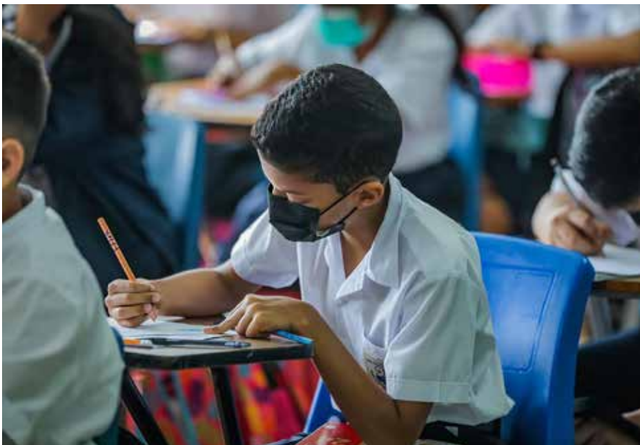
Los estudiantes con discapacidad participaron en la convocatoria de becas 2022 del Ifarhu.

Este jueves 7 de abril, el presidente de la República, Laurentino Cortizo Cohen, anunció la inclusión de 4 mil estudiantes panameños que acuden a distintas escuelas y universidades, al Programa de Asistencia Económica para Estudiantes con Discapacidad. Estos 4 mil estudiantes participaron de la Convocatoria de Becas para Estudiantes con Discapacidad que en febrero de 2022 lanzó el Instituto para la Formación y Aprovechamiento de Recursos Humanos (Ifarhu). El anuncio lo efectuó el presidente durante el acto de entrega protocolar de becas a 20 de los estudiantes que participaron en la convocatoria para estudios de primaria, premedia, media y universitaria. Cortizo Cohen señaló que la educación, “la estrella”, no es un tema exclusivo de una sola administración, sino de muchas más, pero una educación de calidad para la vida y el trabajo.