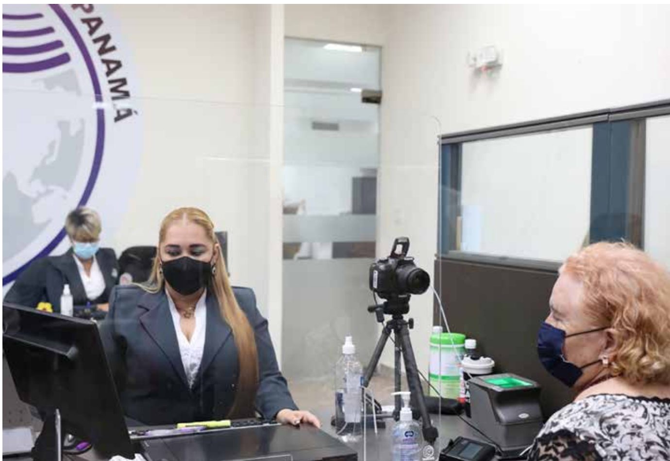
La Autoridad de Pasaportes de Panamá cuenta con oficinas en Bocas del Toro, Chiriquí, Veraguas, Herrera, Coclé, Colón y Panamá.

El 21 de febrero de 2022 se emitió la mayor cantidad de estos documentos desde que inició la pandemia a causa de la Covid-19.