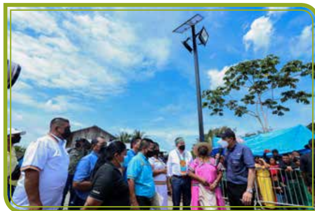
PUESTA EN MARCHA DE LAS ILUMINARIAS CON PANELES SOLARES