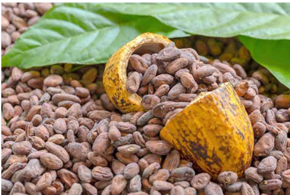
El grano panameño está muy bien cotizado en el mercado asiático.