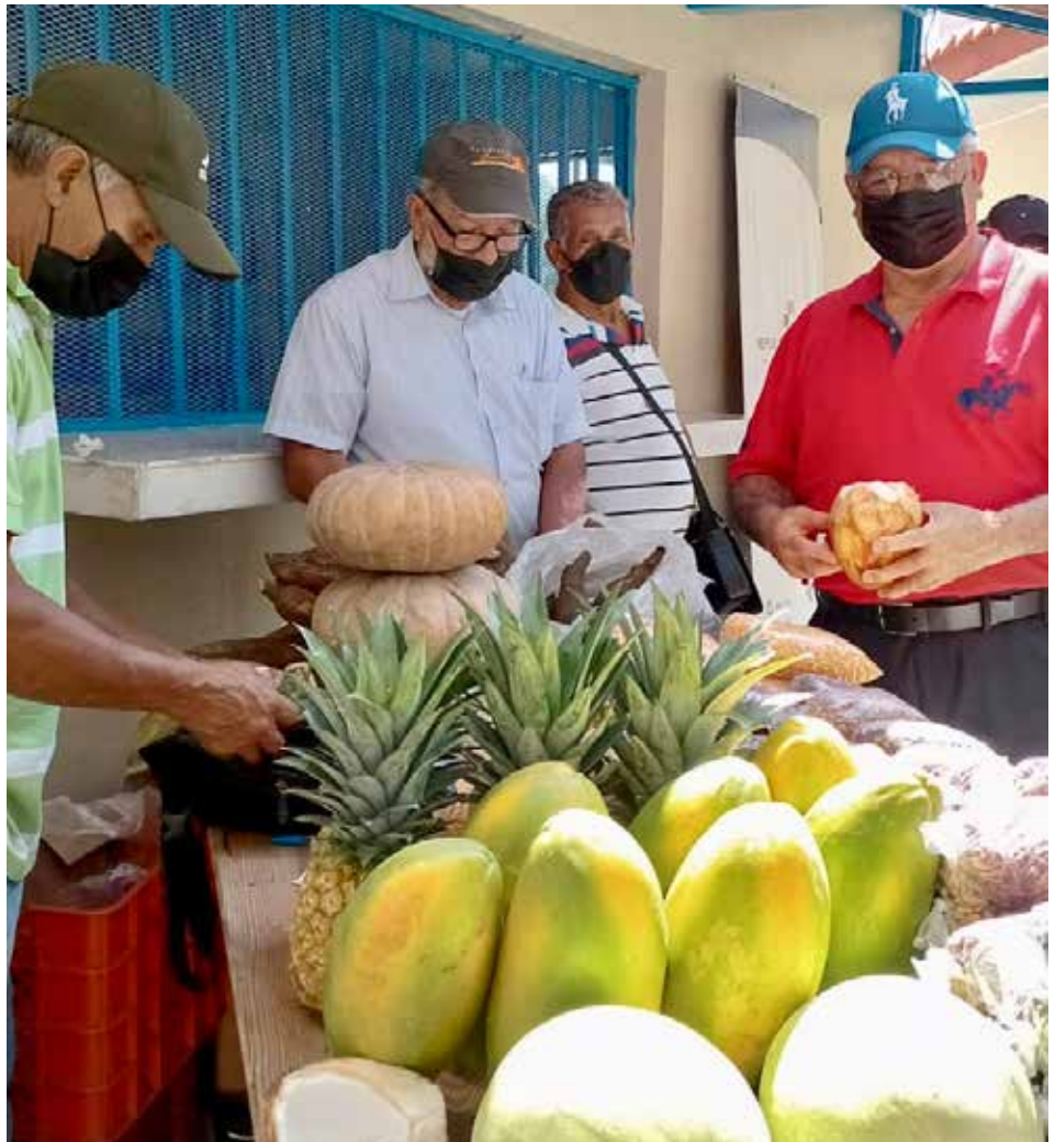
Productores comercializan sus cosechas en los pabellones del IMA en ferias agropecuarias.

Café, frutas, hortalizas, raíces, tubérculos, granos, jugo de caña y flores ornamentales son algunos de los productos que se ofrecen al consumidos en las agrotiendas del IMA.