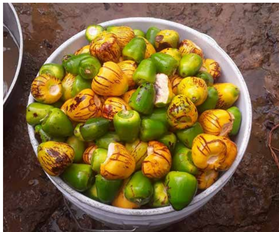
El pixbae dañado por el escarabajo debe recogerse de inmediato porque puede tener larvas que, al completar su ciclo reproductivo, aumentan las infestaciones en campo.