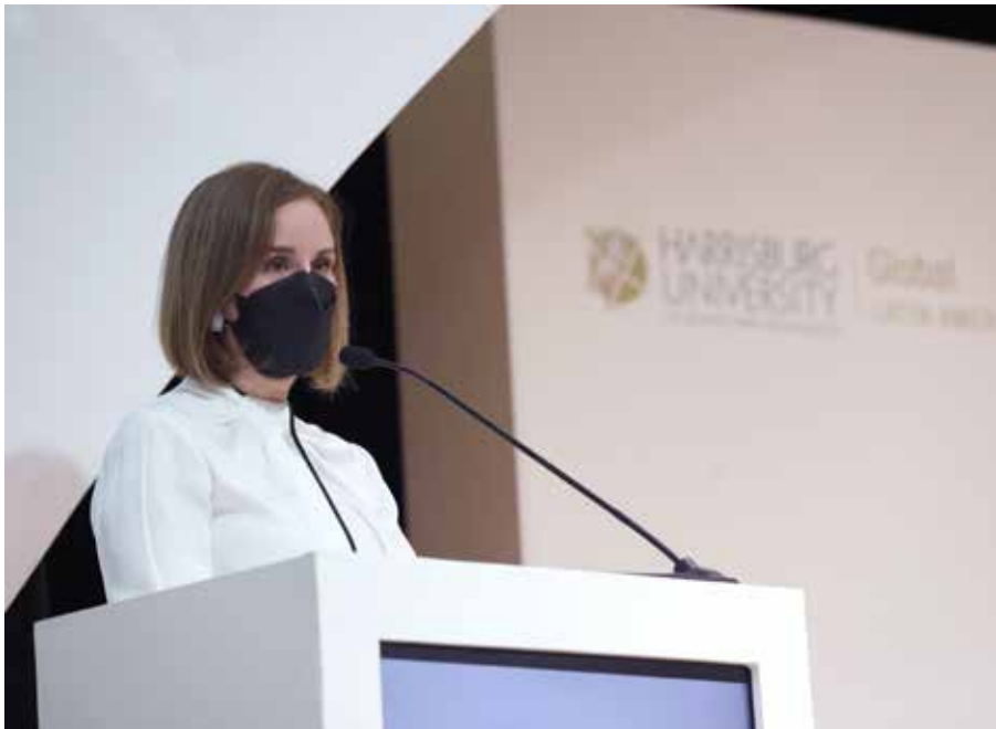
La primera dama participa en la inauguración de Harrisburg University.