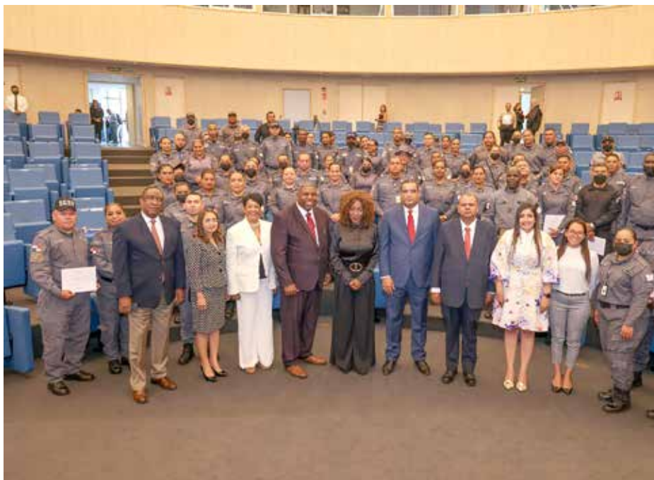
Los custodios penitenciarios, de entre 5 y 35 años de servicios en la entidad, recibieron un pin de distinción por su trayectoria laboral.

Por primera vez se hicieron ascensos de oficiales y suboficiales, y se entregaron distinciones por años de servicios y honor al mérito a los trabajadores del Sistema Penitenciario.