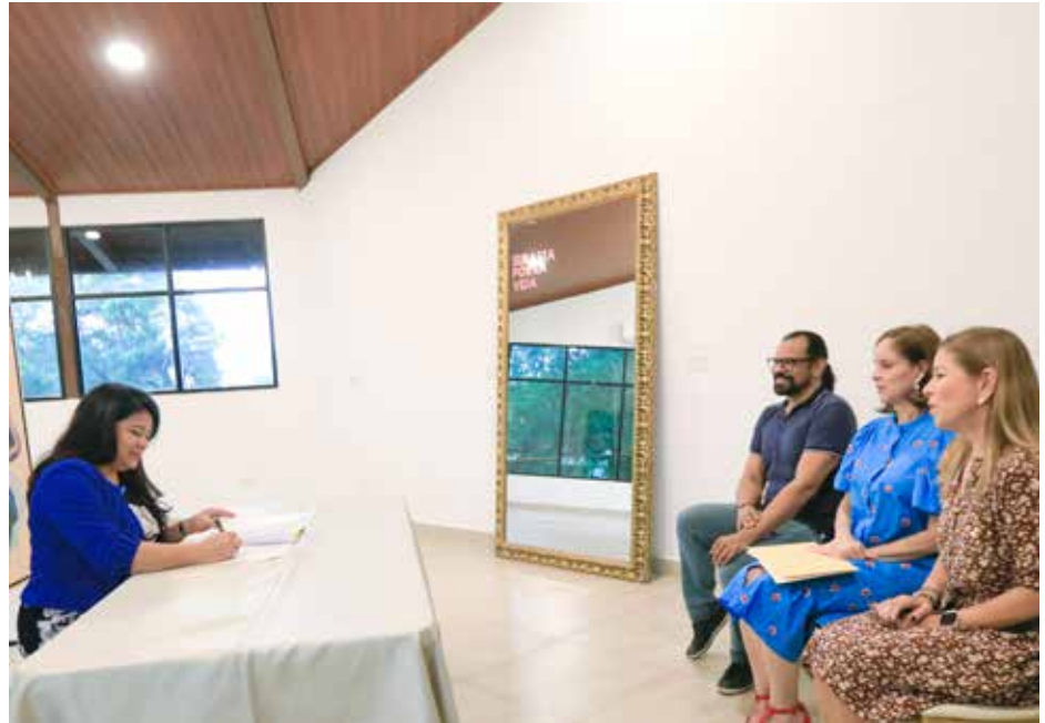
La tercera edición de “Subasta por la Vida” recaudó B/.150,723.00.