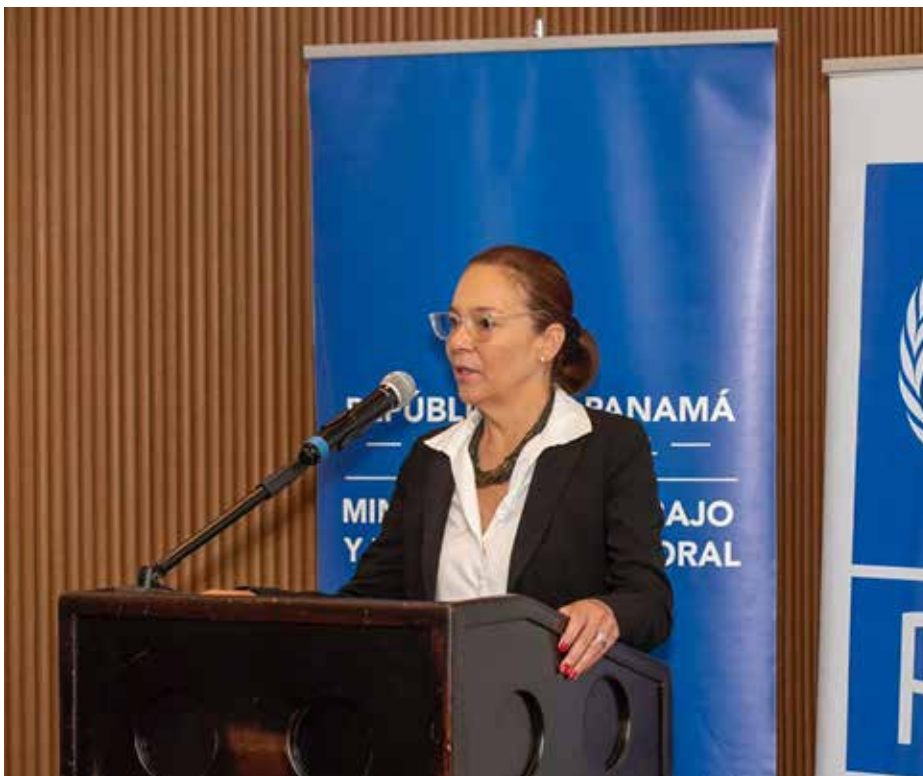
Con este programa se reafirma el compromiso con la meta número 5 de los Objetivos de Desarrollo Sostenible.