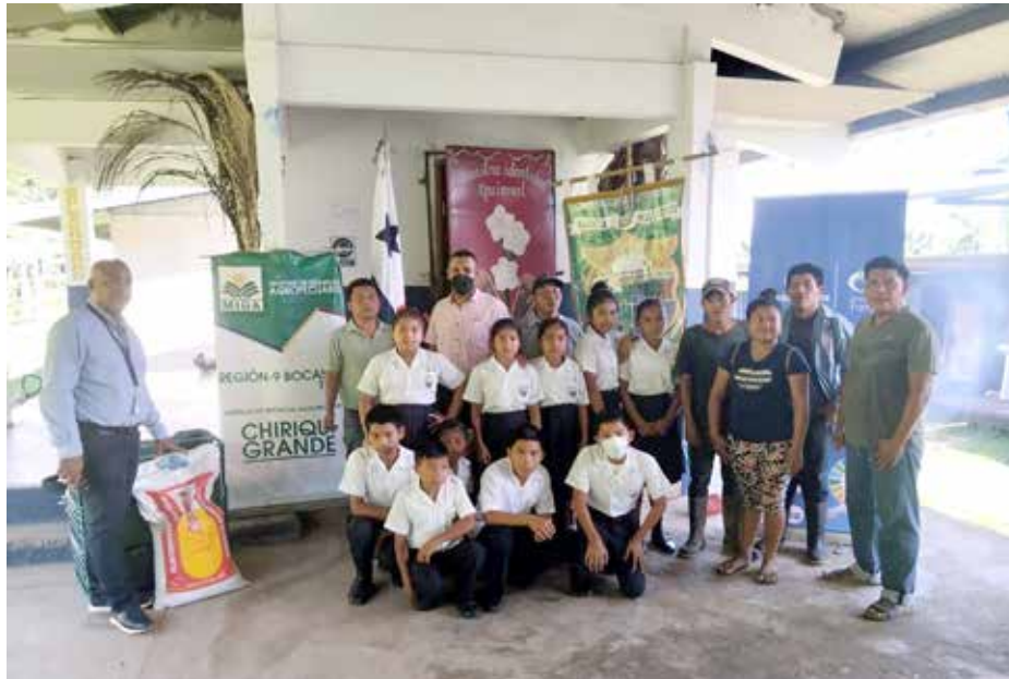
Centros educativos de las provincias de Bocas del Toro, Darién y Chiriquí recibieron insumos avícolas para el desarrollo de sus huertos.

El Programa Huertos Escolares (convenio MIDA, Caja de Ahorros, Meduca), que ejecuta la Dirección de Desarrollo Rural del Ministerio de Desarrollo Agropecuario (MIDA), inició la entrega de insumos avícolas en las provincias de Bocas del Toro, Darién y Chiriquí. El proceso comenzó en Bocas del Toro, con la entrega de 120 gallinas ponedoras con 36 quintales de alimento de postura y 709 pollos de ceba con 84 quintales de alimentos de engorde. Así mismo, en Darién recibieron implementos para 22 huertos escolares; se entregaron 110 gallinas ponedoras con 66 quintales de alimentos y 1,100 pollos de ceba con 132 quintales de