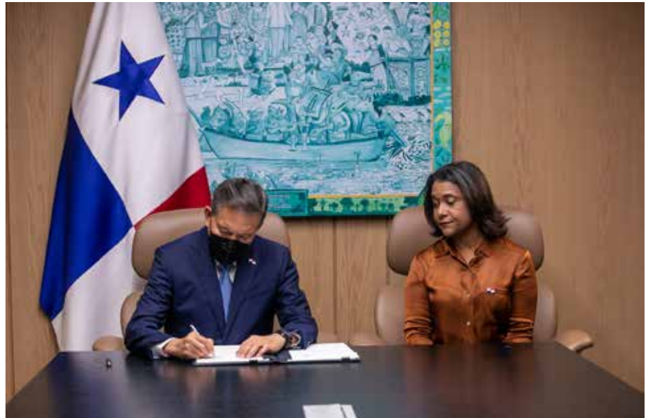
La Ley 331 fue publicada en Gaceta Oficial y comienza a regir a partir de su promulgación.

Al celebrarse el lunes 24 de octubre el Día Internacional de las Bibliotecas, el presidente de la República, Laurentino Cortizo Cohen, sancionó la ley que regula las bibliotecas públicas de Panamá, que fortalece el patrimonio bibliográfico y documental de la Nación, y dinamiza su función como institución cultural en espacios libres y participativos, la cual fue publicada en la Gaceta Oficial 29650-C. La Ley 331 del 24 de octubre del año en curso crea la Red Nacional de Bibliotecas Públicas, adscrita al Ministerio de Cultura, y los centros de lectura; además, reconoce el derecho constitucional de participar en la vida cultural, promueve el desarrollo de una sociedad lectora y asegura la conservación del patrimonio documental, bibliográfico, hemerográfico, audiovisual y digital del país. El presidente Cortizo Cohen sancionó la Ley en el Palacio Presidencial, que fue firmada también por la ministra de Cultura, Giselle González Villarrué. La norma será aplicada a la Biblioteca Nacional y a todas las bibliotecas públicas adscritas a la Red Nacional, así como a los centros públicos de lectura. El Ministerio de Cultura será el ente rector de las bibliotecas públicas y se encargará del diseño e implementación de las políticas