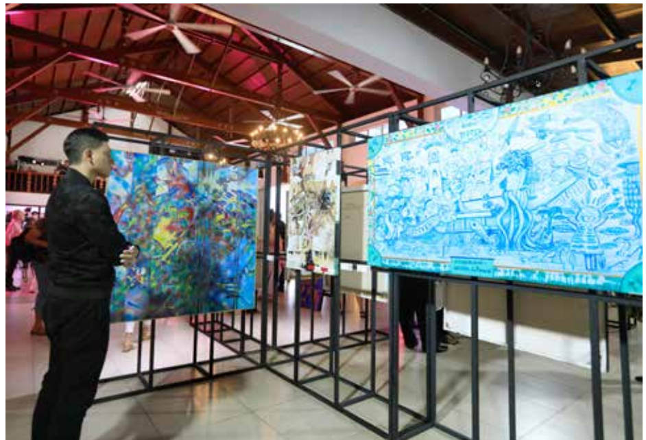
El 50% de lo recaudado es a beneficio del Instituto Oncológico Nacional (ION).