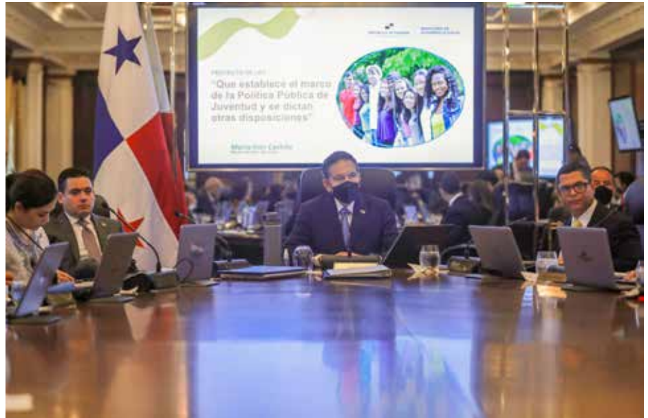
El Consejo de Gabinete también autorizó modificaciones al proyecto de Ley de Presupuesto General del Estado para la vigencia fiscal 2023.

Por primera vez en la historia, Panamá contará con una Ley de Política Pública de Juventud.