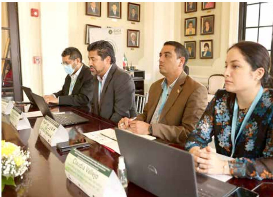
La reunión se realizó en la sede de la Gobernación de Panamá.

La iniciativa tiene como objetivo el desarrollo y fortalecimiento de los seguros agropecuarios desde una perspectiva de gestión integral de riesgos y otros servicios integrales.