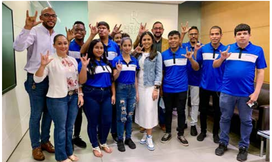
Este año se han gestionado más de 800 intermediaciones de personas con discapacidad.