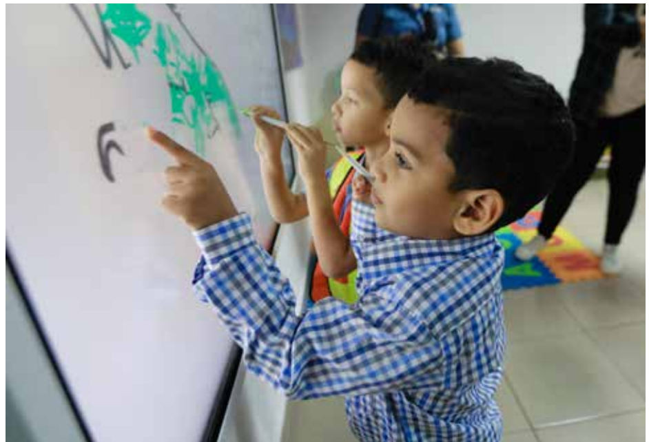
El recorrido incluyó las instalaciones del CAIPI en David, Chiriquí, en donde se implementó la educación STEAM.