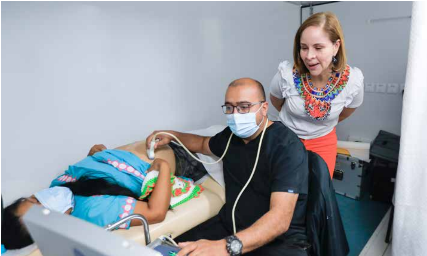
La primera dama participó en la jornada de salud en la comarca Ngäbe Buglé.