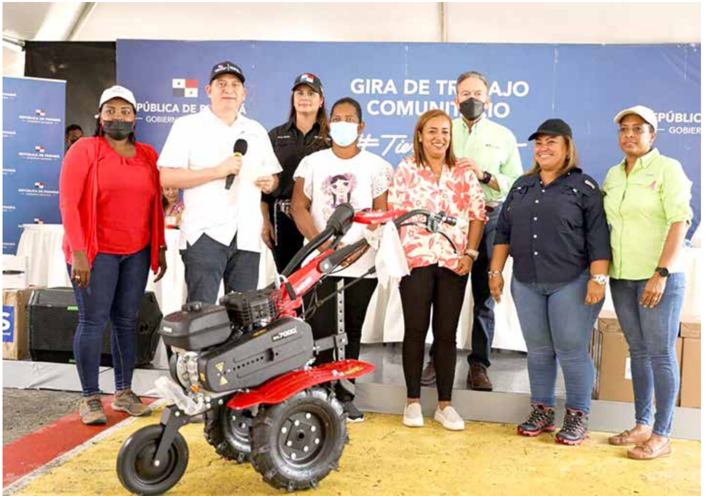
La Gira de Trabajo Comunitario 117, liderada por el presidente, Laurentino Cortizo Cohen, que se realizó el pasado 21 de octubre en la llamada isla de las flores, entregó obras por B/.4,244,538.