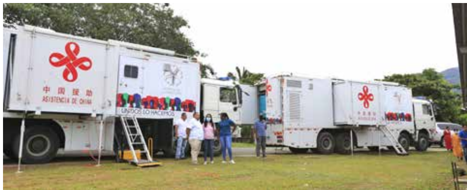
Las clínicas móviles atendieron cerca de 1,200 consultas.

La primera dama de la República, Yazmín Colón de Cortizo, visitó la jornada de salud que organizaron la Presidencia de la República y el Despacho de la Primera Dama, en el corregimiento de Samboa, distrito de Jirondai, en la comarca Ngäbe Buglé. Las tres unidades móviles "Salud Sobre Ruedas" del Despacho de la Primera Dama brindaron atención a la población con exámenes de electrocardiogramas, papanicolau, ultrasonidos, pruebas de VIH y vacunación. En esta actividad se atendieron cerca de 1,200 consultas. También, se contó con las dos unidades móviles del Ministerio de Salud que realizaron electrocardiogramas, ultrasonidos, atención ginecológica, toma de papanicolau. Igualmente, el Despacho de la Primera Dama ofreció los servicios de tamizajes visuales y entrega de lentes del Programa 'Ver y Oír para Aprender'.