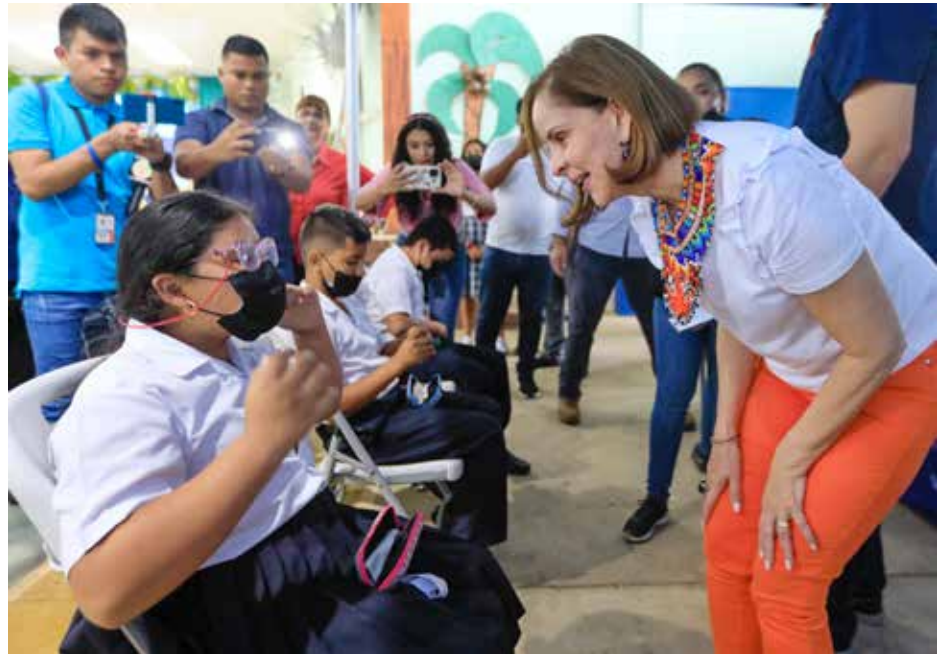
La gira integral del Despacho de la Primera Dama en San Lorenzo beneficia a más de 700 personas.