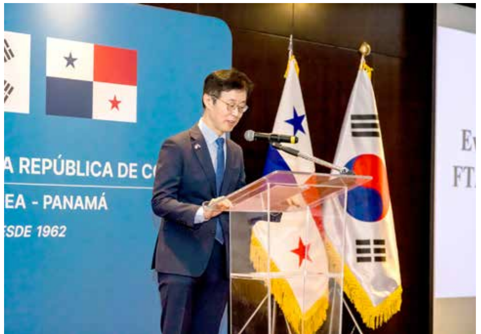
El embajador Jeon Jinkyu hizo un análisis del primer año del TLC firmado entre ambos países.