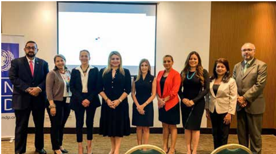
SíGénero es un esfuerzo que involucra a gobiernos nacionales, sector privado y sociedad civil.