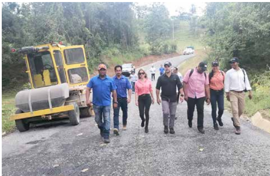
El proyecto en San José - Calidonia - Platanares - Pixvae incluye la construcción de 6 puentes vehiculares y 20 cajones pluviales.

Más de 150 mil habitantes de las provincias de Chiriquí y Veraguas se beneficiarán con la ejecución de estas obras.