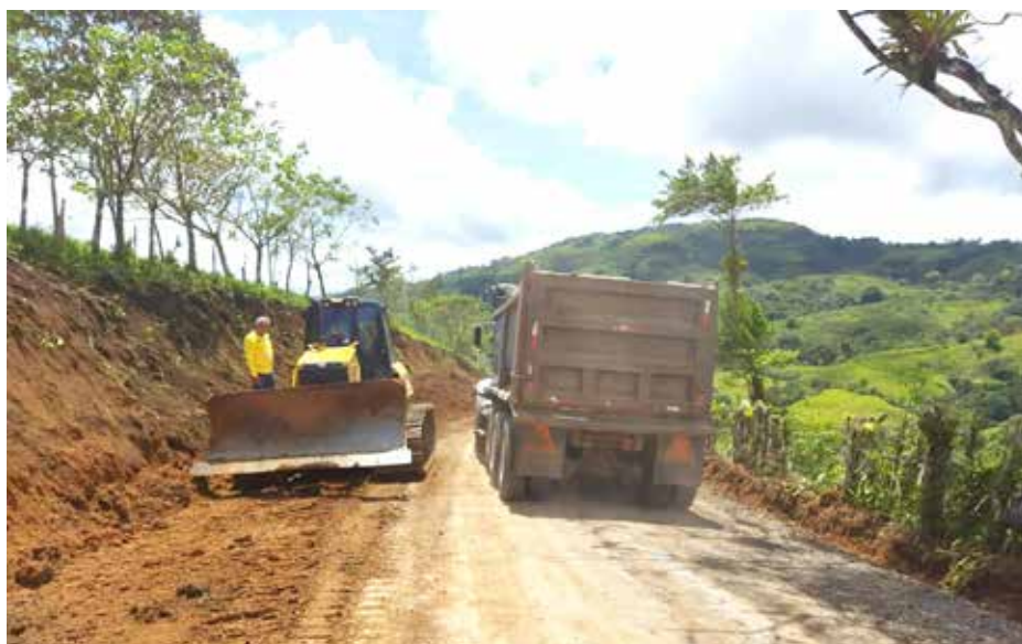
Trabajos de ampliación de calzada del proyecto carretero Paso Canoas - Río Sereno - Piedra Candela, en la provincia de Chiriquí.