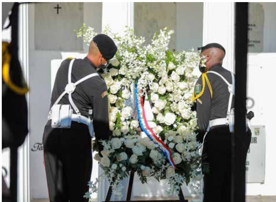
La agenda de eventos oficiales comienza el 2 de noviembre con la romería al Cementerio Amador, en El Chorrillo.