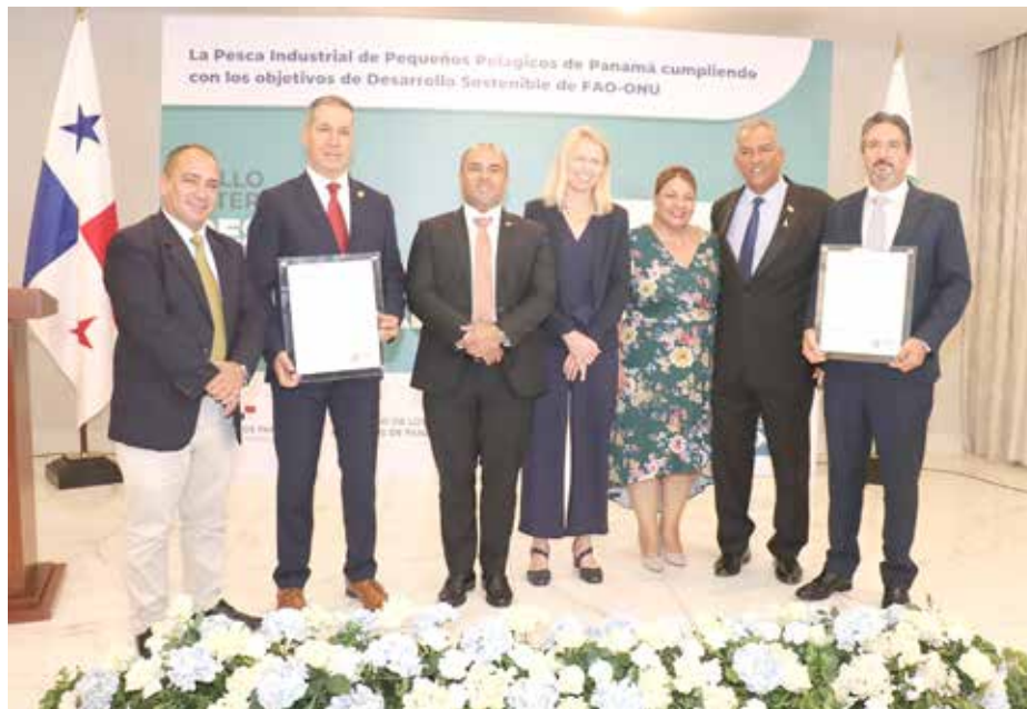
Las autoridades presentes en el evento reconocieron el compromiso de Panamá de velar por que se cumplan las normativas en este sector.

A través de la Autoridad de los Recursos Acuáticos (ARAP), Panamá estuvo presente, el 20 de octubre en el Salón Bolívar de la Cancillería, en la entrega de la primera certificación global de pesca responsable y sostenible que otorga la organización IFFO RS Marin Trust a la pesquería de arenque y anchoveta, también conocidos como “pequeños pelágicos”. En esta ocasión, el mérito recayó en las empresas Promarina, S.A. y Procesadora Bayano, S.A. “Este reconocimiento es el resultado de más de trece años de trabajo arduo del sector pesquero y un indicativo de que nuestra nación garantiza buenas prácticas en la industria, consolidando las inversiones que centran sus fortalezas en mejoras consistentes, a corto y mediano plazo”, indicaron representantes de Promarina, S.A. Como empresa, añadieron, están enfocados con el Plan Estratégico Nacional en la Agenda 2030, para alcanzar los Objetivos de Desarrollo Sostenible (ODS) de la FAO-ONU. Con esta certificación, Panamá se alinea específicamente a los ODS 12 y 14, sobre producción y consumo responsables, con una gestión eficiente de los recursos naturales y la protección de los ecosistemas marinos y costeros, al poner fin a prácticas insostenibles y mantener una lucha frontal contra la pesca ilegal no declarada y no reglamentada. En su mensaje, la administradora general de la ARAP, Flor Torrijos, señaló que es un orgullo para Panamá recibir la primera certificación global de IFFO RS Marin Trust y este logro es