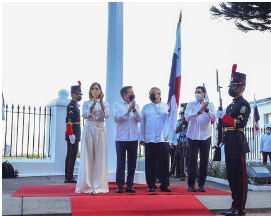
El presidente Laurentino Cortizo Cohen y su equipo de gobierno participarán en los actos oficiales en Panamá, Colón, La Villa de Los Santos, La Chorrera y Boquete.