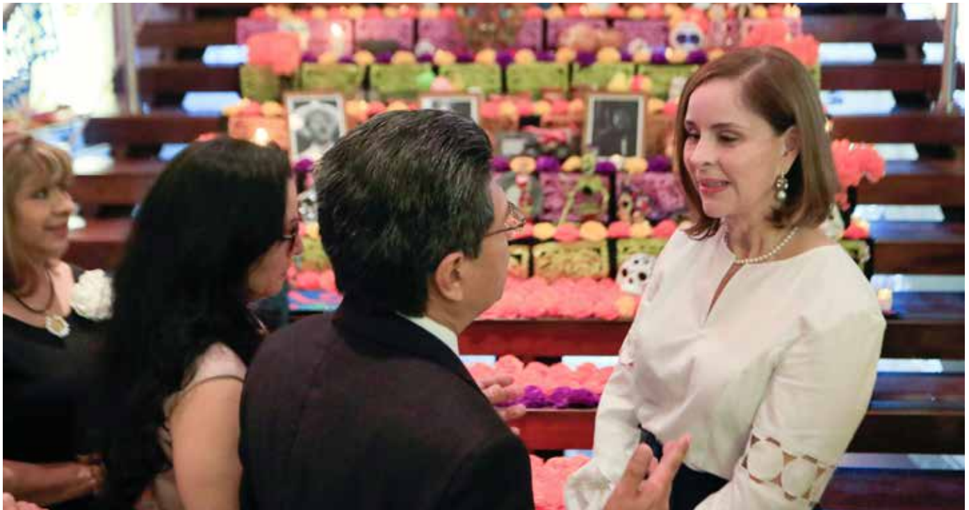
Es el evento gastronómico y multicultural más importante del año.

asistencia social continúa siendo uno de los pilares del Despacho de la Primera Dama.