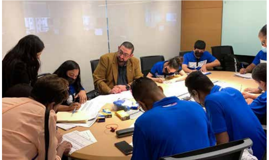
Jóvenes con discapacidad firman contratos con sucursales de Sportline America.