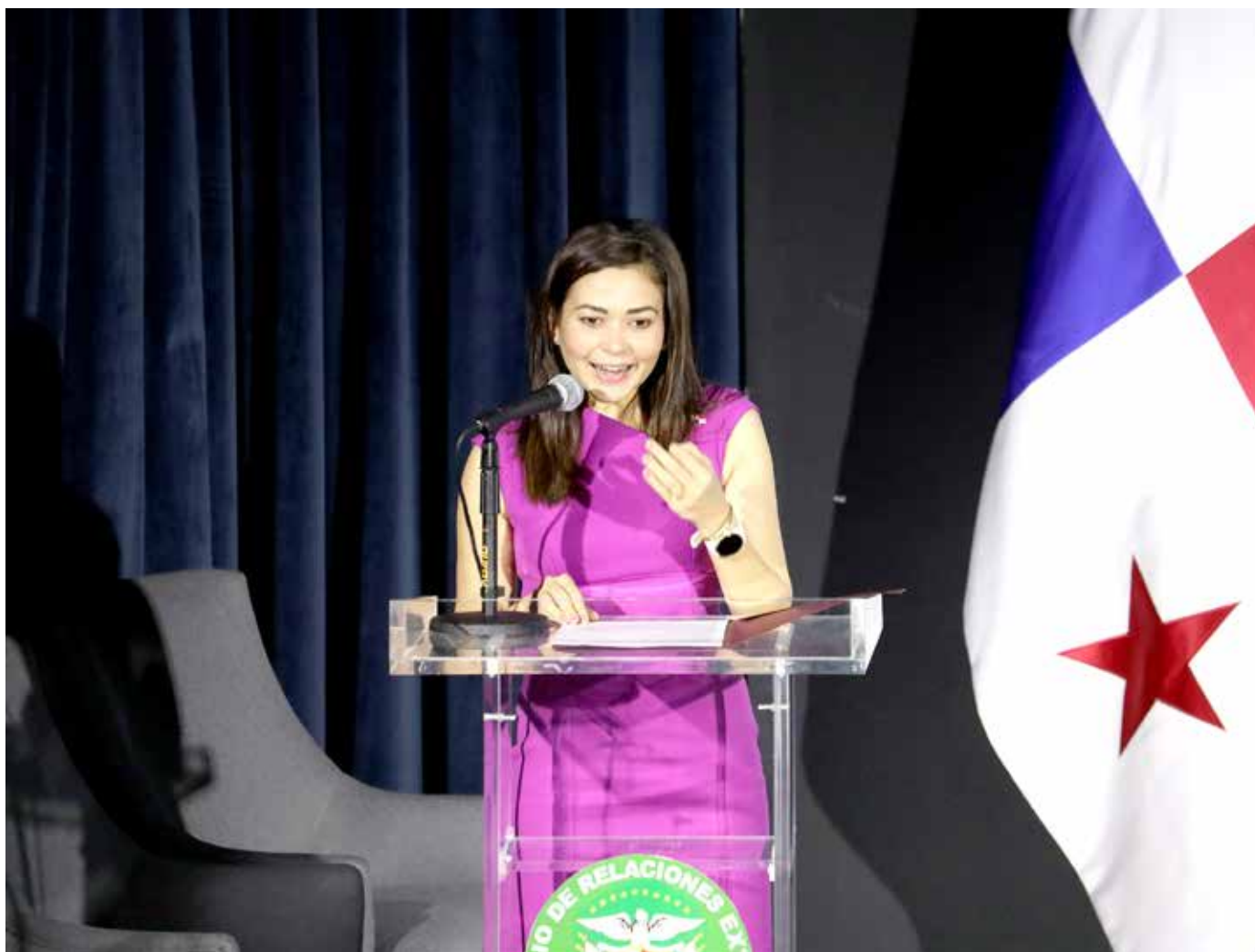
La ministra de Relaciones Exteriores, Janaina Tewaney Mencomo, inauguró el Primer Congreso Internacional de Protocolo, celebrado en el Palacio Bolívar.