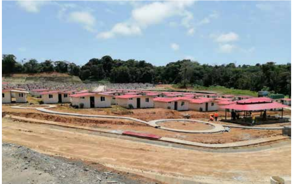
Los trabajos de construcción de la segunda etapa de la Urbanización Isla Colón, que incluye 97 viviendas, registran un 53% de avance.

La entrega de las 486 residencias se contempla para el primer trimestre del 2023.