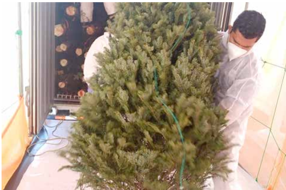
En el 2021 entraron al país 62,606 arbolitos de Navidad.

En los últimos años no se han encontrado irregularidades en la importación de los arbolitos, debido a que se realiza un proceso de verificación del cumplimiento de las normas previo al ingreso.