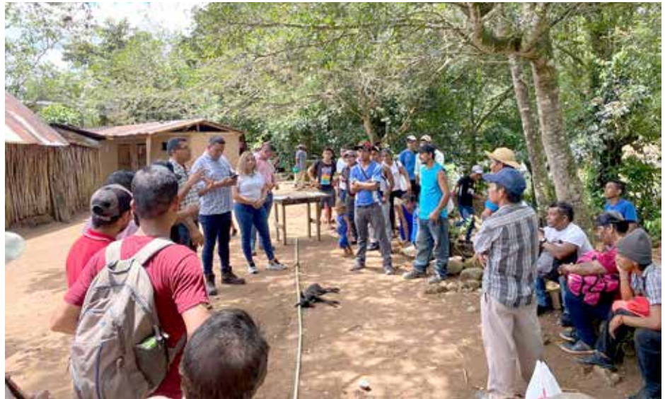
La inserción laboral busca contribuir a la reactivación económica en el interior del país.