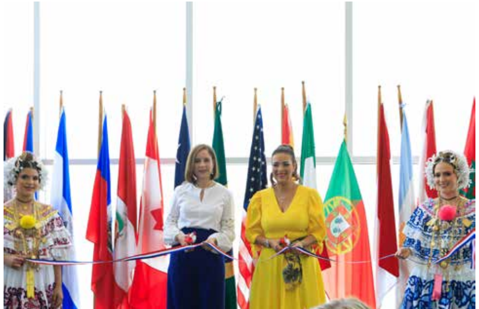
La primera dama, Yazmín Colón de Cortizo, participó en la apertura de "Fiesta Alrededor del Mundo" de Caravana de Asistencia Social.

La primera dama de la República, Yazmín Colón de Cortizo, participó en la edición #55 del evento "Fiesta Alrededor del Mundo" de Caravana de Asistencia Social, damas diplomáticas y panameñas. Es el evento gastronómico y multicultural más importante del año, ya que los asistentes "pueden recorrer el mundo en un día", visitando los "stands" de los países participantes. El propósito es conocer y contribuir a proyectos y organizaciones dedicadas a ayudar a los grupos más vulnerables de Panamá. Este año, los fondos recaudados serán destinados a la construcción de la primera fase del Oratorio Festivo Don Bosco, el cual será una "casa de acogida" para niños, jóvenes y adolescentes en alto riesgo social de las comunidades de Calidonia, Santa Marta, Llano Bonito y Cabo Verde. Caravana de Asistencia Social fue creada en 1961 por la entonces primera dama de la República, doña