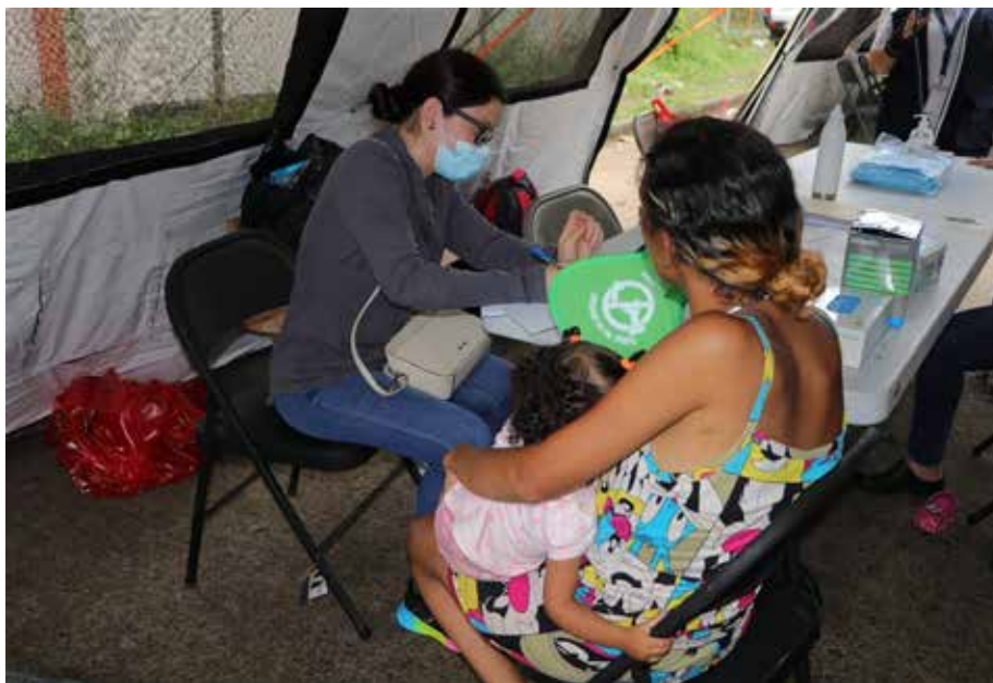
El Ministerio de Salud evalúa las condiciones físicas de los migrantes que llegan a los albergues.